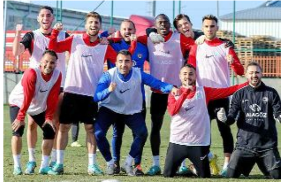
kırmızı-siyahlı takımda moraller gayet iyi