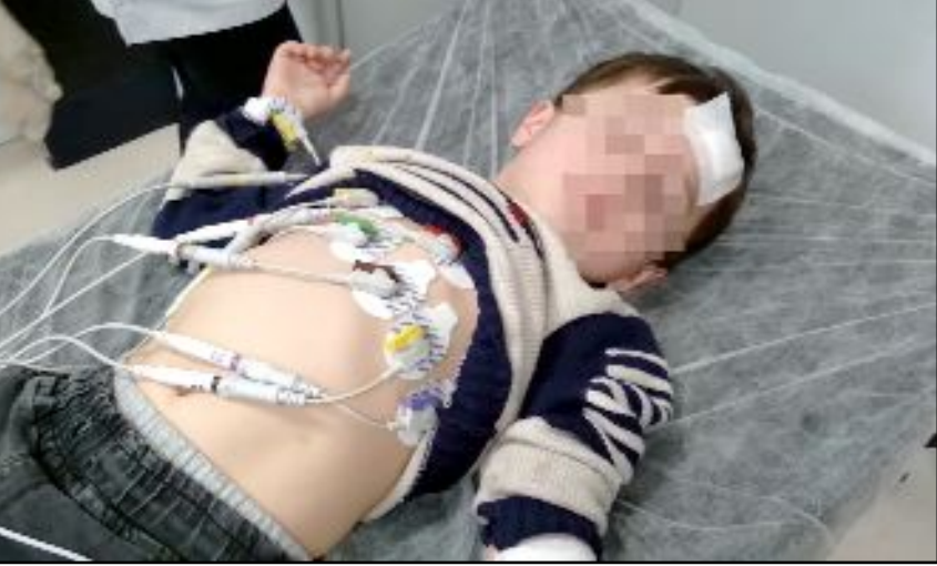
4 yaşındaki çocuk hastanede tedavi altına alındı.