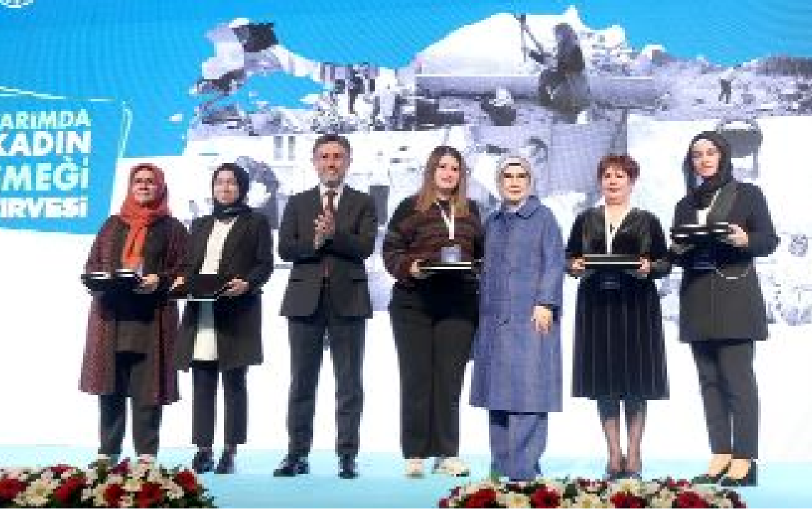
Tarım ve Kırsal Kalkınmayı Destekleme Kurumu (TKDK) düzenlenen "Tarımda Kadın Emegi Zirvesi"ne Çorumlu kadın yatırımcılar da katıldı.