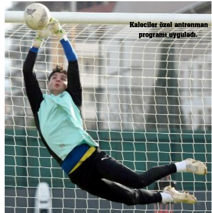
Kaleciler özel antrenman programı uyguladı.

Trendyol Türkiye 1.Futbol Ligi takımlarından Manisa FK, Ahlatçı Çorum FK ile Cumartesi günü Çorum'da oynayacağı 27.hafta maçının hazırlıklarını sürdürüyor.