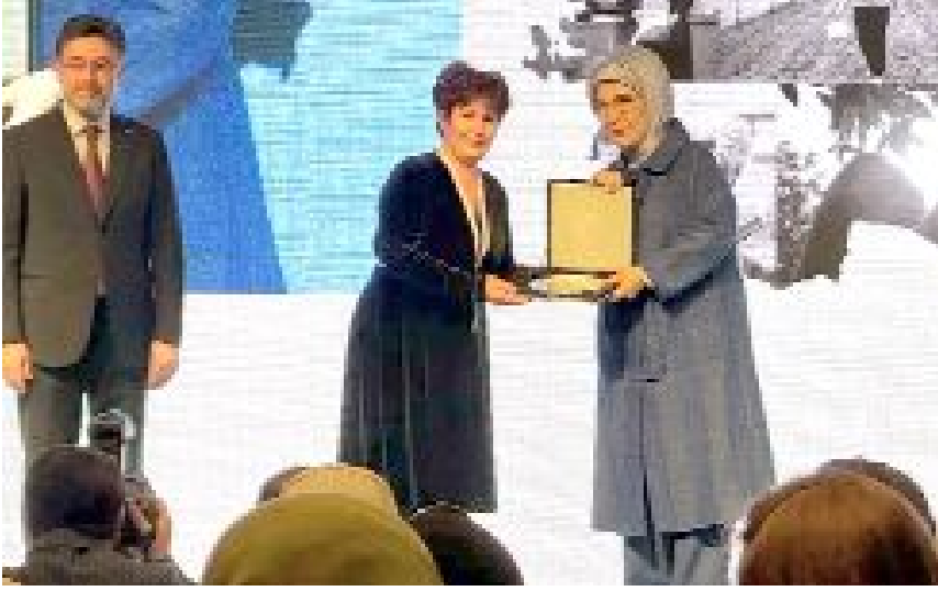
Atçalı köyünde süt üretimi ve büyükbaş damızlık hayvan yetiştiriciliği yapan kadın yatırımcı Hatem Kümbet'e Emine Erdoğan ve Bakan İbrahim Yumaklı tarafından plaket verildi.

Çorum merkeze bağlı Atçalı köyünde süt üretimi ve büyükbaş damızlık hayvan yetiştiriciliği yapan kadın yatırımcı Hatem