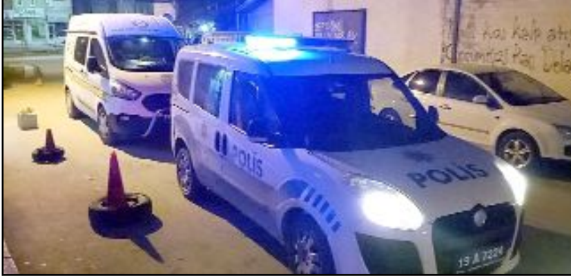
Silah seslerinin İhbarı üzerine olay yerine çok sayıda polis ve 112 sağlık ekipleri sevk edildi.