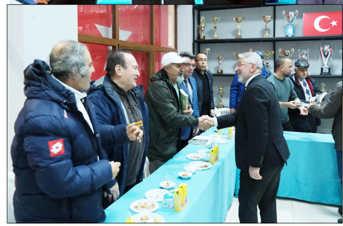
Belediye Başkanı Aşgın davetlilerle yakından ilgilendi.