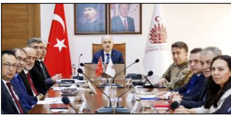
Kadına Yönelik Şiddetle Mücadele İl Koordinasyon Kurulu toplandı.