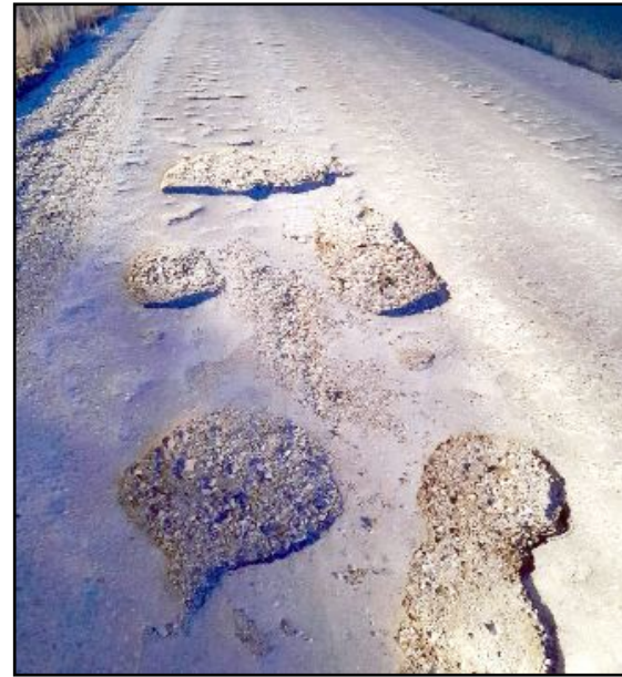
Vatandaşlar öğrencilerin her gün geliş gidiş yaptığını yolun haline tepki gösteriyor.

lar, parayı ihaleyle cebeye alıp gittiler. Bu yoldan her gün çocuk servisleri okula geliş gidiş yapıyor. Yoğun bir kış olduğu zaman aşım derecede bu yolda patlamalar meydana gelecek" diyerek tepkilerini dile getirdi. (Haber Merkezi)