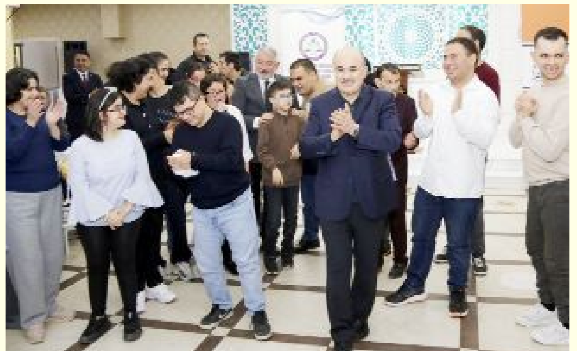
Özel bireylerle tek tek yakından ilgilenen Vali Dağlı, öğrenciler ve aileleriyle sohbet etti.

gereksinimli bireyler ve aileleri ile bir araya geldi. Özel bireylerle tek tek yakından ilgilenen Vali Dağlı, öğrenciler ve aileleriyle sohbet etti. (İHA)