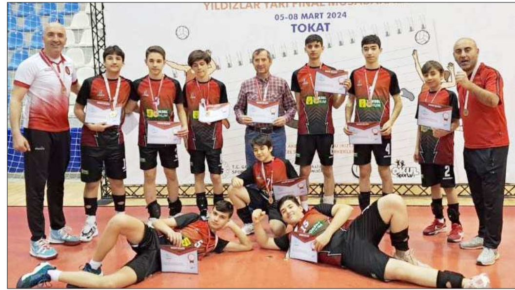
Ahmet Tevfik İleri Ortaokulu yarı final grubunu şampiyon tamamlayarak finallere adını yazdırdı.