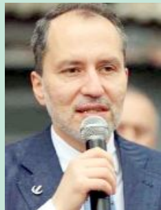
Dr. Fatih Erbakan