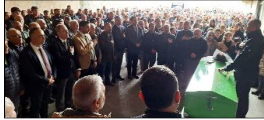
Genç kızın cenazesi Hacı Bektaş Veli Anadolu Kültür Vakfı'nda düzenlenen "Hakka Yürüme" erkanının ardından merkeze bağlı Acıpınar köyünde gözyaşları arasında toprağa verildi.