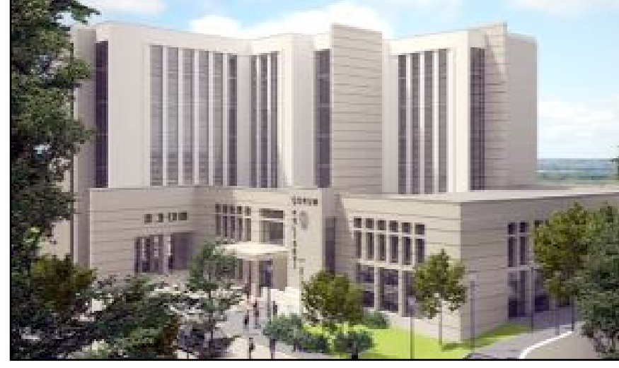
Çorum Polis Moral Eğitim ve Kongre Merkezi ihalesinin onaylandığı açıklandı.