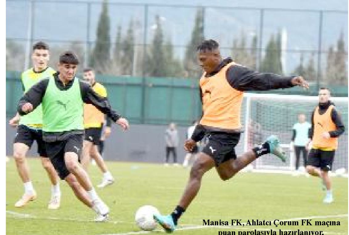
Manisa FK, Ahlatçı Çorum FK maçına puan parolasıyla hazırlanıyor.