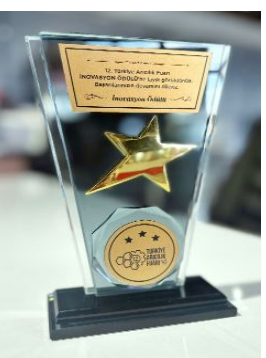
"Mum yıkama teknesi"nin tanıtım broşürü...

Raporla Dünya arıcılık sektörünün 2023-2028 tarihleri arasında tahmin edilen gelişimleri ve sektör analizleri yer alıyor. Rapor, İtalya, Polonya, Çin, Amerika Birleşik Devletleri gibi Dünya'nın birçok ülkesinden sektörün eski ve köklü şirketlerini kapsıyor. (Aliye ÖNCEL)