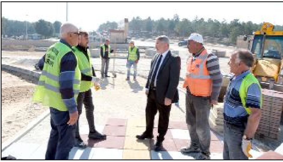
Çorum Belediyesi Fen İşleri Müdürlüğü’ne bağlı ekipleri, Çorum Şehitliği ve Çamlık Mesire Alanı yanındaki Şehitlik Caddesi’nde başlattıkları yol genişletme çalışmalarında sona yaklaştı.

Caddesi’nin devamındaki Dumlupınar Caddesi’ne de bağlanmış olacak. Böylece, itfaiye binası karşısından Dumlupınar Caddesi’ne kadar devam eden yeni bir ring hattı ortaya çıkmış olacak” dedi. (Haber Merkezi)