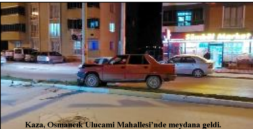
Kaza, Osmaniye Ulucami Mahallesi'nde meydana geldi.

YEDAS ve polis ekipleri geldi. Kaza yapan araç çekici ile olay mahallinden kaldırılırken, hasar gören aydınlatma direğinde de YEDAS ekipleri çalışma başlattı. (İHA)