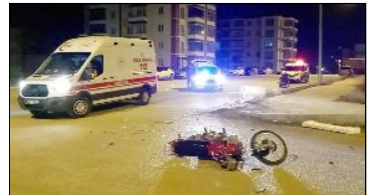
Kaza, Kale Mahallesi Ata 1. Cadde'de meydana geldi.

otomobil ve plakasız motosiklet çekici vasıtasıyla otoparka çekildi. (İHA)