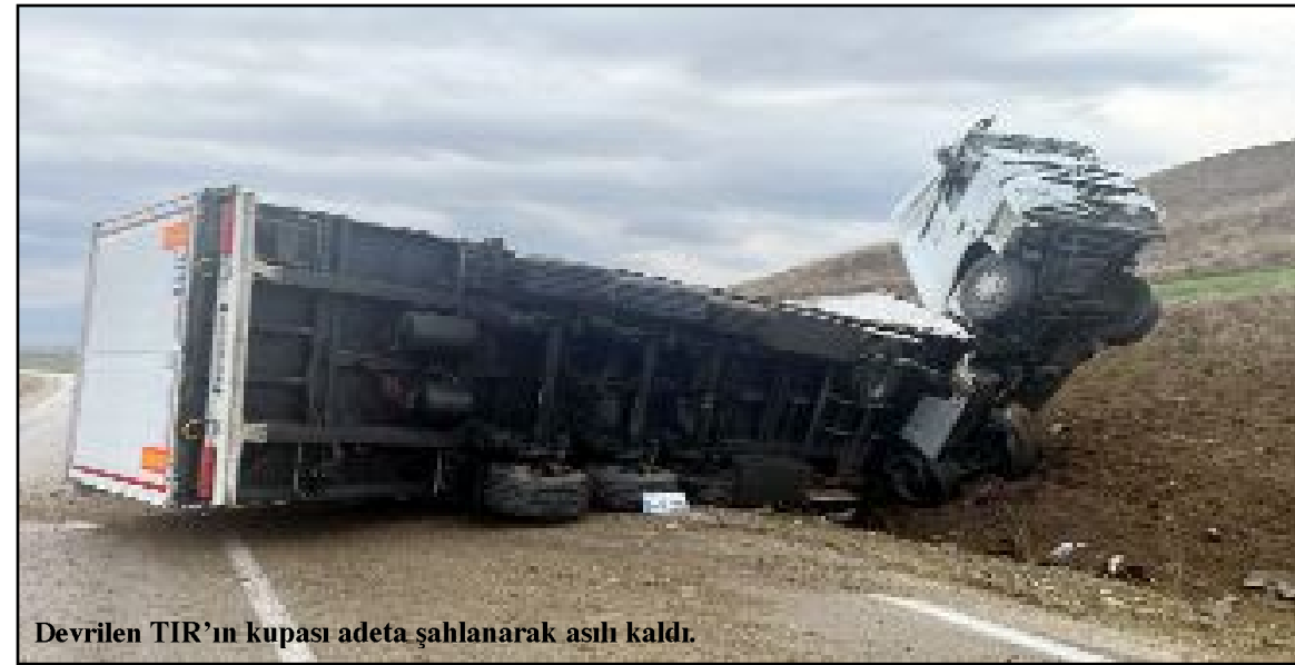
Devrilen TIR'ın kupası adeta şahlanarak asılı kaldı.