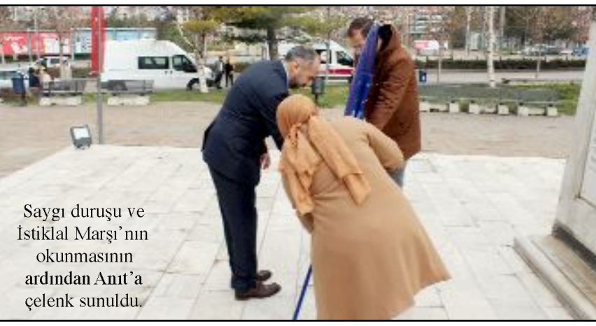
Saygı duruşu ve İstiklal Marşı'nın okunmasının ardından Anıt'a çelenk sunuldu.

dini yenileyerek ve geliştirerek bugünkü modern tıp eğitimi haline gelmiştir. Bu sebepten dolayı 14 Mart ülkemizde tıp eğitiminin başlangıç tarihi olarak kabul edilir ve kutlanır" dedi. (Taner ŞİMŞEK)