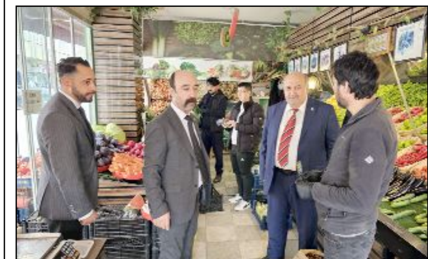
İYİ Parti heyeti, Osmancık Caddesi'nde esnaf ziyaretlerini sürdürdü.