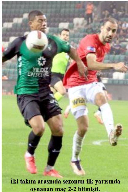
İki takım arasında sezonun ilk yarısında oynanan maç 2-2 bitmişti.

Hem üçüncülük mücadelesini, hem play-off mücadelesini direkt ilgilendiren kritik maç, Ankara Eryaman Stadyumu'nda, saat 20.30'da başlayacak. Zorlu karşılaşma öncesinde Kocaelispor 45 puanla 3.sırada, Gençlerbirliği ise 37 puanla 9.sırada yer alıyor. (Hüseyin AŞKIN)