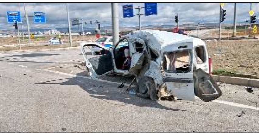
Kaza, Alaca'nın Zile kavşağında meydana geldi.