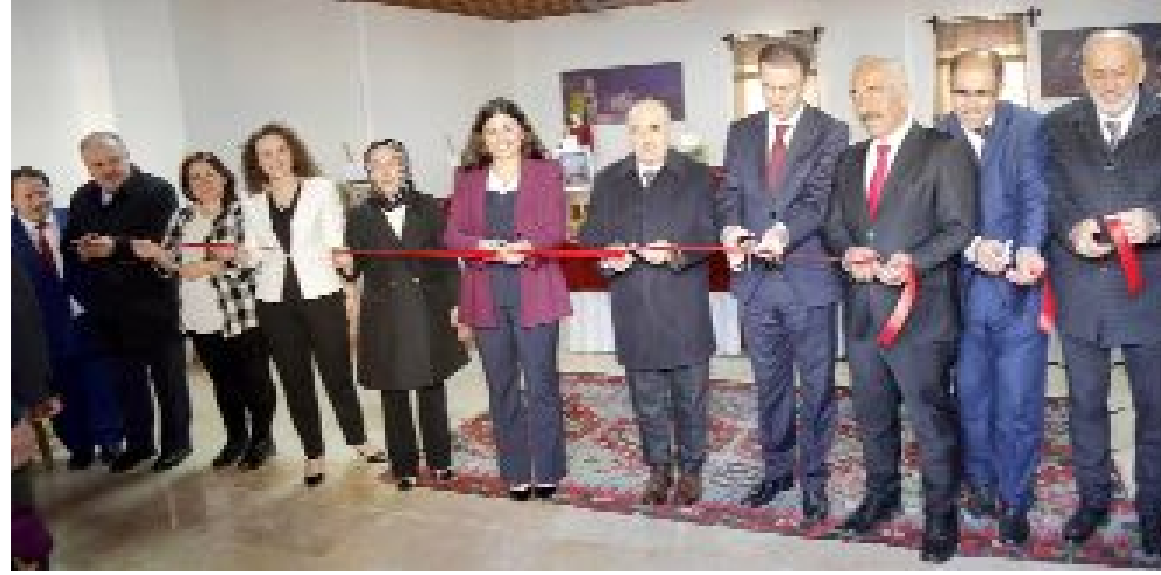
Boğazkale'de Halk Eğitim Merkezi bünyesinde faaliyet gösteren Kâğıt Rölyef Kursu'nda üretilen çalışmaların yer aldığı serginin açılışı gerçekleştirildi.