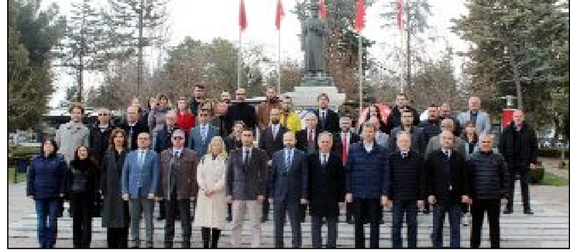
Çorum İl Sağlık Müdürlüğü tarafından "14 Mart Tıp Bayramı" nedeniyle Atatürk Anıtı'nda çelenk sunma töreni gerçekleştirildi.