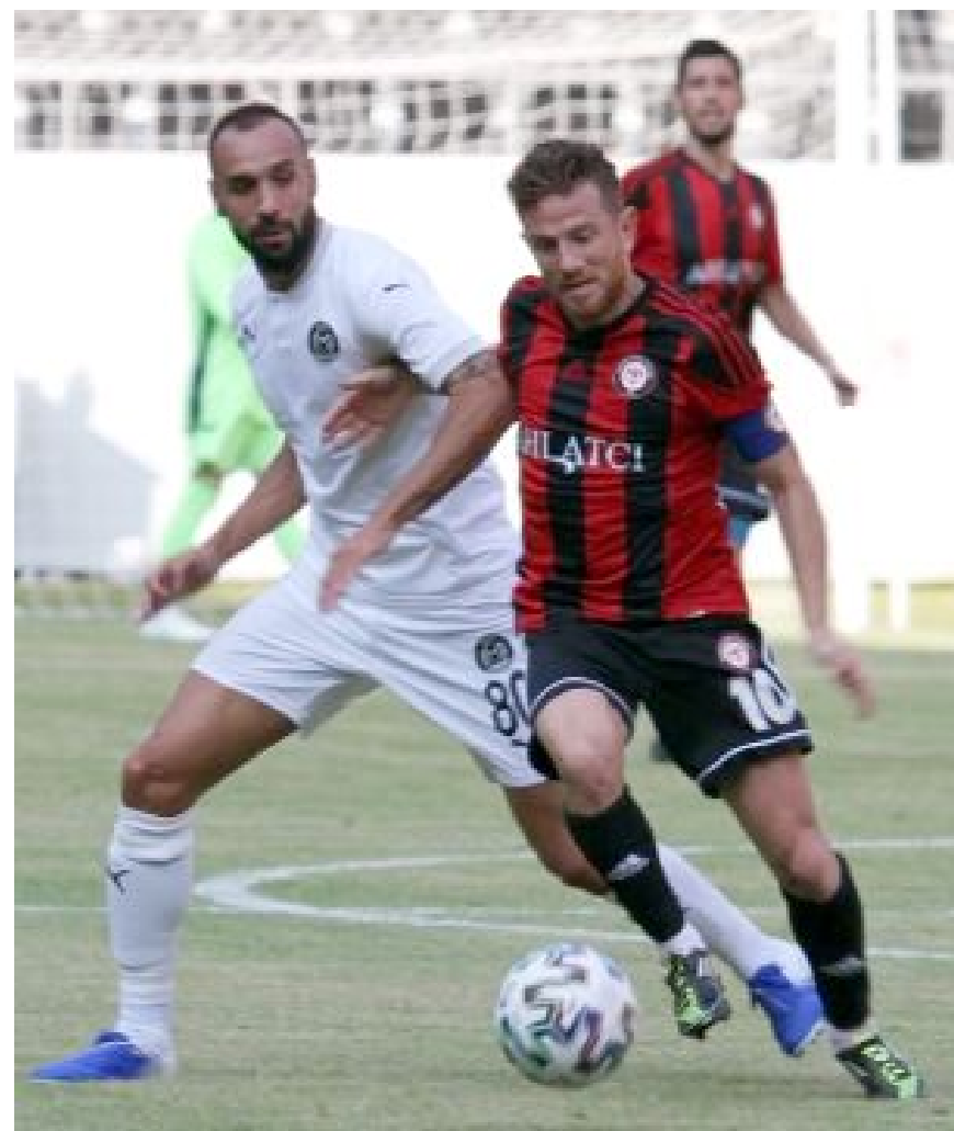
2020-2021 Sezonunun 1.haftasında Çorum'da oynanan maçı Manisa FK 3-1 kazandı. Bu maç aynı zamanda o sezon hizmete açılan Çorum Şehir Stadyumu'ndaki ilk resmi maç olarak kayıtlara geçti.