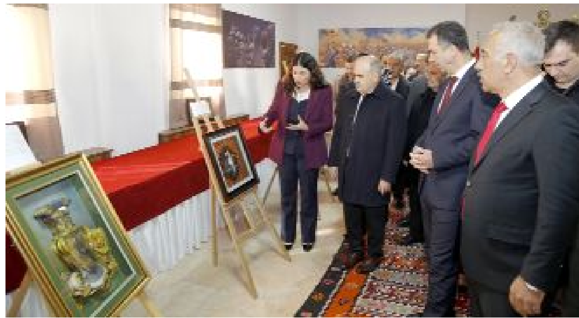
Vali Dağlı, açılış ardından kursiyerlerden çalışmalarını hakkında bilgi aldı.

çalışmaları hakkında bilgi aldı. Törenin ardından Kaymakam Yıldız, Vali Zülkif Dağlı ve Çorum Cumhuriyet Başsavcısı Ahmet Bektaş'a kursiyerlerce yapılan, Hitit figürlerinin yer aldığı rölyef tablo hediye etti. (Haber Merkezi)