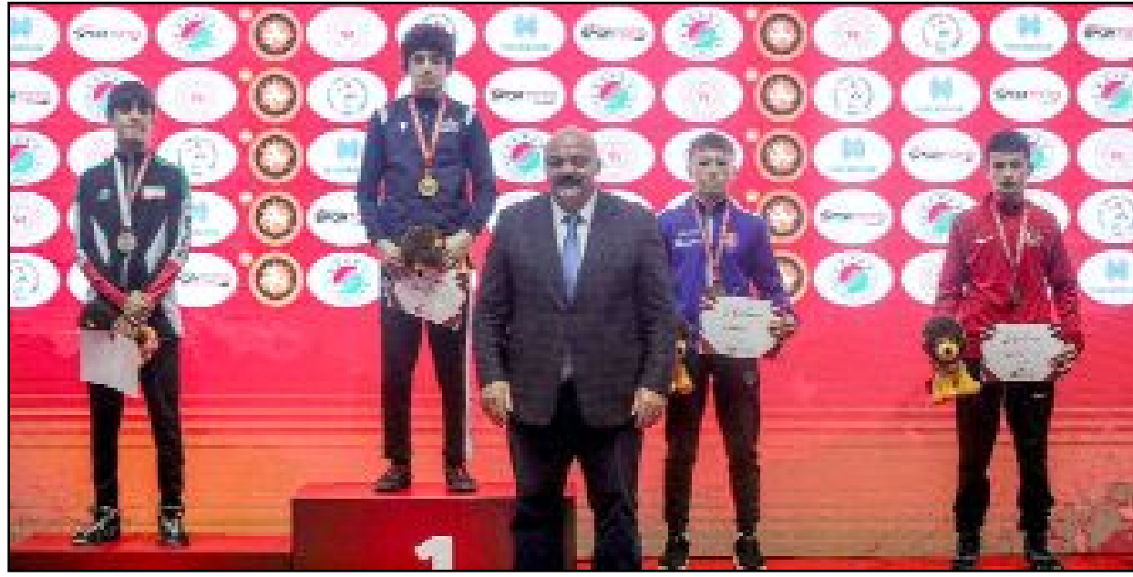
Çorumlu güreşçi, milli mayoyu ilk kez giydiği turnuvada üçüncü oldu