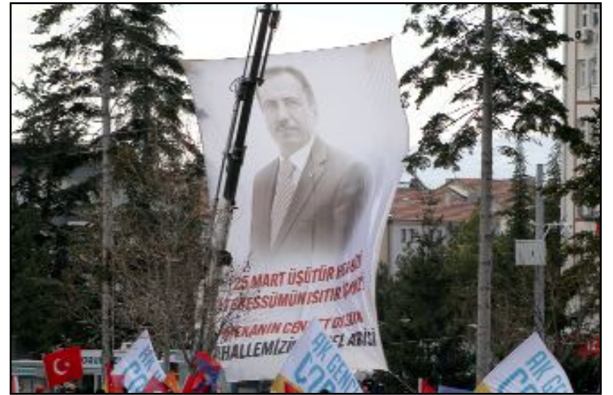
Kadeş Barış Meydanı'nda merhum BBP Lideri Yazıcıoğlu için pankart açıldı.

sun. Mahallemizin güzel Abisi" ifadelerine yer verildiği gözlemlendi.