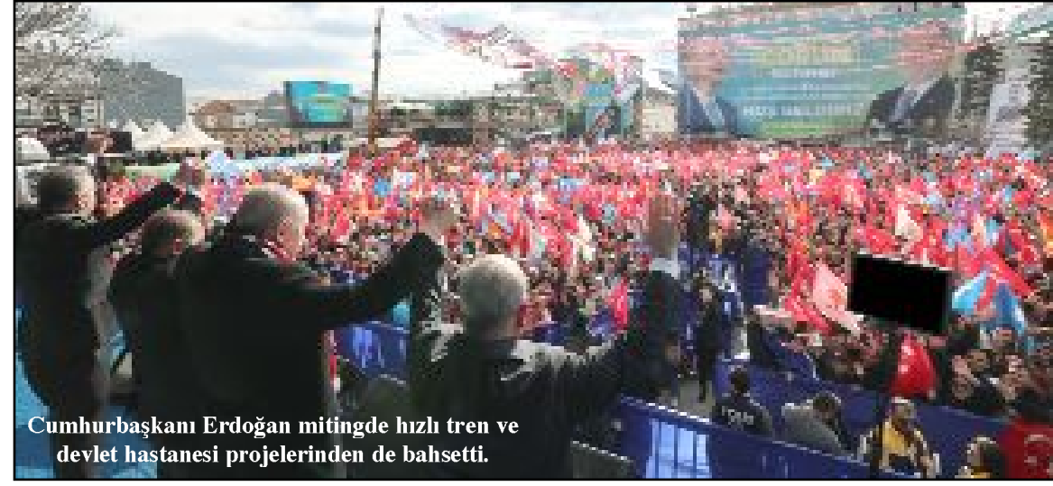
Cumhurbaşkanı Erdoğan mitingde hızlı tren ve devlet hastanesi projelerinden de bahsetti.