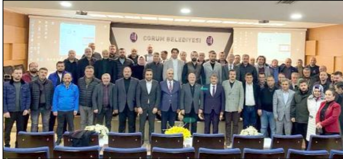
31 Mart seçimlerinde AK Parti adına sandık kurulunda görev yapacak üyeler ve okul sorumluları ile toplantı düzenlendi.