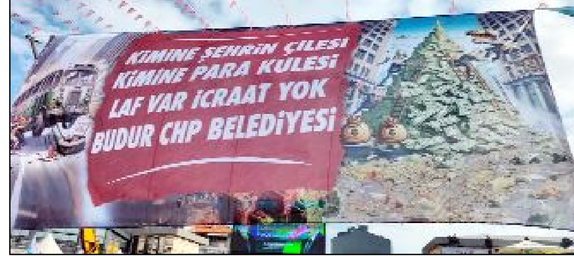
CHP'nin geçtiğimiz haftalarda yaşanan para sayma görüntülerini yansıtan pankart alana asıldı.