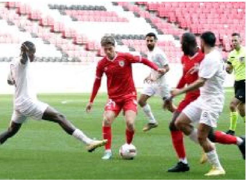
Ahlatcı Çorum FK, maça yedek ağırlıklı bir on birle başladı.