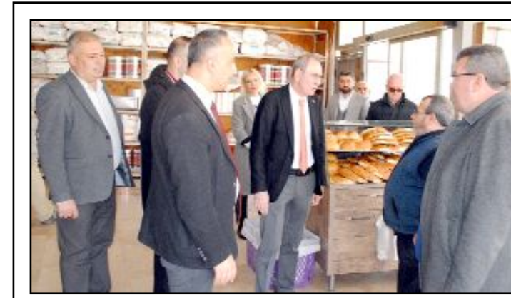
CHP Adayı Levent Çöphüseyinoğlu, Cengiz Topel Caddesi, Bakırçılar Sitesi ve Yukarı Sanayi'de faaliyet gösteren esnafı ziyaret ederek, yerel seçimler için destek istedi.