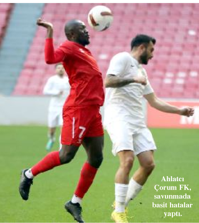
Ahlatcı Çorum FK, savunmada basit hatalar yaptı.

Trendyol Türkiye 1.Futbol Ligi'nde Play-Off'a kalma mücadelesi veren Ahlatcı Çorum FK, milli ara nedeniyle Süper Lig ekibi Yılport Samsunspor'la oynadığı hazırlık maçını kaybetti. Samsun Yeni 19 Mayıs Stadyumu'nda oynanan ve Samsun bölgesi A klasman hakemi Erdem Mertoğlu'nun yönettiği maça yedek ağırlıklı bir kadro ile çıkan Ahlatcı Çorum FK, henüz 1.dakikada Suat'la golü bulup öne geçerken, şoku çabuk atlatan Samsunspor, 7.dakikada Nany Dimata ile beraberliği sağladı. 28'de Carlo Holse ile 2-1 öne geçen Samsunspor, 32'de Kingsley Schindler'le farkı ikiye çıkarttı. 41'de Gökhan'ın gollük vuruşunda top auta gidince ilk yarı Karadeniz ekibinin