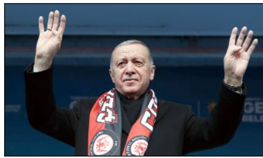
Cumhurbaşkanı Recep Tayyip Erdoğan binlerce Çorumluya seslendi.

cesi yeni bir başarı öyküsü daha yazacağına yürekten inanıyorum" şeklinde konuştu. (Volkan SINAYUÇ - AA)