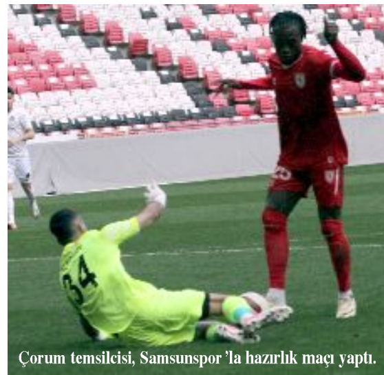
Çorum temsilcisi, Samsunspor'la hazırlık maçı yaptı.

Milli arada dün Trendyol Süper Futbol Lig takımlarından Yılport Samsunspor'la hazırlık maçında karşılaşan Ahlatcı Çorum FK, ara vermeden Ankara Keçiörengücü'ne maçın hazırlıklarına devam edecek. Kırmızı-siyahlı ekip, Samsun dönüşü bugün kendi tesislerinde yapacağı antrenmanla, 2 Nisan Salı günü, Ankara Keçiörengücü ile deplasmanda oynayacağı 28.hafta maçının hazırlıklarına kaldığı yerden devam edecek. (Hüseyin AŞKIN)