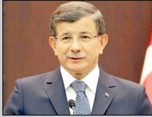
Gelecek Partisi Genel Başkanı Prof. Dr. Ahmet Davutoğlu