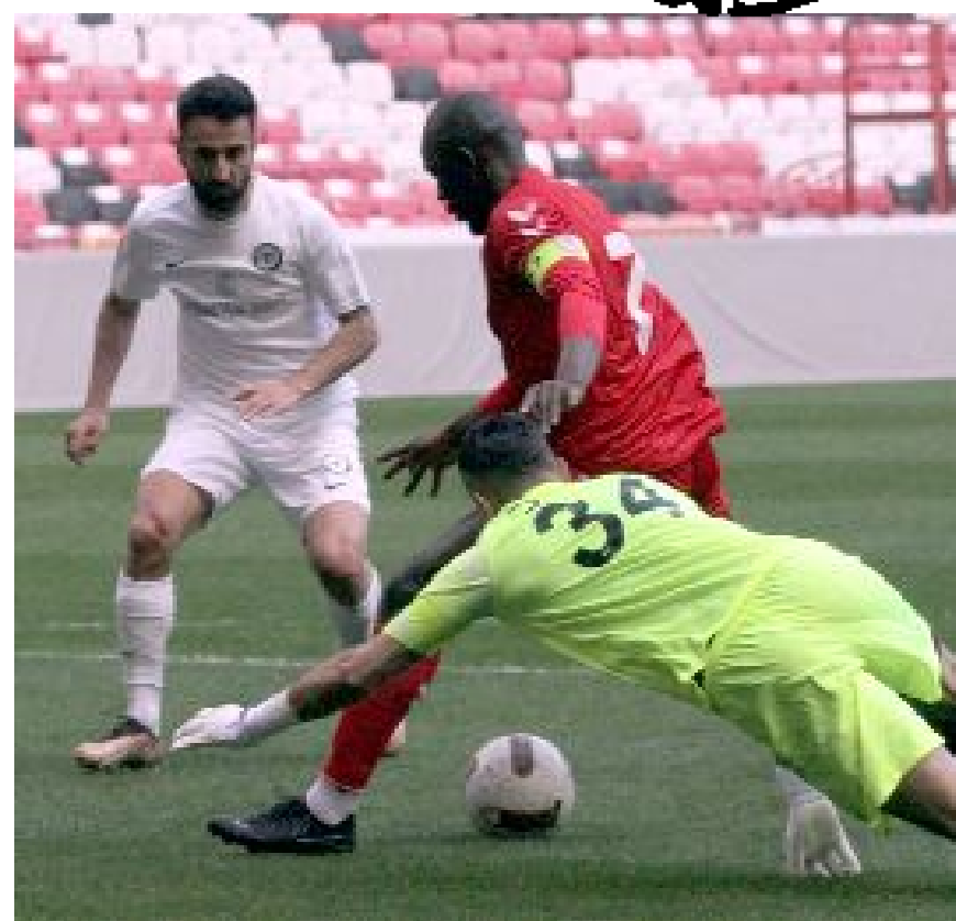
Ahlatcı Çorum FK, öne geçtiği maçta Samsunspor'a farklı yenildi.

3-1'lik üstünlüğü ile tamamlandı. İkinci yarıya Samsunspor tamamen farklı bir birle çıkarken, Ahlatcı Çorum FK'da ise sadece kalede değişiklik oldu. Kırmızı-siyahlı ekip ikinci yarıya Ali Türkan'ın yerine Hasan Hüseyin Akınay değişikliği ile başladı. İlk yarı olduğu gibi ikinci yarıda Samsunspor'un bariz üstünlüğü altında oynandı. Keçiörengücü ile oynayacağı maçın provası niteliğindeki karşılaşmada, Çorum temsilcisinde savunmadaki hatalar ve basit top kayıpları dikkat çekerken, 61'de Taylan Antalyalı, 81'de Emre Kılınç ve 84'te Ercan Kara ile 3 gol daha bulan Samsunspor sahadan 6-1 galip ayrıldı. (Hüseyin AŞKIN)