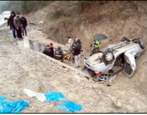
Kaza Mudurnu-Bolu Karayolu Feruz köyü mevkiinde meydana geldi

Bolu'da bir otomobilin şarampole uçarak ters döndüğü kazada 2'si ağır 3 kişi yaralanırken, yaralı olarak hastaneye kaldırılan iki Çorumlu hayatını kaybetti.