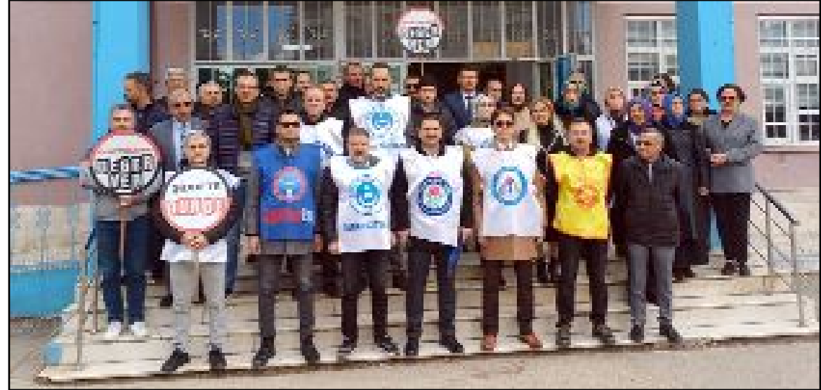
Eğitim iş kolunda örgütlü olan sendikaların başkan ve üyelerinin katılımıyla okul önünde basın açıklaması gerçekleştirildi.

Bilinmesini isteriz ki eğitim çalışanlarımız asla yalnız değildir. Yaşanan menfur saldırının failini lanetliyor ve yetkilileri bu tür olayları engelleme hususunda tedbir ve sorumluluk almaya davet ediyoruz." (Haber Merkezi)