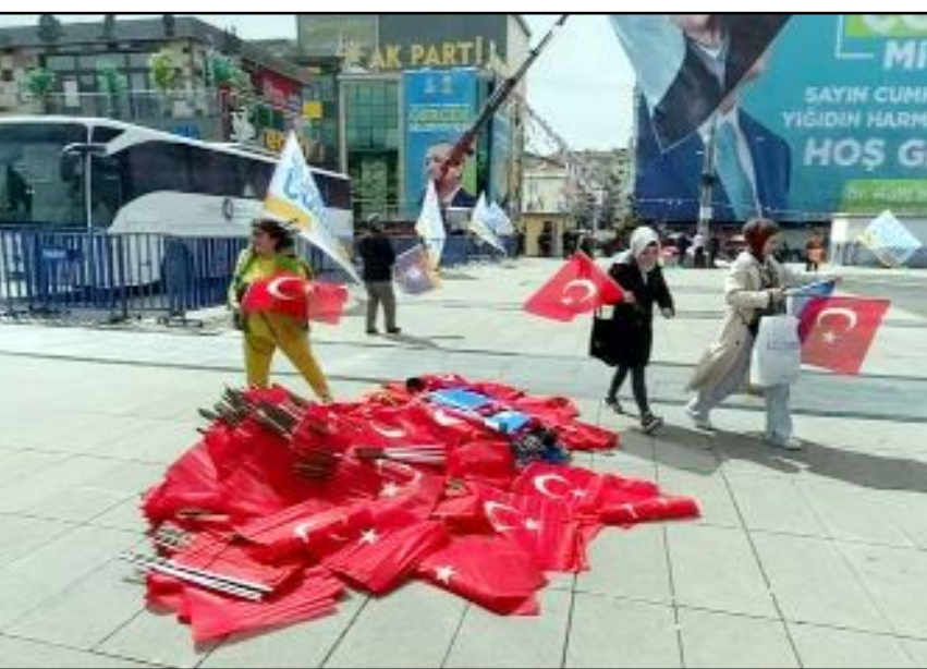
CHP İl Başkanı Dinçer Solmaz, Cumhurbaşkanı Erdoğan'ın Çorum mitinginden bu fotoğrafı paylaştı.

- Bize göre söz konusu vatansa, gerisi teferruattır." (Haber Merkezi)