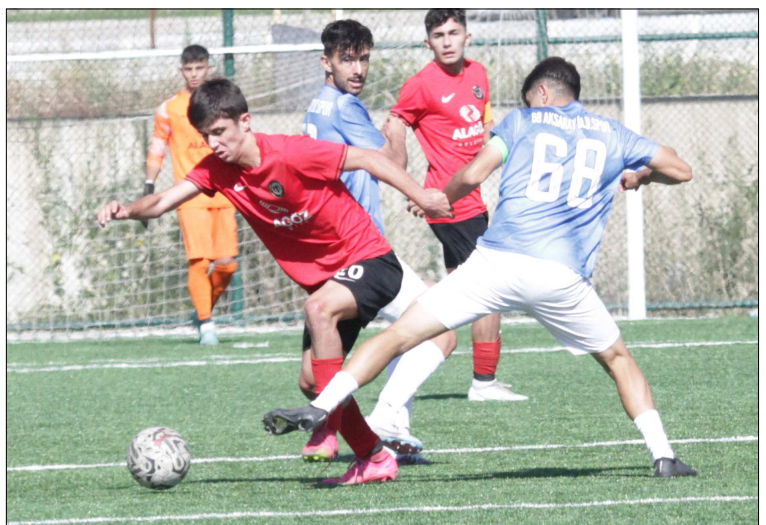
Çorum FK U19 takımının ligdeki maçından bir enstantane...

7 takımın 3 devreli lig statüsüne göre mücadele ettiği U19 Gelişim Ligi'nde Ahlatcı Çorum FK takımı 16 maçta rakip fileleri 33 kez sarsmayı başarırken, kalesinde ise 23 gol gördü. 16 maçın 9'unu kazanan Kırmızı-Siyahlılar, 3 kez berabere kalırken, 4 kez de mağlup oldu. Ahlatcı Çorum FK ligdeki en farklı galibiyetini 14.haftada Afyonspor deplasmanında 6-2'lik skorla alırken, en farklı yenilgisini ise ligin 9.haftasında Ak-saray Belediyespor deplasmanında 3-0'lık skorla aldı. (Rifat KARA)