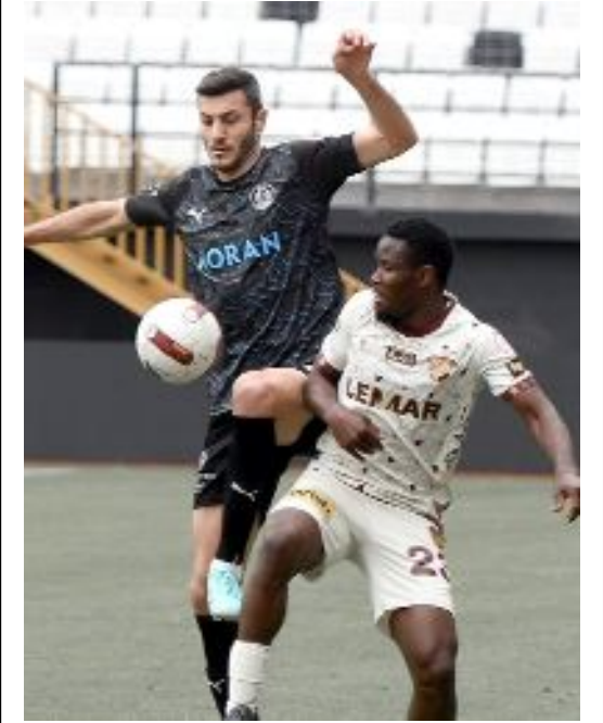
Göztepe'nin 1-0 kazandığı maçtan bir enstantane.

Milli aranın ardından Göztepe deplasmanda Kocaelispor'la, Manisa FK ise sahasında Bodrum FK ile karşılaşacak. (Hüseyin AŞKIN)