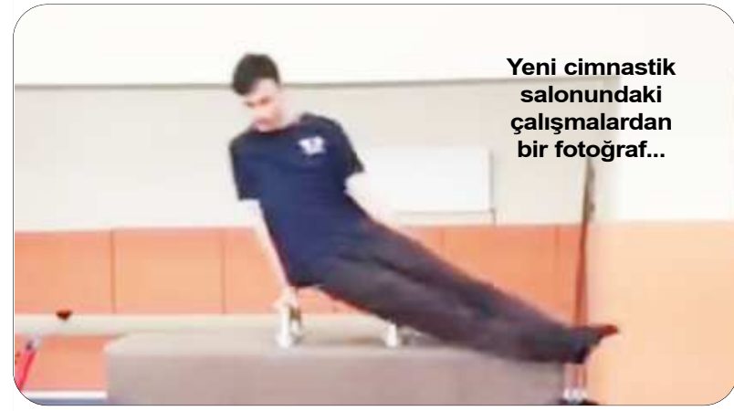
Yeni cimnastik salonundaki çalışmalarından bir fotoğraf...