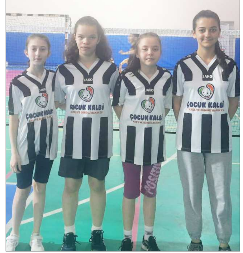
Cumhuriyet Ortaokulu'nun yıldız kızları finallere veda etti.

Tarhuncu Ahmet Paşa Ortaokulu ile Samsun Bafra Atatürk Ortaokulu yükseldi. (Rifat KARA)