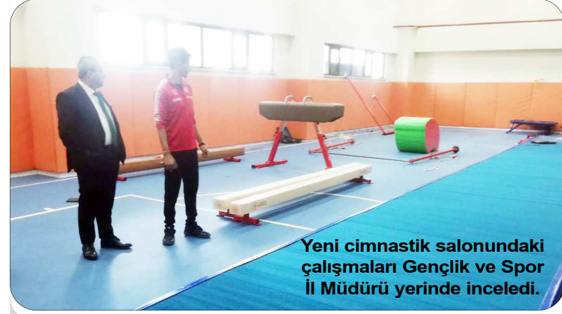
Yeni cimnastik salonundaki çalışmalarını Gençlik ve Spor İl Müdürü yerinde inceledi.

Çorum'da sporcu sayısı her geçen gün artan cimnastik sporunu daha yaygın hale getirmek amacıyla yeni salon kuruldu.