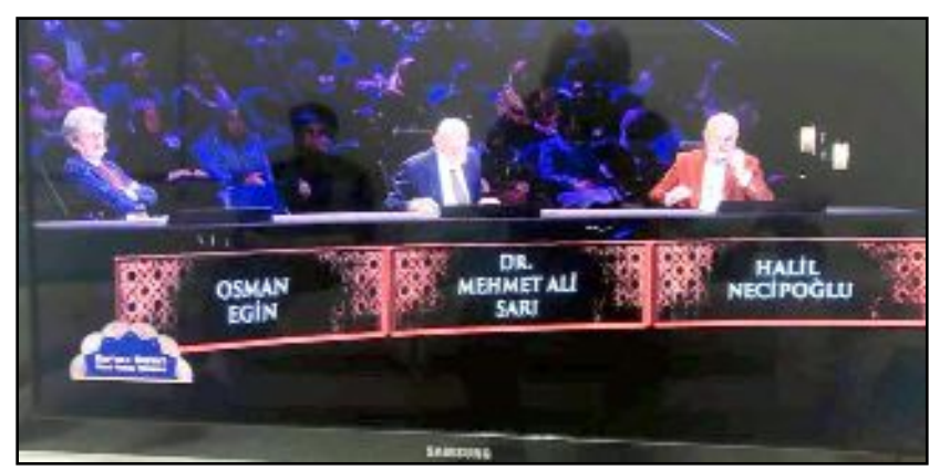
TRT ekranlarında yayınlanan yarışma büyük ilgi görüyor.