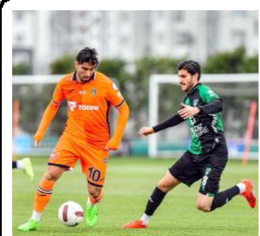
Kocaelispor'la Başakşehir, İstanbul'da karşılaştı.

Bu sonuçların ardından 15 puana yükselen Mimar Sinanspor averajla liderlik koltuğuna otururken, aynı puana sahip İskilipgücü ikinci sırada yer aldı. 13 puanlı Gençlerbirliği ise haftayı üçüncü sırada kapattı. 9 puanlı iki takımdan H.E.Kültürspor ve Osmangözü ise dördüncü sırada yer aldı. (Spor Servisi)