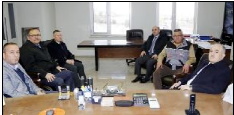
Atatürk maketi armağan edildi.