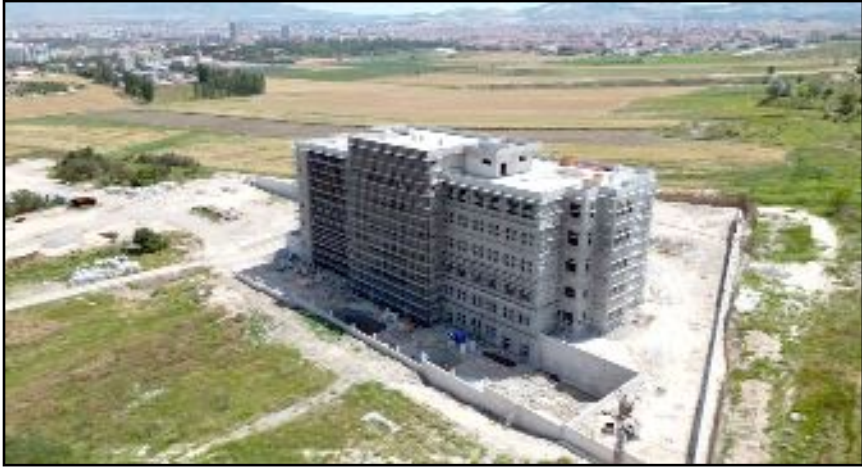
Çorum Ağız ve Diş Sağlığı Hastanesi'nin bir türlü bitirilememesi tepki çekmeye başladı.