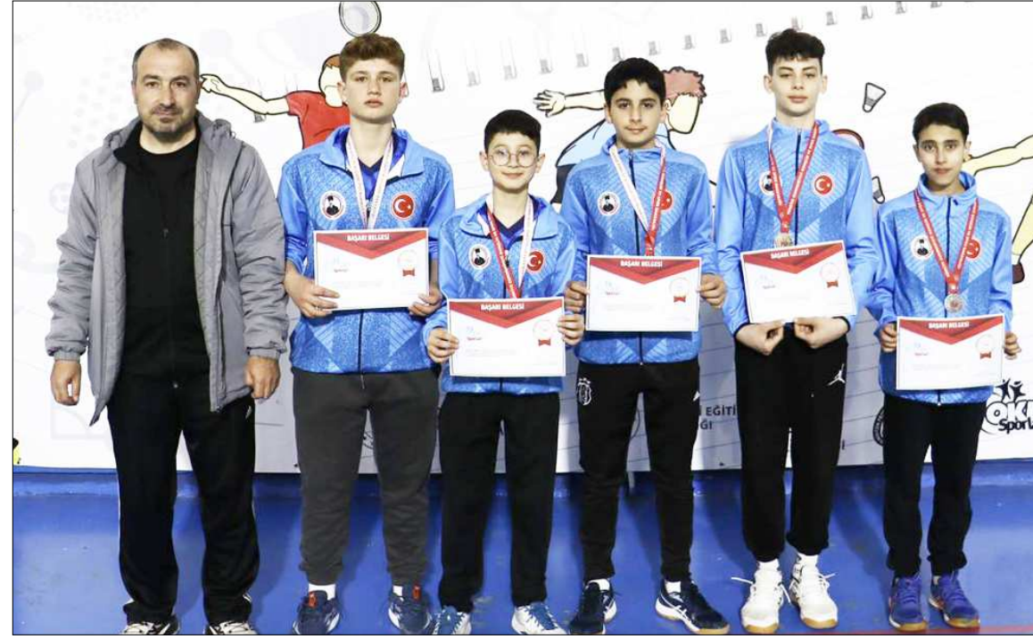
Osmancık Atatürk Ortaokulu Çorum grubunu ikinci sırada tamamlayarak finallere adını yazdırdı.

Çorum'da düzenlenen Okullararası Yıldızlar Badminton Grup Birinciliği'nde erkeklerde Çorum'u temsil eden Osmancık Atatürk Ortaokulu'adı Türkiye finallerine yazdırırken, kızlarda Çorum'u temsil eden Merkez Cumhuriyet Ortaokulu ise finallere 2.turda veda etti.