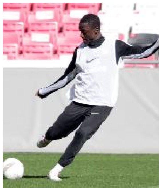
20 yaşındaki Senegalli orta saha oyuncusu, sezon sonuna kadar antrenmanlara devam edecek.

Edinilen bilgilere göre, 20 yaşındaki orta saha oyuncusu sezon sonuna kadar Ahlatçı Çorum FK ile antrenmanlara devam edecek. Genç futbolcu ile ilgisi karar sezon sonunda verilecek. (Hüseyin AŞKIN)