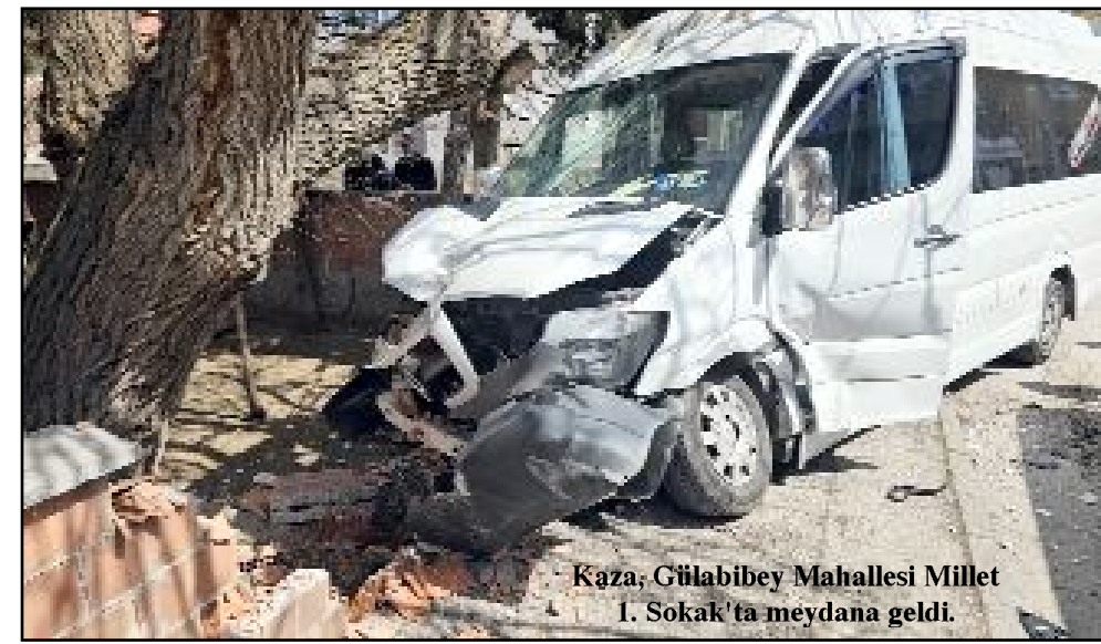
Kaza, Gülabibey Mahallesi Millet 1. Sokak'ta meydana geldi.

Çorum'da öğrenci servisi ile otomobilin çarpıştığı kazada 15'i öğrenci 16 kişi yaralandı.