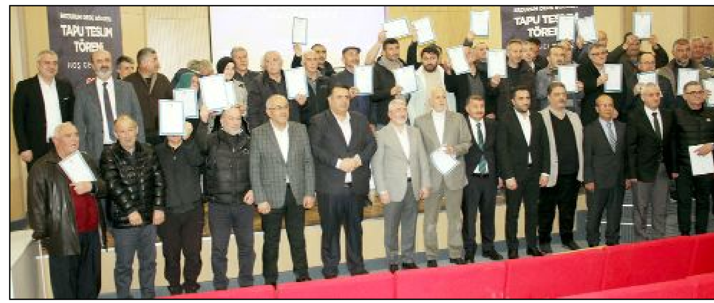
Erzurum Dede bölgesinde hak sahibi olan vatandaşlar için hazırlanan tapuların dağıtım töreni yapıldı.