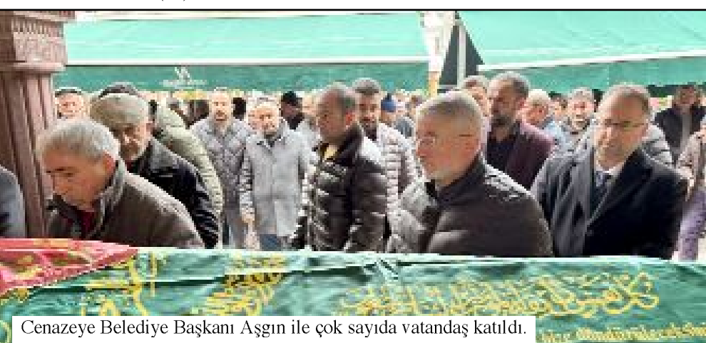
Cenazeye Belediye Başkanı Aşgın ile çok sayıda vatandaş katıldı.

ÇORUM HABER merhumeye Allah'tan rahmet, ailesi ve yakınlarına başsağlığı diler. (Volkan SINAYUÇ)