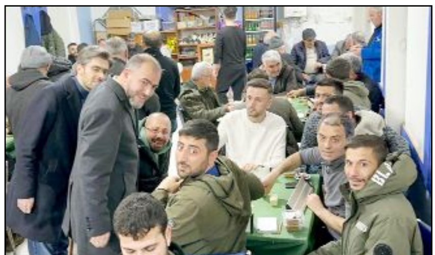
SPAdayı Cıdık iftar sonrası çeşitli ziyaretlerde bulunarak projelerini anlatıyor.

hayvanların yaşam hakkını korurken, vatandaşlarımızın maruz kaldığı olumsuz tablo da giderilmiş olacak. Bu konuda Belediye olarak hayvansaverler ve sivil toplum örgütleri ile uzlaşma içerisinde adım atacağız." şeklinde konuştu. (Haber Merkezi)