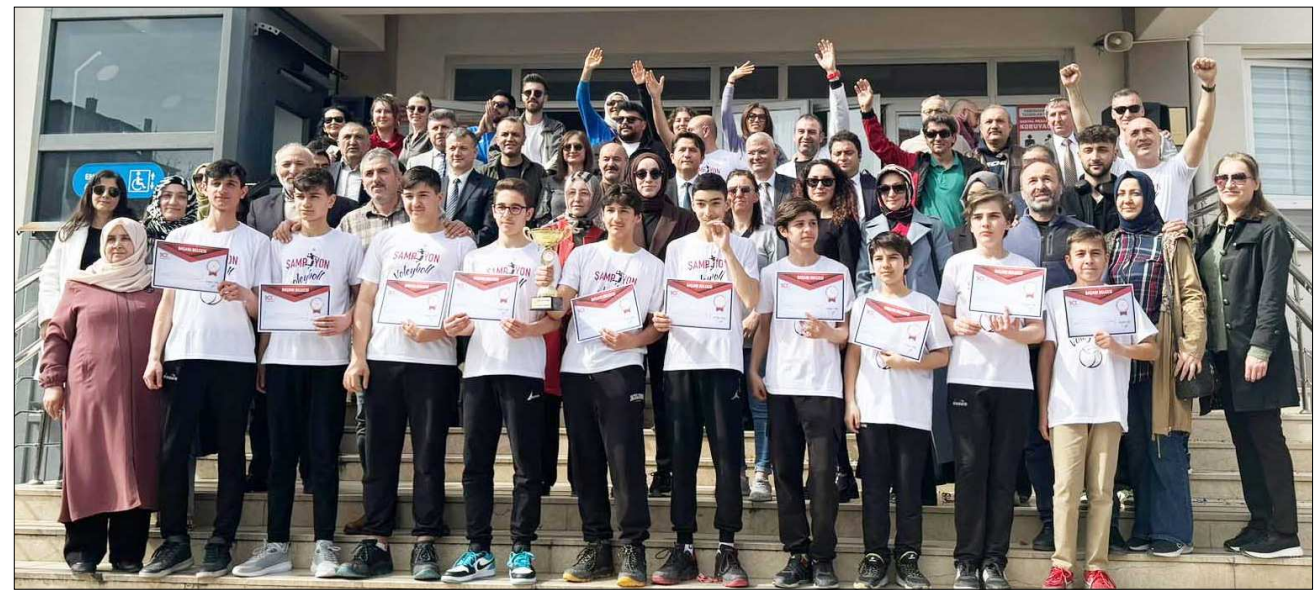
Kutlama sonunda Ahmet Tevfik İleri Ortaokulu voleybol takımı toplu bir şekilde hatıra fotoğrafı çekindiler...