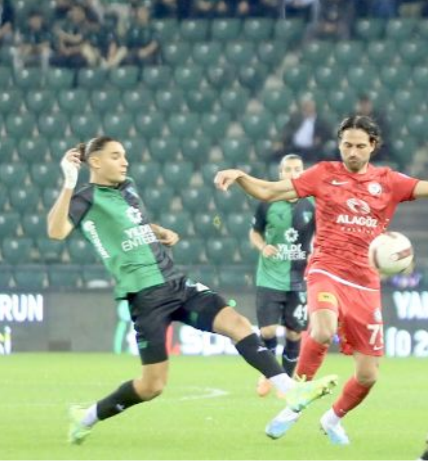
Ahlatcı Çorum FK, play-off final bileti yarışındaki en önemli rakiplerinden Kocaelispor’la 7 Nisan’da Çorum’da karşılaşacak.