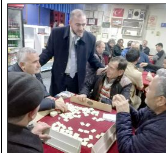
Saadet Partisi Çorum Belediye Başkan Adayı Cıdık, yeni projelerini açıklamayı sürdürüyor.

Aydınli bahardan esin almadan Allı turların sesin almadan Her canlı doğadan besin almadan Baharın geldiğin nereden bileyim?