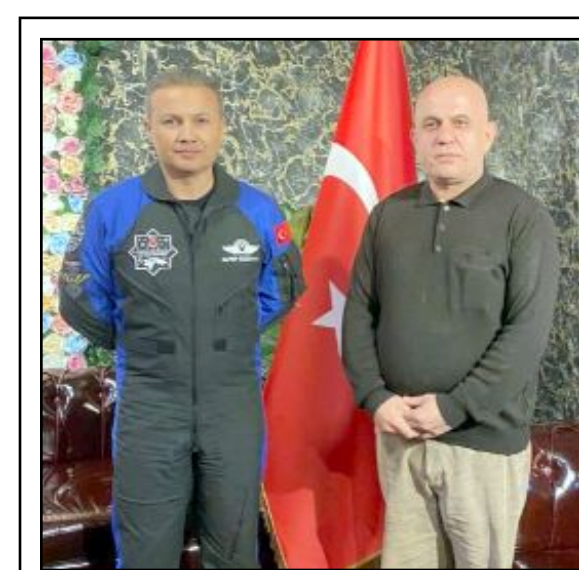
Türk Astronot Alper Gezeravcı, Çorumlu Mehmet Coşgun'un konuğu oldu.