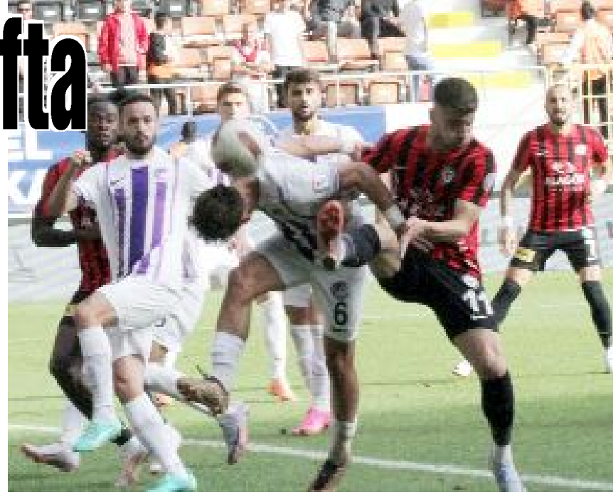
Ahlatcı Çorum FK, milli maç ve seçim arasından sonraki ilk maçını 2 Nisan Salı günü Ankara Keçiörengücü ile deplasmanda oynayacak.

Ahlatcı Çorum FK, milli ve seçim arasından sonra 2 Nisan Salı günü, Ankara Keçiörengücü ile oynayacağı Trendyol Türkiye 1.Futbol Ligi 28.hafta maçının hazırlıklarını galibiyet parolasıyla sürdürürken, kafilenin Ankara seyahat programı belli oldu. Sportif Direktör Muhammed Fettahoğlu’ndan aldığımız bilgilere göre, maç öncesi son antrenmanını 1 Nisan Pazartesi günü, saat 11.30’da yapacak olan kırmızı-siyahlı ekip, saat 14.00 sıralarında da otobüsle Ankara’ya gidecek ve kalacağı otele yerleşerek karşılaşma saatini beklemeye başlayacak. (Hüseyin AŞKIN)