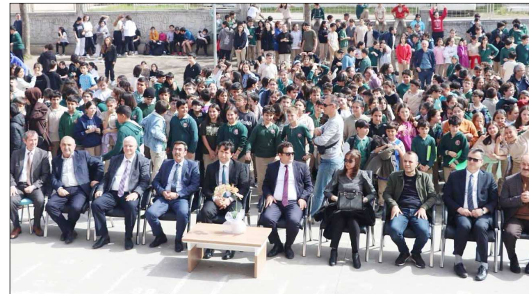
Etkinlik, Ahmet Tevfik İleri Ortaokulu'nun bahçesinde düzenlendi.