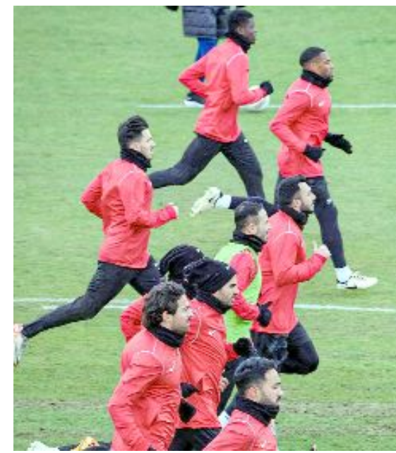
Ahlatcı Çorum FK, Ankara Keçiörengücü maçına galibiyet parolasıyla hazırlanıyor.