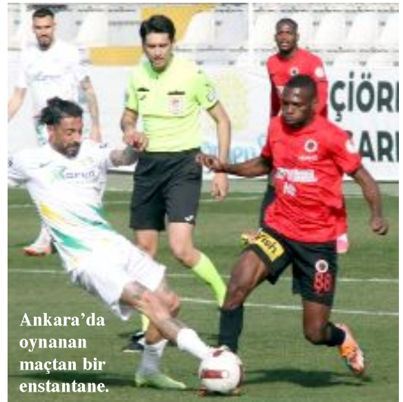
Ankara'da oynanan maçtan bir anstantane.

sahibi ekip bu gole 33.dakikada Rahman Buğra Çağırın ile cevap verdi. Kalan sürede başka gol olmayınca karşılaşma 1-1 berabere sona erdi. Bu sonucun ardından, play-off hesapları yapan Gençlerbirliği puanını 34'e, düşme korkusunu yakından hissedilen Şanlıurfaspor ise 24'e yükselterek averajla ateş hattının üzerinde yer aldı. (Hüseyin AŞKIN)