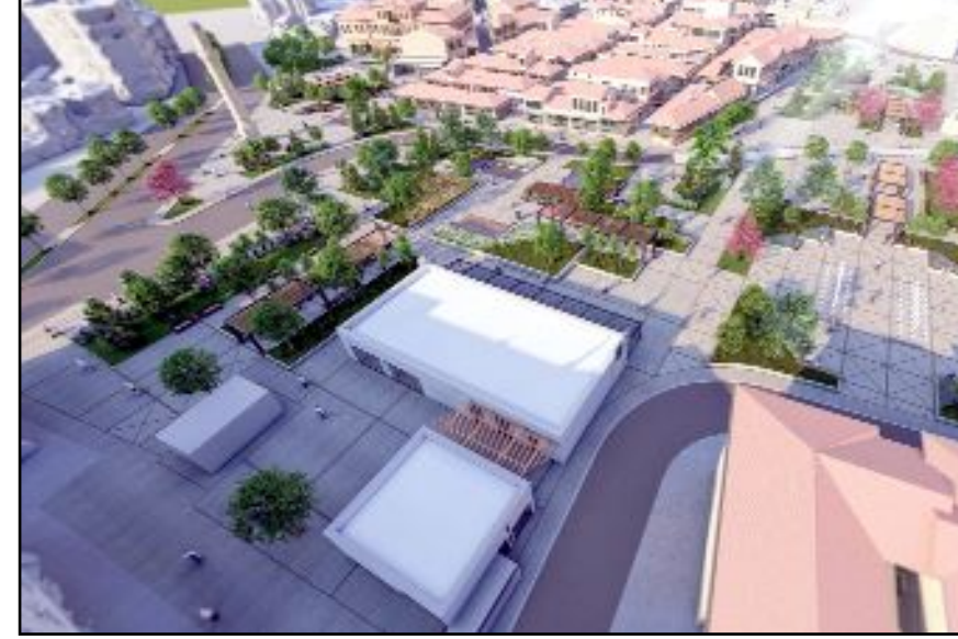
Tarihi Çorum Meydanı'nda birinci etap tamamlandı, sırada ikinci etap var.

lah seçim sonrasında yıkarak Velipaşa Hanı'nın önünü açacağız. Böylece 5 bin 300 m2'lik bir alanı da meydana dahil etmiş olacağız." dedi. (Haber Merkezi)