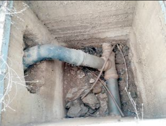
Aşdağullular kendi göletlerinin suyunun Ortaköy Belediyesi'nce çalıştığını iddia ediyor.

Ocak ayı itibarıyla tüzüm bağlarımızı bahçelerimize ve tarlalarımıza yeterince sulayamadığımızı iddia eden çiftçiler, "Bu da ciddi bir verim kaybına sebep olmaktadır. Oruçpınar Göleti'ne gelen suyun bir kısmının Ortaköy Belediyesi'nin kontrolünde Pınarlı Sulama Göleti'ne izinsiz taşınmasına hiçbir şekilde razı değiliz. Kaymakam beyden de sorunumuzu çözmesini bekliyoruz." dedi. (Haber Merkezi)