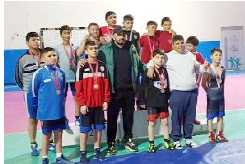
Kilolarında dereceye giren güreşçiler madalya ile ödüllendirildi.