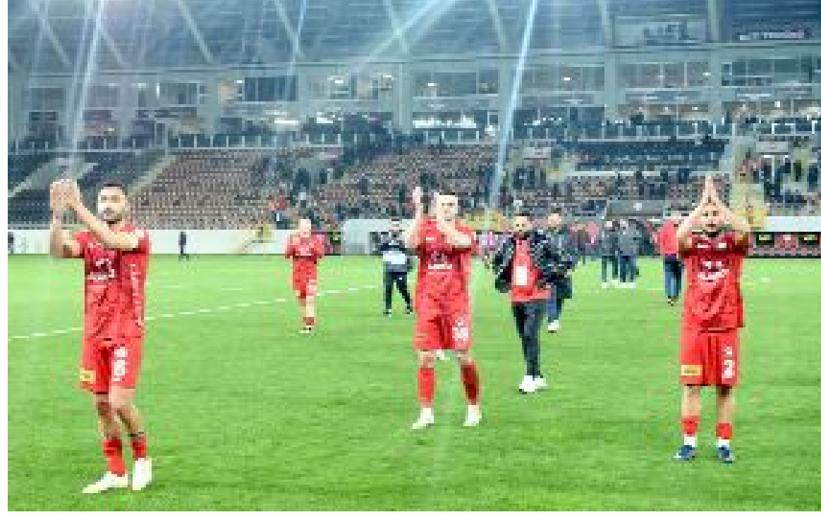
Kırmızı-siyahlı taraftarlar maçtan sonra futbolcuları tribüne çağırdı. Tribüne giden futbolcular taraftarların alkışına alkışla cevap verdi.

güvenin, ve sonuna kadar destekleyin" şeklinde konuştu. Taraftarlar da beraberliğe rağmen futbolcuları alkışlarla soyunma odasına gönderdiler. (Hüseyin AŞKIN)