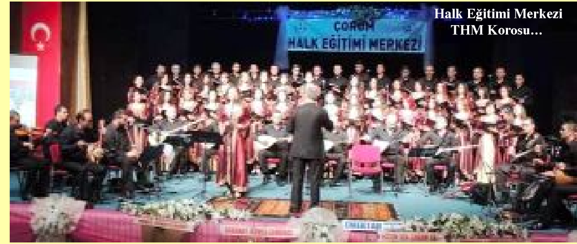
Halk Eğitimi Merkezi THM Korosu...