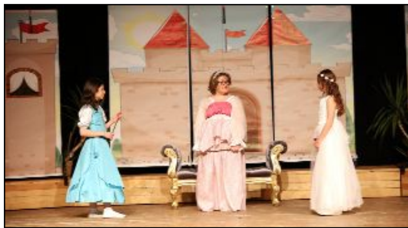
"What Goes Around, Comes Around" isimli İngilizce Müzikal büyük beğeni topladı.