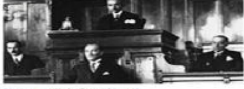
Öğretim Birliği Yasası (Tevhid-i Tedrisat Kanunu)