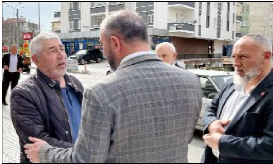
Cıdık, yurttaşların teveccühünden memnun...

esnafı ziyaret ederek, seçimlerde destek istedi.