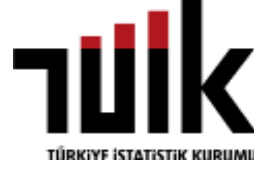
TÜRKİYE İSTATİSTİK KURUMU