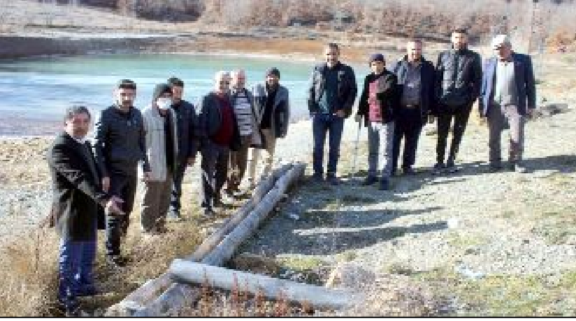
Aşdağul Beldesi sakinleri iki yıldır mücadele etmelerine rağmen sorunun çözülmediğini söyledi.