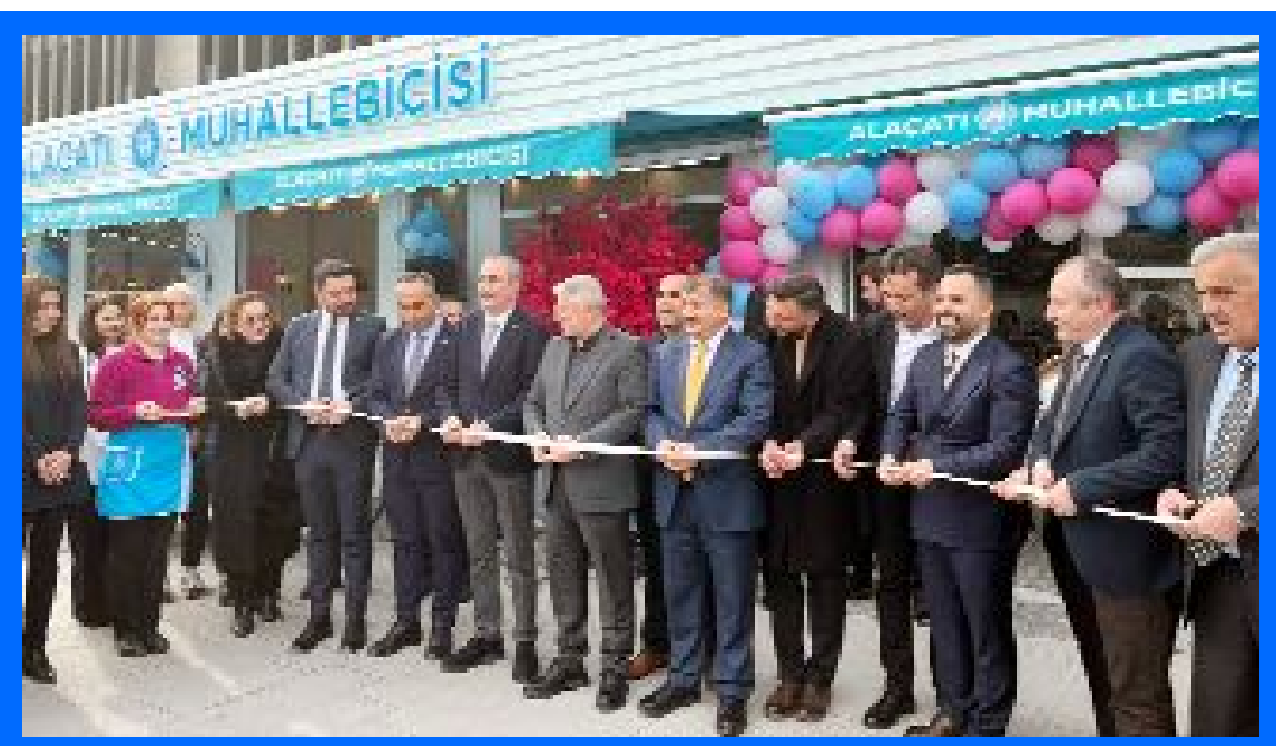
Alaçatı Muhallebicesi'nin açılışında kurdele kesilirken...

Belediye tarafından yapılan açıklamada etkinliğe tüm Çorumlu kadınlar davet edildi. (Volkan SINAYUÇ)