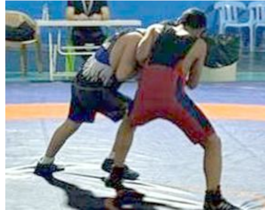
Müsabakalar Tefvik Kış Spor Salonu'nda yapıldı.

Müsabakalar sonunda düzenlenen törenle dereceye giren sporculara madalyalar takdim edildi. (Rifat KARA)