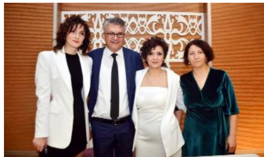
Ailelerle nikâh anıları...