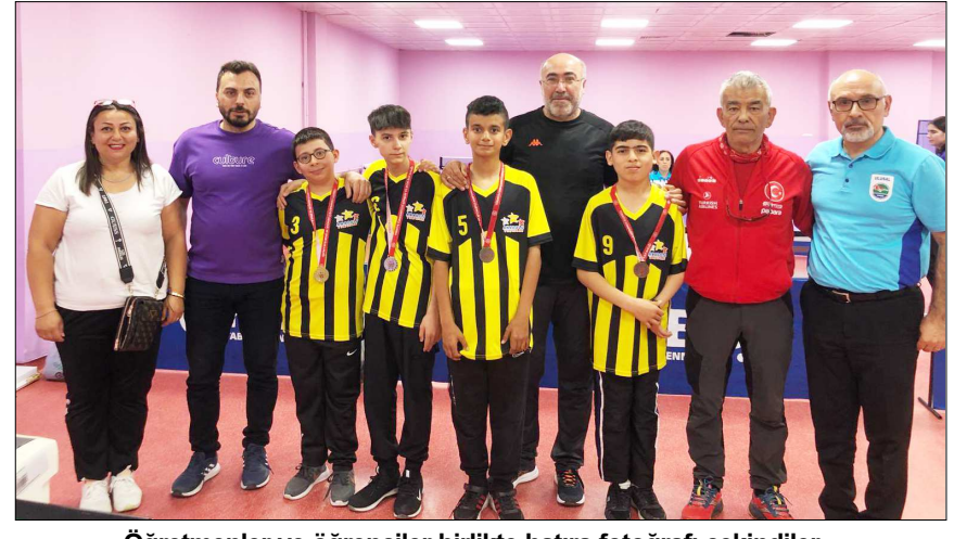
Öğretmenler ve öğrenciler birlikte hatıra fotoğrafı çekindiler...

Okullararası düzenlenen Özel Sporcular Mental Masa Tenisi İl Birinciliği'nde dereceye giren sporcular belli oldu.