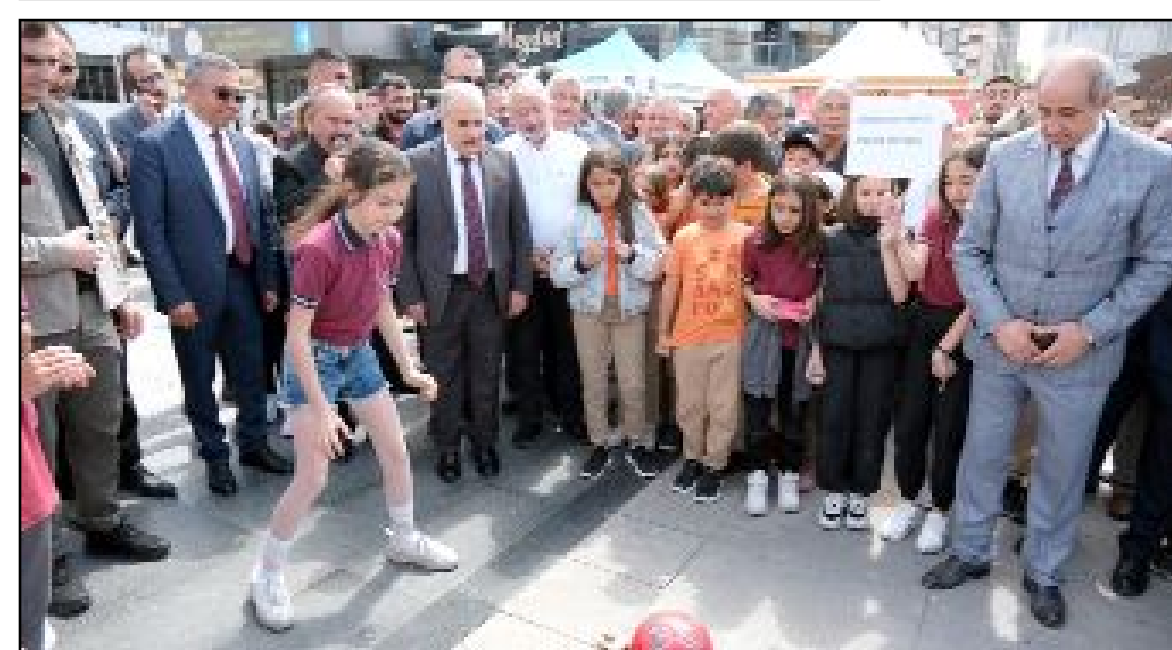
Şölen havasında geçen etkinlikte çocuklar okkelden, yakar topa, ip atlamadan masket oyununa kadar birbirinden farklı çocuk oyununu oynayarak gönüllerince eğlendi.