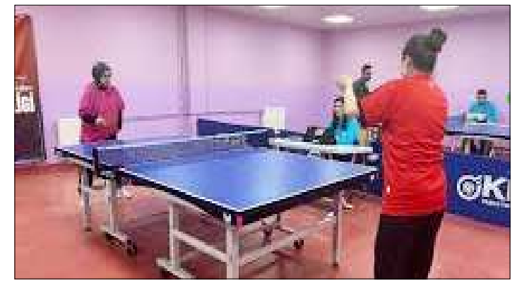
Müsabakalar Olimpik Yüzme Havuzu Masa Tenisi Salonu'nda yapıldı.