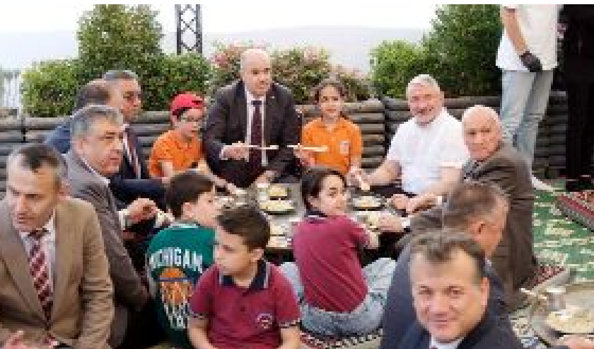
Vali Dağlı ile Başkan Aşgın, Kadeş Barış Meydanı'ndaki etkinlikte çocuklarla yakından ilgilendi. Etkinlik sonunda katılımcılara çiğdem aşısı dağıtıldı. •7'de

Valilik, Belediye ve Milli Eğitim Müdürlüğü tarafından Kadeş Barış Meydanı'nda "Çiğdem Aşı ve Çocuk Oyunları Şenliği" düzenledi. Renkli görüntülere sahne olan etkinliğe katılan çocuklar birbirinden güzel oyunlarını oynarken, protokol üyeleri de onlara eşlik etti. •7'de