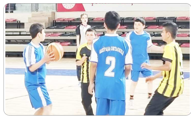
Çorum Yeni Spor Salonu'nda oynanan maçlardan fotoğraf...

Çorum'da ilk kez düzenlenen Okullararası Mental 3x3 Basketbol İl Birinciliği'nde özel sporcular hünerlerini sergilediler.