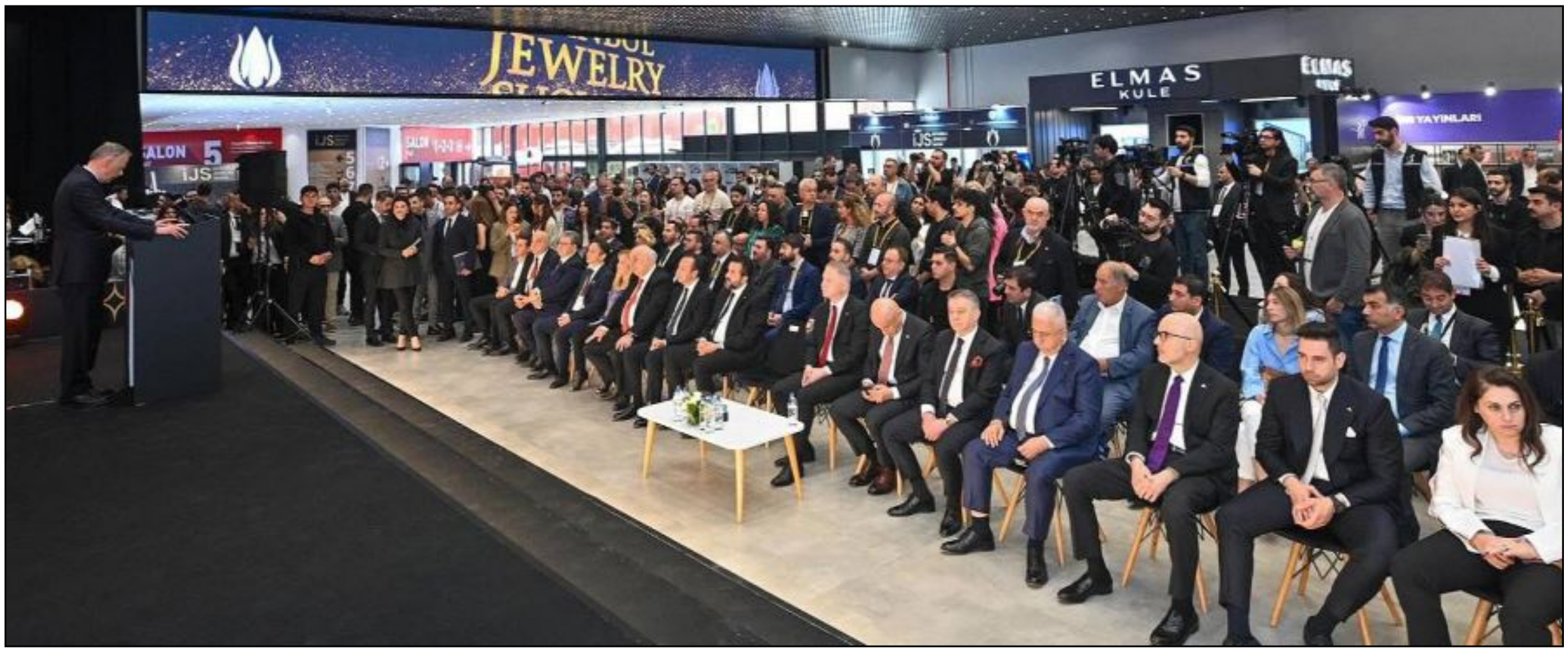
Istanbul Jewelry Show'un açılış töreninden... Ahlatcı Holding yöneticileri, fotoğrafın sağ tarafında, önde...