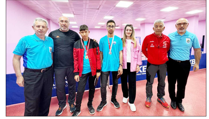
Dereceye giren sporcular madalya ile ödüllendirildi.