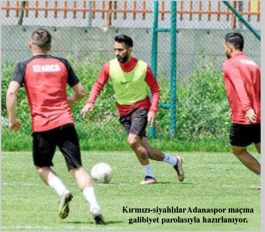
Kırmızı-siyahlılar Adanaspor maçına galibiyet parolasıyla hazırlanıyor.