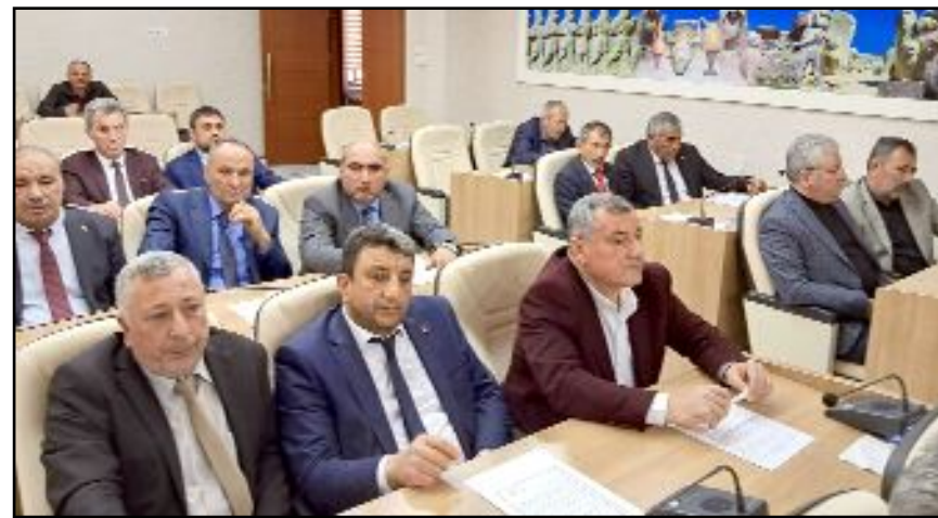
Merkez ve ilçelerde insan hakları kurullarında görev yapmak üzere İl Genel Meclisi üyeleri arasından 14 üye belirlendi.