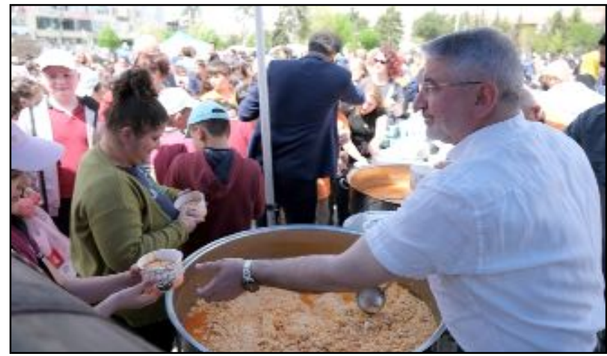
Program sonunda vatandaşlara çiğdem aşı dağıtıldı.

Konuşmaların ardından protokol üyeleri Kadeş Meydanı'nda çocukların oynadığı oyunları izledi. Zaman zaman çocuklara eşlik eden protokol üyeleri, çocukların heyecanına ortak oldu. Program sonunda vatandaşlara çiğdem aşı dağıtıldı. (Haber Merkezi)