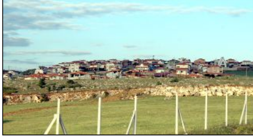
Çorum'un Ortaköy ve Osmançık yolları ile Atçalı Köyü civarında çok sayıda hobi bahçesi bulunuyor.

Farklı planlar mı var? Yeniden Refah Partisi olarak mutlaka konunun takipçisi olacağız.”