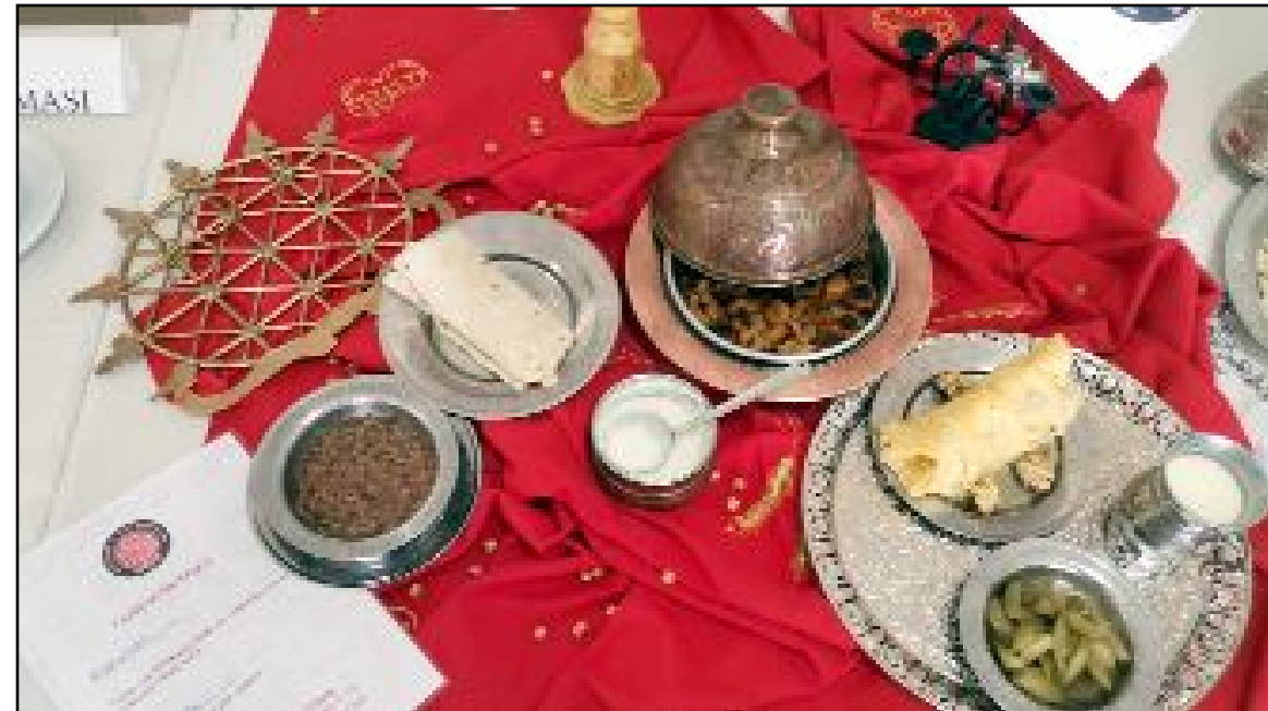
Çorum Hitit Mesleki ve Teknik Lisesi, "Çorum Mutfağı" yemeği ile yarışmada birinci oldu.