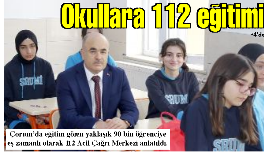
Çorum'da eğitim gören yaklaşık 90 bin öğrenciye eş zamanlı olarak 112 Acil Çağrı Merkezi anlatıldı.