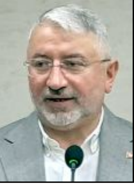
Halil İbrahim Aşgın

Belediye Başkanı Dr. Halil İbrahim Aşgın, öntümüzdeki 5 yıl içinde Çorum'daki tüm paydaşlarla birlikte muhteşem ve büyük işlerin altına imza atacaklarını söyledi.