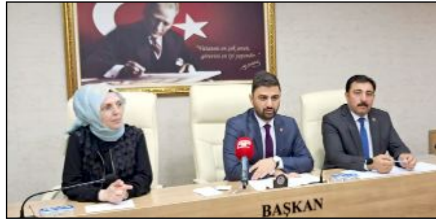
İl Genel Meclisi, Nisan ayı son toplantısını gerçekleştirdi.

sunmaya her zaman hazır olduklarını söyleyen Aşgın, "Öntümüzdeki 5 yıl içinde muhteşem ve büyük işlerin altına imza atacağız" şeklinde konuştu. (Taner ŞİMŞEK)