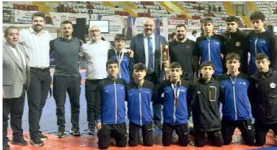
Çorum İl Millî Eğitim Spor Kulübü, 216 takım arasında Türkiye ikincisi oldu.

Şampiyonada bir şampiyon, bir de Türkiye ikincisi çıkartan Çorum İl Millî Eğitim Spor Kulübü, 216 takım arasında ikinci olarak büyük bir başarıya imza attı. Sivas Sporcu Eğitim Merkezi takım halinde Türkiye Şampiyonu olurken, Antalya Cengiz Elbeye ise üçüncü sırada yer aldı.