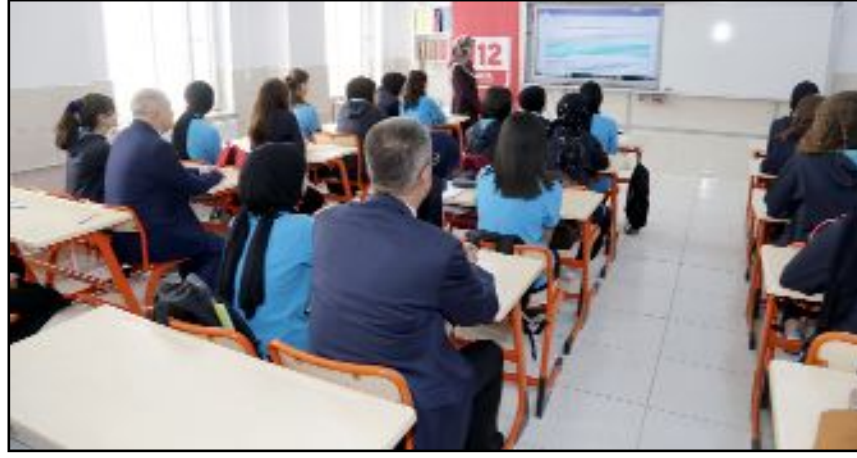
Valisi Zülkif Dağlı, il genelinde öğretmen ve öğrencilere aynı anda verilen 112 Acil Çağrı Merkezi bilgilendirme ve farkındalık eğitimini Suheybi Rumi İmam Hatip Ortaokulundaki öğrencilerle birlikte takip etti.

va tandışa hizmet noktasında önemli başarılar elde ettiğini vurgulayan Dağlı, "Tüm istatistik verilerde Türkiye ortalamasının üstünde kalarak, halkımıza hızlı ve kaliteli hizmet verme noktasında çok iyi bir durumda'yız" dedi. (Haber Merkezi)