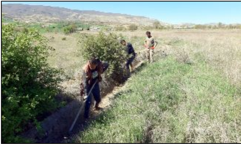
Ortaköy'de yaklaşık 600 dönüm araziye sulayan kanal, belediye ekiplerince temizlendi.

ni belirten Kurşun, bu sayede suyun akışkanlığını artırdıklarını kaydetti. (AA)