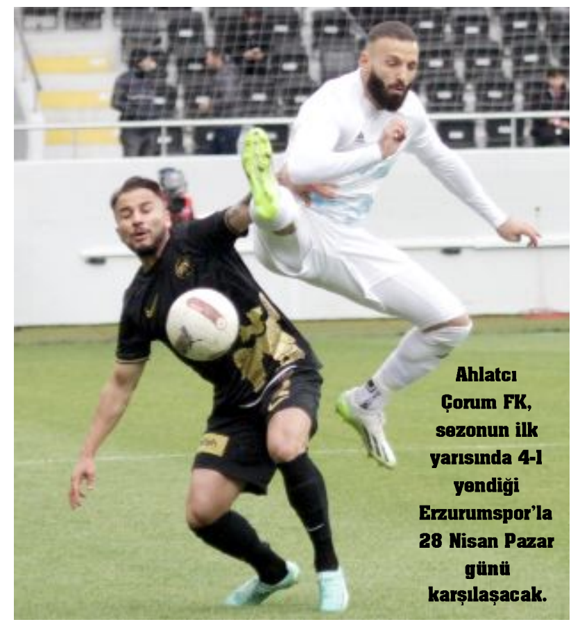
Ahlatcı Çorum FK, sezonun ilk yarısında 4-1 yendiği Erzurumspor'la 28 Nisan Pazar günü karşılaşacak.

ADANA 3 MAÇTA 1 PUAN ALDI Filiz, Adanaspor'un ise bugüne kadar 3 maçını yönetti. Turuncu-beyazlı ekip deplasmanda oynadığı bu maçlarda 1 galibiyet 2 yenilgi alırken, 2020-2021 Sezonunda deplasmanda Akhisarspor'u 1-0 yenerken, 2018-2019 sezonunda Balıkesirspor'a 1-0, 2021-2022 sezonunda ise Keçiörengücü'ne 2-0 yenildi. (Hüseyin AŞKIN)