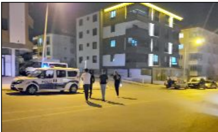
Asayiş uygulamasında kasten adam öldürme ve hırsızlık suçlarından kesinleşmiş cezaları bulunan 2 aranan şahıs yakalandı.

Gözaltına alınan şüpheliler ilade işlemleri için polis merkezine götürüldü. (Haber Merkezi)