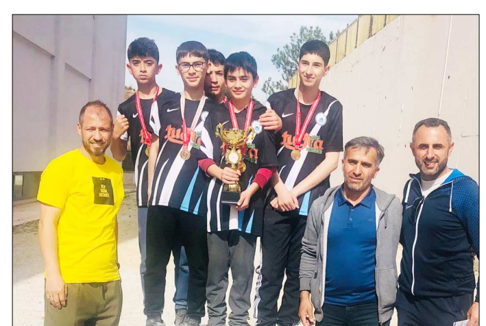
Dereceye giren okullara kupa ve madalya ile ödüllendirildi.