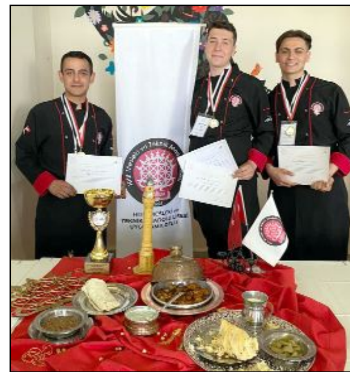
Çorum Hitit Mesleki ve Teknik Lisesi, Batı Karadeniz'i İstanbul'da yapılacak olan finalde temsil edecek.

Yarışmada birinci olan Çorum Hitit Mesleki ve Teknik Lisesi (Turizm ve Otelcilik Okulu), İstanbul'da yapılacak finalde Batı Karadeniz Bölgesi adına yarışacak. (Haber Merkezi)