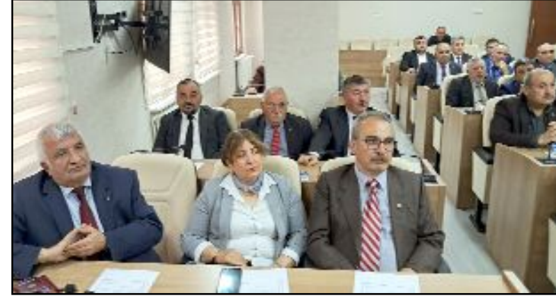
İl Genel Meclisi'nin Nisan ayı beşinci toplantısında Afet ve Risk Komisyonu kurulması kararlaştırıldı.

Çorum İl Genel Meclisi'nde Afet ve Risk Komisyonu kurulmasına karar verildi.