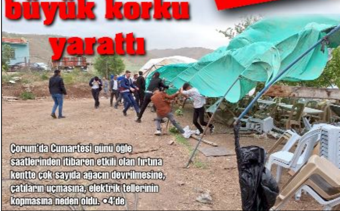
Çorum'da Cumartesi günü öğle saatlerinden itibaren etkili olan fırtına kentte çok sayıda ağacın devrilmesine, çatıların uçmasına, elektrik tellerinin kopmasına neden oldu. 4'de