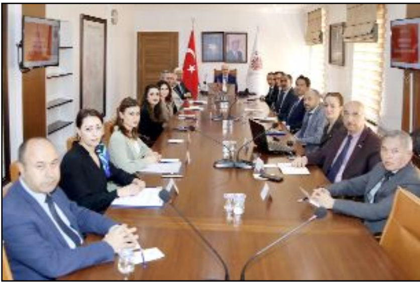
Toplantıda, Çorum Yeşilay Şubesi'nin yeni projeleri hakkında bilgilendirme sunumu yapılırken, ilçelerde yürütülen bağımlılıkla mücadele çalışmalarını değerlendirildi.

larımıza ve gençlerimize yönelik yeni, farklı ve etkili projelerin planlandığını ve bunları uygulamaya koymak üzere tüm kurumların işbirliğinde yoğun bir çalışma yürüteceklerini ifade etti.