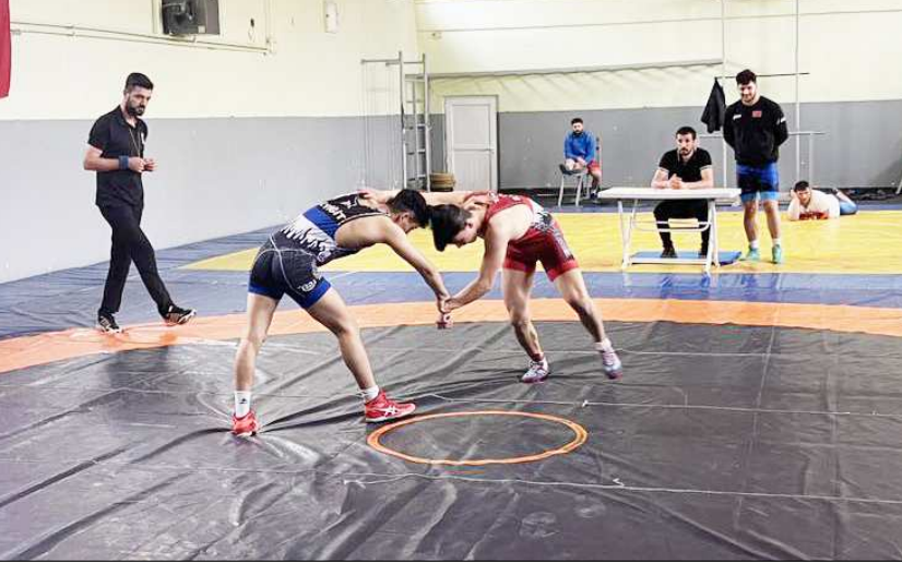
U23 Serbest Güreş İI Birinciliği müsabakalarından fotoğraflar...