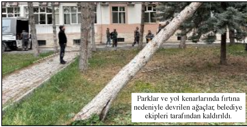
Parklar ve yol kenarlarında fırtına nedeniyle devrilen ağaçlar, belediye ekipleri tarafından kaldırıldı.