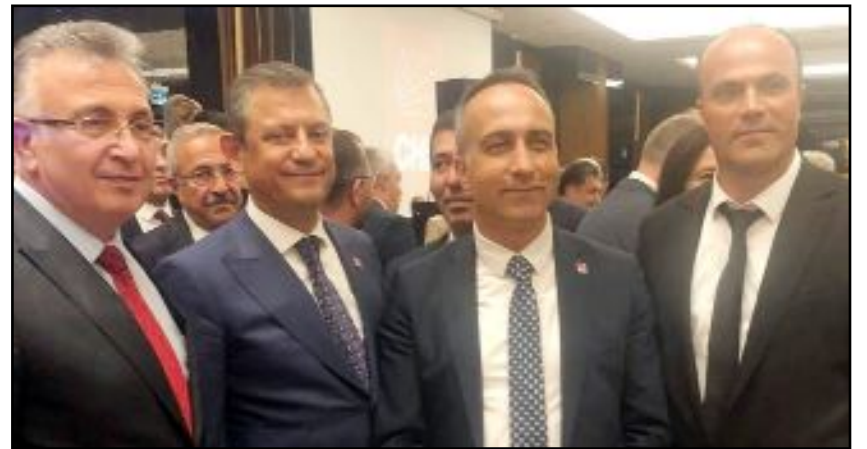
CHP Çorum İl Başkanı Dinçer Solmaz ve belediye başkanlarından oluşan heyet, CHP Genel Başkanı Özgür Özel, İstanbul Belediye Başkanı Ekrem İmamoğlu ve partili yöneticilerle görüştü.

Solmaz, görüşmelerde Özel'i Çorum'a davet etti. (AA)