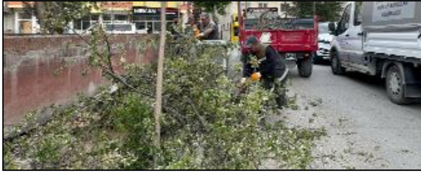
Kentte yaşanan şiddetli fırtına sırasında ağaç devrilmesi olaylarıyla ilgili 25 ihbar alan belediye ekipleri anında müdahale etti.