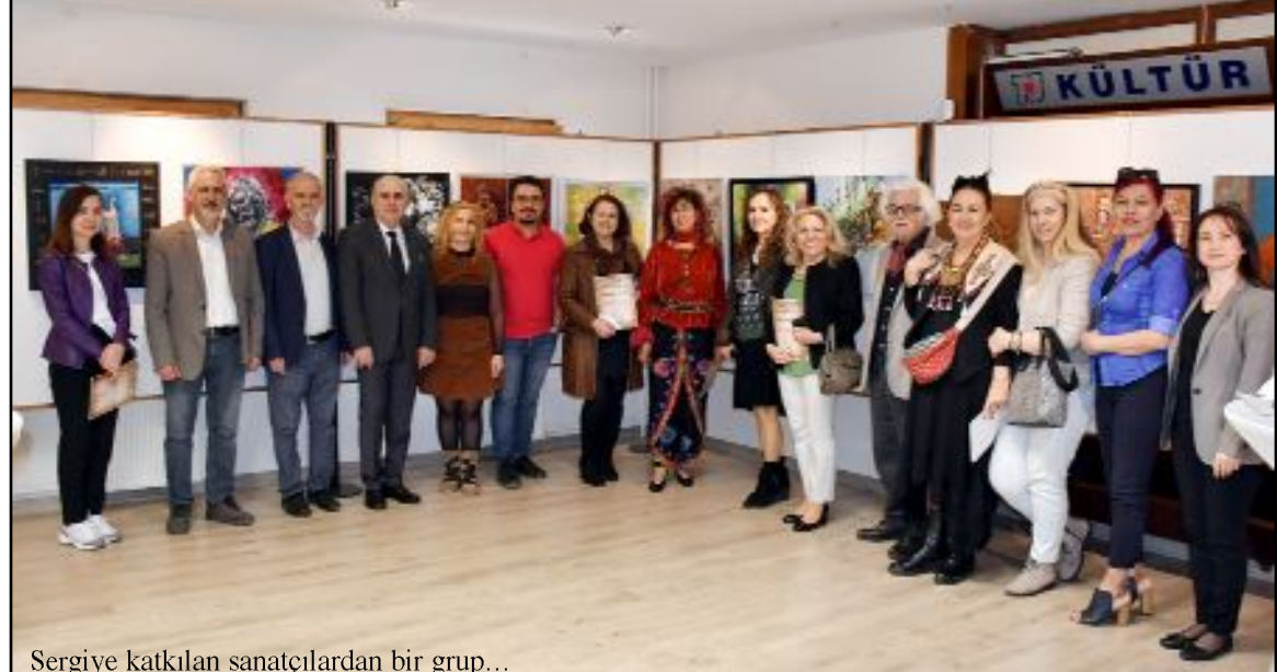
Sergiye katılan sanatçılardan bir grup...