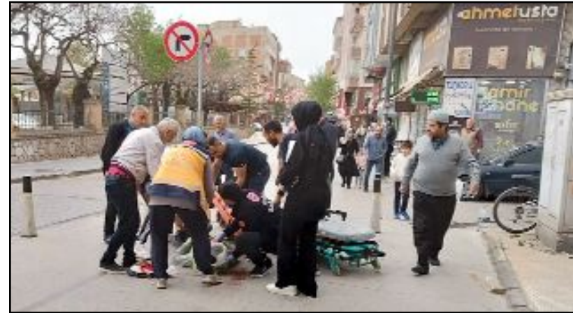
Kanlar içinde yerde kalan adamın imdadına çevredeki vatandaşlar yetişti. (Fotoğraf: AA)

düştü. Kanlar içinde yerde kalan adamın imdadına çevredeki vatandaşlar yetişti. (Fotoğraf: AA)