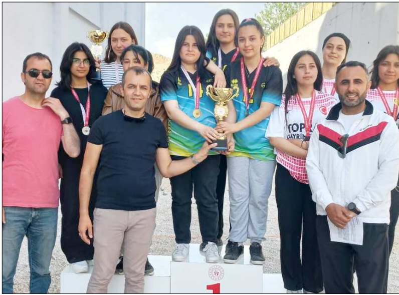
Sungurlu temsilcileri Çorum'u gruplarda temsil etmeye hak kazandılar...

Okullararası düzenlenen Genç Kızlar Bocce Petank II Birinciliği'nde şampiyonluk kupası Sungurlu temsilcisi Şehit Ali Alıtkan Anadolu İmam Hatip Lisesi'nin oldu.