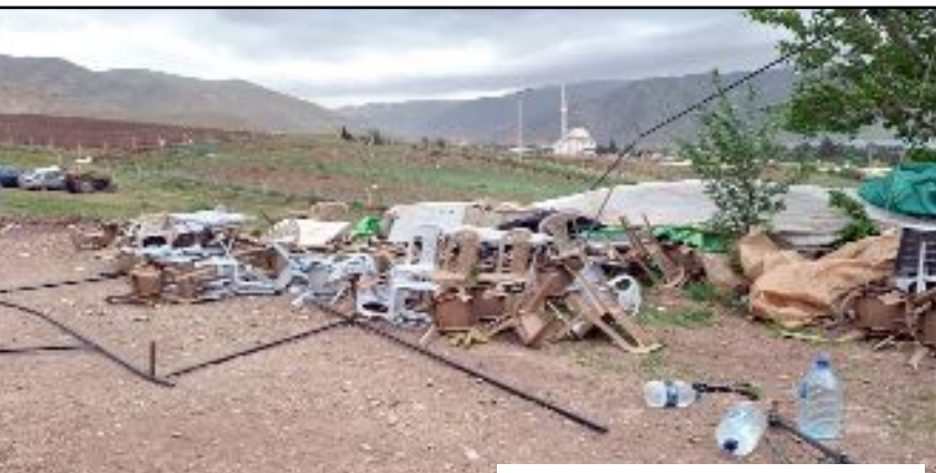
Düğün çadırı, masa ve sandalyeler fırtına nedeniyle uçtu.