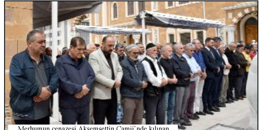
Merhumun cenazesi Akşemsettin Camii'nde kılınan cenaze namazının ardından Ulumezar'da toprağa verildi.