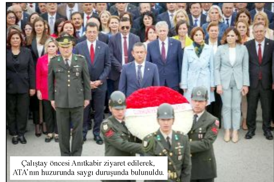
Çalıştay öncesi Anıtkabir ziyaret edilerek, ATA'nın huzurunda saygı duruşunda bulunuldu.