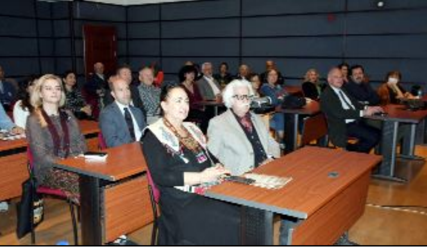
Prof. Omura'nın Japon kazıları ile ilgili sunumu merakla izlendi.