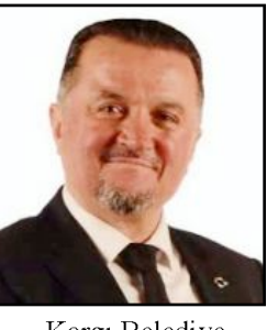
Kargı Belediye Başkanı Hamit Dereli