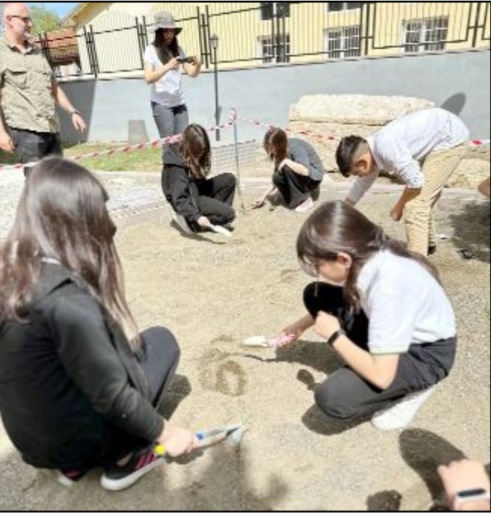
"Kazı Havuzu" etkinliği ve Müze Atölyesi'nde kil tabletler üzerine çalışma...