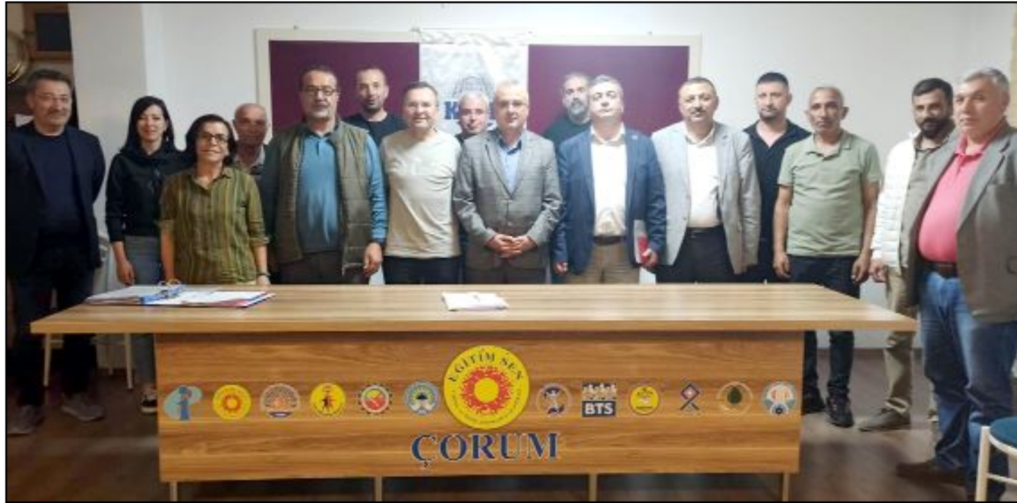
Türk-İş, DISK, KESK ve Birleşik Kamu-İş konfederasyonlarının bir araya gelerek oluşturduğu 1 Mayıs Tertip Komitesi, Eğitim-Sen'de bir değerlendirme toplantısı düzenledi.