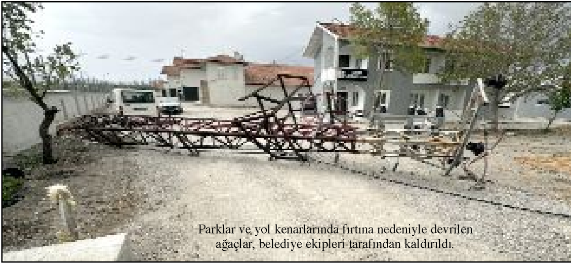
Parklar ve yol kenarlarında fırtına nedeniyle devrilen ağaçlar, belediye ekipleri tarafından kaldırıldı.