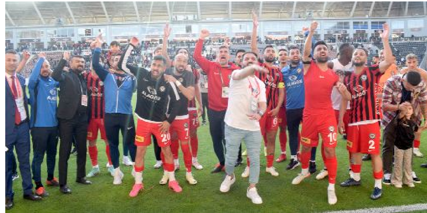
Adanaspor'u 2-0 yenerek üçüncü sıradaki yerini koruyan Ahlatcı Çorum FK, Play-Off'u büyük ölçüde garantiledi.

Düşme hattındaki Adanaspor'u her iki yarıda bulduğu gollerle 2-0 yenen Ahlatcı Çorum FK, Play-Off'u büyük ölçüde garantilerken, final bileti ise bir adım daha yaklaştı.