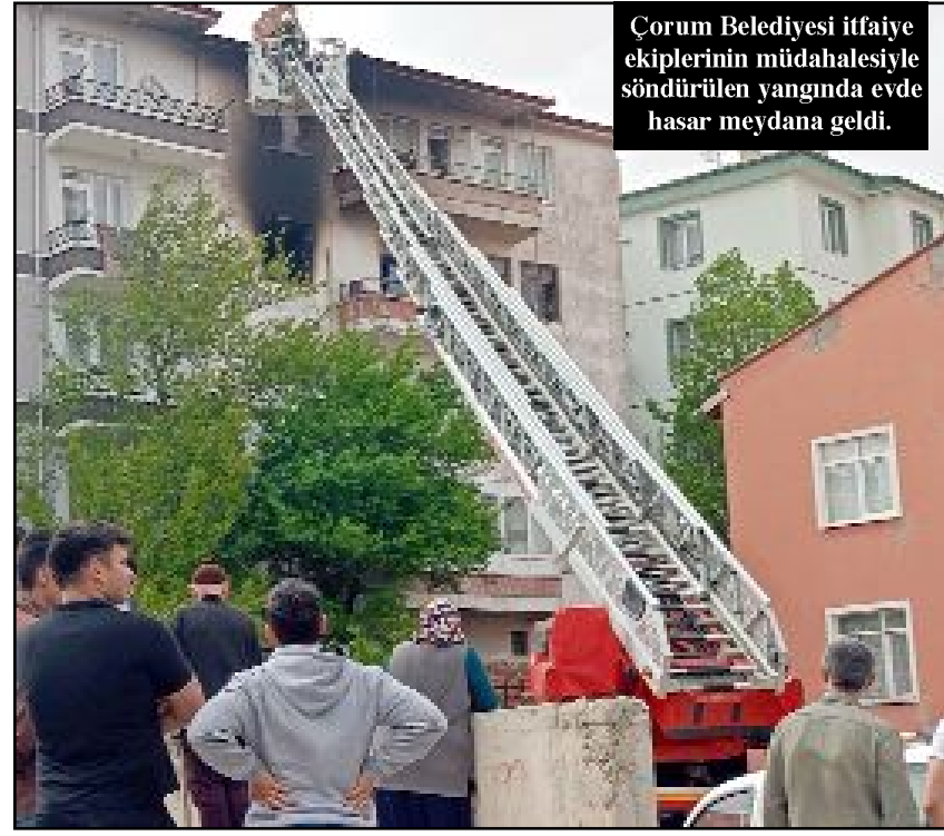
Çorum Belediyesi itfaiye ekiplerinin müdahalesiyle söndürülen yangında evde hasar meydana geldi.

Kentte meydana gelen 6 trafik kazasında 2'si çocuk 11 kişi yaralandı.