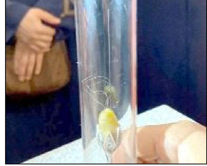
Sungurlu'da kadınlara yönelik düzenlenen program büyük ilgi gördü.

Daha sonra salavat ve tekbirler eşliğinde Sakal-1 Şerif'in ziyaret edildiği programa, Sungurlu kadınlar yoğun katılım sağlarken, kalabalık cami avlusunun dışına taşı. (Haber Merkezi)