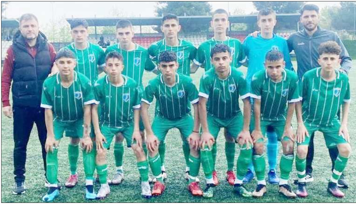
H.E.Kültürspor'u farklı mağlup eden Mimar Sinanspor Play-Off grubuna süper bir başlangıç yaptı.