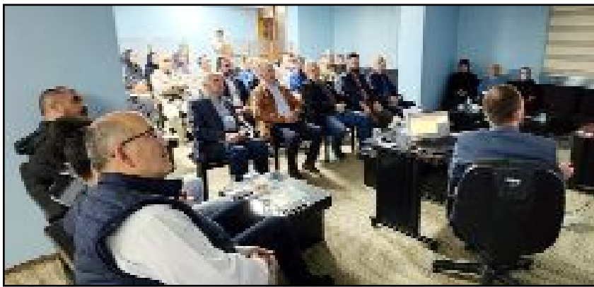
IMVAK Salonu'ndaki konferansa katılanlardan iki grup...