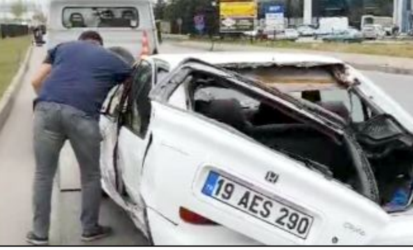
Kaza nedeni ile yolun tek şeridi bir süre araç trafiğine kapandı.