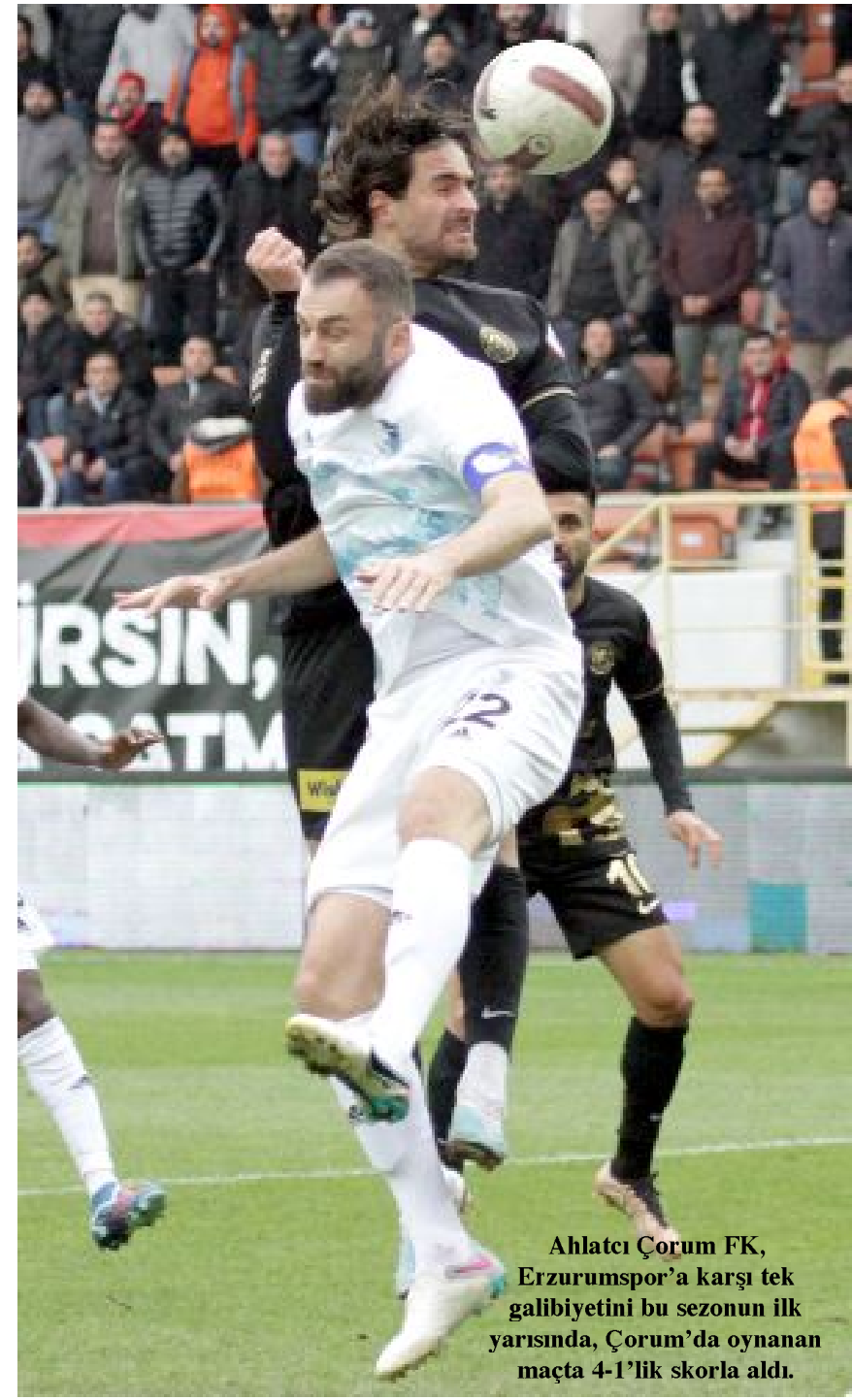
Ahlatcı Çorum FK, Erzurumspor'a karşı tek galibiyetini bu sezonun ilk yarısında, Çorum'da oynanan maçta 4-1'lik skorla aldı.

● Ahlatcı Çorum FK, Pazar günü deplasmanda karşılaşacağı Erzurumspor'la bugüne kadar resmi maçlarda 5 kez karşılaştı. 1 galibiyet, 1 beraberlik, 3 yenilgi alan kırmızı-siyahlılar, attıkları 5 gole karşılık 8 gol yediler. Erzurum'da oynanan 2 maçta Dadaşlar gol yemeden kazandı.