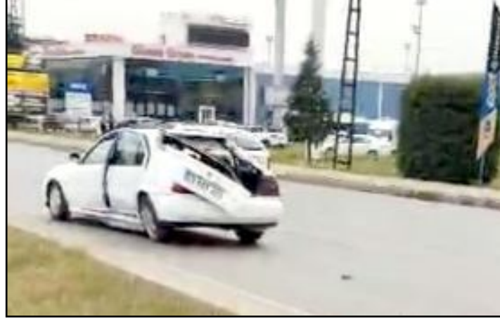
Çevreyolu Bulvarı Terminal Kavşağı'ndaki kazada yaralanan iki kişi hastaneye kaldırıldı.