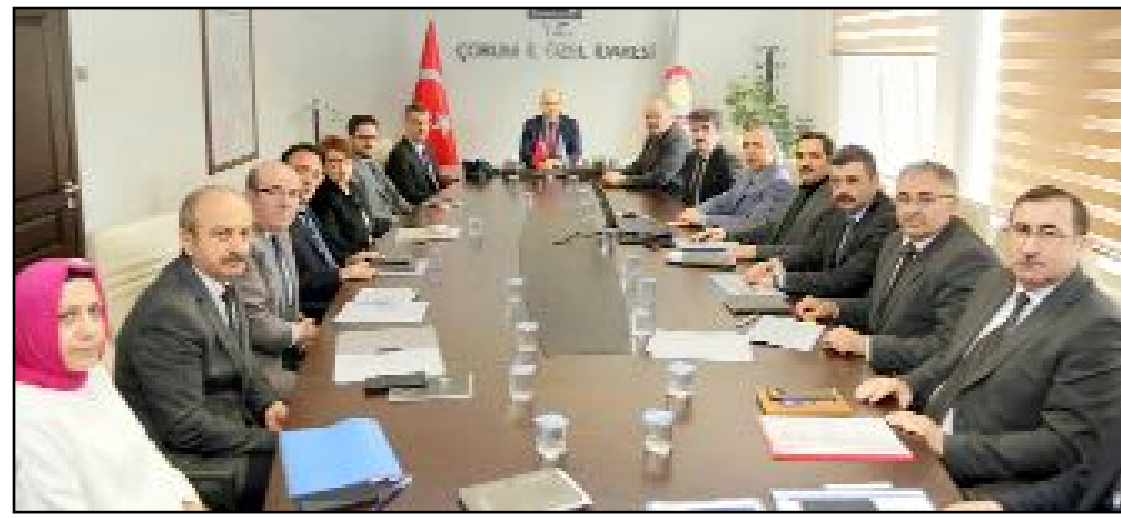
Valisi Zülkif Dağlı, İl Özel İdaresi Genel Sekreter Recep Cıplak ve şube müdürlerinden İl Özel İdaresi'nin 2024 yılı çalışmalarını ve faaliyetleri hakkında bilgi aldı.

yoğun çalışmalar yapılacağını belirten Vali Dağlı, köylerde yaşayan yurttaşlara kaliteli hizmet götürme noktasında İl Özel İdaresi'nin tüm personeli ile birlikte gayretli bir çalışma yürüttüğünü ve bu çalışmalara hız kesmeden devam edeceğini ifade etti. (Haber Merkezi)