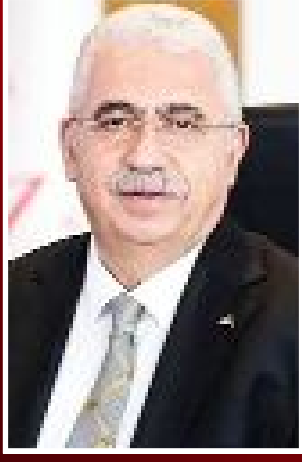
Ahlatcı Holding Yönetim Kurulu Başkanı Ahmet Ahlatcı

● Ahlatcı Holding iştiraklerinden A Doğalgaz ve Elektrik A.Ş., Enerji Piyasası Düzenleme Kurumu'nun açtığı ihalede KDV hariç 1 milyar 910 milyon lira teklif vererek, Yalova ilinin doğalgaz dağıtımını yapan Armagaz Arsan Marmara Doğalgaz Dağıtım A.Ş.'nin dağıtım şebekesini de aldı.