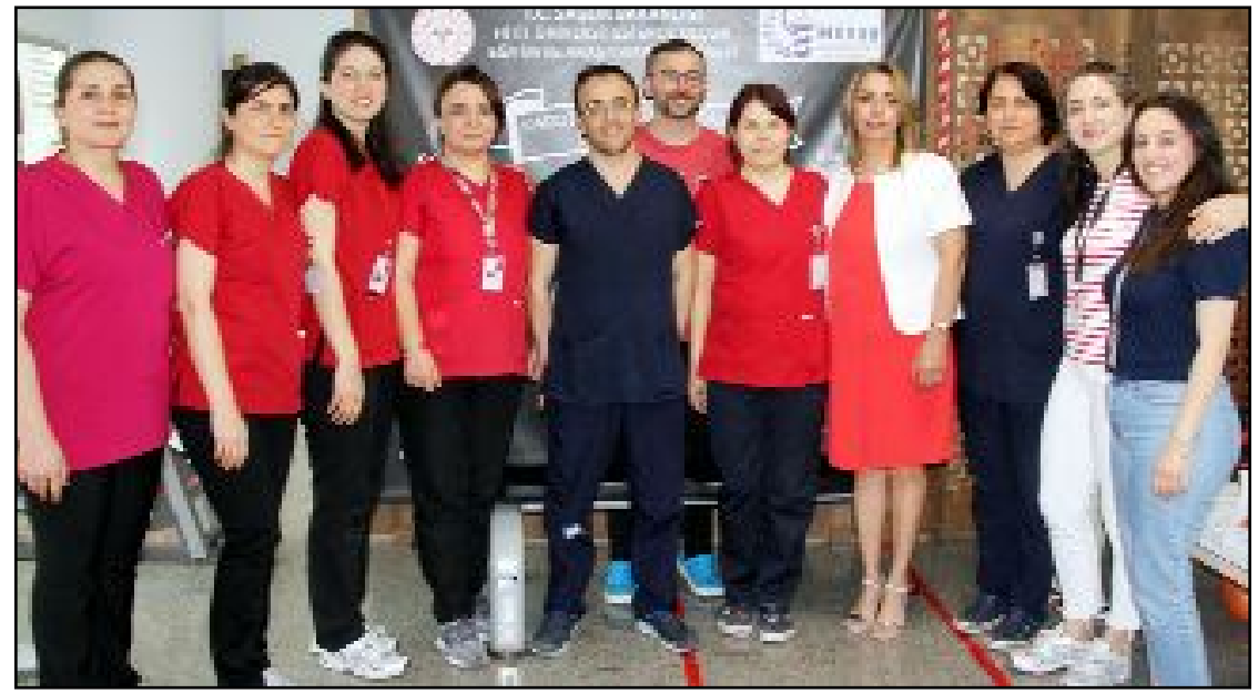
Hitit Üniversitesi Erol Olçok Eğitim ve Araştırma Hastanesi Kardiyak Rehabilitasyon Merkezi'nde Dünya Kalp Haftası nedeniyle bir dizi etkinlik gerçekleştirildi.

sektördeki payını artırma kararlılığının sürdürüldüğü ve dağıtım yapılan bölge sayısının 11'e çıkarıldığı vurgulanarak, "Yalova ve çevresindeki ihale gibi inorganik büyüme fırsatlarını da değerlendirmeye devam edeceğiz" ifadesi kullanıldı. (Haber Merkezi)