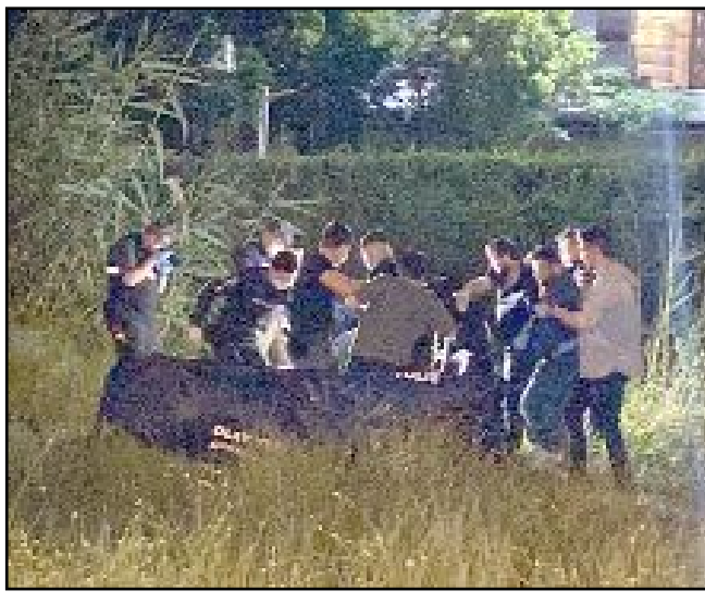
Antalya'da iki gündür kayıp olduğu belirtilen Çorumlu 25 yaşındaki gencin cesedine ulaşıldı.