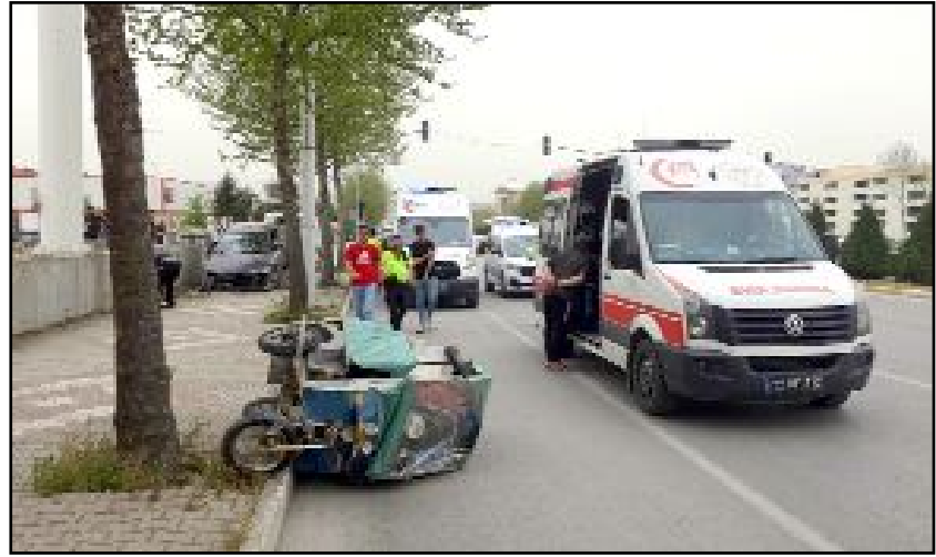
Kaza, İnönü Caddesi'nde meydana geldi.

Otomobil sürücüsü V.Ç.'nin alkollü olduğu öğrenildi. (İHA)