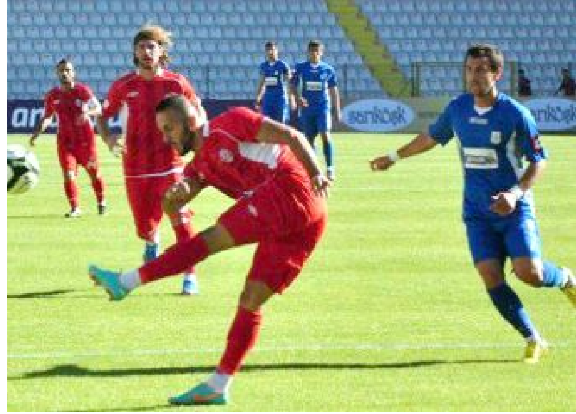
İki takım ilk kez 9 Eylül 2012'de Erzurum'da karşılaştı. Müsabakayı Erzurum temsilcisi 2-0 kazandı.

da, 2015-2016 Sezonunun devre arasında, Antalya'da oynanan hazırlık maçı ise 2-2 bitti. (Hüseyin AŞKIN)