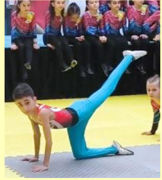
Nermin Hoca Spor Akademisi'nin minikleri ve çocukları, gösteri sırasında...