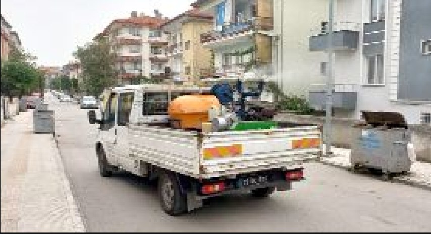
Çorum Belediyesi Temizlik İşleri Müdürlüğü ekipleri, hava sıcaklıklarının artması nedeniyle bu yıl vektörel mücadele çalışmalarına erken başladı.

Vatandaşlara da çağrıda bulunan Başkan Yardımcısı Tuncel, "Evsel katı atıklarınızı çöp poşetine koyarak ağız kapalı bir şekilde çöp konteynırına bırakınız ve konteynır kapaklarını kapalı tutunuz. Evlerinizde ve bahçelerinizde uzun süre çöp bulundurmayınız. Hayvan gübrelere açıkta bırakmayınız, yığın haline getirip üzerine toprak veya kireçle örtünüz" dedi. (Haber Merkezi)