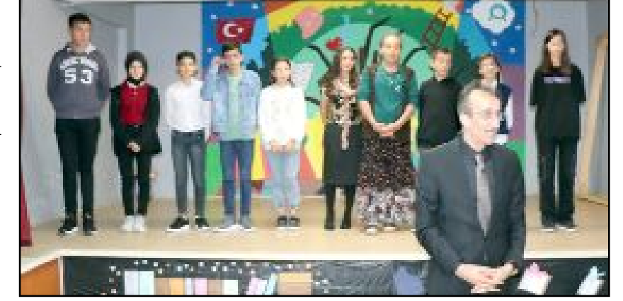
Çorum Eczacı Odası ile İl Milli Eğitim Müdürlüğü işbirliğinde Kınık Köyü'nde 23 Nisan etkinliği düzenlendi.

Odası tarafından çocuklara ağız ve diş sağlığı taraması da yapıldı. (Haber Merkezi)