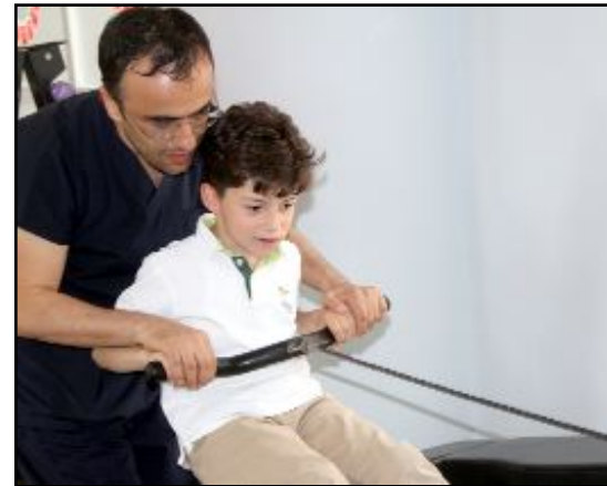
Etkinlikte, egzersiz faaliyetlerinin insan yaşamındaki önemine dikkat çekildi.

layarak 80'le yaşlara kadar egzersiz yaptığımız hastalarımız var" dedi.