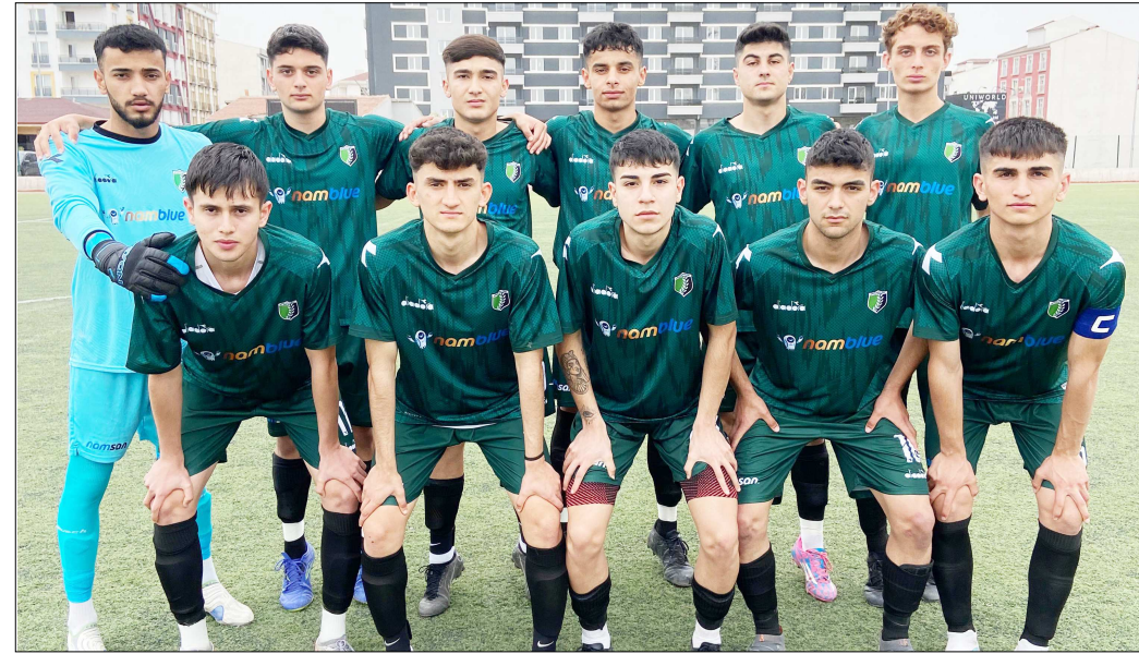
Mimar Sinanspor'un Amasyaspor karşısında maça başlayan ilk 11'...