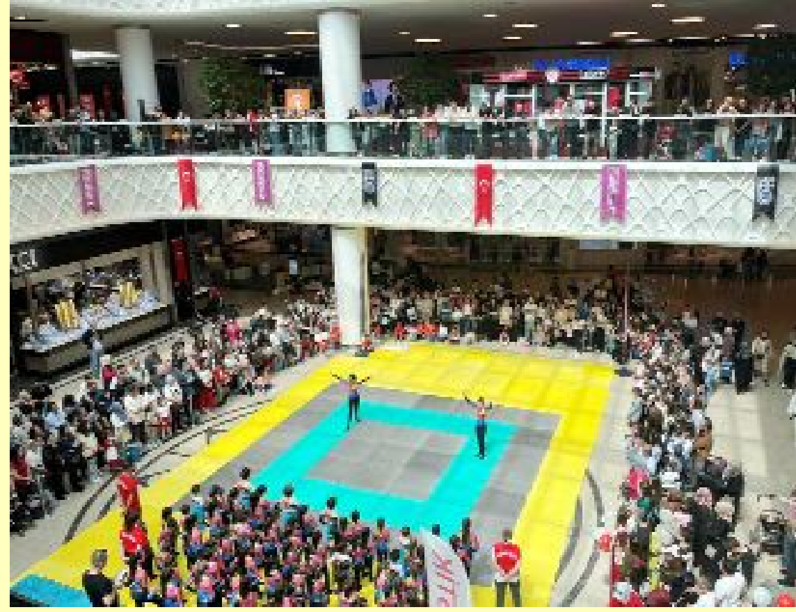
Nermin Hoca Spor Akademisi'nin gösterileri kalabalık bir izleyici kitlesi tarafından beğeniyle takip edildi.