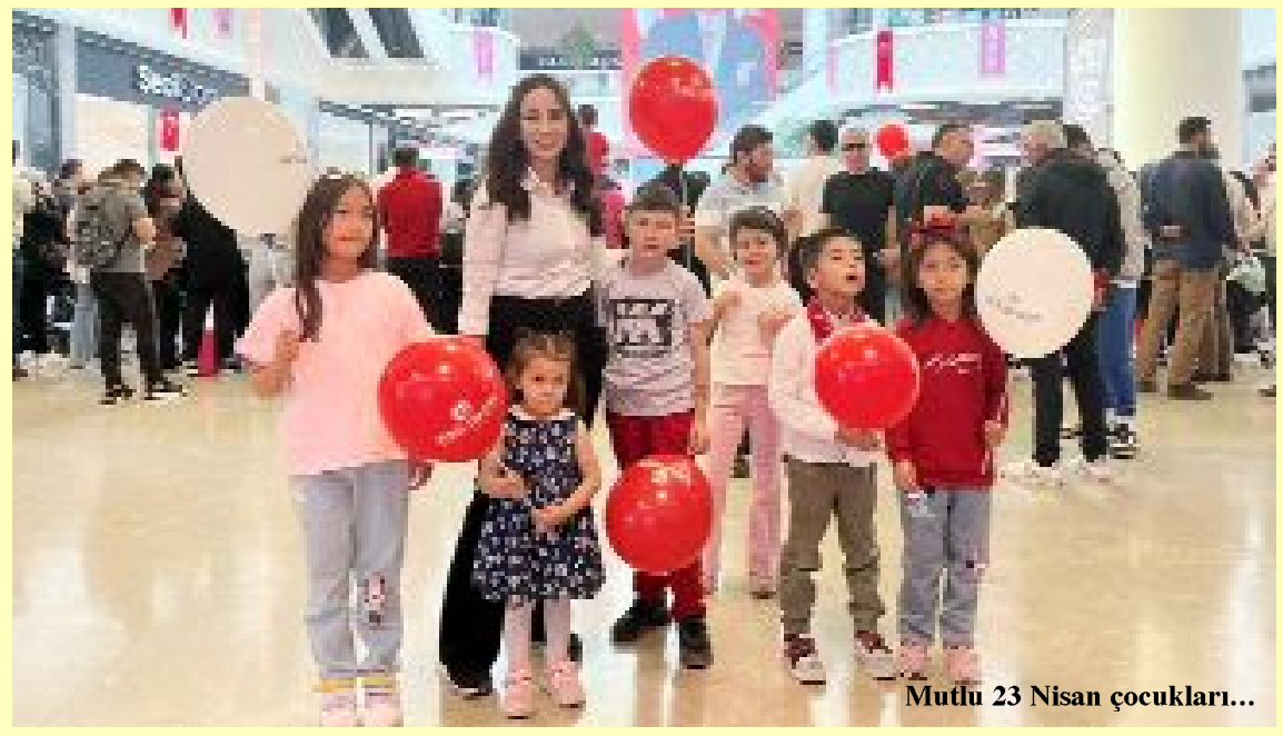
Mutlu 23 Nisan çocukları...