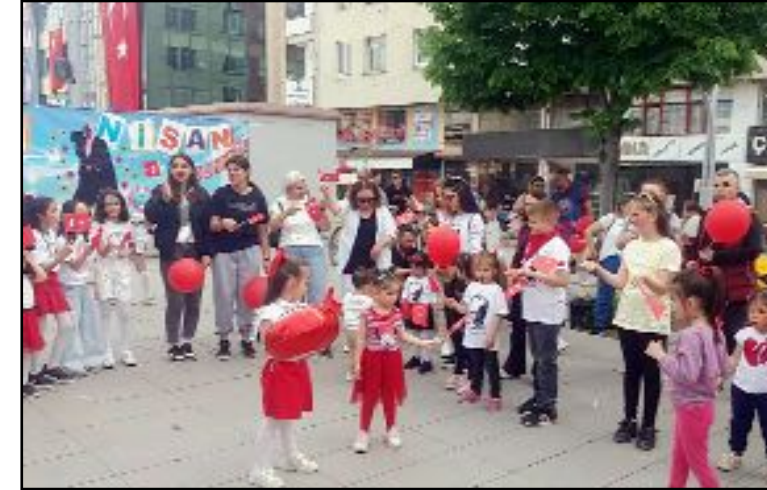
Eğitim-İş Sendikası tarafından her yıl Kadeş Barış Meydanı'nda düzenlenen Çocuk Şenliği yine renkli geçti.