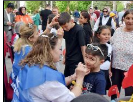
Palyaço ile oyunlar, yüz boyama gibi bazı etkinliklerin yer aldığı şenlikte çocuklara hediyeler dağıtıldı.

latan Bozkurt, tüm çocukların 23 Nisan bayramını kutlayarak, katılımcılara teşekkür etti. (Volkan SINAYUÇ)