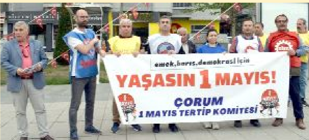
Çorum'da Türk-İş, DiSK, KESK ve Birleşik Kamu-İş'ten oluşan 1 Mayıs Tertip Komitesi, tüm işçi ve emekçileri 1 Mayıs alanına çağırdı.

● Çorum 1 Mayıs Tertip Komitesi, Eğitim Sen Şube binası önünde buluşarak 1 Mayıs için bildiri dağıtımını yaptı. •2'de