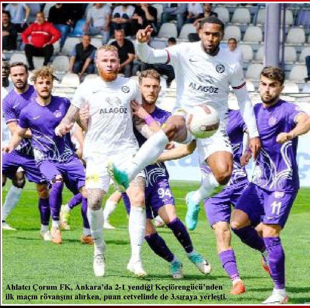
Ahlatcı Çorum FK, Ankara'da 2-1 yendiği Keçiörengücü'nden ilk maçın rövanşını alırken, puan cetvelinde de 3.sıraya yerleşti.

● Trendyol Türkiye 1.Futbol Ligi'nde play-off final bileti için mücadele eden Ahlatcı Çorum FK, 28.hafta maçında konuk olduğu Ankara Keçiörengücü'nü Hollandalı yıldız Thomas'ın 17 ve 42.dakikalarda attığı gollerle 2-1 yenerek üst üste üçüncü galibiyetini aldı ve Sakaryaspor'un da yenilmesi üzerine 3.sıraya yerleşti. •SPOR'da