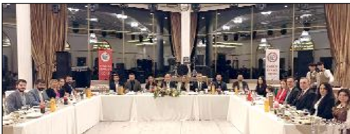
Çorum Eczacılar Odası'nın geleneksel iftar yemeği yoğun bir katılımı ile gerçekleşti.

ÇORUM YUMURTA ÜRETİM PAZARLAMA A.Ş. YÖNETİM KURULU