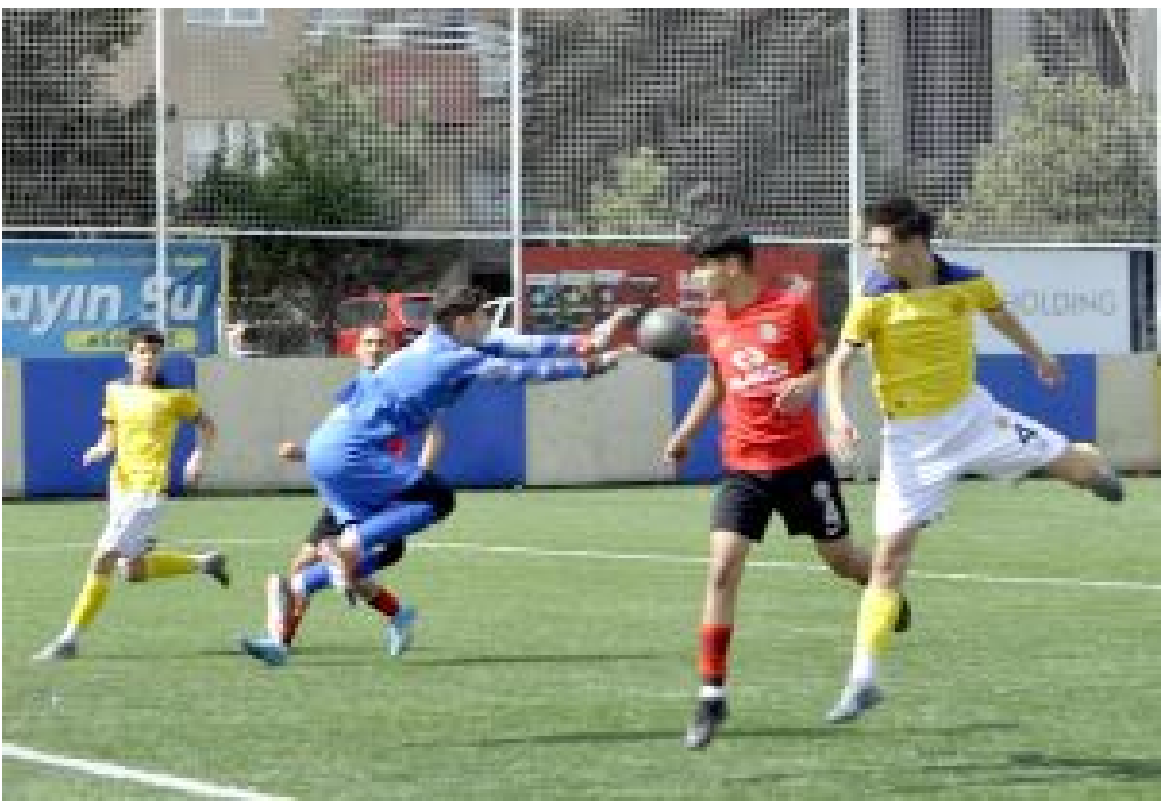
MKE Ankaragücü Tandoğan Tesislerinde oynanan maçtan bir enstantane.