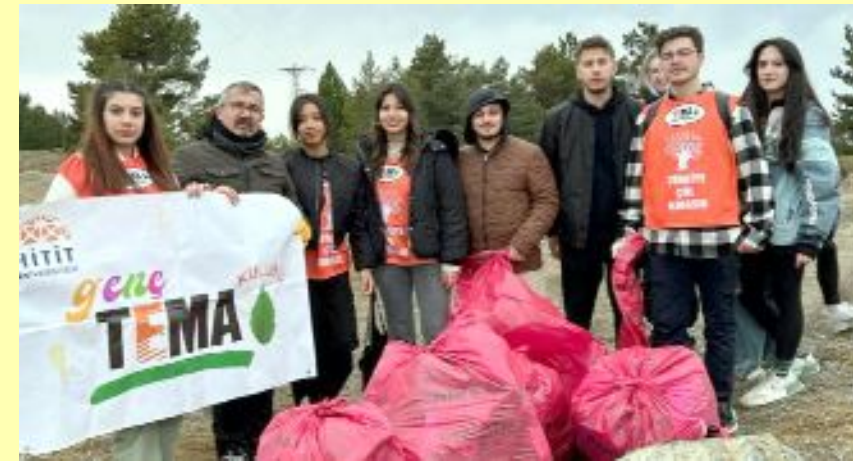
Hitit Üniversitesi Genç TEMA Kulübü üyesi gençler, Çatak Tabiat Parkı'nda etkinlik yaparak eğlenirken, sonrasında da temizliğini gerçekleştirdiler.

Hitit Üniversitesi bünyesinde faaliyetlerini sürdüren "Genç Tema Kulübü" Çatak Tabiat Parkı'nda etkinlik yaptı.