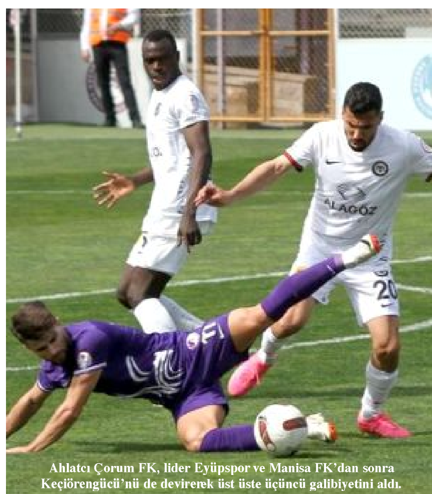
Ahlatcı Çorum FK, lider Eyüpspor ve Manisa FK'dan sonra Keçiöregücü'nü de devirerek üst üste üçüncü galibiyetini aldı.

Thomas, 11 golle Ahlatcı Çorum FK'nın en golcü oyuncusu unvanını da korudu. (Hüseyin AŞKIN)