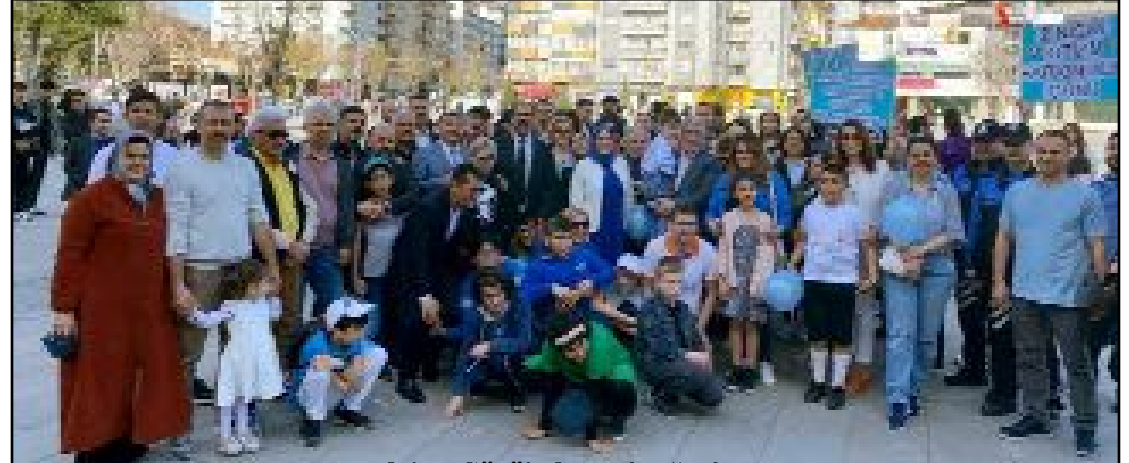
Otizm Günü'nde anı fotoğrafı...