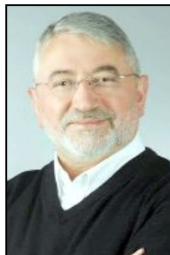
Halil İbrahim Aşgın

Başkan Aşgın, sosyal medya hesabından bu konuda yaptığı açıklamada şu ifadeleri kullandı: "Bu kutsal göreve bizleri yeniden layık gören kıymetli hemşehrilerim; Belediye Başkanlığı tebrikleriniz için çiçek yollamak yerine çoğu çocuk ve kadın yaklaşık 35 bin insanın katledildiği, aylardır ve bu mübarek günlerde bile zulüm altında olan Filistin için Türkiye Kızılay Derneği'ne bağışta bulunmanızı rica ediyorum, şimdiden tüm bağışçılarımıza şükranlarımı sunuyorum." (Sefer ATAY)