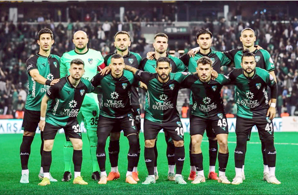
Kocaelispor topladığı 48 puanın yarısını deplasmanda oynadığı maçlarda aldı.

Ahlatcı Çorum FK, Kocaelispor'la Çorum'da 6 kez karşılaşmış. Bu maçlarda sadece 1 galibiyet alan kırmızı-siyahlı ekip, 5 kez de sahadan puansız ayrıldı. Kırmızı-siyahlı ekibin 8 golüne Kocaelispor 12 golle cevap verdi. (Hüseyin AŞKIN)