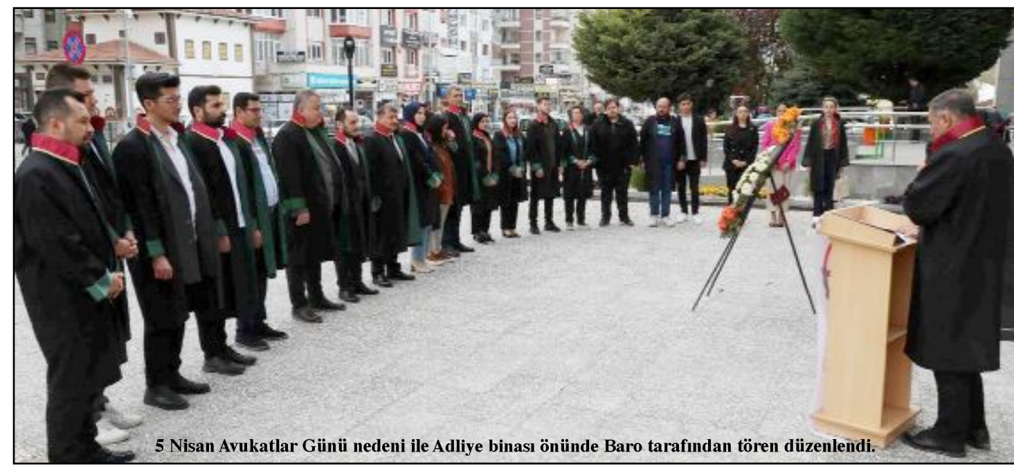
5 Nisan Avukatlar Günü nedeni ile Adliye binası önünde Baro tarafından tören düzenlendi.