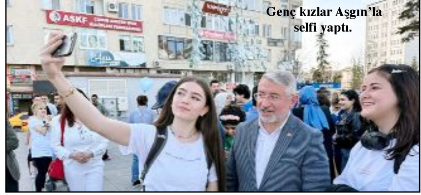
Genç kızlar Aşgın'la selfi yaptı.