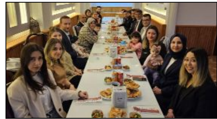
Çorum Barosu ilçe temsilcileri tarafından Alaca, Osmançık ve İskilip'te iftar yemeği düzenlendi.

Öte yandan 5 Nisan Avukatlar Günü dolayısıyla Çorum'un Osmançık, Alaca ve İskilip İlçeleri'nde düzenlenen ve ilçe temsilcileri ve ilçelerde görev yapan avukatların katıldığı iftar yemeklerine iştirak eden Baro Başkanı Turan Kalıpcı, meslektaşları ile sohbet ederek sorunlarını da dinledi. (Volkan SINAYUÇ)