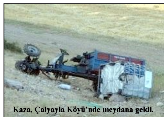
Kaza, Çalyayla Köyü'nde meydana geldi.

Yaralılar sağlık ekiplerince yapılan müdahalelerin ardından Hitit Üniversitesi Erol Olçok Eğitim ve Araştırma Hastanesi'ne kaldırıldı. (Haber Merkezi)