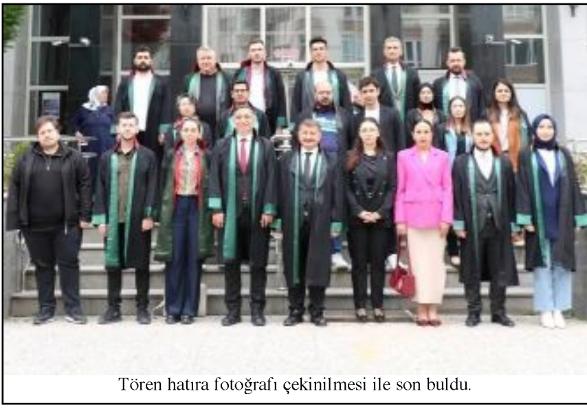
Tören hatıra fotoğrafı çekinilmesi ile son buldu.