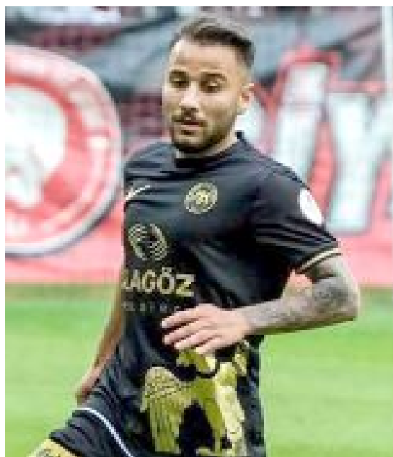
Savunma oyuncularından sadece Ologo ve Landre gol atarken, Kerem Kalafat 6 asistle en çok gol pası veren savunma oyuncusu oldu.

Çorum FK'nın da gündemine gelen ve geçtiğimiz günlerde de 1.Lig'in yeni takımlarından İğdır FK ile anlaşacağı yönünde haberler çıkan 27 yaşındaki Nijeryalı golcü yaptığı açıklamada, "Hakkımda çıkan transfer haberleri gerçeği yansıtmamaktadır. Kulübüm Pendikspor'la sözleşmem devam etmektedir. Kulübümün 25 Haziran'da başlayacak olan sezon başı kampına takımım ile çalışmalara başlayacağım. Kamuoyuna saygılarımla" ifadelerini kullandı. (Hüseyin AŞKIN)