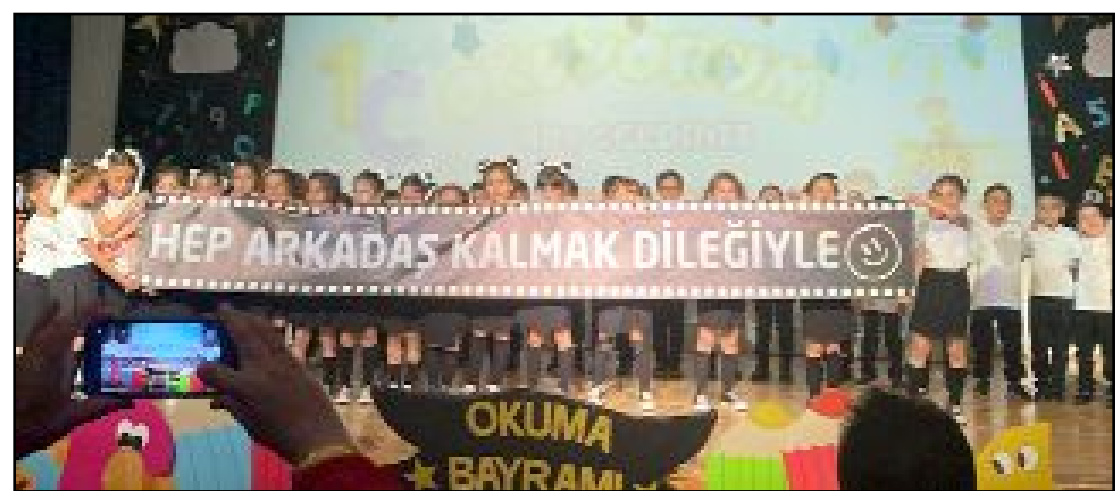
İlk Okuma Bayramı etkinlikleri kapsamında Çorum Bekir Aksoy İlkokulu'nda 1/C sınıfı öğrencileri okuma bayramını kutladılar.

Ziyaretten duyduğu memnuniyeti ifade eden Çetinkaya da, Bağcı'ya teşekkür ederek, belediye çalışmalarını hakkında bilgi verdi. (AA)