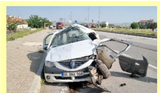
Alaca'nın Emniyet Kavşağı'ndaki kazada iki otomobile TIR çarptı.

Şans eseri yaralanmanın olmadığı yangında apartman dairesinin bir bölümü tamamen yandı. Osmancık'ta apartman dairesi alevlere teslim