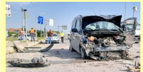
TIR'ın adeta biçtiği otomobillerdeki 5 kişi yaralandı.