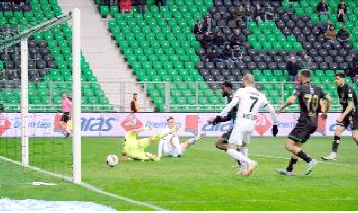
Çorum FK, biten sezonda lig, play-off ve Türkiye Kupası'nda olmak üzere 38 resmi maçta 59 gol attı.