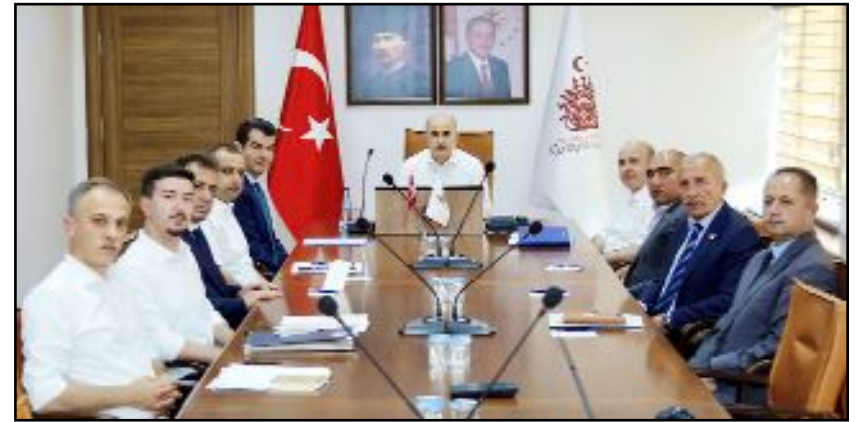
Vali Dağlı, Osmaniye ve Sungurlu OSB heyetleri ile değerlendirme toplantısı gerçekleştirdi.