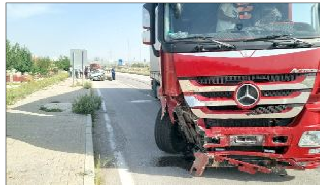
Kaza, Alaca'nın Emniyet Kavşağı'nda meydana geldi.