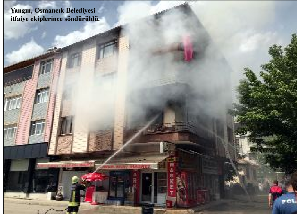
Yangın, Osmancık Belediyesi itfaiye ekiplerince söndürüldü.

Üst kattaki apartman dairelerinde zarar gördüğü yangın sonrasında olay yeri inceleme ekipleri yangının çıkış nedenini araştırıyor. (İHA)