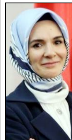
Mahinur Özdemir Göktaş

Aile ve Sosyal Hizmetler Bakanı Mahinur Özdemir Göktaş, Evde Bakım Yardımı ödemelerini Kurban Bayramı dolayısıyla öne çektiklerini bugün toplam 4,2 milyar lira ödeme yapacaklarını bildirdi.