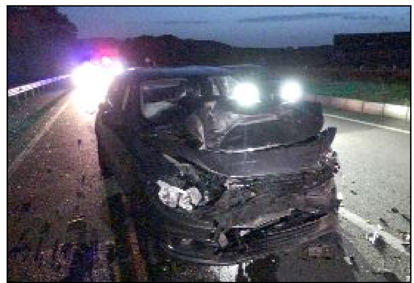
Kaza, Çorum-Yozgat yolu Alaca Kavşağı'nda meydana geldi.

Bağ, bahçe, arsa, tarla sahibi vatandaşlarımızın da sesleniyor, Çiftçi Malları Koruma Birliği'ne dilekçe vererek, Çiftçi Malları Koruma Kanunu'nun 34. maddesine göre koruma hizmeti talep etmiyoruz diye dilekçe vererek aidat ödemekten kurtulabilirler." (Haber Merkezi)