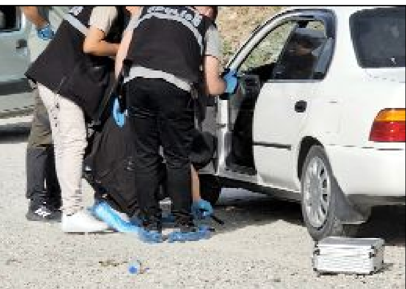
Yapılan kontrolde gencin hayatını kaybettiği belirlendi.

Çorum'da bir genç silahla yaşamına son verdi.