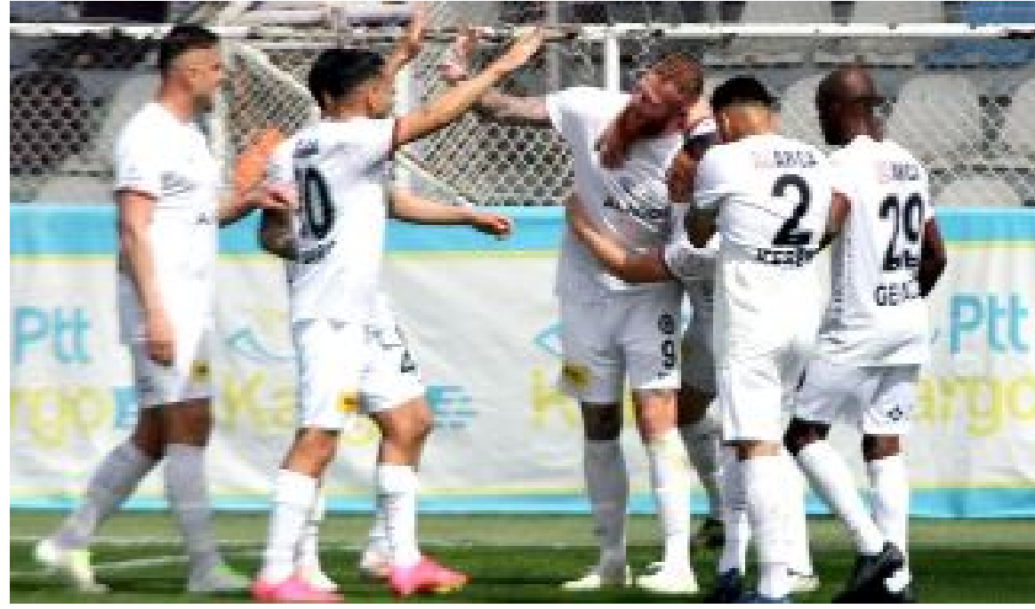
Çorum FK'lı futbolcular ligde 55 kez gol sevinci yaşadılar.