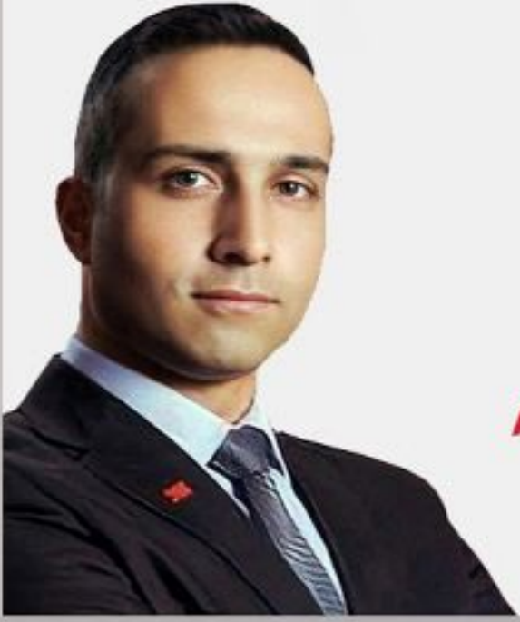
Av. Dincer SOLMAZ İl Başkanı