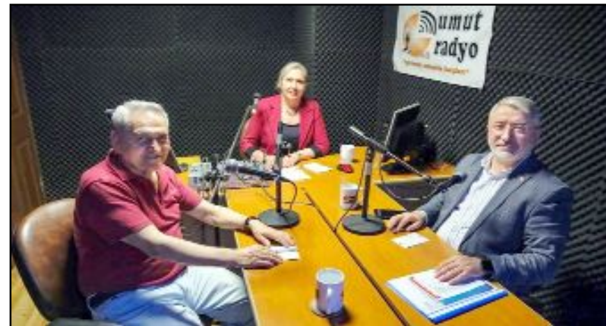
“Çorum Güncesi Özel”...

olabileceğini vurgulayan Belediye Başkanı Aşgın, kendilerinin de Tasarruf Tedbirleri'ne tabi olduklarını, ancak projelerinin yürütmesi bakımından bu nedenle bir aksama düşünmediklerini, Çimento Fabrikası'nın yerindeki en büyük yatırım olan Kongre ve Kültür Merkezi'nin projeleri hazırlanınca kadar ekonominin de düze çıkmış olacağına inandığını söyledi. (Haber Merkezi)