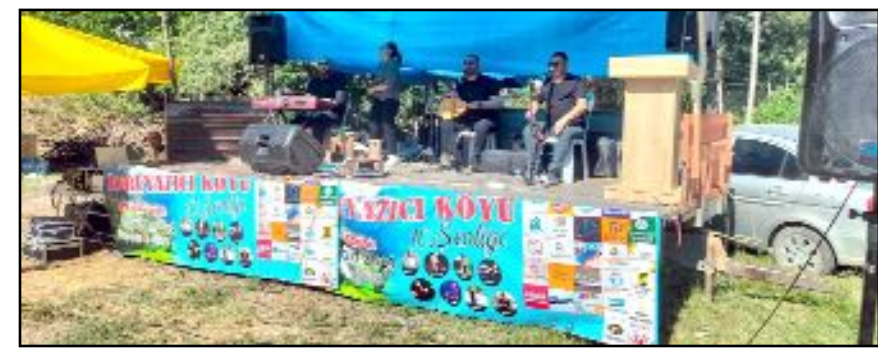
Yerel sanatçıların damga vurduğu şenlikte gençler bol bol halay çekti.