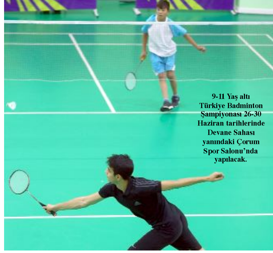
9-11 Yaş altı Türkiye Badminton Şampiyonası 26-30 Haziran tarihlerinde Devane Sahası yanındaki Çorum Spor Salonu'nda yapılacak.