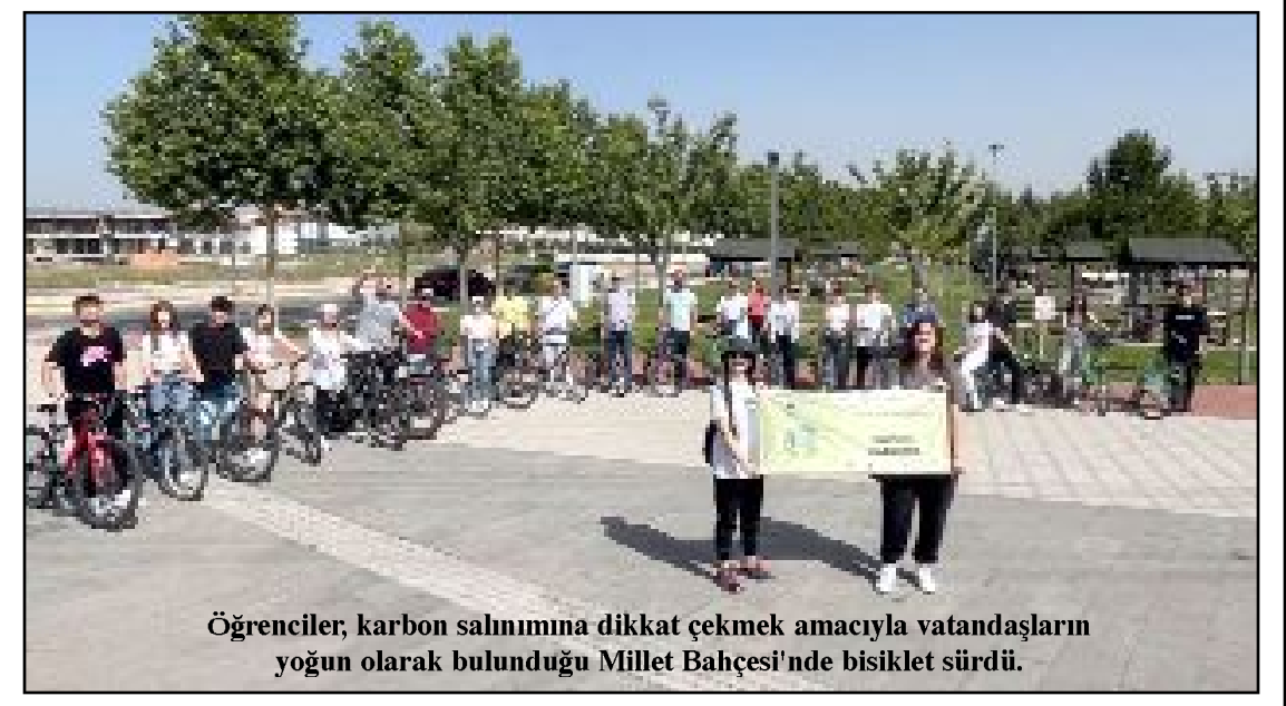
Öğrenciler, karbon salınımına dikkat çekmek amacıyla vatandaşların yoğun olarak bulunduğu Millet Bahçesi'nde bisiklet sürdü.

Öğrencilerin temiz bir çevre elde etmek için uluslararası iş birlikleri yapmalarını hedefleyen proje kapsamında Çorum'daki öğrenciler, karbon salınımına dikkat çekmek amacıyla vatandaşların yoğun olarak bulunduğu Millet Bahçesi'nde bisiklet sürdü.