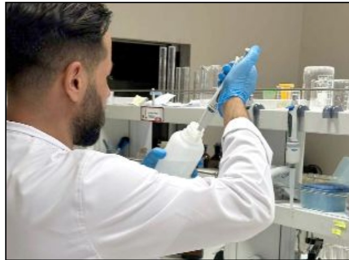
Çorum Belediyesi'nden yapılan açıklamada, baraj suyunda ekipler tarafından yapılan rutin tetkikler neticesinde herhangi bir kirliliğe rastlanmadığı belirtildi.