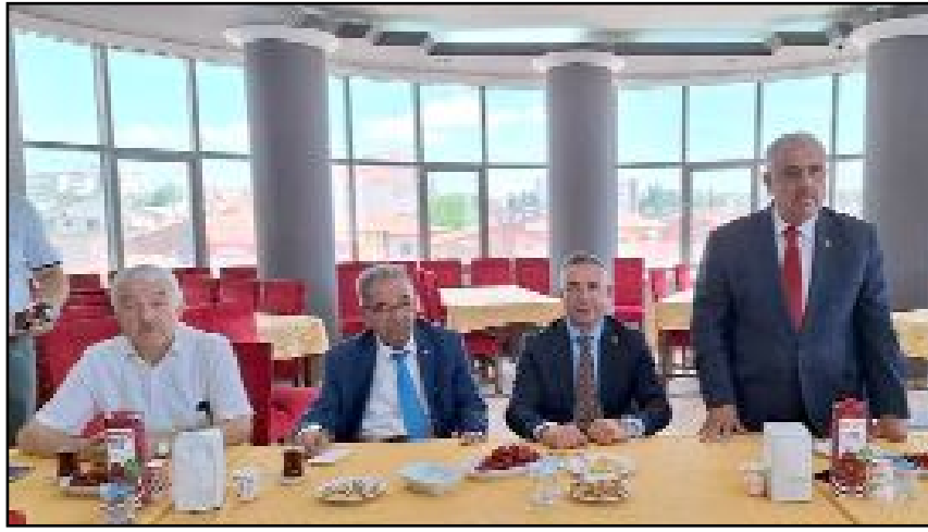
Programa Milletvekili Tahtasız, Esnaf Kefalet Başkanı Canbek ile çok sayıda esnaf temsilcisi katıldı.