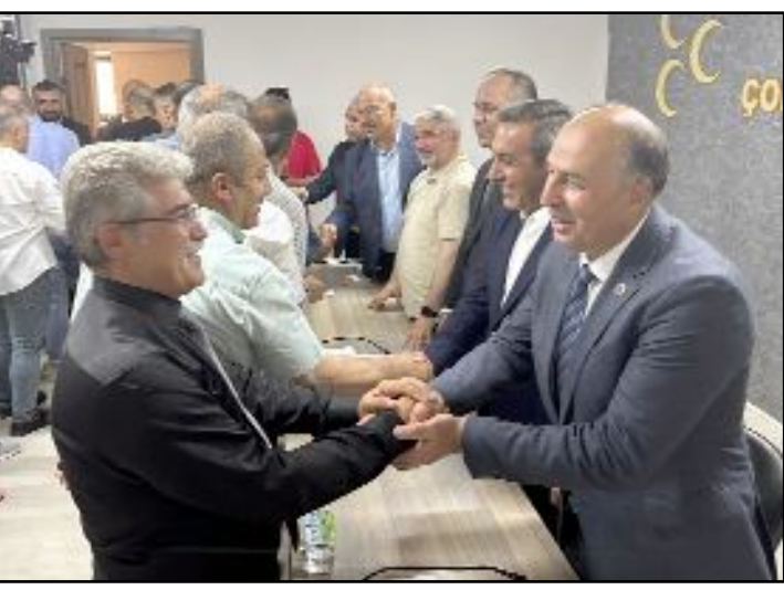
MHP İl Başkanlığı'nda düzenlenen bayramlaşma törenine partililer büyük ilgi gösterdi.