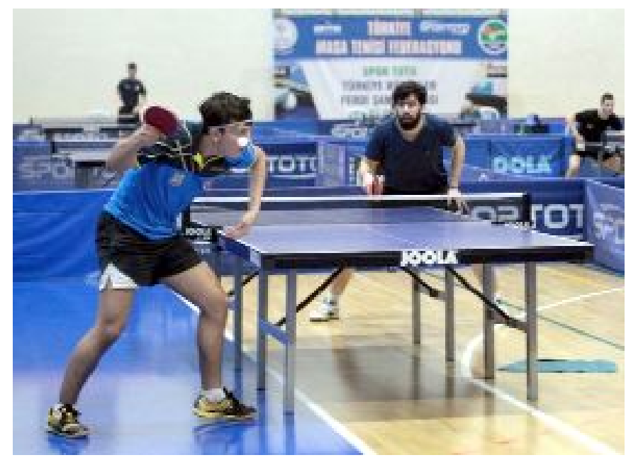
Büyükler Ferdi Türkiye Masa Tenisi Şampiyonası 24-26 Haziran tarihlerinde Hitit Üniversitesi Spor Salonu'nda yapılacak.