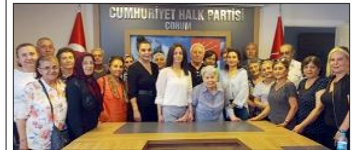
CHP Kadın Kolları seçimi 25 Haziran'da yapılacak.