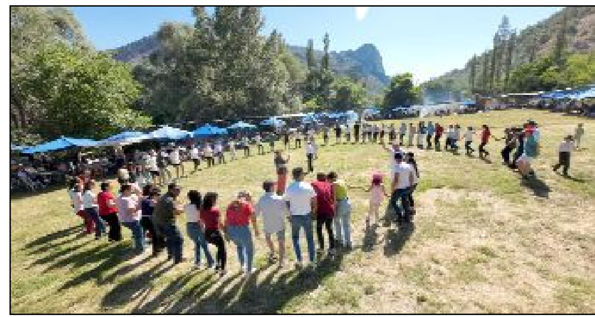
Müzik eşliğinde şenliğe katılanlar halaylar çekerek, eğlenceli vakit geçirdiler.