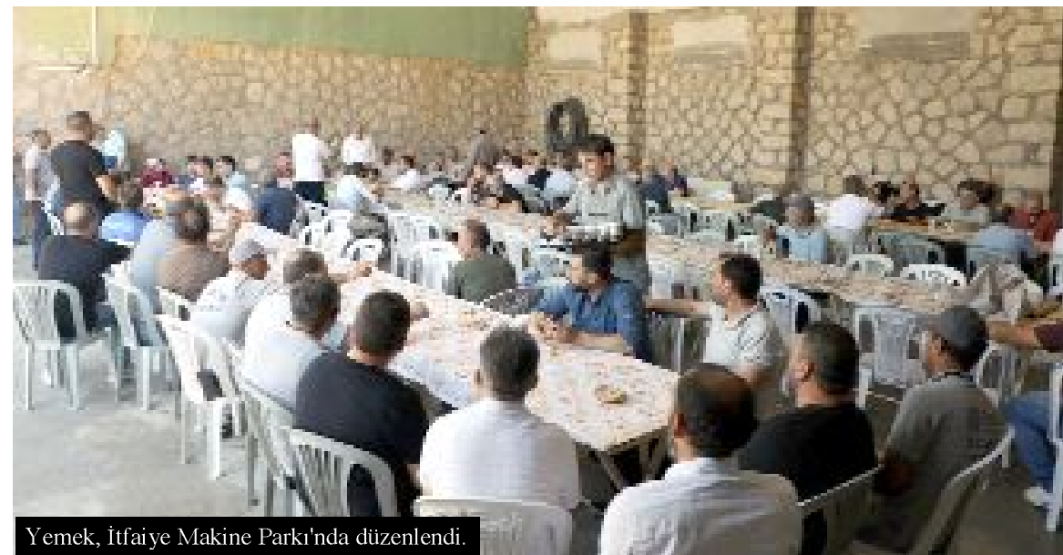
Yemek, İtfaiye Makine Parkı'nda düzenlendi.