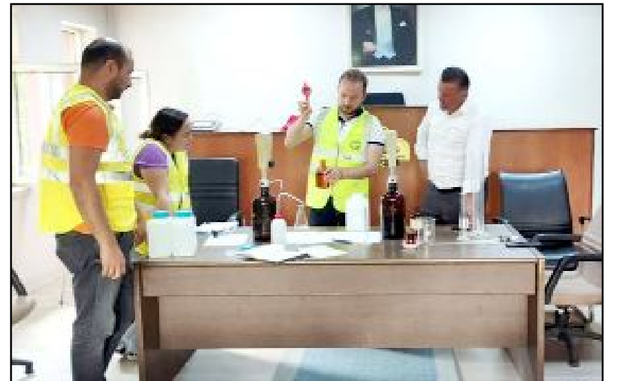
Arıtma Tesisi için Ankara Büyükşehir Belediyesi Su ve Kanalizasyon İdaresi Genel Müdürlüğü (ASKİ) uzman ekipleri ilçede analizleri yaptı.

ceğiz. Uzun zamandır üzerinde çalıştığımız projemiz kapsamında önce uzman ekiplerimizce şebeke suyumuzun analizi yapılacak. Gerekli testler ve analizler yapıldıktan sonra sondaj ve zemin etüdüyle birlikte projemiz hızlandıracağız. Kargımız için "altın proje" dediğimiz değerli projemiz, hayata geçtiğinde hemşehrilerimiz artık çeşmelerden içme suyu taşımak zorunda kalmayacak. İnşallah evlerimizde çeşmelerden akan su, pet şişelerde satılan su kalitesinde olacak. Kargımızın kronikleşen sorunlarından birine daha son vermiş olacağız. Her zaman dediğimiz gibi hemşehrilerimize ne söz verdiğimiz zamanı geldiğinde hepsini sırasıyla gerçekleştireceğiz, bizlere güvenlerini boşa çıkartmayacağız." şeklinde açıklama yaptı. (Haber Merkezi)