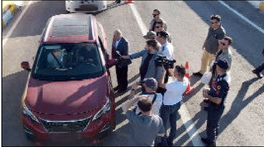
Vali Dağlı ve protokol üyeleri bayram trafiğinin yoğun olduğu yollarda inceleme yaptı.

Bakan Ali Yerlikaya, ayrıca polis ve jandarma ekiplerinin karadan ve havadan yaptığı trafik denetleme faaliyetlerine ilişkin görüntüleri de paylaştı.