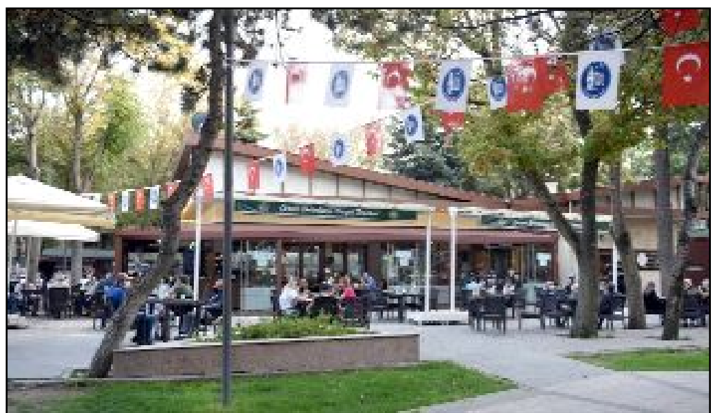
Çorum Belediyesi'ne ait sosyal tesislerde yaz döneminde yarı zamanlı çalışmak üzere 50 üniversite öğrencisi alınacak.

Başvurular; 24-25-26 Haziran 2024 tarihlerinde https://co-kis.com.tr/ web sitesinden online olarak yapılacak. Başvuruda bulunanların, açık öğretim fakülteleri hariç örgün üniversite öğrencisi olması gerekiyor. (Haber Merkezi)