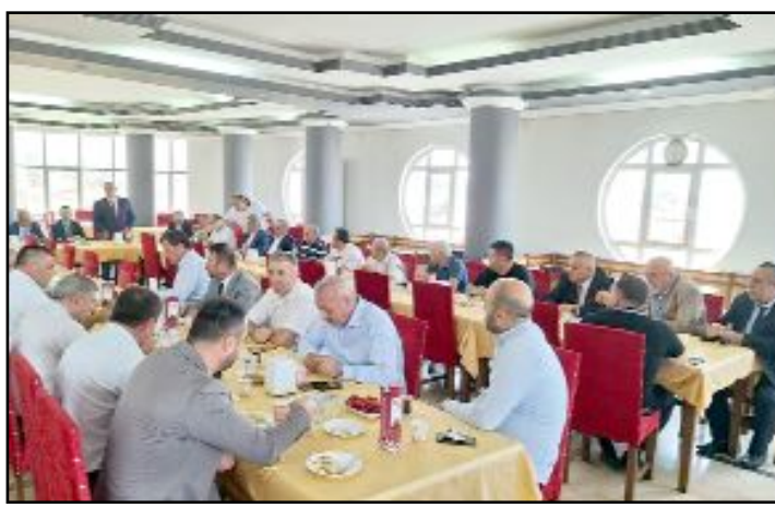
Çorum Esnaf ve Sanatkarlar Odaları Birliği'nin geleneksel bayramlaşmasına katılım yoğun oldu.

-Solunum problemlerinin tedavisi için trakeotomi veya solunum cihazına bağlama