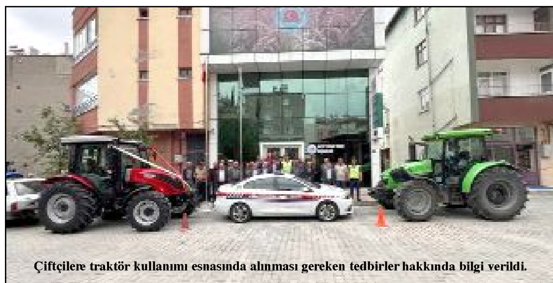
Çiftçilere traktör kullanımı esnasında alınması gereken tedbirler hakkında bilgi verildi.