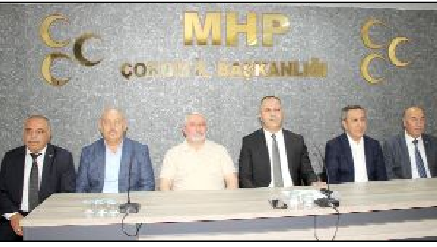
Programda Belediye Başkanı Aşgın ile birlikte Belediye Başkan Yardımcıları, Belediye Meclisi ve İl Genel Meclisi üyeleri de iştirak etti.