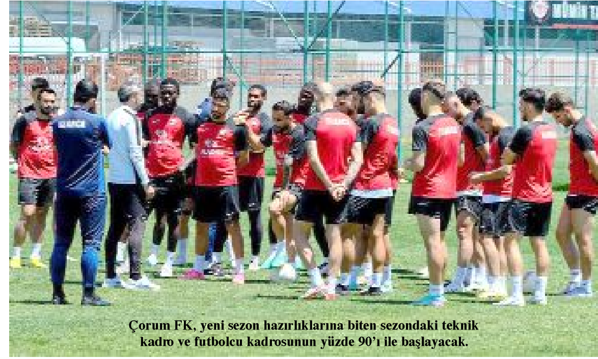
Çorum FK, yeni sezon hazırlıklarına biten sezondaki teknik kadro ve futbolcu kadrosunun yüzde 90'ı ile başlayacak.

iyor. Çorum FK'nın geçen sezonki kadrosundan şu ana kadar kiralık olan Ologo, Eren ve Ahmet Sağat'ın yanı sıra sözleşmesi biten oyuncularından Ahmet İlhan Özek ayrıldı. (Hüseyin AŞKIN)