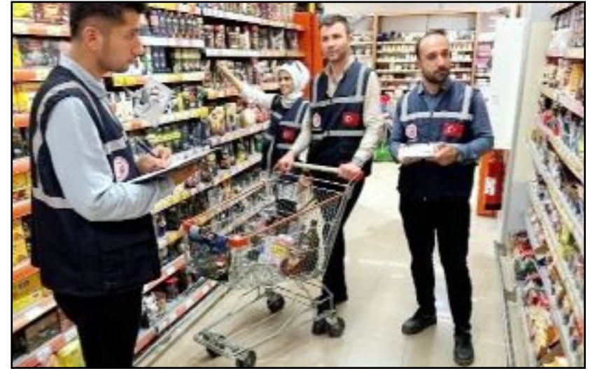
Ticaret Müdürlüğü ekipleri merkez ve ilçelerde 76 firmanın 752 ürününü denetledi.

Çorum merkez ile birlikte Alaca, Kargı, Laçın, Osmançık ve Sungurlu'da yapılan denetimlerde 2 firmanın fahiş fiyat uyguladığının tespit edildiği ve firmalar hakkında tutanak tutularak bakanlığa bildirildiği de açıklandı. (Haber Merkezi)