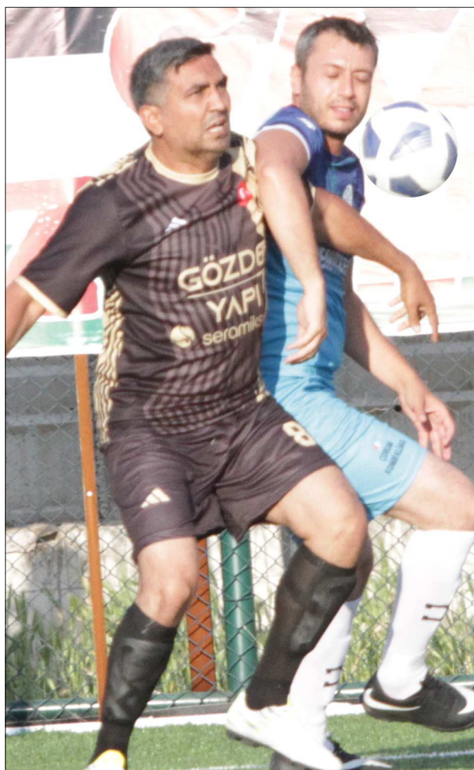
Beyaz Grup'ta oynanan maçtan bir enstantane...