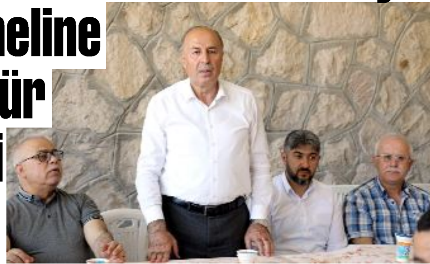
Alaca Belediye Başkanı Şerif Arslan, özverili çalışmalarını nedeniyle personeline teşekkür etti.

Öğle yemeğinin ardından belediye personeline özverili çalışmalarından dolayı teşekkür eden Başkan Arslan, "Özverili çalışmalarınızdan dolayı hepinize ayrı ayrı teşekkür ederim. Hiç bir zaman başımı yere eğdirmediniz. Biz hep birlikte bir aileyiz, ben hepinizden memnun ve razıyım. Allah hepinizden razı olsun" dedi. (İHA)