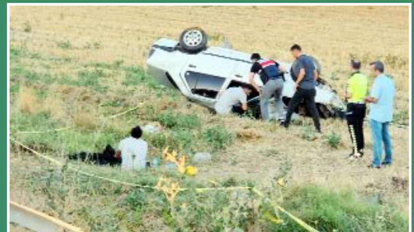
Çorum-Ankara Karayolu üzerinde takla atarak şarampole devrilen otomobilin imam olan sürücüsü, hayatını kaybeden eşinin başından uzun süre ayrılmadı.