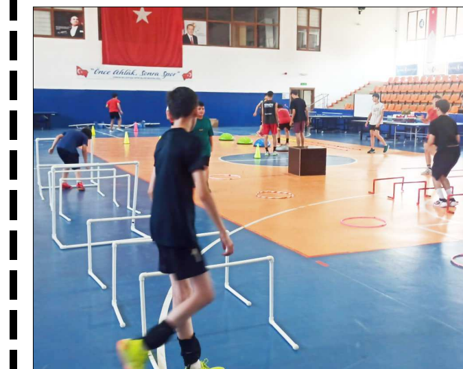
Antrenmanlar Ş.Abdullah Tayyip Olçok Spor Salonu'nda yapılıyor.

Çorum Belediyesi Spor Kulübü, voleybol branşında yeni sezon çalışmalarına start verdi.