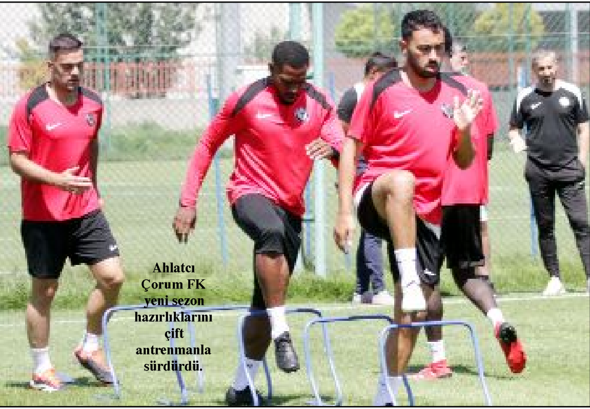
Ahlatcı Çorum FK yeni sezon hazırlıklarını çift antrenmanla sürdürdü.