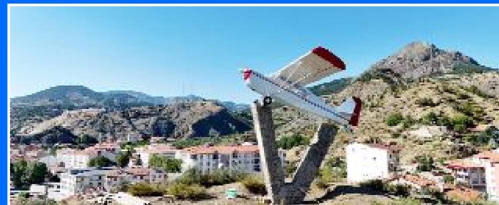
Milli Mücadele döneminde İskilip'te halktan toplanan paralarla satın alınarak THK'ya bağışlanan temsili uçak, restore edildikten sonra tekrar yerine yerleştirildi.