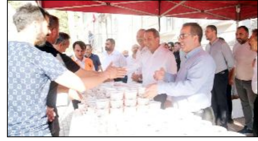
Başkan Dere ve beraberindeki heyet vatandaşa aşure ikram etti.

Yetkililere seslenen vatandaşlar, sokak aydınlatma mağduriyetlerinin bir an önce giderilmesini istediler. (Haber Merkezi)