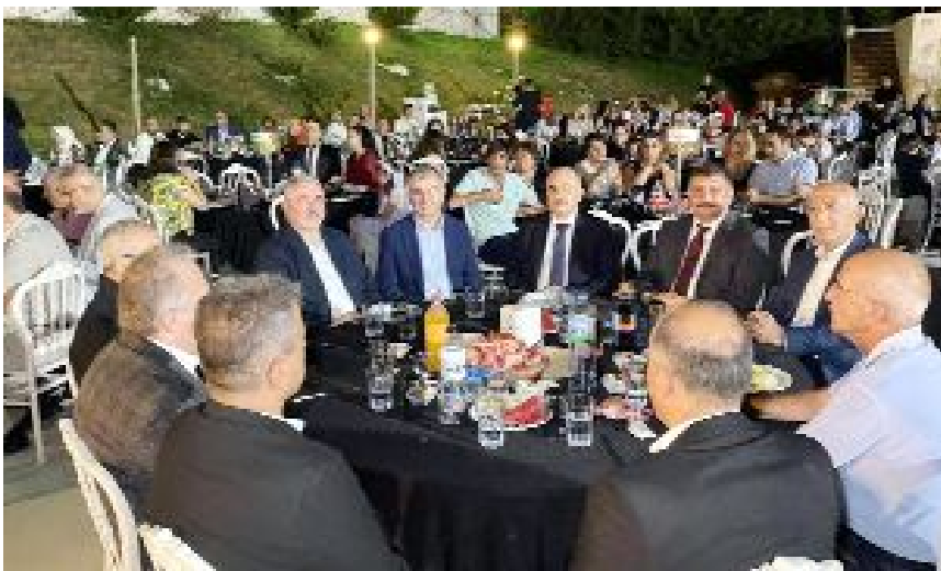
Amasya'da düzenlenen düğüne Çorum'dan çok sayıda davetli katıldı.