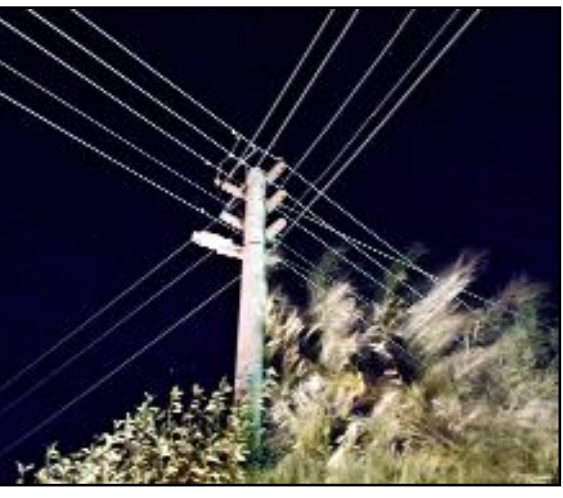
Çoraklık 43. Sokak'ta ikamet eden vatandaşlar, sokak aydınlatmalarının yapılmasını istiyor.