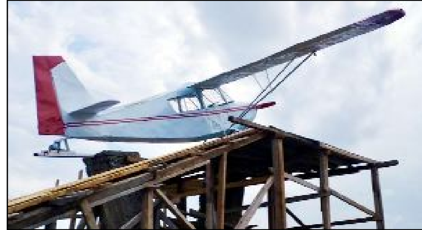
Yaklaşık 4 yıldır bakımda olan temsili uçak yeniden eski yerine yerleştirildi.

Doğurganlıktaki hızlı düşüşün projeksiyonda etkili olduğu vurgulanırken bu süreçte ilimizin nüfusunun da gerilemenin devam edeceği öngörüldü. Buna göre 2023 yılında 528 bin 351 kişilik Çorum nüfusunun 2024 yılında 521 bin 930, 2025 yılında 517 bin 360, 2026 yılında 512 bin 844, 2027 yılında 508 bin 196, 2028 yılında 503 bin 552, 2029 yılında 498 bin 897 ve 2030 yılında ise 494 bin 205 olacağı ifade edildi. (Haber Merkezi)