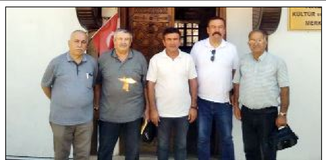
Osmancık Kent Konseyi genel kurul süreci tamamlandı.

Kampanyaya hayırsever kişi ve kuruluşların desteği bekleniyor. (Haber Merkezi)