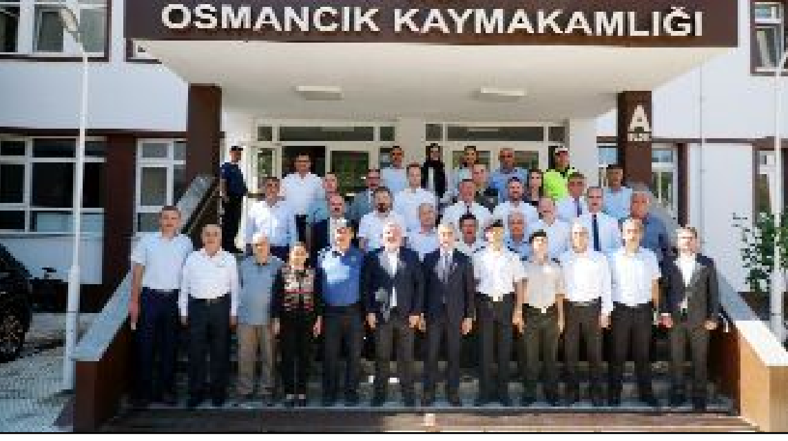
Osmancık'a kaymakam olarak atanan Furkan Duman ilçeye gelerek görevine başladı.