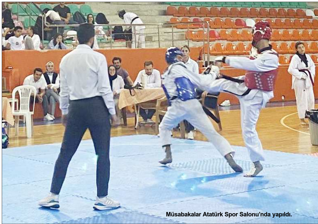
Müsabakalar Atatürk Spor Salonu'nda yapıldı.