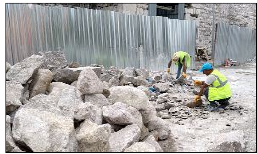
Başkan Aşgın, Bin 100 yıllık kaleyi ayağa kaldırarak turizme kazandırdıklarını söyledi.