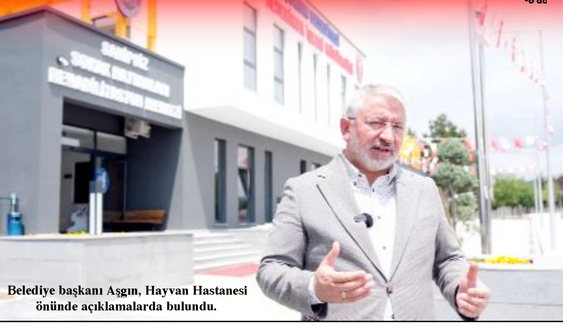
Belediye başkanı Aşgın, Hayvan Hastanesi önünde açıklamalarda bulundu.