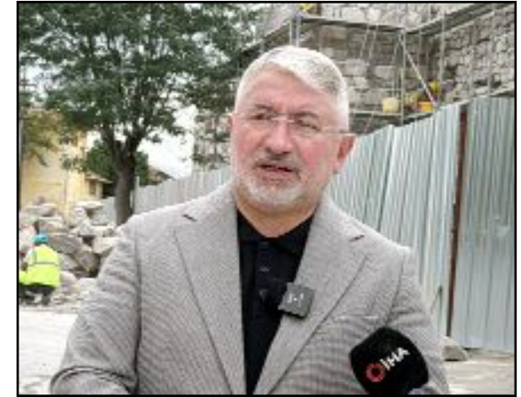
Belediye Başkanı Aşgın, Kale'de sürdürülen çalışmaları inceleyerek açıklama yaptı.