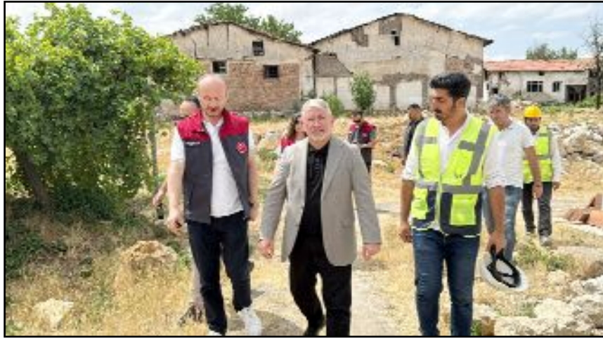
Restorasyon kapsamında kalenin bedenlerinin restorasyonu, aydınlatması ve etrafının drenaj hattı yapılacak.

Kültür ve Turizm Bakanlığının restorasyon çalışmalarına çok büyük katkısını olduğunu dile getiren Aşgın, "Kültür ve Turizm Bakanlığının kalemizde incelemelerde bulundu. Güzel düşünceleri ve tavsiyeleri oldu. Onları da dikkate alacağız. Bakanlığımız ilk etapta 10 milyon destek vereceğini açıklamıştı, bunu 30 milyon liraya çıkardı. Kültür ve Turizm Bakanlığının katkılarıyla, teknik ekibimizin katkılarıyla dünyanın merkezinde kalemizi tüm ihtişamıyla gün yüzüne çıkaracağız" diye konuştu. (İHA)