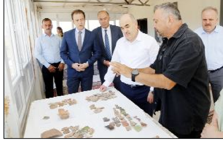
Alaca'ya bağlı Mahmudiye köyünde bulunan Kalehisar ören yerinde kazı çalışmaları aralıksız sürüyor.