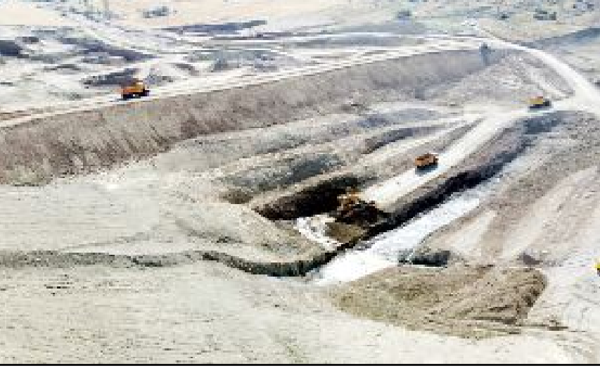
Sungurlu'da yapımına başlanan göletin batardo imalatı tamamlandı.

jeyi hız kesmeden bir an önce tamamlayarak, Diği çayı kaynaklı taşkın sorununu ve Sungurlu ilçemizin su sıkıntısını çözmek olduğunu ifade etti. (İHA)