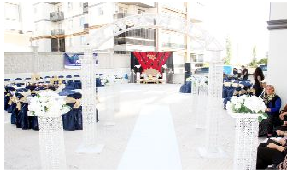
Rüya Catering, May Otel, Seyirtepe Sosyal Tesisleri işletmeciliğinin yanı sıra Çorum Sürücü Kursu olarak faaliyet gösteren Anatolia Grup, sokak düğünlerinde yeni konsepti ile dikkat çekiyor.