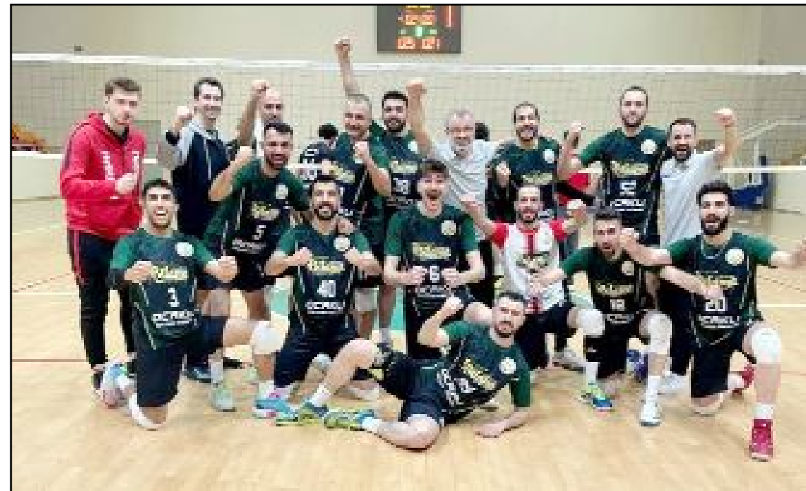
Sungurlu Belediyespor sezonun ilk maçını Ankara Yedidağ ile deplasmanda oynayacak.