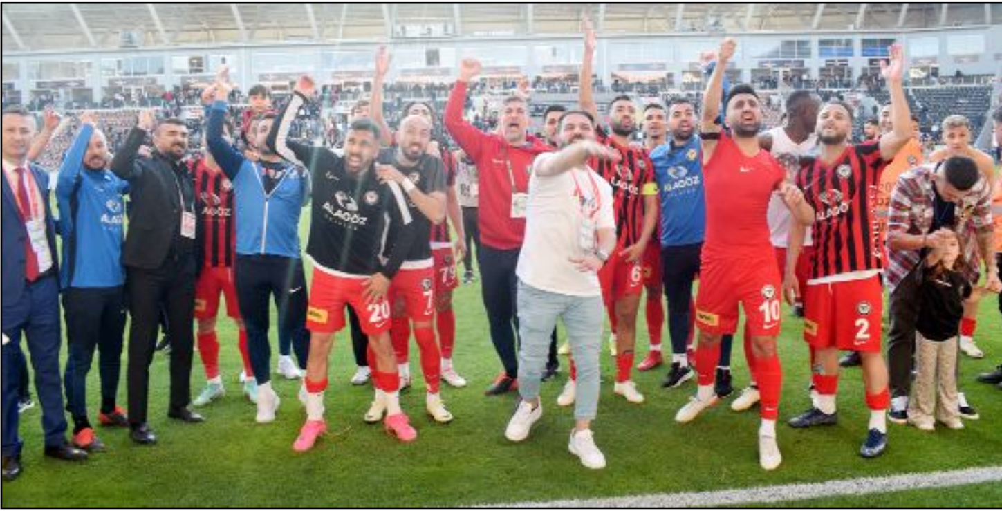
Geçen sezon Play-Off yarı finaline kadar yükselerek Çorumlu sporseverleri gururlandıran Ahlatcı Çorum FK, bu sezon yine "şampiyonluk" mücadelesi verecek.