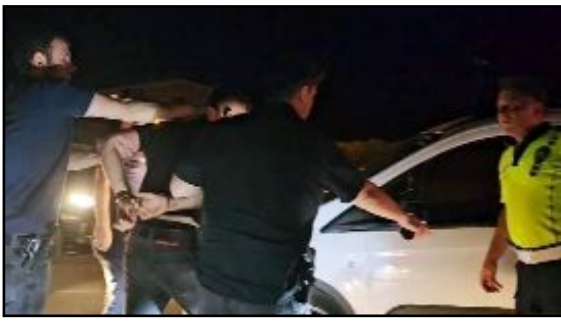
Ehliyetsiz sürücüye 46 bin TL ceza uygulandı.

Ehliyetsiz ve alkollü olduğu öğrenilen sürücüye 46 bin lira ceza uygulanırken, otomobil trafikten men edildi. Ehliyetsiz sürücü ifade işlemleri gereği Polis Merkezi Amirliği'ne götürüldü. (Haber Merkezi)