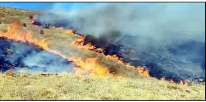
Alaca Soğucak ve Büyük Keşlik Köyü'ndeki yangınlara köylülerle birlikte itfaiye ekipleri müdahale etti.