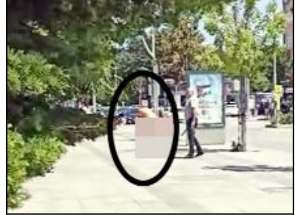
Valilik önüne gelerek eylem yapan H.Ö. isimli kişi bir süre sonra soyundu. Şahıs polis ekipleri tarafından etkisiz hale getirildi.

çıplak vatandaş Hitit Üniversitesi Çorum Erol Olçok Eğitim ve Araştırma Hastanesi'ne kaldırıldı. (Haber Merkezi)