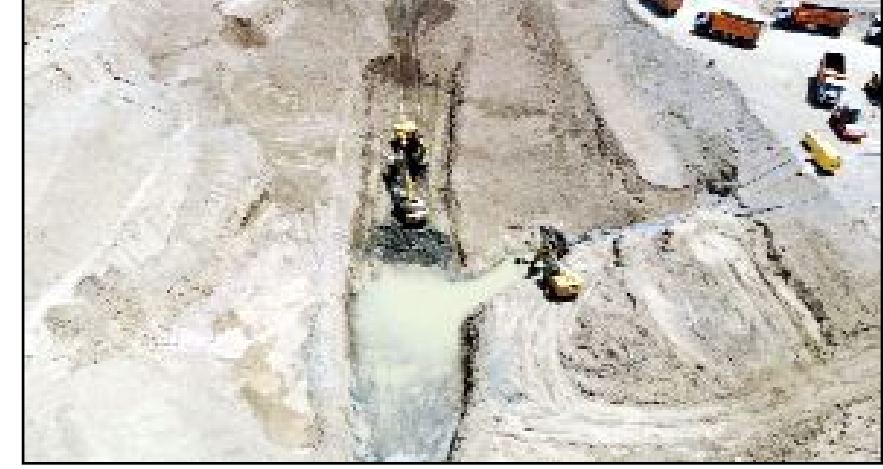
Göletin tamamlanması ile birlikte ilçeye hem içme hem de sulama suyu sağlanacağı belirtildi. Ayrıca gölet sayesinde Diği çayındaki taşkınların önüne geçilecek.