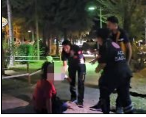
Mehmet Akif Ersoy Caddesi'nde bulunan parkta yere oturan genç kadın kırdığı alkol şişesi ile kendine zarar verdi.