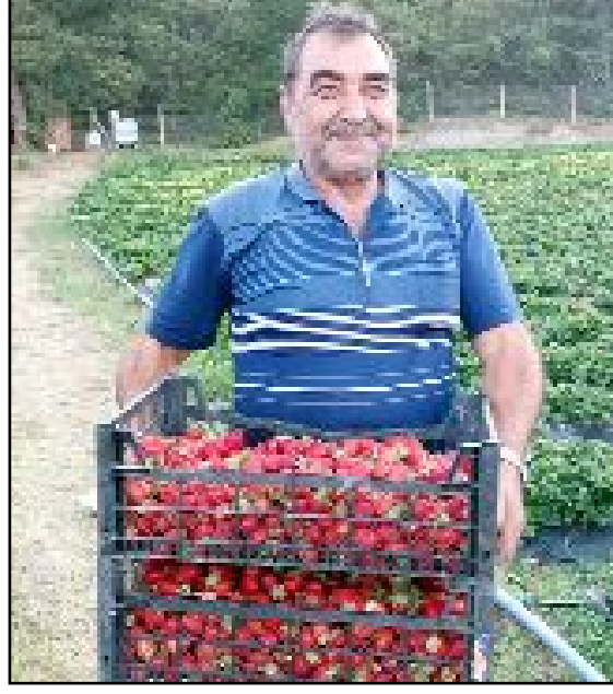
İskilip'te 7 yıl içinde çilek ekim alanları 5 dekaradan 750 dekaraya yükseldi.

İskilip Kaymakamlığı ve Belediyesi'nin desteği ile 2007 yılında yapılan denemede iyi verim alınması üzerine açılan kurslarda çilek üretimi eğitimi alan çiftçiler, arazilerinin belli bölümlerinde çilek yetiştiriciliğine başlamıştı. Aradan geçen sürede 5 dekarla başlayan üretim 750 dekaraya yükseldi.