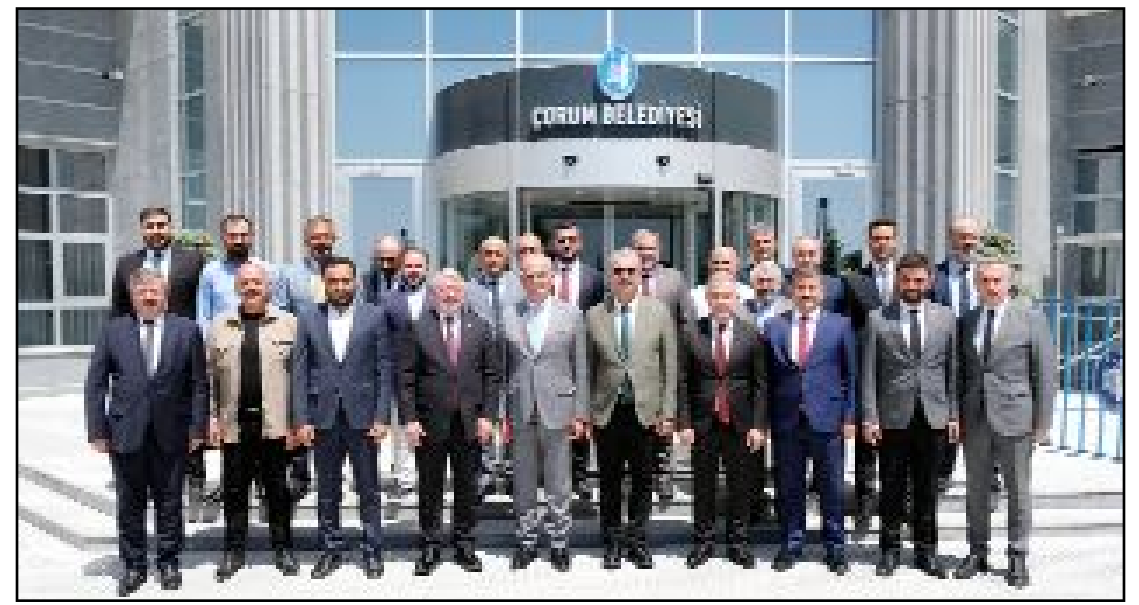
AK Parti Yerel Yönetimler Başkanı Yusuf Ziya Yılmaz'a Çorum Belediyesi'nin çalışmalarını hakkında bilgi verildi.

2024 Yılı Ek Ücret Tarifesinin görüşüleceği toplantıda ayrıca yolcu taşıma araçlarının T-Cetveline işlenmesi ve imar planı değişiklikleri ele alınacak. (Haber Merkezi)