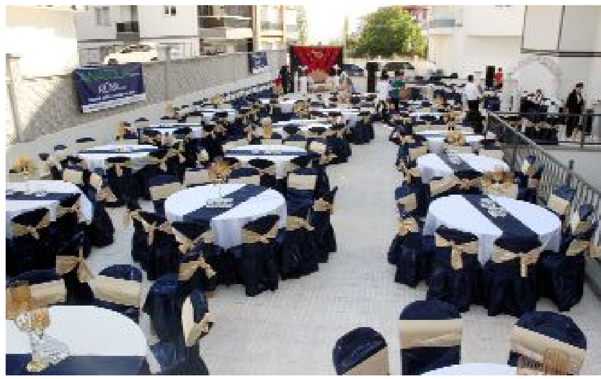
Anatolia Grup, salon kiralarnın yüksek maliyeti nedeni ile vatandaşlar için yeni bir konsept geliştirdi.