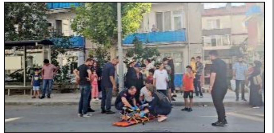
Ekin Caddesi üzerinde yaşanan kazada 8 yaşındaki çocuk hastanelik oldu.

Yaralı çocuk sağlık ekiplerince yapılan müdahalenin ardından Hitit Üniversitesi Erol Olçok Eğitim ve Araştırma Hastanesi'ne kaldırıldı. Çocuğun durumunun iyi olduğu öğrenildi. (Haber Merkezi)