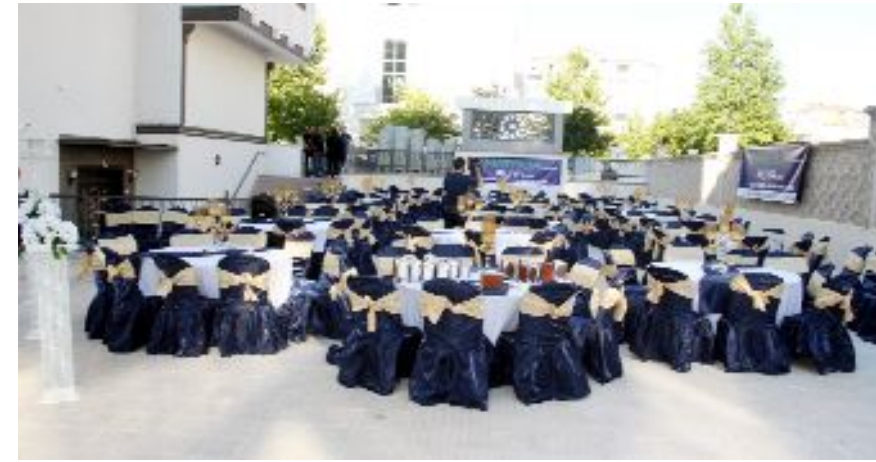
Anatolia Grup mekan seçimlerinden süslemeye, fotoğraf ve kamera çekiminden müzisyenlere, yemekten misafirlerin ağırlanmasına kadar tüm organizasyonu tek elden yapıyor

"Düğün sahiplerinin tüm taleplerini en uygun fiyata en kaliteli şekilde yerine getiriyoruz" diye konuşan Anatolia Organizasyon yetkilileri ailelerin kendilerine - 0532 445 52 07 veya 0364 226 66 76 numaralı telefondan ulaşabileceğini dile getirdiler. (Volkan SINAYUÇ)