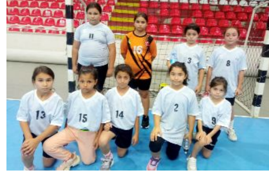
Şampiyonanın ilk gününde ev sahibi Amasya'ya 16-21 yenilen Çorum Karması, bugün Giresun ve Gaziantep temsilcileri ile karşılaşacak.

● Amasya'da düzenlenen Mini Minikler Türkiye Hentbol Şampiyonası'nda Çorum'u temsil eden Çorum Karması Kız Takımı, ilk maçında ev sahibi Amasya'ya 21-16 yenildi.