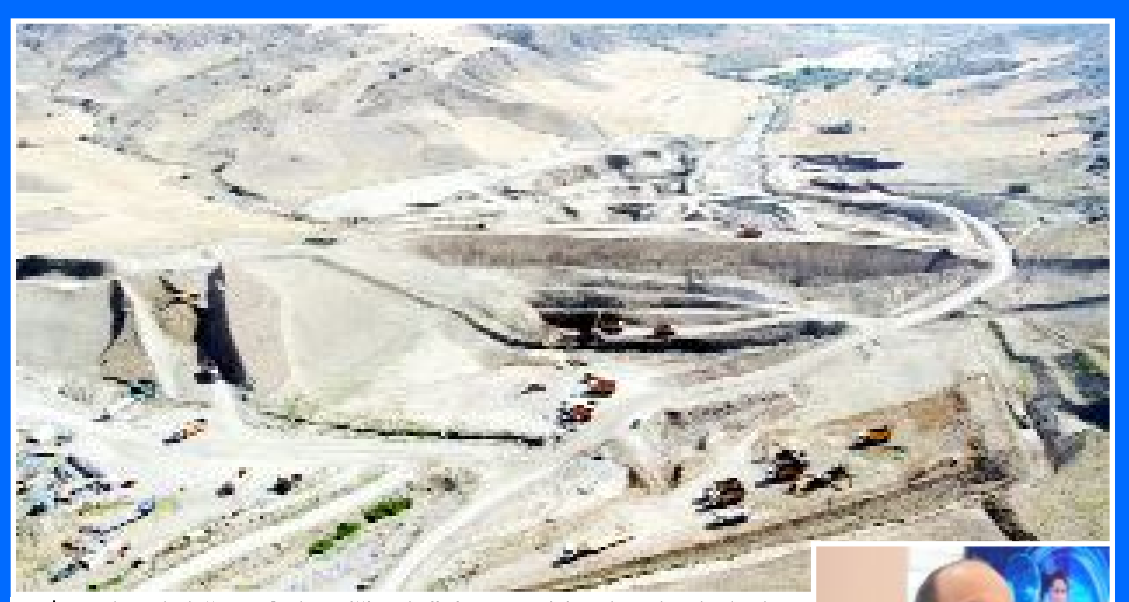
DSİ Genel Müdürlüğü tarafından Diği Göleti'nin yapımı için çalışmalara başlandı.

"Sungurlu'nun hem su, hem de taşkın sorunu çözülüyor"