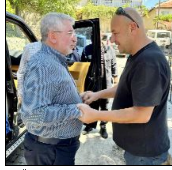
Üçköy'de düzenlenen can yemeğine Milletvekili Ahacı ile Belediye Başkanı Aşgın da katıldı.