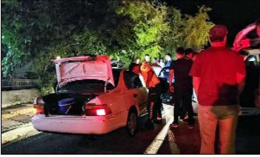
Polis noktasından aracıyla kaçan sürücü bir süre sonra yakalandı.