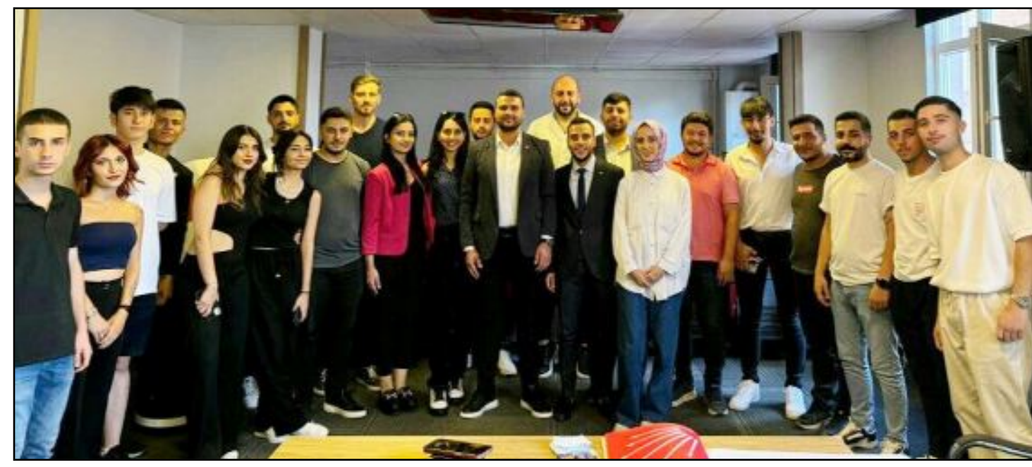
CHP Çorum Merkez İlçe Gençlik Kolları'nın olağan genel kurulu üyelerin katılımı ile yapıldı.