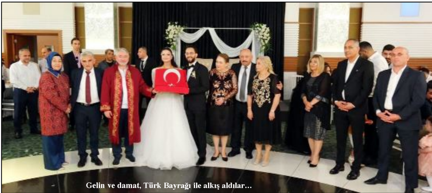
Gelin ve damat, Türk Bayrağı ile alkış aldılar...