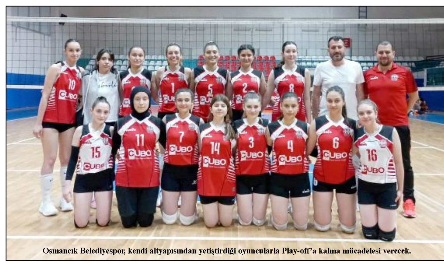
Osmaniye Belediyespor, kendi altyapısından yetiştirdiği oyuncularla Play-off'a kalma mücadelesi verecek.

Grupta, çift devreli lig statüsüne göre oynanacak maçlar sonunda ilk 2 sırayı alan takımlar çeyrek finale yükselecek. Son sırayı alan takım ise mahalli lige düşecek. (Hüseyin AŞKIN)