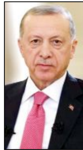
Cumhurbaşkanı R.Tayyip Erdoğan

da sözlerine ekledi. (Kaynak: Malatya Söz Gazetesi)