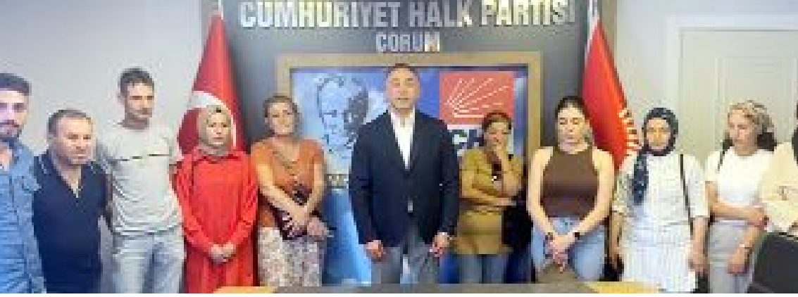
Milletvekili Mehmet Tahtasız, CHP İl Merkezi'ne gelen tekstil işçileriyle...

● Çorum'un 5. yatırım teşvik bölgesinde olduğunu, 6. bölgeye göre bir işçide 5.500 lira fazla ödenmesi gerektiğini anlatan Tahtasız, "Tekstil sektörü, ülkemizden, ucuz işgücü nedeniyle Mısır ve Bangladeş'e kayıyor. Çorum gibi tekstil üssüne dönüşmüş illerense, daha fazla teşvik gören doğu illerine doğru yöneliyor" diye konuştu.