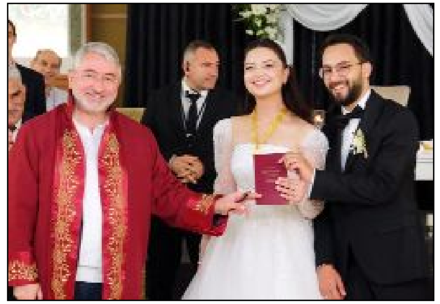
Başkan Aşgın, evlilik cüzdanını verirken, mutluluk dilekelerini ilettiler.