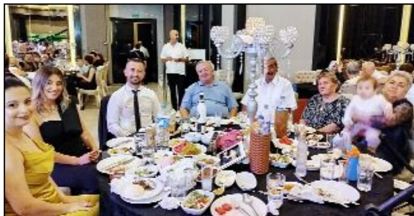
Yıldızpark Düğün Salonu'ndaki düğüne Kızıltepe ve Erkoç ailesinin çok sayıda davetlisi katıldı.