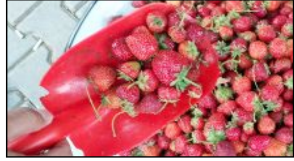
İlçede bu yıl 2 bin ton çilek yetiştirilmesi hedefleniyor.

Efe, ilçede üretilen çileğin bir kısmının Türkiye'nin farklı illerine gönderildiğini, bir kısmını da Ziraat Odası bünyesinde kurdukları dondurarak kurutma tesisinde kurutarak ilçe ekonomisine katkı sağladıklarını kaydetti. (AA)