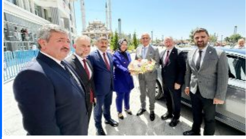
Yusuf Ziya Yılmaz'ın Çorum'da ilk durağı Çorum Belediyesi oldu.

AK Parti Yerel Yönetimler Başkanı olan Yusuf Ziya Yılmaz, bir dizi ziyaret için geldiği Çorum'da parti binasında basın toplantısı düzenledi. Yılmaz yerel seçim sonuçlarından memnun olmadıklarını dile getirdi. •3'de