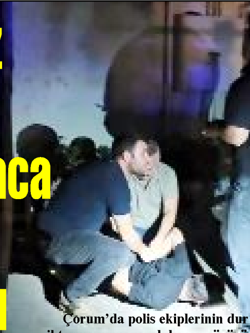
Çorum'da polis ekiplerinin dur ihtiarına uymayarak kaçan şüpheli yakalanınca 46 bin lira ceza yedi.