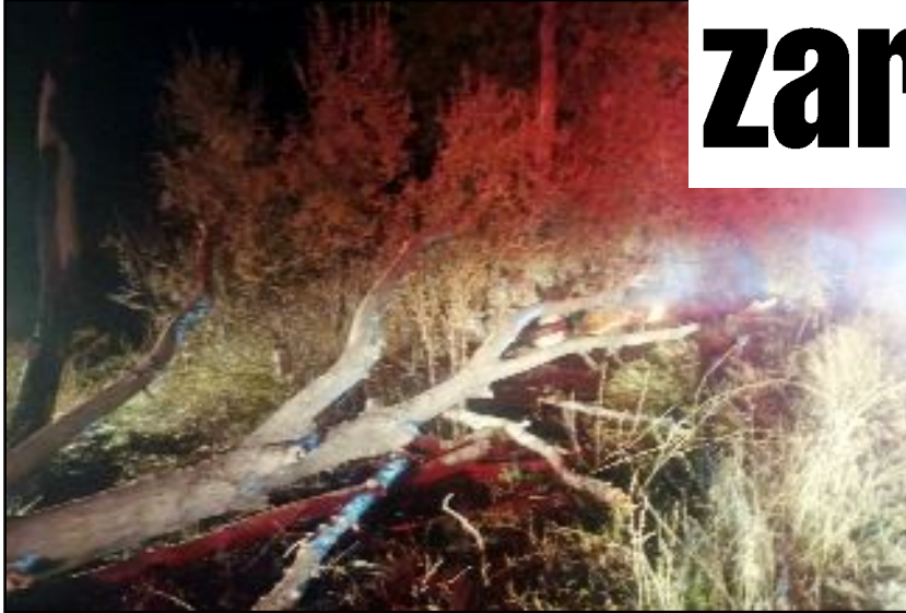
Yanan ağaçlar Balçıkhisar ve İsmaili köy grup yoluna devrildi.

Çorum'un Alaca ilçesinde çıkan anız yangınında ağaçlık alan zarar gördü.