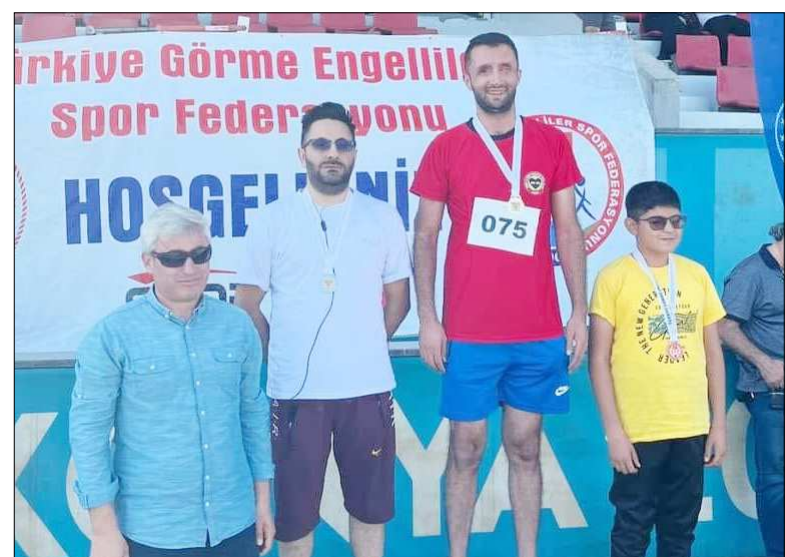
Çorumlu görme engelli sporcular ödül kürsüsünde görülüyor...