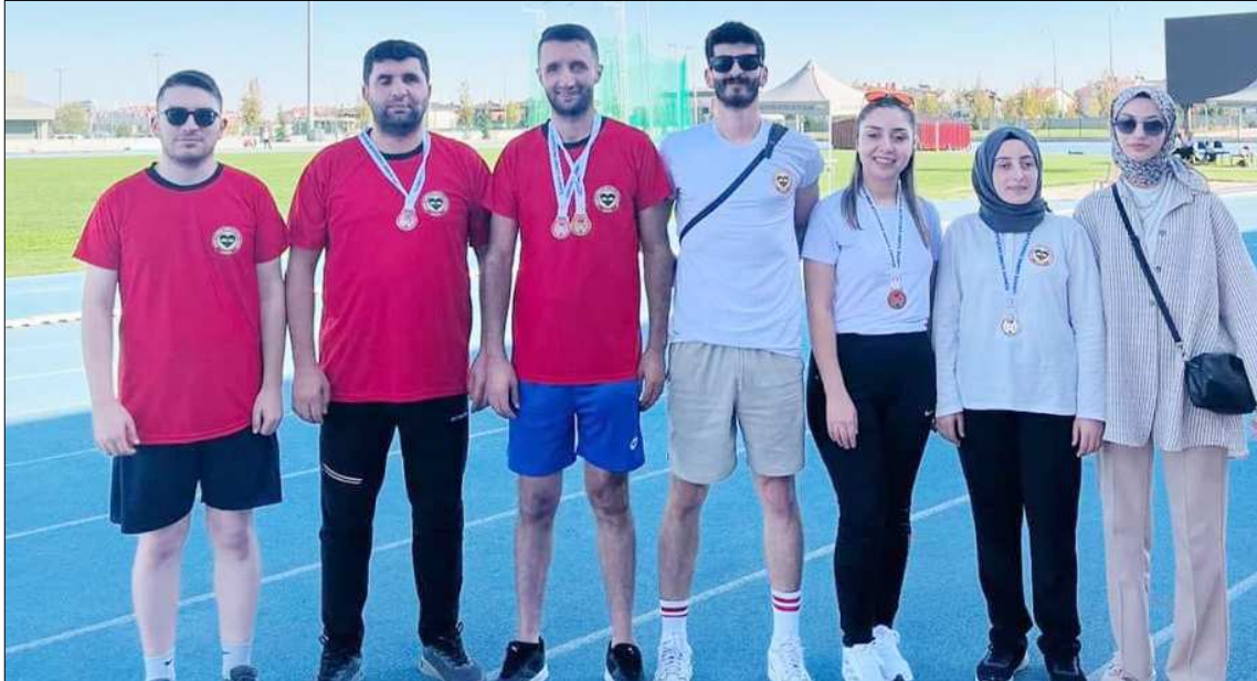
Derece yapan Çorumlu özel sporcular birlikte görülüyor...

Türkiye Görme Engelliler Spor Federasyonu'nun 2024 yılı faaliyet programında yer alan Türkiye Görme Engelliler Atletizm müsabakaları Konya'da yapıldı. Ülke genelinden çok sayıda görme engelli sporcuların ter döktüğü müsabakalara Çorumlu sporcular damga vurdu. Çorum Görme Engelliler Spor Kulübü 2 altın, 1 gümüş ve 3 bronz olmak üzere toplamda 6 madalya ile Çorum'a döndüler. (Rifat KARA)