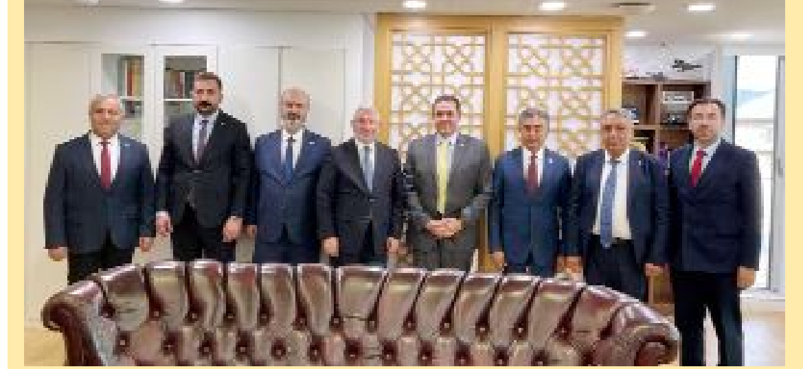
Çorum heyeti, Seul Büyükelçisi Murat Tamer'le birlikte...