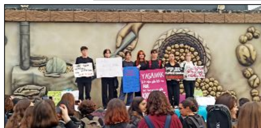
Sosyal medyadan haberleşerek bir araya gelen yaklaşık 300 liseli genç, çocuk ve kadın cinayetlerini protesto etti.