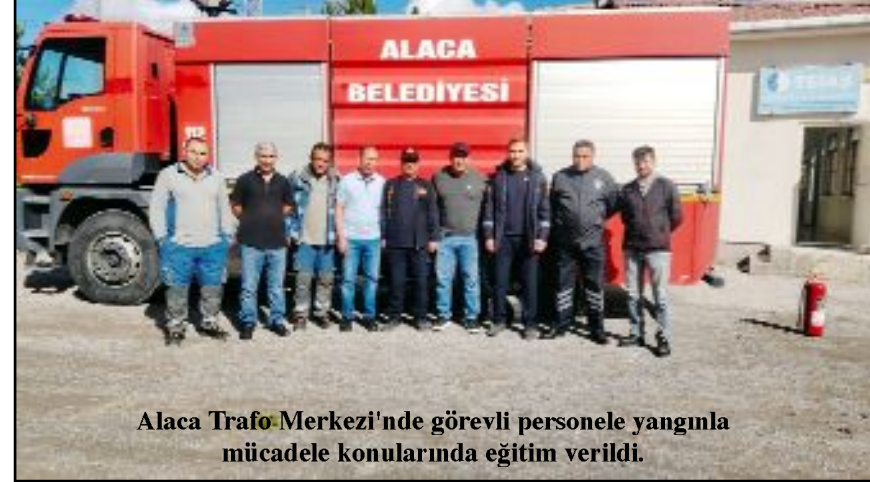
Alaca Trafo Merkezi'nde görevli personele yangınla mücadele konularında eğitim verildi.

"Cumhurbaşkanı Erdoğan 2018-19 ve 2020'de Çorumlulara hızlı tren müjdesi vermiş, 'Çorum'un hızlı tren için gün saydığını çok iyi biliyorum. Çorum'un bu hayalini gerçeğe dönüştürmeye kararlıyız, hızlı tren 2023 yılında Çorum'a gelecek. Bu işi bizzat takip ediyorum' demişti. Ulaştırma ve Altyapı Bakanı Abdülkadir Uraloğlu da Kırıkkale-Delice-Çorum hızlı tren ihalesinin bu sene yapılacağını defalarca tekrarladı. 12 Eylül'de ilimize gelen AKP Başkan Vekili Mustafa Elitaş ise 'Yılın bitmesine üç ay var, biraz zor olabilir' açıklamasıyla hem Cumhurbaşkanını hem de Bakanım yalanlamış oldu. Sözünüzü yerine getirmek için seksen iki gününüz kaldı." (Haber Merkezi)