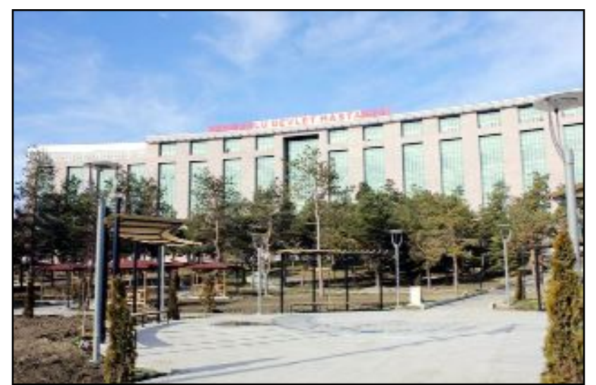
Hastanenin kantin ihalesi 21 Ekim 2024 günü yapılacak.

Hasan Yıldırım, "İlçeye gelerek görevime başladım. Sungurlu'da görev yapacak olmaktan dolayı mutluyum. Sungurlu şirin bir ilçe ve insanları sıcak kanlı. Gerçekten burada çalışmaktan ve ilçe halkına hizmet edecek olmaktan dolayı mutluyum" görüşüne yer verdi. (Haber Merkezi)