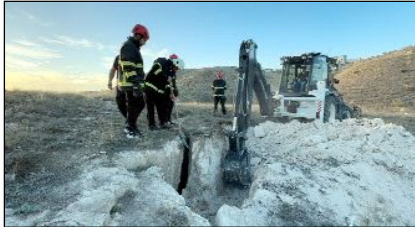
İtfaiye ekiplerinin yaptığı 3 saatlik titiz çalışmanın ardından yavru köpekler mahsur kaldıkları yerden kurtarıldı.