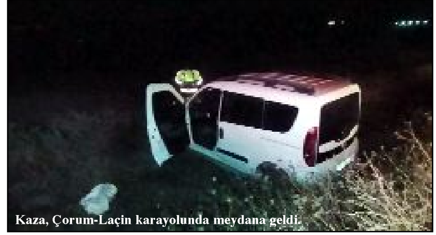
Kaza, Çorum-Laçın karayolunda meydana geldi.

Kaza, Çorum-Laçın karayolunda meydana geldi. Edinilen bilgilere göre, Dursun Ç. idaresindeki 19 ACN 671 plakalı araç, Çatak yol ayrımında sürücünün direksiyon hakimiyetini kaybetmesi sonucu kontrolden çıkarak yol kenarındaki şarampole uçtu. Kazada sürücü yaralandı. Yaralı sürücü olay yerinde yapılan ilk müdahalenin ardından hastaneye kaldırılarak tedavi altına alındı. (İHA)