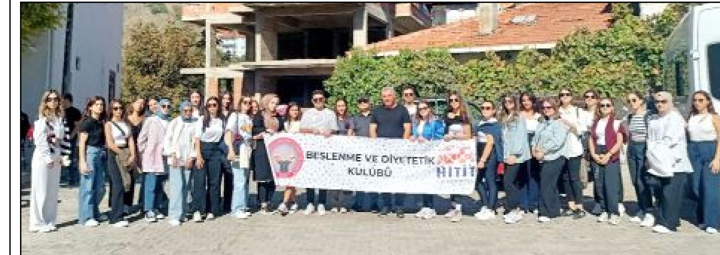
Hitit Üniversitesi Beslenme ve Diyetetik Kulübü, Oğuzlar Ceviz Üreticileri Birliği'ni ziyaret etti.

Hantal, Hitit Üniversitesi Beslenme ve Diyetetik Kulübüne ziyaretlerinden dolayı teşekkür etti. (AA)