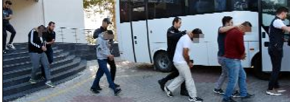
Gözaltına alınan 76 şüpheli, emniyetteki işlemlerin ardından adli makamlara sevk edildi.

arak güven sağlandığı, daha yüksek ödemeler yapılabilmesi için 'VIP gruba' geçiş parası talep edildiği belirlendi. Çetenin müşterilerden toplanan paraların izlerini kaybetirmek için farklı hesaplara, daha sonra da kripto para hesaplarına aktardığı, paranın son olarak hiçbir kripto borsasına veya kişiye ait olmayan soğuk cüzdanlarda toplanarak nakde dönüştürüldüğü tespit edildi. Çete liderinin Diyarbakır'da berberlik yaptığını belirleyen ekipler, operasyon için düğmeye bastı. Yaklaşık 16 ay süren teknik ve fiziki takip sonrasında şüphelilere yönelik 'suç işlemek amacıyla örgüt kurma ve nitelikli dolandırıcılık' suçundan Diyarbakır başta olmak üzere İstanbul, Adana, Karabük, Antalya, Muğla, Çorum, Ankara, Yalova, Kocaeli, Şırnak, Kırklareli, Batman, Samsun, Mersin, Hatay, Ordu, İzmir ve Van illerinde toplam 95 adrese eş zamanlı operasyon düzenleyen polis, 92 şüpheliden 76'sını yakalayıp gözaltına aldı. (İHA)