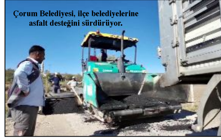
Çorum Belediyesi, ilçe belediyelerine asfalt desteğini sürdürüyor.

Çorum Belediyesi Fen İşleri Müdürlüğü'ne bağlı ekipler Sungurlu'da başlattıkları asfalt çalışmalarını tamamladı. Çorum genelinde devam eden alt yapı ve üst yapı çalışmalarının yanı sıra Çorum Belediyesi ilçe belediyelerine de desteğini sürdürüyor. Geçtiğimiz yıllarda olduğu gibi 2024 yılında da Fen İşleri Müdürlüğü'ne bağlı ekipler ilçelerde de asfalt çalışmaları gerçekleştiriyor. Çiftlik Mahallesi'nde 1200 metrelik yolun asfalt çalışmaları tamamlandı. Fen İşleri Müdürlüğü ekipleri önümüzdeki günlerde ilçelere asfalt desteğini sürdürecektir. (Haber Merkezi)