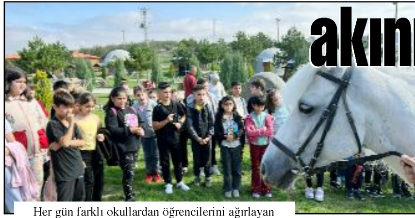
Her gün farklı okullardan öğrencilerini ağırlayan Çorumlu Obası, ziyaretçilerine keyifli anlar yaşıyor.