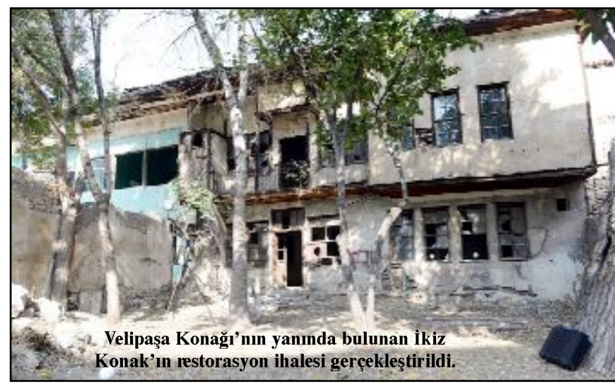
Velipaşa Konağı'nın yanında bulunan İkiz Konak'ın restorasyon ihalesi gerçekleştirildi.

olarak restorasyonunu yaparak butik otel olarak hizmete açacağız. Bu tarihi yapı ile şehrimizin turizmine ve tanıtımına önemli katkılar sağlanmış olacaktır." dedi. (Haber Merkezi)