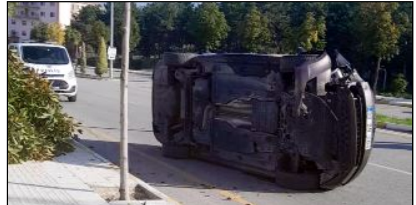
Kaza, Bahçelievler Semt Polikliniği'nin önünde gerçekleşti.

Kaza, Bahçelievler Semt Polikliniği'nin önünde gerçekleşti. İddiaya göre, kimliği belirlenemeyen sürücünün kullandığı araç, direksiyon hakimiyetini kaybettiği anda kontrolden çıktı. Otomobil, yol kenarında bulunan ağaca çarparak yan yattı. Yan yatan araçta sıkışan sürücünün durumu- rücünün durumunun iyi olduğu öğrenildi. (Haber Merkezi)