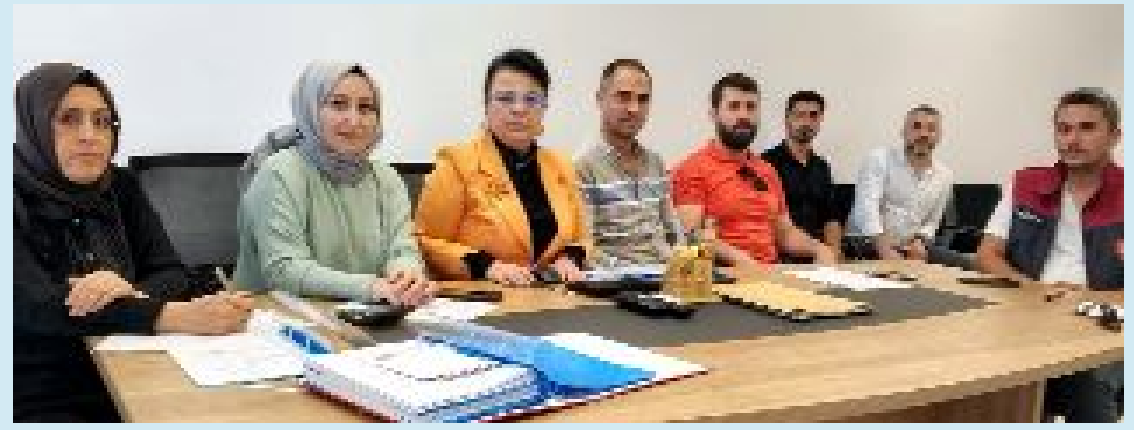
5 firmanın katıldığı ihalede 3 firmanın teklifi geçerli sayılırken, ihalede en düşük teklifi 29 milyon 971 bin 515 TL ile Arsen Proje İnşaat Turizm Sanayi ve Ticaret Anonim Şirketi verdi.

● Çorum Belediyesi tarihi İkiz Konak'ı turizme kazandırıyor. Kültür Yolu projesi dahilinde butik otel olarak hizmete sunulması hedeflenen İkiz Konak'ın restorasyon ihalesi yapıldı. •3'de