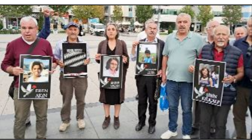
Ankara Garı önünde 10 Ekim 2015'te meydana gelen patlamada yaşamını yitirenler, saldırının 9. yılında Çorum'da da anıldı.