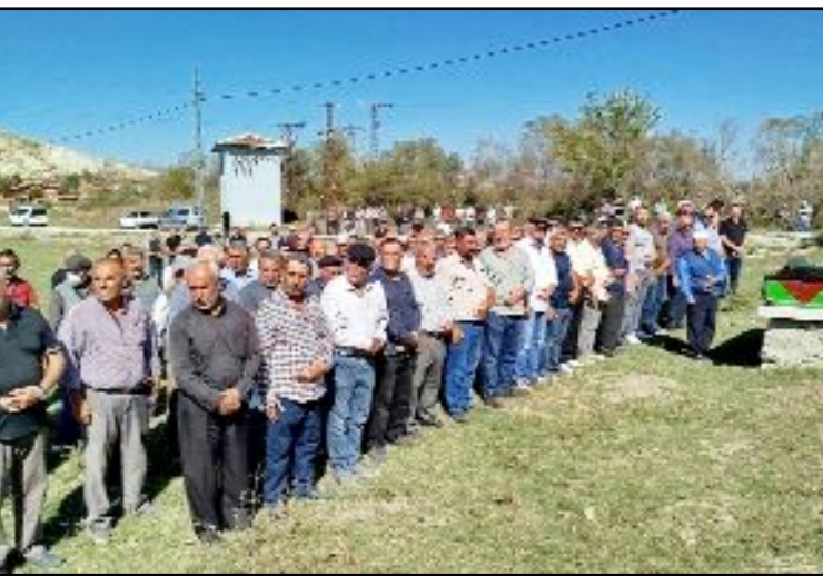
Ankara'da hayatını kaybeden Emine Bilal Ferhatlı Köyü'nde son yolculuğuna uğurlandı.

İhale şartnameleri mesai saatleri içinde Sungurlu Devlet Hastanesi Satınalma Biriminden bedelsiz olarak alınabilecek. İstenilen belgeleri içeren ihale zarfları 21.10.2024 Pazartesi günü saat 10.00'a kadar Sungurlu Devlet Hastanesi Baştabipliğine verilecek. (Haber Merkezi)