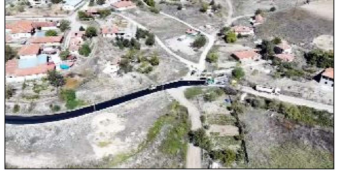
Sungurlu'nun Çiftlik Mahallesi'nde 1200 metrelik yolun asfalt çalışmaları tamamlandı.