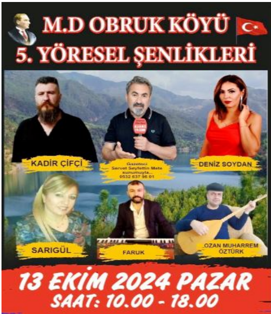
Mehmet Dede Obruk Köyü 5. Geleneksel Şenlikleri yarın yapılacak.

Türkülerin sevilen ismi, ünlü sanatçı Ali Ekber Eren, Çorum'da konser verecek.