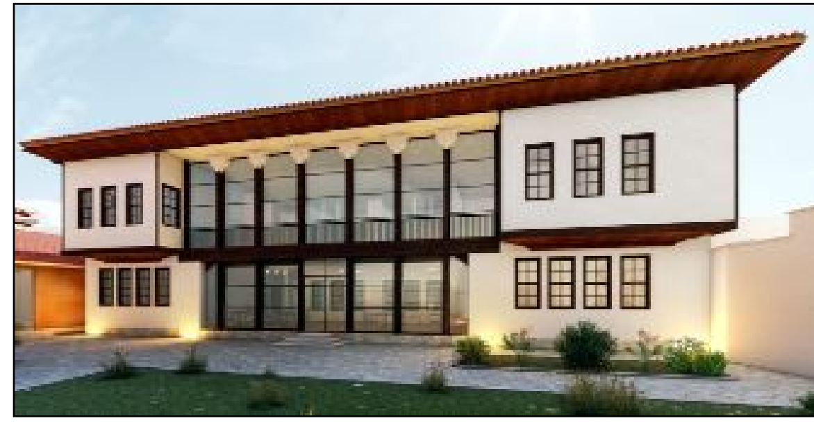
11 odası ve içerisinde hediyelik eşya dükkanlarının da yer alacağı İkiz Konak, butik otel olarak kullanılacak.