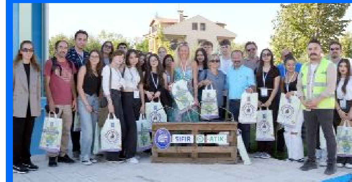
İtalya, Portekiz ve Litvanya'dan Çorum'a gelen 8 öğretmen ve 18 öğrenci, Belediye'nin 1.Sınıf Atık Getirme Merkezi'ni ziyaret etti.

Yurt dışından ilimize gelen bir grup öğretmen ve öğrenci