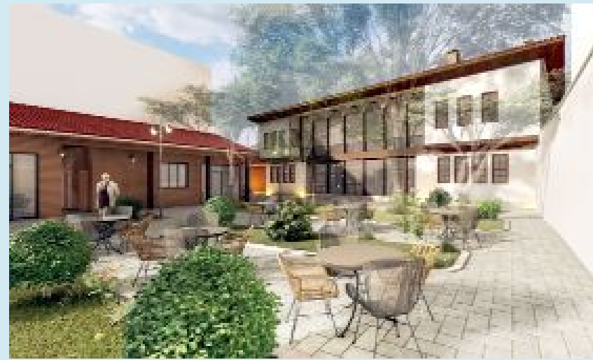
11 odası ve içerisinde hediyelik eşya dükkanlarının da yer alacağı İkiz Konak, butik otel olarak kullanılacak.

● Çorum Belediyesi tarihi İkiz Konak'ı turizme kazandırıyor. Kültür Yolu projesi dahilinde butik otel olarak hizmete sunulması hedeflenen İkiz Konak'ın restorasyon ihalesi yapıldı. •3'de