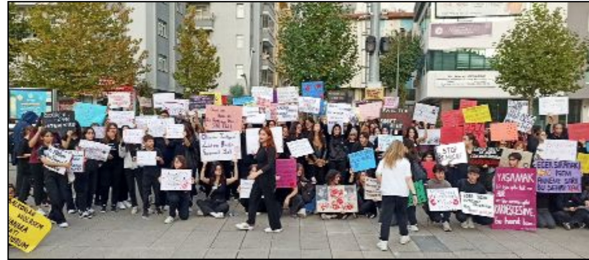
Kadeş Barış Meydanı'nda eylem yapan gençler, "Susma sustukça sıra sana gelecek", "Hak, hukuk, adalet" sloganları atarak Türkiye'de son dönemlerde artan şiddet olaylarına tepki gösterdi.