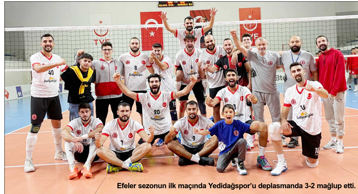
Efeler sezonun ilk maçında Yedidağspor'u deplasmanda 3-2 mağlup etti.