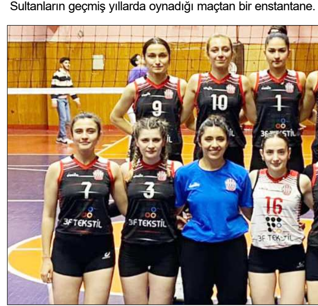
Çorum temsilcisi Osmaniye Belediyespor uzun yıllardır Çorum'u 2.Lig'de temsil ediyor...

Çorum'un Kadınlar 2.Voleybol Ligi'ndeki temsilcisi Osmaniye Belediyespor sezonun ilk maçına sahasında çıkıyor. Türkiye Voleybol Federasyonu (TVF) Kadınlar 2.Lig 14.Grup 1.hafta maçında Çorum temsilcisi Osmaniye Belediyespor ile Ordu temsilcisi 52 Çamlıkspor Çorum'da karşı karşıya gelecek. Çorum'un voleybol branşındaki yüz akı Osmaniye Belediyespor bu kritik karşılaşmayı kazanarak sezona puanla başlamak istiyor. Karşılaşma yarın Osmaniye İlçe Stadı'nda saat 14.00'de oynanacak. Grup'ta oynanacak diğer maçlarda Artvinspor ile Bordo Mavi 61, Samsunspor Voleybol ile Çayelispor karşı karşıya gelecek. (Rifat KARA)