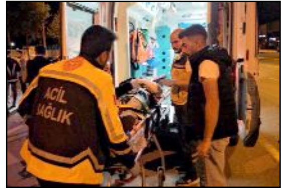
Kamyonete çarpan motosiklet sürücüsü yaralanarak hastaneye kaldırıldı.

Kaza nedeniyle bir şeridi kapanan yol araçların kaldırılmasının ardından tekrar trafiğe açıldı. (Haber Merkezi)