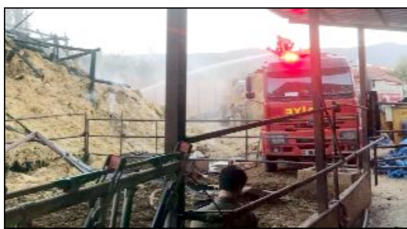
Çeşmeören Köyü'nde bulunan samanlıkta çıkan yangın söndürüldü.