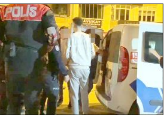
Çöplü Mahallesi Devane Sokak'ta yaşanan çatışmanın ardından yakalanan 5 genç tutuklandı.