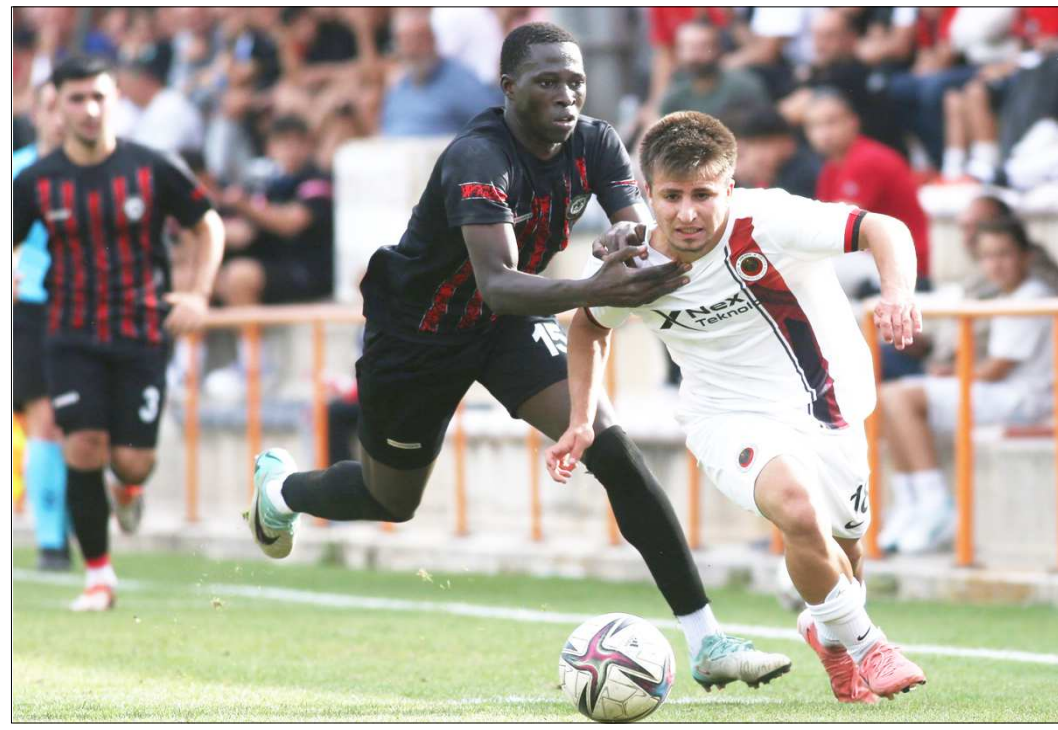
Çorum FK U19 takımı deplasmanda Gençlerbirliği'ne 1-0 mağlup oldu.