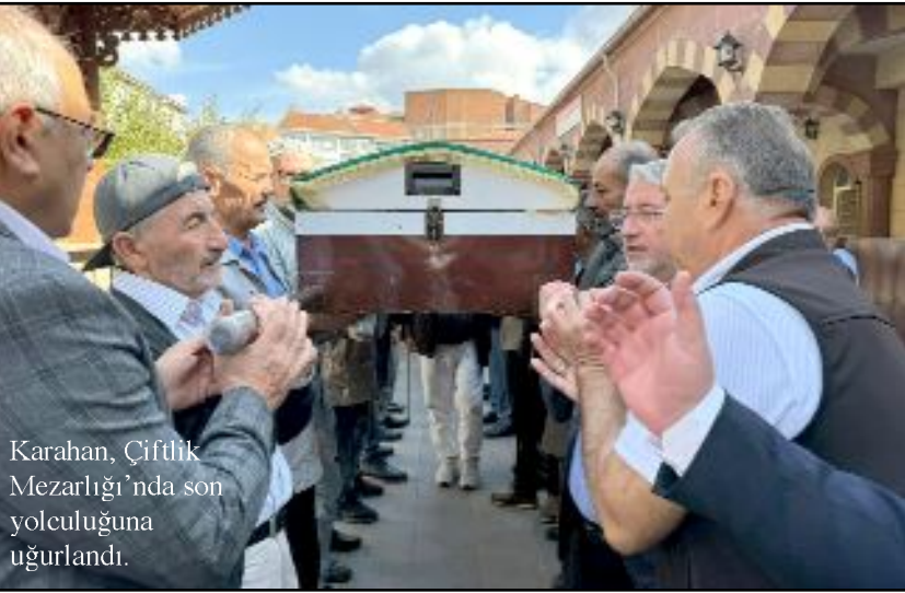
Karahan, Çiftlik Mezarlığı'nda son yolculuğuna uğurlandı.

ÇORUM HABER merhuma Allah'tan rahmet, kederli ailesi ve yakınlarına başsağlığı diler. (Volkan SINAYUÇ)