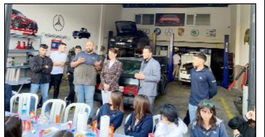
Sanayi Çarşısı'nda esnafılık üzerine bilgilendirme...