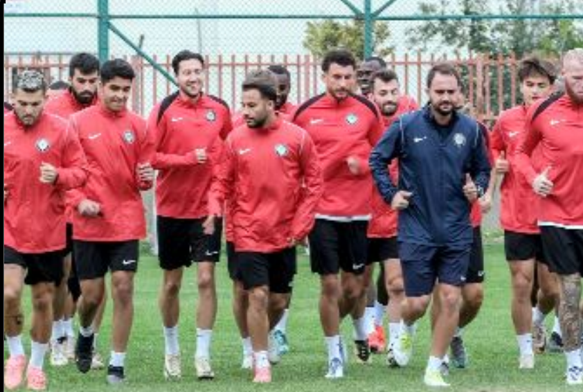
Ahlatacı Çorum FK dünü dinlenerek geçirdi.