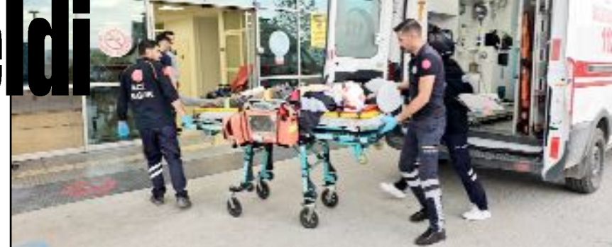
Kazada yaralılarından 80 yaşındaki Hakkı Y. de hayatını kaybetti.