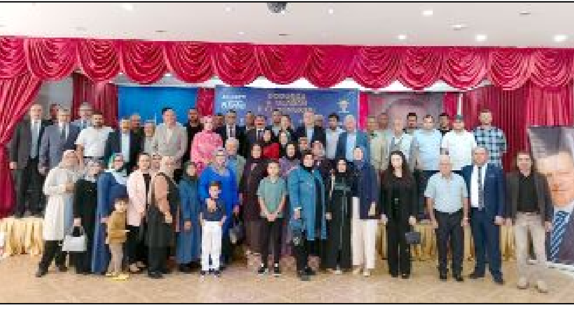
AK Parti'nin ilçe kongreleri geçtiğimiz hafta sonu başladı.