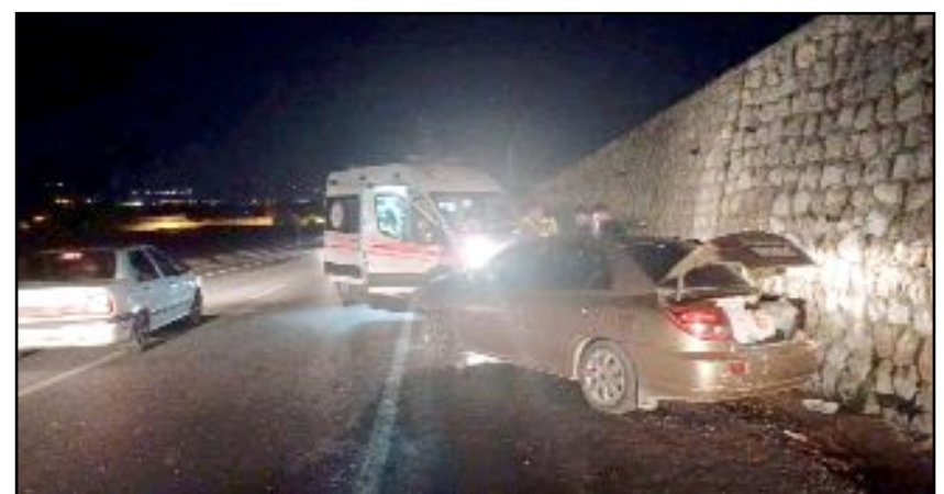
Yoldan geçen sürücülerin ihbarı üzerine olay yerine sağlık ve polis ekipleri sevk edildi.