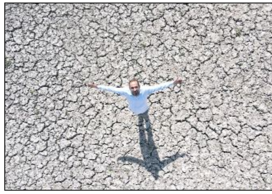
"Kuş cenneti" Gölünyazı, kuraklık sebebiyle susuz kaldı.