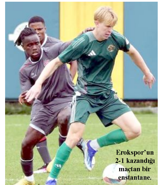
Erokspor'un 2-1 kazandığı maçtan bir enstantane.