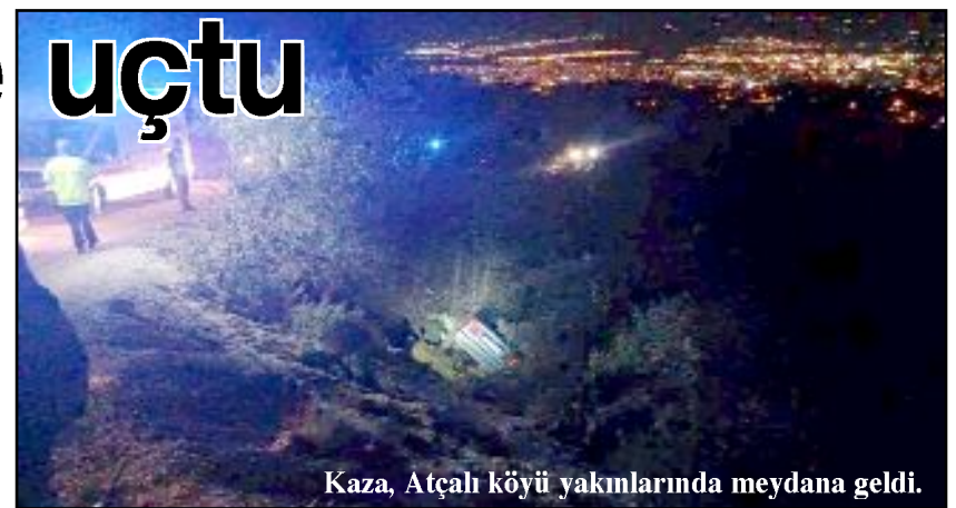
Kaza, Atçalı köyü yakınlarında meydana geldi.