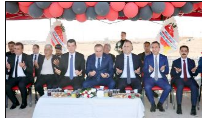
Sungurlu Organize Sanayi Bölgesi'nde, endüstriyel streç film üretimi yapacak fabrikanın temeli atıldı.

Fabrikada üretilen streç filmlerin yüzde 60'lık bölümünün yurt içinde, yüzde 40'lık kısmının ise yurt dışına ihraç edileceğini belirtirken, fabrikanın ilçe ekonomisine önemli katkılar sağlayacağı ve bölge sanayisinin gelişiminde önemli bir rol oynayacağı ifade edildi. (İHA)