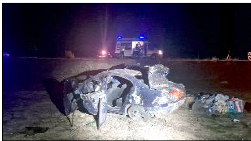
Olay yerinde ilk müdahalesi yapılan yaralıları, Alaca Devlet Hastanesi'ne kaldırılarak tedavi altına alındı.