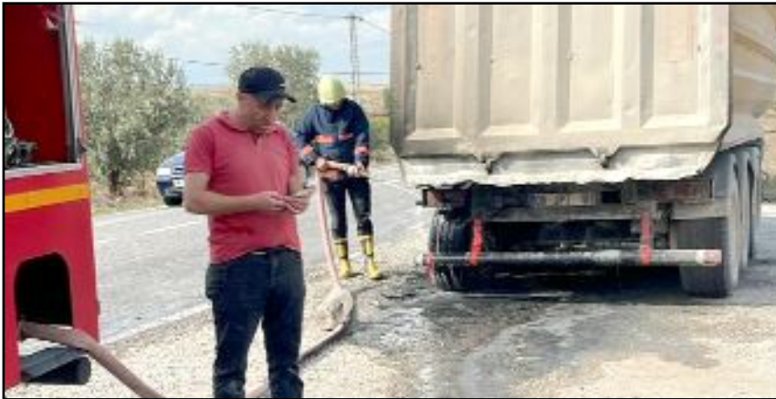
İskilip'te alev alan kamyonu itfaiye ekipleri söndürdü.

Çorum'un İskilip ilçesinde alev alan hafriyat kamyonu it-