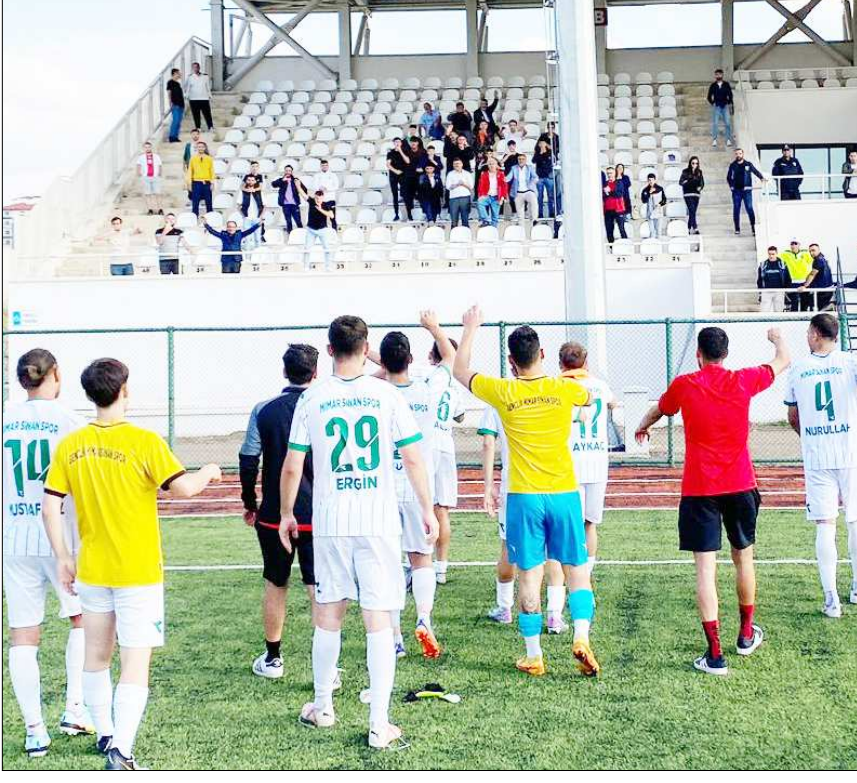
Mimar Sinanspor'lu futbolcular kritik galibiyeti taraftarları ile kutladı.

dan Kdz. Ereğli Belediyespor birinci, Keçiören Belediyesi Bağlumspor ikinci, Bartınspor üçüncü ve Geredespor ise dördüncü sırada yer aldı. Çorum temsilcisi Mimar Sinanspor ise aldığı 3 puan ile haftayı sekizinci sırada kapattı. (Rifat KARA)