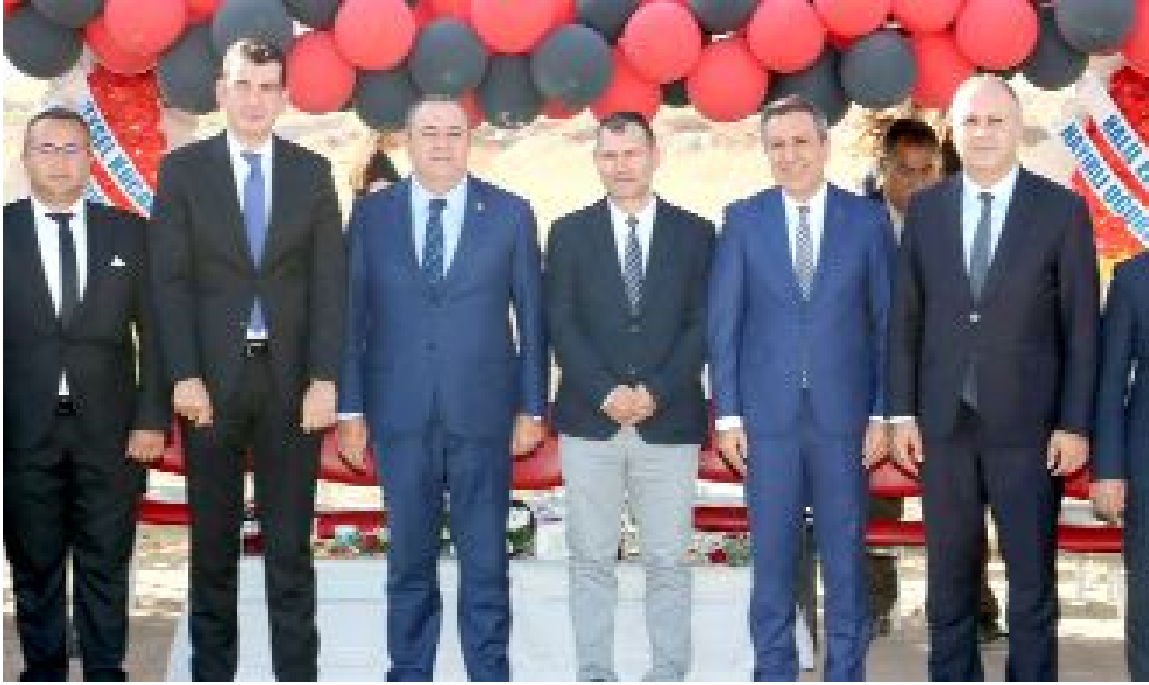
Sungurlu Organize Sanayi Bölgesi'nde "endüstriyel streç film" üretimi yapacak fabrikanın temeli atıldı.

● Sungurlu Organize Sanayi Bölgesine (OSB), Elfa Lojistik firması tarafından 50 milyon lira yatırımla endüstriyel streç film üretilecek fabrikanın temeli düzenlenen törenle atıldı. ● Fabrikada üretilen streç filmlerin yüzde 60'lık bölümünün yurt içinde, yüzde 40'lık kısmının ise yurt dışına ihraç edileceği belirtildi. •3'de