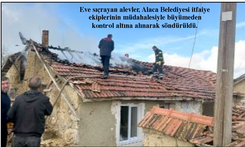
Eve sıçrayan alevler, Alaca Belediyesi itfaiye ekiplerinin müdahalesiyle büyümeden kontrol altına alınarak söndürüldü.

Çorum'un Alaca ilçesinde baca temizliği yapılırken yangın çıktı. Çıkan yangında samanlık ile samanlıkta bulunan 120 balya saman kül olurken, ev ise itfaiyenin yoğun çabasıyla son anda kurtarıldı.