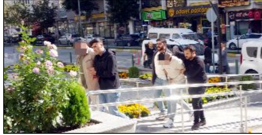
Emniyet'teki işlemleri tamamlanan zanlılar, Adliye'ye çıkarıldı.

Çorum'da hafta sonu bir işyerinin kurşunlanması ve pazarcı esnafının silahla vurulması olayıyla ilgili gözaltına alınan 2 zanlı Adliye'ye sevk edildi.