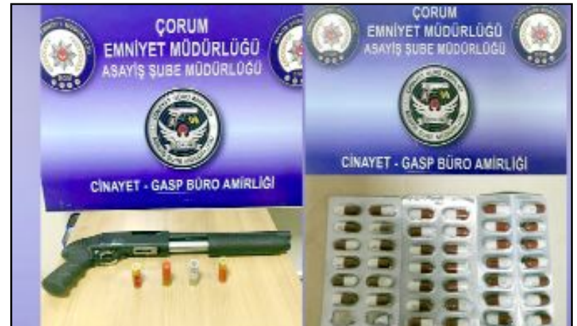
Asayiş ekipleri yaptıkları uygulamada çok sayıda uyuşturucu madde ve silah ele geçirdi.

Konuyla ilgili açıklamada "Şehrimizin huzur ve güvenliği için 24 saat görevimizin başındayız" denildi. (Volkan SINAYUÇ)