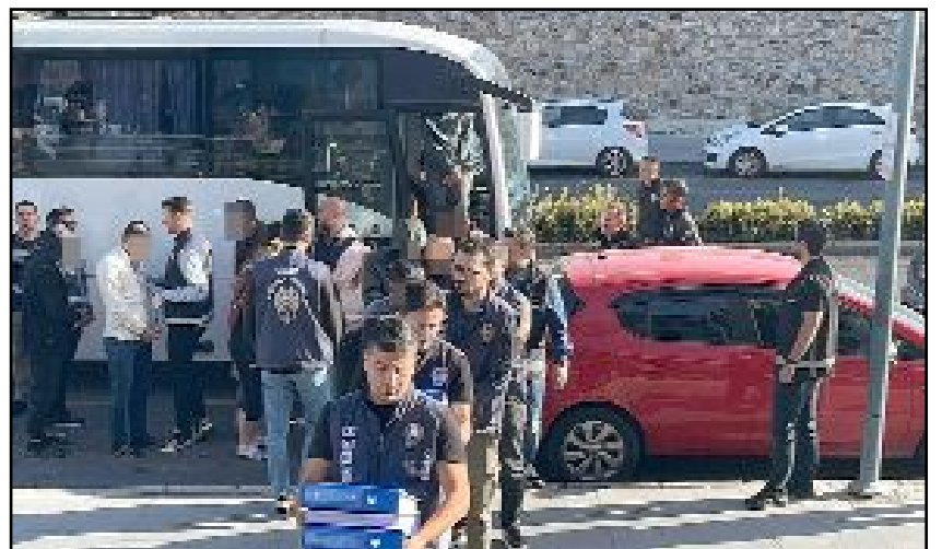
92 şüpheliden 76'sı gözaltına alınırken, 54'ü tutuklandı.

savcılıktan, 15 şahısta mahkemeden adli kontrol şartıyla serbest bırakıldı. (İHA)