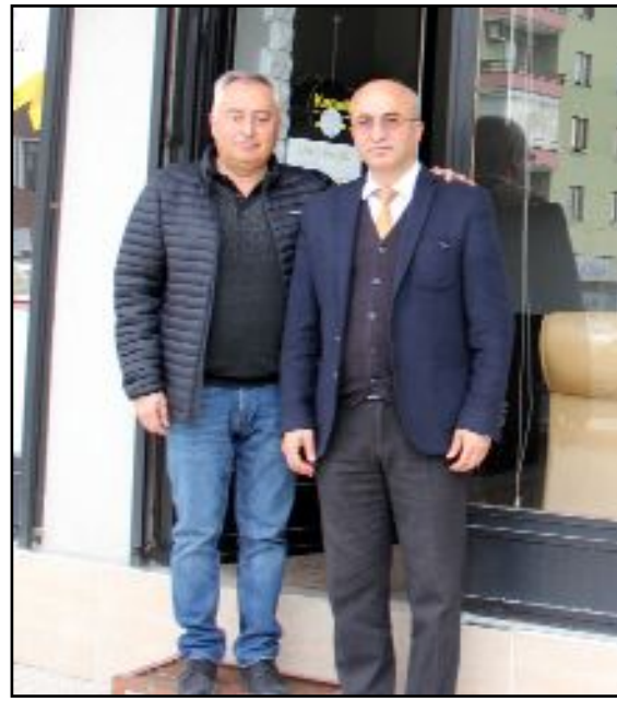
Albayrak Caddesi üzerinde faaliyet gösteren Limit Emlak, mülk sahiplerine uyarıda bulundu.