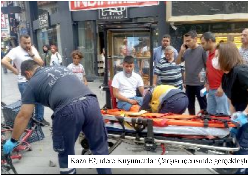
Kaza Eğridere Kuyumcular Çarşısı içerisinde gerçekleşti.

Çorum'da araç trafiğine kapalı olan Eğridere Kuyumcular Çarşısı içerisinde bir motosiklet ile şarjlı elektrikli bisiklet çarpıştı. Kazada 2 kişi yaralandı.