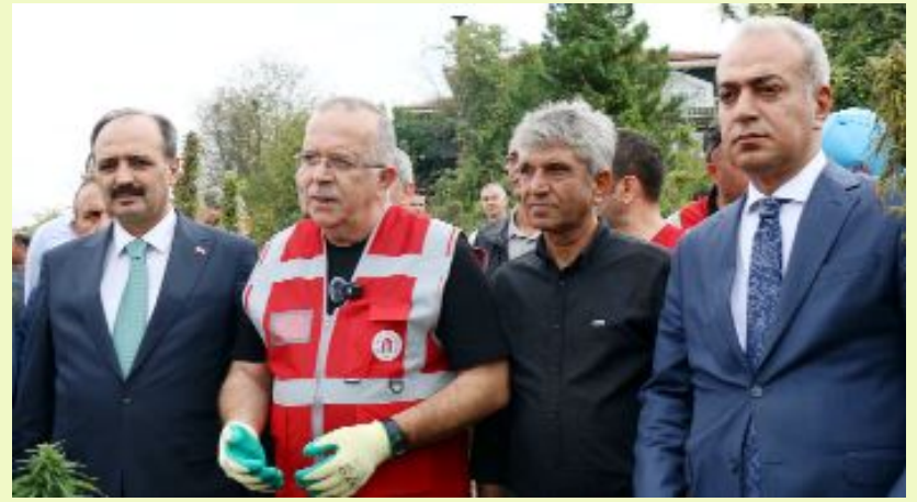
Mecitözü'ne bağlı Pınarbaşı köyünde 30 dönüm tarlaya ekimi yapılan kenevirin ilk hasadı yapıldı. Vali Yardımcısı Gürbüz ile Amasya Üniversitesi Rektörü Turabi de katıldı.