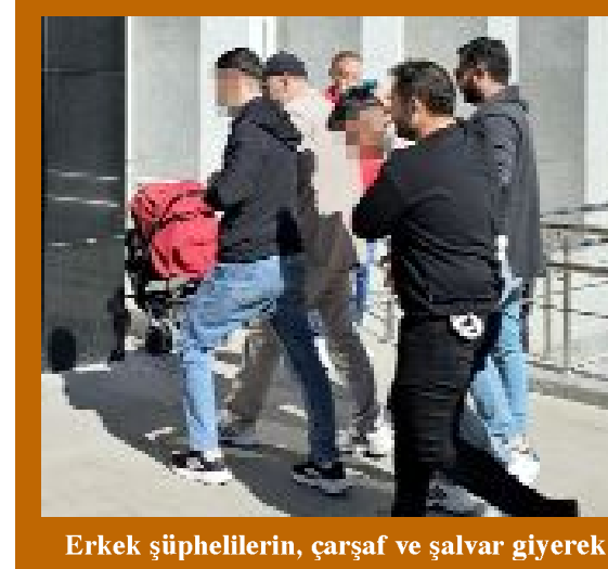
Erkek şüphelilerin, çarşaf ve şalvar giyerek 3 işyerini de kurşunladıkları belirlendi.

25 yıl cezası bulunan firari yakalandı •4'de