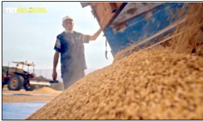
TRT Belgesel programında Kargı'da çeltik hasadı gündeme getirildi.