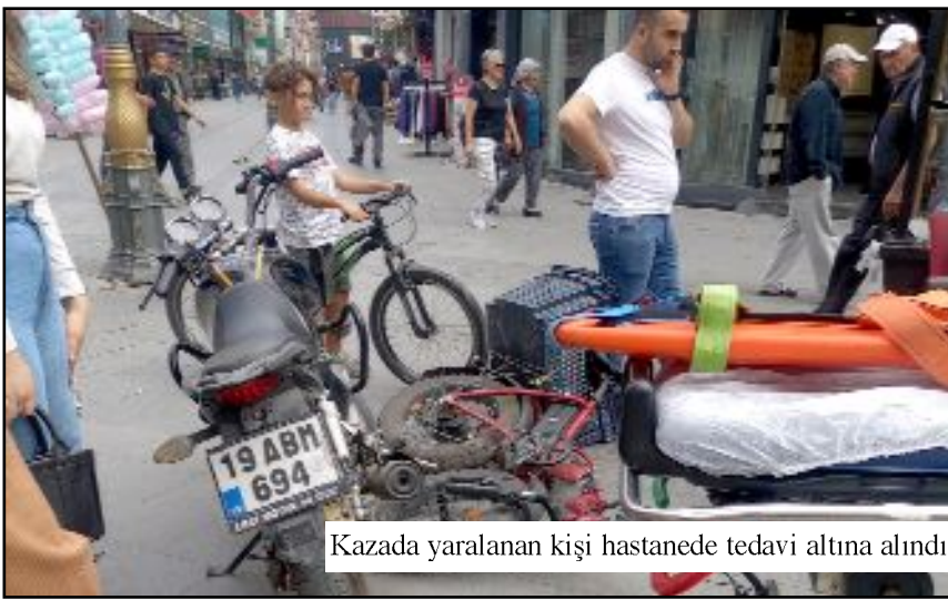
Kazada yaralanan kişi hastanede tedavi altına alındı.