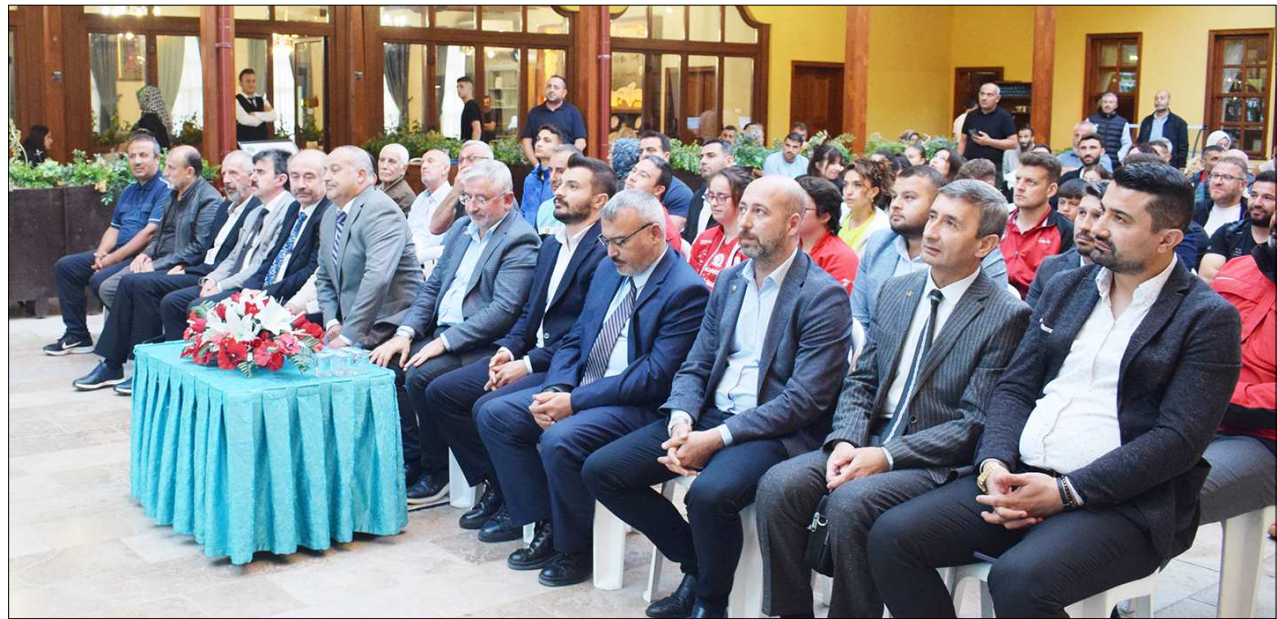
Veli Paşa Hanı'nda gerçekleşen sporun enleri törenine protokol üyeleri yoğun ilgi gösterdi.

Protokol konuşmaları ile başlayan törende 2023-2024 amatör spor sezonunda derece elde eden sporcular ve antrenörler ödüllendirildi. (Rifat KARA)