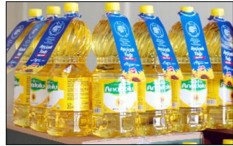
Çorum Belediyesi 3 bin litre yağ sosyal belediyecilik anlayışıyla ihtiyaç sahibi ailelere ulaştırmak üzere hazırladı.

"hiç boş arazi bırakılmaya çağız, ekilebilir tüm arazileri ekeceğiz" şeklinde talimatları olmuştu. Biz de bundan yola çıkarak 80 dönümlük belediye arazisine ayçiçeği ektik. Hasadın ardından ayçiçeğinden 3 bin litre yağ elde etmiş olduk. Bu yağlarımızda belirlenen ailelerin sofralarına ulaşacak. Bundan sonraki süreçte de belediyemize ait arazilerde ekim ve buradan elde edilen ürünleri de ihtiyaç sahipleriyle paylaşmaya devam edeceğiz" ifadelerine yer verdi. (Haber Merkezi)