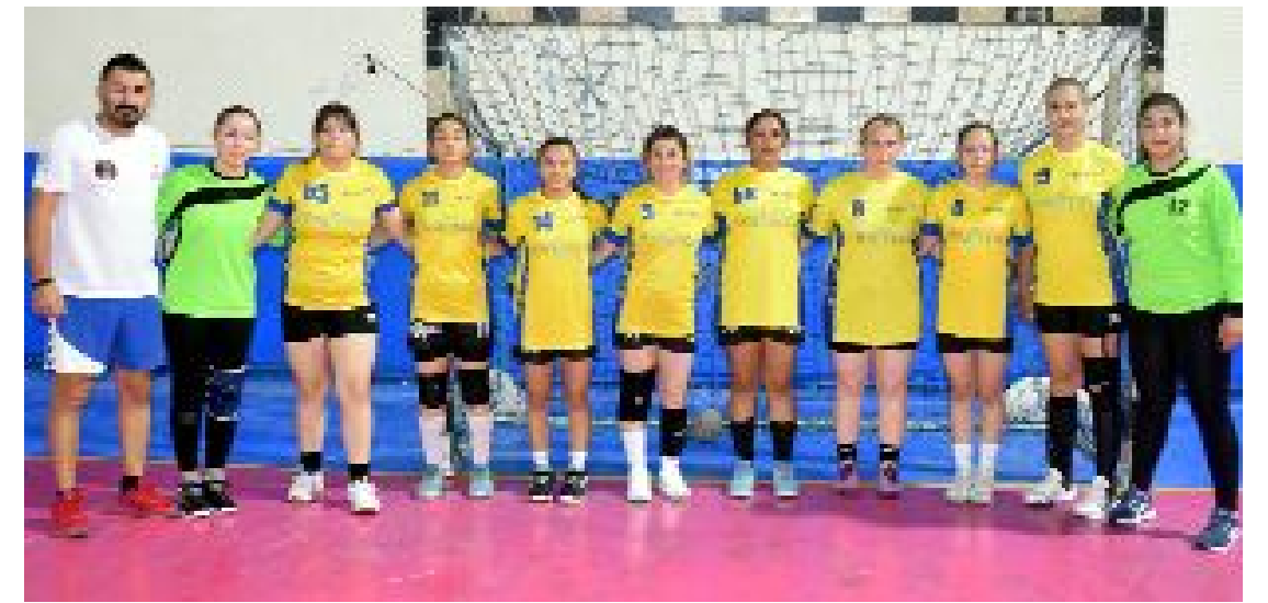
Çorum Gençlikspor geçen sezon da 2.Lig'de mücadele etmişti.

Normal sezonda ligden düşme ise olmayacak. Grup maçlarının fikstürü önümüzdeki günlerde açıklanacak. (Hüseyin AŞKIN)