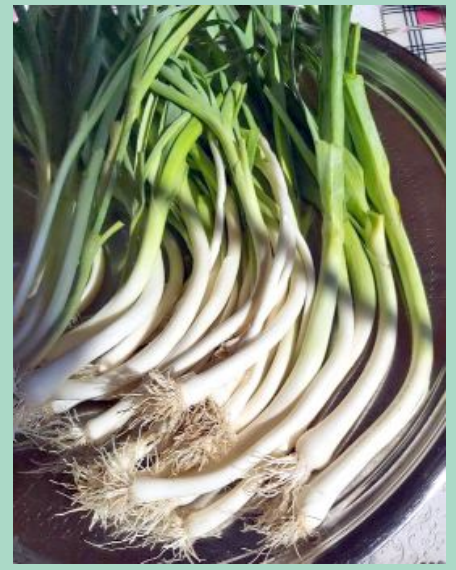
Kışlacık pırasası, Türk Patent ve Marka Kurumu'na tescillendi.

● Mecitözü'nün Kışlacık Köyü'nde üretilen pırasaya coğrafi işaret tescilli verildi. •2'de