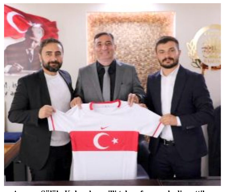
Arıcı ve Sülüük, Kalıpçı'ya milli takım forması hediye ettiler.

Arıcı, ziyarette, Çorum Barosu ile ASKF arasında spor alanında yapılabilecek işbirlikleri ile ilgili istişarelerde de bulduklarını söyledi. (Hüseyin AŞKIN)