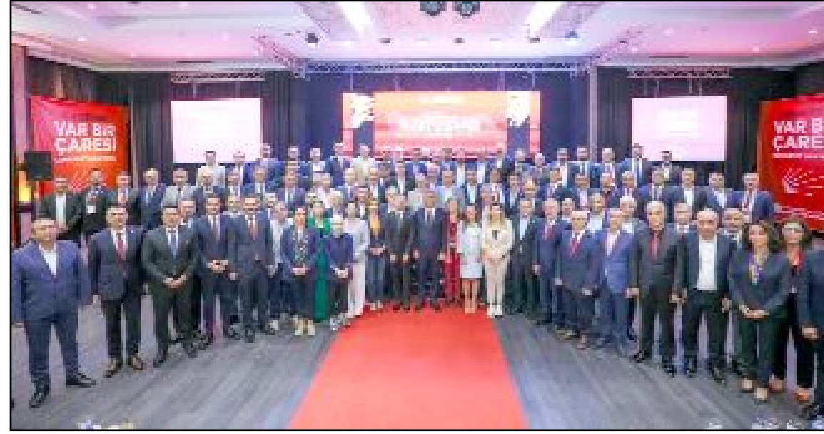
11-13 Ekim 2024 tarihleri arasında Bodrum'da 81 il başkanının katılımı ile düzenlenen toplantıda parti çalışmalarını değerlendirilerek, geleceğe yönelik hedef ve projeler belirlendi.