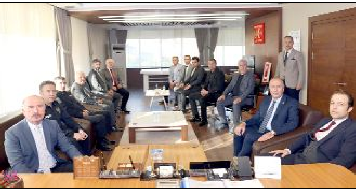
Çorum Valisi Ali Çalgan, Alaca ilçesinde ziyaret ve incelemelerde bulundu.