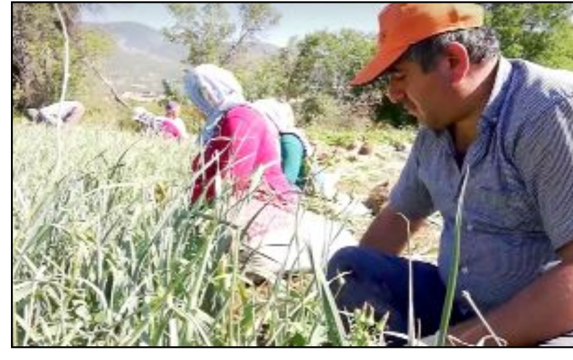
Mecitözü'nün Kışlacık Köyü'nde üretilen pırasaya coğrafi işaret tescili verildi.

"Köklü bir geçmişe sahip olan Kışlacık pırasasını, aromasının yüksek olması, gövdesinin yumuşak ve beyaz olması, toprağa gömülmesinden dolayı eğri şekilde olması ve içerdiği protein, kalsiyum, demir, magnezyum, sodyum miktarlarının yüksek olması benzerlerinden ayıran özelliklerdir. Kışlacık pırasası il ve ilçe ekonomisinde ve mutfak kültüründe önemli bir yer tutan sebzelere aittir." (AA)