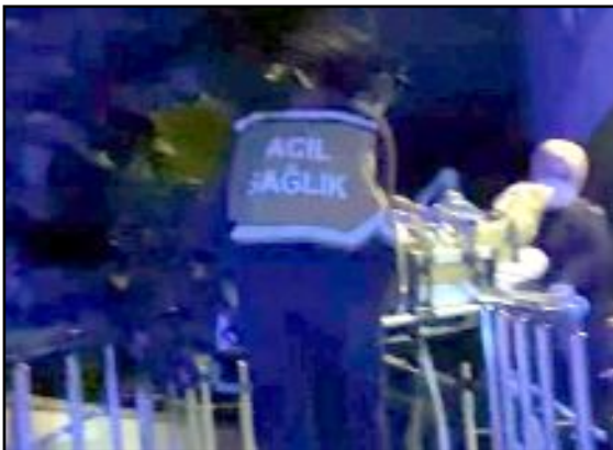
Bastonu ile yere vurarak yardım isteyen kadın hastaneye kaldırıldı.

Yaşlı kadın sağlık ekiplerince yapılan müdahalenin ardından Hitit Üniversitesi Erol Olçok Eğitim ve Araştırma Hastanesi'ne kaldırıldı. (Haber Merkezi)