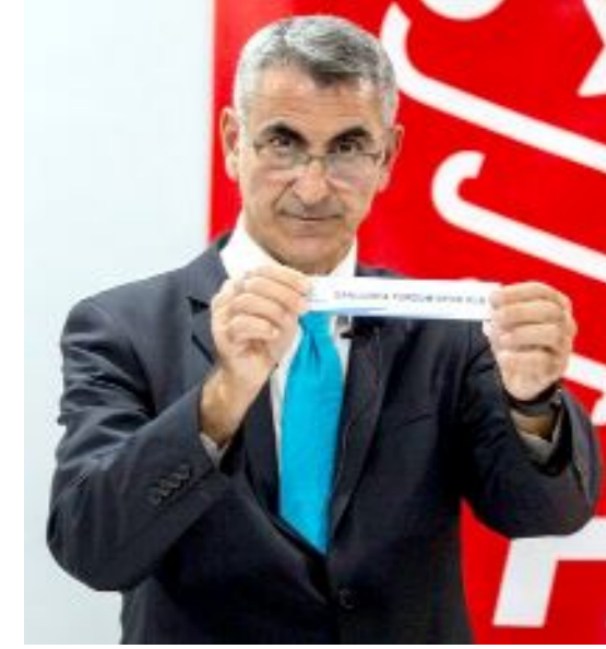
2024-2025 Sezonunun grupları kura ile belirlendi.