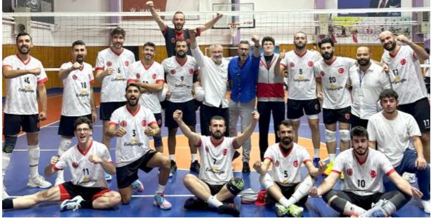
1921 Orduspor'u 3-1 yenen Sungurlu Belediyespor üçte üç yapıp maç fazlasıyla liderlik koltuğuna oturdu.

zarak skoru eşitledi. Üçüncü ve dördüncü sette oyunun üstünlüğünü tekrar eline geçiren Çorum'un efeleri üçüncü seti 25-21, dördüncü seti de 25-12 kazanarak maçtan 3-1 galip ayrıldı. Bu sonucun ardından puanını 8 yapan Çorum'un efeleri maç fazlasıyla liderlik koltuğuna otururken, ev sahibi Orduspor ise 3 puanda kalarak haftayı sekizinci sırada kapattı. (Rifat KARA)