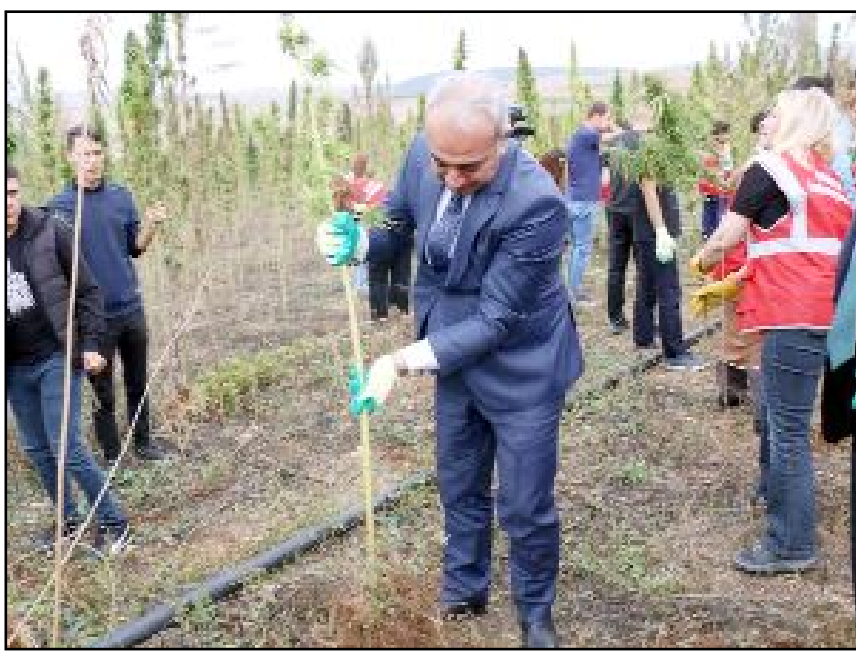
Mecitözü Pınarbaşı Köyü'nde dikimi yapılan kenevirin ilk hasadı yapıldı.