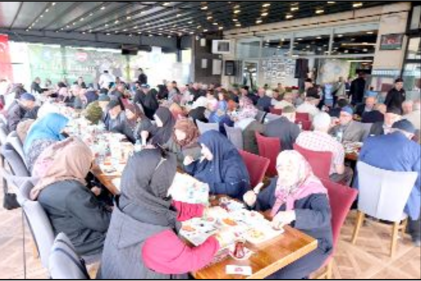
Millet Bahçesi'nde gerçekleştirilen programa mahalle sakinlerinin yanı sıra mahalle muhtarları da katıldı.