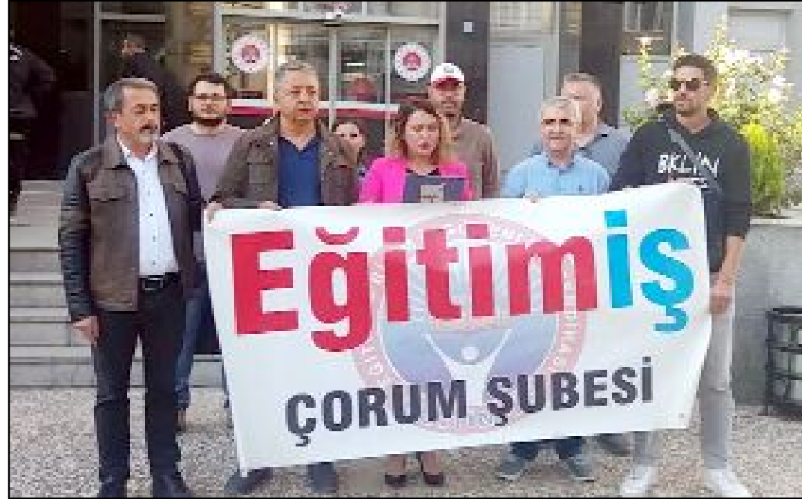
Eğitim-İş Çorum Şubesi, TBMM Başkanı Numan Kurtulmuş'un Anayasa'nın 3. maddesi hakkındaki sözleri nedeniyle suç duyurusunda bulundu.