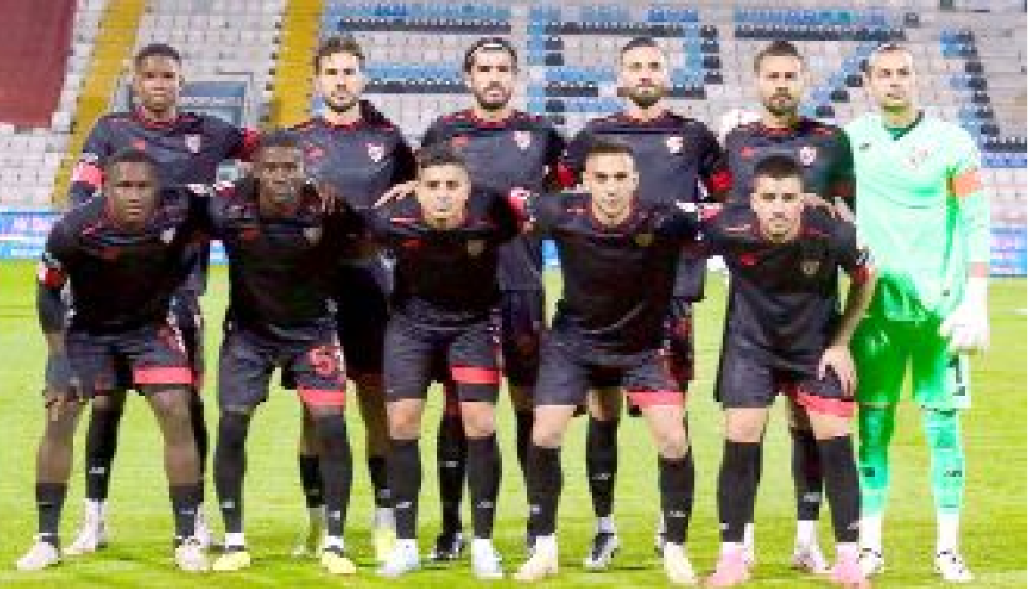
Boluspor sahasında oynadığı 4 maçta 2 galibiyet, 2 yenilgi olarak 6 puan toplarken, 5 gol atıp 4 gol yedi.

Trendyol Türkiye 1.Futbol Ligi'nin 9.hafta maçında 20 Ekim Pazar günü Boluspor'la karşılaşacak olan Ahlatçı Çorum FK, profesyonel liglerde 423'üncü kez puan maçına çıkacak. Profesyonel futbol liglerindeki 13'üncü sezonunu geçiren Ahlatçı Çorum FK bugüne kadar 422 kez puan maçına çıktı. Kırmızı-siyahlı ekip bu maçlarda 3'ü hükmen olmak üzere 183 galibiyet, 115 beraberlik, 124 yenilgi alarak 664 puan toplarken, 606 gol atıp 443 gol yedi. 422 maçın 210'unu sahasında oynayan Ahlatçı Çorum FK bu karşılaşmalarda ise 108 galibiyet, 57 beraberlik, 45 yenilgi aldı ve 381 puan topladı. Rakip fileleri 346 kez havalandıran kırmızı-siyahlılar kalelerinde ise 201 gol gördüler. Ahlatçı Çorum FK, deplasmanda çıktığı 212 maçta ise 75 galibiyet, 58 beraberlik, 79 yenilgi aldı ve 283 puan topladı. Bu maçlarda 260 gol atan kırmızı-siyahlı takım kalesinde 242 gole engel olamadı. (Hüseyin AŞKIN)