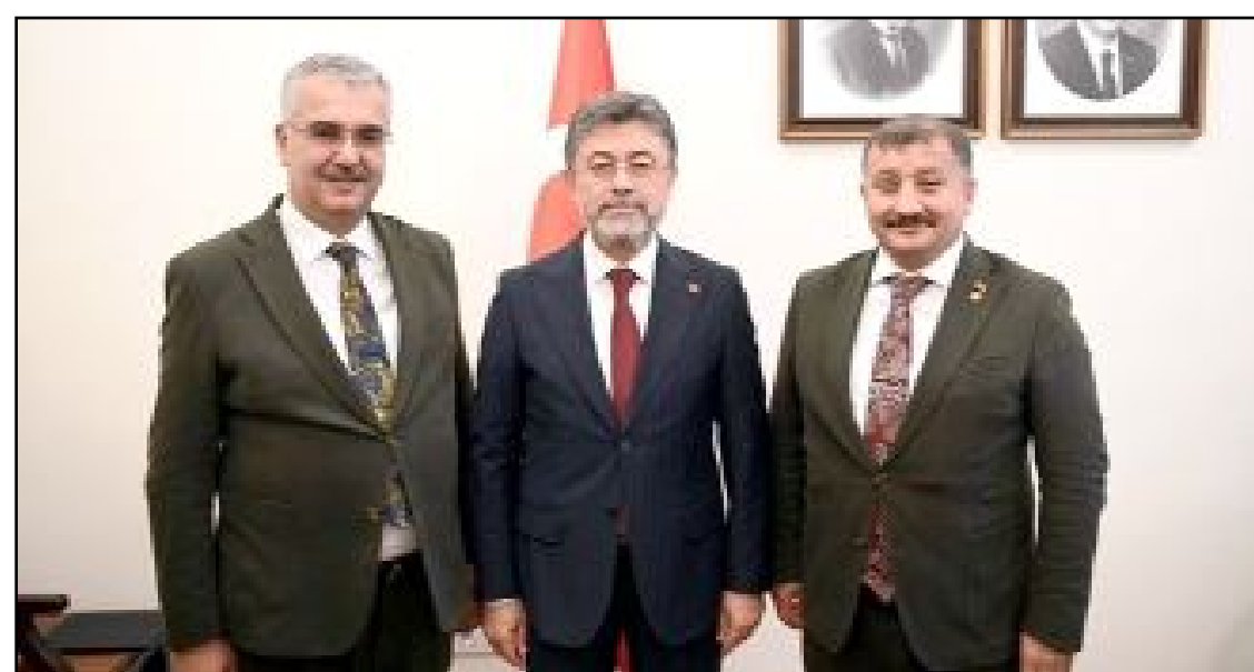
Milletvekili Ahlatcı ve İl Başkanı Günay, Tarım Bakanı Yumaklı ile buluştu.