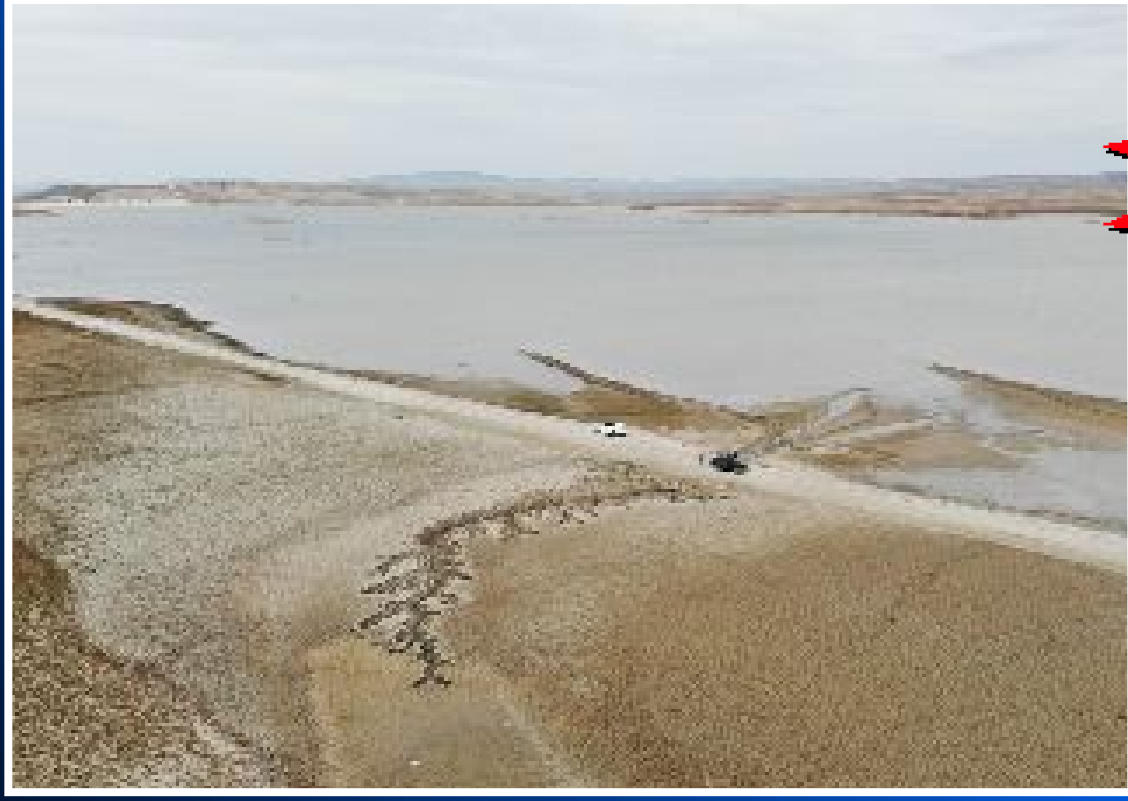
161 milyon metreküp kapasiteli Koçhisar Barajı'nda 5,7 milyon metreküp su kaldı.