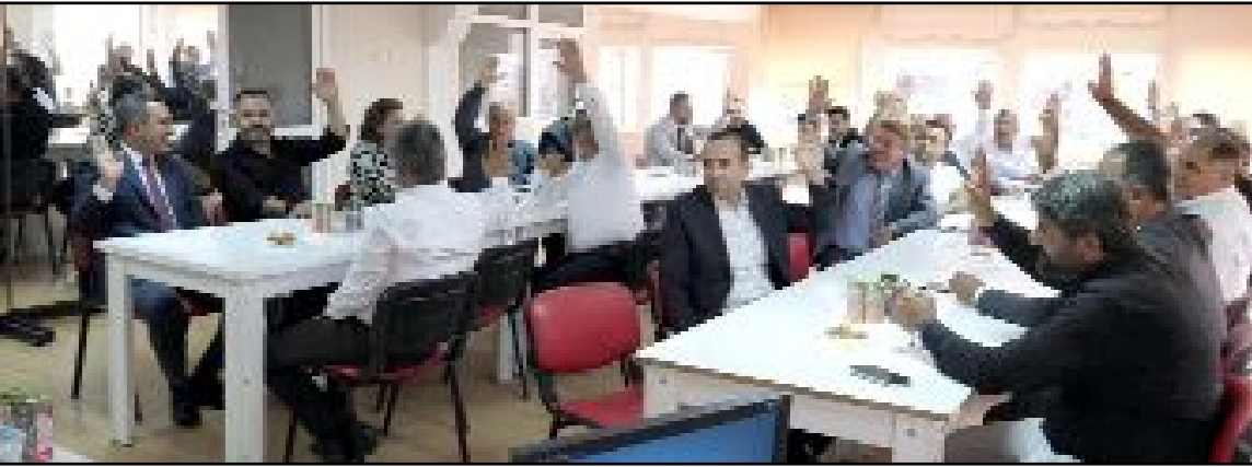
Sungurlu Kent Konseyi'nin olağan genel kurulu yapıldı.