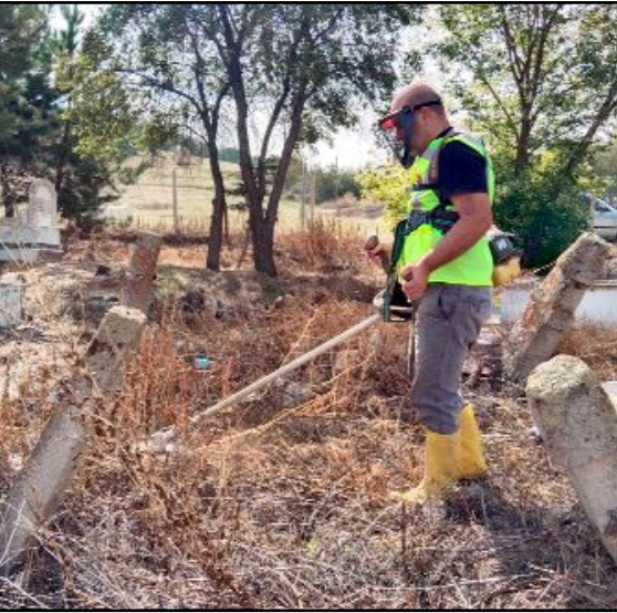
ÇOSTOG yönetici ve gönüllüleri Tarhan Köyü mezarlığını temizleyerek bayrak direği dikti.

Çorum Sivil Toplum Gönüllüleri Derneği (ÇOSTOG), köy mezarlıklarını temizleyip Türk bayrağı dikmekle vatandaşların gönülleri kazanıyor.