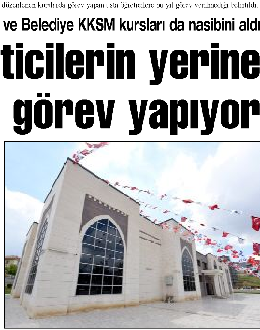
Belediye Engelli Eğitim Merkezi'nde de usta öğreticilerin yerine gönüllüler eğitim vermeye başladı.