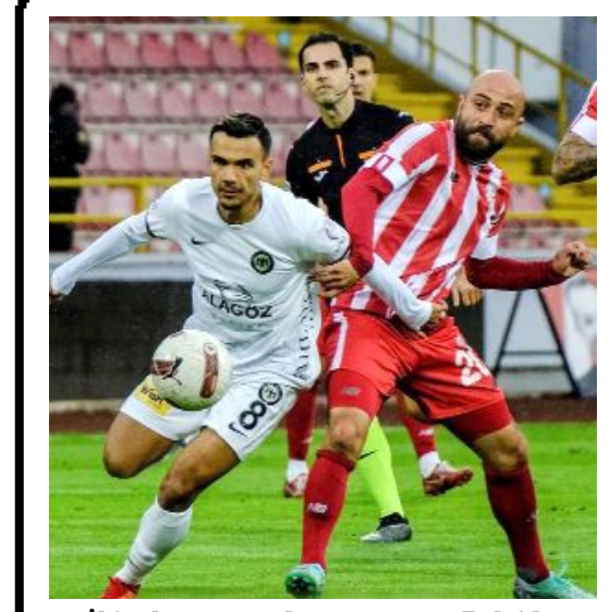
İki takım arasında geçen sezon Bolu'da oynanan maçtan bir enstantane.