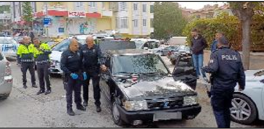
Şüphe üzerine durdurulan araçta uyuşturucu ele geçirilirken, 2 kişi gözaltına alındı.