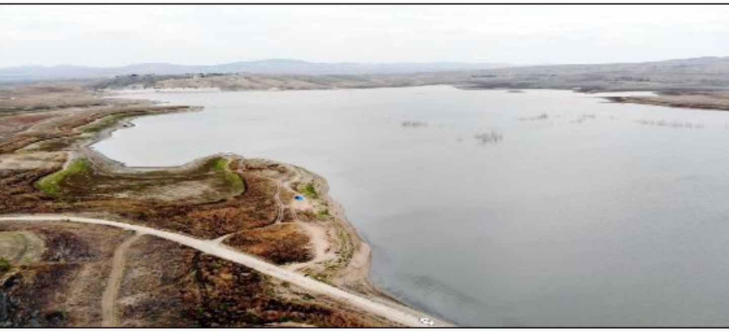
Baraj gölünde su seviyesini, düşmesiyle birlikte eski Yozgat-Alaca karayolu gün yüzüne çıktı.