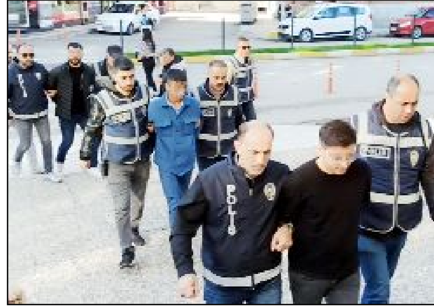
Gözaltına alınan şüpheliler, Emniyet'teki işlemlerinin tamamlanmasının ardından Adliye'ye sevk edildi.

lanmasının ardından Adliye'ye sevk edildikten sonra tutuklanarak cezaevine gönderildi, (İHA)