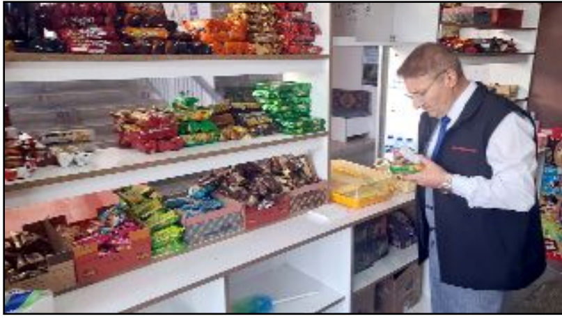
Sungurlu İlçe Tarım Müdürlüğü ekipleri okulları ziyaret ederek kantinlerdeki ürünleri inceledi.