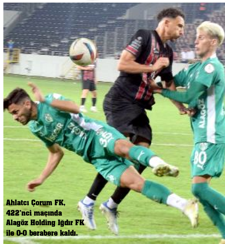
Ahlatçı Çorum FK, 422'nci maçında Alagöz Holding Iğdır FK ile 0-0 berabere kaldı.