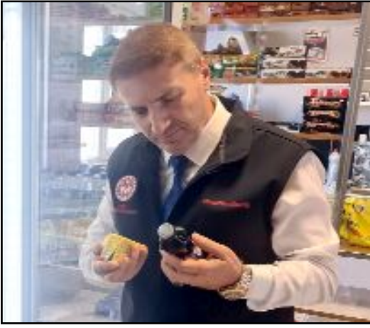
Ekipler gıda maddelerinin saklanma şartları ve son kullanma tarihleri gibi kriterleri inceledi.

Yetkililer, gıda güvenliğinin önemini vurgulayarak, "Güvenli gıda, sağlıklı gelecek" sloganıyla çalışmalarına devam edeceklerini belirttiler. (İHA)