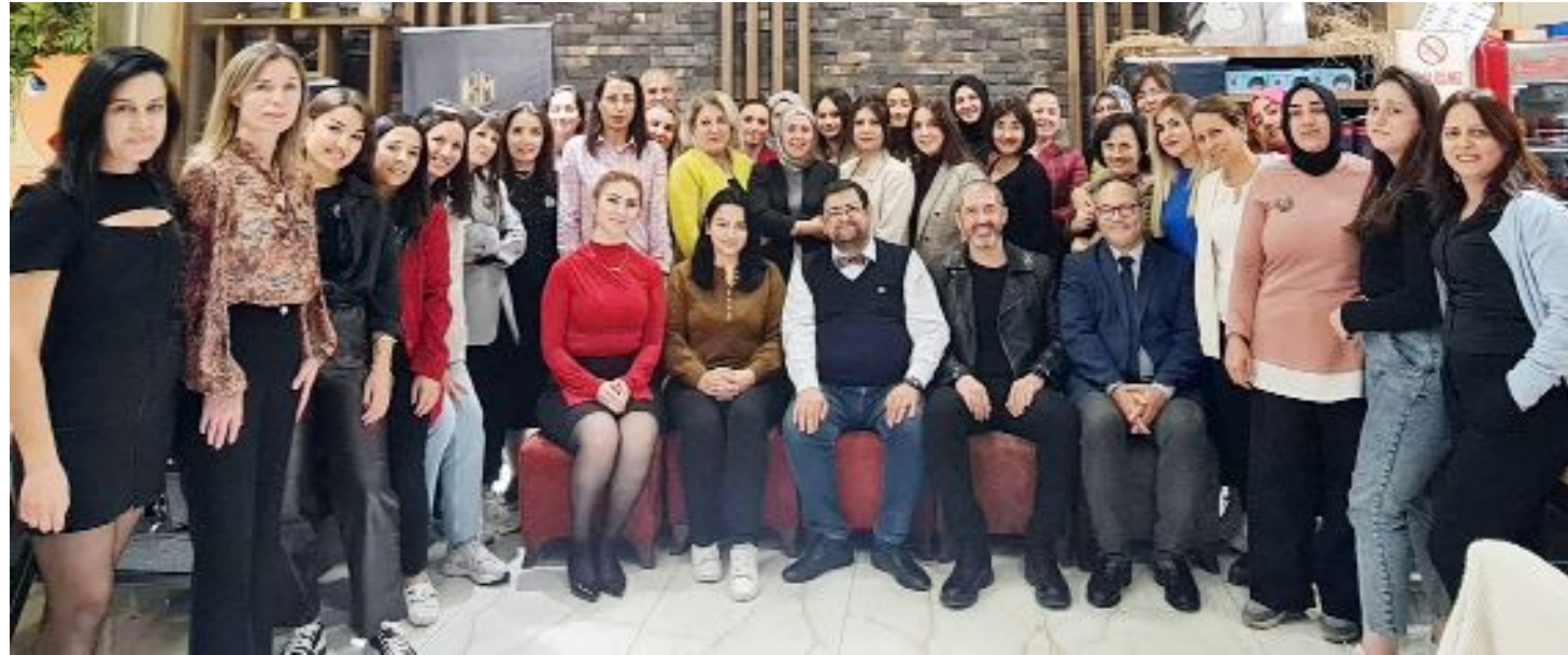
Kadın muhasebeciler ve toplantı konukları... Eğitim çalışması, meslek profesyonellerinin yapay zeka teknolojilerini etkin bir şekilde kullanarak iş süreçlerini optimize etmelerine ve mesleki becerilerini bir üst seviyeye taşımalarına olanak tanıyan önemli bir fırsat oldu.