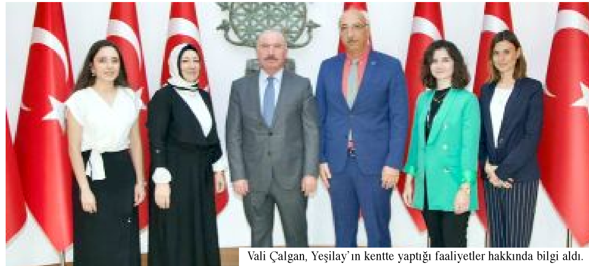
Vali Çalgan, Yeşilay'ın kentte yaptığı faaliyetler hakkında bilgi aldı.

© Türkiye Yeşilay Cemiyeti Çorum Şube Başkanı Dr. İsmail Türker Ejder ve beraberindeki heyet, Çorum Valisi Ali Çalgan'a hayırlı olsun ziyaretinde bulundu. Ziyarette Vali Çalgan'a Yeşilay'ın kentte yaptığı faaliyetler hakkında bilgi verildi. (Haber Merkezi)