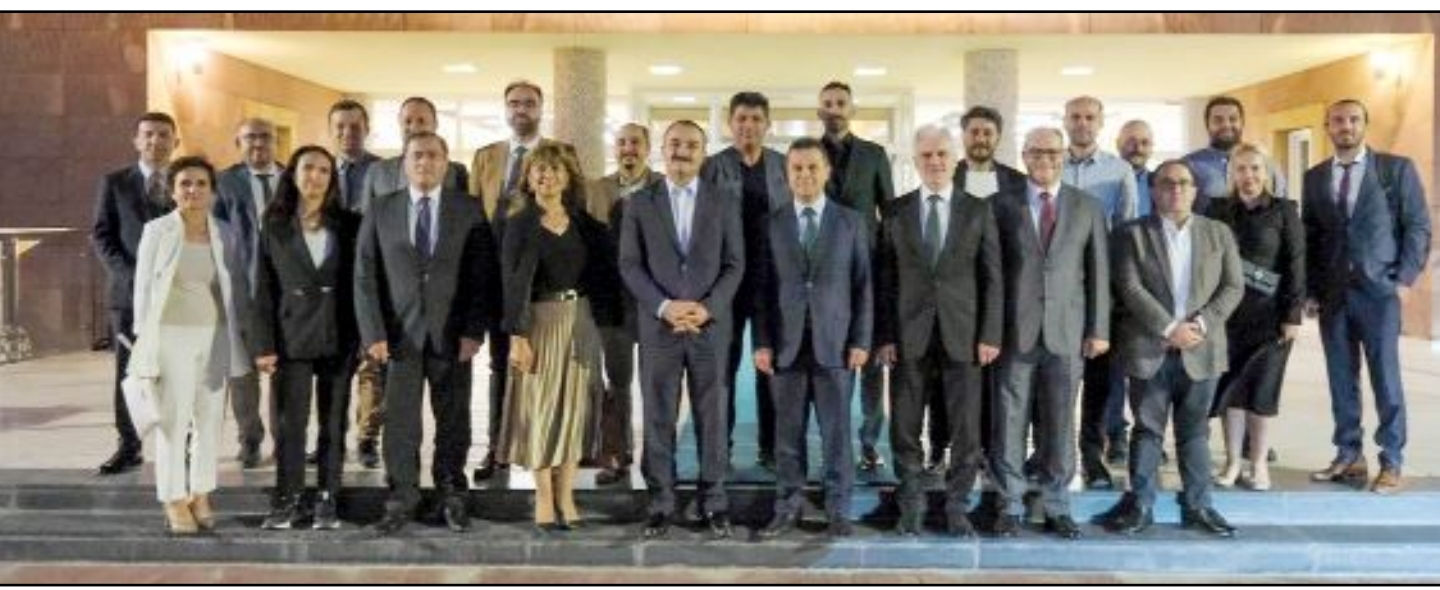
Hitit Üniversitesi ve Kastamonu Üniversitesi, başta ihtisaslaşma alanları olmak üzere akademik ve Ar-Ge odaklı işbirliklerini değerlendirmek üzere ikinci kez toplandı.