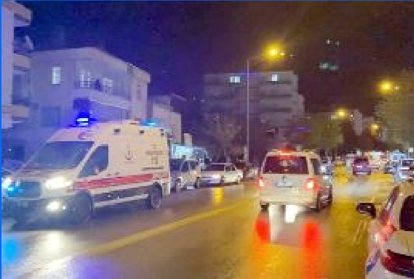
İhbar üzerine olay yerine polis ve sağlık ekipleri sevk edildi.

● Çorum'da S.B. ile eski sevgilisinin babası İ.Y. arasında Ata Caddesi'nde tartışma çıktı. ● Kavgaya dönüşen olayda S.B. bıçakla, yanındaki arkadaşı Ö.B. silahın kabzasıyla, İ.Y. ve Y.Y. ise darbedilerek yaralandı. ●4'de