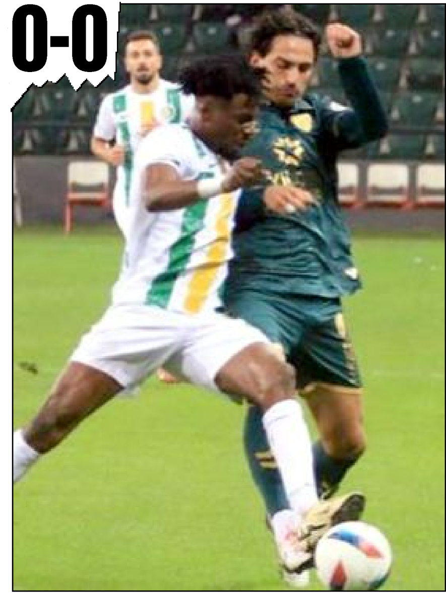
Kocaelispor-Şanlıurfaspor maçından bir enstantane.