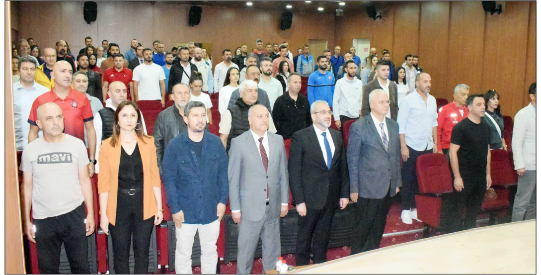
Toplantı, Hayrettin Karaman Kız Öğrenci Yurdu'nda gerçekleşti.