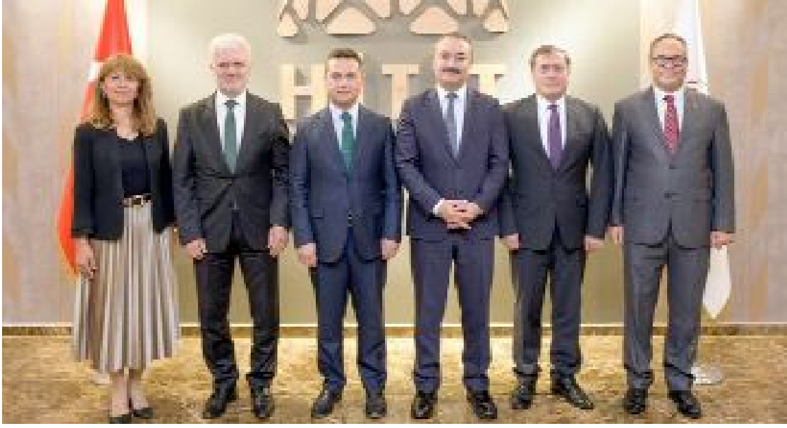
Hitit Üniversitesi ve Kastamonu Üniversitesi, başta ihtisaslaşma alanları olmak üzere akademik ve Ar-Ge odaklı işbirliklerini değerlendirmek üzere ikinci kez toplandı.