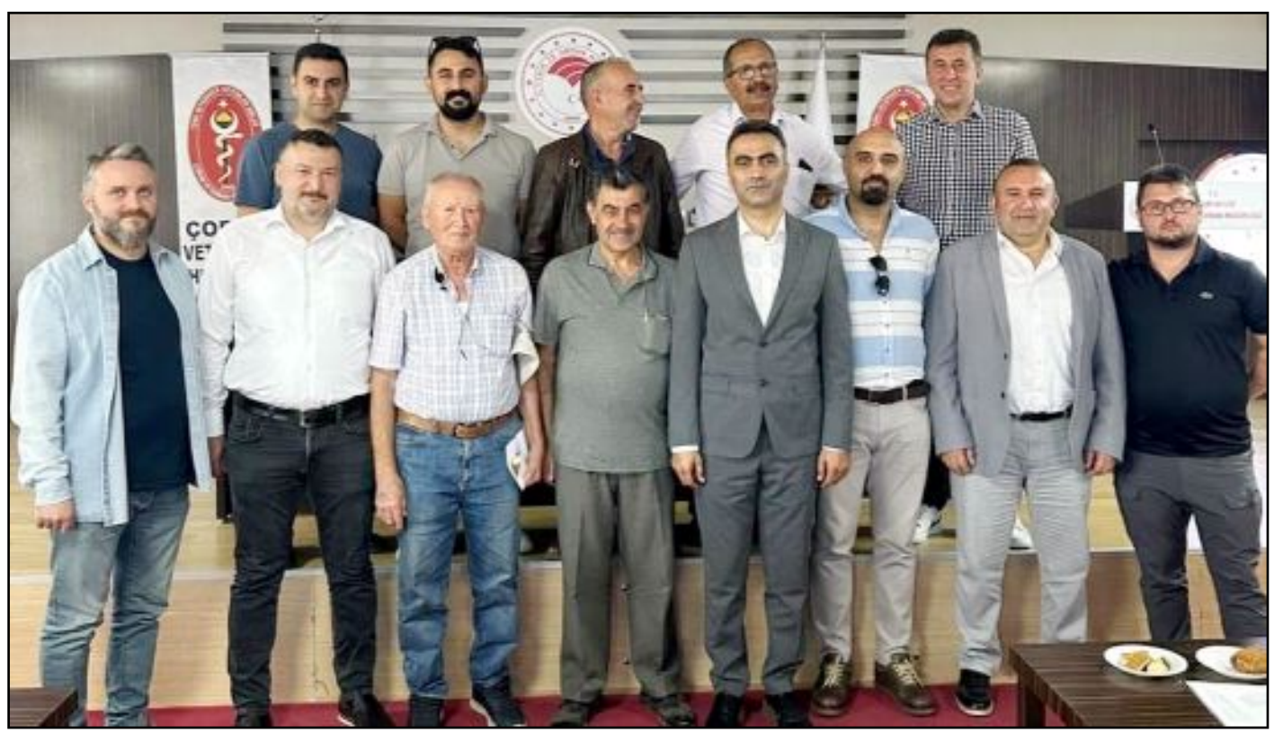
Genel Kurul'a katılan veteriner hekimler toplu halde...