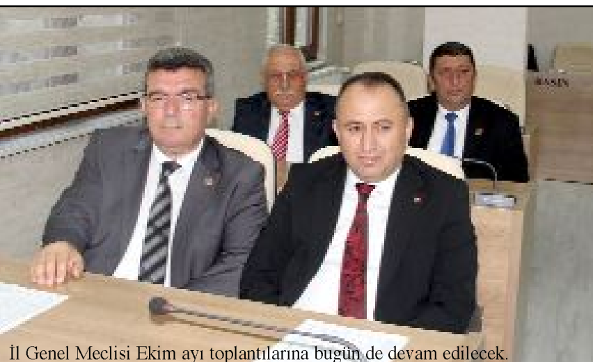
İl Genel Meclisi Ekim ayı toplantılarına bugün de devam edilecek.