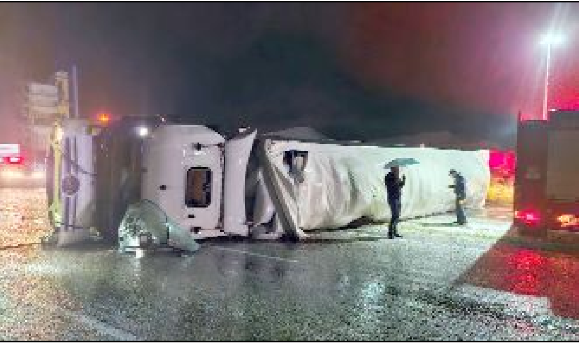
Kaza nedeniyle trafik Çorum-Alaca karayolunda tek şeritten kontrollü olarak verildi.