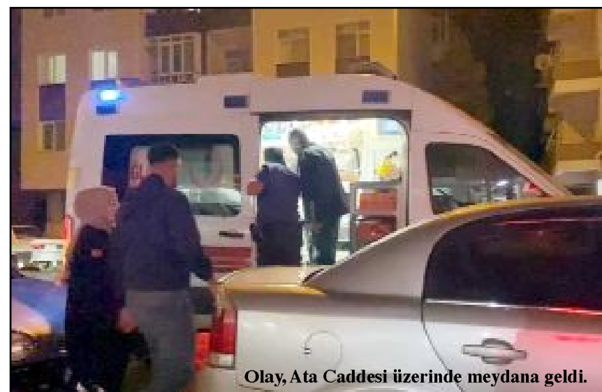
Olay, Ata Caddesi üzerinde meydana geldi.

Yaralı S.B. ve Ö.B. sağlık ekiplerinin müdahalesinin ardından Hitit Üniversitesi Erol Olçok Eğitim ve Araştırma Hastanesine, İ.Y. ile Y.Y. ise kentte bulunan bir özel hastaneye kaldırıldı. (AA)