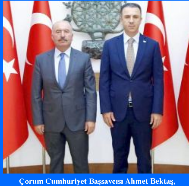
Çorum Cumhuriyet Başsavcısı Ahmet Bektaş, Vali Çalgan ile bir araya geldi.