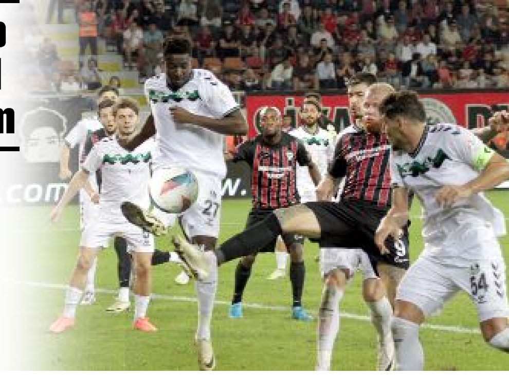
Ahlatıcı Çorum FK, özellikle sahasında Sakaryaspor'la 1-1 berabere kaldığı maçta tüm istatistikleri altüst etmişti.

Kırmızı-siyahlı ekip, maç başına top kaybı kategorisinde, 10,0 ile en çok top kaybeden ikinci takım olurken, 11,1 top kaybı ile İstanbulspor zirvede yer alıyor. Ümraniyespor da 9,4 top kaybı ile istatistik sıralamada üçüncülük basamağında bulunuyor. (Hüseyin AŞKIN)