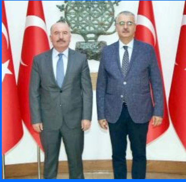
Milletvekili Yusuf Ahlatcı, Vali Ali Çalgan'ı ziyaret etti.