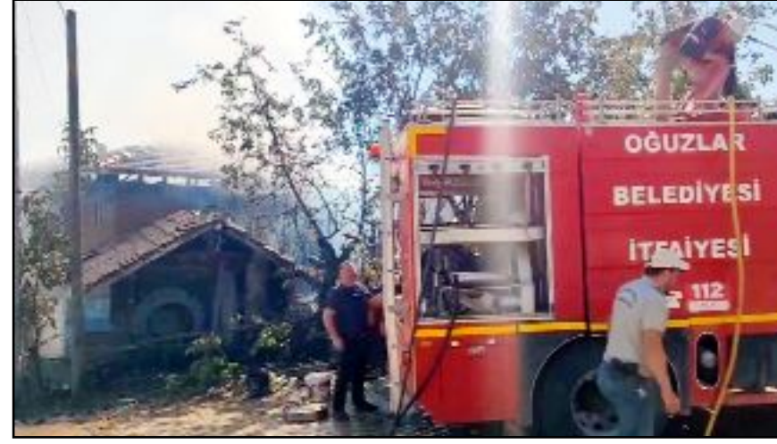
Evin yanındaki samanlığa da sıçrayan yangın, Oğuzlar Belediyesi itfaiye ekiplerinin müdahalesiyle söndürüldü.

ce mağdur aileye yardımda bulunulacağı belirtildi. (AA)