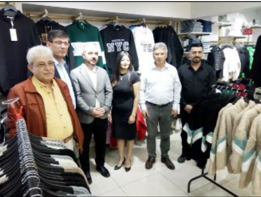
Konuklar, Trend Giyim'de...