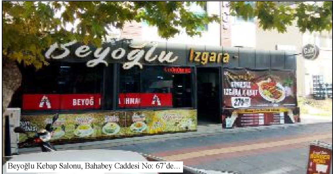
Beyoğlu Kebap Salonu, Bahabey Caddesi No: 67'de...