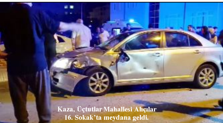
Kaza, Üçtutlar Mahallesi Ahşarlar 16. Sokak'ta meydana geldi.

Çorum'da otomobil ile motosikletin çarpışması sonucu 4 kişi yaralandı.