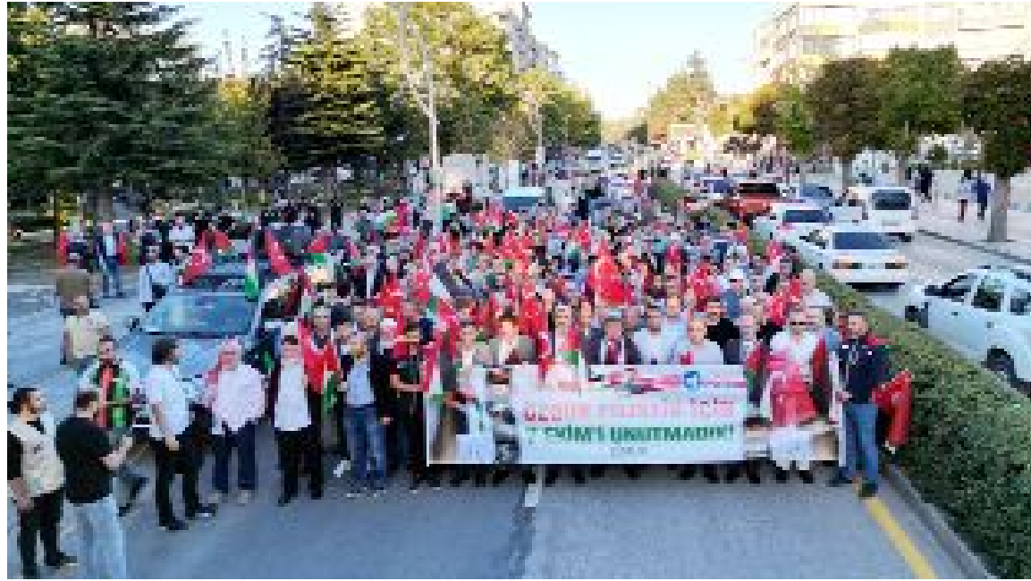
Çorum’da Filistin Platformu tarafından İsrail’in 7 Ekim’den bu yana bir yıldır süren Filistin’deki saldırılarını protesto etmek amacıyla “Soykırma İsyan Filistin’e Destek Yürüyüşü” düzenledi.