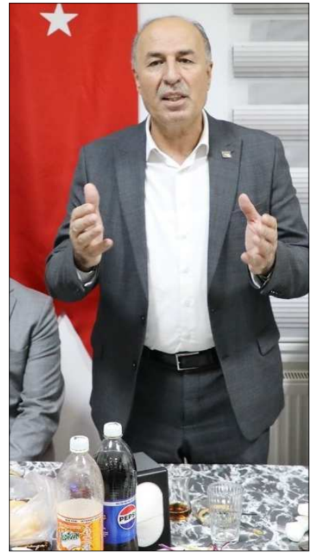
Alaca Belediye Başkanı Şerif Arslan

1. Amatör Küme'de mücadele edecek olan Alaca Belediyespor'da yeni yönetim kurulu, Alaca Belediye Başkanı Şerif Arslan ile bir araya geldi. Alaca Belediyespor vefa gecesi adına bir araya gelen eski başkan, futbolcu ve yöneticiler hem geçmişini yad ettiler hem de yeni sezonla ilgili görüş alışverişinde bulundular. Yemeğin ardından bir konuşma yapan Alaca Belediye Başkanı ve eski kulüp başkanlarından Şerif Arslan ilçede sporun gelişimi için ellerinden gelen her türlü desteği vereceklerini belirterek, Alaca Belediyespor'un daha başarılı olması için üzerlerine düşeni yapacaklarını belirterek, yeni başkan ve yönetimine başarılar diledi.