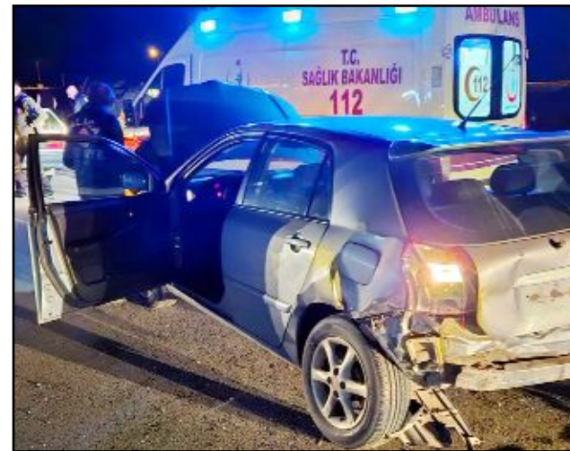
Kaza, Alaca'nın Çorum Caddesi Sanayi Kavşağı'nda meydana geldi.

Çorum'un Alaca ilçesinde iki otomobilin çarpıştığı kazada 4 kişi yaralandı.