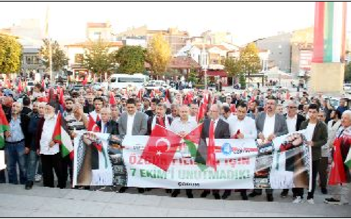
Filistin Platformu tarafından İsrail'in 7 Ekim'den bu yana bir yıldır süren Filistin'deki saldırılarını protesto etmek amacıyla "Soykırma İsyan Filistin'e Destek Yürüyüşü" düzenledi.