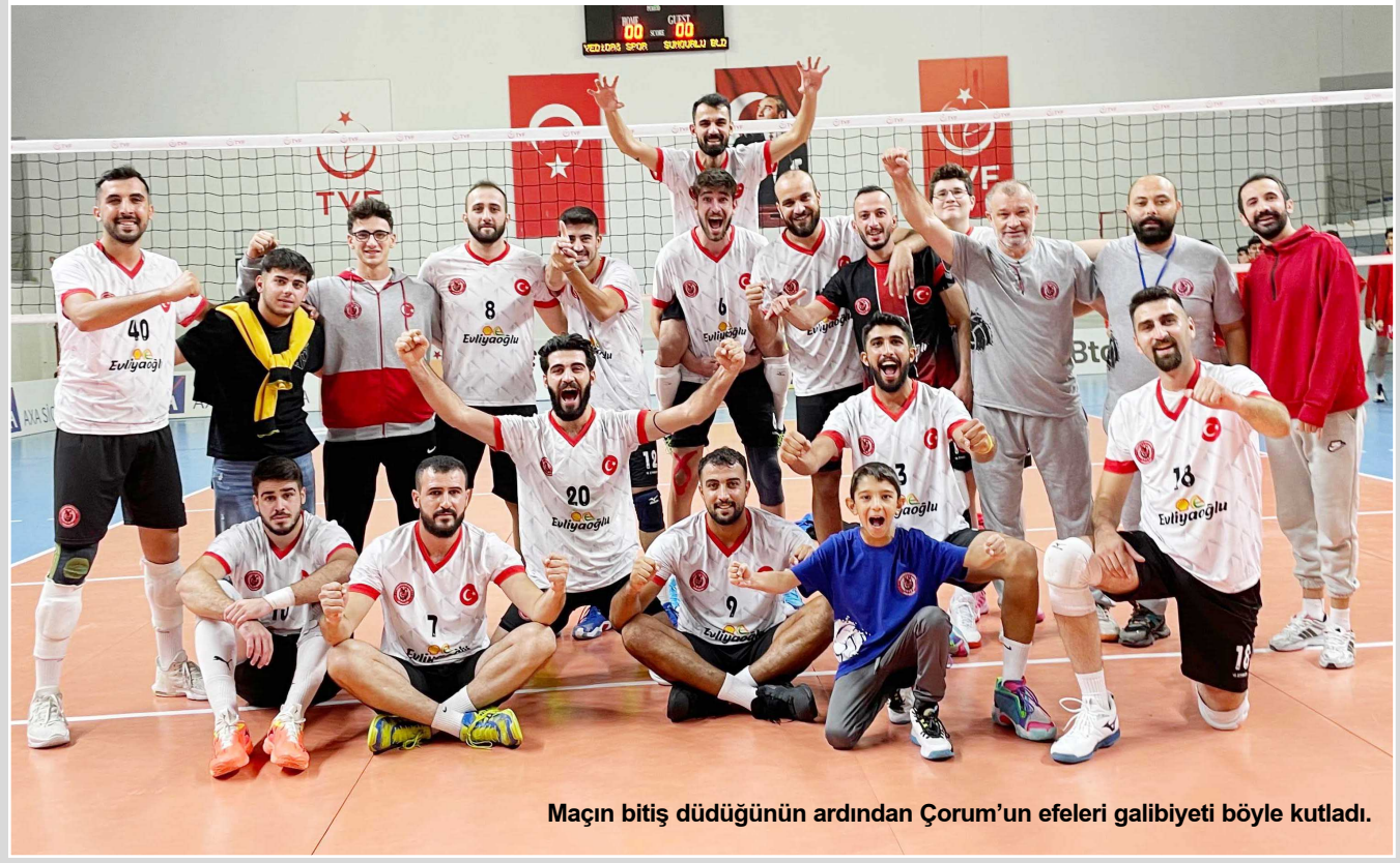
Maçın bitiş düdüğünün ardından Çorum'un efeleri galibiyeti böyle kutladı.