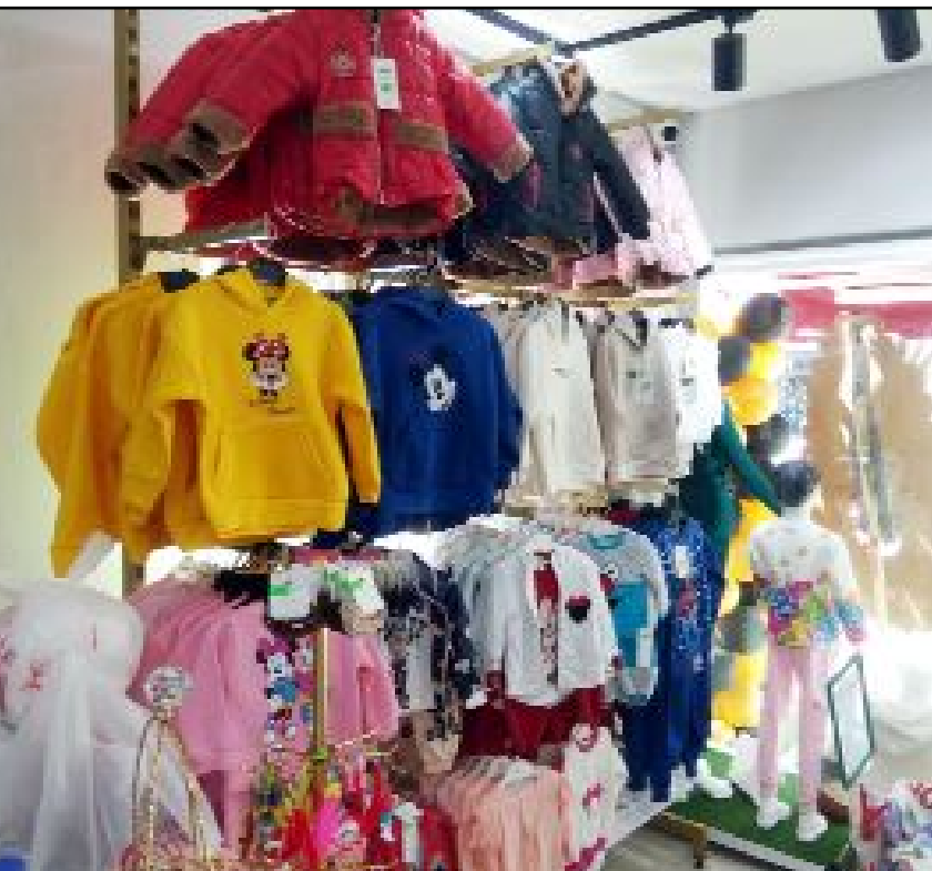
Çocuk giyiminde kalite ve uygun fiyat...