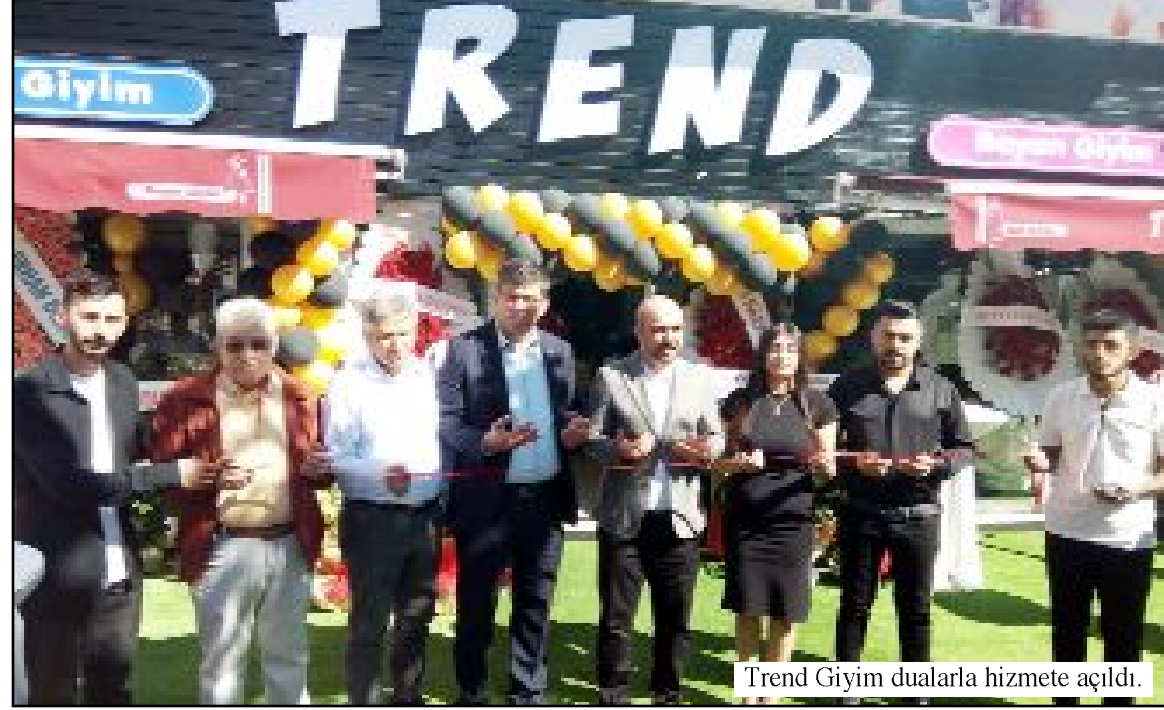
Trend Giyim dualarla hizmete açıldı.

● Trend Giyim'de, kot pantolon, pijama takımı, bay-bayan sweet yanında çocuk giyiminde de çok uygun fiyatlar uygulanıyor. (Aliye ÖNCEL)