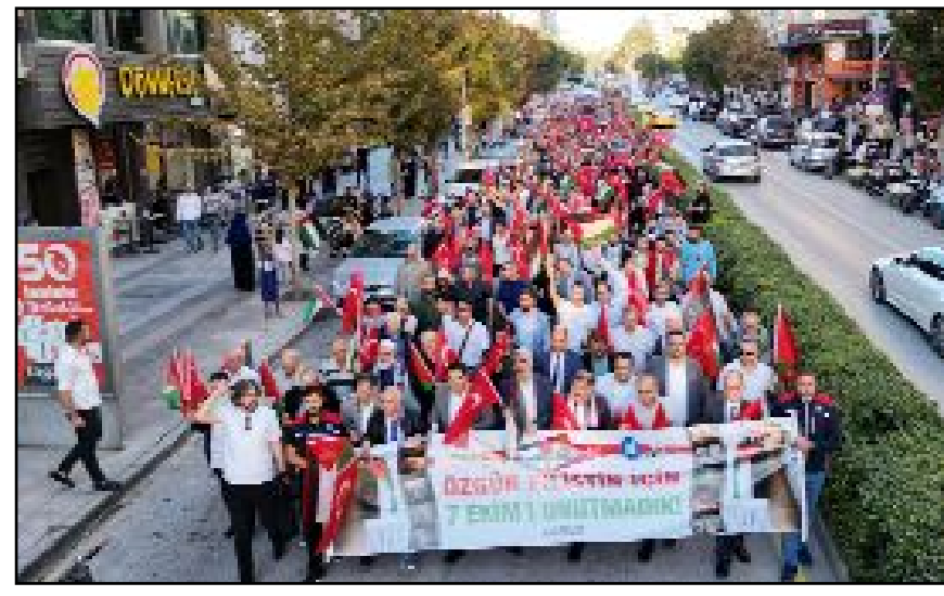
Valilik önünden başlayan yürüyüşe katılanlar İsrail'i lanetlerken Filistin'e destek verdi.