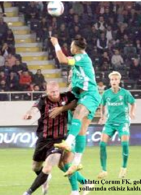
Ahlatcı Çorum FK, gol yollarında etkisiz kaldı.