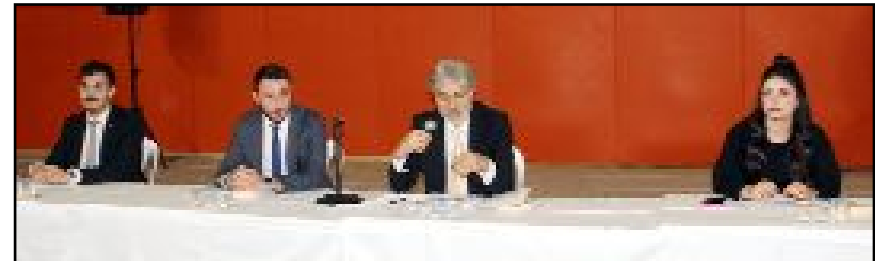
Çorum Barosu'nun Olağan Genel Kurulu, Atatürk Spor Salonu'nda gerçekleştirildi.