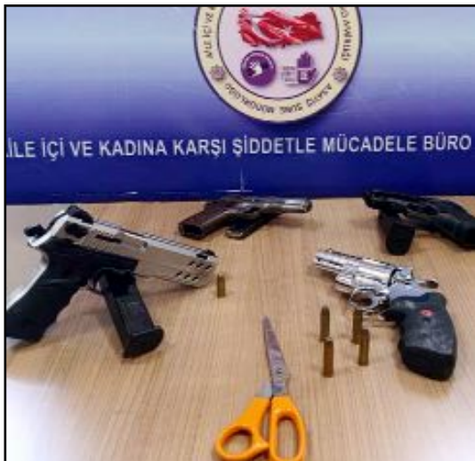
İLE İÇİ VE KADINA KARŞI ŞİDDETLE MÜCADELE BÜRO

Asayiş Şube Müdürlüğüne bağlı birimlerce yapılan denetimlerde 42 umuma açık mekan, 23 kahvehane/kıraathane, 18 kafe, 21 çay ocağı, 9 oyun salonu ve 11 otopark kontrol edilirken, trafik ekipleri tarafından kontrol edilen bin 478 araçtan 18 araca 232 bin 458 TL idari para cezası uygulandı. Teknik noksanları bulunan 3 araç ise trafikten men edildi. (İHA)