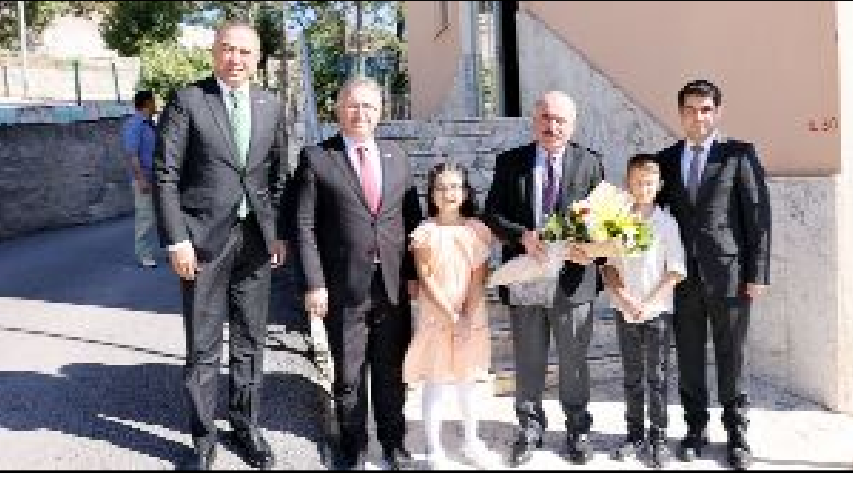
Vali Ali Çalgan, Oğuzlar ilçesinde bir dizi ziyaret ve temaslarda bulundu.

Çorum Valisi Ali Çalgan, ilk ilçe ziyaretini ceviz diyarı olarak bilinen Oğuzlar'a yaptı.