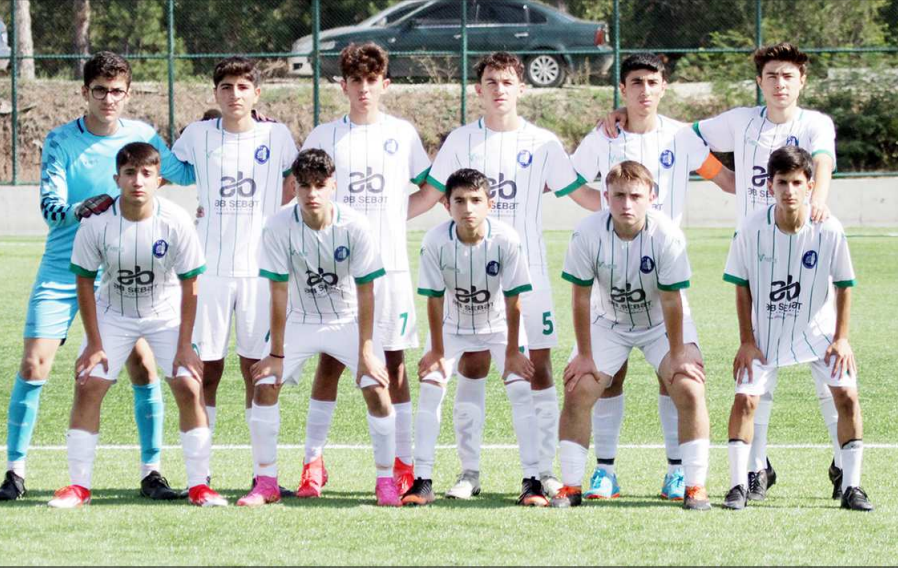
A grubunda lider durumda bulunan M.Sinanspor bu hafta ilk puan kaybını yaşadı.

puanlı iki takımdan Vefaspor ikinci, İskilipgücü ise üçüncü sırada yer aldı. B grubunda ise Çorum Anadolu FK 4'de 4 yaparak 12 puanla birinci, 6 puanlı 3 takımdan Osmaniçik Belediyespor ikinci, Çorumsport üçüncü, Buharaspör ise dördüncülüğü elde etti. (Rifat KARA)