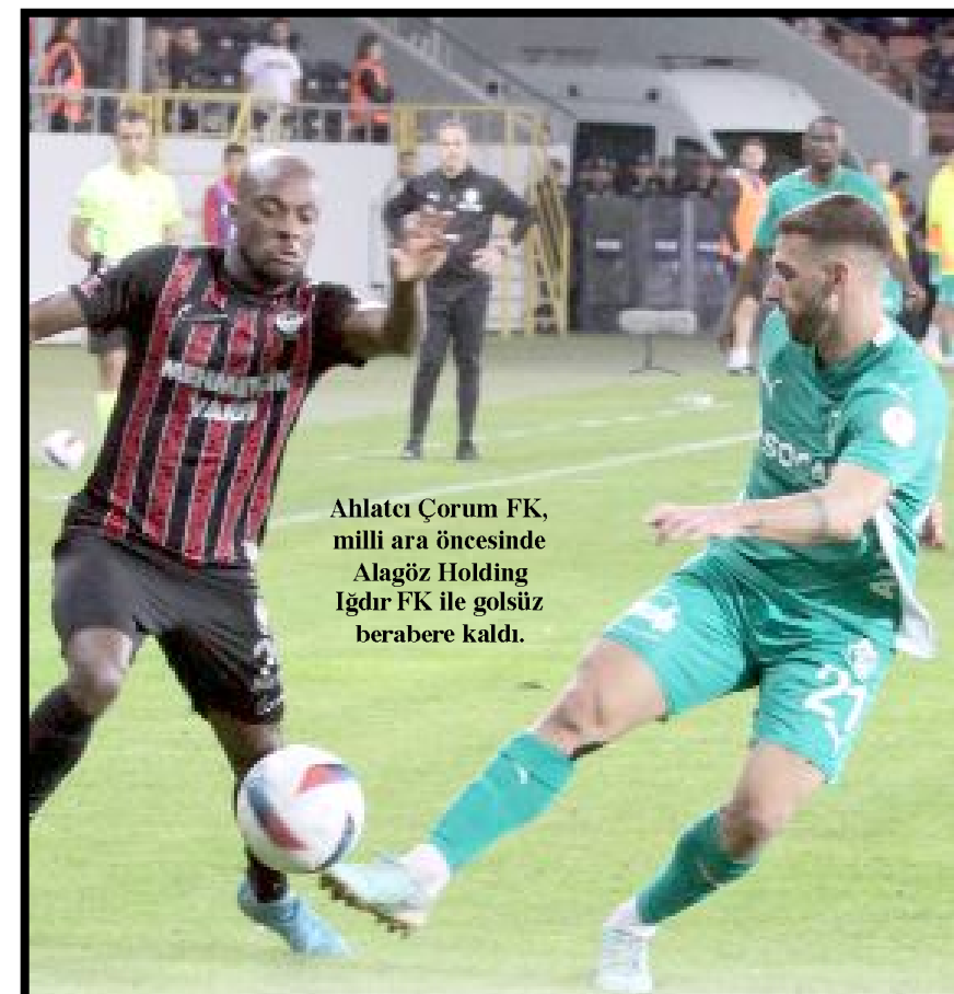
Ahlatıcı Çorum FK, milli ara öncesinde Alagöz Holding İğdir FK ile golsüz berabere kaldı.

Çorum Futbol Kulübü'nü de tebrik ederim. Onlar da iyi mücadele ettiler. Bundan sonraki maçlarında başarılar dilerim" şeklinde konuştu. (Hüseyin AŞKIN)