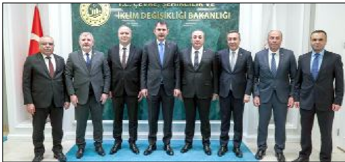
MHP'li Belediye Başkanlarının talepleri Bakan Murat Kurum'a iletildi.

Çevre, Şehircilik ve İklim Değişikliği Bakanı Murat Kurum, Çorum MHP heyetini ağırladı.