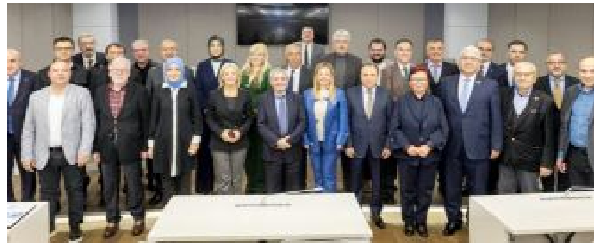
Genel Kurul üyeleri, toplantı sonrası anı fotoğrafı çekti.