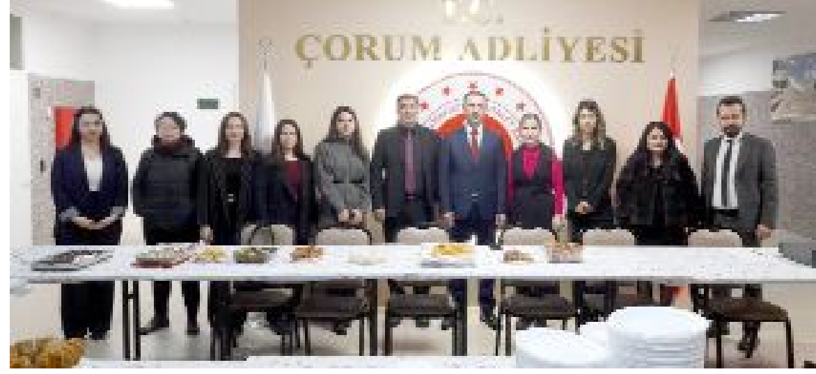
Cumhuriyet Başsavcısı Ahmet Bektaş, Baro Başkanı Turan Kalıpcı ve kermesi düzenleyen avukatlarla görüşüyor.

Çorum Barosu Kadın Hakları Komisyonu, ihtiyaç sahibi aileler ve çocukları için kermes düzenledi. Adliye'de gerçekleştirilen kermese Çorum Barosu avukatları evlerinden getirdikleri yiyeceklerle katkıda bulundu.