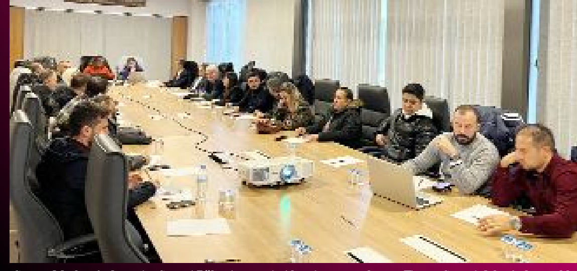
Çorum Merkez 2. Organize Sanayi Bölgesi yer seçimi komisyonu toplantısı Ticaret Sanayi Odası'nda yapıldı.