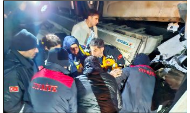
TIR'ın kabin kısmında sıkışan yaralıları, ekiplerin 2,5 saat süren çabası ile kurtarıldı.

Kazayı gören vatandaşlar durumu 112 Acil Çağrı Merkezine bildirdi. İhbar üzerine olay yerine sağlık, polis, jandarma ve Alaca Belediyesi itfaiye ekipleri sevk edildi. Olay yerine gelen ekipler, kabinde sıkışan yaralıları kurtarmak için çalışma başlattı. Ekiplerin yaklaşık 1 saat süren çabasının ardından Mehmet Ali D. kurtarıldı. Yaralı sürücü ise yaklaşık 2,5 saat süren çaba ile kurtarıldı. Sağlık ekipleri tarafından ilk müdahaleleri yapılan yaralılar Alaca Devlet Hastanesine kaldırıldı. (İHA)