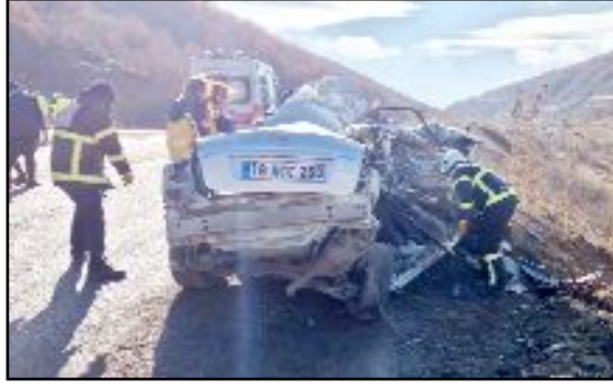
Kaza, Çorum-Alaca karayolu Eliceck Deresi mevkiinde meydana geldi.