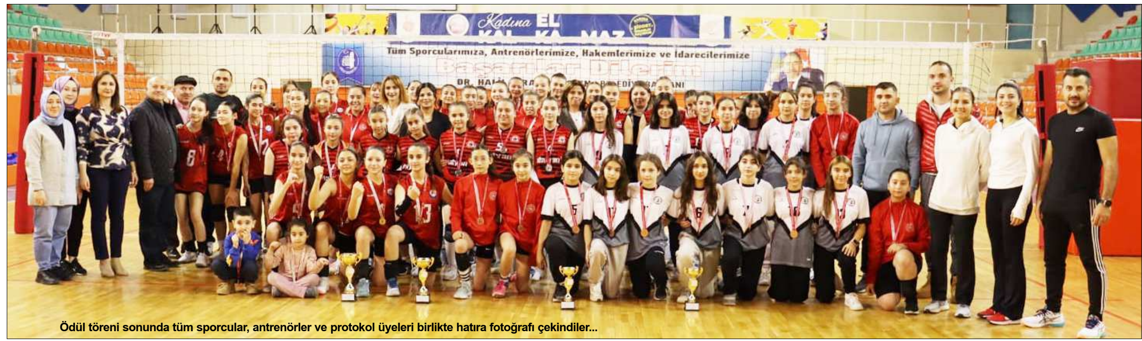
Ödül töreni sonunda tüm sporcular, antrenörler ve protokol üyeleri birlikte hatıra fotoğrafı çekindiler...