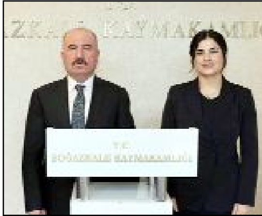
Çalgan, Kaymakamlık ve Belediye'yi ziyaret etti.