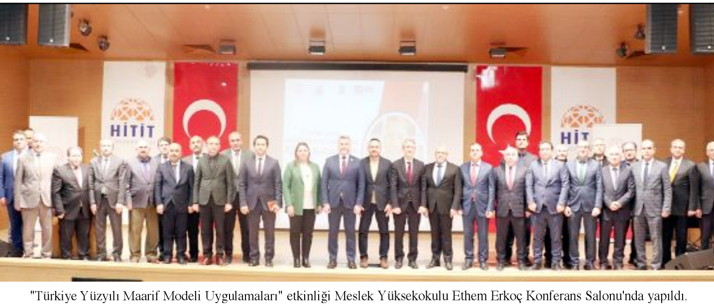
"Türkiye Yüzyılı Maarif Modeli Uygulamaları" etkinliği Meslek Yüksekokulu Ethem Erkoç Konferans Salonu'nda yapıldı.