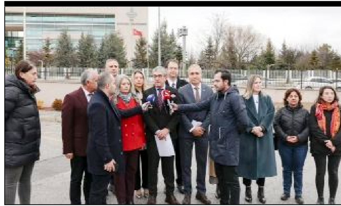
CHP Grup Başkanvekili Gökhan Günaydın, AYM önünde konuşurken...