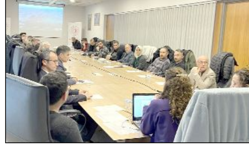
Çorum'da kurulması planlanan 2. Organize Sanayi Bölgesi (OSB) için yer seçimi toplantısı yapıldı.

Çorum'un coğrafi olarak Türkiye'nin ortasında yer alması ve ulaşım yolları üzerinde bulunması, bölgeyi yatırımcılar için cazip bir hale getiriyor. Başkent Ankara'ya yakınlık, hammadde temini ve üretimlerin pazarlanabilmesi açısından stratejik bir avantaj sunan alan, teşvik kanunlarının uygulanacak olmasıyla birlikte önemli bir yatırım merkezi haline gelmesi bekleniyor. (Haber Merkezi)