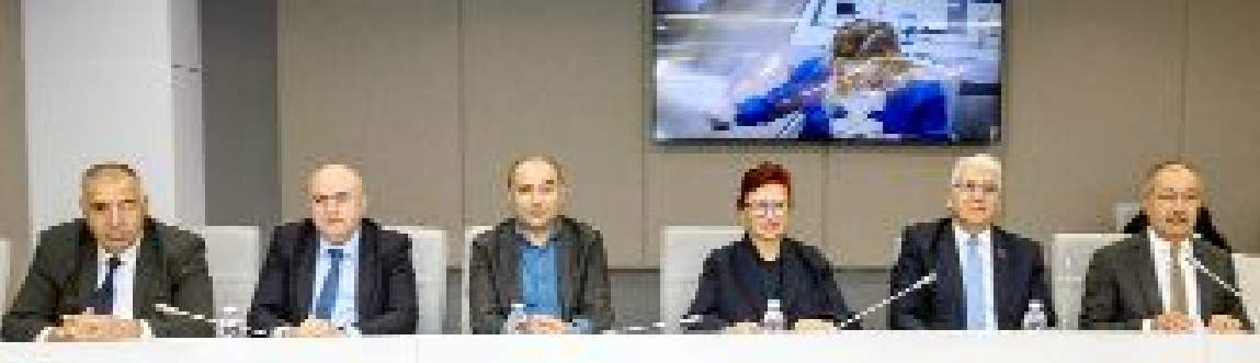
Basın İlan Kurumu Genel Kurulu'ndan...