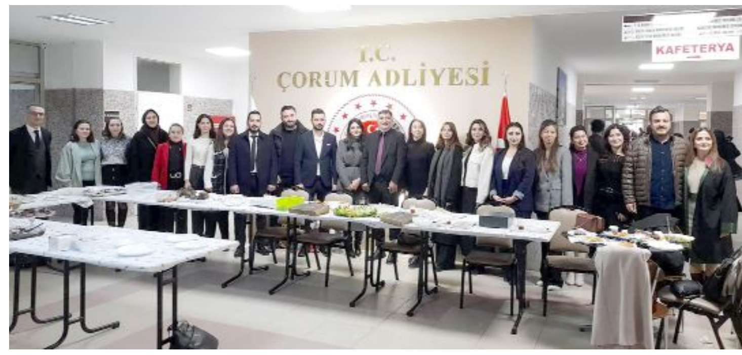
Kermese katılan Çorum Barosu avukatları yaptıkları yiyeceklerle katkı sağladılar.