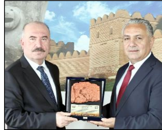
Çalgan, Kaymakamlık ve Belediye'yi ziyaret etti.