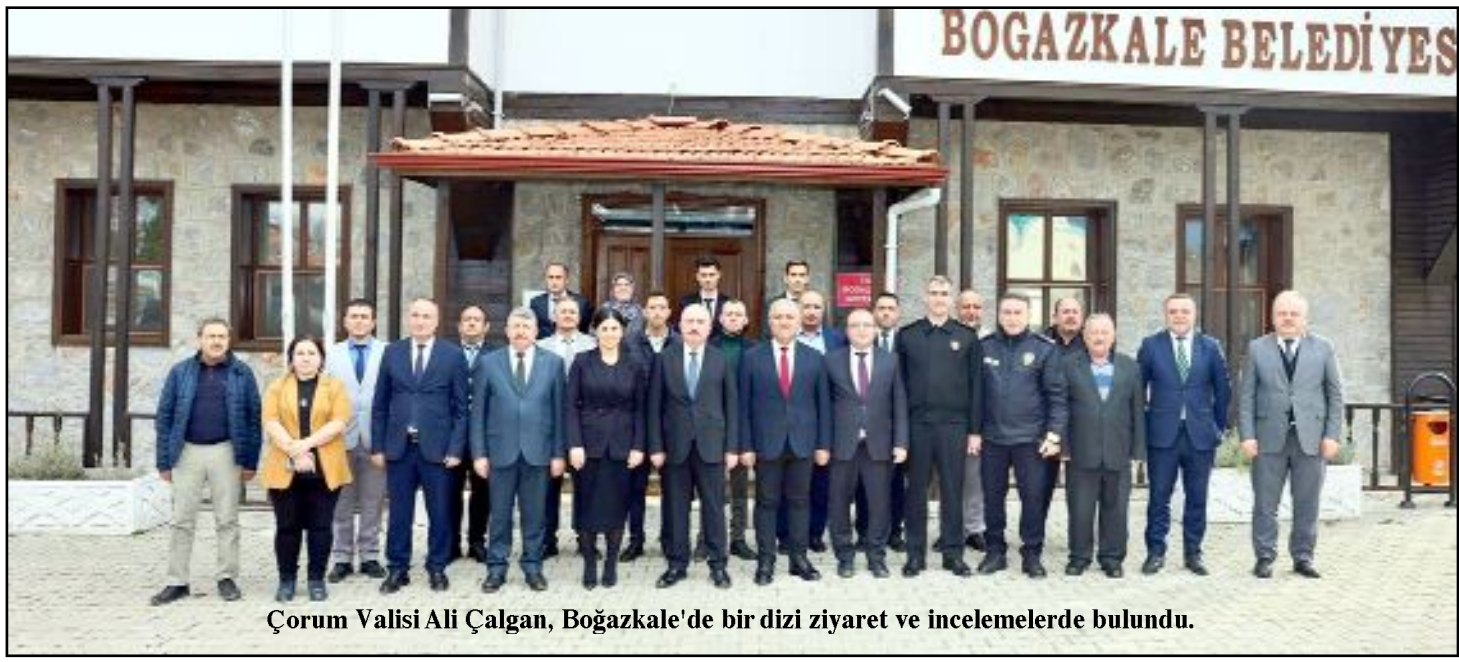
Çorum Valisi Ali Çalgan, Boğazkale'de bir dizi ziyaret ve incelemelerde bulundu.