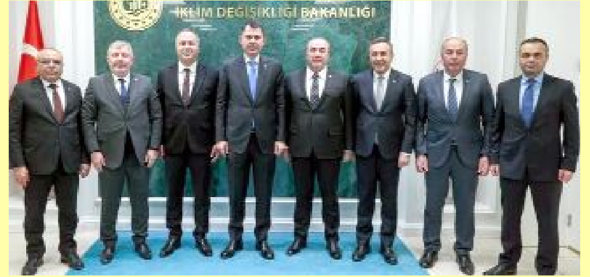
MHP Çorum Milletvekili Vahit Kayırcı ve İl Başkanı Mehmet İhsan Çıplak, MHP'li Belediye Başkanları ile birlikte Çevre, Şehircilik ve İklim Değişikliği Bakanı Murat Kurum'u ziyaret etti.

● Murat Kurum'u ziyaretlerinde bazı yatırımlar ve projelerle ilgili kararlar alındığını belirten MHP İl Başkanı Çıplak, 4 ilçeye 4 iş makinesi tahsisi, 61 milyon lira hibe desteği, 450 çöp konteyneri, güneş enerji sistemi kurulumu için 80 dönüm arazi tahsisi gibi konularda destek aldıklarını söyledi. •7'de