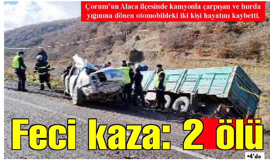
Çorum'un Alaca ilçesinde kamyonla çarpışan ve hurda yığınına dönen otomobildeki iki kişi hayatını kaybetti.