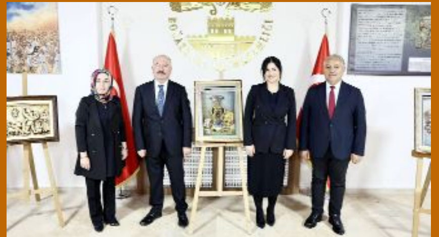
Boğazkale Hitit Köyü'nde bulunan Hitit Figürleri Rölyef Sergisi'ni gezen Vali Çalgan'a Boğazkale Kaymakamı Emine Karataş Yıldız ve Belediye Başkanı Adem Özel eşlik etti.

● Bir dizi ziyaret ve inceleme amacıyla Boğazkale'ye giden Vali Ali Çalgan, Dünya Kültür Mirası listesinde yer alan Boğazkale'yi gelecekte çok güzel günlerin beklediğini söyledi. •6'da