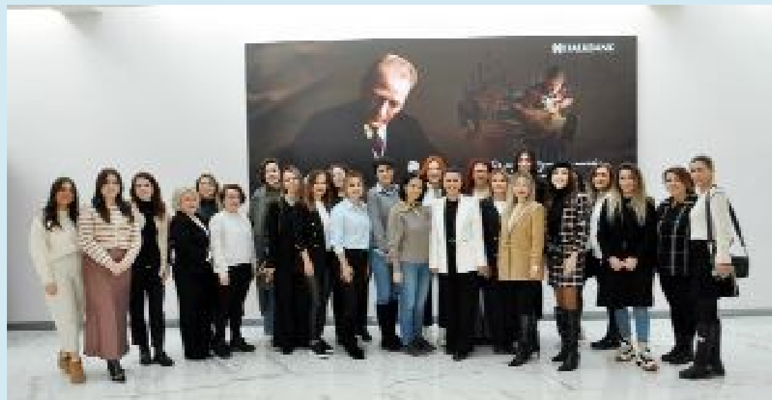
Çorumlu kadın girişimciler, toplu halde...