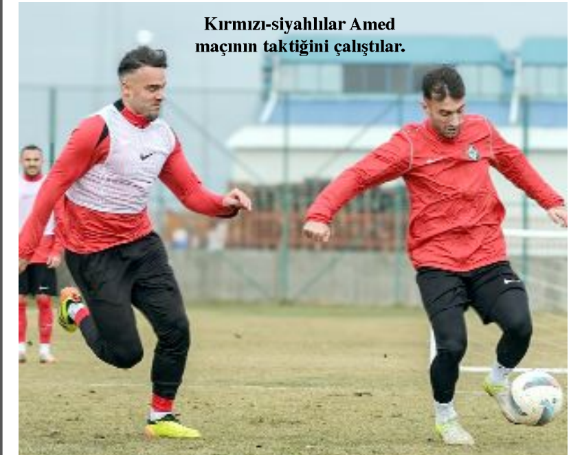
Kırmızı-siyahlılar Amed maçının taktiğini çalıştılar.

İki takım arasında Çorum'da oynanan son maç Diyarbakır temsilcisi 2-0 kazandı.