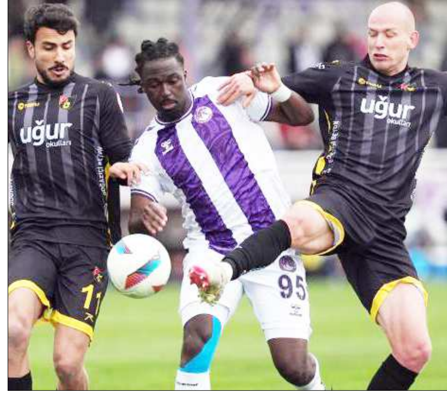
Trendyol 1.Lig maçından bir enstantane...

Aynı saatte, Yeni Adana Stadi'nda oynanacak ve yine İstanbul bölgesi üst klasman hakemlerinden İker Yasin Avcı'nın yöneteceği maçta Adanaspor'la Yeni Malatyaspor karşı karşıya gelecek. Düşme hattında, son 2 sırayı alan takımlardan Adanaspor 8 puanla 19.sırada, Yeni Malatyaspor ise -21 puanla son sırada bulunuyor. (Hüseyin AŞKIN)