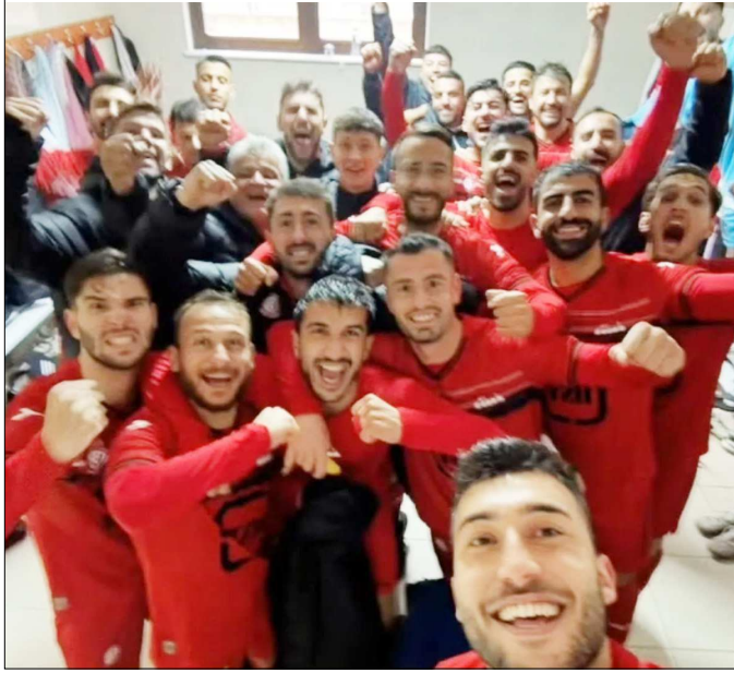
Bartınspor soyunma odasından bir fotoğraf...

silcisi üçüncü sıraya yükselirken, ev sahibi Geredespor ise 10.sırada kaldı. (Rifat KARA)