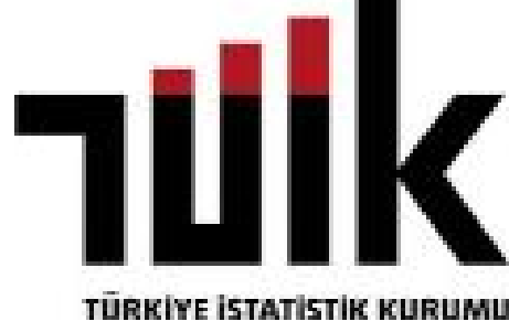
TÜRKİYE İSTATİSTİK KURUMU

çılık ve balıkçılık, 15 milyar 426 milyon 920 bin lira ile sanayi, 13 milyar 82 milyon 515 bin liralık gelirle imalat sanayi izledi. Ayrıca Çorum'un Türkiye GSYH büyümesine katkısı ise % 0,02 olarak belirlendi. Samsun, Tokat, Çorum ve Amas-