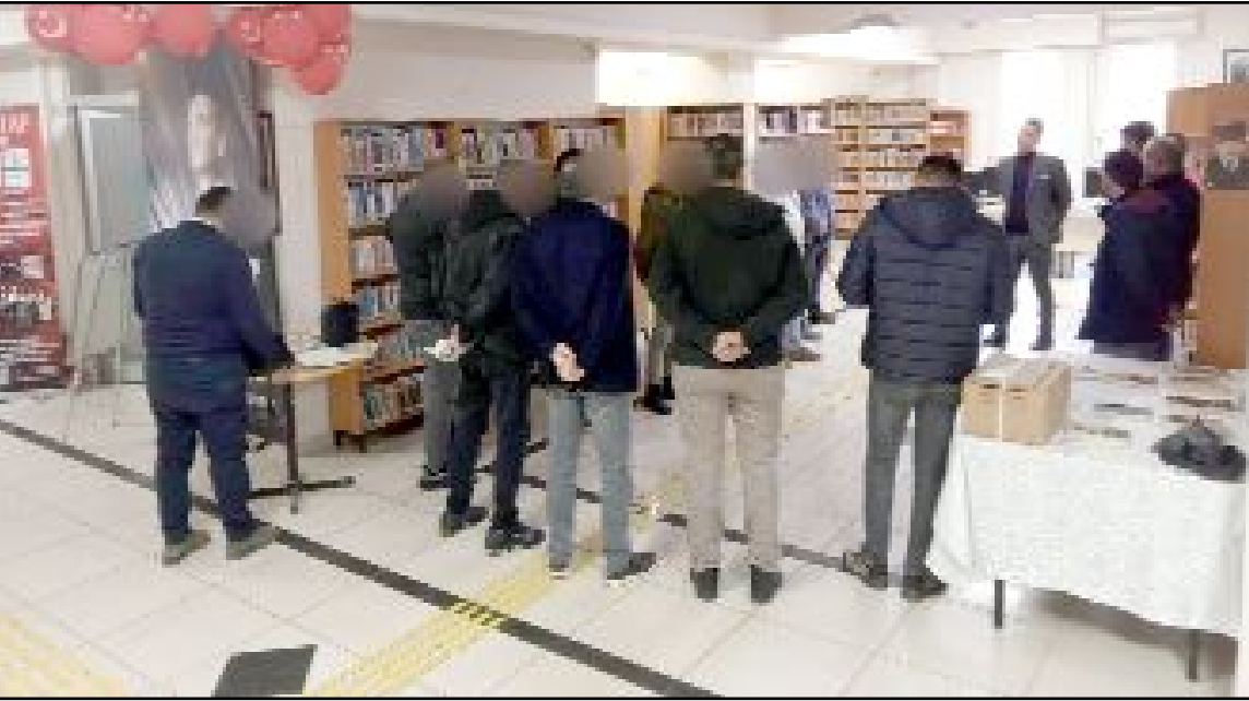
Çorum'da bulunan 19 denetimli serbestlik yükümlüsü ve kurum personeli, Çorum İl Halk Kütüphanesi ziyaret etti.