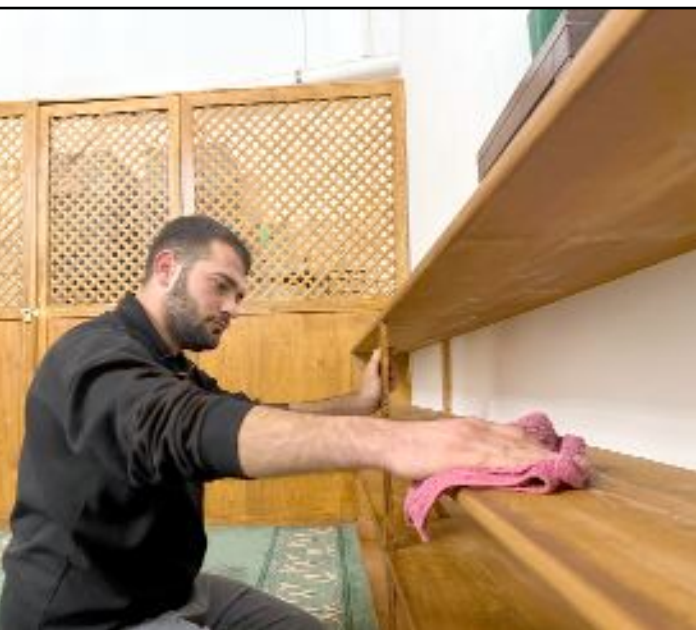
AK Parti Gençlik Kolları üyeleri her hafta iki camide temizlik yapıyor.