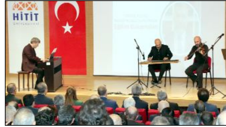
Etkinlikte Hitit Üniversitesi Güzel Sanatlar Fakültesi öğretim üyeleri müzik dinletisi sundu.