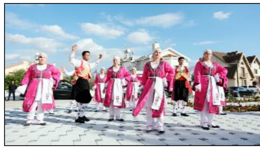
Park açılışında yöresel halk oyunları gösterisi yapıldı.