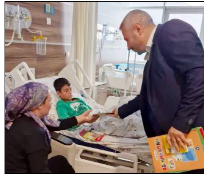
Çocuk ve çocuk cerrahi servisinde yatarak tedavi gören çocuklara boyama ve hikâye kitapları hediye edildi.

Hastanelerde hizmet sunumunun önemli bir parçası olan tıbbi sekreterleri unutmayan Türkiye Sağlık İş Sendikası Çorum İl Temsilciliği, 29 Kasım Dünya Tıbbi Sekreterler Günü nedeniyle Çorum Hitit Üniversitesi Erol Olçok Eğitim ve Araştırma Hastanesi'nde kutlama programı gerçekleştirdi.