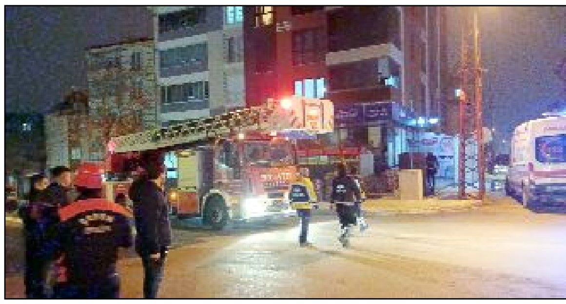
Olay, Hüyük Caddesi ile Emek Caddesi kesişiminde bulunan binada meydana geldi.

Son bir haftalık çalışmalarda 6 aranan şahıs yakalanırken, çok sayıda silah, kesici ve delici alet ile yasaklı madde ele geçirildi.