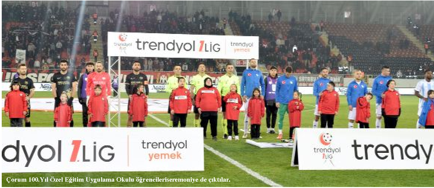
Çorum 100.Yıl Özel Eğitim Uygulama Okulu öğrencileriseremoniye de çıktılar.

Ahlatcı Çorum FK sahasında oynadığı 7 maçta 2 galibiyet, 3 beraberlik, 2 yenilgi alarak 9 puan toplarken, attığı 5 gole karşılık 6 gol yiyerek eksi averaja düştü. (Hüseyin AŞKIN)