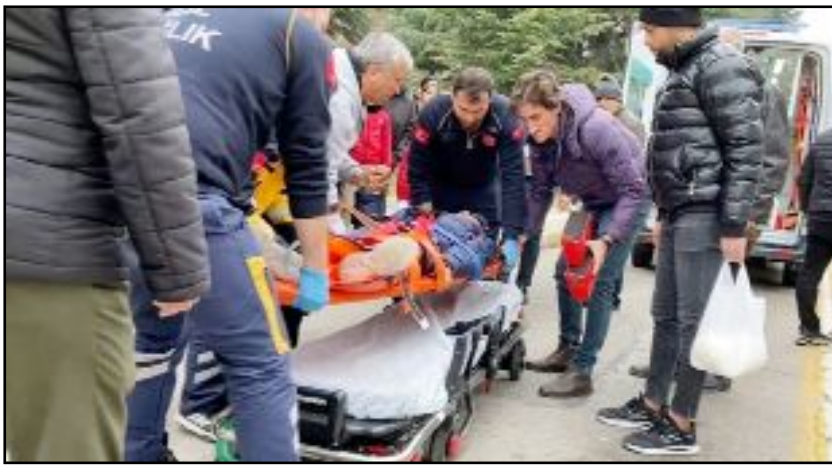
Yaralı çocuk sağlık ekiplerince yapılan müdahalenin ardından Hitit Üniversitesi Erol Olçok Eğitim ve Araştırma Hastanesi'ne kaldırıldı.

Yaralı çocuk sağlık ekiplerince yapılan müdahalenin ardından Hitit Üniversitesi Erol Olçok Eğitim ve Araştırma Hastanesi'ne kaldırıldı.