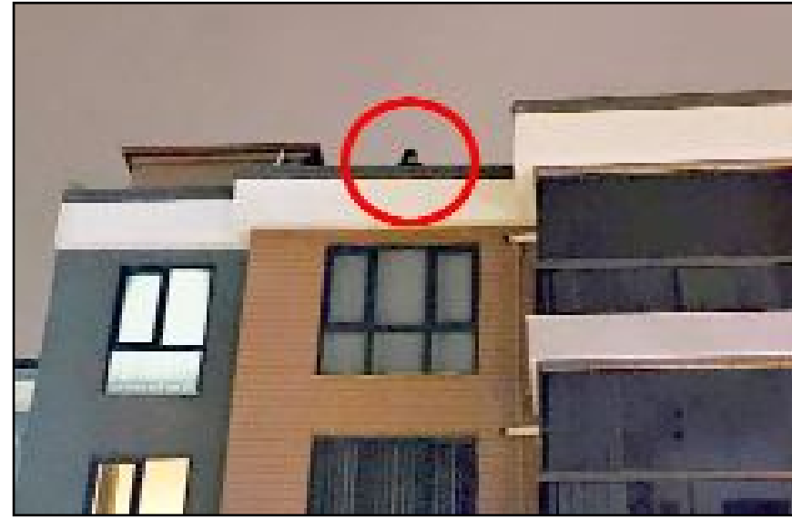
İhbar üzerine olay yerine sağlık, itfaiye ve polis ekipleri sevk edildi.

kontrolünün ardından polis merkezine götürüldü. (İHA)