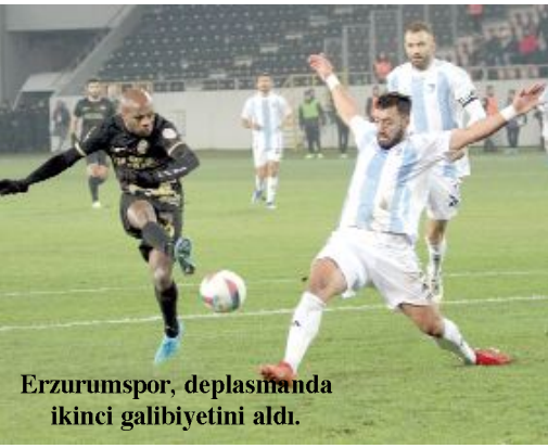
Erzurumspor, deplasmanda ikinci galibiyetini aldı.