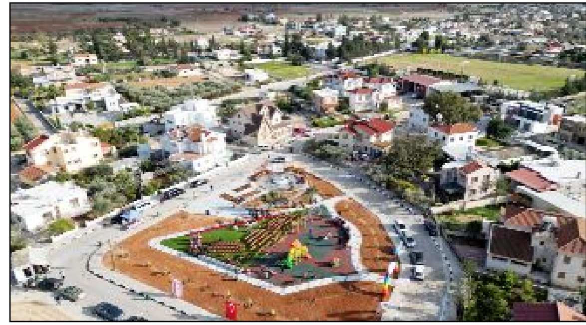
KKTC Beyarmudu Belediyesi'ne Çorum Belediyesi tarafından yapılan park, düzenlenen törenle açıldı.