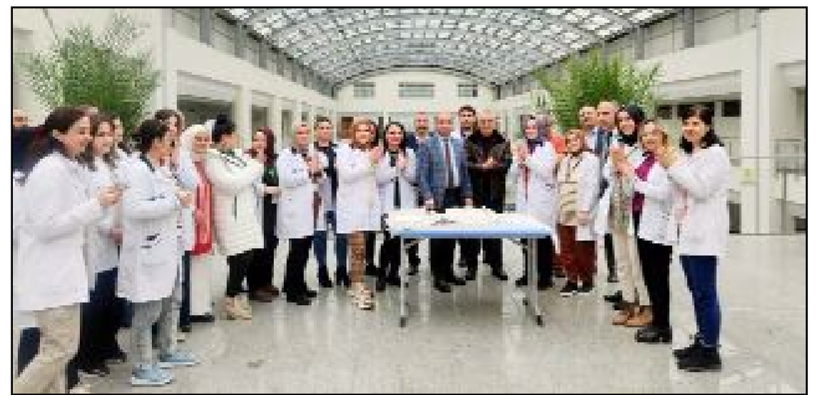
Kutlama programında hastane yönetimi ve sendika yetkilileri, tıbbi sekreterlerle birlikte pasta kesti.