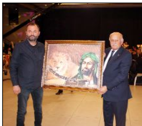
Gecede 7 tablo ve kısa sap bağlama açık artırma ile satışa sunuldu.