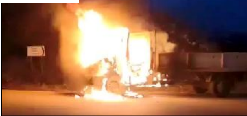
Sürücüsü ve plakası öğrenilemeyen seyir halindeki kamyonet bir anda yandı.

Yangınla ilgili inceleme başlatıldı. (İHA)