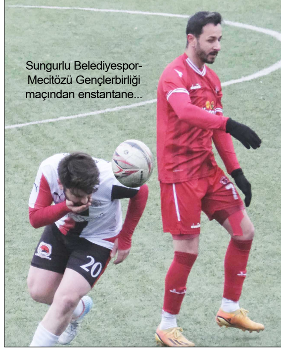
Sungurlu Belediyespor-Mecitözü Gençlerbirliği maçından enstantane...

ve Cuma kaydetti. Bu sonucun ardından 8'de 8 yapan Sungurlu Belediyespor 24 puana yükselirken, konuk Mecitözü 9 puanda kaldı. (Rifat KARA)