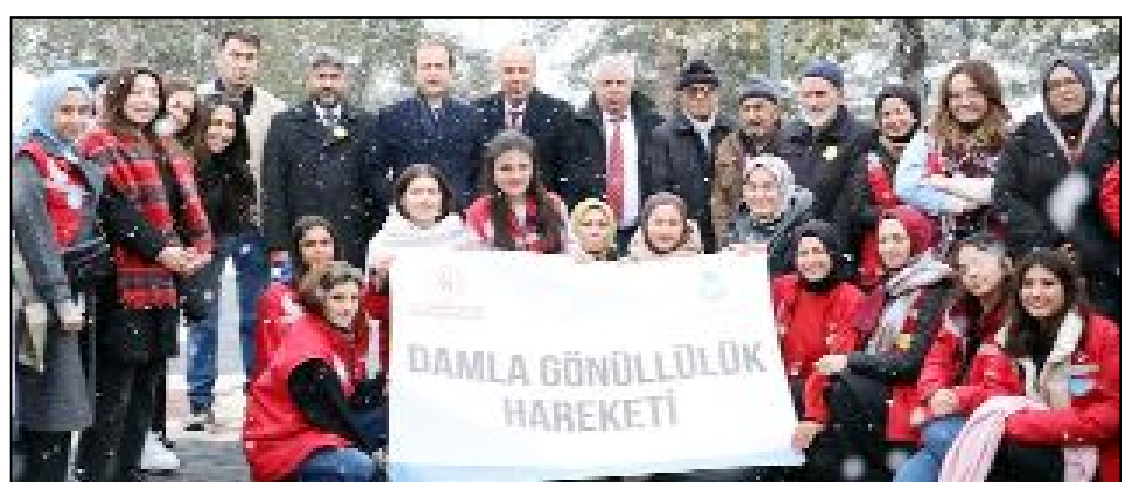
Proje çerçevesinde gönüllüler, toplumsal dayanışmayı güçlendirmek amacıyla çeşitli etkinlikler ve aktiviteler düzenleyecek.