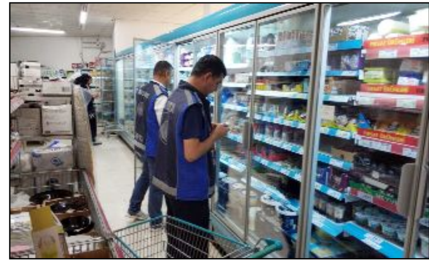
Hafta boyunca 74 markette denetleme yapan Zabıta Müdürlüğü ekipleri yaklaşık 1500 farklı ürün üzerinde incelemelerde bulundu.

Hafta boyunca 74 markette denetleme yapan Zabıta Müdürlüğü ekipleri yaklaşık 1500 farklı ürün üzerinde incelemelerde bulundu. Marketlerde 20 farklı üründe fiyat etiketi, gramaj ve son kullanma tarihi gibi unsurları kontrol eden ekipler tarafından 3 markete ceza yazıldı. Çorum Belediyesi'nden yapılan açıklamada, denetimlerin düzenli aralıklarla devam edeceği ve tüketicilerin güvenli alışveriş yapabilmesi için tüm önlemlerin alınacağı vurgulandı. (Haber Merkezi)