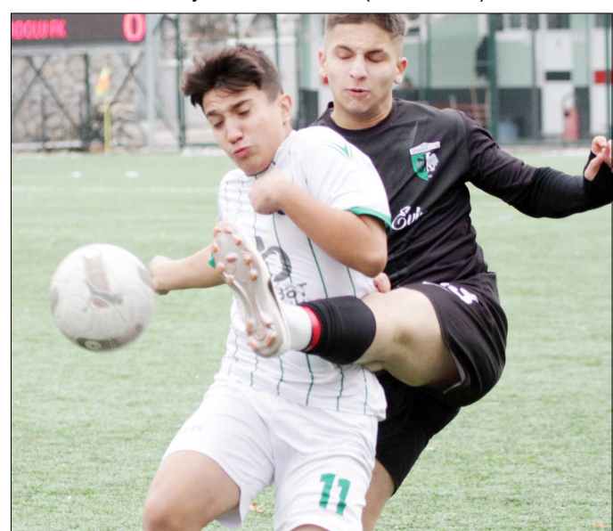
Mimar Sinanspor-Vefaspor maçından enstantane...

4 takımın çift devreli lig statüsüne göre mücadele ettiği U16 Play-Off Ligi'nde 3.hafta heyecanı yaşandı. Cumartesi günü Mimar Sinan Sahası'nda oynanan haftanın en kritik maçında Mimar Sinanspor ile Çorum Anadolu FK karşı karşıya geldi. Çorum Anadolu FK'nın 9 kişi tamamlandığı karşılaşma 0-0 sona erdi. İtfaiye Sahası'nda oynanan günün diğer maçında ise Vefaspor, Çorumspor'u 3-0'la geçti. Bu sonuçların ardından puanını 4'e yükselten Mimar Sinanspor ile Çorum Anadolu FK zirveyi paylaşmaya devam ederken, Vefaspor ise ilk 3 puanını hanesine yazdırarak şampiyonluk yarışında bende yarım dedi. (Rifat KARA)