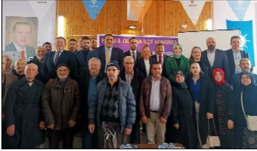
AK Parti'de Osmancık, Kargı ve Oğuzlar ilçelerinin kongreleri gerçekleştirildi.