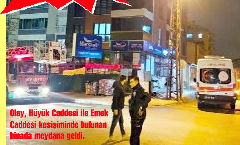
Olay, Hüyük Caddesi ile Emek Caddesi kesişiminde bulunan binada meydana geldi.