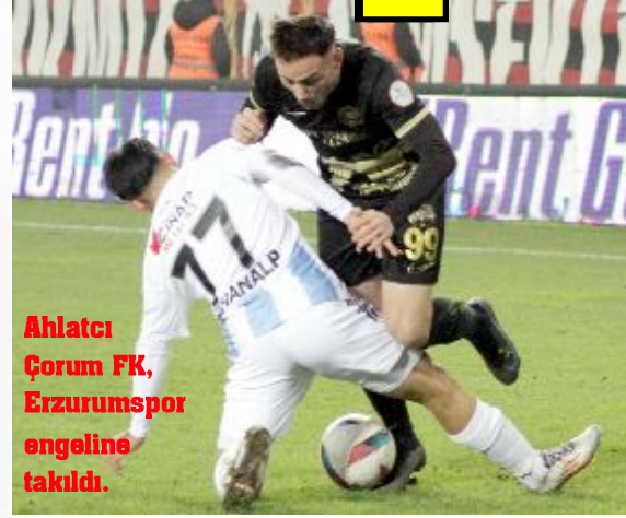
Ahlatcı Çorum FK, Erzurumspor engeline takıldı.

STAT: Çorum Şehir HAKEMLER: Erdem Mertoğlu **, Erkan Akbulut **, Serdar Osman Akarsu **