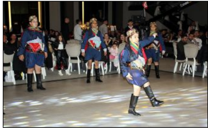
HBV Vakfı Çocuk Zeybek Korusu'nun gösterisi büyük beğeni topladı.