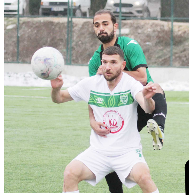
Mimar Sinan-Bağlumspor maçından enstantaneler...