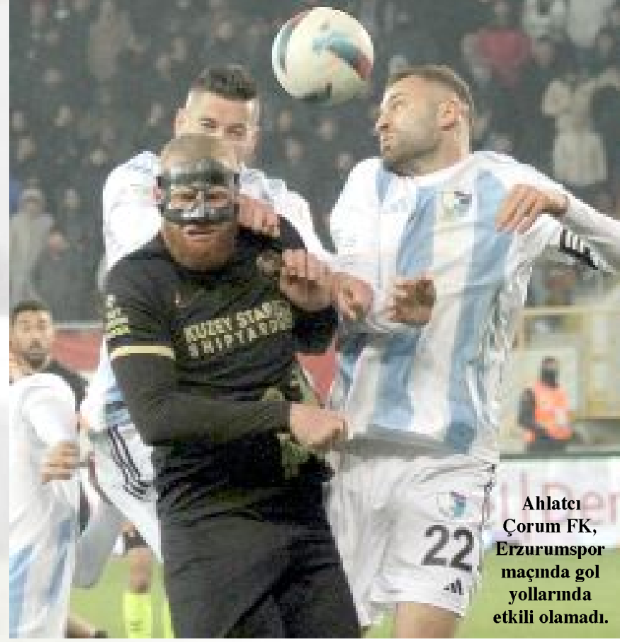
Ahlatcı Çorum FK, Erzurumspor maçında gol yollarında etkili olmadı.

Son saniyeye kadar yediğimiz gol haricinde oyundan, oyuncularından ve mücadeleden çok memnunuz.