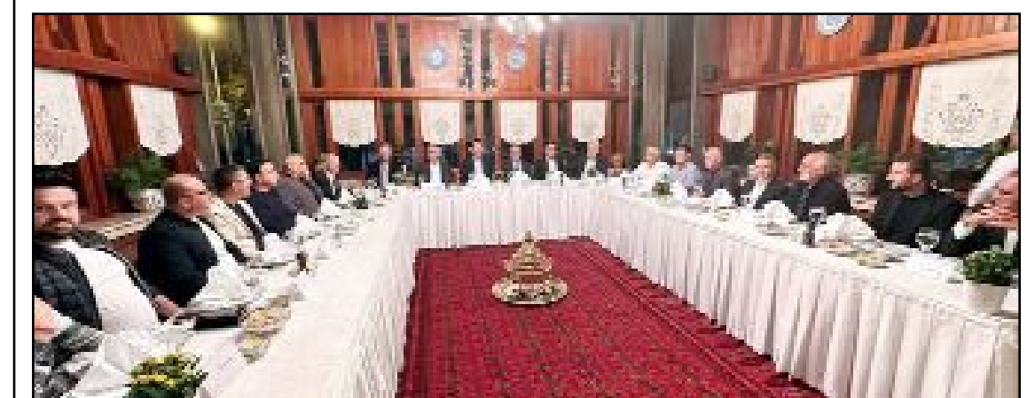
İstanbul'da bulunan Sungurlulu iş insanları memleketlerine yatırım yapmak için düzenlenen istişare toplantısında bir araya geldiler.