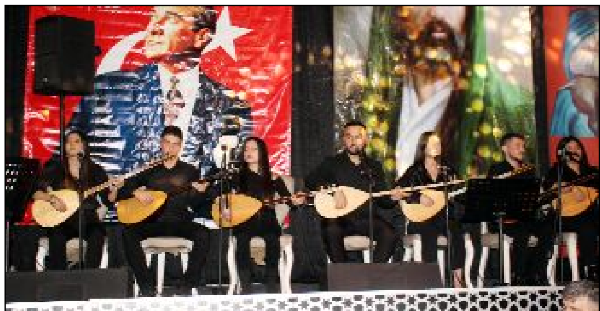
Gecede HBV Korusu "bağlama resitali" sundu.