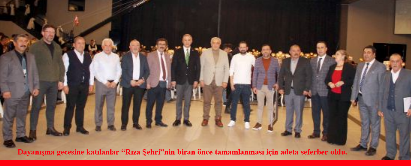
Dayanışma gecesine katılanlar “Rıza Şehri”nin biran önce tamamlanması için adeta seferber oldu.

● Ana sponsorluğunu Ata Gross'un üstlendiği dayanışma gecesi, Yıldızpark Düğün Salonu'nda büyük bir katılımla gerçekleştirildi. ●6'da