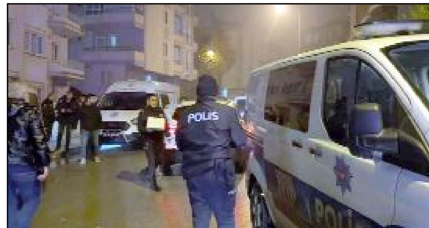
Cenin otopsi yapılmak üzere hastane morguna kaldırılırken, gözaltına alınan kadın ise ifade işlemleri için polis merkezine götürüldü.

Gözaltına alınan kadın ise ifade işlemleri için polis merkezine götürüldü. (AA)