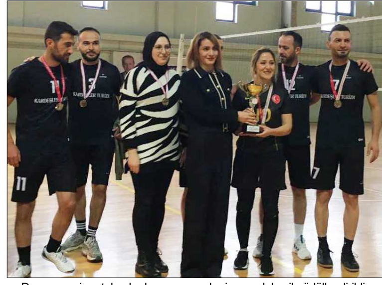
Dereceye giren takımlar kupa, sporcular ise madalya ile ödüllendirildi.

Mecitözü'nde düzenlenen Kurumlararası Voleybol Turnuvası'nda şampiyon belli oldu.