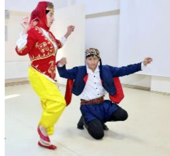
Aile ve Sosyal Hizmetler İl Müdürlüğü tarafından düzenlenen programda, engelli bireyler hünelerlerini sergiledi.