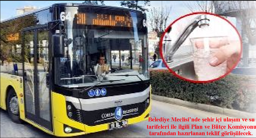
Belediye Meclisi'nde şehir içi ulaşım ve su tarifeleri ile ilgili Plan ve Bütçe Komisyonu tarafından hazırlanan teklif görüşülecek.

● Bekâr ve iki aylık hamile olduğu öğrenilen A.S., 112 Acil Çağrı Merkezini arayarak yardım istemesi üzerine eve sağlık ekibi sevk edildi. •6'da