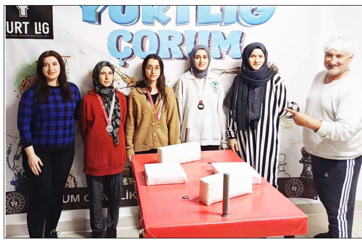
Dereceye yapan sporcular Çorum'u gruplarda temsil edecek.

Müsabakalar sonunda düzenlenen törenle dereceye giren öğrencilere ödülleri takdim edildi. (Rifat KARA)