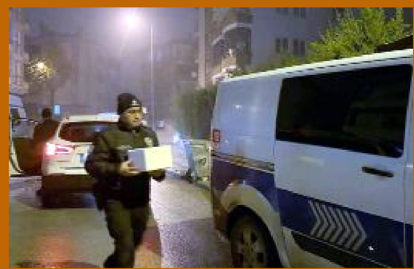
Bahçede yapılan çalışmada polis ekiplerince bulunan cenin, otopsi yapılmak üzere hastane morguna kaldırıldı.