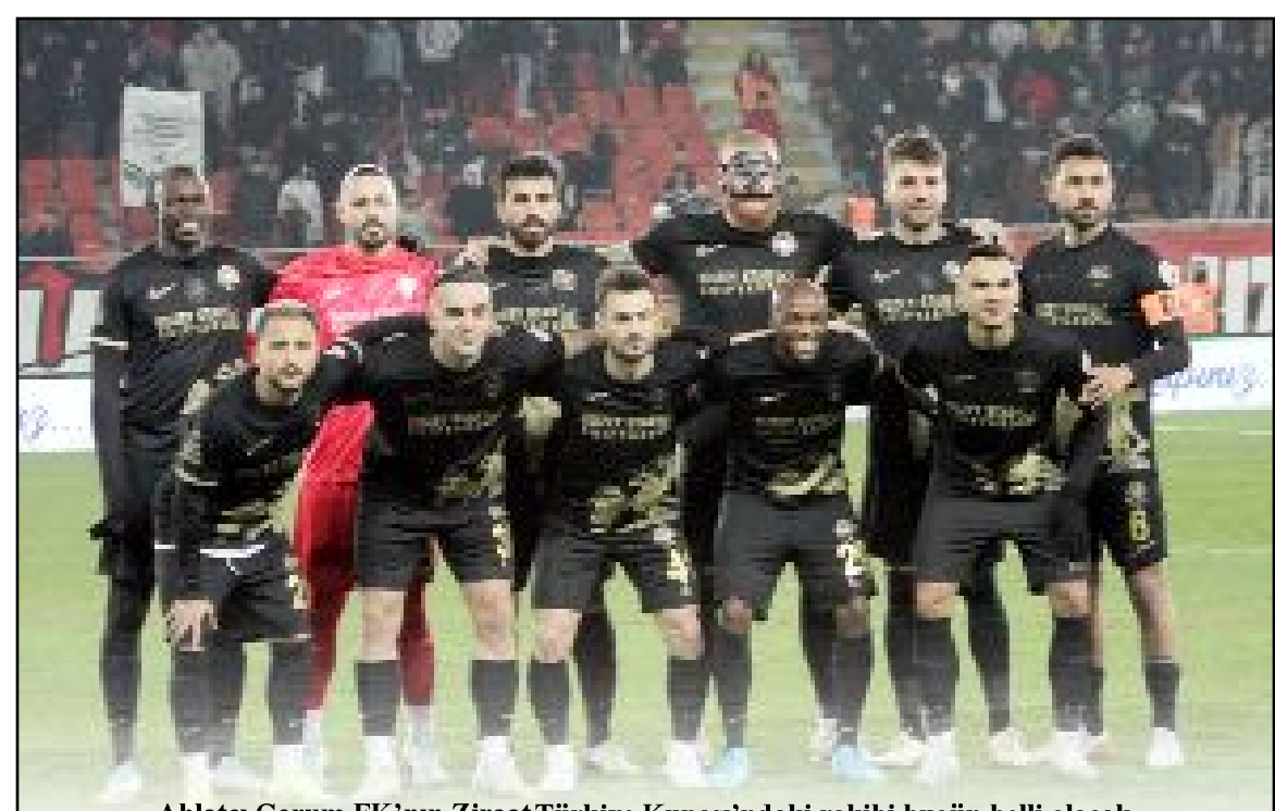
Ahlatcı Çorum FK'nın Ziraat Türkiye Kupası'ndaki rakibi bugün belli olacak.