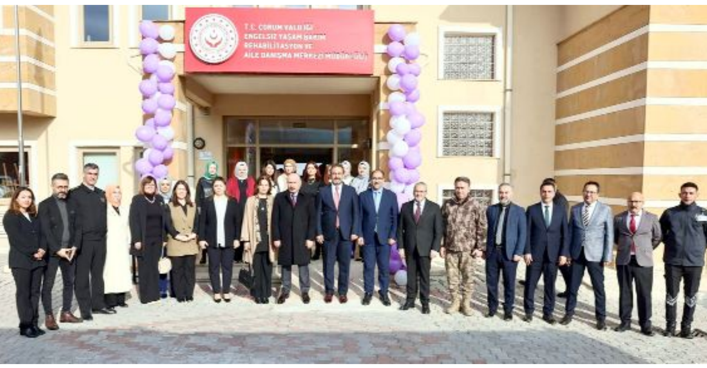
3 Aralık Dünya Engelliler Günü kapsamında Engelsiz Yaşam Bakım Rehabilitasyon ve Aile Danışma Merkezi'nde bir dizi etkinlik gerçekleştirildi.