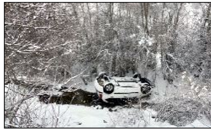
Kaza, Çorum-Alaca karayolu Küre köyü mevkiinde meydana geldi.