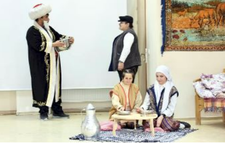
Engelli bireylerin skeç gösterisi beğeniyle izlendi.