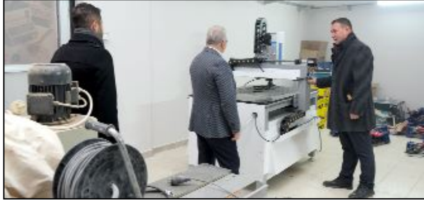
Ahşap Tasarım ve Mobilya Atölyesi 2025 yılının ilk aylarında hizmete açılacak.

kursları verilecek. Ayrıca atölye içerisinde kurulacak satış noktasında ve kadın emeği çarşımızda kursiyerlerin yapacağı ürünler satılacak. Şehimize hayırlı olsun" dedi. (Haber Merkezi)