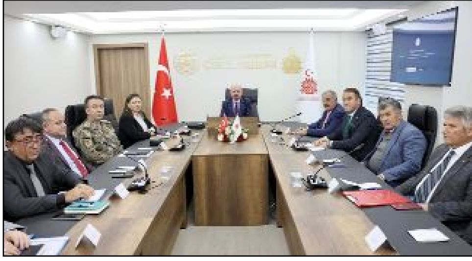
Valilik Toplantı Salonu'nda gerçekleştirilen toplantıda muhtarların mahalleleri ile ilgili istek, görüş ve önerileri alındı.

Çorum Valisi Ali Çalgan, mahalle muhtarları ile bir araya geldi.