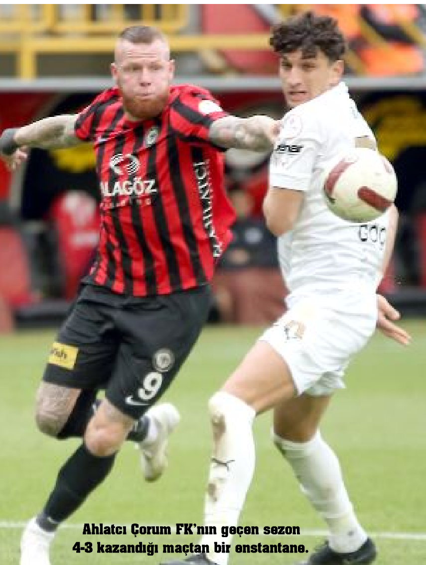
Ahlataci Çorum FK'nın geçen sezon 4-3 kazandığı maçtan bir anstantane.

● Ahlataci Çorum FK, Manisa FK'ya karşı 1 galibiyet, 1 beraberlik, 3 yenilgi olarak hanesine 4 puan yazdırırken, attığı 7 gole karşılık 11 gol yedi. Manisa'da oynanan 2 maçın 1'i berabere biterken, diğerini ise Manisa temsilcisi kazandı. Ahlataci Çorum FK, son 2 maçta rakibine yenilmedi.