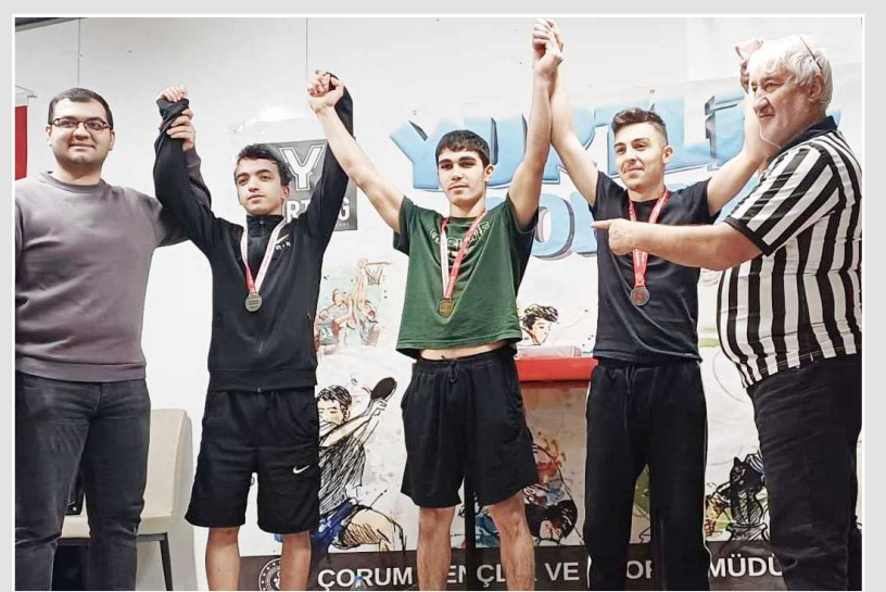
Dereceye giren yurt öğrencileri madalya ile ödüllendirildi.

Kredi Yurtlar Kurumu'nda kalan öğrenciler arasında düzenlenen KYK Yurt Lig erkekler bilek güreşinde şampiyonlar belli oldu.