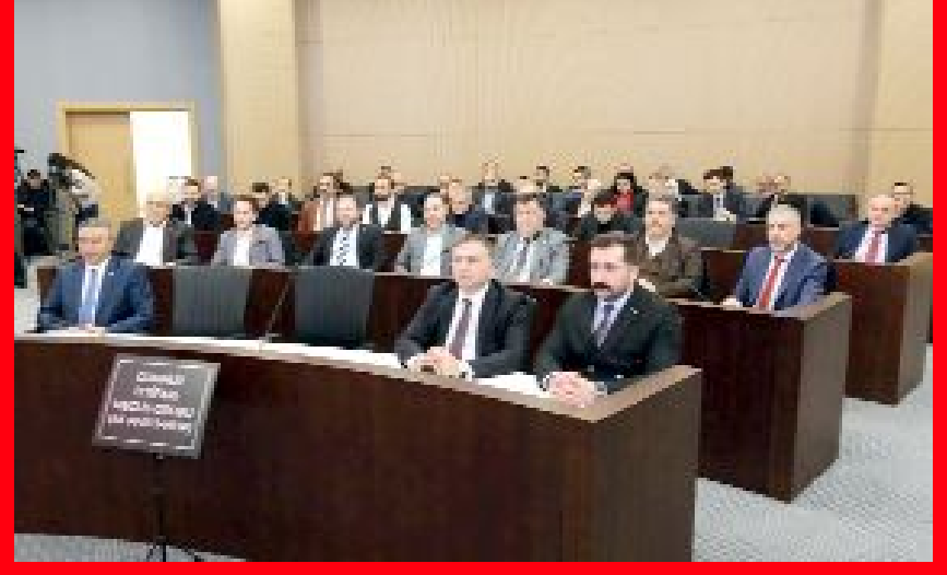
Çorum'da Belediye Meclisi yılın son oturumunda gelir tarifesindeki değişiklikleri görüşerek karara bağladı.

● Çorum'da 1 Ocak 2025 tarihi itibarıyla 9.75 lira olan şehir içi tam akıllı kart bilet ücretinin 17.50 lira, 6.75 lira olan şehir içi öğrenci ücretinin ise 12 lira olması karara bağlandı. Meskenlerde geçen yıl 10 tona kadar su kullarımlarında 6,37 lira olan su kullanımını ise 11,15 liraya çıkı. •3'de