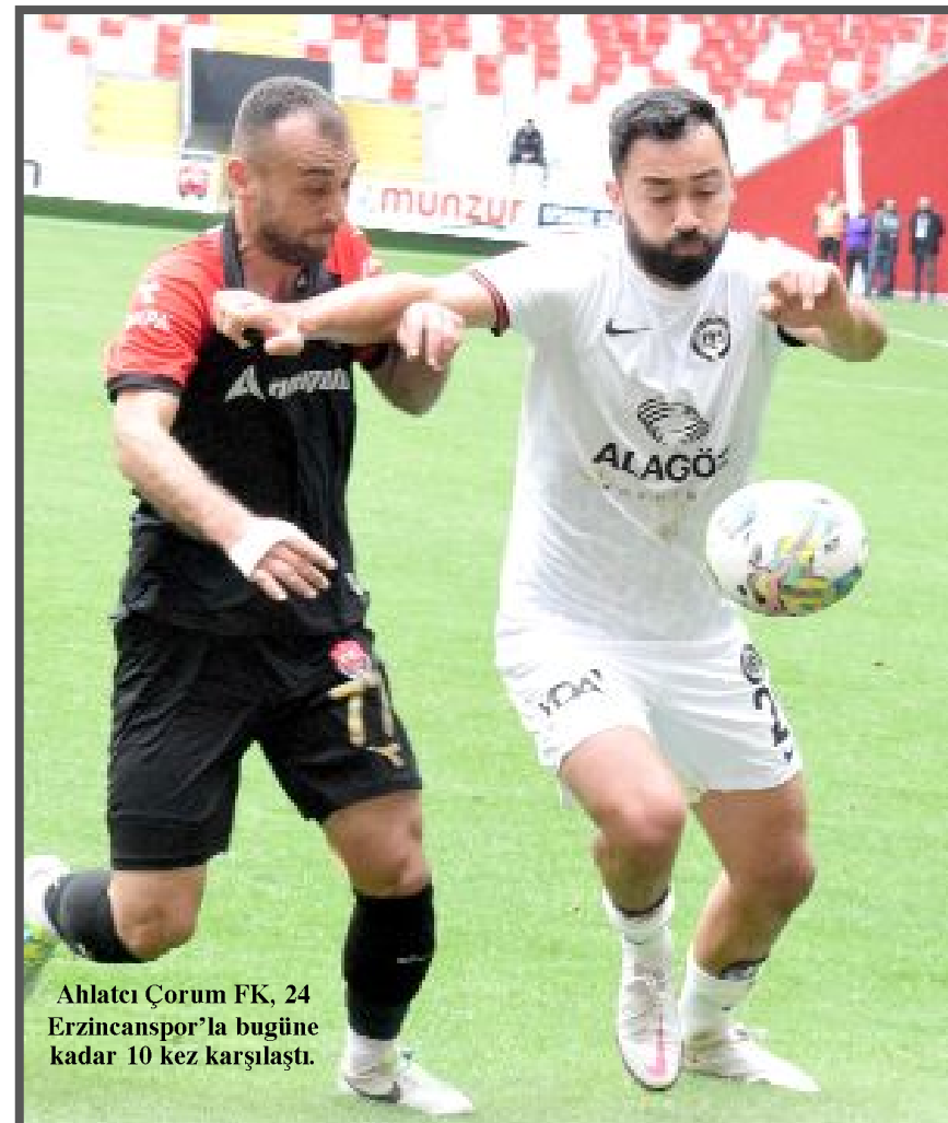
Ahlatıcı Çorum FK, 24 Erzincanspor'la bugüne kadar 10 kez karşılaştı.

4 Aralık Çarşamba günü Erzincan 13 Şubat Stadı'nda oynanan maçta Erzincanspor'u 5. tura taşıyan golleri 69. dakikada Serkan Köse, 77. dakikada Muhammed Ali Çağlar ve 78. dakikada Serkan Köse attı. Ahlatıcı Çorum FK ise kupa serüvenine 5. turdan başlıyor. (Hüseyin AŞKIN)