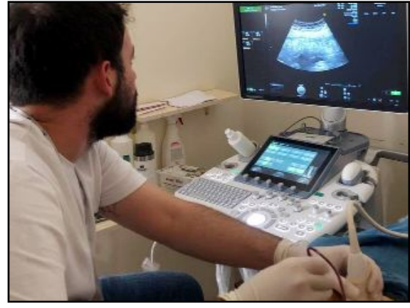
Hitit Üniversitesi Erol Olçok Eğitim ve Araştırma Hastanesi'nde anne karnında kan nakli yapılan bebek sağlığına kavuştu.

Hitit Üniversitesi Çorum Erol Olçok Eğitim ve Araştırma Hastanesi, sağlık alanındaki bir yeniliğe imza atarak, anne karnında kan nakli yapılan bir bebeği sağlıklı bir şekilde dünyaya getirdi.