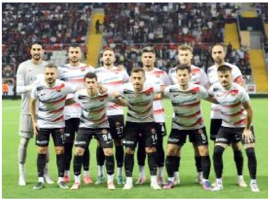
2. Lig Beyaz Grup'ta mücadele eden Erzincanspor 25 puanla 5. sırada yer alıyor.

karşılık 7 gol yedi. Erzincan'da oynanan 5 maçta Ahlatıcı Çorum FK 3 galibiyet, 1 beraberlik, 1 yenilgi alırken, attığı 4 gole karşılık kalesinde 2 gol gördü. Ahlatıcı Çorum FK, Erzincanspor'a karşı tek yenilgisini 2016-2017 Sezonunun 2. haftasında, deplasmanda 1-0'lık skorla aldı. (Hüseyin AŞKIN)