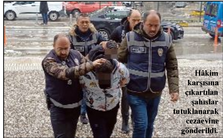
Hâkim karşısına çıkartılan şahıslar tutuklanarak cezaevine gönderildi.

Asayiş Şube Müdürlüğü ekipleri tarafından İstanbul'da düzenlenen operasyonda iki şüpheli de yakalandı. Çorum'a getirilen şahıslar, Emniyet'teki işlemlerinin ardından Adliye'ye sevk edildi. Hâkim karşısına çıkartılan şahıslar tutuklanarak cezaevine gönderildi. (İHA)