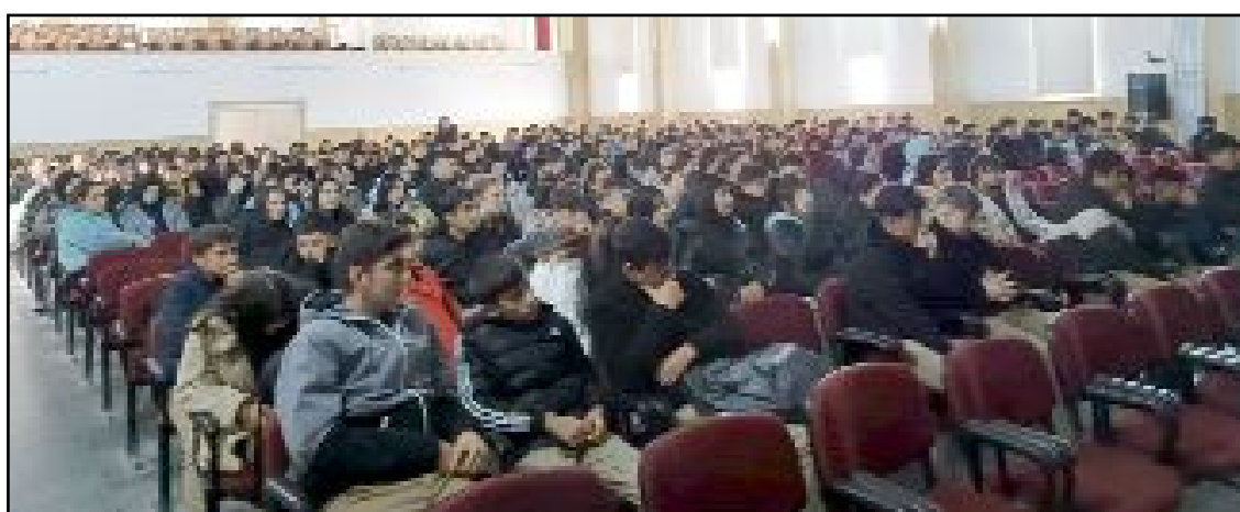
"Gençlik ve güvenli gelecek" projesi çerçevesinde 410 öğrenciye terör farkındalık eğitimi verildi.

Çorum'da polis ekipleri tarafından "gençlik ve güvenli gelecek" projesi çerçevesinde 410 öğrenciye terör farkındalık eğitimi verildi.