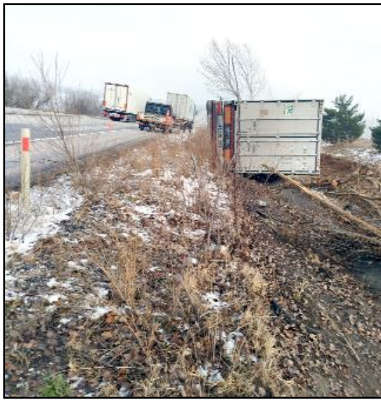
Kaza, Çorum-Alaca karayolu İbrahim köyü mevkiinde meydana geldi.