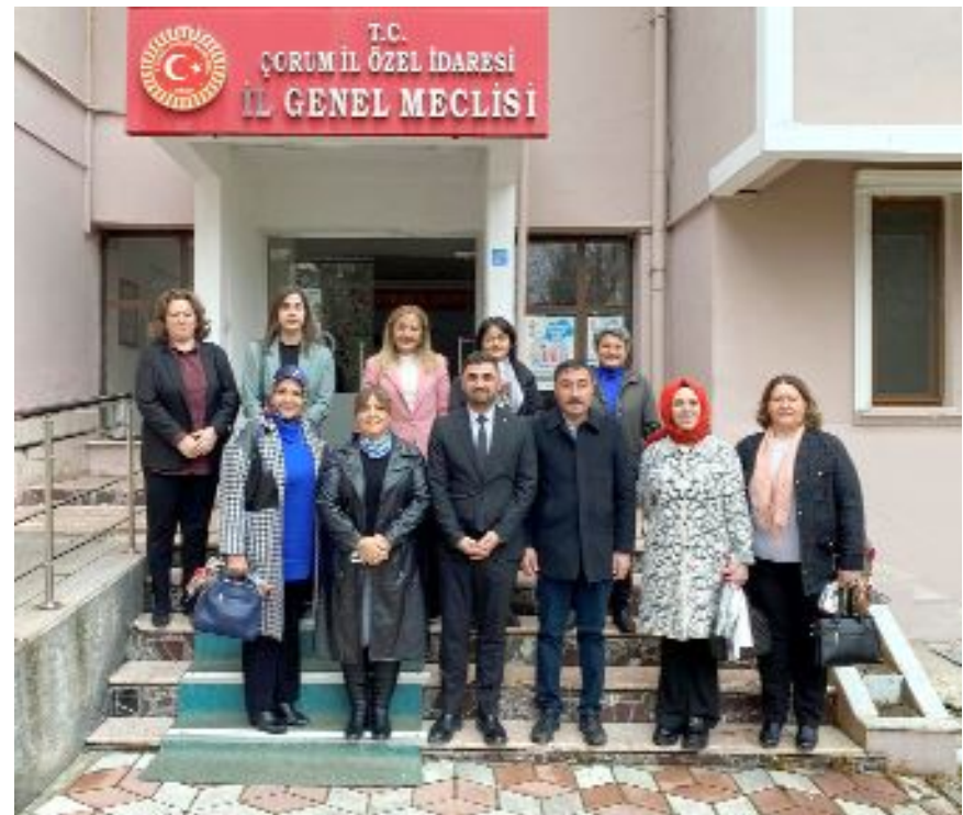
Çorum’da 31 Mart mahalli idareler seçimlerinde sandıktan başarıyla çıkan kadın muhtarlar, İl Genel Meclisi’nde ağırlandı.

Daha sonra kadın muhtarlar da kısa birer selamlaşma konuşması yaparak, Türk kadınına bu hakkı veren Mustafa Kemal Atatürk’e olan minnettarlıklarını dile getirdiler. (Haber Merkezi)