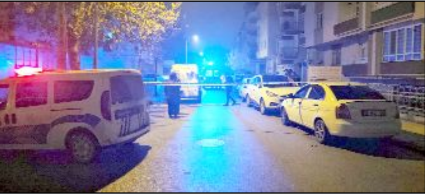
Olay, Ulukavak Mahallesi Damat Şükri 3. Sokak'ta meydana geldi.