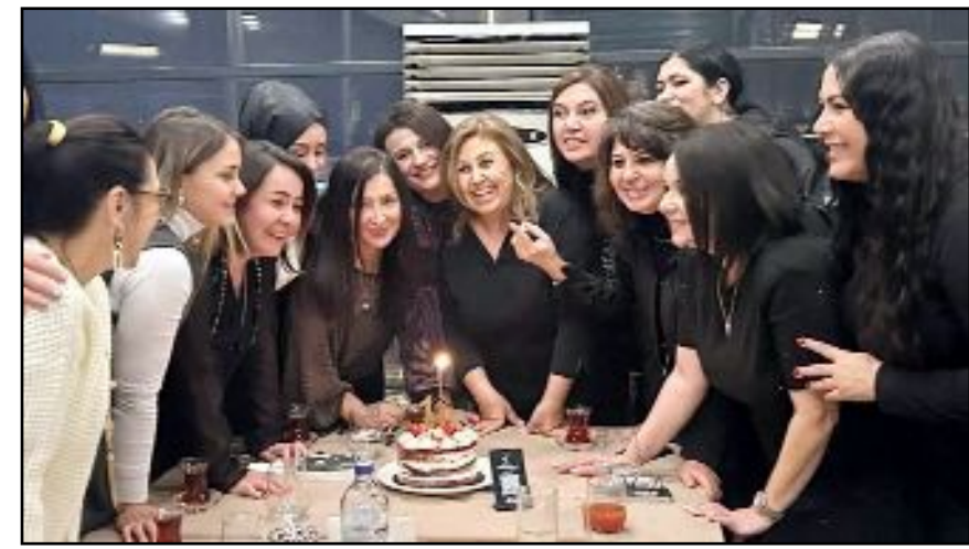
İŞKAD yöneticileri 10. yılın mutluluğunu paylaştı.

Çorum İş Kadınları Derneği yöneticileri, 5 Aralık 2024 itibarıyla 10. kuruluş yıldönümünü kendi aralarında pasta keserek kutladılar.