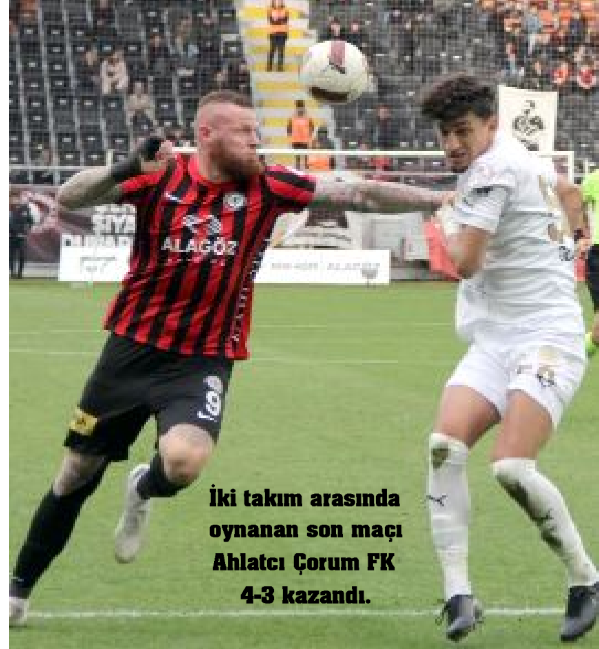
İki takım arasında oynanan son maçı Ahlatcı Çorum FK 4-3 kazandı.

Ahlatcı Çorum FK'nın bugünkü rakibi Manisa FK ise 7 Aralık'ta oynadığı tek maçta, geçen yıl deplasmanda Kastamonuspor'la oynadığı Ziraat Türkiye Kupası 4.tur maçı 3-0 kazandı. (Hüseyin AŞKIN)