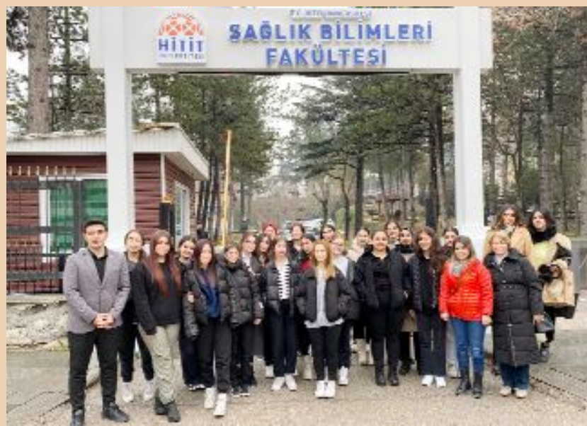
Öğrencilerin ilgisi hayli fazlaydı.