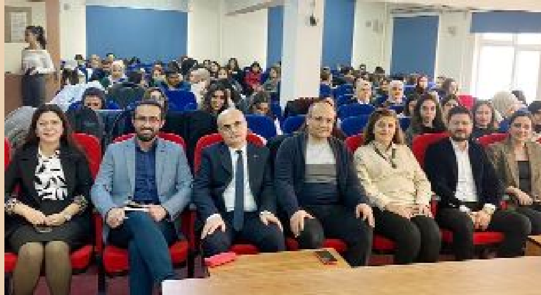
Sağlık Bilimleri Fakültesi’ndeki panelden...