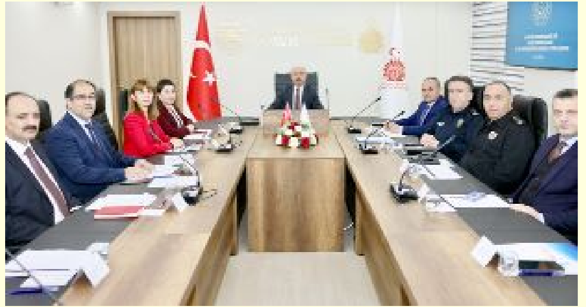
Çorum'da "Ailenin Korunması ve Güçlendirilmesi 2025 yılı 1. İl Koordinasyon Toplantısı", Vali Ali Çalgan'ın başkanlığında Valilik Toplantı Salonunda yapıldı.