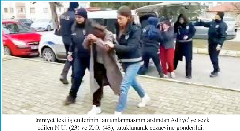
Emniyet'teki işlemlerinin tamamlanmasının ardından Adliye'ye sevk edilen N.U. (23) ve Z.O. (43), tutuklanarak cezaevine gönderildi.

Çorum'un Sungurlu ilçesinde girdikleri evden hırsızlık yapan 2 kadın, polis ekipleri tarafından düzenlenen operasyonla yakalandı. Yakalanmamak için kılık değiştiren hırsızlardan birinin 157, diğerinin 28 suç kaydının olduğu ortaya çıktı. *4'de