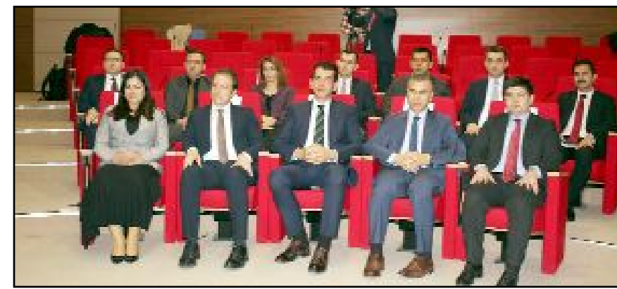
TSO Meclis Salonu'ndaki toplantıya kaymakamlar ile kamu kurum ve kuruluşlarının idarecileri katıldı.