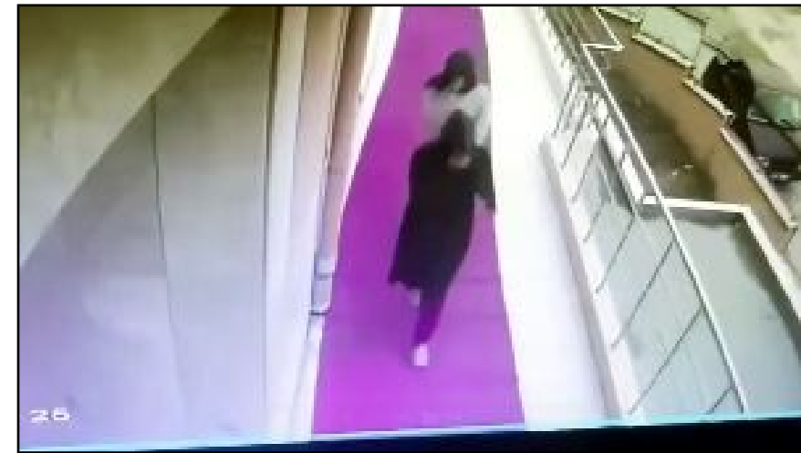
Z.O. ve N.U.'nun hırsızlık yaptıkları eve girme anları ve daha sonra ilçeden kaçtıkları anlar saniye saniye kameralara yansdı.

Öte yandan, Z.O. ve N.U.'nun hırsızlık yaptıkları eve girme anları ve daha sonra ilçeden kaçtıkları anlar saniye saniye kameralara yansdı. Görüntülerde şüphelilerin, elleri ile yüzlerini kameralardan gizlemeye çalıştığı görülüyor. (İHA)