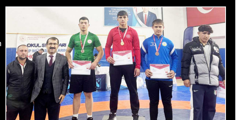
Sikketlerinde dereceye giren Çorumlu güreşçiler kürsüde görülüyor...

toplam 165 puan toplayan Şehit Mustafa Solak Anadolu Lisesi ikinci olarak 17-21 Şubat tarihleri arasında Tokat'ta yapılacak olan Türkiye Şampiyonası'nda mücadele etmeye hak kazandı. (Rifat KARA)