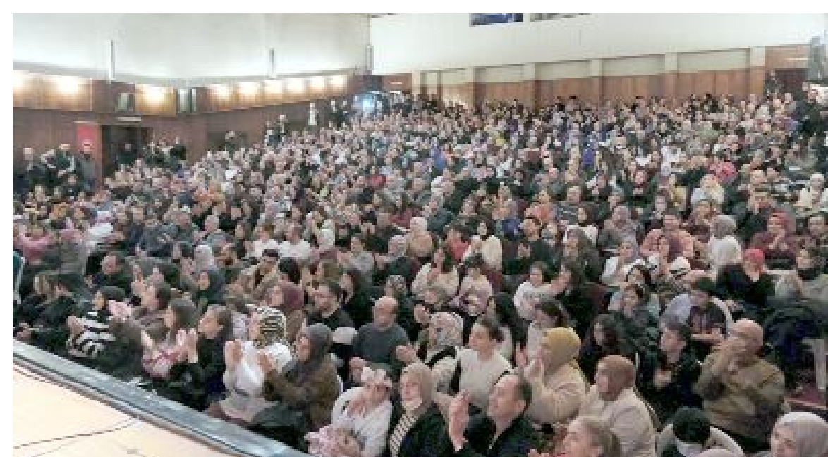
Konserde salonu dolduran vatandaşlar birbirinden güzel şarkılarıyla geçmişe yolculuk yaptı.