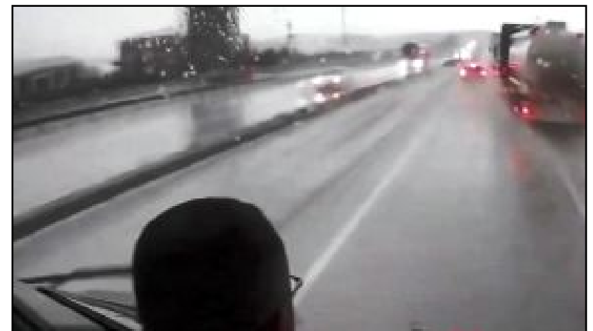
Emniyet'ten paylaşılan görüntülerde, TIR'ın yolun solunda seyir halindeki otobüsü sıkıştırdığı anlar yer aldı.