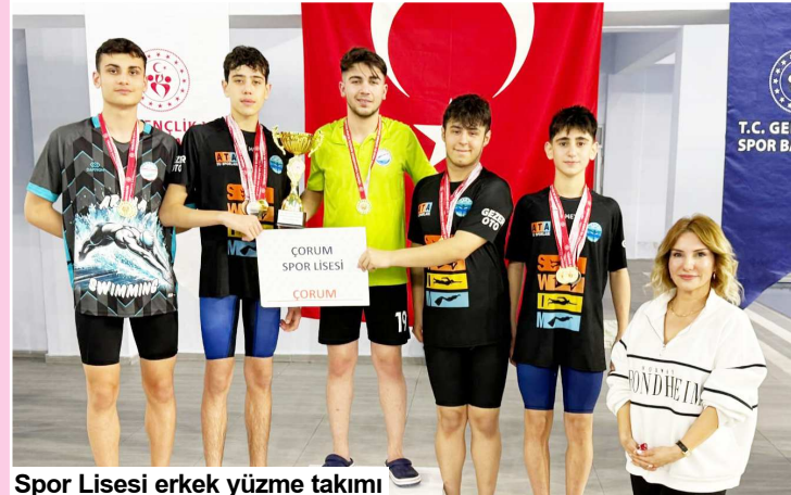
Spor Lisesi erkek yüzme takımı