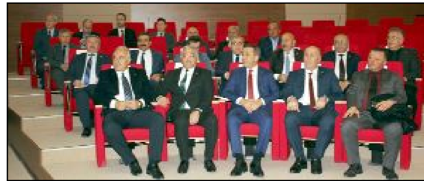
Toplantıya katılan belediye başkanları ilçelerindeki sorunları kurum yetkililerine ilettiler.