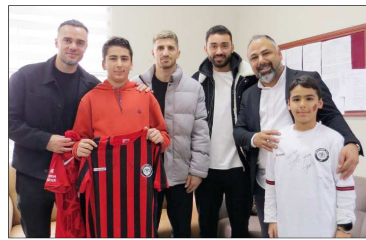
Çorum FK'lı futbolcular, okul yönetimi ve öğrenciler birlikte görüldü.