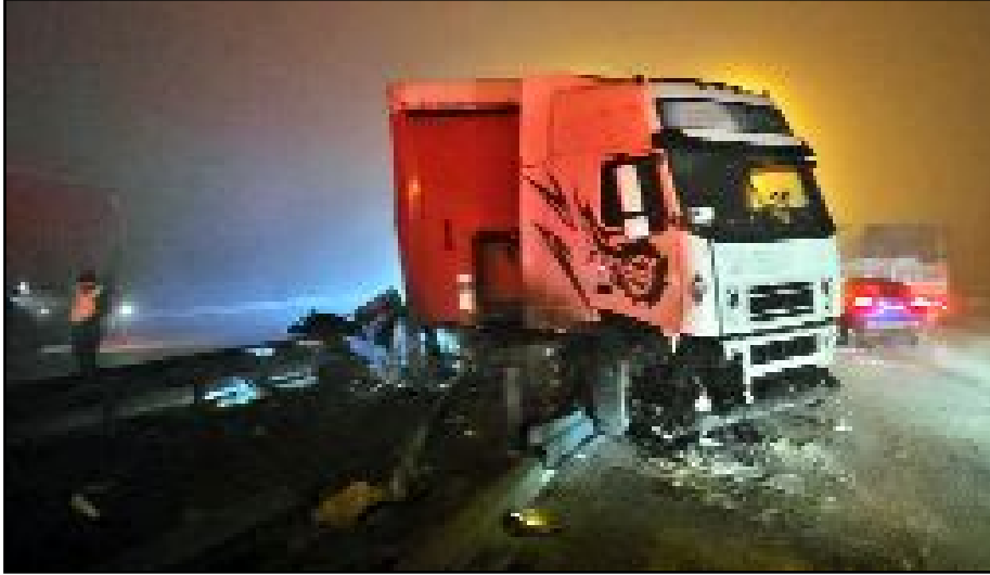
Refüjde bulunan aydınlatma direği çarpmanın etkisiyle devrilirken, kurtarma çalışmaları nedeniyle Çorum-Samsun kara yolunda uzun araç kuyruğu oluştu.

Çorum istikametine yaklaşık 2 saat kapalı kalan yol, TIR'ın kaldırılmasının ardından ulaşıma açıldı. (AA)