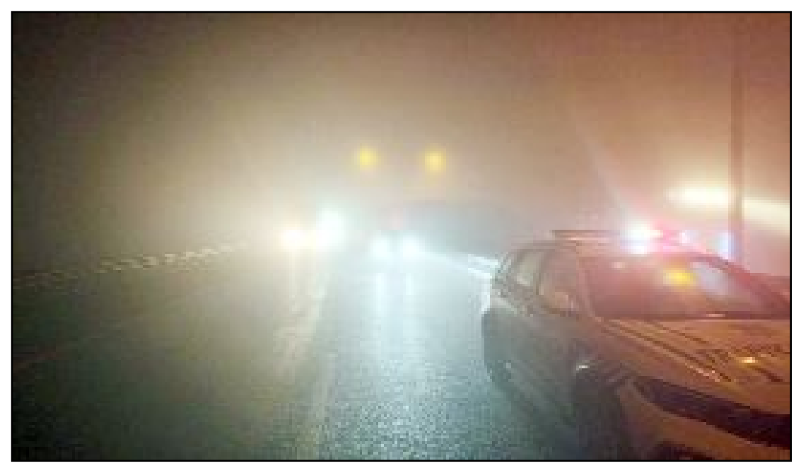
Görüş mesafesinin yer yer 30 metreye kadar düşmesi nedeniyle sürücüler trafikte ilerlemekte zorlandı.