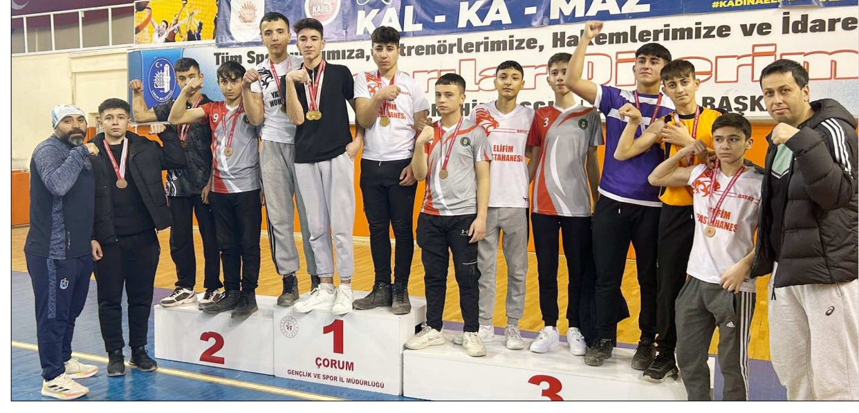
Sikketlerinde dereceye giren Bayatlı öğrenciler birlikte görülüyor...