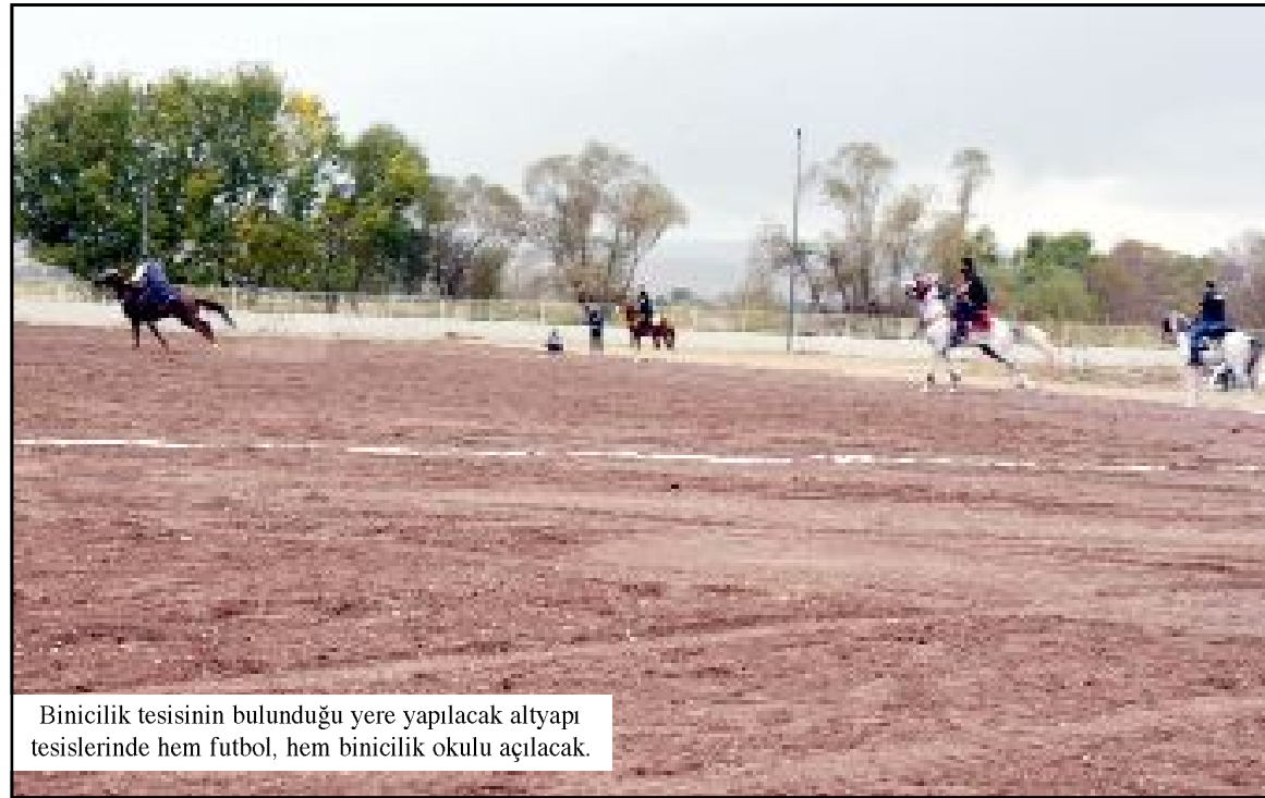
Binicilik tesisinin bulunduğu yere yapılacak altyapı tesislerinde hem futbol, hem binicilik okulu açılacak.

Artık kimse şeref tribününe bedava giremeyecek