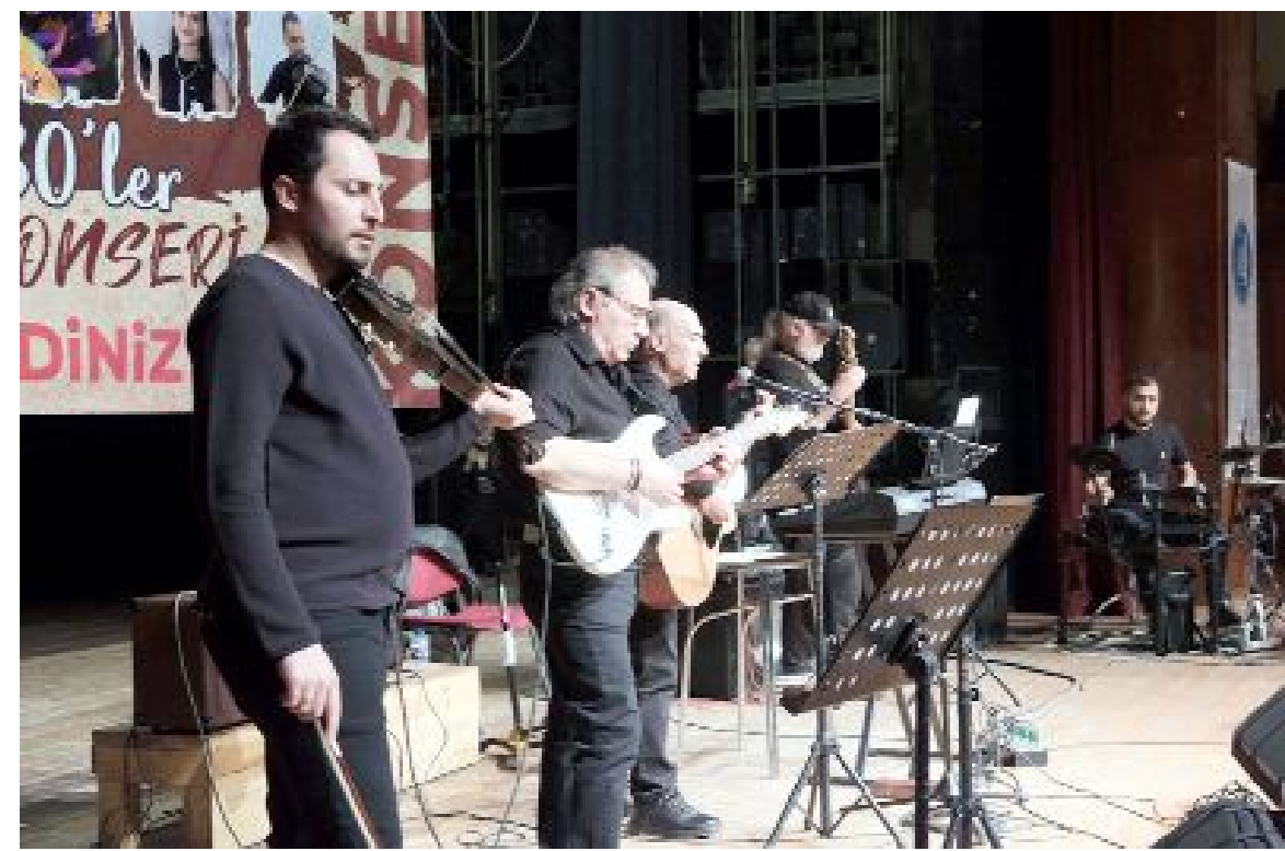
Yaklaşık 2 saat süren konserde Gelişim Orkestrası, 1970 ve 1980'li yıllarda hafızalara kazınan şarkıları seslendirdi.