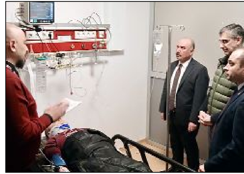
Çorum Valisi Ali Çalğan, yaralıları hastanede ziyaret ederek, geçmiş olsun dileklerini ilettiler.

Çorum'un Laçın ilçesinde iki otomobilin çarpışması sonucu ilçe jandarma komutanı ve ilçe karakol komutanı ile 2 kişi yaralandı.