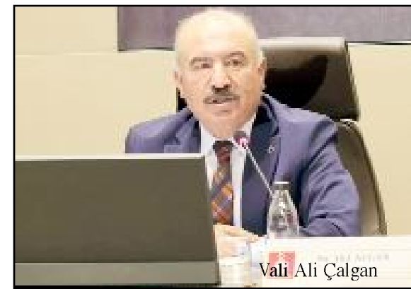
Vali Ali Çalgan

Çorum'da kamu kurum ve kuruluşlarına ait toplam tutarı 40 milyar 703 milyon lira olan 397 adet proje bulunduğunu belirten Vali Ali Çalgan, 397 projeden 254'ünün tamamlandığını, 80 projenin devam ettiğini, 3 projenin ihale aşamasında olduğunu, 12'sine ise