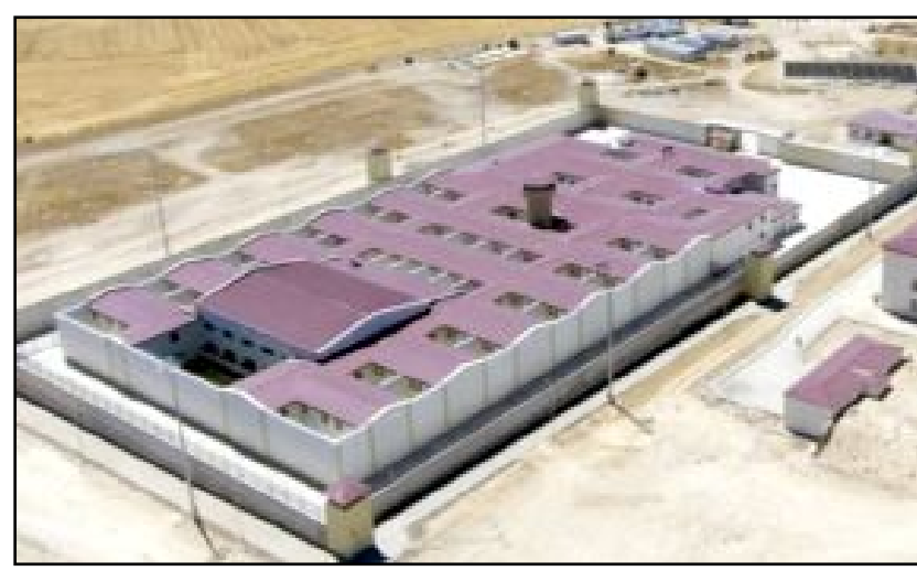
Osmançık'a yapılacak cezaevinde çok sayıda personel istihdam edilecek.