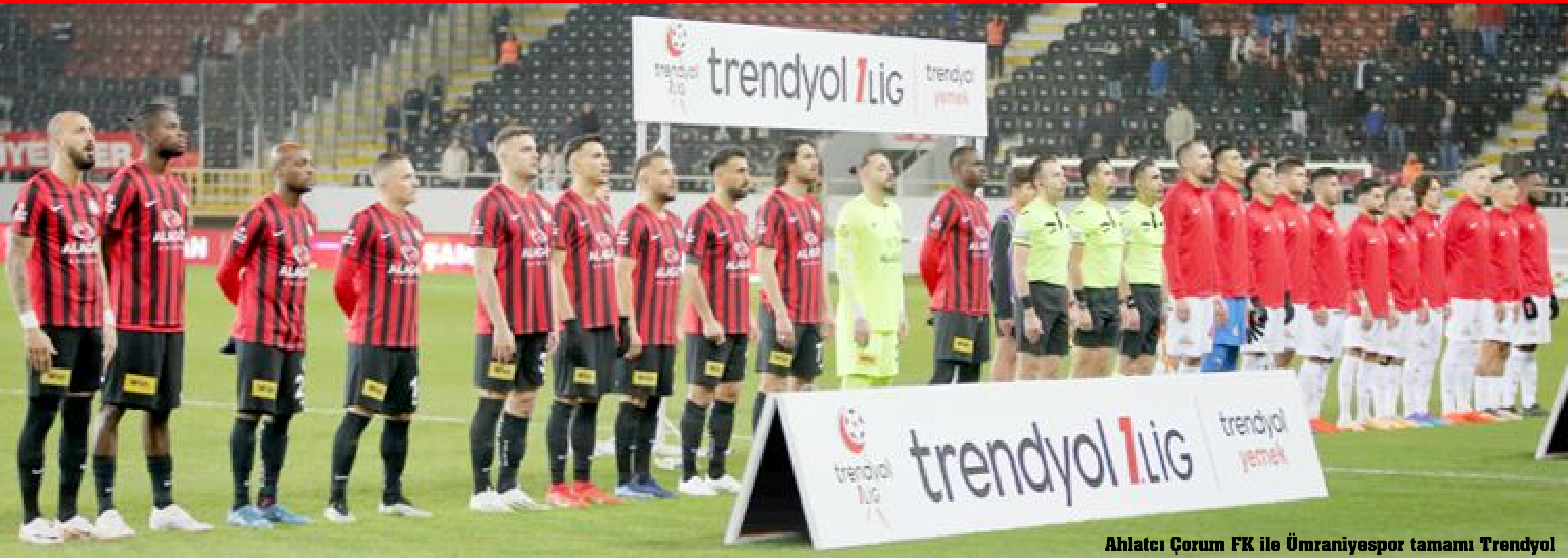
Ahlatcı Çorum FK ile Ümraniyespor tamamı Trendyol 1.Lig'de olmak üzere bugüne kadar 3 kez karşılaştı.