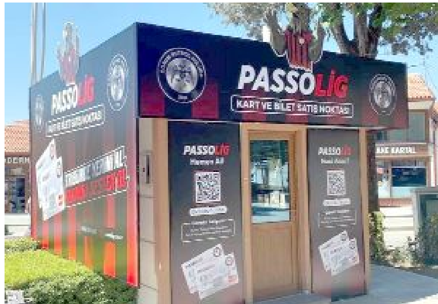
Passolig kartları, Saat Kulesi yanındaki Hürriyet Parkı'nda bulunan Passolig gişesinden alınabiliyor.

Ücretsiz giriş için passolig zorunluluğuna dikkat çekilen açıklamada, passolig kartlarının en geç Cuma (bugün) saat 19.00'a kadar Saat Kulesi Hürriyet Parkı Passolig gişesinden alınabileceği belirtildi. (Hüseyin AŞKIN)