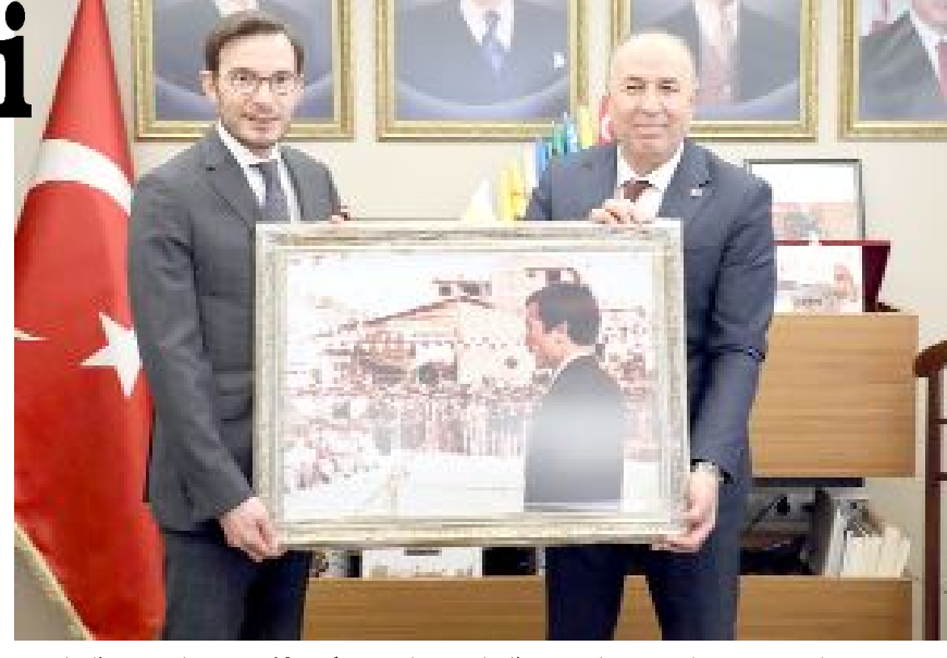
Belediye Başkanı Şerif Arslan, Tokat Belediye Başkanı Mehmet Kemal Yazıcıoğlu'na babasının Alaca Kaymakamlığı döneminde çekilmiş fotoğrafını armağan etti.

Alaca Belediyesi'nden yapılan yazılı açıklamaya göre Yazıcıoğlu, babasının görev yaptığı Alaca Kaymakamlığı'nı ziyaret etti.