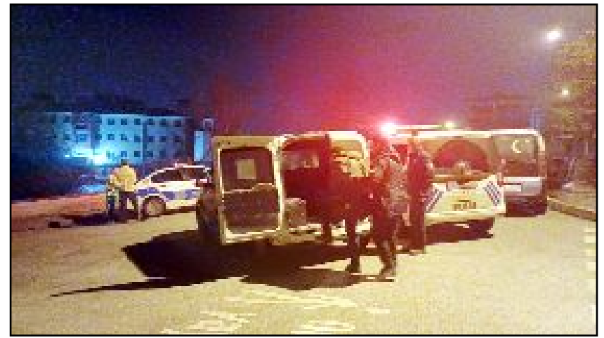
Şahıs üzerinde ve araçta yapılan aramada 1 adet ruhsatsız tabanca, 8 adet fişek ve 1 adet bıçak ele geçirildi.

Yapılan kontrollerde şahsın 0.82 promil alkollü olduğu tespit edildi. 11 bin 600 lira idari para cezası uygulanan şahsın aracı ise çekici ile otoparka çekildi. Şahıs gözaltına alındı. (İHA)