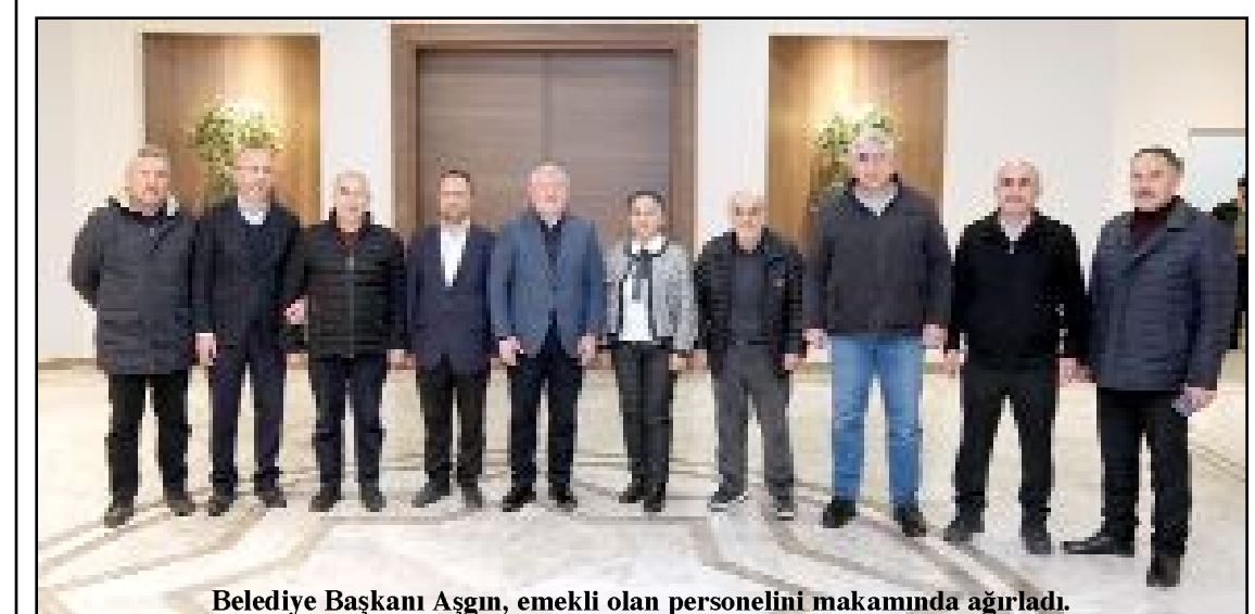
Belediye Başkanı Aşgın, emekli olan personelini makamında ağırladı.