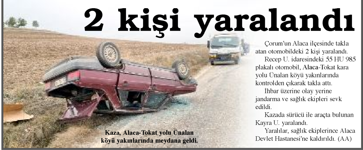
Kaza, Alaca-Tokat yolu Ünalın köyü yakınlarında meydana geldi.

Çorum'un Alaca ilçesinde takla atan otomobildeki 2 kişi yaralandı.