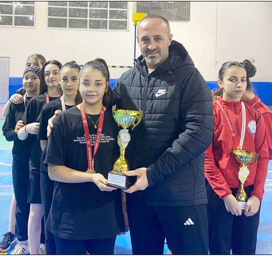
Dereceye giren okullara kupa ve madalyaları verildi.

Okullararası düzenlenen Genç Kızlar Badminton İl Birinciliği'nde şampiyon belli oldu.