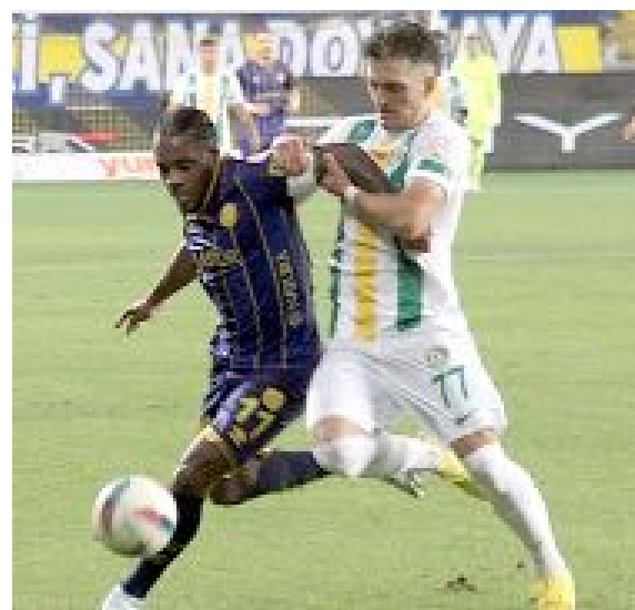
İki takım arasında sezonun ilk yarısında oynanan maçtan bir enstantane.

İki takım arasında, sezonun ilk yarısında Ankara'da oynanan maçta Başkent ekibi 2-0 kazanmıştı. (Hüseyin AŞKIN)