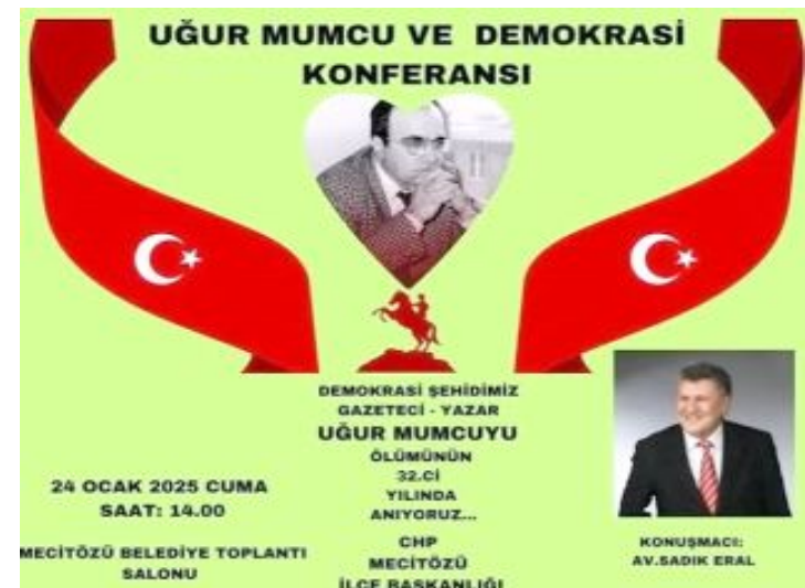
Uğur Mumcu için düzenlenen programın afişi