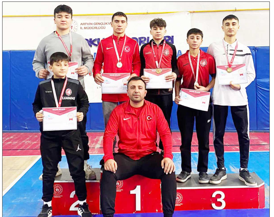
Türkiye Şampiyonası'nda mücadele edecek Çorumlu güreşçiler...

Bu güreşçiler Tokat'ta yapılacak Türkiye Şampiyonasına katılmaya hak kazandılar. (Rifat KARA)