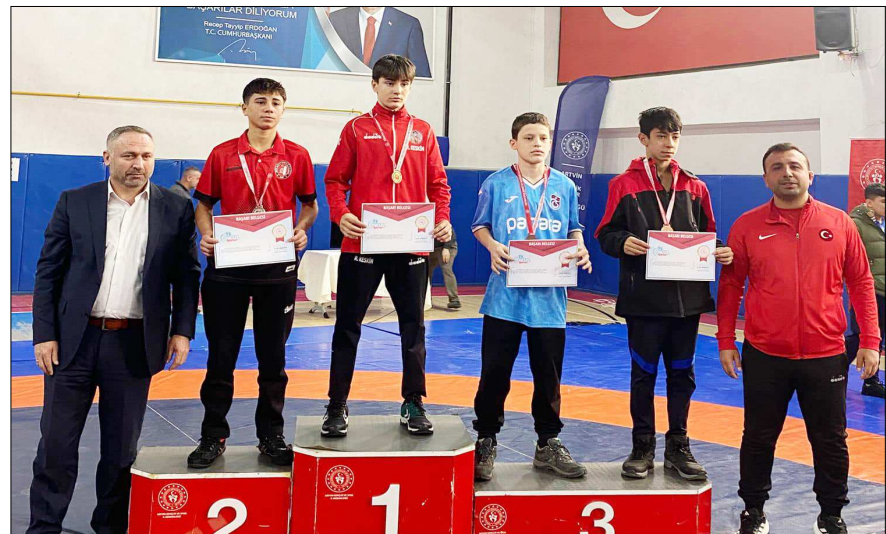
Çorumlu güreşçiler ödül kürsüsünde görülüyor...

Artvin'de düzenlenen Okul Sporları B Gençler grekoromen güreş grup birinciliğinde kürsüye çıkan altı güreşçi Türkiye Şampiyonasına katılmaya hak kazandılar.