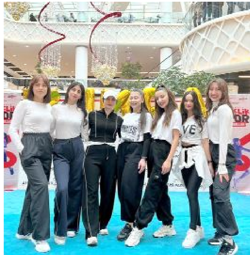
Çorum Gençlik ve Spor İl Müdürlüğü ve PilateSystem iş birliğiyle zumba gösterisi yapıldı.

keyfini çıkararak sporu hayatın içine entegre etmenin mutluluğunu yaşad. (Volkan SINAYUÇ)