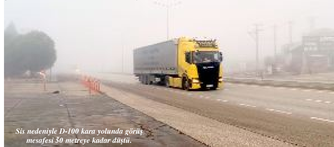
Sis nedeniyle D-100 kara yolunda görüş mesafesi 50 metreye kadar düştü.

Sis nedeniyle D-100 kara yolunda görüş mesafesi 50 metreye kadar düştü. Sürücüler trafikte hızlarını düşürerek ilerledi. Öğle saatlerine kadar etkili olması beklenen sis nedeniyle trafik ekipleri sürücülere dikkatli olmaları yönünde uyarda bulundu.(İHA)