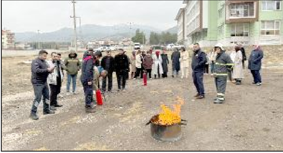
Eğitimde, afet anında yapılması gereken doğru davranışlar, yangın güvenliği ve acil durum müdahale yöntemleri detaylı şekilde anlatıldı.