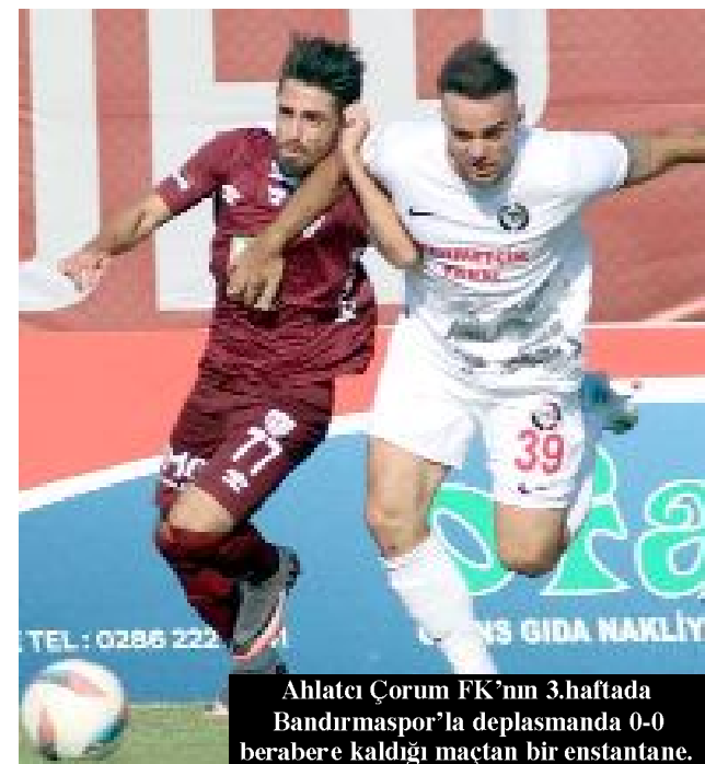
Ahlatıcı Çorum FK'nın 3.haftada Bandırmaspor'la deplasmanda 0-0 berabere kaldığı maçtan bir enstantane.

Öte yandan, son 3 haftada alınan beraberlikler aynı zamanda Ahlatıcı Çorum FK'nın bu sezonki en uzun ikinci beraberlik serisi oldu. Kırmızı-siyahlı ekip 2.haftada Fatih Karagümrük'le 2-2, 3.haftada Bandırmaspor'la 0-0, dördüncü haftada da Sakaryaspor'la 1-1 berabere kalarak üst üste 3 beraberlik almıştı. (Hüseyin AŞKIN)