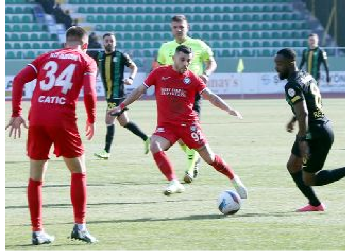
Ahlatcı Çorum FK, en son Şanlıurfaspor maçında gol bulamadı.