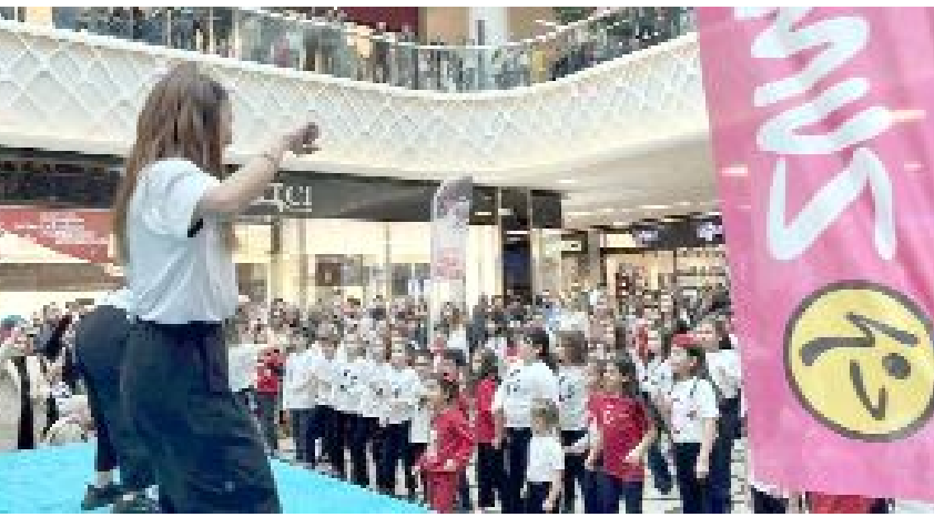
AHL Park AVM'de haftasonu düzenlenen etkinlik büyük ilgi gördü.