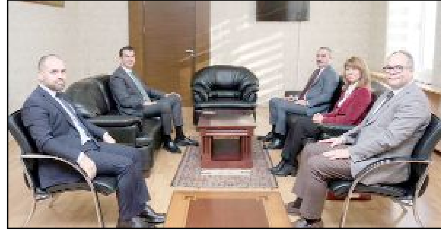
Ziyaretlerde; Sungurlu Organize Sanayi Bölgesi'nde yapılan çalışmalar değerlendirilerek, akademik zeminde katkı sağlayacak noktalar üzerinde duruldu.