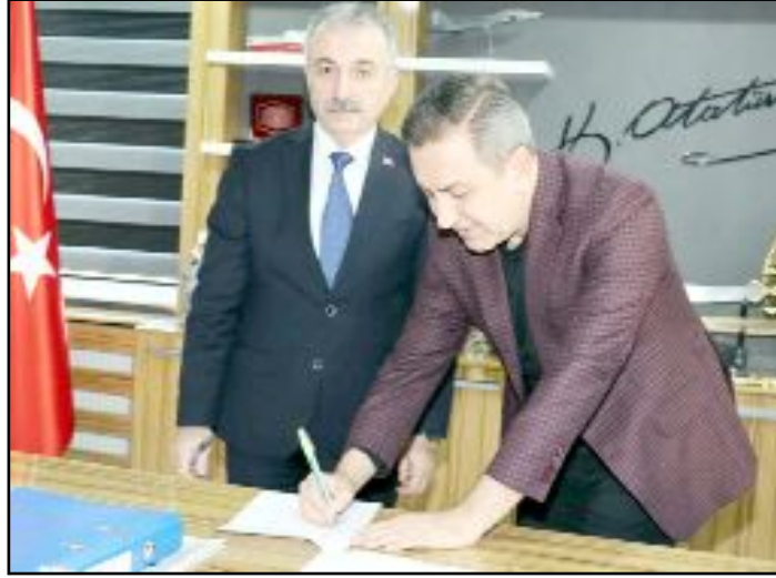
Sungurlu Belediyesi ile Türk Yerel Hizmet Sendikası arasında SDS imzalandı.