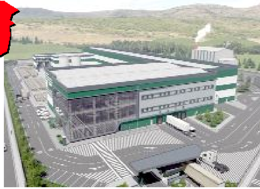
Sungurlu OSB'de yapımına başlanan tesiste yıllık 144 bin ton üretim yapılarak ekonomiye 100 milyon Euro'luk katkı sağlanması hedefleniyor.