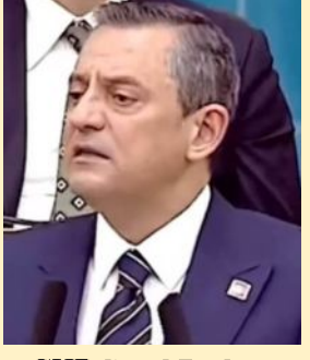
CHP Genel Başkanı Özgür Özel

“İhaleyi alan şirketi 40 gün önce duyurduk”