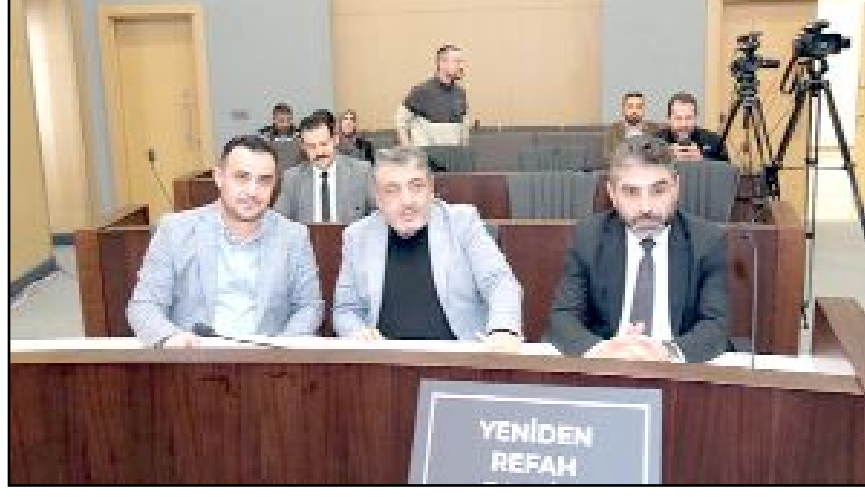
Belediye Meclisi'nin Ocak ayı oturumu dün gerçekleştirildi.

sermayesi 65 milyon artırılarak 312 milyon, 27 milyon lira olan Beltur'un sermayesi ise 25 milyon lira artırılarak 52 milyon lira oldu. (Taner ŞİMŞEK)