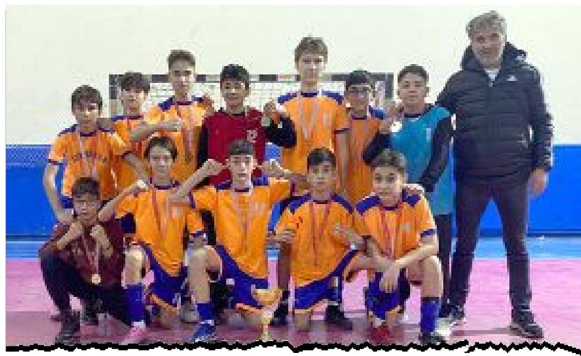
23 Nisan, finalde Mimar Sinan'ı 2-1 yenerek şampiyonluk ipini göğüsledi.