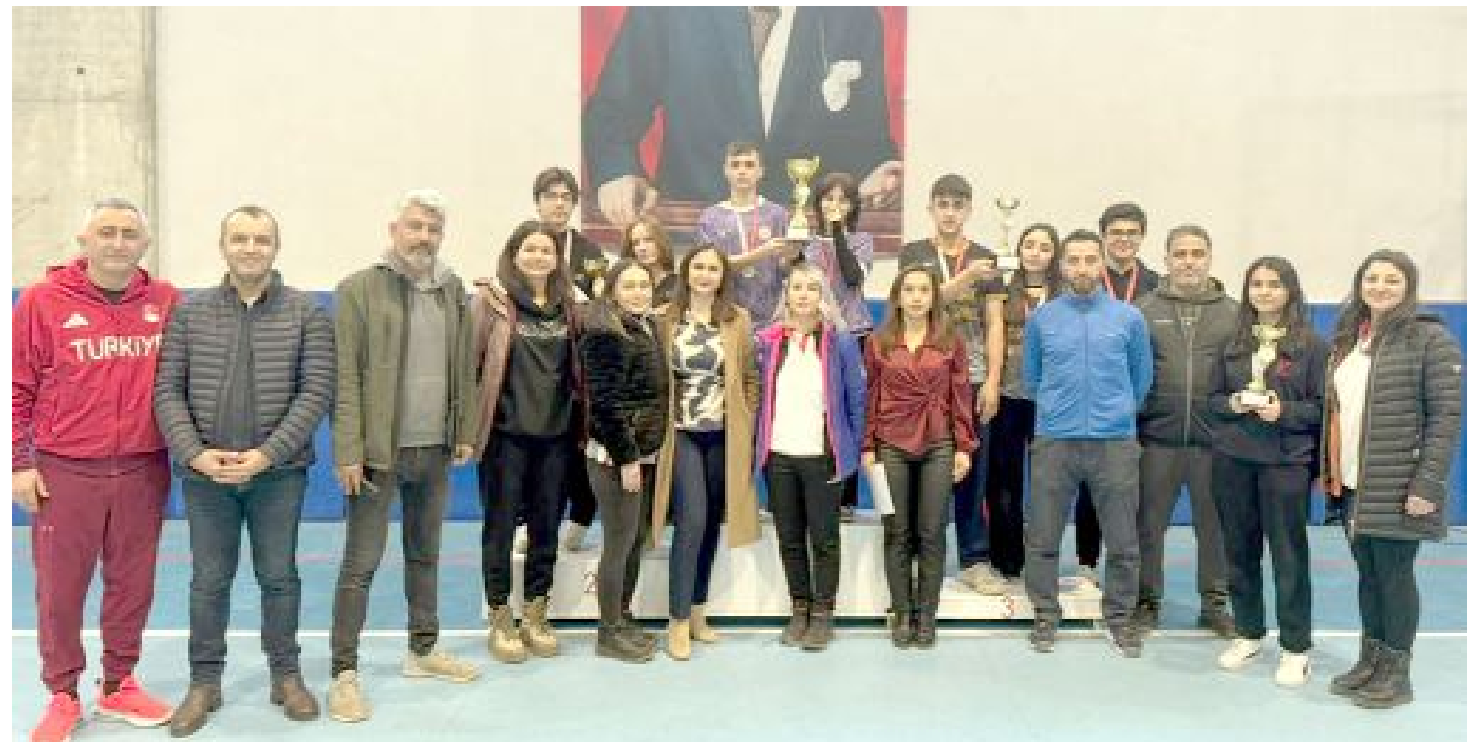
10 okuldan 30 sporcunun katılımıyla yapılan turnuvada dereceye giren takımlar ödül töreninden sonra yetkililerle birlikte görüldüler.