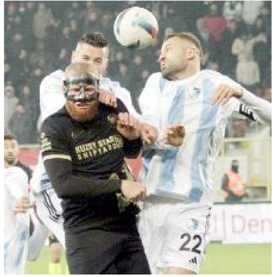
Ahlatcı Çorum FK, sahasında oynadığı Kocaelispor, Iğdır FK ve Erzurumspor maçlarında gol atamadı.

EN GOLCÜ; KARAGÜMRÜK Trendyol Türkiye 1.Futbol Ligi'nde geride kalan 18 haftalık periyotun en golcü takımı ise Fatih Karagömrük oldu. İstanbul temsilcisi 18 maçta 33 golle zirvede yer alırken, İstanbulspor 31 golle ikinci, Kocaelispor 30 golle üçüncü sırayı alıyor.