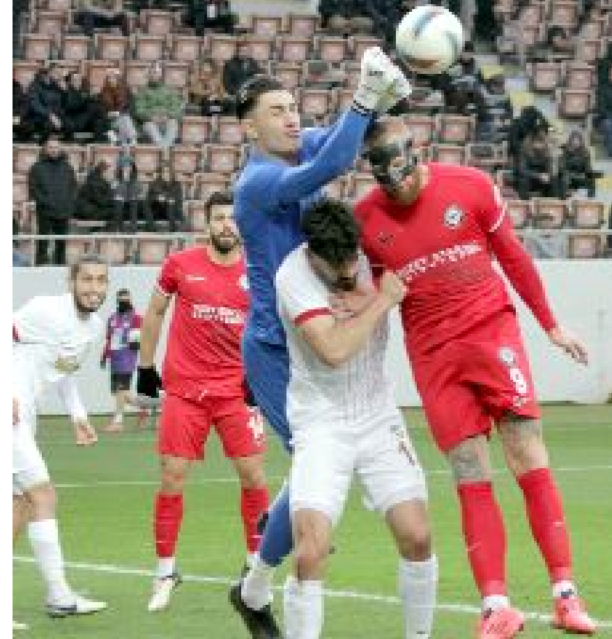
Ahlatıcı Çorum FK'nın sahasında Amed Sportif Faaliyetler'le 1-1 berabere kaldığı maçtan bir enstantane.

● Trendyol 1.Futbol Ligi'ndeki 8.beraberliğini alan Ahlatıcı Çorum FK, 18.haftalar itibariyle tarihinin en çok beraberlik aldığı ikinci sezonunu geçiriyor. Kırmızı-siyahlı ekip, Amedspor'la birlikte 1.Lig'in en çok beraberlik alan iki takımından biri, profesyonel liglerde mücadele eden 139 takım arasında da en çok beraberlik alan 8 takımdan biri olarak dikkat çekiyor.