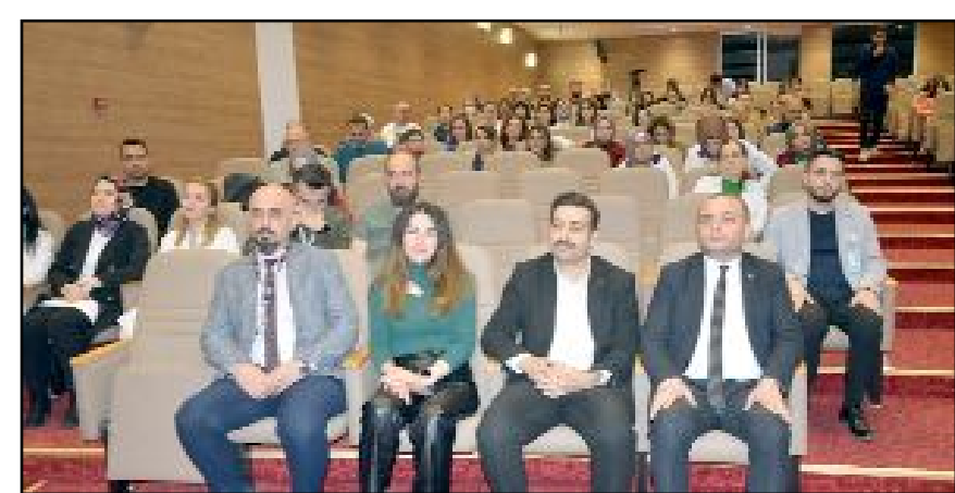
Hitit Üniversitesi Erol Olçok Eğitim ve Araştırma Hastanesi'nde 21 Mart Dünya Down Sendromu Farkındalık Günü kapsamında özel bir program düzenlendi