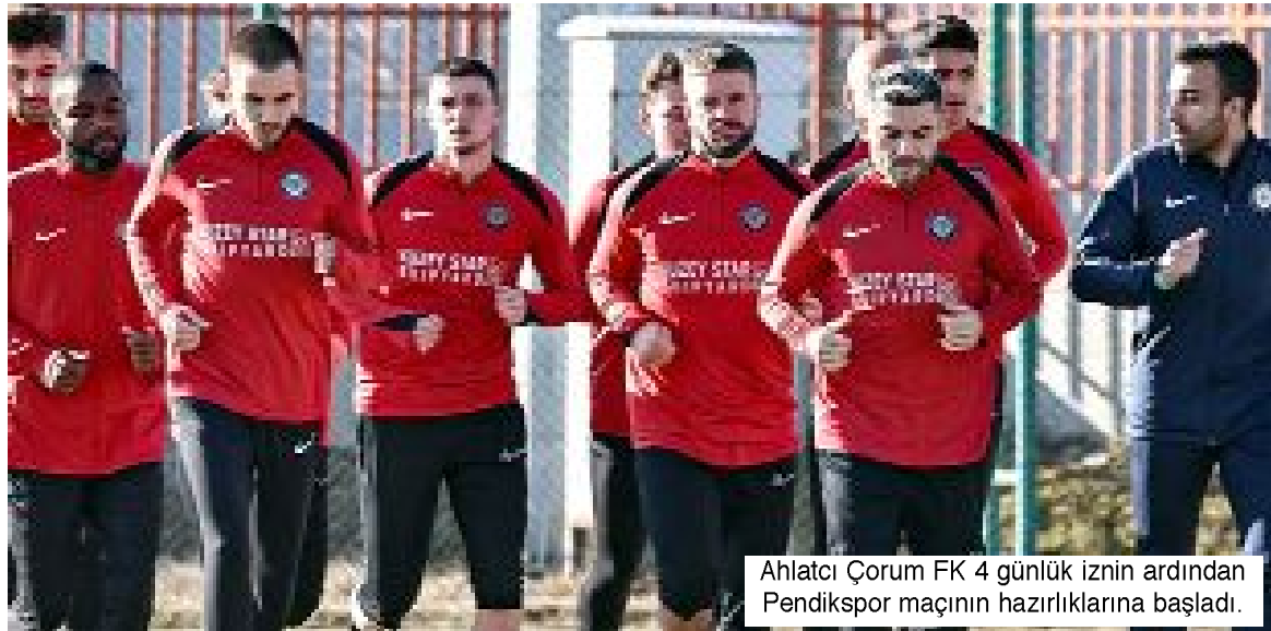
Ahlatçı Çorum FK 4 günlük iznin ardından Pendikspor maçının hazırlıklarına başladı.

Ahlatçı Çorum FK ile Pendikspor arasında, 29 Mart Cumartesi günü, Pendik Stadi'nda oynanacak maç saat 16.00'da başlayacak. (Hüseyin AŞKIN)