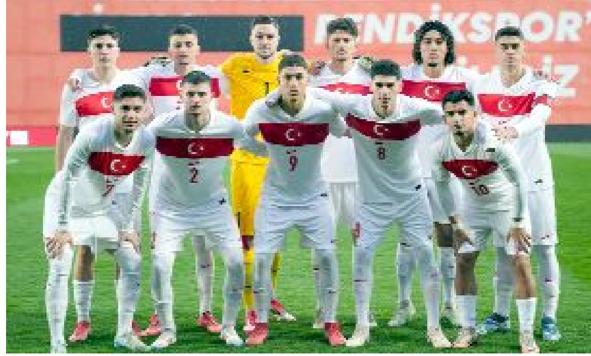
U20 Futbol Millî Takımımızın İtalya ile oynadığı maçtaki ilk 11'li...

Türkiye, Elit Lig'deki son maçında 25 Mart Salı günü Romanya ile deplasmanda karşılaşacak. (Hüseyin AŞKIN)