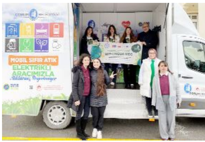
Mehmetçik Anadolu Lisesi öğrencileri Erasmus + Dil projesi ile Avrupa'da dikkat çekti.