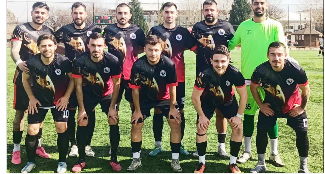
8 haftada 20 puan toplayan H.E.Kültürspor yenilgisiz zirvede yer alıyor...

Yarın 12.00'de oynanacak maçlarda Mimar Sinan Sahası'nda Mimar Sinanspor ile Mecitözü Gençlerbirliği, Devane Sahası'nda Çorum İdman Yurdu ile Osmançık Kandiberspor, İtfaiye Sahası'nda ise Hattuşaspor ile İskilipgücü karşı karşıya gelecek. Sungurlu İlçe Sahası'nda saat 14.00'de başlayacak maçı ise Sungurlu Belediyesi ile Gençlerbirliği takımları karşılayacak. (Rifat KARA)