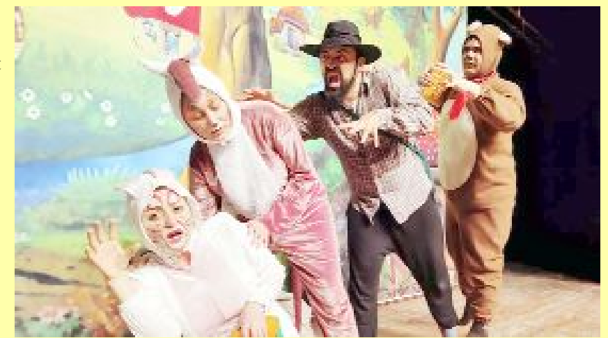
Çorum Çocuk Tiyatrosu tarafından sahnelenen ve Caner Ergan'ın yazıp yönettiği oyun 23 Mart Pazar günü sahnelenecek.