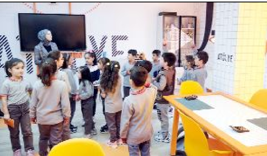
Öğrenciler atölye içerisinde yer alan sınıflarda uygulamalı olarak ders gördü.