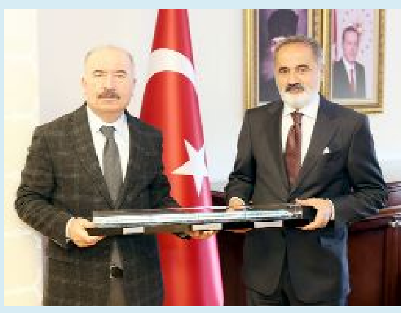
TCDD Genel Müdürü ve Yönetim Kurulu Başkanı Veysi Kurt'un Vali Ali Çalgan'a yaptığı ziyarette hızlı tren çalışmalarını ve gelinen son durum görüşüldü.