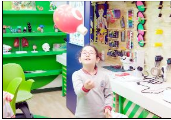
Farklı okullardan öğrenciler Bilim Çorum'a gelerek atölyeleri gezdi, çalışmalar yaptı.