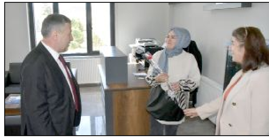
Ziyarete İŞKUR'un kadın istihdamına desteğinin devam edeceği de belirtildi.