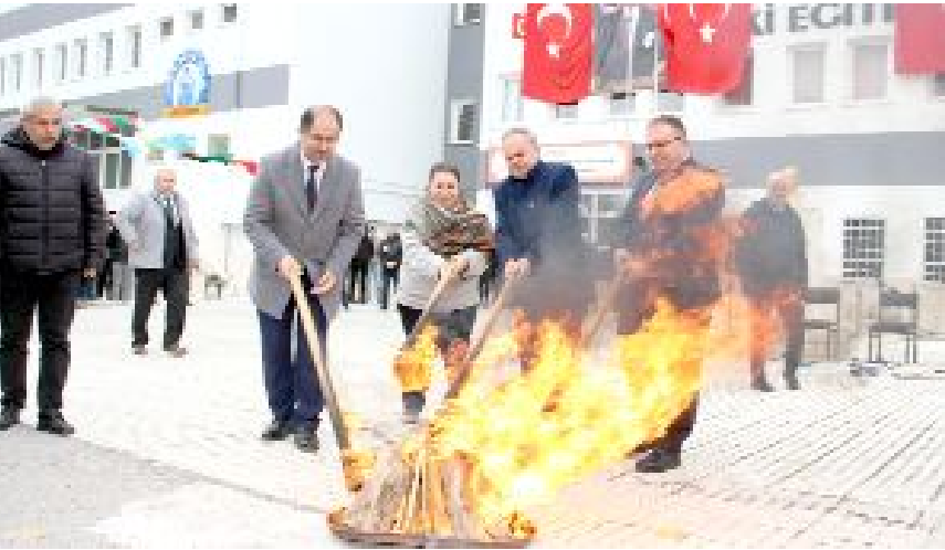
Çorum Valiliği, İl Kültür ve Turizm Müdürlüğü, Çorum Belediyesi, İl Millî Eğitim Müdürlüğü ve İl Özel İdaresi işbirliğiyle 21 Mart Nevruz Bayramı nedeni ile düzenlenen programda Nevruz ateşi yakılarak halaylar çekildi.