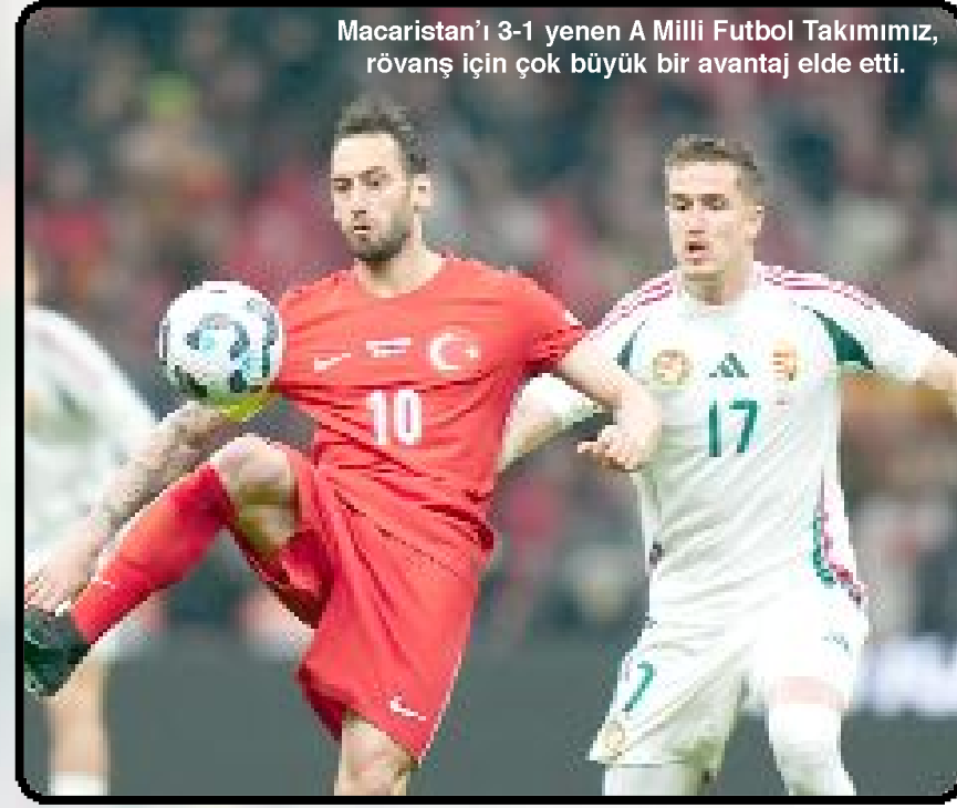
Macaristan'ı 3-1 yenen A Milli Futbol Takımımız, rövanş için çok büyük bir avantaj elde etti.

Maça yedek kulübesinde başlayan İrfan Can Kahveci, 72. dakikada Oğuz Aydın'ın yerine dahil oldu. Çorumlu futbolcu, 1 dakika sonra, topl