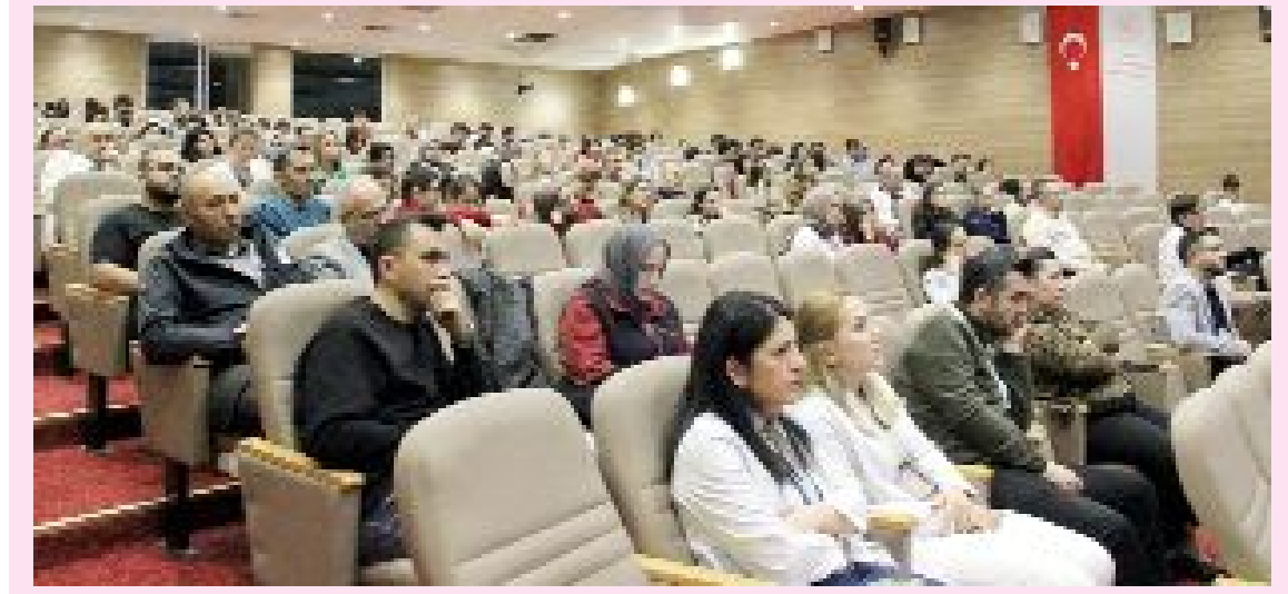
Hitit Üniversitesi Erol Olçok Eğitim ve Araştırma Hastanesi'nde 21 Mart Dünya Down Sendromu Farkındalık Günü kapsamında özel bir program düzenlendi.

● Çorum Belediyesi, kardeş şehir Afşin Belediyesi'nin taleplerine duyarsız kalmıyor. ● Belediye Meclisi'nin oybirliğiyle aldığı karar doğrultusunda Çorum Belediyesi Park ve Bahçeler Müdürlüğü tarafından temin edilen 10 adet kamerye, Afşin'e gönderildi. •3'de