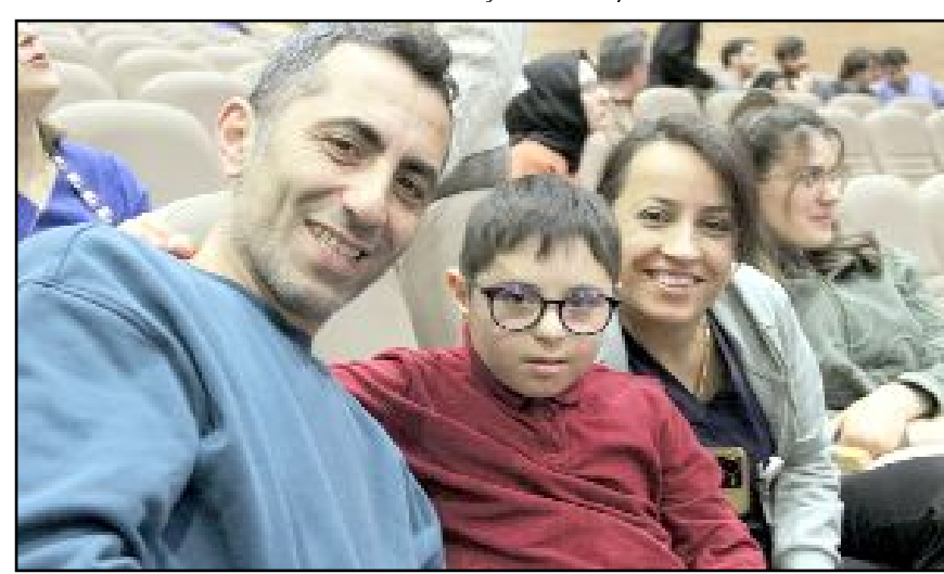
Çorum'da, Dünya Down Sendromu Farkındalık Günü kapsamında özel bir program gerçekleştirildi.