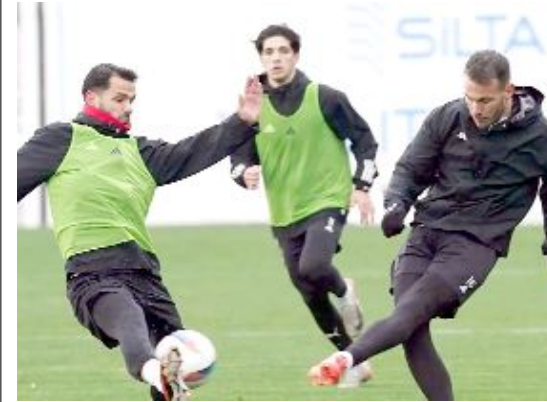
Pendikspor, Çorum FK maçının hazırlıklarına başladı.