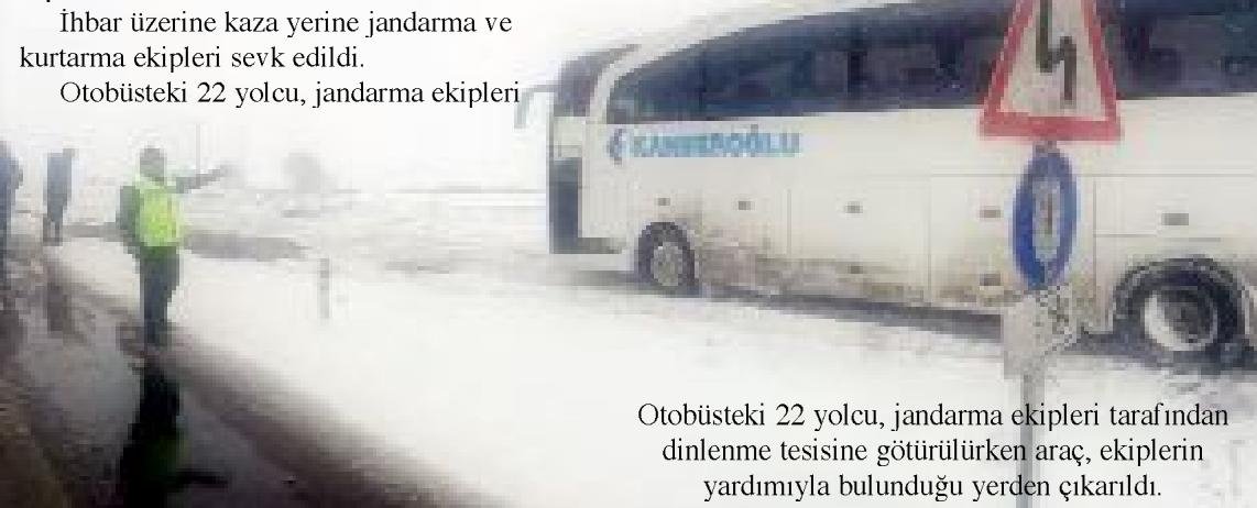
Otobüsteki 22 yolcu, jandarma ekipleri tarafından dinlenme tesisine götürülürken araç, ekiplerin yardımıyla bulunduğu yerden çıkarıldı.

Ekipler, sürücülerini buzlanma ve kar yağışı nedeniyle dikkatli olmaları konusunda uyardı. (AA)