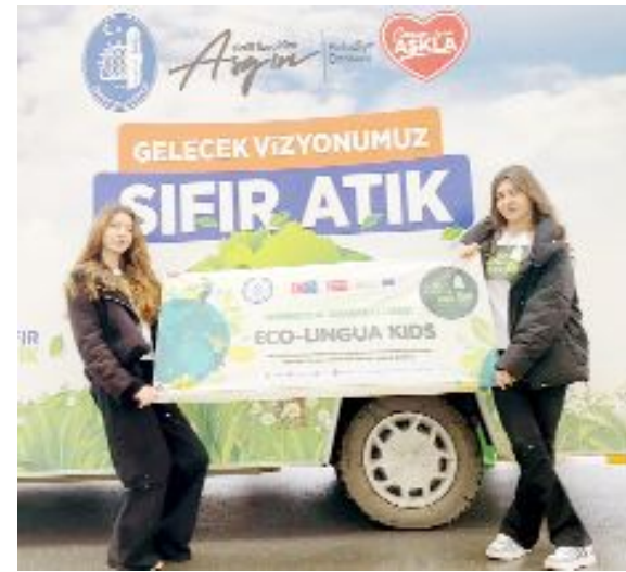
Çorumlu öğrenciler proje kapsamında kent içinde bir dizi etkinliği yaptı.

aynı zamanda dil yeteneklerini geliştirmelemlerini sağlayan proje, eğitim alanında sürdürülebilir kalkınma hedeflerine de katkı sağlıyor. (Volkan SINAYUÇ)