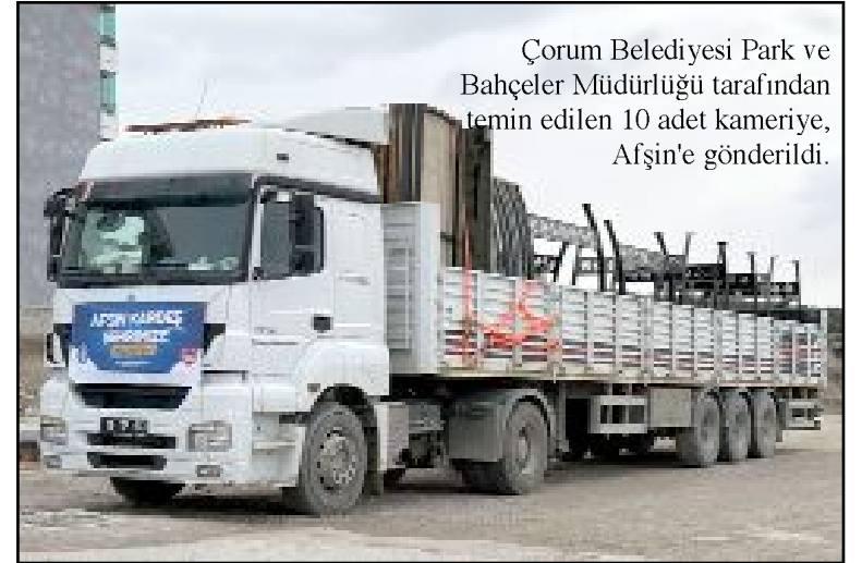
Çorum Belediyesi Park ve Bahçeler Müdürlüğü tarafından temin edilen 10 adet kamerye, Afşin'e gönderildi.

Çorum Belediye Meclisi Şubat ayı oturumunda kardeş şehir Afşin Belediyesi'nin kamerye talebi görüşülerek karar bağlanmıştır. Belediye Meclisi'nin oybirliğiyle aldığı karar doğrultusunda Çorum Belediyesi Park ve Bahçeler Müdürlüğü tarafından temin edilen 10 adet kamerye, Afşin'e gönderildi. (Haber Merkezi)