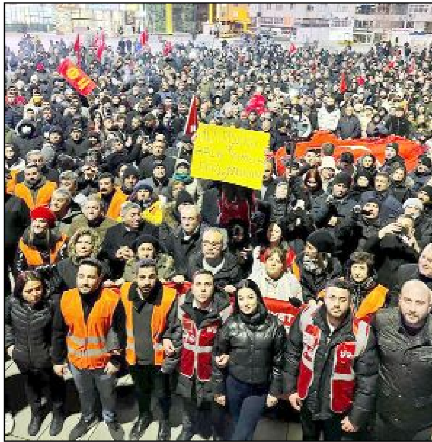
Tarihi bir kalabalıkla yapılan miting Bahabey Caddesi Yeşil Fırın önünden başlayıp, Kadeş Barış Meydanı'nda tamamlandı.

adalet mücadelemiz bizlerin tek başına vereceği mücadeleye değildir. Çocuklarımızın, ülkemizin geleceği için, aydınlık yarınlar için bu mücadeleyi hep birlikte vermek zorundayız.