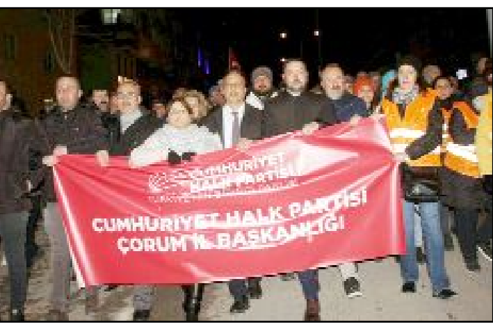
Binlerce vatandaşın katıldığı yürüyüş ve mitingde, "Her şey çok güzel olacak", "Hak-hukuk-adalet", "Kurtuluş yok tek başına, ya hep beraber, ya hiçbirimiz" sloganları atıldı.