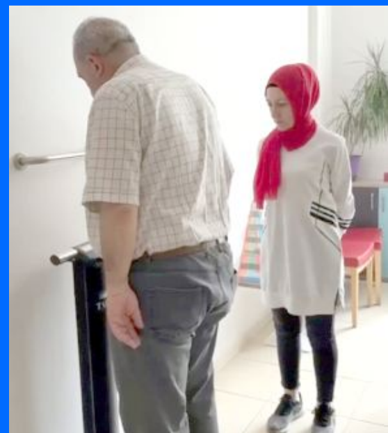
6 ay süre ile diyetisyenin takibinde olan vatandaş 24 kilo vermeyi başardı.

● Sağlıklı Hayat Merkezi Diyet Polikliniği'ne başvuran 59 yaşındaki kişi 132 kilogramdan 108 kiloya düşmeyi başardı. •2'de