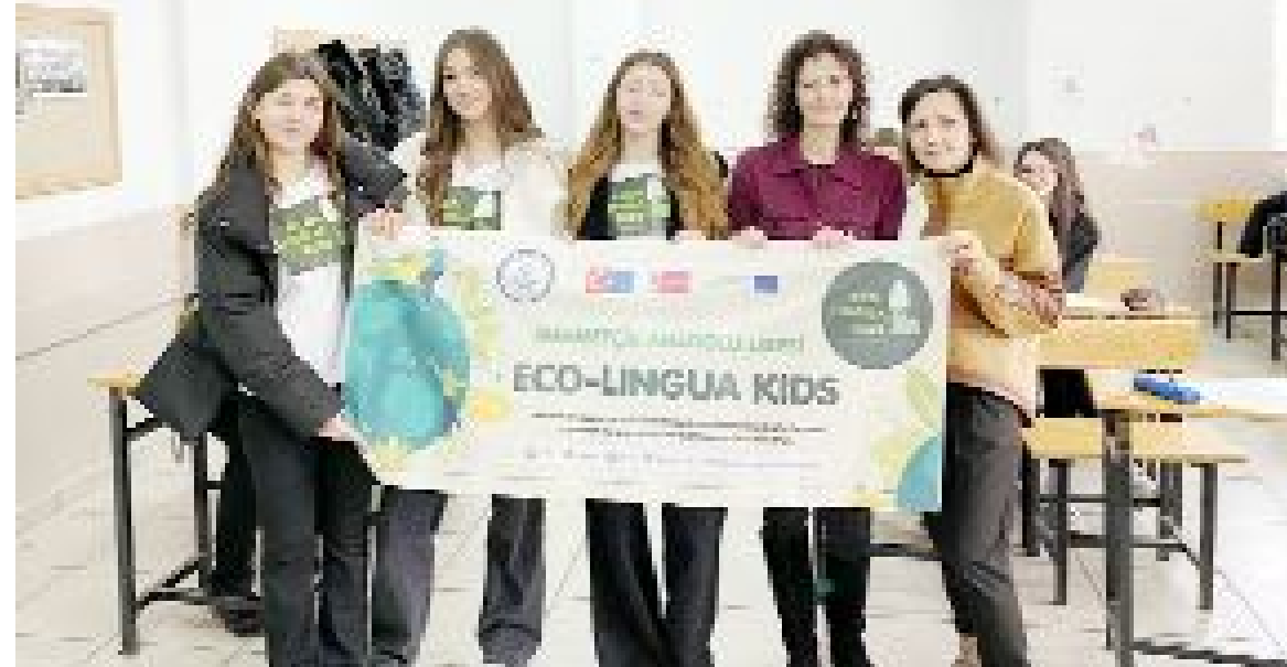
Mehmetçik Anadolu Lisesi projesi ile yenilikçi bir eğitim yaklaşımını sergiledi.