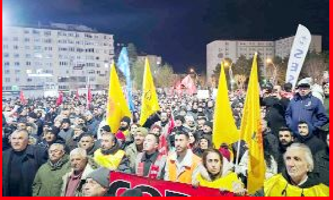
Ekrem İmamoğlu'nun 23 Mart'ta yapılacak Cumhurbaşkanlığı aday belirleme seçimleri öncesi diplomasının iptal edilmesi ve gözaltına alınması karşısında eylem zinciri başlatan CHP Çorum İl Örgütü ve Çorum Emek ve Demokrasi Platformu, ikinci protesto mitingini gerçekleştirdi.

● Ekrem İmamoğlu'na destek amacıyla yapılan yürüyüşte konuşan CHP İl Başkanı Av. Dinçer Solmaz, Ekrem İmamoğlu'nun girdiği tüm seçimlerden galibiyetle çıktığını belirterek, "Bu yüzden Erdoğan'ın tercihi, bir kez daha milletın karşısına devleti dikmek, bu milletın istediğini cumhurbaşkanı seçebilme özgürlüğünü elinden almak olmuştur. Ama unutmasınlar ki, kazanan yine millet iradesi olacaktır" dedi. •4'de