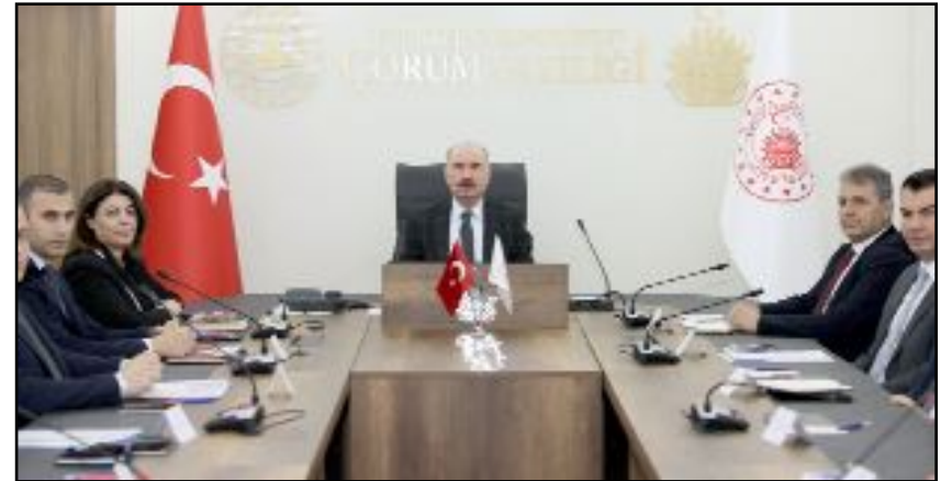
Vali Çalgan yönetiminde düzenlenen toplantıya ilçe kaymakamları, belediye ve kamu kurumlarının yetkilileri katıldı.

Toplantıda; kaymakamlıklar, belediyeler ve kamu kurumları tarafından hazırlanan, Avrupa Birliği (AB) fon ve mali kaynakları başta olmak üzere, yurt içi ve yurt dışı fonlar ile finanse edilen projelerin uygulama süreçleri ele alındı. Güncel proje çağrılarının hakkında bilgilendirmeler yapıldı. Vali Ali Çalgan, uygulama sürecinde olan projelerin takip edilmesi ve biran önce tamamlanması, aynı zamanda işbirliği ve koordinasyon içerisinde yeni proje çalışmalarının yapılması yönünde talimat verdi. (Volkan SINAYUÇ)