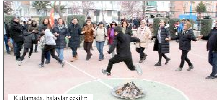
Kutlamada, halaylar çekilip ateşin üstünden atlandı.

Çorum Emek ve Demokrasi bileşenleri olarak buradan bir kez daha haykırıyoruz savaşa, sömürüye ve zulme karşı; toplumsal barışı, bir arada yaşamı halklar kurtacak." (Taner ŞİMŞEK)