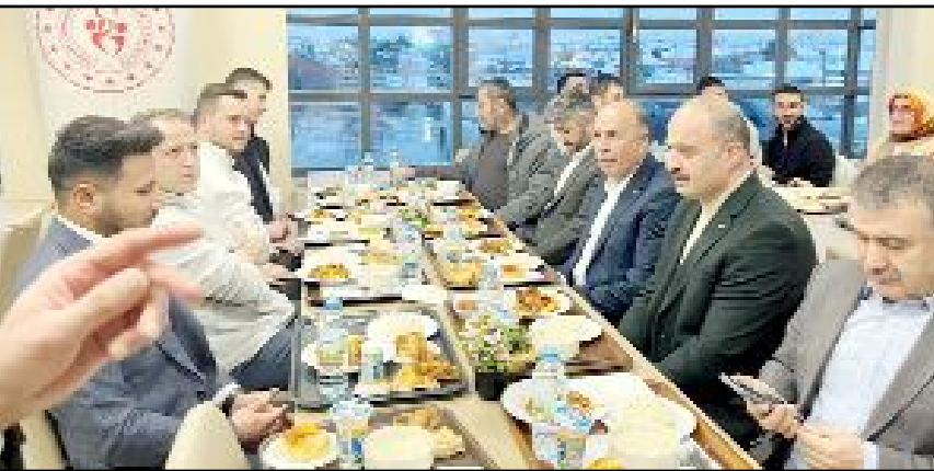
Alaca'da protokol üyeleriyle KYK yurdunda kalan öğrenciler düzenlenen iftar programında bir araya geldi.

Ramazan ayının dayanışma ve paylaşım ruhunu yansıtan iftar programında protokol üyeleri öğrencilerle sohbet etti. (İHA)