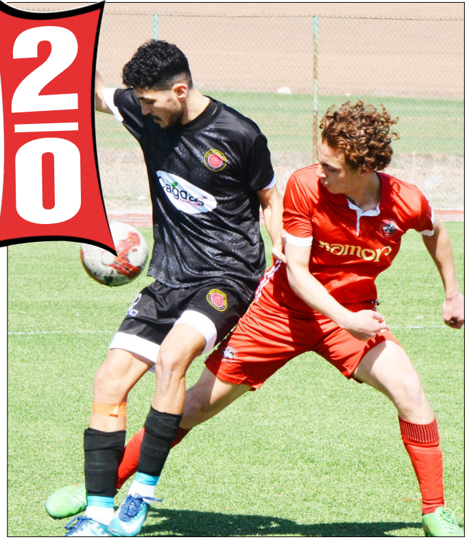
Alaca Belediye-Ulukavakspor maçından bir enstantane...

Bu sonucun ardından Alaca Belediyespor puanını 18'e yükseltirken, Ulukavakspor ise 4 puanda kaldı. (Rifat KARA)