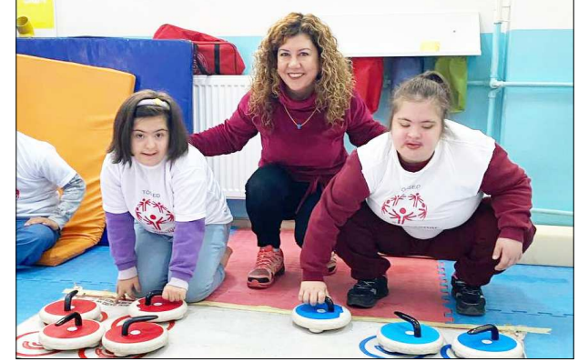
Özel öğrencilerin curling etkinliğinden bir fotoğraf...

21 Mart Dünya Down Sendromu Farkındalık Günü kapsamında, Çorum Gençlik ve Spor İl Müdürlüğü anlamlı bir etkinliğe imza attı. Zübeyde Hanım Özel Uygulama Okulu'nda düzenlenen organizasyonda, Down sendromlu öğrenciler için floor curling ve dart etkinlikleri gerçekleştirildi.