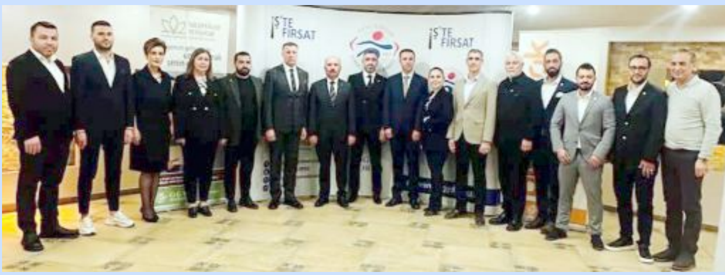
GGYD yöneticileri, Vali Çalgan, Başsavcı Bektaş ve Albay Çetinkaya ile...