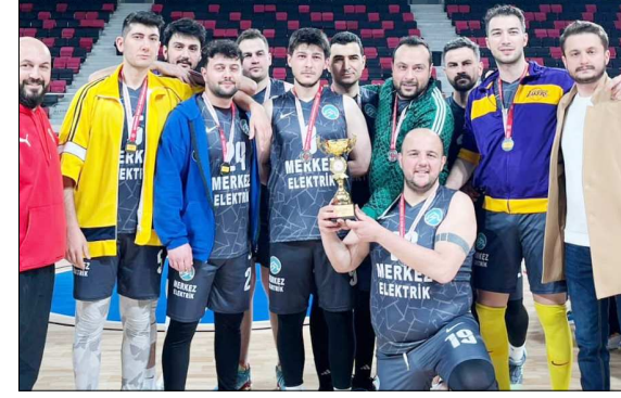
Merkez Elektrik ikincilik kupası ile görülüyor...