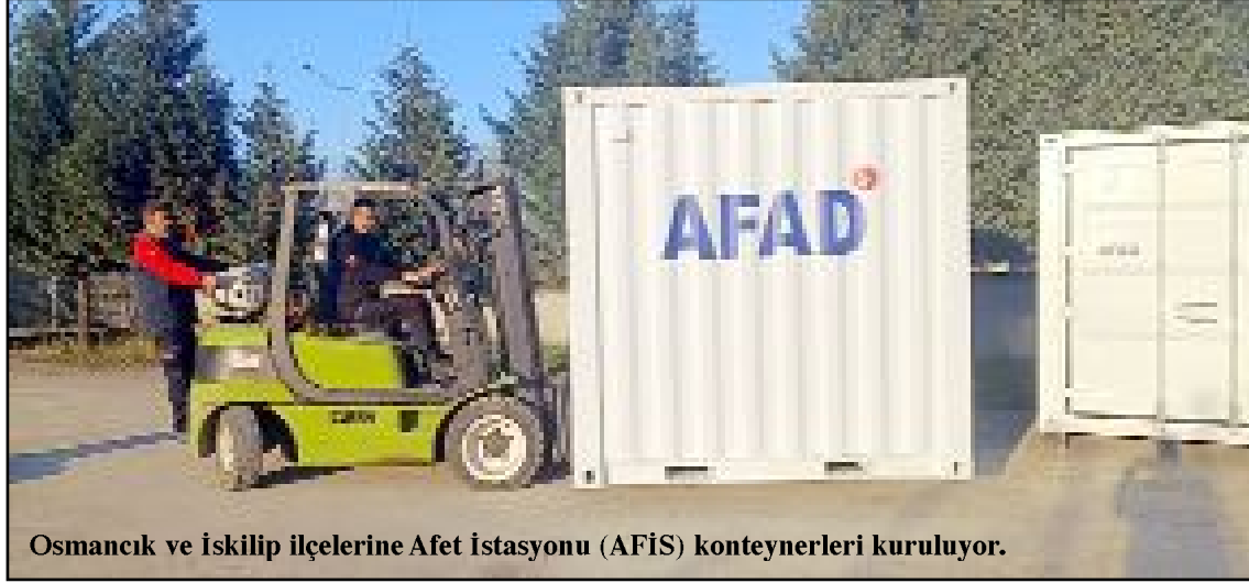
Osmancık ve İskilip ilçelerine Afet İstasyonu (AFİS) konteynerleri kuruluyor.