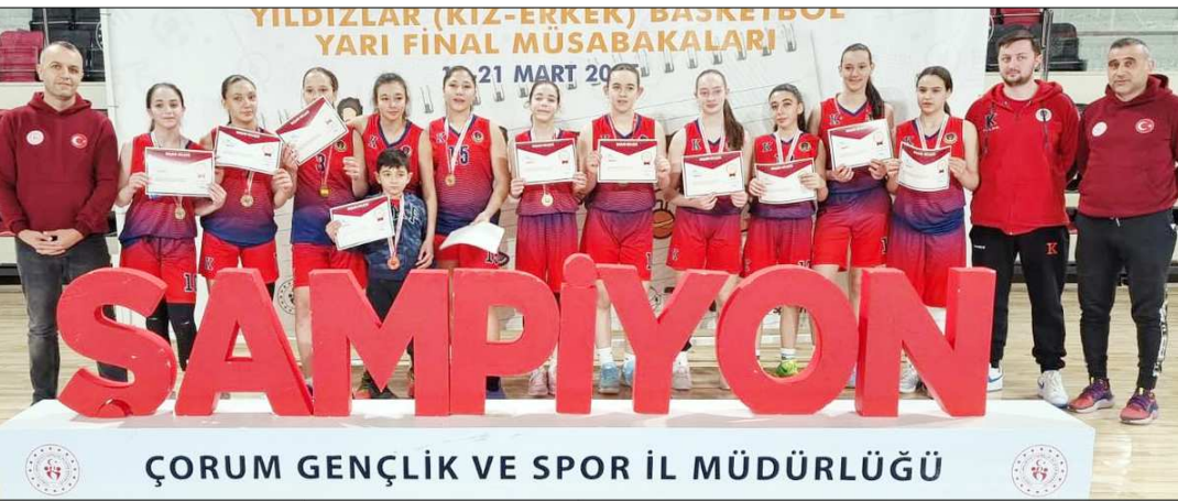
ÇORUM GENÇLİK VE SPOR İL MÜDÜRLÜĞÜ

Samsun ve Ankara takımları Çorum'da ilk ikiye girerek final biletini aldılar.