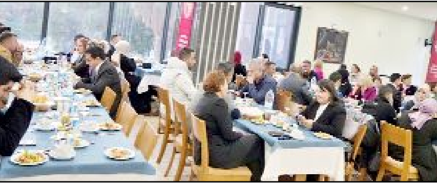
Muratpaşa ilçesinde bulunan bir otelde gerçekleştirilen programa, iş adamları ve akademisyen isimler katıldı.