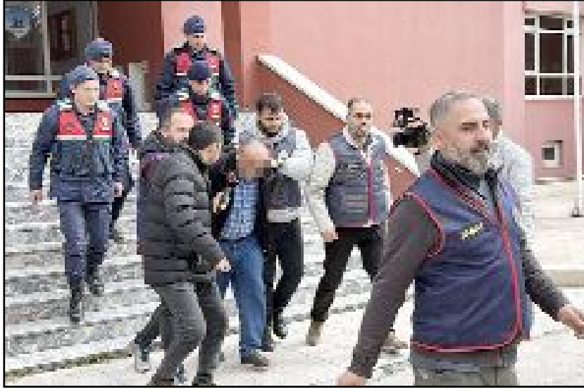
Sağlık kontrolünden sonra adliyeye götürülen cinayet zanlısı, çıkarıldığı hâkimlikte tutuklandı.