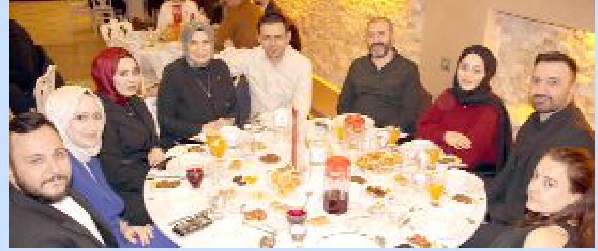
Hanoğlu Konağı'ndaki iftar yemeğinden...