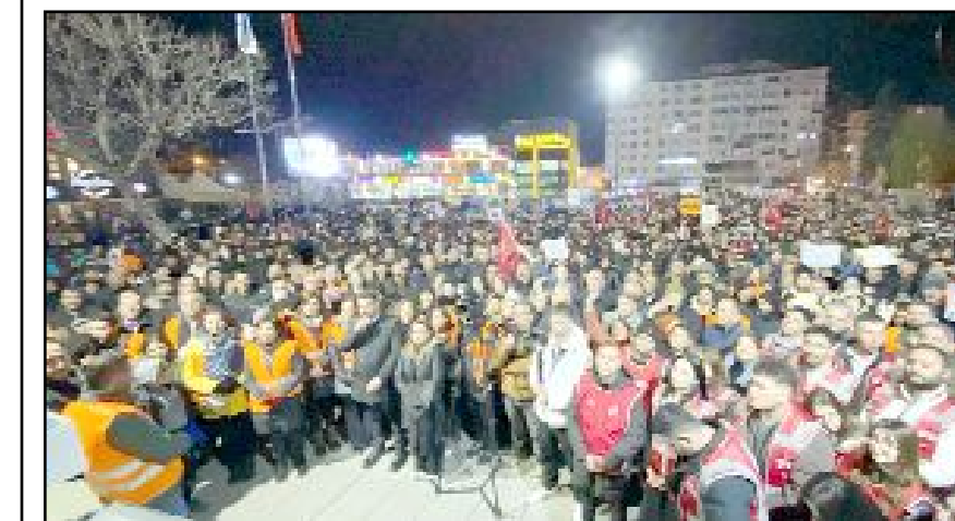
Kadeş Barış Meydanı'nı dolduran yurttaşlar sık sık "her şey çok güzel olacak" sloganları atarak, İmamoğlu'na destek mesajı gönderdi.

Mitinge CHP'nin yanı sıra Emek Partisi, Sol Parti, DEM Parti, Eğitim Sen, Eğitim-İş, Atatürkçü Düşünce Derneği, Hacı Bektaş Veli Anadolu Kültür Vakfı, Birleşik Emekçiler Sendikası da destek verdi.