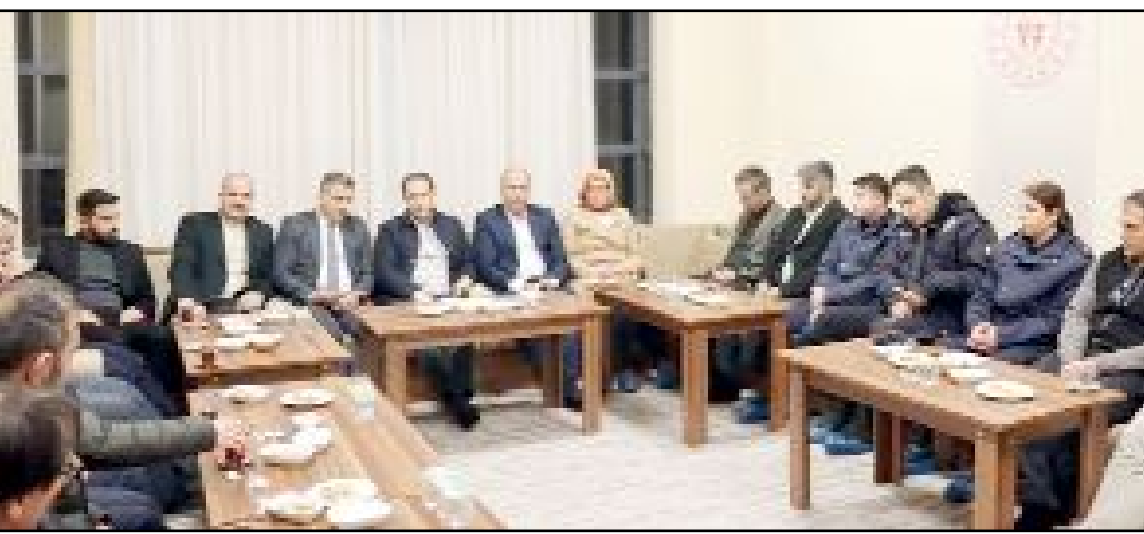
Alaca'da Ramazan ayı münasebetiyle Kredi ve Yurtlar Kurumu (KYK) yurdunda kalan gençler için iftar programı düzenlendi.