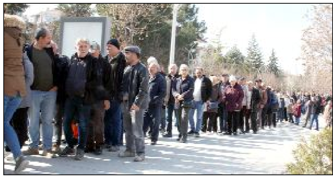
İmamoğlu için tutuklama kararı çıkmasına rağmen vatandaşlar akın akın sandığa geldi.