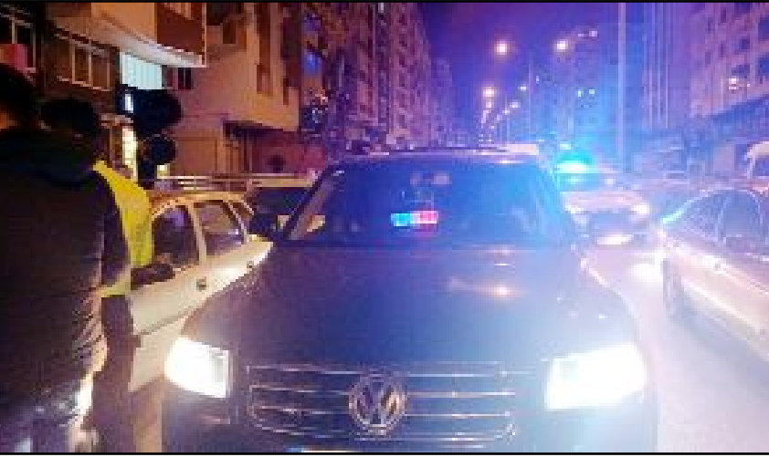
Ekipler tarafından yetkisiz çakar kullanan sürücü A.T.'ye 138 bin 172 lira, araç sahibine 138 bin 172 lira olmak üzere toplam 276 bin 344 TL ceza işlem uygulandı.

Çorum'da çakarlı araçla yola çıkan sürücü polis ekipleri tarafından yakalandı. Sürücüye ve araç sahibine toplam 276 bin 344 TL ceza işlem uygulandı.