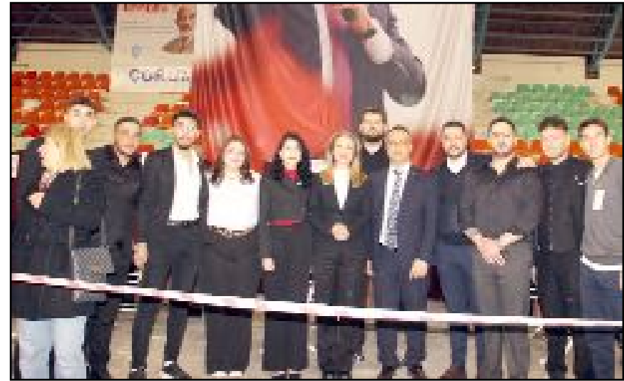
CHP Genel Başkan Yardımcısı Aylın Nazlıaka'nın da hazır bulunduğu oy verme işlemine Çorumlular yoğun katılım gösterdi.

Bahabey Caddesi'nde Hacı Bektaş Veli Parkı'nda toplanan Çorum Emek ve Demokrasi Platformu bileşeni siyasi parti, sendika ve demokratik kitle örgütü temsilcileri, buradan "Kurtuluş yok tek başına, ya hep beraber ya hiçbirimiz" sloganı atarak İmamoğlu için oy kullanma işleminin devam ettiği Atatürk Spor Salonu'na yürüdü.