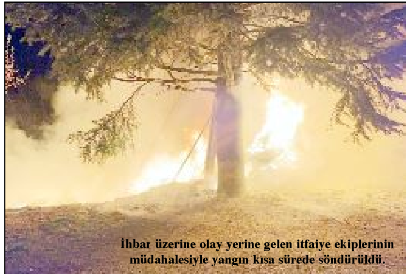
İhbar üzerine olay yerine gelen itfaiye ekiplerinin müdahalesiyle yangın kısa sürede söndürüldü.

Yangında can kaybı ya da yaralanan olmazken maddi hasar meydana geldi. (İHA)