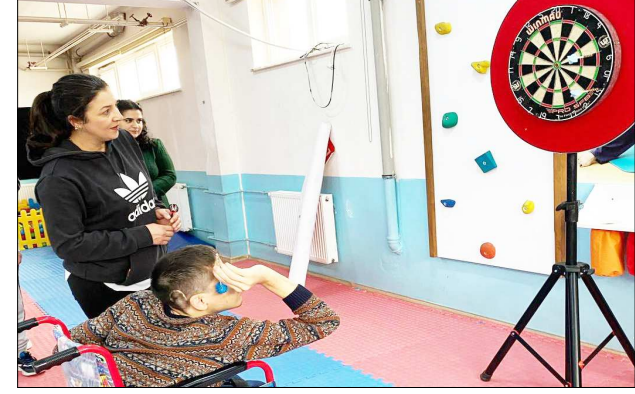
Özel öğrenciler dart branşında hünerlerini sergilediler.