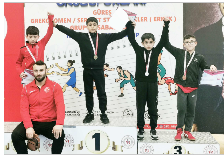
İkiz kardeşler iki stilde üçüncü olarak finale adını yazdırmayı başardı.