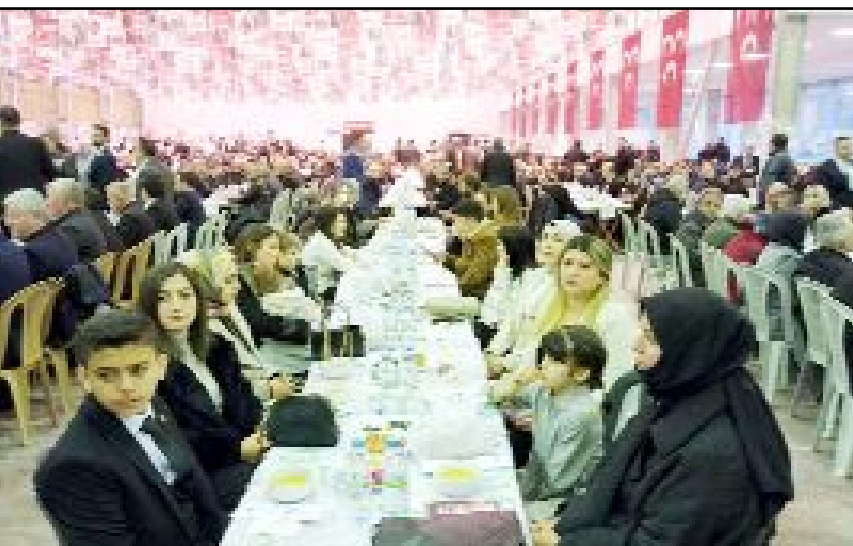
MHP Çorum İl Teşkilatı, Ramazan ayı nedeniyle TSO Fuar Kompleksi'nde iftar programı düzenledi.