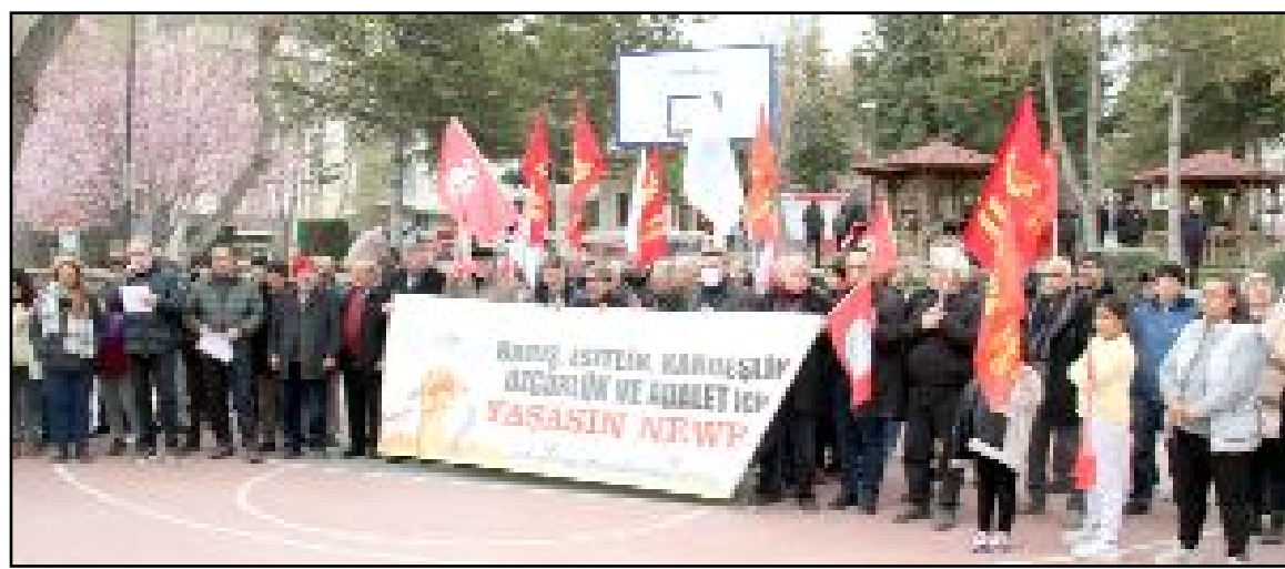
Çorum Emek ve Demokrasi Platformu da nevrüz bayramı vesilesiyle Aşık Mahsuni Şerif Parkı'nda bir kutlama programı düzenledi.