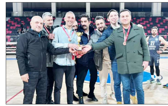
Üçüncülük kupası Gelişim Basketbol'un...

34 önde girdi. Son periyotta Erdemli Tarım takımı 20-15 kazanmasına rağmen maçtan 58-54 mağlup ayrıldı.