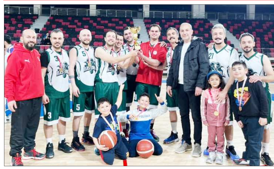
Final maçını 5 sayı farkla kazanan Bastonia takımı şampiyonluğu böyle kutladı.