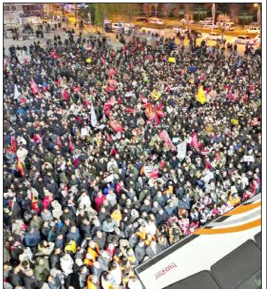
Çorum Emek ve Demokrasi Platformu ile Cumhuriyet Halk Partisi Çorum İl Örgütü öncülüğünde düzenlenen demokrasi mitinglerinin üçüncüsü Cuma akşamı coşku içerisinde tamamlandı.