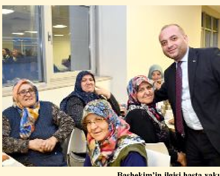
Başhekim'in ilgisi hasta yakınları için memnuniyet vesilesi...