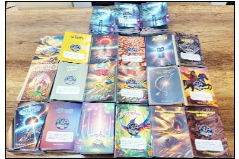
Nisan ayında düzenlenecek imza günü etkinliği ile minik yazarlar, okullarıyla buluşacak.