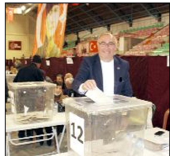
Genciden yaşlısına binlerce yurttaş, CHP'nin Cumhurbaşkanı Adayı olan İmamoğlu için oy kullandı.