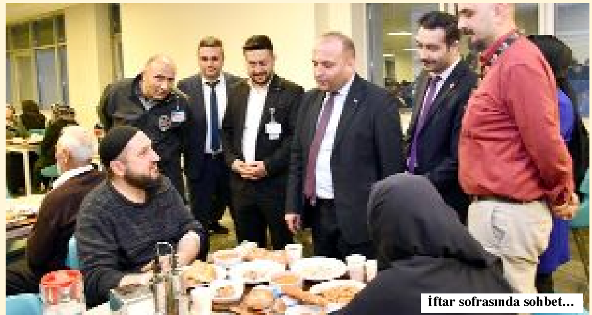
İftar sofrasında sohbet...