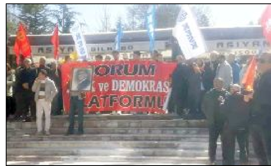
Çorum Emek ve Demokrasi Platformu da bir yürüyüş düzenleyerek İmamoğlu'na destek verdi.