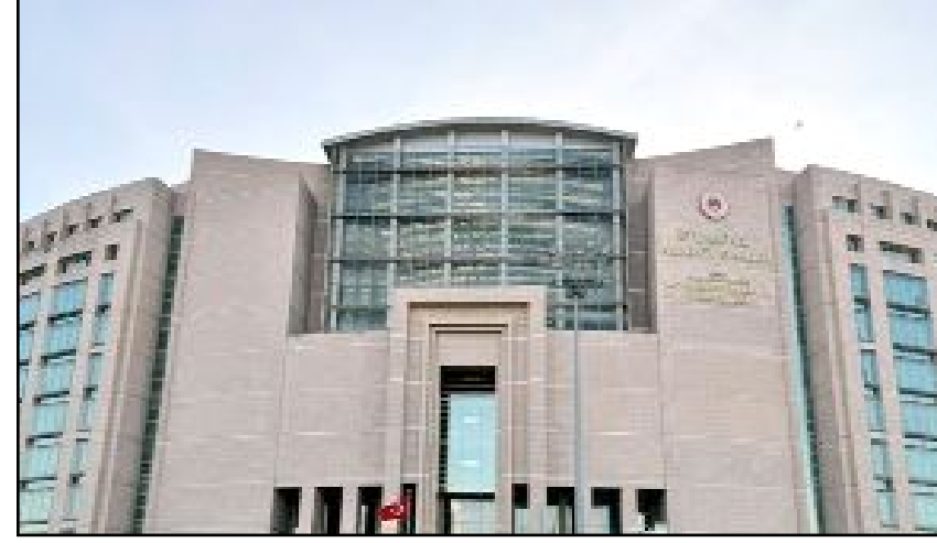
Emniyetteki işlemlerin ardından Çağlayan'daki İstanbul Adliyesi'ne sevk edilen bazı şüphelilerin nöbetçi sulh ceza hâkimliğindeki işlemleri tamamlandı.