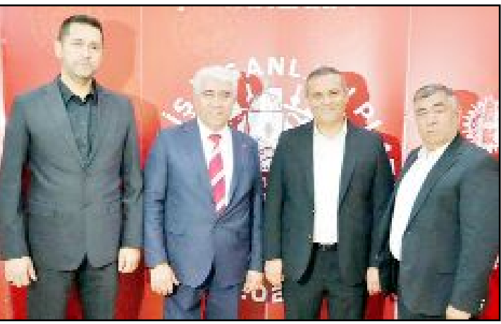
Antalya'da yaşayan Çorumlular, Çorumlu İş İnsanları Platformu'nun düzenlediği iftar programında bir araya geldi.