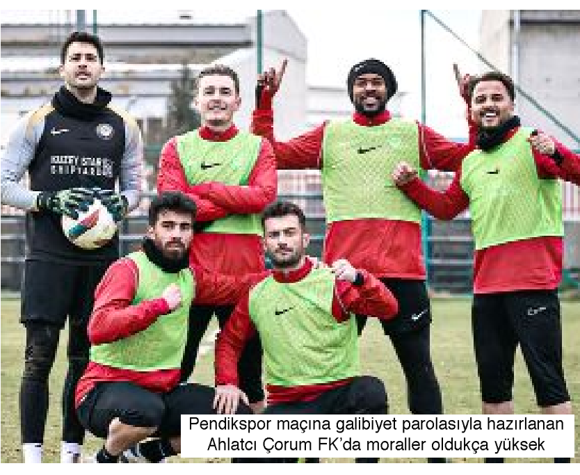
Pendikspor maçına galibiyet parolasıyla hazırlanan Ahlatcı Çorum FK'da moraller oldukça yüksek

Cumartesi günü, Konyaspor Kayacık Tesislerinde oynanan maçta 2-0 kazanan Gençlerbirliği 28 Mart'ta Şanlıurfaspor'la oynayacağı kritik maç öncesinde moral buldu. Konyaspor karşısında Başkent ekibine galibiyeti getiren goller 12.dakikada Rahman Buğra ve 27.dakikada Gaucho'dan geldi. (Hüseyin AŞKIN)