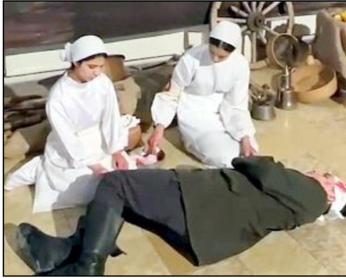
Yaklaşık 600 öğrencinin 4 ay boyunca özveri ve emekle hazırladığı eser, Devlet Tiyatro Salonu Fuaye Alanı'nda düzenlenen törenle açıldı.