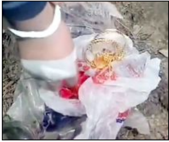
Şüphelinin evden aldığı altınlar, jandarma ekiplerince gömüldüğü yerden çıkarılmıştı.

Kış'ın kolundaki 3 altın bilezik ile birkaç gün önce ilçe merkezindeki bir kuyumcudan satın aldığı bir miktar altını gasbederek evden uzaklaştığı tespit edilmişti. (AA)