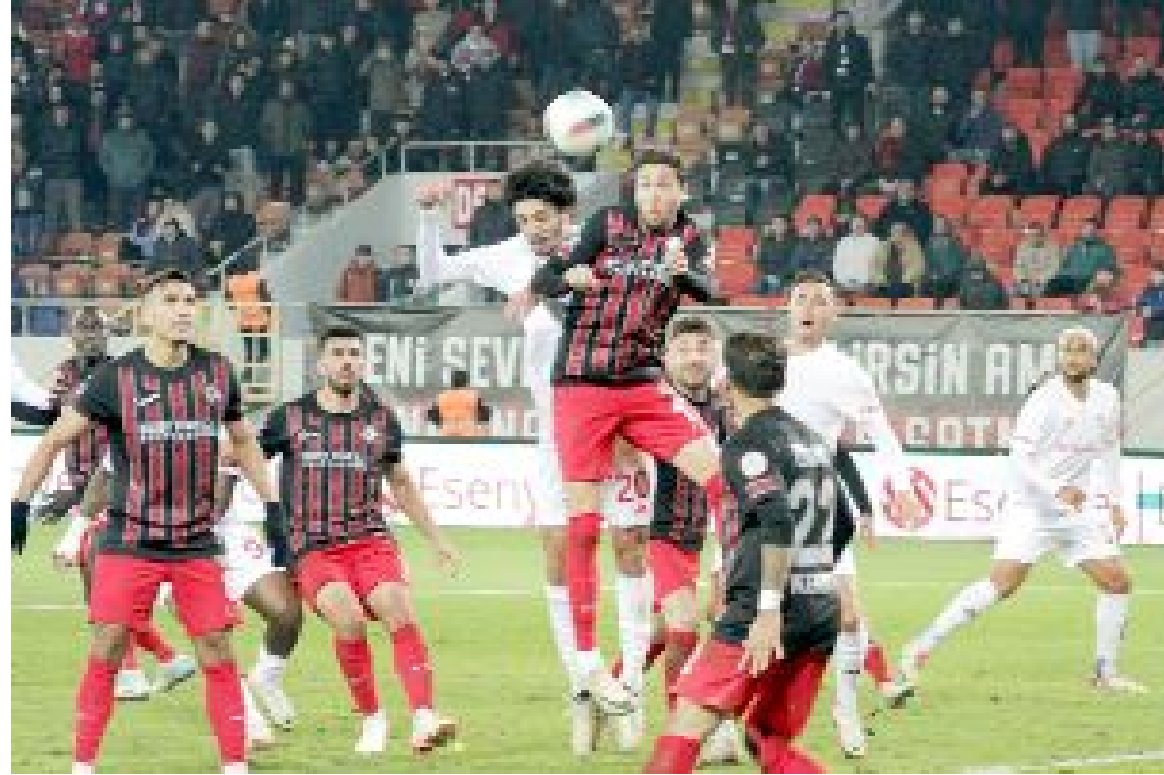
Ahlatıcı Çorum FK, kalan 8 haftalık zorlu periyottaki ilk maçını Cumartesi günü, İstanbul'da Pendikspor'la oynayacak. İlk yarıda Çorum'da oynanan maçı Ahlatıcı Çorum FK 1-0 kazanmıştı.