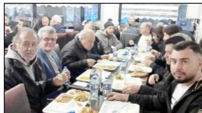
Yurttaşlar Pide Salonu'nda düzenlenen iftar yemeğine çok sayıda esnaf katıldı.

Bu mübarek günde geleneksel olarak düzenlediğimiz iftar yemeğinde bizleri yalnız bırakmayan esnafımıza teşekkür ederiz" dedi. (Haber Merkezi)