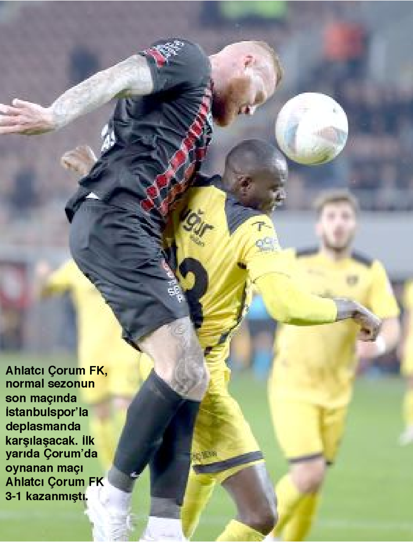
Ahlatıcı Çorum FK, normal sezonun son maçında İstanbulspor'la deplasmanda karşılaşacak. İlk yarıda Çorum'da oynanan maçı Ahlatıcı Çorum FK 3-1 kazanmıştı.