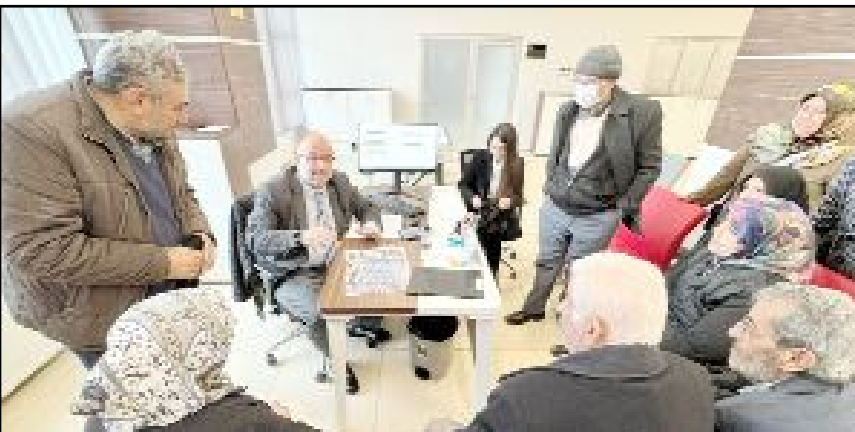
Çorum Belediyesi tarafından başlatılan kentsel dönüşüm çerçevesinde Gülübbey Mahallesi Hasanpaşa Sokak sakinleriyle görüşmeler başladı.