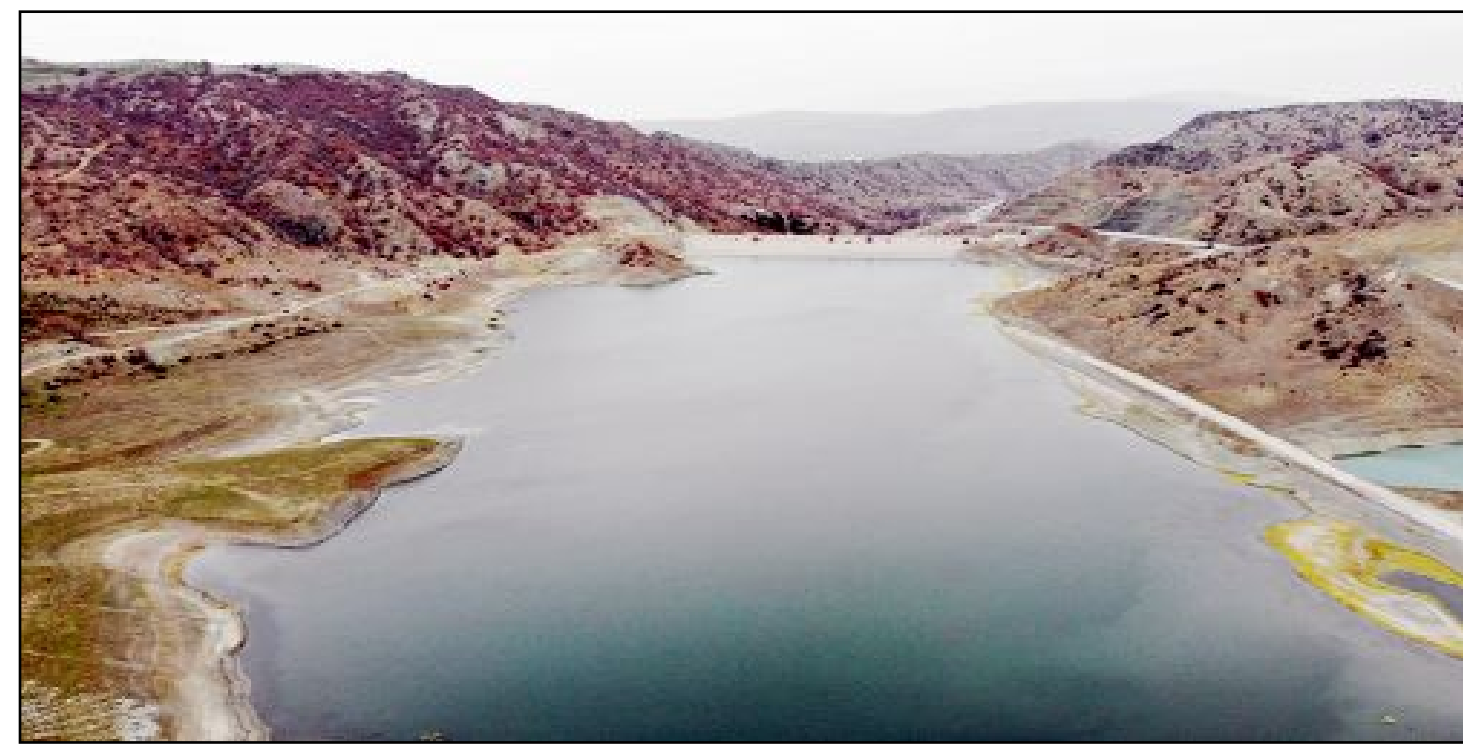
Çorum'da, bu yıl da kar ve yağmur yağışlarının beklenen seviyede olmaması sebebiyle barajlarda su seviyesi hızla düşmeye devam ediyor.