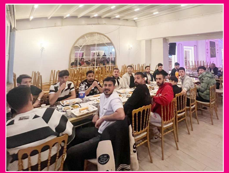
Umay Otel'de verilen iftar yemeğinden bif fotoğrafı...