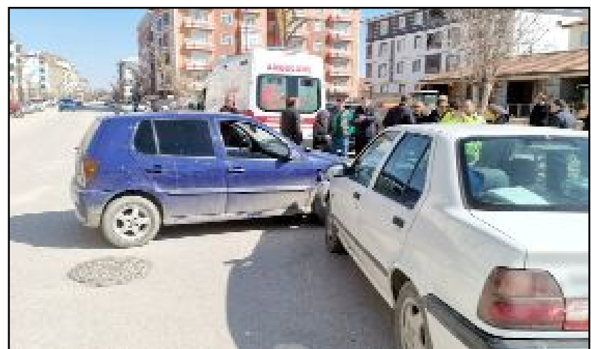
Olay yerine gelen sağlık ekipleri tarafından ilk müdahaleleri yapılan yaralılar, Alaca Devlet Hastanesi'ne kaldırıldı.

Kazayla ilgili inceleme başlatıldı.