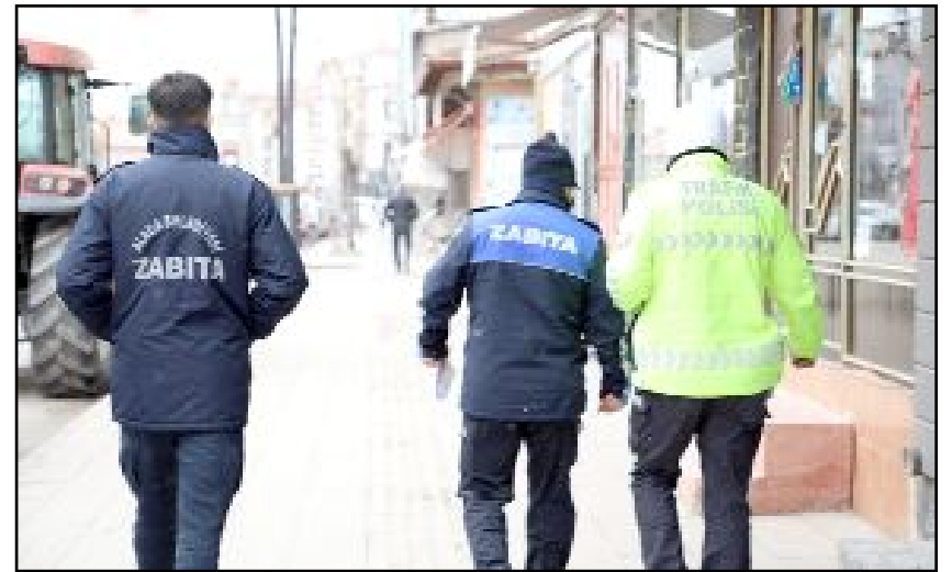
Ramazan Bayramı'ndan sonra tekrar kontrollerin yapılacağını belirten ekipler, kurallara uymayan iş yeri sahipleri ve vatandaşlara cezai işlem uygulanacağını aktardı.

Uygulamayla şehir içi ulaşımın daha güvenli ve düzenli hale getirilmesi hedefleniyor. (İHA)