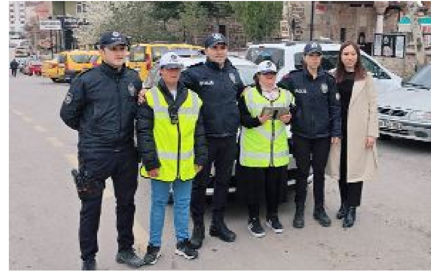
Sungurlu İlçe Emniyet Müdürlüğü tarafından Dünya Down Sendromlular Günü dolayısıyla, Bölükbaşı Özel Eğitim Merkezi'nde eğitim gören dört özel birey için etkinlik düzenlendi.

lislik mesleğiyle ilgili önemli bilgiler verildi.