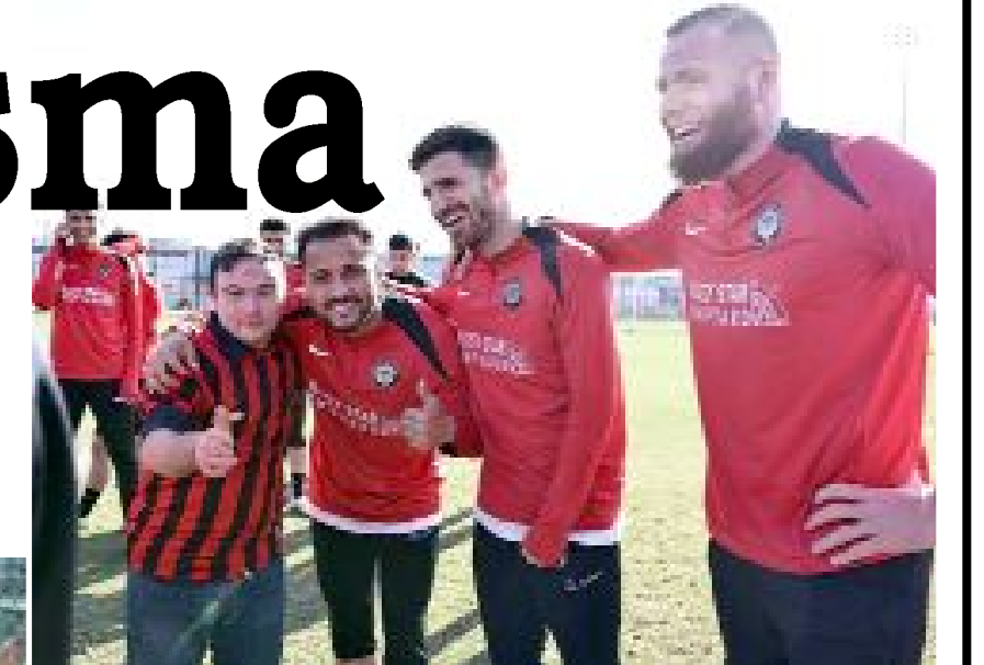
Hollandalı golcü Thomas Verheydt da diğer futbolcular gibi öğrencilere yakın ilgi gösterdi.

● Zübeyde Hanım Özel Eğitim Uygulama Okulu'nda eğitim gören 3. kademe öğrenciler, 21 Mart Down Sendromu Farkındalık Günü ve 2 Nisan Otizm Farkındalık Günü'nü çerçevesinde, kırmızı-siyahlı formalarıyla Ahlatçı Çorum FK'nın antrenmanında teknik heyet ve futbolcularla bir araya geldiler.