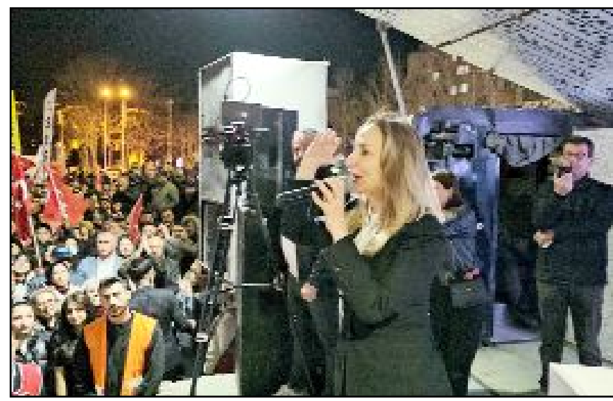
CHP Genel Başkan Yardımcısı Aylin Nazlıka, Çorum'da düzenlenen mitingde konuştu.

2024'te 17 bakanı ve 1 Cumhurbaşkanı sandığa göndürdü İmamoğlu. Adalet, demokrasi emin olun onlara da lazım olacak" şeklinde konuştu. (Haber Merkezi)