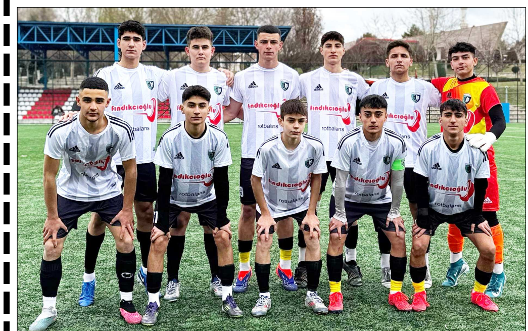
Çorum Anadolu FK ikide iki yaparak maç fazlası ile zirveye yerleşti.