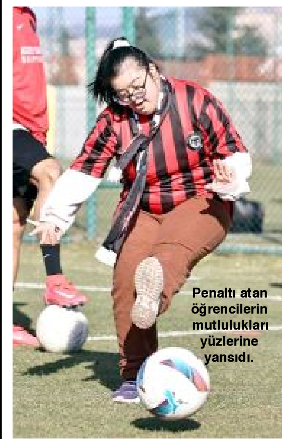
Penaltı atan öğrencilerin mutlulukları yüzlerine yansdı.

Trendyol Türkiye 1.Futbol Ligi'nde play-off hesapları yapan ve Cumartesi günü deplasmanda oynayacağı kritik Pendikspor maçına hazırlanan Ahlatçı Çorum FK'nın çok özel konukları vardı. Zübeyde Hanım Özel Eğitim Uygulama Okulu'nda eğitim gören 3. kademe öğrenciler, 21 Mart Down Sendromu Farkındalık Günü ve 2 Nisan Otizm Farkındalık Günü'nü çerçevesinde, kırmızı-siyahlı formalarıyla Ahlatçı Çorum FK'nın antrenmanında teknik heyet ve futbolcularla bir araya geldiler.