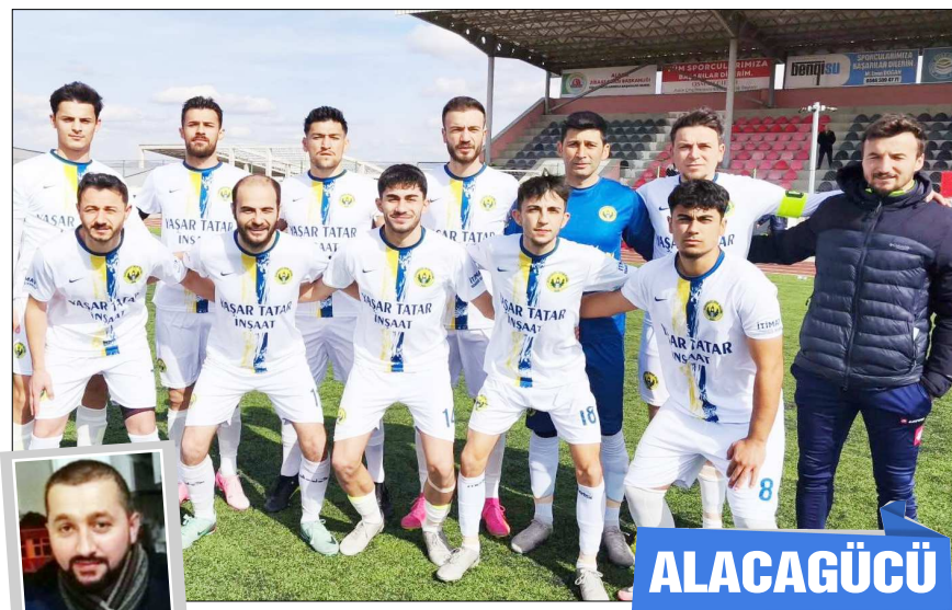
Hazırlayan: Rıfat KARA

■ BELTAŞ 1.Amatör Küme 9.hafta maçında şampiyonluk mücadelesi veren Alacagücü İskilip'te İskilipspor'un konduğu oldu. Ligin dirençli takımlarından biri olan İskilipspor karşısında etkili bir futbol ortaya koyan Alacagücü, iyi futbolunu 8 golle süsleyerek haftanın takımı olmayı başardı.