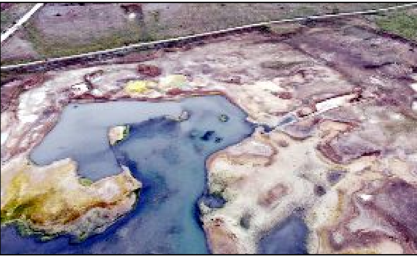
Su seviyesinin düştüğü Hatap Barajı'nda eski yollar ve adacıklar ortaya çıktı.

kamda görmüş olduğunuz Hatap Barajı'nda 2024 yılından 2025 yılına yaklaşık yüzde 50 oranında bir düşüş meydana geldiğini görüyoruz. Bunun için de endişeliyiz. Suyumuz çekiliyor, gördüğümüz üzere kuraklık başlıyor. Şu anda bulunduğum nokta toprak parçası ve su aşırı derecede azalıp geriye çekildi, bunun için endişeliyiz. Genel olarak baktığımızda bulunduğum noktada suyun azalmasının gereksiz su tüketimi ve küresel ısınmaya bağlı diyebiliriz. Toplum olarak suyu dikkatli kullanmalıyız. Şu an bir sorunla karşılaşmasak bile ileride çok büyük sorunlarla karşı karşıya kalabilir" dedi. (İHA)