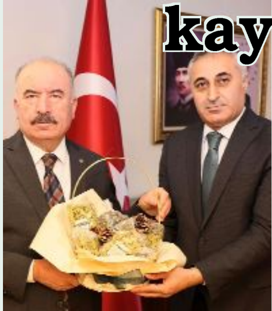
Ziyarete doğayı korumanın önemi vurgulanırken, hafta boyunca gerçekleştirilecek etkinlikler hakkında da bilgi verildi.