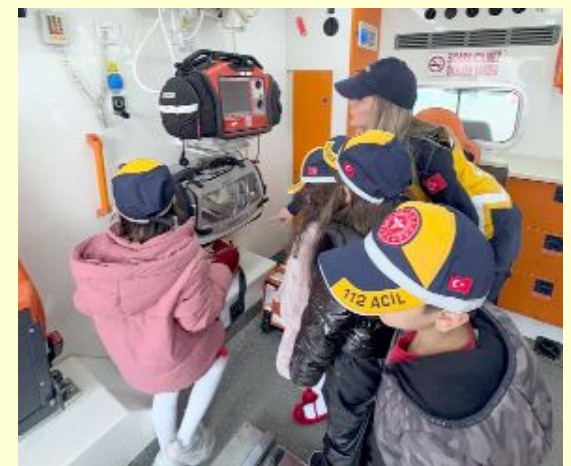
İl Ambulans Servisi Başhekimliği personeli, Özel Bahçeşehir Anaokulu'nda miniklere acil sağlık hizmetleri ve ambulans kullanımı konusunda bilgilendirme yaptı.

fikte ambulansa yol verme konuları ile hangi şartlarda ve nasıl iletişim kurulması gerektiği konularını anlattı. Eğitim sonunda ayrıca ambulansın iç donanımı hakkında da bilgilendirme yapıldı. (Volkan SINAYUÇ)