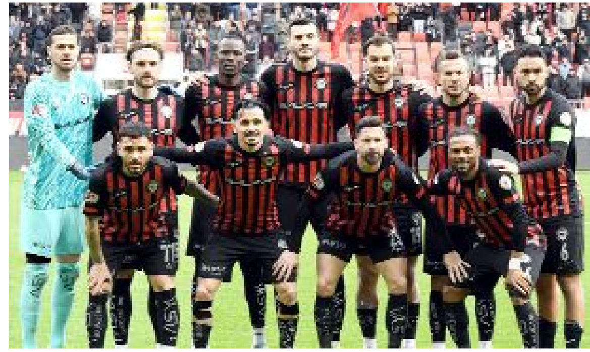
Arca Çorum FK, ilk yarının ilk 10 haftasında olduğu gibi ikinci yarının aynı periyodunda da 21 puan topladı.