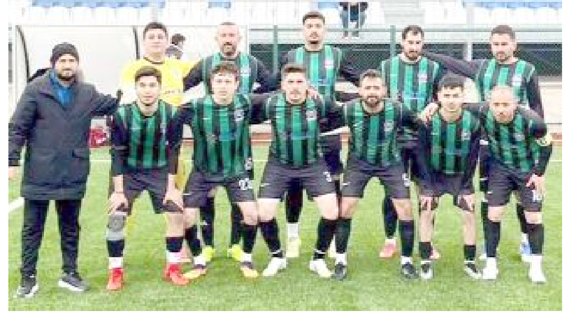
Üçüncülük mücadelesi veren Dodurga Belediye, düşme hattındaki Ulukavakspor'u 2-1 yendi.

silcisinin üstünlüğü ile sona erdi. Bu sonucun ardından ev sahibi Ulukavakspor 6 puanda kalarak küme düşme hattından kurtulamadı. Dodurga Beyliği Belediyespor ise 18 puana yükselerek dördüncü sıradaki yerini korudu. (Hüseyin AŞKIN)