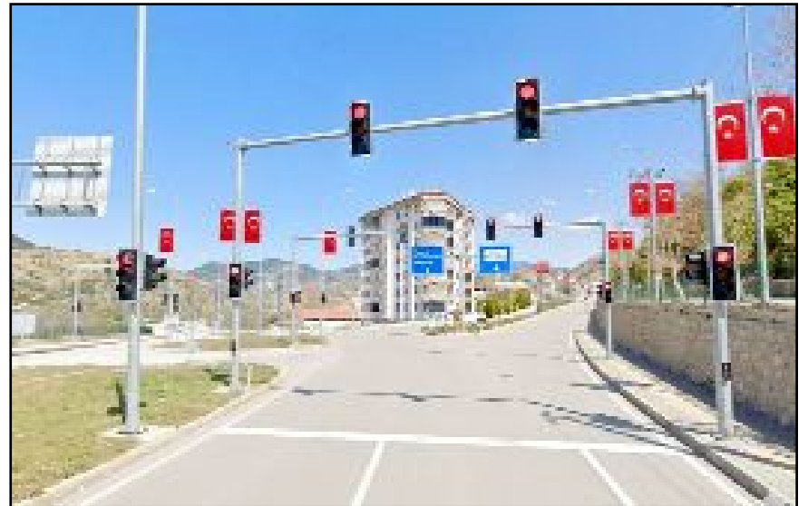
İskilip'te Belediye'nin Beşevler Kavşağı ile ilgili yaptığı başvuru kabul edilerek Karayolları Genel Müdürlüğü'nün yatırım programına alındı.

İskilip Beşevler Kavşağı'na kurulacak sinyalizasyon sistemi ile birlikte hem trafik akışının daha düzenli hale gelmesi hem de kazaların önüne geçilmesi hedefleniyor. (Haber Merkezi)