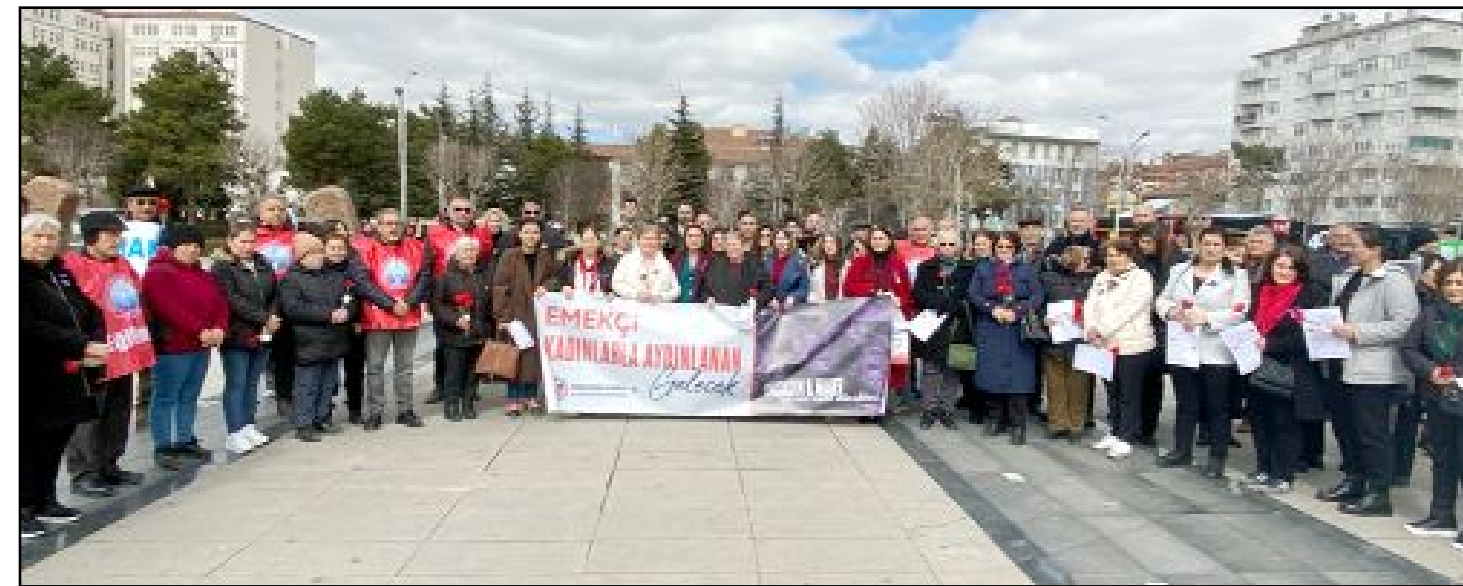
8 Mart etkinlikleri kapsamında Atatürk Anıtı'nda bir araya gelen Birleşik Kamu-İş ve Eğitim-İş üyeleri, basın açıklaması düzenledi.