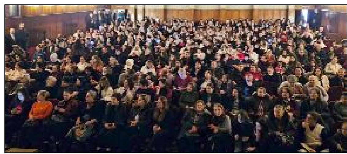
Devlet Tiyatro Salonu'nda gerçekleştirilen etkinliğe ilgi ve katılım yüksek düzeyde olurken, etkinlik sırasında şiirlerle, türkülerle, skeçlerle Erbanî konseri ile kadın mücadelesine dikkat çekildi.