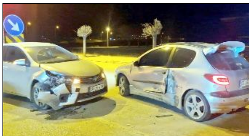
Kaza, Zile Caddesi üzerindeki İlçe Emniyet Müdürlüğü önünde meydana geldi.

19 LH 419 plakalı otomobil çarpıştı. Çarpışmanın etkisiyle her iki otomobilde maddi hasar oluşurken, sürücüler yaralandı. İhbar üzerine olay yerine sağlık ve polis ekipleri sevk edildi. Yaralılar, sağlık ekiplerince yapılan ilk müdahalenin ardından hastaneye kaldırıldı. Trafik ekiplerince yapılan incelemenin ardından araçlar otoparka kaldırıldı. (İHA)