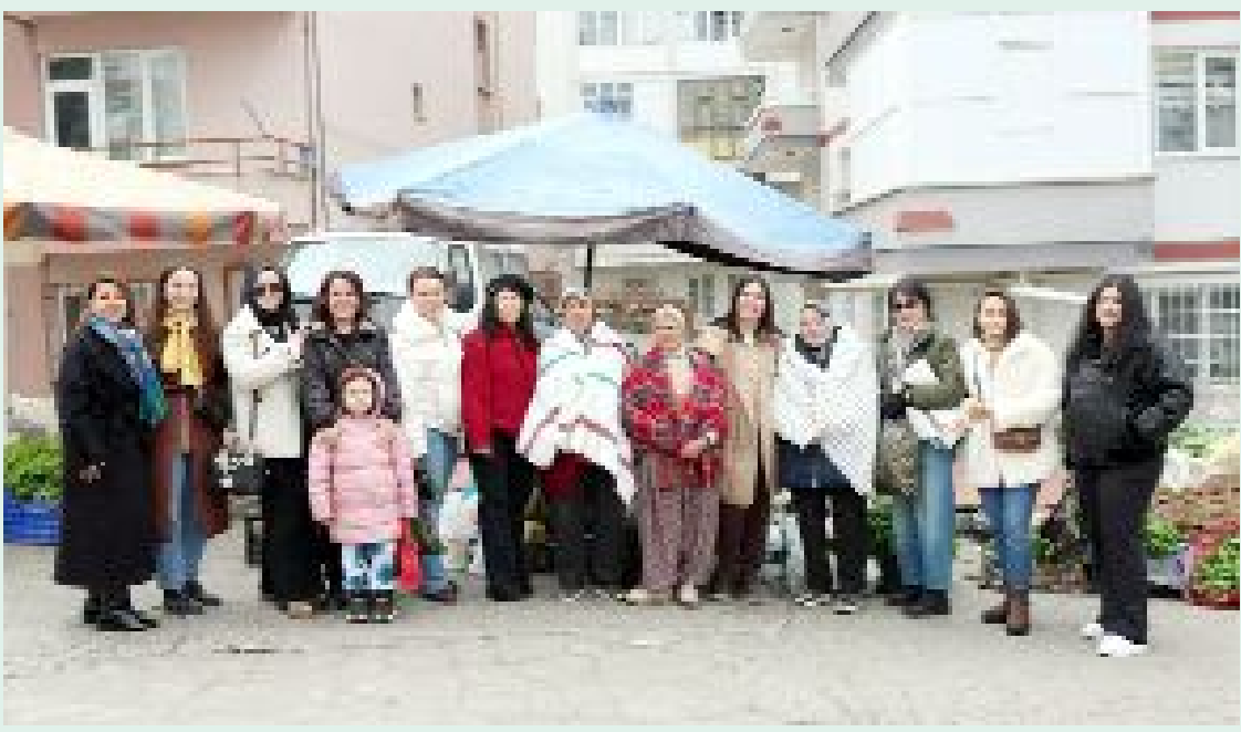
İŞKAD yöneticilerinin, pazar yerindeki emekçi kadınlarla bir anı fotoğrafı...