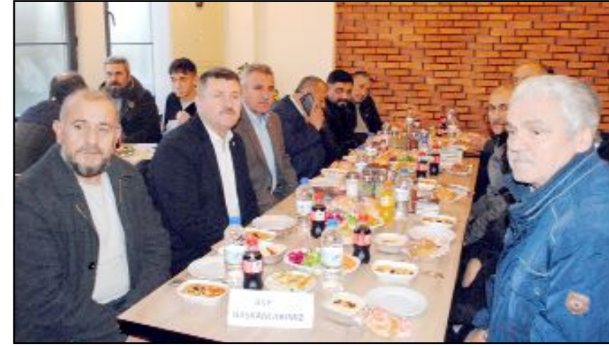
İftara Genel Merkez ve İl yöneticilerinin yanı sıra ilçe başkan, yönetici ile aileleri de katıldı.