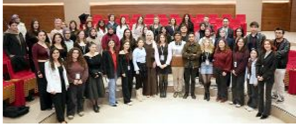
Kadın girişimcilerin söyleşisinden bir anı fotoğrafı...