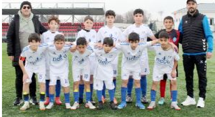
A grubunda 2'de 2 yapan Vefaspor haftayı lider kapattı.

Bu sonucun ardından Alaca temsilcisi puanını 19'a, H.E.Kültürspor ise 11 puana yükseldi. (Hüseyin AŞKIN)