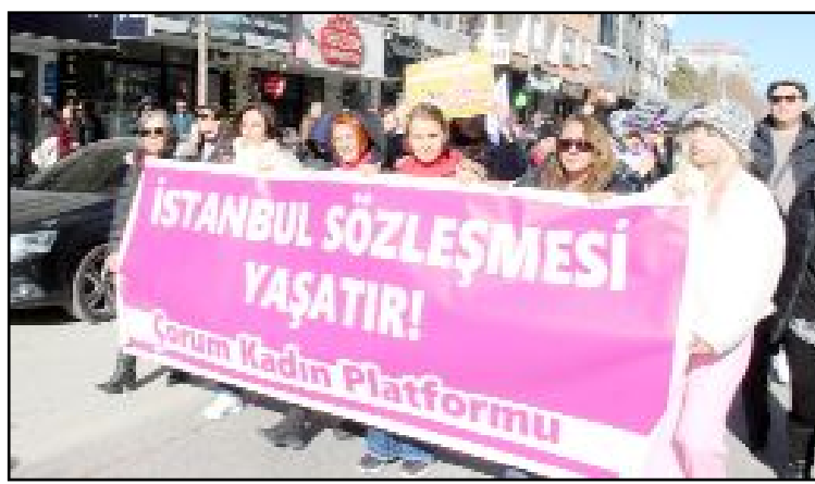
Çorum Kadın Platformu, 8 Mart Dünya Emekçi Kadınlar Günü nedeniyle alanlara çıktı.