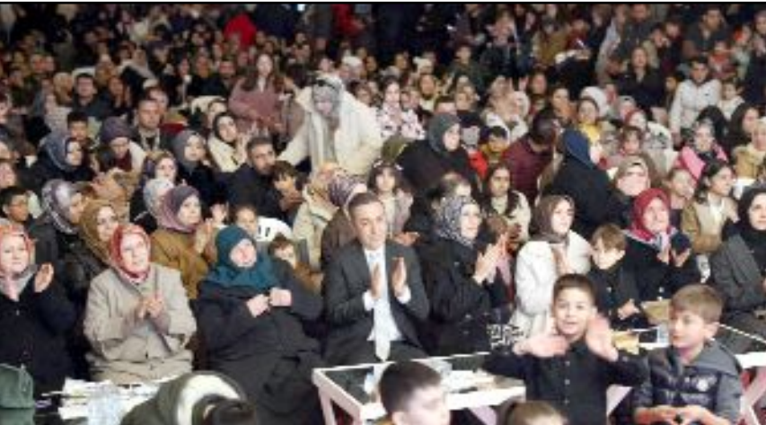
Sungurlu Belediyesi tarafından Ramazan ayı dolayısıyla Kentpark'ta kurulan Ramazan etkinlikleri çadırı yoğun ilgi gördü.

Ramazan etkinliklerinin Kentpark'ta kurulan Ramazan etkinlikleri kapsamında her akşam iftar sonrasında devam edeceğini belirten Başkan Dere, tüm vatandaşları programa davet etti. (İHA)