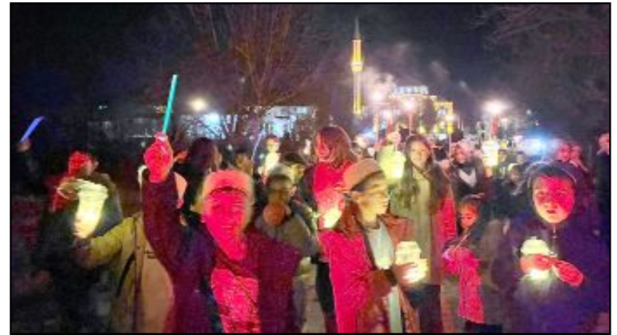
Çorum'un Laçın ilçesinde düzenlenen Ramazan etkinliğinde iftar sofrasında buluşan çocuklar, fenerlerle camiye yürüdü.

nin üst katından aşağı bırakılan onlarca balon çocuklara büyük bir mutluluk yaşattı.