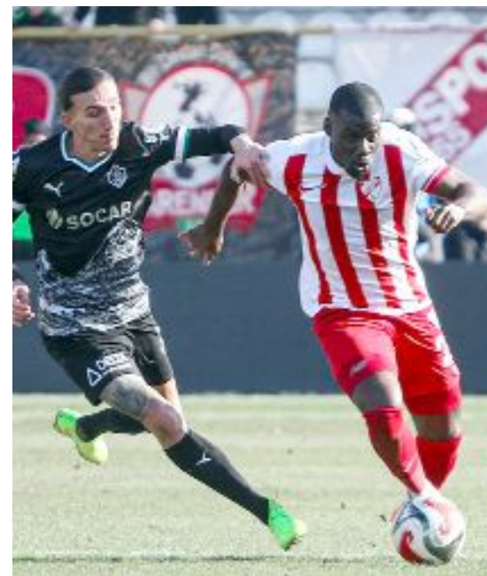
Boluspor-İğdir FK maçından bir enstantane.

10.sırada kapattı. İğdir FK ise play-off potasının 1 puan gerisinde haftayı 44 puanla 8.sırada tamamladı. (Hüseyin AŞKIN)