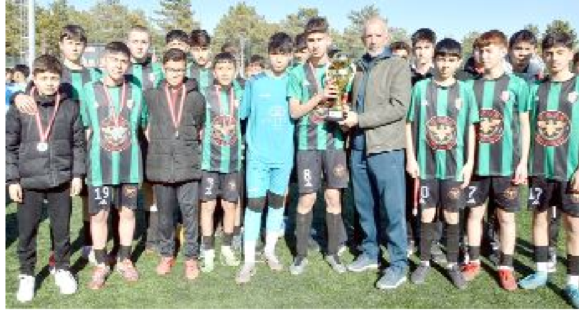
Sungurlu Belediye ile şampiyonluk için çekişen Mimar Sinan, İskilipspor'u 10-1 yenerek liderliğini sürdürdü.