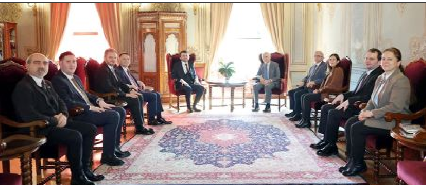
BIK ile İstanbul Üniversitesi arasındaki işbirliği protokolünün imza töreninden...