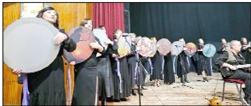
8 Mart Dünya Emekçi Kadınlar Günü kutlamalarına Eğitim-Sen Çorum Şubesi'nin Erbane (Bendir) Topluluğu damga vurdu.

ken, katılımcılara yönelik şiir dinletisi, skeç ve müzik etkinlikleri düzenlendi. Etkinlikte ayrıca Hacı Bektaş-ı Veli Halk Oyunları Ekibi gösteri sunarken, Eğitim Sen Erbane Topluluğu da sahne aldı. (Haber Merkezi)