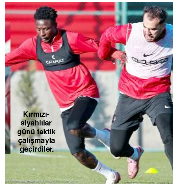
Kırmızı-siyahlılar günü taktik çalışmayla geçirdiler.

Kırmızı-siyahlı takım, kritik maçın hazırlıklarını bugün yapacağı idmanla sürdürecektir. (Hüseyin AŞKIN)