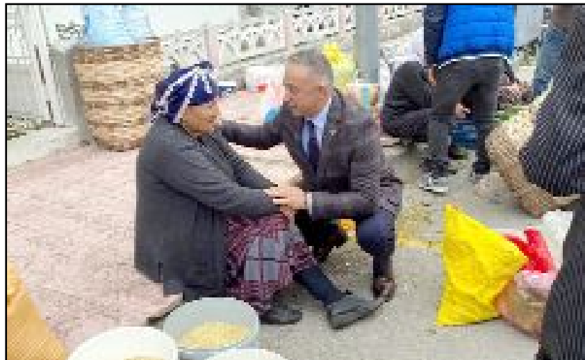
Tahtasız, 8 Mart'ın kadınlar açısından "eşitlik ve özgürlük için mücadele" günü olduğunu söyledi.

mücadelesini her zaman, her şartta, her koşulda desteklemeye ve yüceltmeye devam edeceğiz" dedi. (Haber Merkezi)