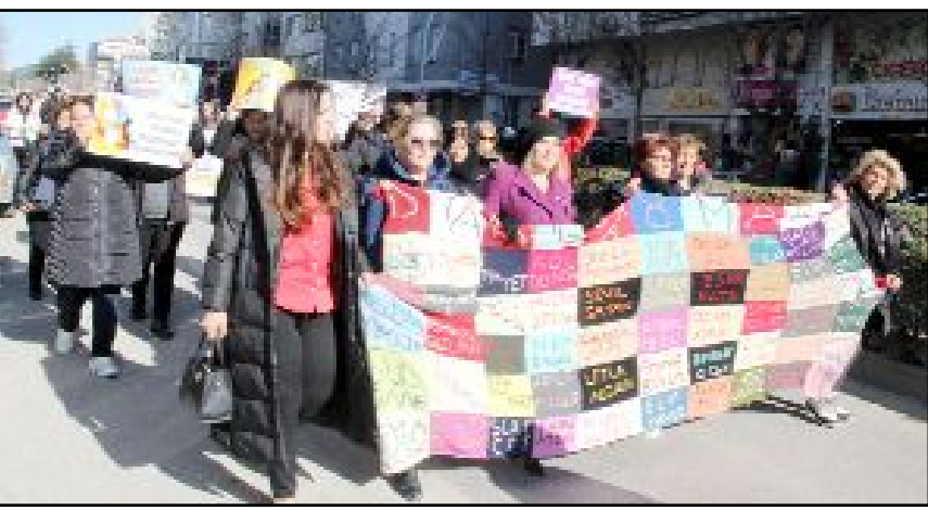
Devlet Tiyatrosu Salonu önünde toplanan kadınlar, buradan sloganlar ve pankartlar eşliğinde Saat Kulesi'ne yürüdü.

Laiklik yoksa barış da asla olmayacaktır.