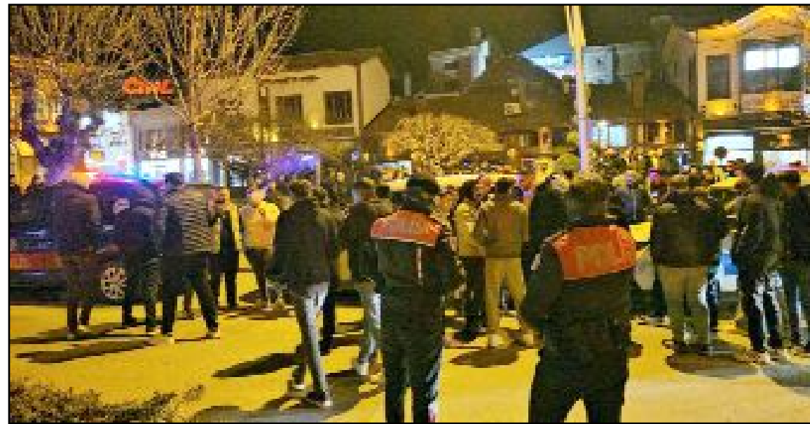
Modifiye araç sahipleri, son dönemde artan denetimler ve kesilen para cezalarına tepki göstermek amacıyla konvoy düzenledi.

Kurallara uymayan araçların 30 gün süreyle trafikte men edilemesi de söz konusu olabiliyor. (Haber Merkezi)