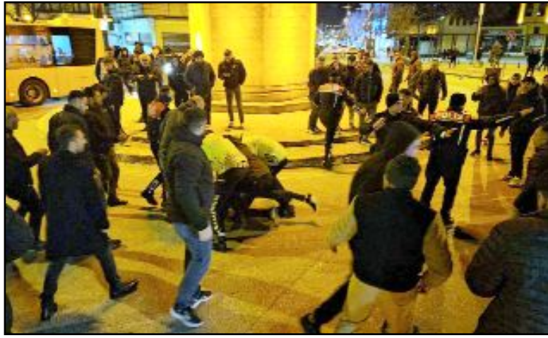
Polisin uyarısına rağmen aracını hareket ettirmeyen sürücü, araçtan indirilerek gözaltına alınırken, otomobil ise çekici marifetiyle bölgeden uzaklaştırıldı.