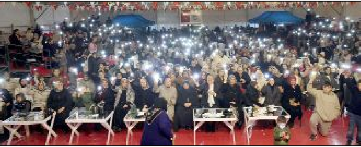
Sungurlu Belediyesi, Ramazan ayının maneviyatını düzenlediği etkinliklerle yaşatmaya devam ediyor