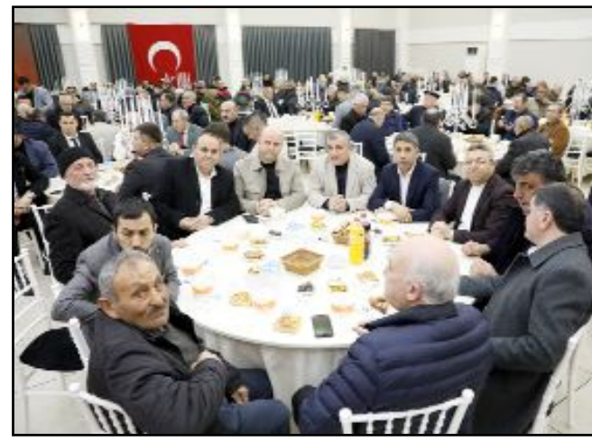
Alaca Belediyesi tarafından organize edilen iftar ilçe protokolü ve vatandaşları bir araya getirdi.