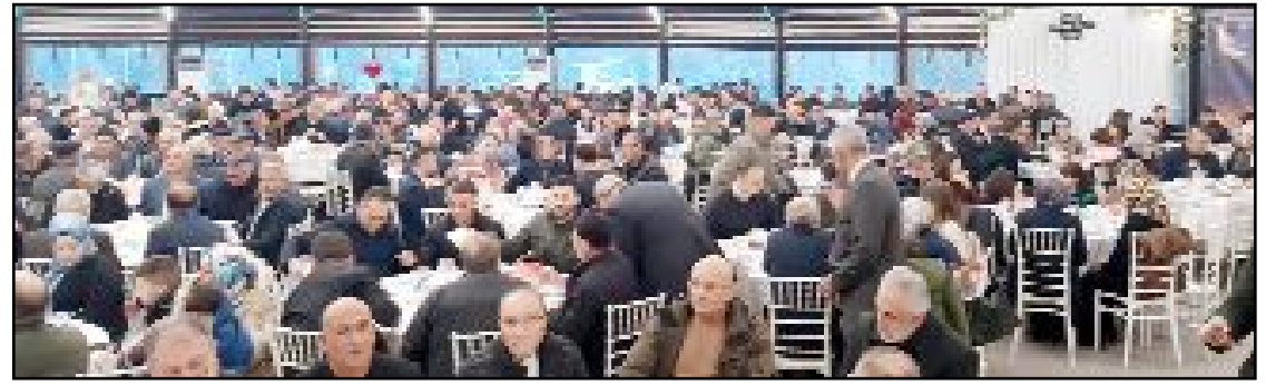
AK Parti İskilip İlçe Başkanlığına düzenlenen "vefa ve gönül sofrası" iftar programında partililer bir araya geldi.

Alar da AK Parti'nin dünyanın en büyük sivil toplum kuruluşu olduğunu dile getirerek, "AK Parti'nin girdiği 19 seçimi kazanmasının altında eser ve hizmet siyaseti ile gönül siyaseti anlayışları yatıyor. AK Parti bu dönem milletle güçlü bir bağ kurmuştur. Bu bağın üç sebebi bulunmaktadır. Bunlardan biri devrimci lider Recep Tayyip Erdoğan, arkasında dağ gibi duran teşkilatı ve dünyanın en büyük sivil toplum kuruluşu haline gelen üyelerimizdir." dedi. (AA)