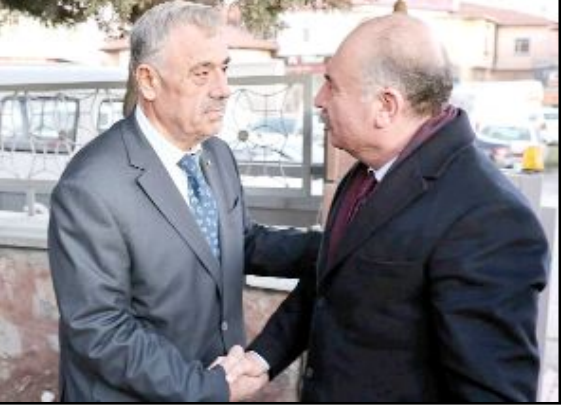
İftar yemeğine katılan protokol üyelerini ÇESOB Başkanı Gür kapıda karşıladı.