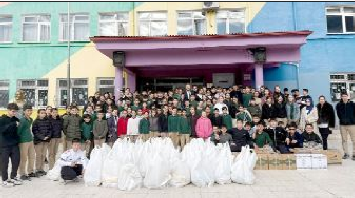
"Maarifin Kalbinde Ramazan" etkinlikleri kapsamında ihtiyaç sahipleri için yardım kolileri hazırlandı.