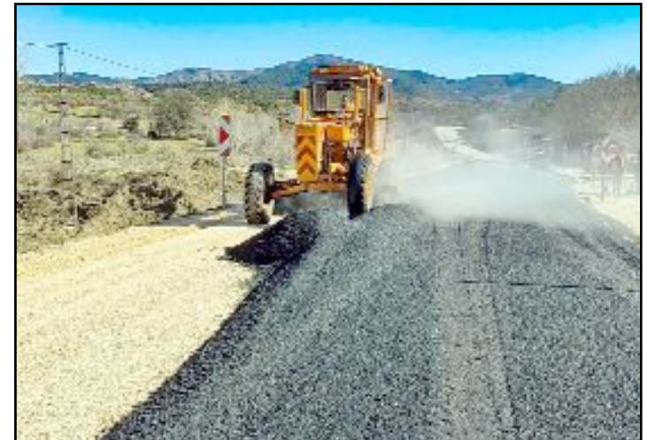
Çomu Çayı üzerindeki köprü- nün bir ayağı, 16 Şubat tarihinde meydana gelen göçük nedeniyle yıkılmıştı.

İskilip ile Kastamonu'nun Tosya ilçesi arasındaki karayolunda bağlantıyı sağlayan Çomu Çayı üzerindeki köprü- nün bir ayağı, 16 Şubat tarihinde meydana gelen göçük nedeniyle yıkılmıştı. Yaşanan olayın ardından ihtimal bir tehlikeyi önlemek amacıyla köprü, Karayolları ekipleri tarafından anında tedbir amaçlı olarak araç ve yaya trafiğine kapatıldı. Karayolları ekipleri tarafından sahada yapılan gerekli teknik incelemelerin ardından, ulaşıma kapanan yolun yerine yeni bir alternatif servis yolu oluşturuldu. Bölgede iş makineleri eşliğinde çalışan ekipler, zemin düzenleme çalışmalarının ardından asfalt serim sürecine geçti. Alternatif yoldaki asfaltlama çalışmalarının kısa süre içerisinde tamamlanarak ulaşıma açılması hedeflenirken yeni köprü- nün yapım sürecinin de kısa sürede başlanacağı öğrenildi. (İHA)