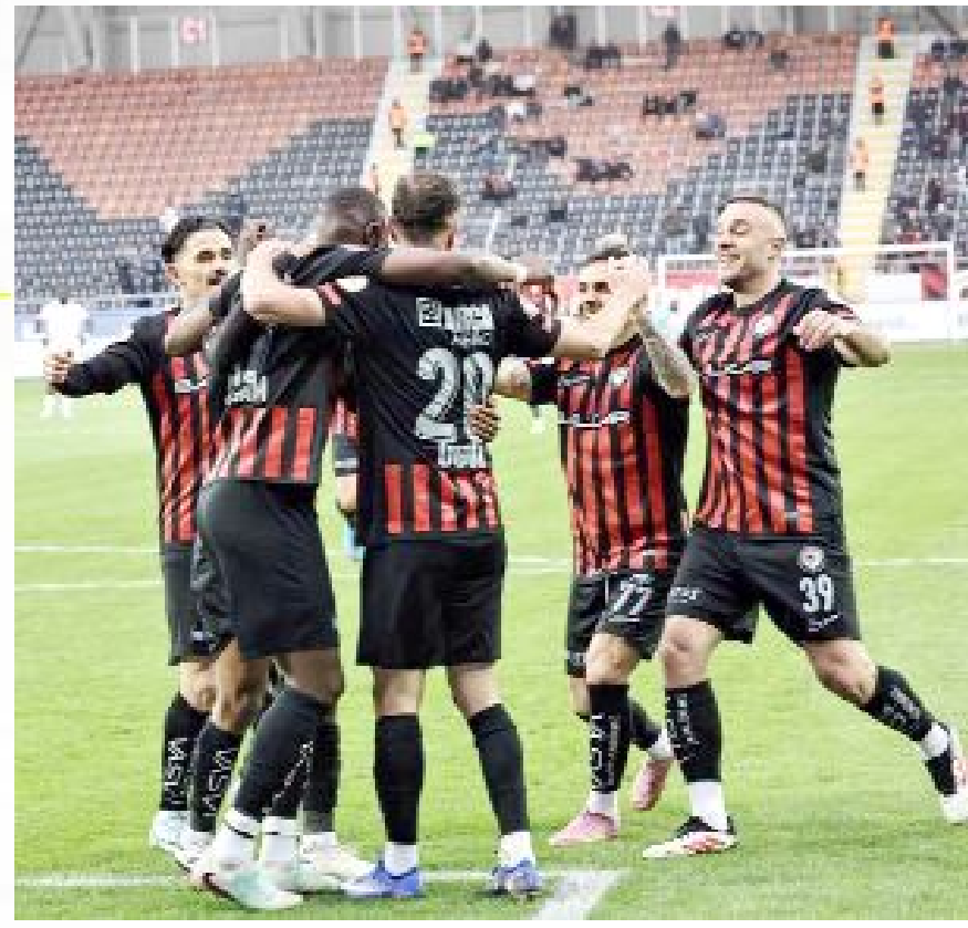
Arca Çorum FK, 481 maçın 211'ini kazandı.

481 maçın 239'unu da sahasında oynayan Arca Çorum FK, 127 galibiyet, 64 beraberlik, 48 yenilgi alarak 445 puan topladı ve attığı 402 gole karşılık kalesinde 226 gol gördü. (Hüseyin AŞKIN)