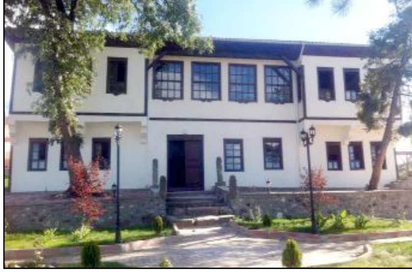
Dulkadiroğlu Konağı, varisleri tarafından bir ilan sitesinde 300 milyon liraya satışa çıkarıldı.

Dulkadiroğlu Konağı, varisleri tarafından bir ilan sitesinde 300 milyon liraya satışa çıkarıldı. (Haber Merkezi)