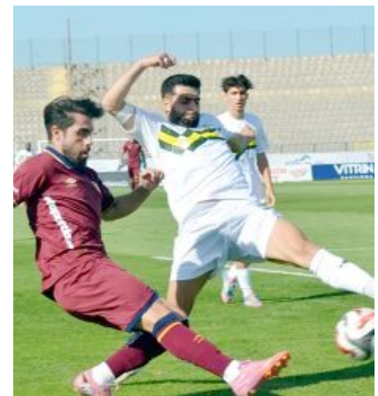
Esenler Erokspor, sezonun ilk yarısında 0-0 berabere kaldığı Bandırmaspor'u konuk edecek. O maçta Bandırmaspor ilk yarıda 9 kişi kalmıştı.

Günün ve 30.haftanın son maçı ise Arca Çorum FK'nın Süper Lig yolundaki kaderini direkt etkileyecek cinsten. Çorum temsilcisinin 16 Mart'ta konuk edeceği Esenler Erokspor, play-off hesapları yapan Balıkesir temsilcisi Bandırmaspor'la karşılaşacak. Esenler Erok Stadı'ndaki karşılaşma saat 20.00'de başlayacak. (Hüseyin AŞKIN)