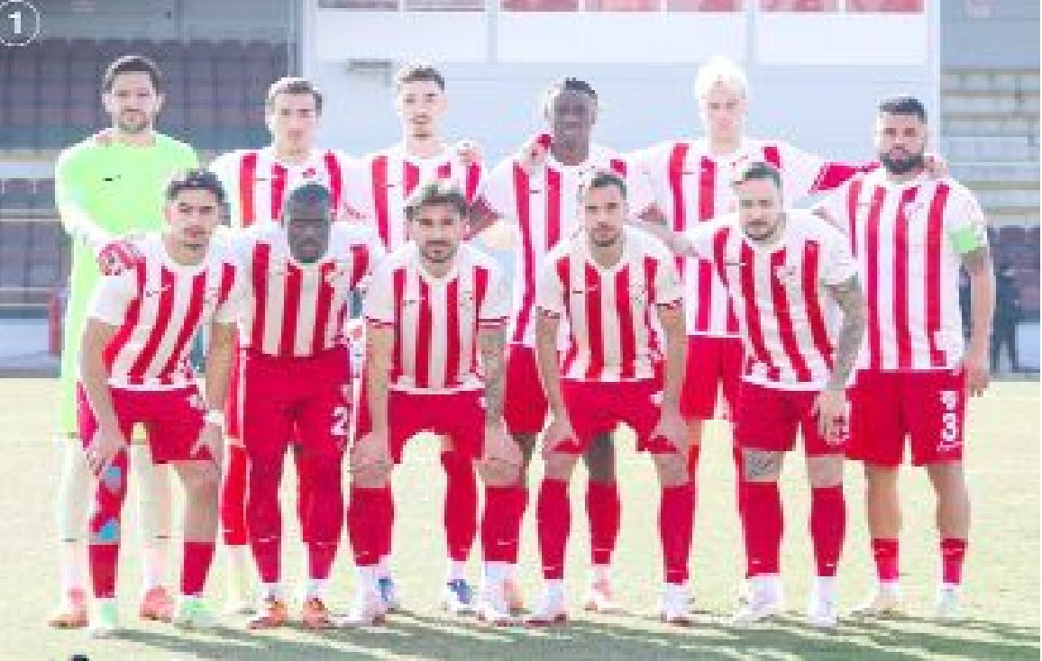
Boluspor, 41 puanın 24'ünü sahasında oynadığı maçlarda topladı.

Öte yandan, 6.maçın 4'ü Çorum'da, 2'si Bolu'da oynandı. Bolu'daki 2.maçta da galip taraf Boluspor oldu. (Hüseyin AŞKIN)