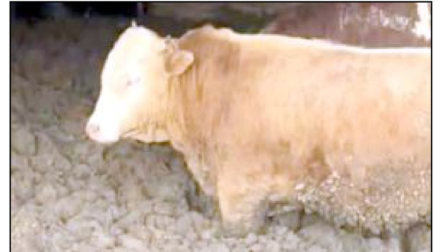
Büyükbaş hayvanları uygunsuz koşullarda barındıran işletmeye idari para cezası uygulandı.

mez. Bu ilkeyi ihlal eden hiçbir kişi ya da işletmeye müsamaha gösterilmeyecektir. Bakanlık olarak ülke genelinde hayvan refahının korunması amacıyla denetimlerimizi kararlılıkla sürdüreceğiz." (AA)