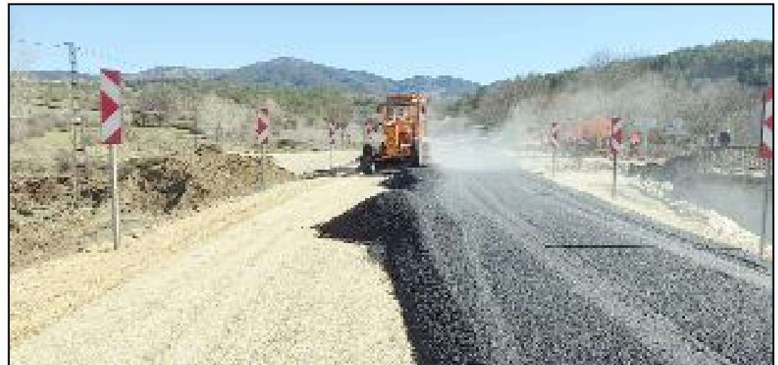
Bölgede iş makineleri eşliğinde çalışan ekipler, zemin düzenleme çalışmalarının ardından asfalt serim sürecine geçti.

Törende 12 bisiklet, 12 tablet ve 12 akıllı kol saati sahiplerini bulacak. Ayrıca program kapsamında yapılacak çekilişle katılımcılara çeşitli sürpriz hediyeler de verilecek. (Haber Merkezi)