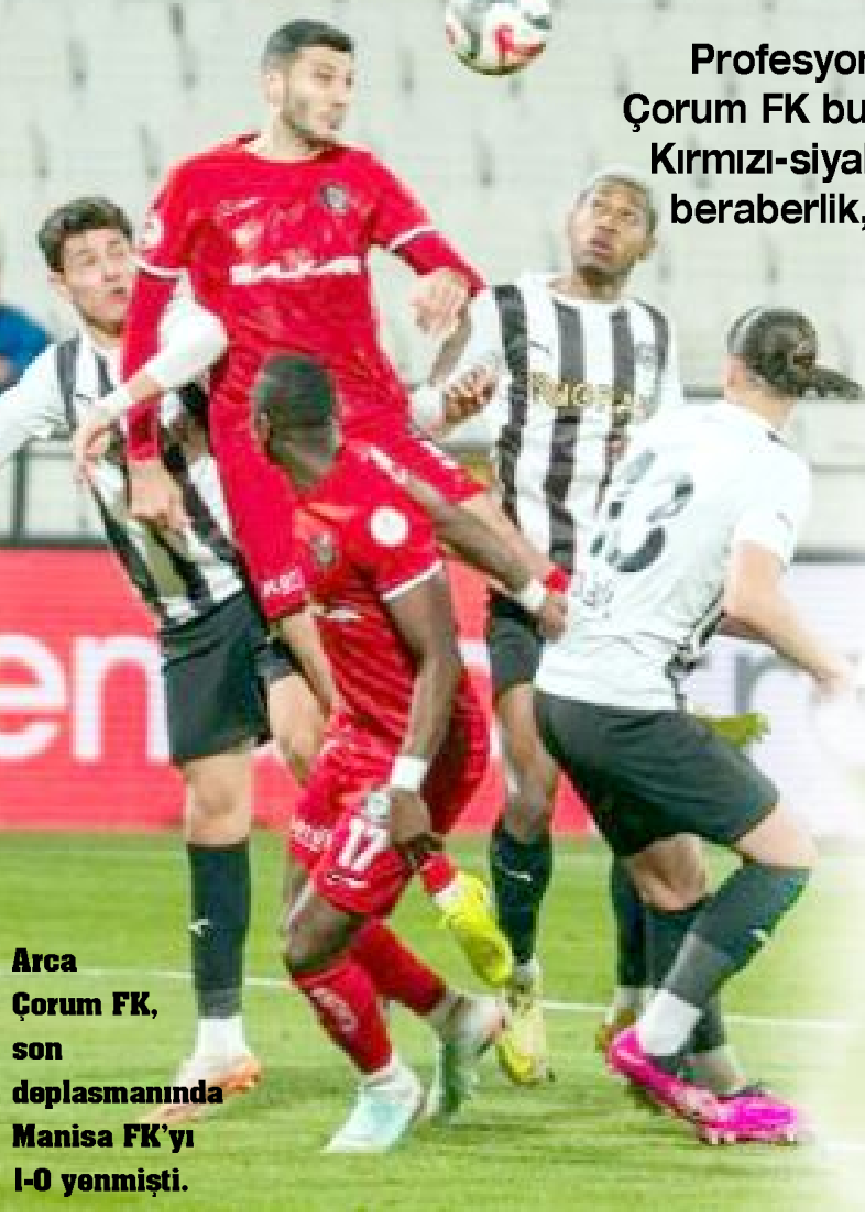
Arca Çorum FK, son deplasmanında Manisa FK'yi 1-0 yenmişti.

Arca Çorum FK'dan öğrencilere büyük jest!