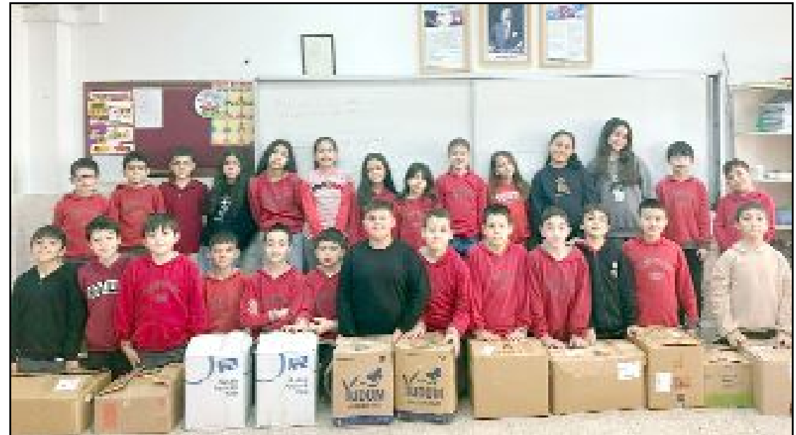
Sungurlu İsmetpaşa İlkokulu öğrencileri ihtiyaç sahiplerine yardım kolileri ulaştırdı.

Öğrenciler, paylaşmanın verdiği huzuru yaşayarak Ramazan'ın bereketini yalnızca sofralara değil, gönüllere de taşımış oldu. (Haber Merkezi)