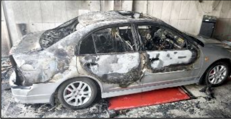
Yangında otomobilde ve iş yerinde maddi hasar meydana geldi.