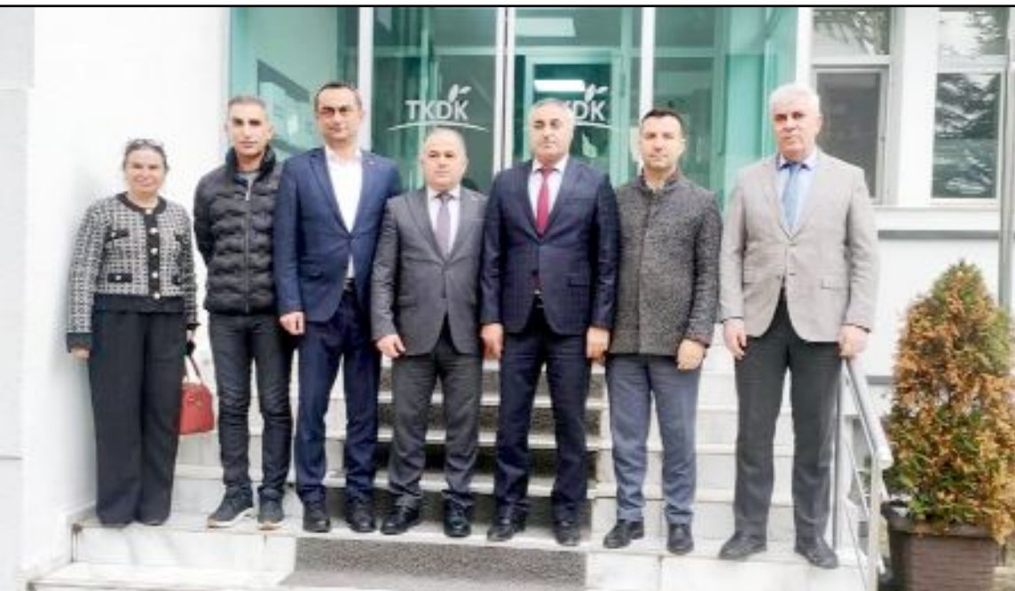
Tarım ve Orman Bakanlığı'na bağlı kurum müdürlerinin katılımı ile TKDK Koordinasyon Toplantısı yapıldı.

Toplantıyla ilgili yapılan açıklamada: "Tarım ve kırsal kalkınma alanında yürütülen çalışmaların daha etkin ve koordineli şekilde sürdürülmesi için ilgili tüm paydaşlarla işbirliği içerisinde çalışmalarımıza kararlılıkla devam edeceğiz" görüşüne yer verildi. (Haber Merkezi)