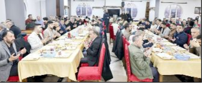
İftar yemeğine esnaf ve sanatkarlarda büyük ilgi gösterdi.