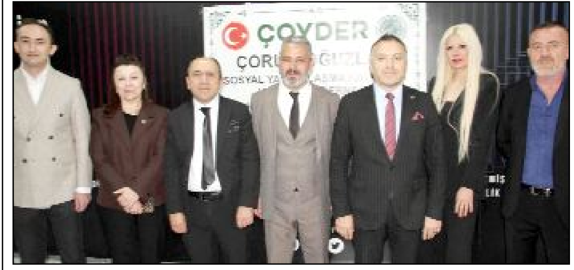
Oğuzlar Sosyal Yardımlaşma, Kalkınma ve Kültür Demeği tarafından geniş katımlı bir iftar düzenlendi.