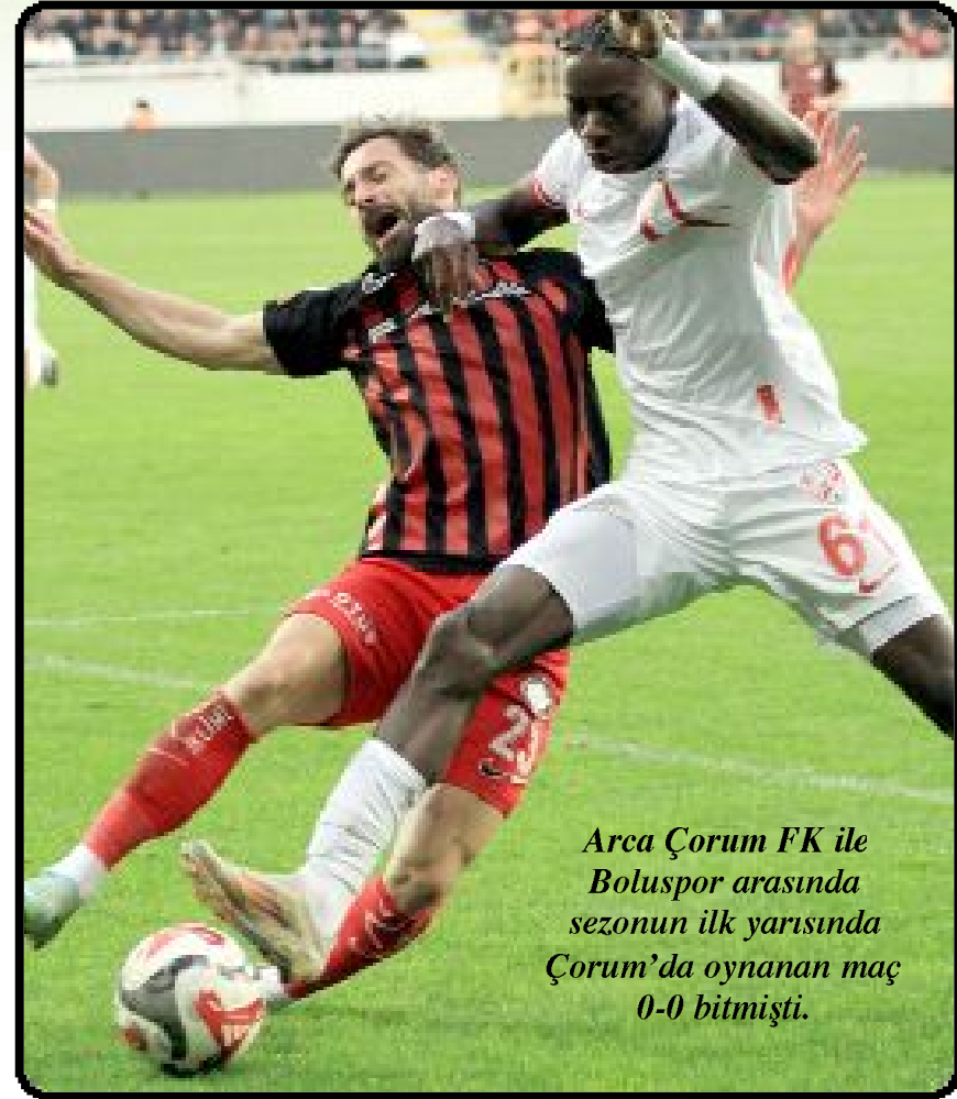
Arca Çorum FK ile Boluspor arasında sezonun ilk yarısında Çorum'da oynanan maç 0-0 bitmişti.

33 puanlı 4.sırada Arca Çorum FK ile 41 puanlı Boluspor arasında bugün Bolu Atatürk Stadı'nda oynanacak kritik maç saat 16.00'da başlayacak. (Hüseyin AŞKIN)