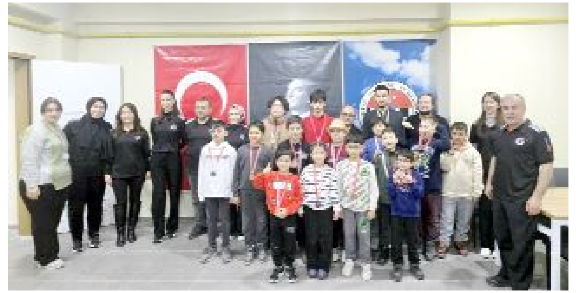
Kategorilerinde dereceye giren sporcular madalya ile ödüllendirildi.

9 puanla lider tamamlayarak 6-9 Nisan tarihleri arasında Yozgat'ta gerçekleştirilecek olan yarı final grubuna adını yazdırdı. (Ömür SOYTEMİZ)