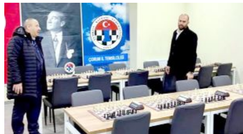
Federasyon Başkanı Apaydın, satranç salonunu gezdi.

Türkiye Satranç Federasyonu Başkanı Fethi Apaydın, Çorum'a bu yıl içerisinde bir organizasyon vereceklerini belirtti.