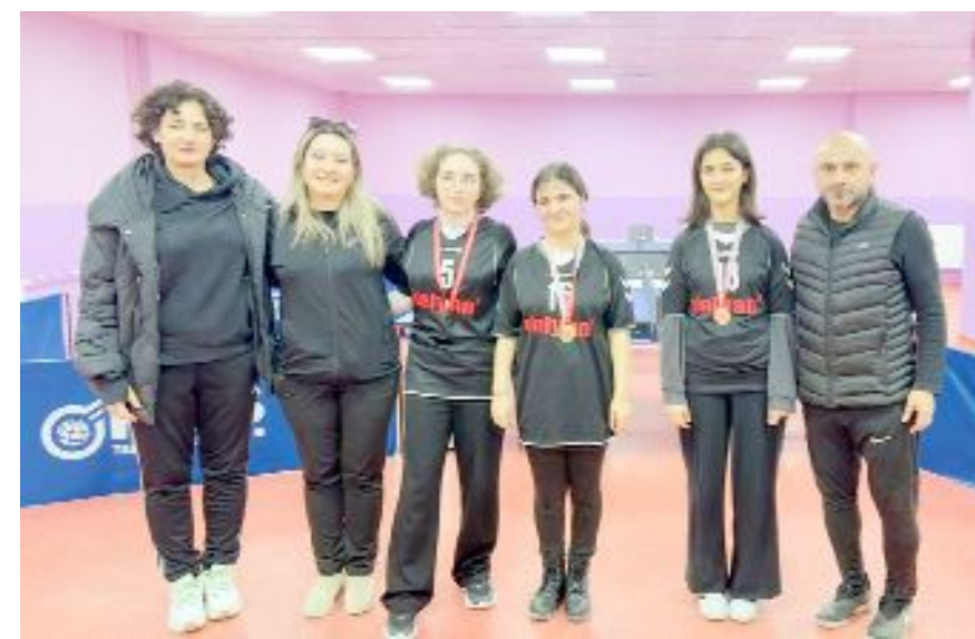
Müsabakalar sonunda düzenlenen törende, derecelerine göre sporculara madalya verildi.

Masa Tenisi İl Temsilciliği tarafından düzenlenen Özel Sporcular İl Birinciliği sona erdi.