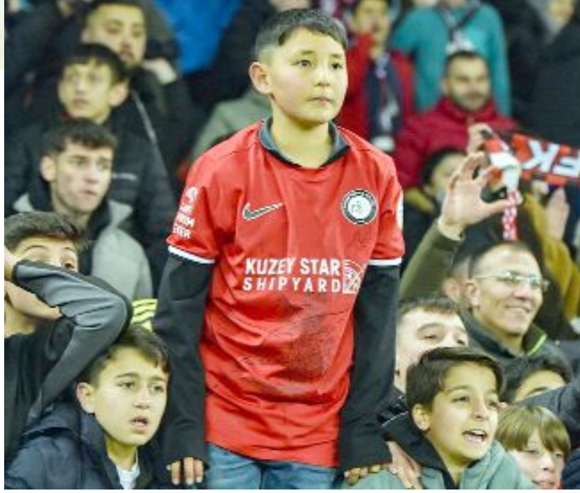
Öğrenciler, Esenler Erokspor maçını ücretsiz olarak tribünden izleyebilecekler.

Kulüpten yapılan açıklamaya göre, Esenler Erokspor maçını ücretsiz izlemek isteyen öğrencilerin 1 adet vesikalık fotoğraf ve kimlik fotokopisi ile birlikte Saat Kulesi önündeki passolig bürosuna en geç 15 Mart Pazar günü, saat 21.00'e kadar başvurmaları gerekiyor. (Hüseyin AŞKIN)