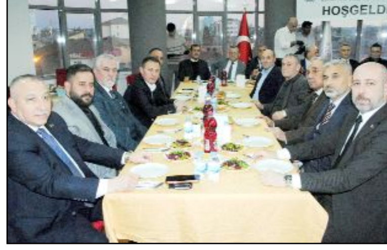
Çorum Esnaf ve Sanatkarlar Odaları Birliği tarafından düzenlenen iftar yemeğine Vali Çalgan başta olmak üzere kamu kurum ve kuruluş müdürleri, siyasi parti ve sivil toplum kuruluşu temsilcileri büyük ilgi gösterdi.