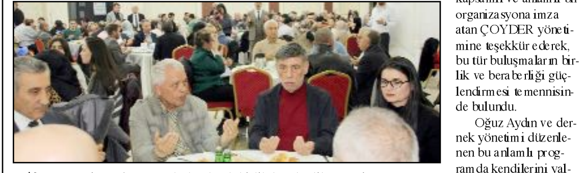
İftar yemeğine 750 Çorumlu katılarak birlik beraberlik örneği sergiledi.