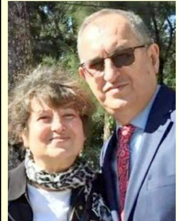
Ziynet-Atila Sertel çifti mutlu günlerinde...

● Mayıs 2021'de 61 yaşında kaybettiğimiz İzmirli gazeteci Ziynet Sertel anısına "Edebiyat Ödülleri" konularak bu yıl için "öykü" dalında yarışma düzenlendi.