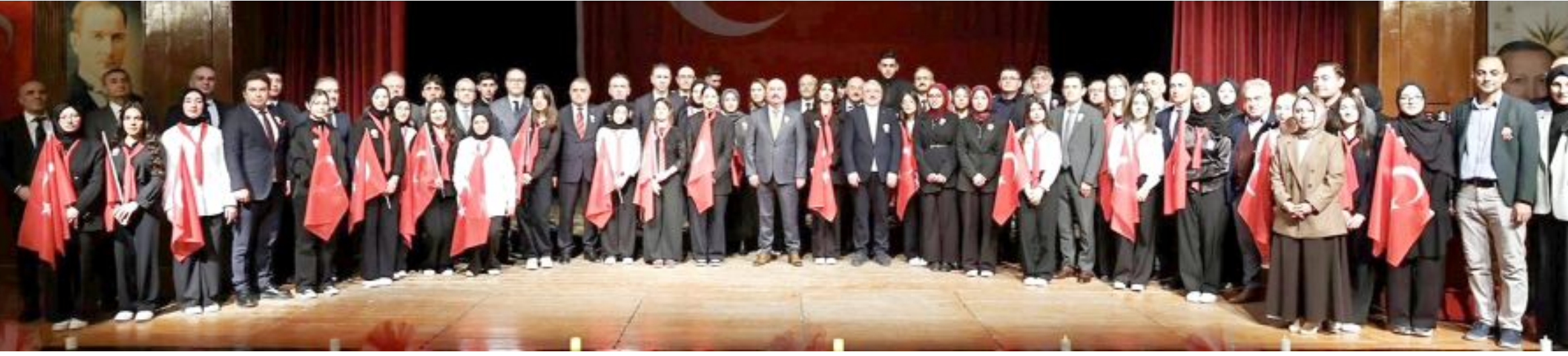
Buharaevler Kız Anadolu İmam Hatip Lisesi öğretmen ve öğrencileri tarafından hazırlanan 12 Mart İstiklâl Marşı'nın Kabulü ve Mehmet Akif Ersoy'u Anma Günü Programı, Devlet Tiyatrosu Salonu'nda yoğun katılımıyla gerçekleştirildi.