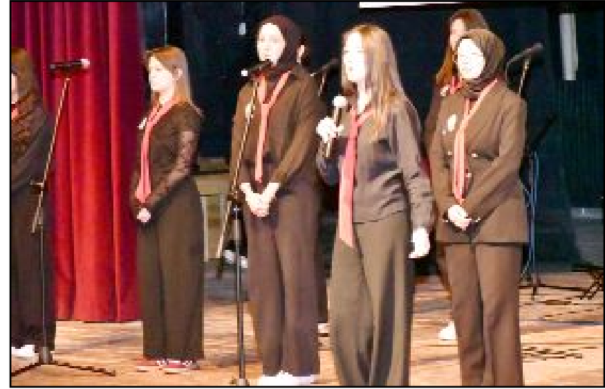
Öğrencilerin gösterileri beğeniyle izlendi.