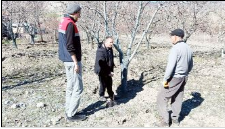
Mecitözü İlçe Tarım Müdürlüğü teknik personeli yaptıkları incelemede badem bahçelerinin verimini düşüren hastalığı tespit ederken, hastalığın zararının azaltılması için çalışmalara da başladılar.