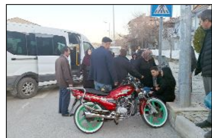
Kaza, İskilip-Tosya karayolu üzerindeki Pazarbaşı Köprüsü mevkiinde meydana geldi.

Çorum'un İskilip ilçesinde motosiklet ile servis minibüsünün çarpışması sonucu meydana gelen trafik kazasında 1 kişi yaralandı.