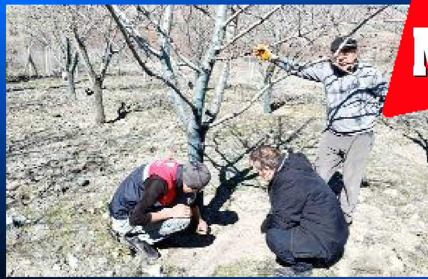
Mecitözü İlçe Tarım ve Orman Müdürlüğü teknik personeli badem bahçelerindeki incelemelerde mummy monilya hastalığı tespit etti.