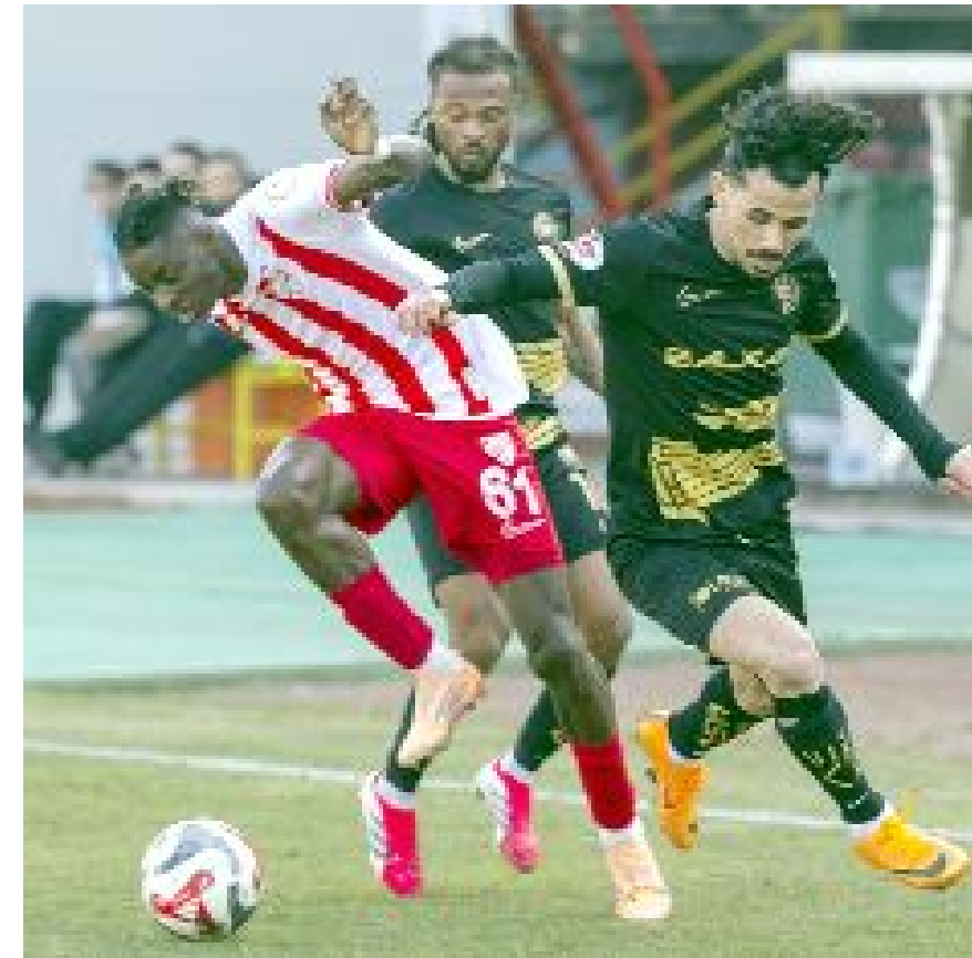
Uzatmalarda bulduğu golle 2-1 kazanan Arca Çorum FK, şampiyonluk için de yeniden umutlandı.

13.30 Bandırmaspor-İğdır FK 16.00 Arca Çorum FK-Esenler Erok 20.00 Bodrum FK-Bolospor