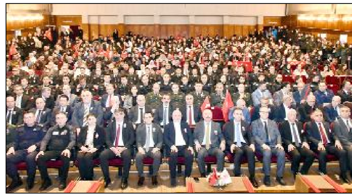
12 Mart İstiklal Marşı'nın Kabulü ve Mehmet Âkif Ersoy'u Anma Günü Programı, Devlet Tiyatrosu Salonu'nda yoğun katılımıyla gerçekleştirildi.