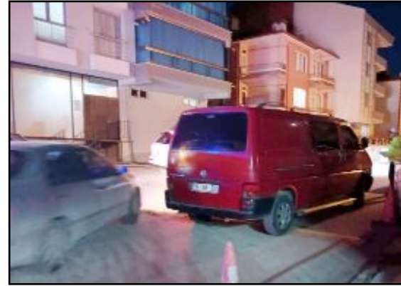
Karşıyaka 1. Cadde ile 10. Sokak kesişiminde yaşanan kazada yaralı bir kişi hastaneye kaldırıldı.

Kaza nedeniyle hasar gören araçlar küçük yardımıyla olay yerinden kaldırıldı. Polis ekipleri kazanın meydana geliş nedenine ilişkin inceleme başlattı. (Haber Merkezi)