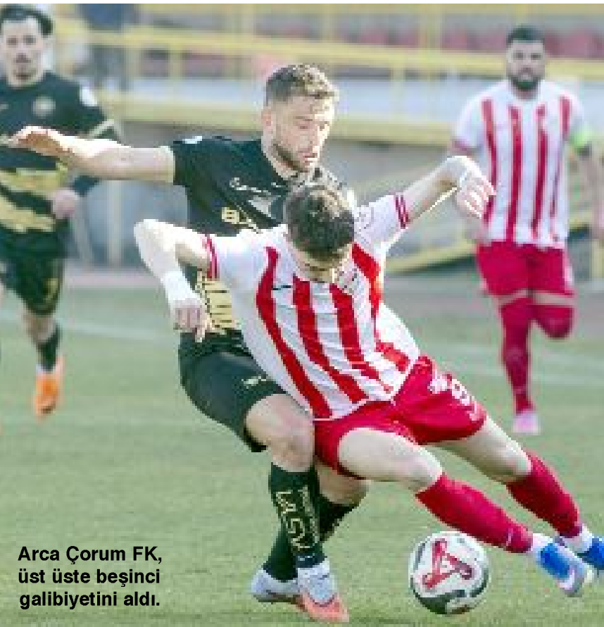
Arca Çorum FK, üst üste beşinci galibiyetini aldı.