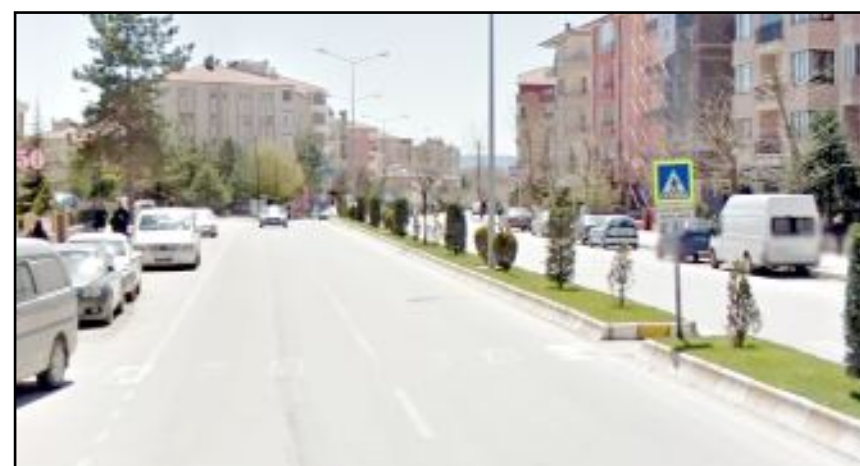
Eşref Hoca Caddesi üzerinde, fahri trafik müfettişi tarafından S.Ö. isimli sürücüye aracından yola çöp attığı gerekçesiyle bin lira idari para cezası kesildi.

Olay, fahri trafik müfettişlerinin yazdığı cezalar ve bu cezaların denetim konusundaki tartışmaları yeniden gündeme taşıdı. (Haber Merkezi)