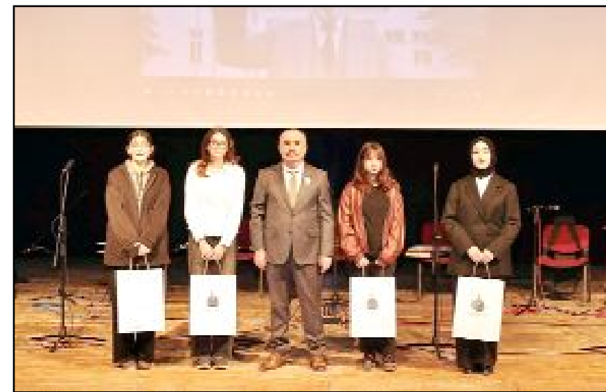
Millî Eğitim Müdürlüğü tarafından düzenlenen yarışmalarda dereceye giren öğrencilere ödülleri verildi.