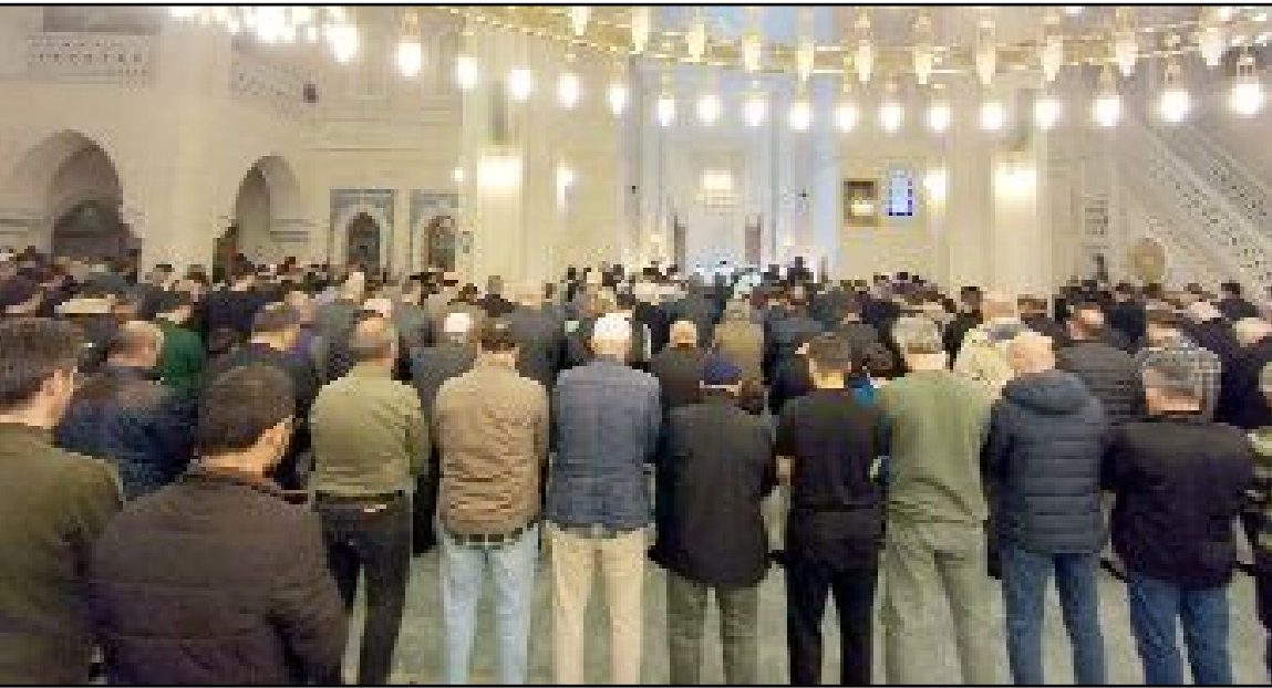
Ezanın okunmasının ardından Yatsı namazı ve Enderun usulü teravih namazı eda edildi.