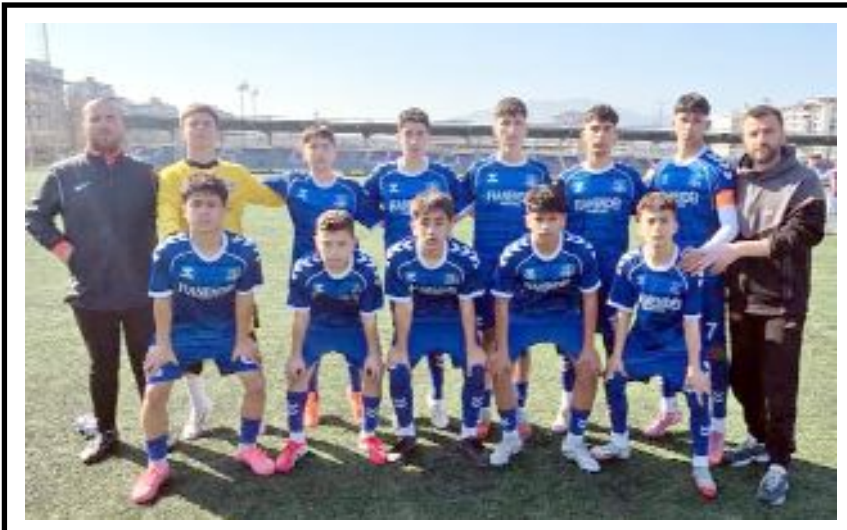
Çorum şampiyonu Vefaspor, Samsun ekibi Bafra 23 Nisan'a rahat geçti.

Büyük heyecana sahne olan final müsabakasında da Arı Koleji ile karşı karşıya gelen Bahçeşehir, ortaya koyduğu başarılı oyunla rakibini bir kez daha mağlup ederek bölge şampiyonluğunu kazandı. Bahçeşehir, bu başarısıyla Türkiye şampiyonasına katılma hakkı elde etti. (Hüseyin AŞKIN)