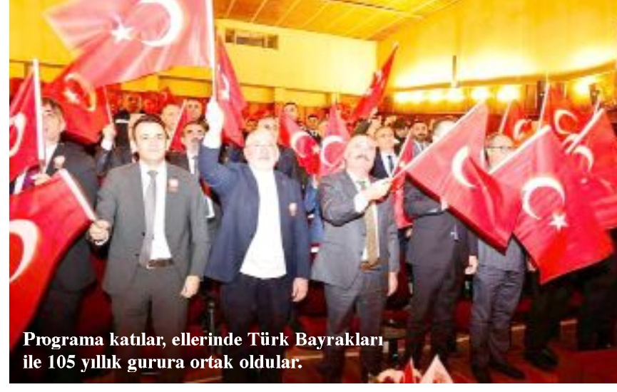
Programa katılan, ellerinde Türk Bayrakları ile 105 yıllık gurura ortak oldular.

● İstiklâl Marşı'nın kabulünün 105. yılı nedeniyle düzenlenen programda oratoryo gösterisi büyük beğeni toplarken, "Zulmü Alkışlayamam" şiiri, İstiklâl Marşı ve Mehmet Akif Ersoy'un bestelenmiş şiirlerinden seçkiler seslendirildi. •3'de