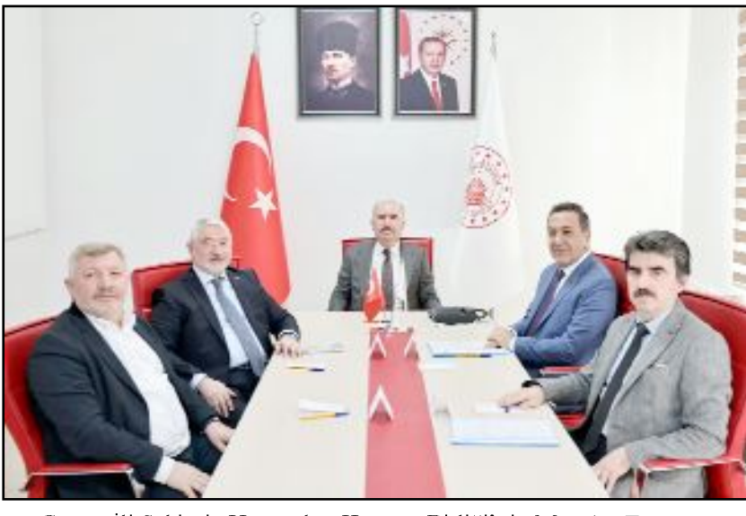
Çorum İli Sahipsiz Hayvanları Koruma Birliği'nin Mart Ayı Encümen Toplantısı, Vali Ali Çalğan başkanlığında Valilik Toplantı Salonu'nda yapıldı.

Sahipsiz hayvanların daha güvenli ve sağlıklı koşullarda yaşamlarını sürdürebilmeleri için yürütülen çalışmaların artarak devam edeceği ifade edildi. (Haber Merkezi)