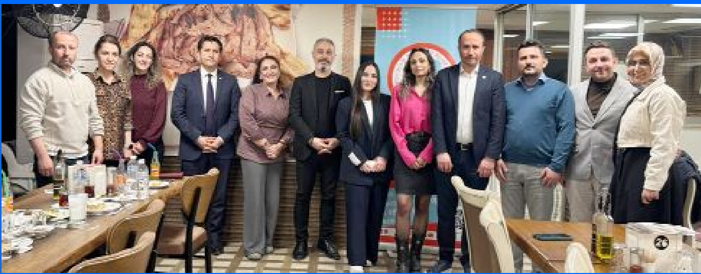
Psikolojik danışmanlar, Ramazan ayının birlik, huzur ve bereketinin mesleklerine ve hayatlarına da yansımaları dileddiler.