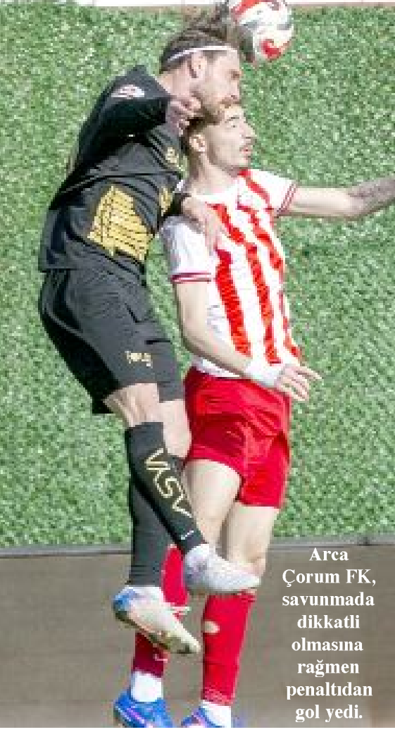
Arca Çorum FK, savunmada dikkatli olmasına rağmen penaltıdan gol yedi.

5'te 5 yapan Arca Çorum FK puanını 56'ya yükseltirken, Boluspor 41 puanda kaldı. (Hüseyin AŞKIN)