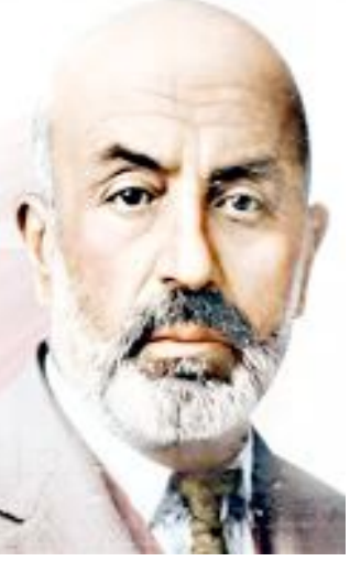
Mehmet Akif Ersoy