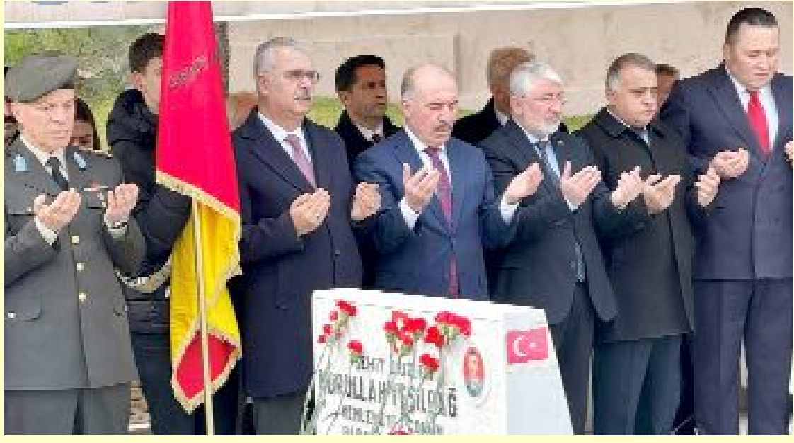
Çorum Şehitliği'ndeki çelenk sunma töreni sonrasında şehit kabirlerine karanfil bırakılarak dua edildi.