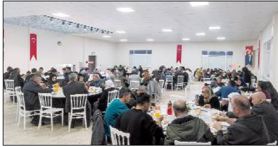
Oğuzlar Belediyesi tarafından belediye personeline yönelik iftar programı düzenlendi.