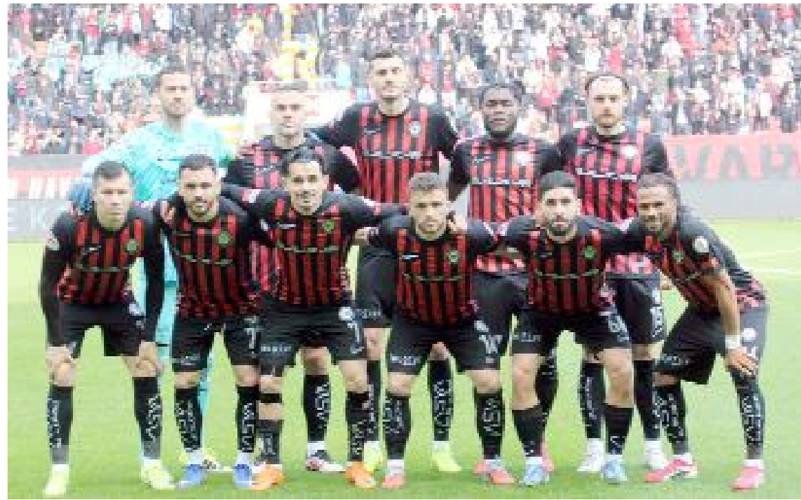
Son 6 maçını kazanan Arca Çorum FK, topladığı 59 puanın 23'ünü deplasmanda hanesine yazdırdı.