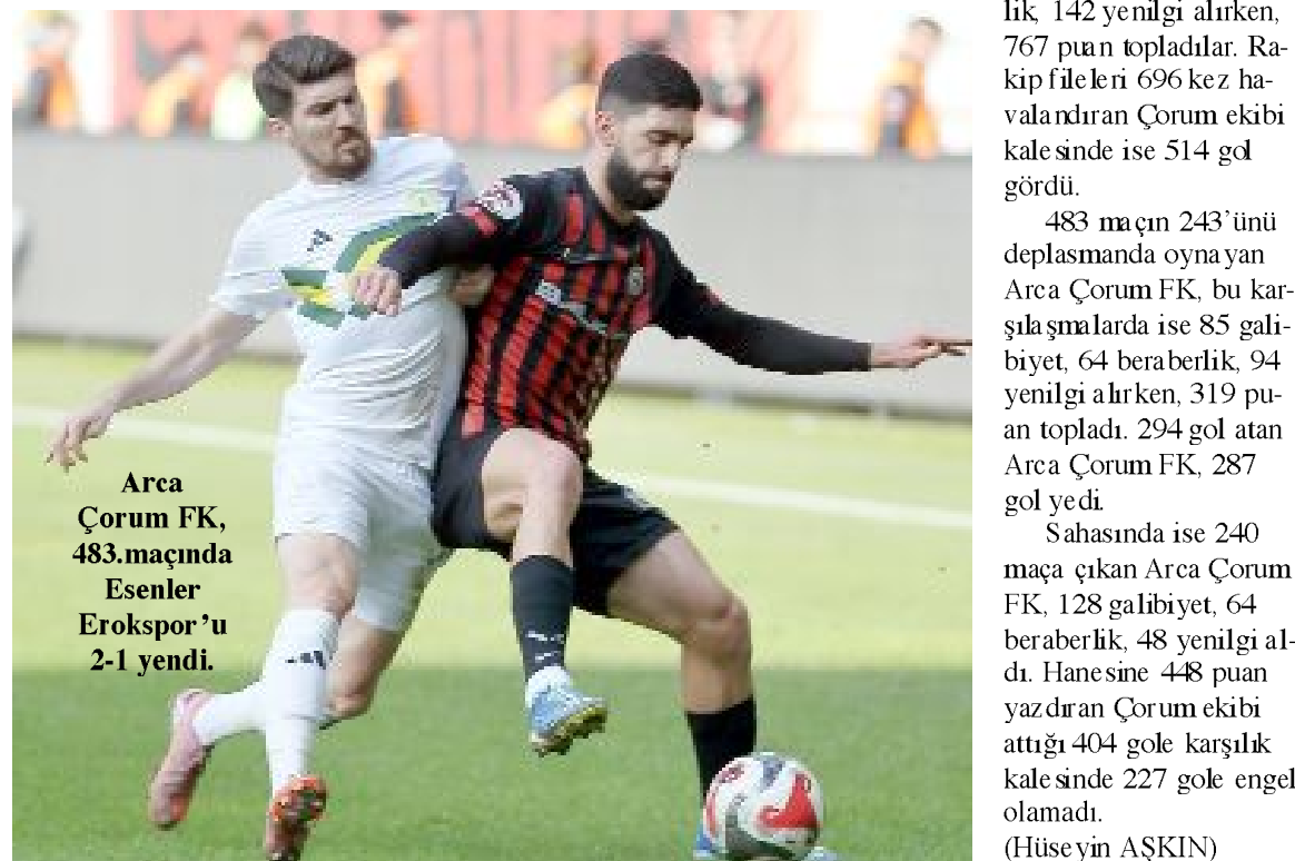
Arca Çorum FK, 483.maçında Esenler Erokspor'u 2-1 yendi.

Sahasında ise 240 maça çıkan Arca Çorum FK, 128 galibiyet, 64 beraberlik, 48 yenilgi aldı. Hanesine 448 puan yazdıran Çorum ekibi attığı 404 gole karşılık kalesinde 227 gole engel olamadı. (Hüseyin AŞKIN)