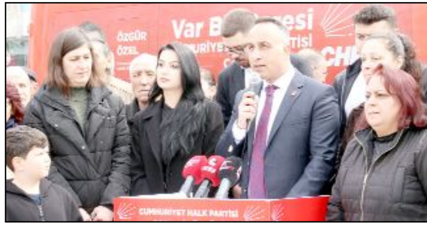
Ekrem İmamoğlu'nun gözaltına alınması ve ardından tutuklanarak cezaevine gönderilmesinin 1. yıldönümü nedeniyle Kadeş Barış Meydanı'nda basın açıklaması gerçekleştirildi.