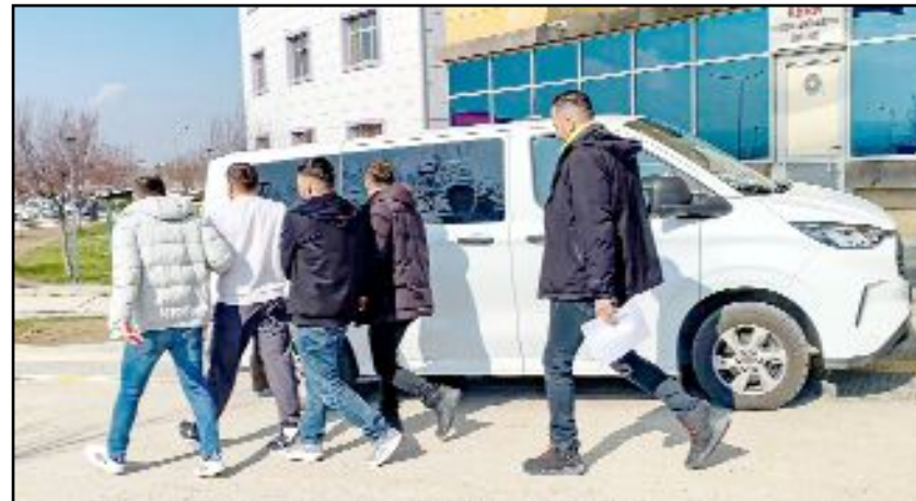
Gözaltına alınan 2 firari hükümlü, emniyetteki işlemlerinin ardından tutuklanarak cezaevine teslim edildi.

(21) olduğu tespit edildi. Yapılan incelemede, U.E.'nin "yağma" suçundan 17 yıl 6 ay kesinleşmiş hapis cezasının bulunduğu belirlendi. B.Ç.'nin ise "silahla tehdit" suçundan 32 ay 15 gün hapis cezası olduğu ve Samsun Cezaevi'nde firar ettiği tespit edildi. Gözaltına alınan 2 firari hükümlü emniyetteki işlemlerinin ardından tutuklanarak cezaevine teslim edildi. (İHA)