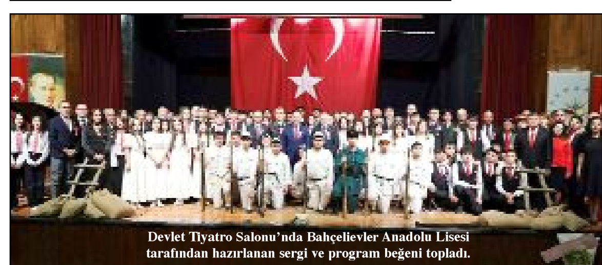
Devlet Tiyatro Salonu'nda Bahçelievler Anadolu Lisesi tarafından hazırlanan sergi ve program beğeni topladı.