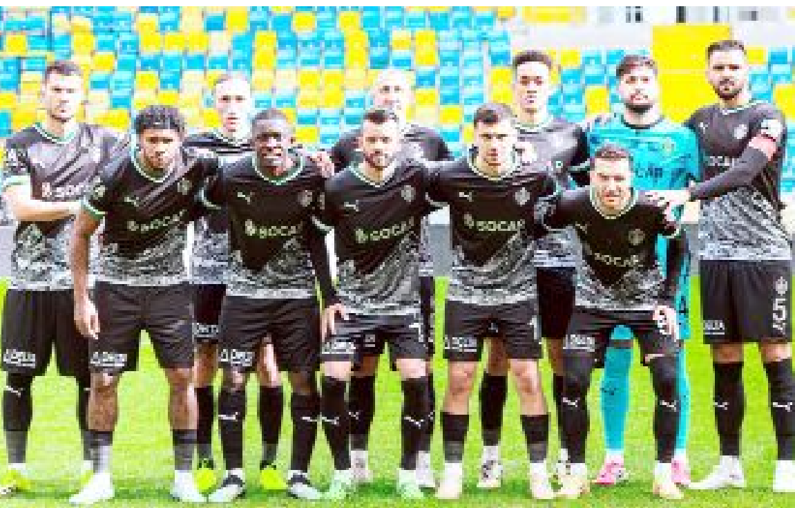
Ligin en kötü iç saha takımlarından biri olan Iğdır FK, evinde çıktığı 15 maçta 24 puan alabildi.

13.00 Vanspor-Sarıyer 13.30 Hatayspor-Amedspor 16.00 Iğdır FK-Arca Çorum FK 16.00 İstanbulspor-Bodrum FK 19.00 Esenler Erokspor-Erzurumspor