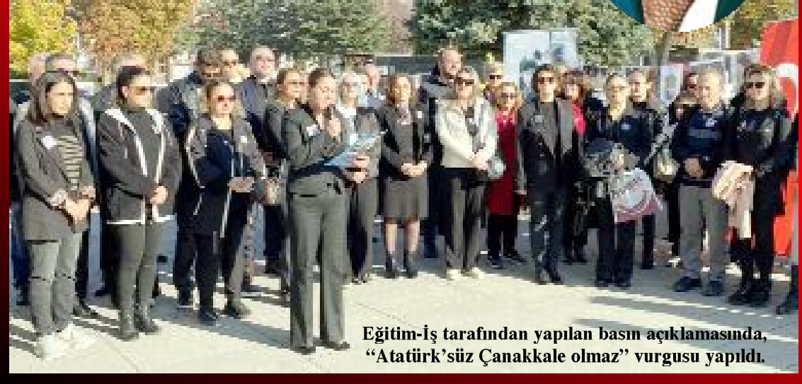
Eğitim-İş tarafından yapılan basın açıklamasında, "Atatürk'süz Çanakkale olmaz" vurgusu yapıldı.