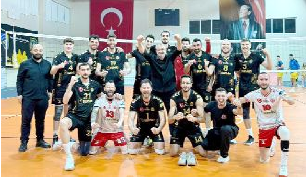
Normal sezonu galibiyetle kapatan Sungurlu Belediyespor, Efeler Ligi'ne yükselme maçındaki rakibini bekliyor.

AFDK'dan yapılan açıklamada, itirazın reddedildiği belirtilirken, Sungurlu Belediyespor'un itiraz için Türkiye Futbol Federasyonu Hukuk Kurulu'na başvuru yapabileceğini hatırlattı. (Hüseyin AŞKIN)