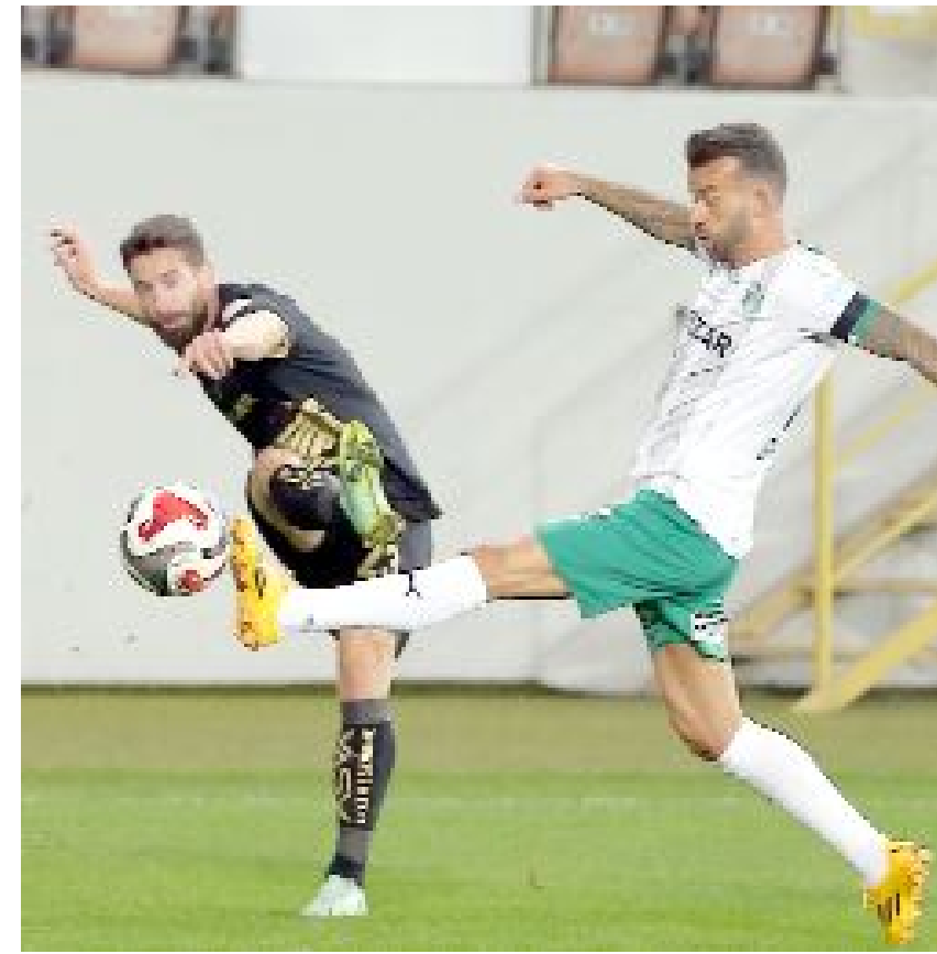
İki takım arasında sezonun ilk yarısında Çorum'da oynanan maçı Arca Çorum FK 3-1 kazanmıştı.

Arca Çorum FK, Iğdır FK ile oynadığı 3 resmi maçta 1 galibiyet, 1 beraberlik, 1 yenilgi alırken, attığı 3 gole karşılık kalisnde 2 gol gördü.