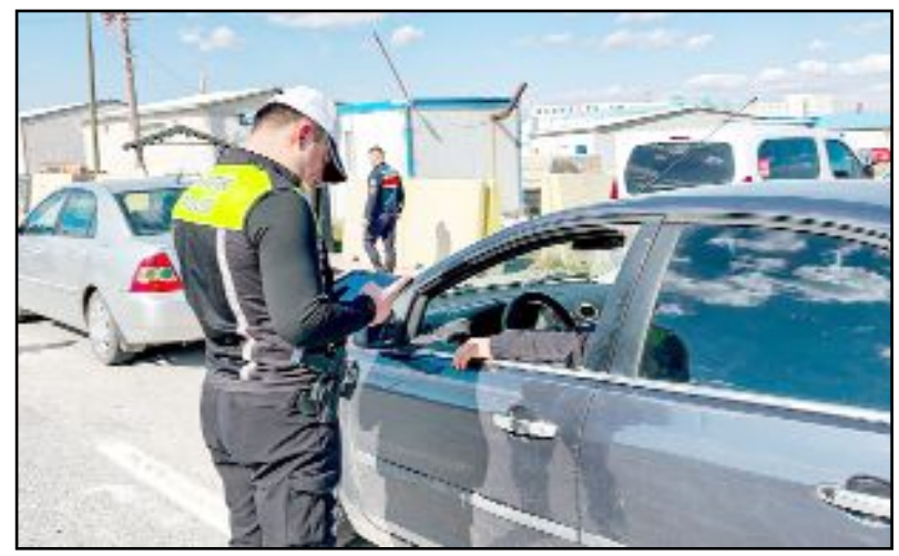
Alaca İlçe Emniyet Müdürlüğü Trafik Şube Müdürlüğü ekipleri, Ramazan Bayramı dolayısıyla denetimlerini üst seviyeye çıkardı.

Gerçekleştirilen denetimlerde polis ekipleri tarafından sürücülere kurallarla ilgili uyarı ve hatırlatmalar yapılıyor.