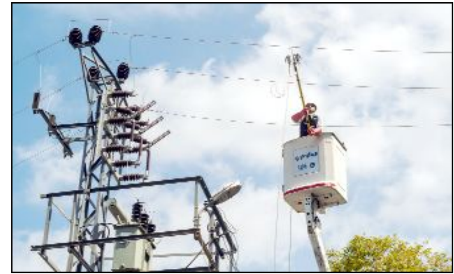
851 arıza onarım personeli, 360 araç ve 80 nöbetçi amirin bayram boyunca görev alacağı belirtildi.

ek lokasyonlar oluşturuldu. Vatandaşlar, taleplerini 186 Çağrı Merkezi ve 0530 10 60 186 WhatsApp hattı üzerinden iletebilecek. Bu kapsamlı planlama ve önlemler sayesinde aboneler, Ramazan Bayramı boyunca güvenli ve sürdürülebilir enerjiye erişmeye devam edecek. (Haber Merkezi)