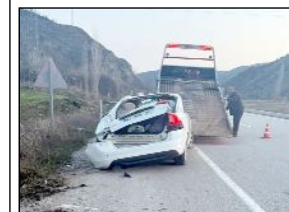
Yaralılar, sağlık ekiplerinin ilk müdahalesinin ardından Hitit Üniversitesi Erol Olçok Eğitim ve Araştırma Hastanesi'ne kaldırıldı.