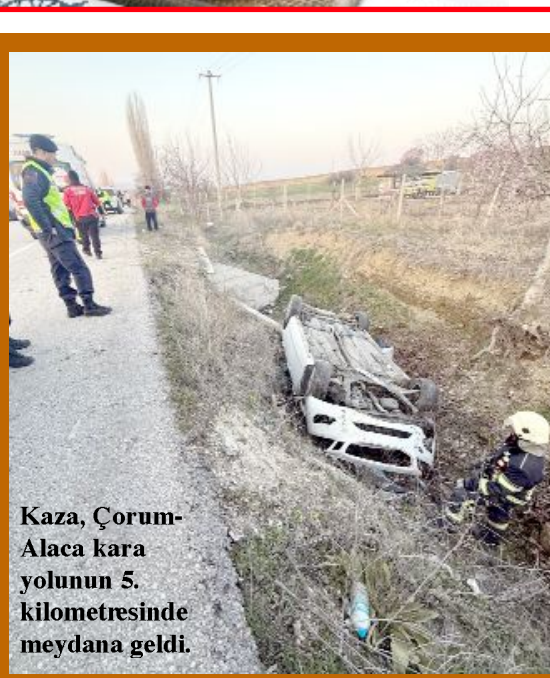
Kaza, Çorum-Alaca kara yolunun 5. kilometresinde meydana geldi.

● Çorum Belediyesi'nin girişimleri sonucunda, şehrin geleneksel lezzetlerinden Çorum simidi, Türk Patent ve Marka Kurumu tarafından coğrafi işaretle tescillendi. •9'da