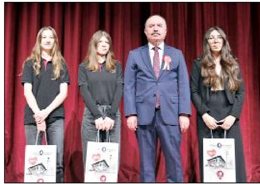
Çanakkale Zaferi nedeni ile düzenlenen yarışmalarda dereceye giren öğrenciler ödüllendirildi.

Ocak günün anlam ve önemine ilişkin konuştu. 18 Mart nedeni ile düzenlenen yarışmalarda dereceye giren öğrencilere ödülleri verildiği programda "Çanakkale Geçilmez" adlı oratoryo ve tiyatro gösterisi sahnelendi. Çanakkale türkülerinin seslendirildiği müzik dinletisi ile program sona erdi. (Volkan SINAYUÇ)