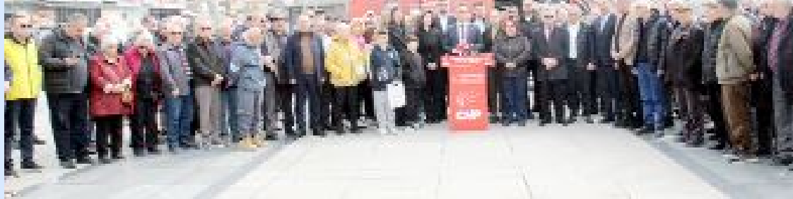
Kadeş Barış Meydanı'nda, Ekrem İmamoğlu'nun gözaltına alınması ve ardından tutuklanarak cezaevine gönderilmesinin 1. yıldönümü nedeniyle basın açıklaması yapıldı.

● CHP İl Başkanı Dinçer Solmaz, "Milletten korkanlar kaybedecek, millette koşanlar kazanacaktır" diyerek, gelinen nokta itibarıyla daha cesur, daha çalışkan ve daha umutlu olduklarını söyledi. •15'de