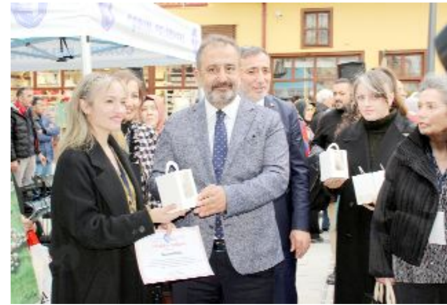
Sergiye katkı sağlayan sanatçılara teşekkür belgesi verildi.

Konuşmanın ardından festivalde eserleri olan ressamlara teşekkür belgesi takdim etti. 34 ressamın 34 eserinin sergilendiği Puduhepa Resim Sergisi yarından itibaren bazı okullarda sergilenmeye devam edecek. (Haber Merkezi)