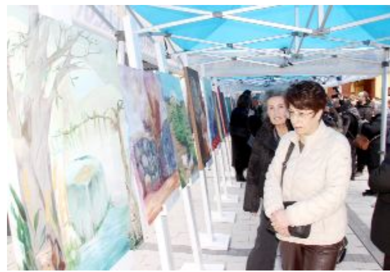
3. Puduhepa Kadın Kültür Festivali kapsamında Belediye ve ÇOSED işbirliğinde sergi düzenlendi.