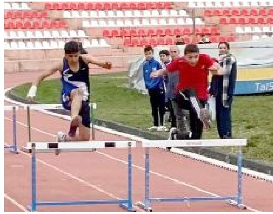
Yarışmalar oldukça çekişmeli geçti.

5x60 Metre: 1. Alaca Denizhan Ortaokulu, 2. Kocatepe Ortaokulu, 3. Bayat Şehit Yakup Kozan