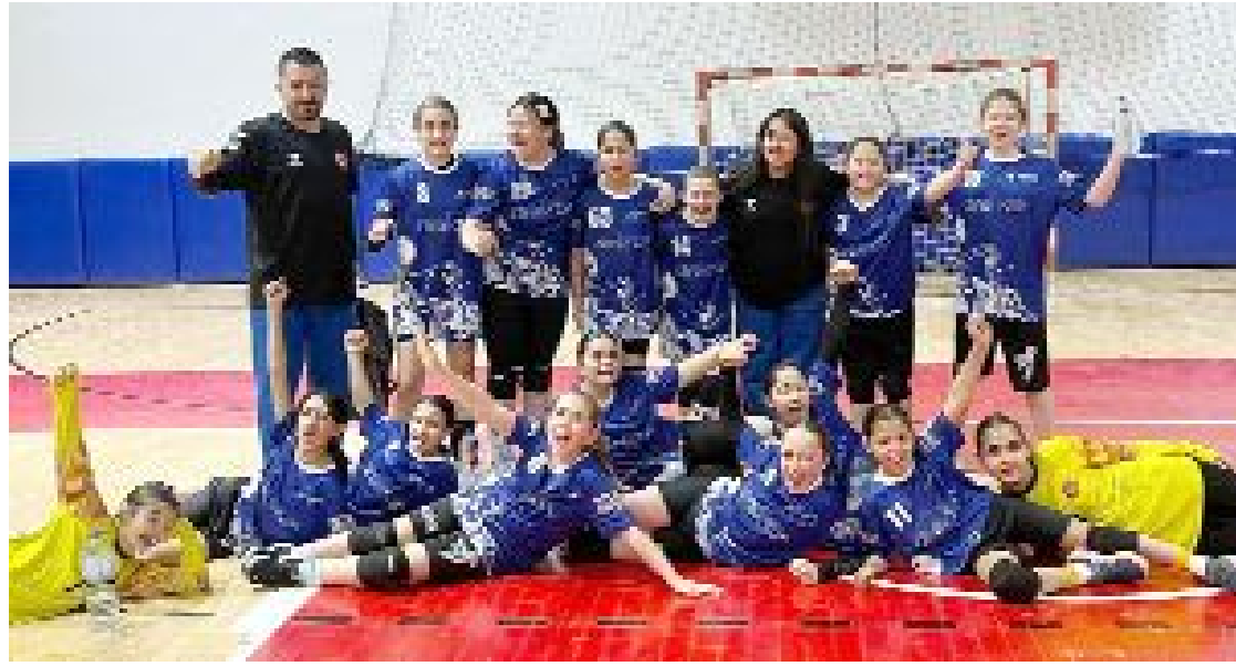
Kızlarda Dr. Sadık Ahmet Ortaokulu şampiyonluğunu ilan etti.

Alaca Denizhan Ortaokulu, Okullararası Küçükler ve yıldızlar (kız-erkek) Puanlı Atletizm İl Birinciliğinde dört kategoride de şampiyon oldu.