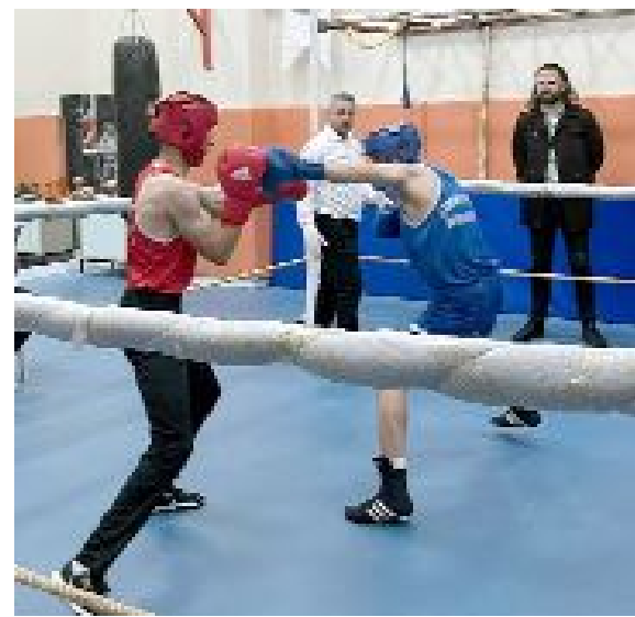
İl birinciliğinde, 6 sıklıtte müsabaka yapıldı.

Kilolarında birinci olan ve madalya ile ödüllendirilen bu sporcular, 9-19 Nisan tarihlerinde Bursa'da düzenlenecek Türkiye Boks Şampiyonasında Çorum'u temsil etme hakkı kazandılar. (Hüseyin AŞKIN)