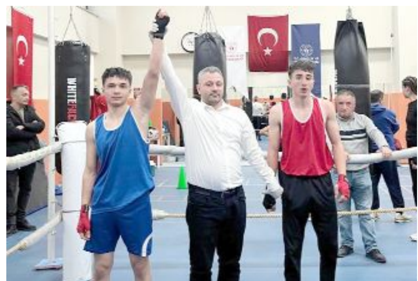
Birinci olan sporcular Türkiye şampiyonasına katılacak.

Çorum Yeni Spor Salonu'nda, 12 sporcunun katılımıyla düzenlenen il birinciliğinde sadece 6 sıklıtte müsabaka yapılabildi. Kilolarında birinci olan sporcular Bursa'da yapılacak Türkiye Şampiyonasında ringe çıkacak.