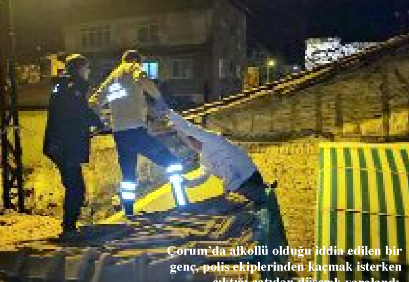
Çorum'da alkollü olduğu iddia edilen bir genç, polis ekiplerinden kaçmak isterken çıktığı çatıdan düşerek yaralandı.