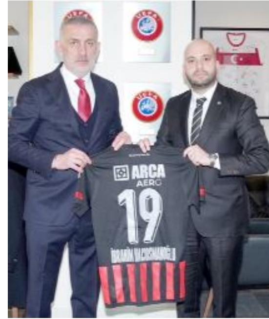
Arca Çorum FK Başkanı Baran Korkmazoğlu, TFF Başkanı İbrahim Ethem Hacısmanoğlu ve TFF Başkanvekili Mecnun Otyakmaz'a isimlerinin yazılı olduğu Arca Çorum FK forması hediye etti.

Nazik ev sahiplikleri için Türkiye Futbol Federasyonu Başkanı Sayın İbrahim Hacısmanoğlu'na ve Başkan Vekili Sayın Mecnun Otyakmaz'a teşekkür ederiz" ifadeleri kullandı. (Hüseyin AŞKIN)