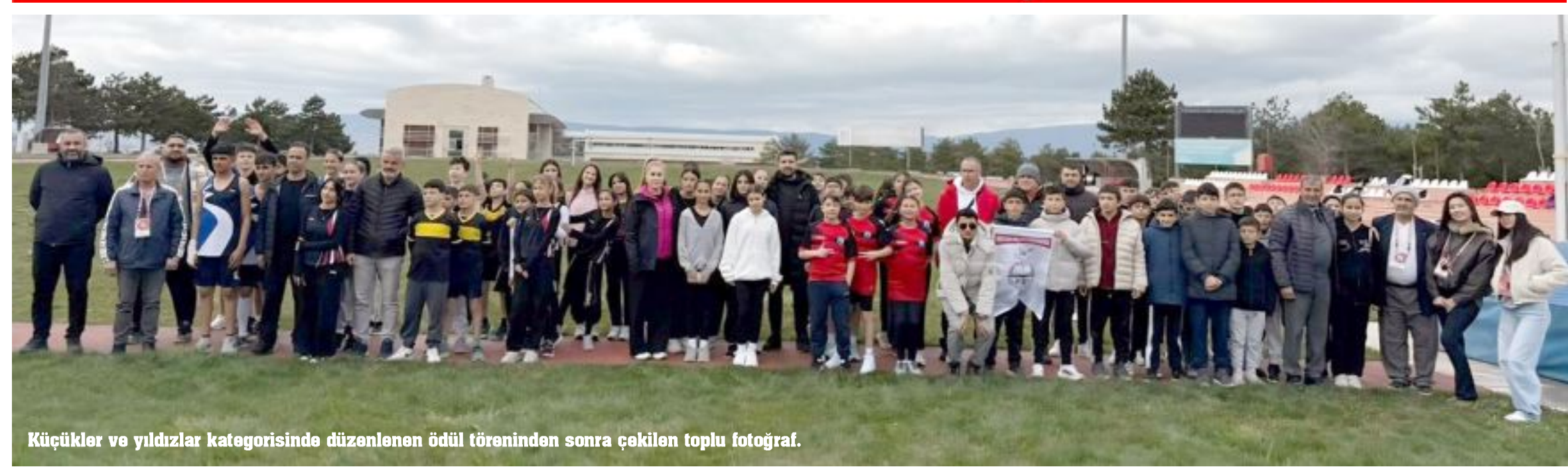
Küçükler ve yıldızlar kategorisinde düzenlenen ödül töreninden sonra çekilen toplu fotoğraf.