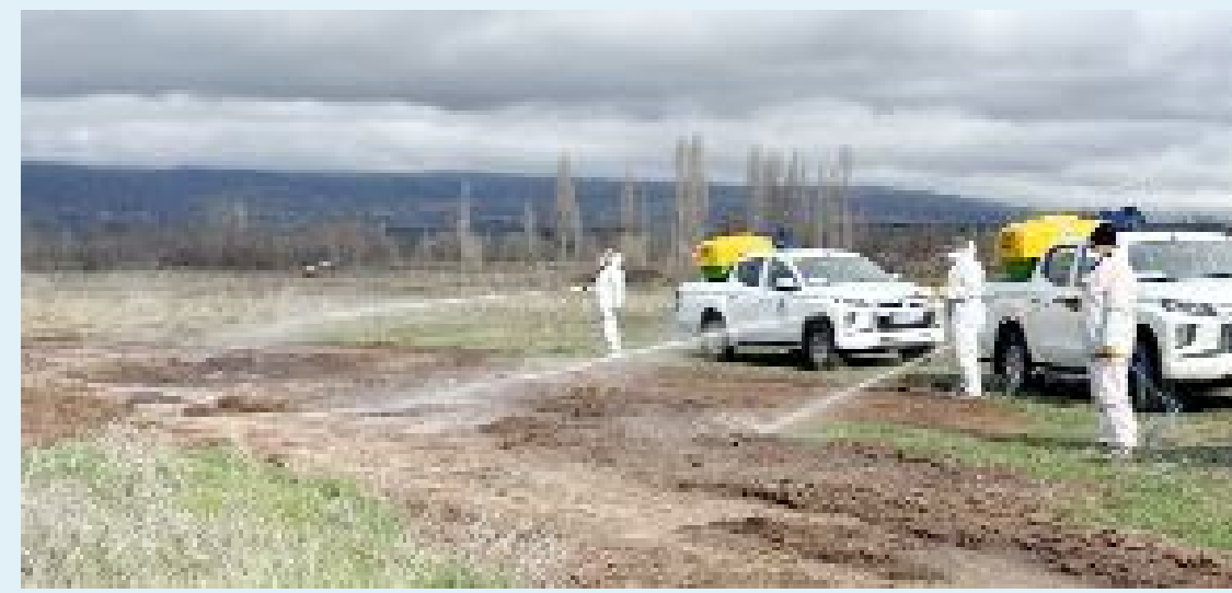
Havaların ısınmasıyla birlikte artabilecek risklere karşı erken harekete geçen ekipler, fiziksel müdahalelerin yanı sıra larva mücadelesine de ağırlık veriyor.