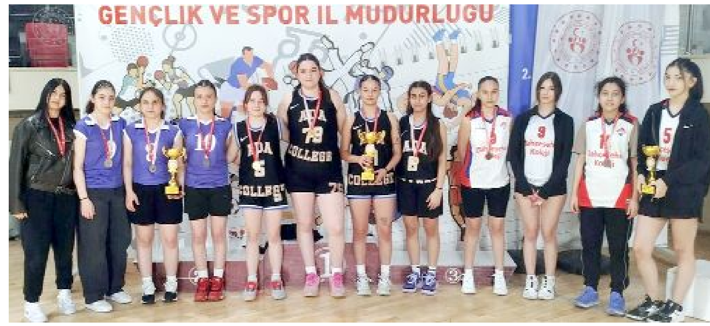
Kızlarda dereceye giren takımlar ödülleriyle...

Liseli Gençler 3x3 Basketbol II Birinciliği sona erdi