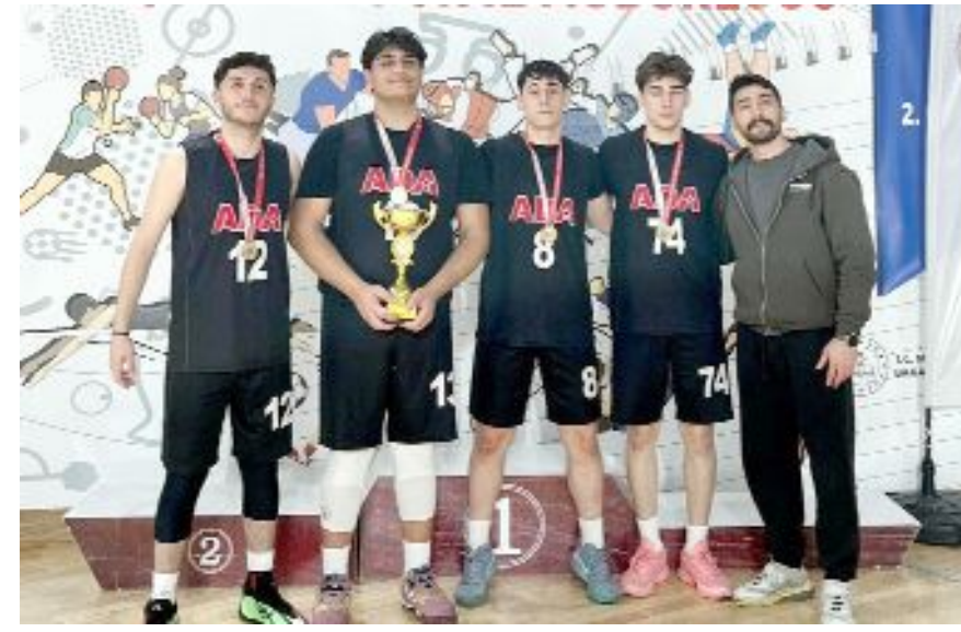
Erkeklerde şampiyon olan Özel Çorum Ada Koleji Anadolu Lisesi kupayla...

© Kızlarda, Başöğretmen Anadolu Lisesi ikinci, Özel Çorum Bahçeşehir Koleji Anadolu Lisesi üçüncü olurken, erkeklerde ise Özel Çorum Ada Koleji Anadolu Lisesi'nin ardından TED Çorum Koleji Anadolu Lisesi ikinciliği, Şehit Abdullah Tayyip Olçok Anadolu Lisesi üçüncülüğü elde etti.