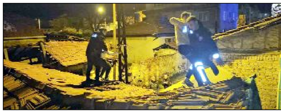
Alkollü olduğu iddia edilen bir genç, polis ekiplerinden kaçmak isterken çıktığı çatıdan düşerek yaralandı.

de başarılar dileyip hediyeye takdim etti. (Haber Merkezi)