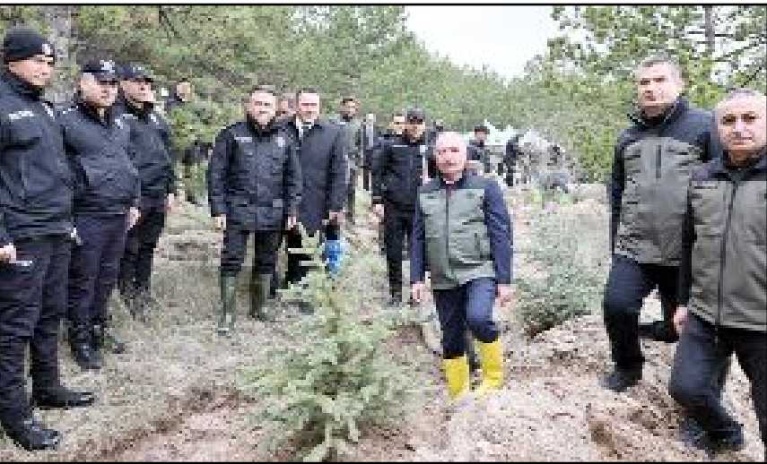
"Türkiye'nin Gücü Orman" sloganıyla yapılan etkinliğe protokol üyeleri ile birlikte siyasi parti temsilcileri, öğretmenler, öğrenciler ve vatandaşlar katıldı.