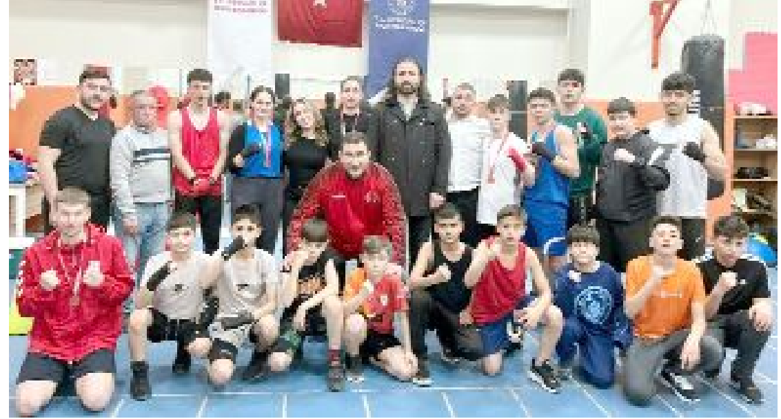
İl birinciliğine katılan bazı sporcular ve yetkililer..