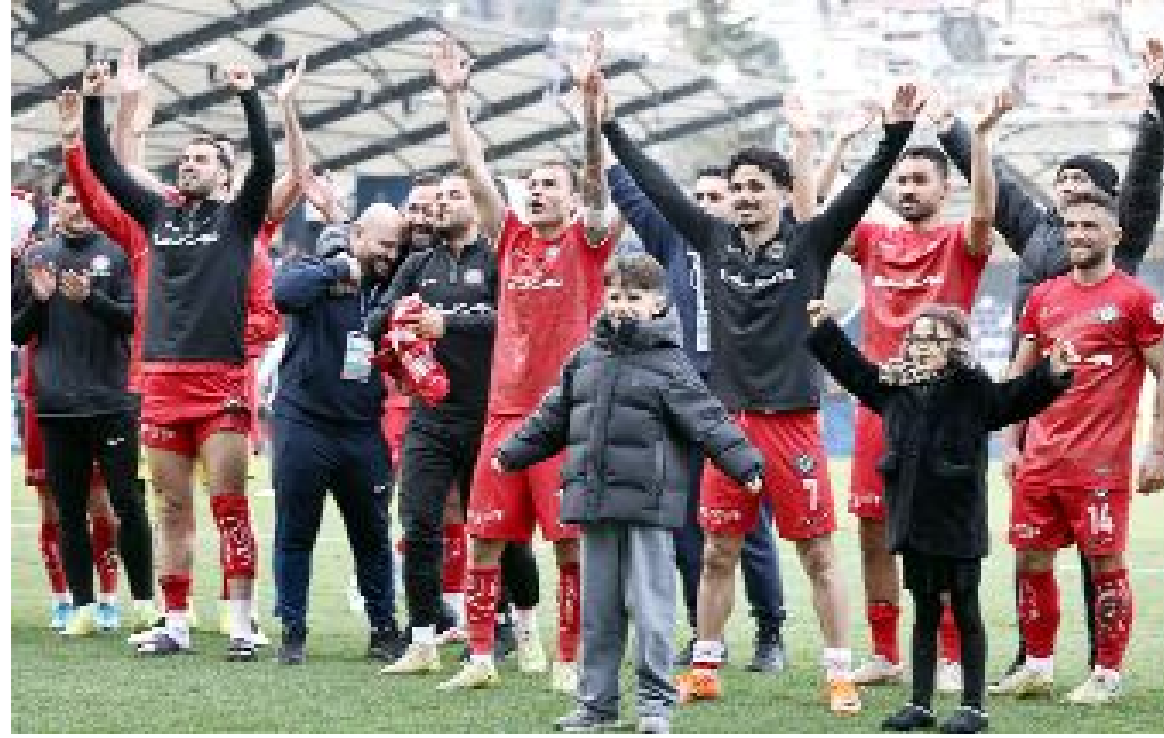
Arca Çorum FK, ikinci yarının geride kalan 13 haftalık periyodunda 30 puan topladı.

Kırmızı-siyahlı takım 4 günlük iznin ardından bugün Çorum'da toplanıp 3 Nisan'da oynanacak kritik Bandırmaspor maçının hazırlıklarına başlayacaktır. Ancak teknik direktör Uğur Uçar'ın izni 1 gün uzattığı ve takımın Cumartesi günü yapacağı antrenmanla Bandırmaspor maçının hazırlıklarına start vereceği belirtildi. (Hüseyin AŞKIN)