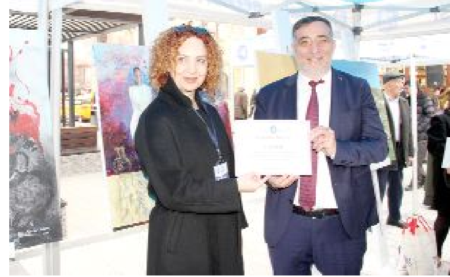
34 sanatçının 34 eserinin yer aldığı sergi Velipaşa Hanı önünde açıldı.