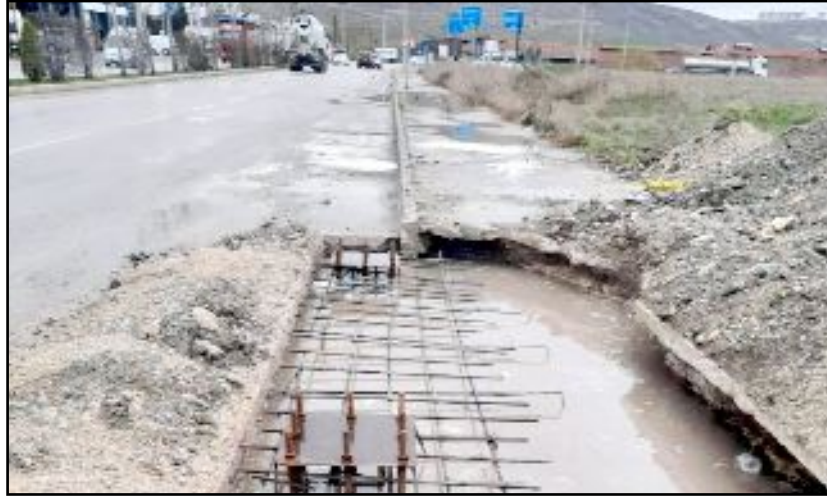
Çorum Sanayi Sitesi'nin belirlenen yerlerine güvenlik için nizamiyeler kurulacak. İlk nizamiyenin temeli atıldı.