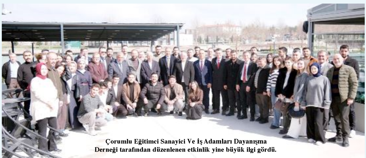
Çorumlu Eğitimci Sanayici Ve İş Adamları Dayanışma Derneği tarafından düzenlenen etkinlik yine büyük ilgi gördü.