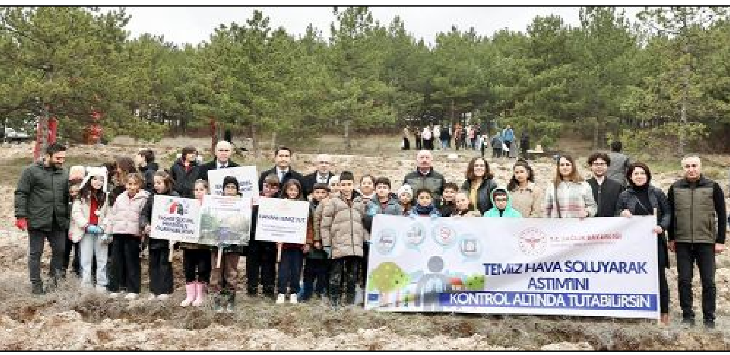
Orman Haftası etkinlikleri kapsamında Sanayi Sitesi'nde fidan dikme etkinliği düzenlendi.

"Türkiye'nin Gücü Orman" etkinliğinde 2 bin fidan toprakla buluşturuldu