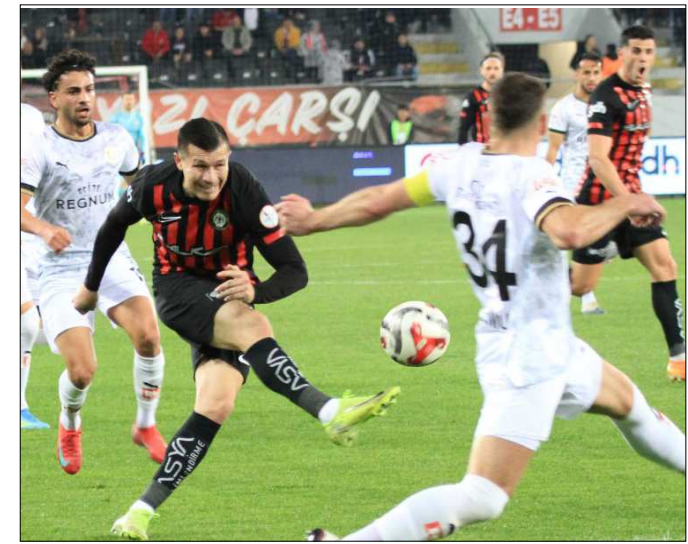
Çorum FK 486.maçında Bodrum FK ile karşılaştı.

ramı ise henüz açıklanmadı. Normal sezonun tamamlanmasından sonra Süper Lig'e yükselcek son takımın belli olacağı play-off maçları ise 7-22 Mayıs tarihlerinde oynanacak. (Hüseyin AŞKIN)