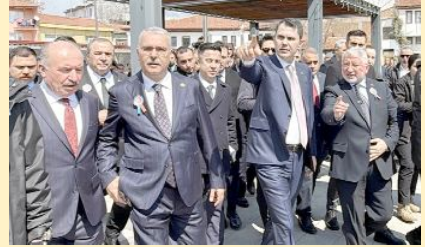
Bakan Murat Kurum, Çorum Belediyesi'nin "Tarihi Çorum Meydanı", "Dar Arasta" ve "Saat Kulesi" çevresinde yürüttüğü çalışmalarını inceledi.

Çorum'da "Yüzyılın Konut Projesi" kapsamında inşa edilecek 2 bin 867 konutun hak sahipleri, Çevre ve Şehircilik Bakanı Murat Kurum'un katıldığı kura çekim töreniyle belirlendi. •3'de