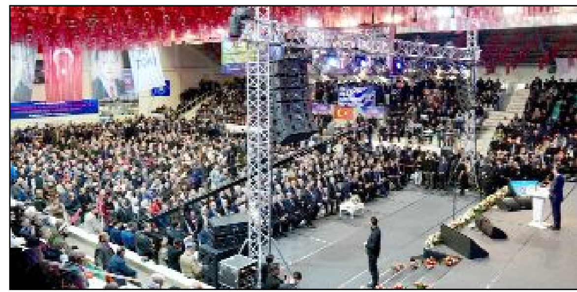
Çorum'da "Yüzyılın Konut Projesi" kapsamında inşa edilecek 2 bin 867 konutun hak sahipleri, Çevre ve Şehircilik Bakanı Murat Kurum'un katıldığı kura çekim töreniyle belirlendi.