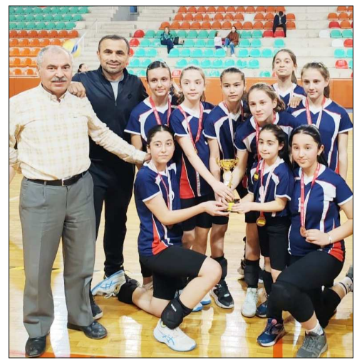
Üçüncülük kupası Dinamikspor'un

Final maçın ardından düzenlenen törenle dereceye giren takımlara kupa ve madalyaları takdim edildi. (Rifat KARA)