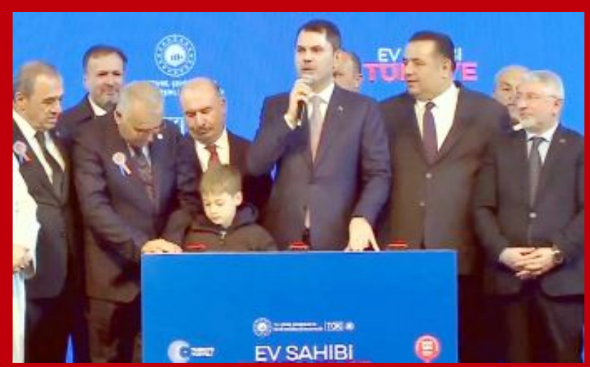
Bakan Kurum ve beraberindeki protokol üyeleri, başvuru yapan vatandaşlarla birlikte noter huzurunda çekiliş butonuna bastı.