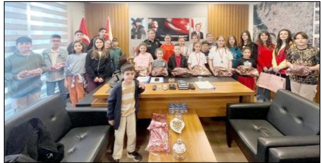
Osmançık'ta emniyet görevlilerinin çocuklarına yönelik Floor Curling turnuvası düzenlendi.

Unutmayalım: Küresel efendiler her zaman vardır. Ama yerel itaat, tarihsel bir yazgı değil, siyasi bir tercihtir.