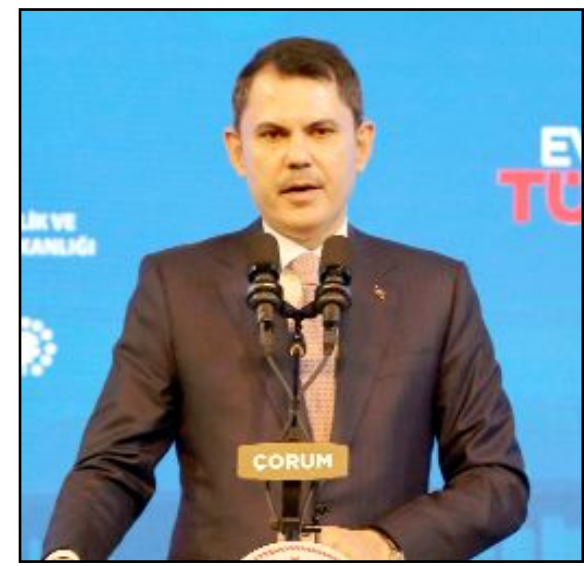
Bakan Murat Kurum

Çorum'da Atatürk Spor Salonu'nda düzenlenen "Ev Sahibi Türkiye Kura Çekimi Töreni"ne katılan Çevre, Şehircilik ve İklim Değişikliği Bakanı Murat Kurum, "2 yıl içinde anahtarları vermeyi hedefliyoruz." dedi.