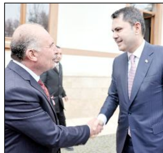
Bakan Murat Kurum'a burada çiçek verildi.