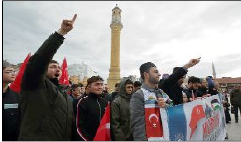
Çorum Filistin Platformu üyeleri Saat Kulesi önünde biraraya gelerek basın açıklaması yaptı.

Düzenlenen programda İsrail'in Filistinlilere yönelik uygulamaları sert