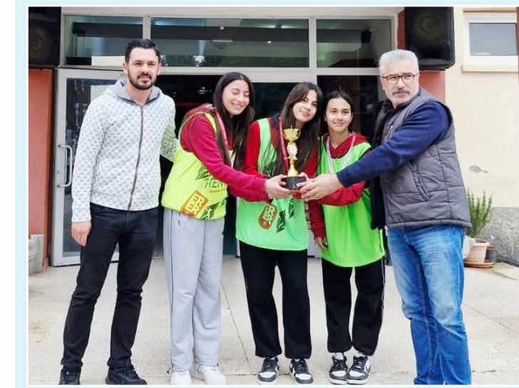
Dereceye giren okullar kupa ile ödüllendirildi.