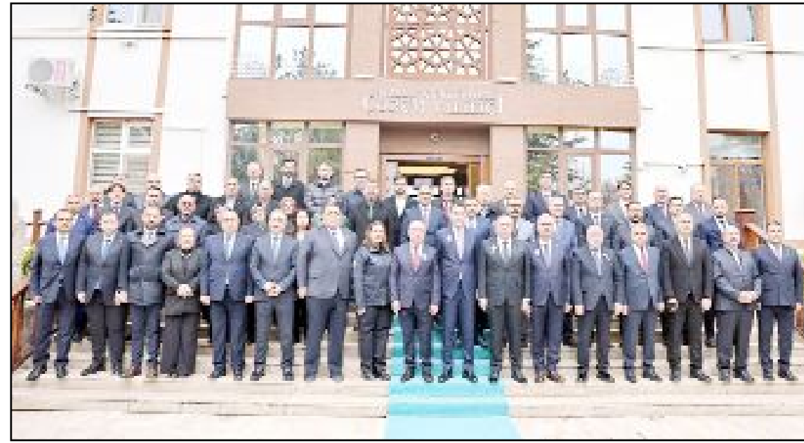
Çevre Şehircilik ve İklim Değişikliği Bakanı Murat Kurum, Valilik önünde protokol üyelerince karşılandı.