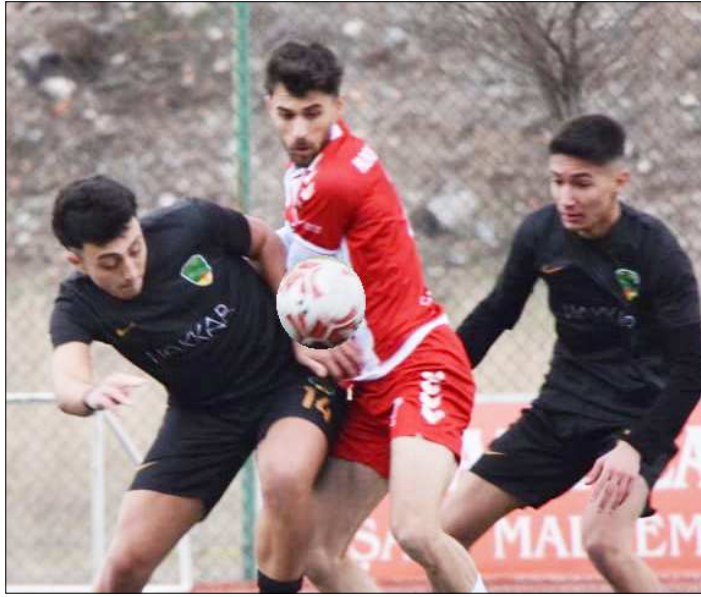
1.Küme maçından bir enstantane...

90.dakikada yarıda kalan İskilipspor-Alaca Belediyespor 11.hafta maçının sonucunu ise ilerleyen günlerde TFF Amatör Futbol Disiplin Kurulu tayin edecek. (Rifat KARA)