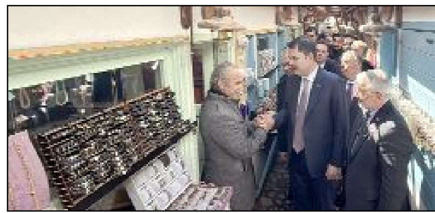
Bakan Kurum, Belediye'nin çalışmalarını, "muazzam" sözüyle değerlendirdi.

rum ise yürütülen çalışmalardan duyduğu memnuniyeti dile getirdi. Tarihi dokunun korunarak ayağa kaldırılmasına yönelik projeleri beğendiğini ifade eden Kurum, yapılan çalışmaların "muazzam" sözleriyle değerlendirdi. (Haber Merkezi)