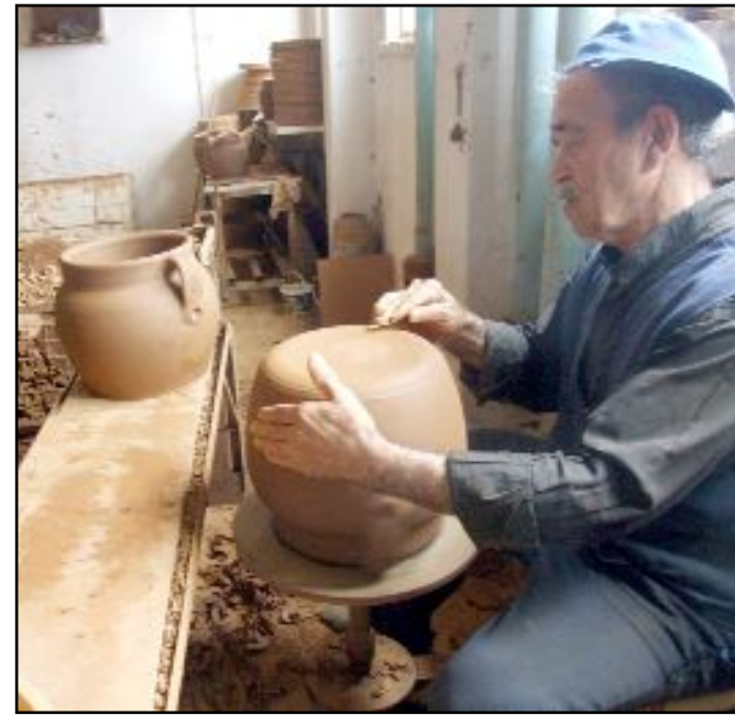
2025 yılı kapsamında yapılan incelemeler sonucunda belirlenen 15 yeni unsur, Kültür ve Turizm Bakanlığı Yaşayan Miras ve Kültürel Etkinlikler Genel Müdürlüğü tarafından onaylanarak ulusal envantere kaydedildi.

Bektaş, yapılan tescil çalışmalarının yalnızca bir kayıt süreci olmadığını, aynı zamanda kültürel değerlerin korunması ve gelecek nesillere aktarılması adına önemli bir yol haritası sunduğunu vurguladı. (Haber Merkezi)