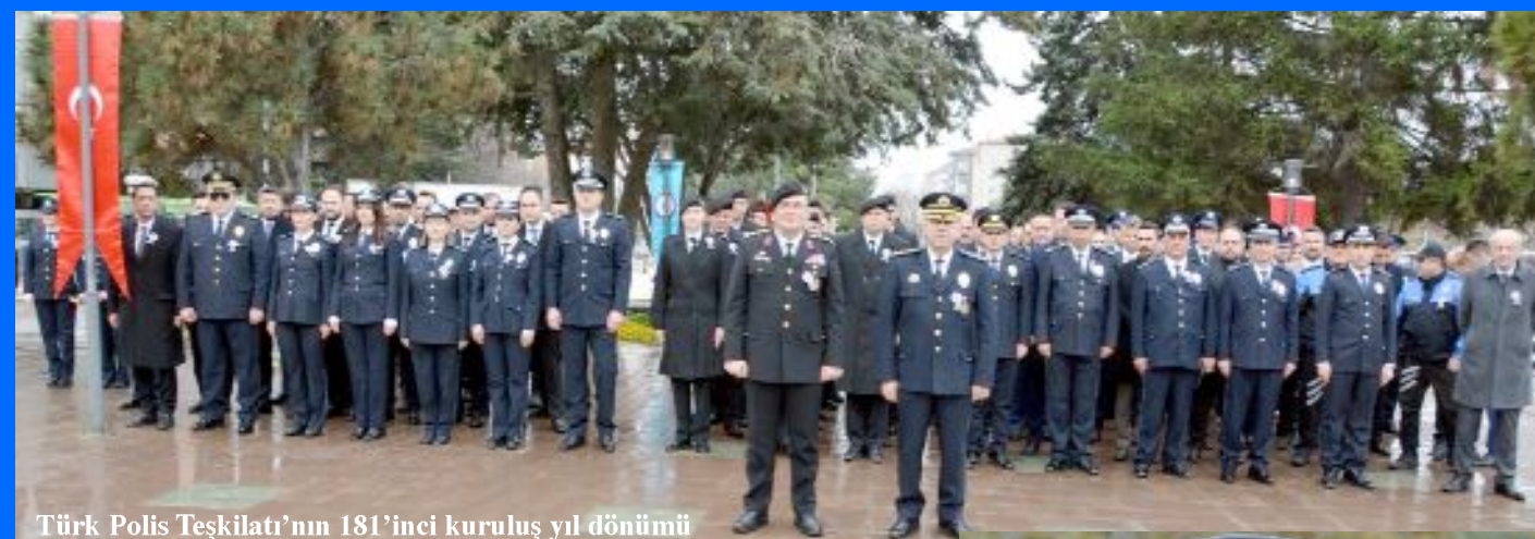
Türk Polis Teşkilatı'nın 181'inci kuruluş yıl dönümü nedeniyle Atatürk Anıtı'nda tören düzenlendi.