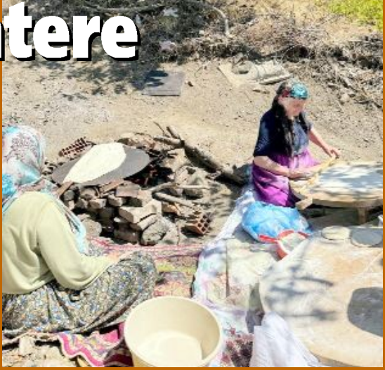
Kültür ve Turizm Müdürlüğü koordinasyonunda gerçekleştirilen saha çalışmaları kapsamında Çorum'dan 15 yeni değer, Türkiye'nin "Somut Olmayan Kültürel Miras Ulusal Envanteri"ne eklendi.

● Çorum'un köklü kültürel mirasına 15 yeni değer daha eklendi. Aralarında yufka ekmeğinin de bulunduğu unsurlar ulusal envantere girerken, kentin kayıtlı miras sayısı 32'ye yükseldi. •4'de