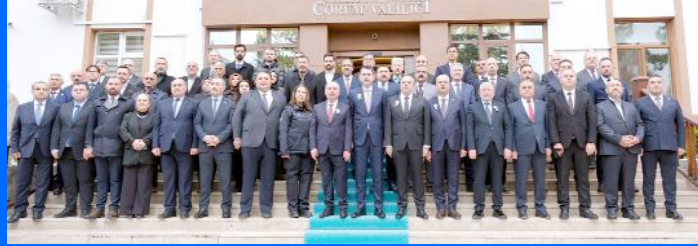
"Ev Sahibi Türkiye - 500 Bin Sosyal Konut Projesi" kura çekimi için ilimize gelen Çevre, Şehircilik ve İklim Değişikliği Bakanı Murat Kurum, Vali Ali Çalgan ve protokol üyeleri tarafından Valilik önünde karşılandı.

● "Yüzyılın Konut Projesi" kapsamında Atatürk Spor Salonu'nda düzenlenen "Ev Sahibi Türkiye Kura Çekim Töreni"nde konuşan Çevre, Şehircilik ve İklim Değişikliği Bakanı Murat Kurum, "Bakanlığımızın Çorum'a yaptığı yatırım miktarı 61 milyar liraya ulaşmış durumda" dedi. •3'de