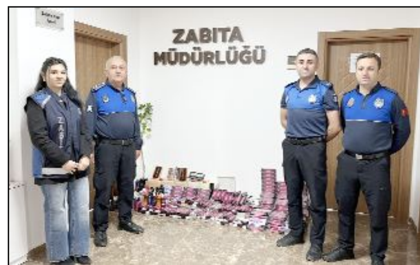
Denetimlerde son kullanma tarihi geçtiği belirlenen 563 saç boyası, makyaj malzemesi ve kişisel bakım ürününe zabıta ekiplerince el konuldu.

Son kullanma tarihi geçmiş ürün bulundukları belirlenen işletmeler hakkında ceza işlem uygulanması için Osmancık Belediyesi Encümeni'ne gönderilmek üzere tutanak tutuldu. (AA)