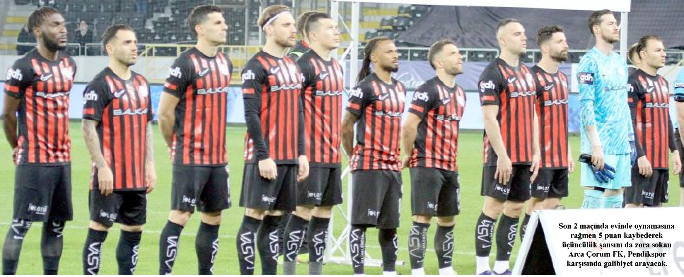
Son 2 maçında evinde oynamasına rağmen 5 puan kaybederek üçüncülük şansını da zora sokan Arca Çorum FK, Pendikspor karşısında galibiyet arayacak.