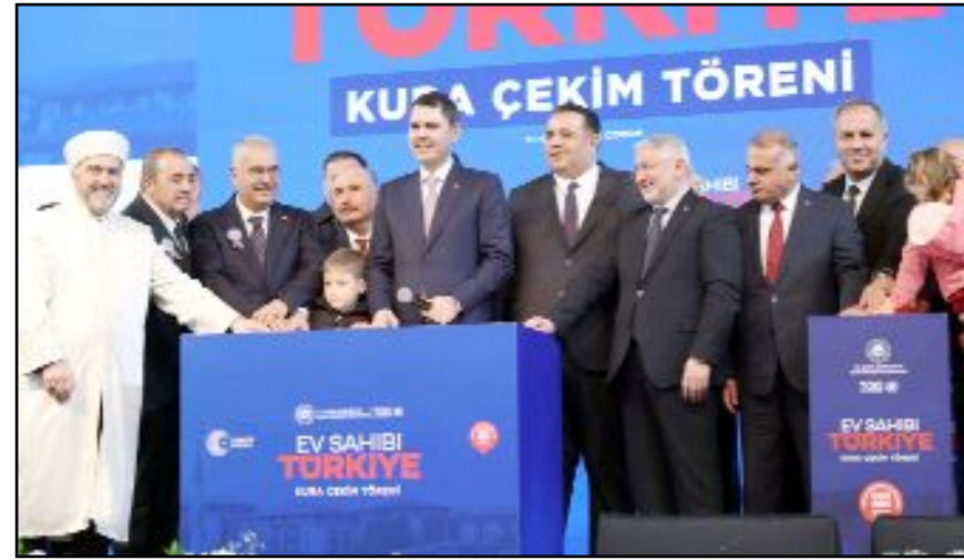
Bakan Kurum ve beraberindeki protokol üyeleri, başvuru yapan vatandaşlarla birlikte noter huzurunda çekiliş butonuna bastı.

Çorum'da hastanelerden konutlara, ticaret merkezlerinden sosyal yaşam alanlarına kadar birçok projeyi hayata geçirdiklerini belirten Kurum, Çorum Meydanı ve çevresinde yapılan düzenlemelerle tarihi dokunun yeniden canlandırıldığını söyledi. Tarihi alanların restore edilerek şehrin estetik değerine katkı sağlandığını ifade etti.