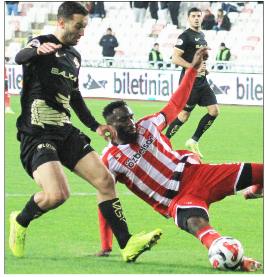
Arca Çorum FK 19 Nisan'da, sezonun il yarısında 1-1 berabere kaldığı Sivasspor'u konuk edecek.