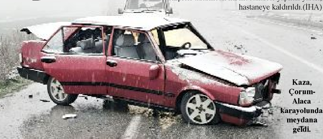
Kaza, Çorum-Alaca karayolunda meydana geldi.

Çorum'un Alaca ilçesinde tabelaya çarpan otomobilin sürücüsü yaralandı. Kaza, Çorum-Alaca karayolunda meydana geldi. Edinilen bilgilere göre, Çorum istikametinde seyir halinde olan S.P. idaresindeki 58 ADA 282 plakalı otomobil, sürücüsünün kar yağışı ve buzlanma sebebiyle direksiyon hakimiyetini kaybetmesi neticesinde yön tabelasına çarptı. Kazada sürücü yaralandı. Kazayı gören vatandaşların 112 Acil Çağrı Merkezine ihbarı üzerine olay yerine sağlık, polis ve jandarma ekipleri sevk edildi. Olay yerine gelen sağlık ekipleri tarafından ilk müdahalesi yapılan yaralı, hastaneye kaldırıldı. (İHA)