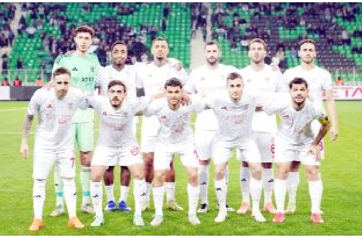
Play-off hattında bulunan Pendikspor, 34 maçta topladığı 57 puanın 32'sini sahasında aldı.

Arca Çorum FK, Uğur Uçar nezaretinde çıktığı 9 maçta 7 galibiyet, 1 beraberlik, 1 yenilgi alırken 2,44 puan ortalaması tutturdu. (Hüseyin AŞKIN)