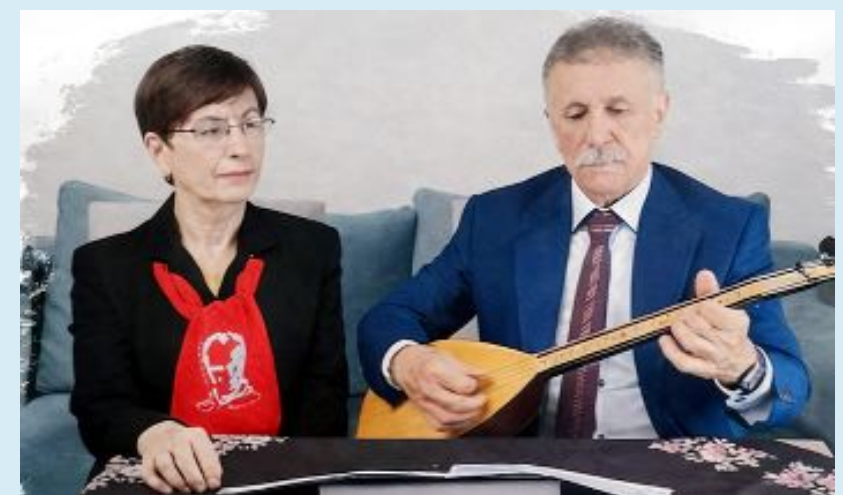
Yeter Ayık Döner ve Sadi Döner...