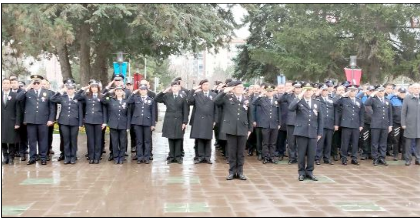
Türk Polis Teşkilatı'nın 181'inci kuruluş yıl dönümü nedeniyle Atatürk Anıtı'nda tören düzenlendi.