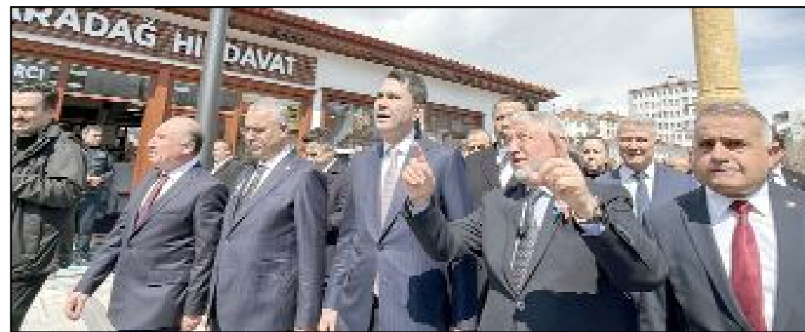
Bakan Murat Kurum, Çorum Belediyesi'nin Tarihi Çorum Meydanı, Dar Arasta ve Saat Kulesi çevresinde yürüttüğü çalışmaları inceledi.

Çorum Belediye Başkanı Halil İbrahim Aşgın ise 2020 yılında Bakan Kurum ile birlikte şehrin farklı noktalarını gezerek hayallerini paylaşmalarını belirterek, "Buraları güzelleştireceğiz, meydanlarımızı açacağız, tarihimize sahip çıkacağız" demiştik. Ve şahit olduğumuz zaman "ama" demedi, hiçbir zaman "fakat" demedi. Samimiyetle, içtenlikle tüm hayallerimize ortak oldu. Kendisine teşekkür ediyorum." diye konuştu. (Haber Merkezi)