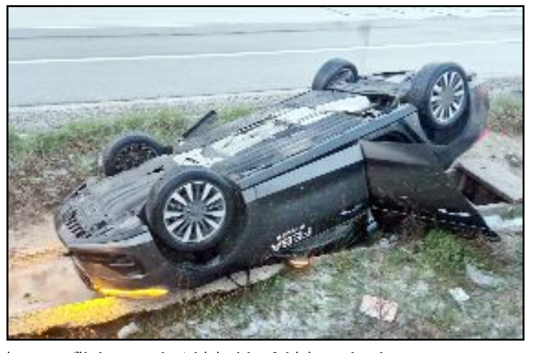
Alaca'da aynı yolda art arda meydana gelen iki ayrı trafik kazasında 1 kişi öldü, 3 kişi yaralandı.