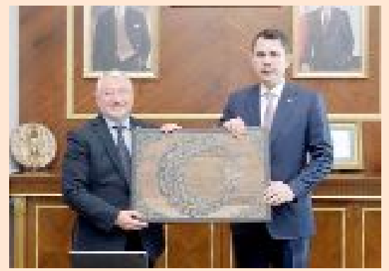
Çevre, Şehircilik ve İklim Değişikliği Bakanı Murat Kurum, Çorum programı çerçevesinde Belediye'yi ziyaret etti.

● Çorum Belediyesi'ni ziyaret eden Bakan Murat Kurum, kentsel dönüşümde sosyal projelere kadar şehrin ihtiyaç duyduğu tüm çalışmalara destek vermeye devam edeceklerini açıkladı. •3'de