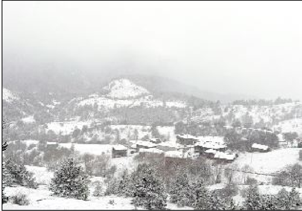
Kargı'nın Hacı Veli, Saraçlar ve Gümüşoluğu köylerinde kar yağışı nedeniyle yollar kapandı.

İlçeye bağlı Hacı Veli, Saraçlar ve Gümüşoluğu köylerinde kar yağışı nedeniyle yollar kapandı. Kapalı köy yollarının yeniden ulaşım açılması için İl Özel İdaresi ekipleri çalışmalarını yoğun bir tempo içerisinde sürdürdü. (İHA-AA)