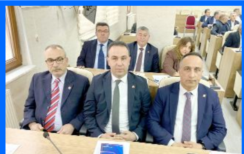
CHP İl Genel Meclisi Grubu, Encümen seçimlerinin usulsüz bir şekilde gerçekleştirildiği gerekçesiyle Çorum Valiliği'ne resmi itirazda bulundu.