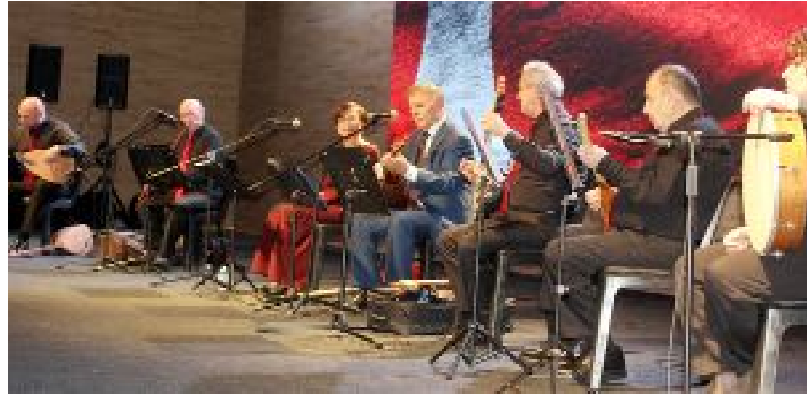
Coşkulu ve duygusal bir türkü gecesi...