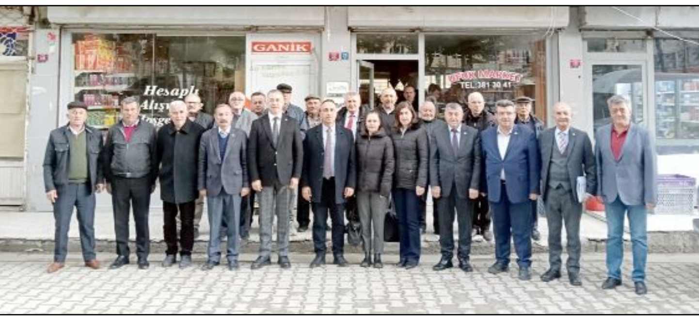
Cumhuriyet Halk Partisi, Bayat ve İskilip'te ilçe danışma kurulu toplantısı düzenledi.