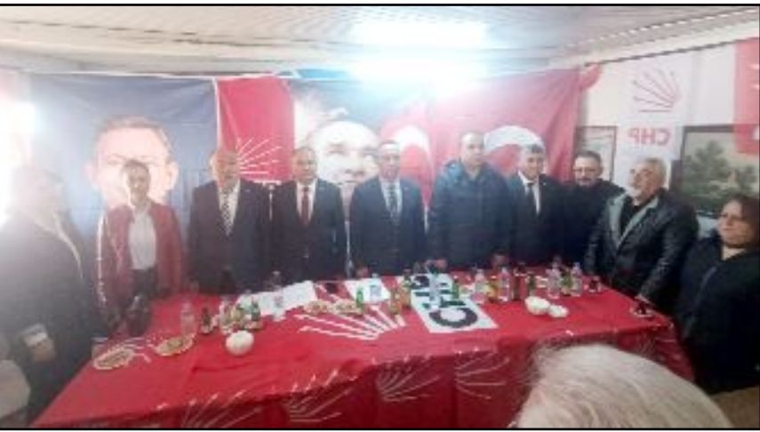
CHP'nin ilçe danışma toplantıları Alaca ve Boğazkale'de de yapıldı.