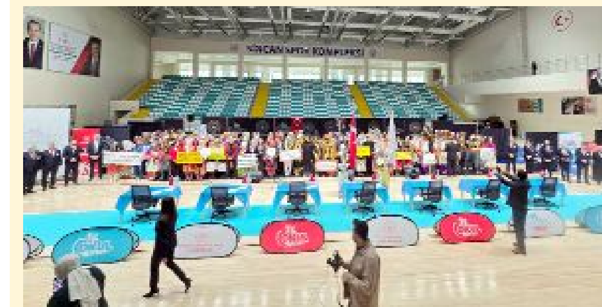
Ankara'da düzenlenen halk oyunları grup birinciliğine katılan ekiplerden genel bir görünüm... Ve Bahçelievler Mesleki ve Teknik Anadolu Lisesi Halkoyunları Ekibi...

● Sosyal sorumluluk ve farkındalık açısından önemli bir buluşmaya sahne olan etkinlik, "+1 farkla" birlikte üretmenin ve hayatı paylaşmanın en güzel örneklerinden biri oldu. (Haber Merkezi)