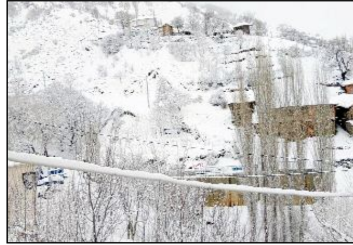
Kent genelinde etkili olan sağanak yağış, yüksek kesimlerde yerini kara bıraktı.