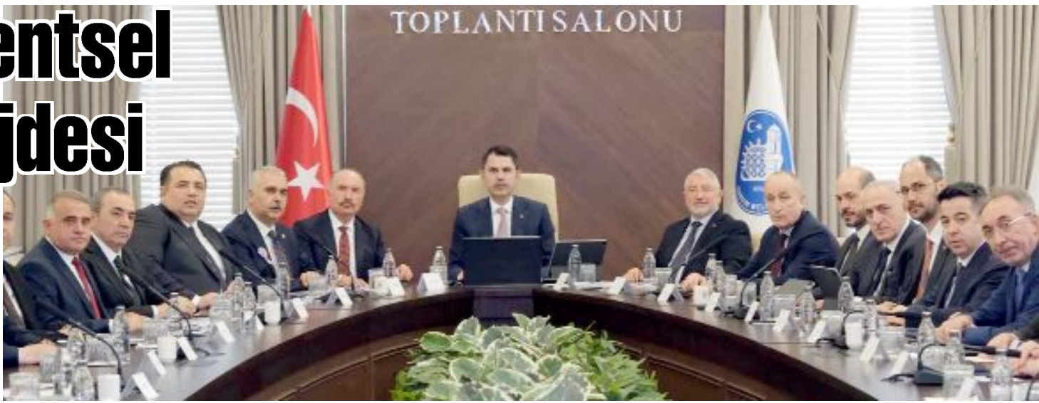
Bakan Murat Kurum başkanlığında düzenlenen geniş kapsamlı koordinasyon toplantısında Çorum genelinde devam eden projeler masaya yatırılırken, yeni dönem yatırımları ve öncelikli ihtiyaçlar detaylı şekilde ele alındı.

● Çevre, Şehircilik ve İklim Değişikliği Bakanı Murat Kurum'un Çorum ziyaretinde kentsel dönüşüm başta olmak üzere birçok projeye destek verildi; Kale Mahallesi'nde uzlaşma süreci 11 Mayıs'ta başlıyor, Çöplü Arastası'na 100 milyon TL kaynak sağlanırken, çimento arazisi ve çevre yatırımları için de somut adımlar atılıyor. •3'de