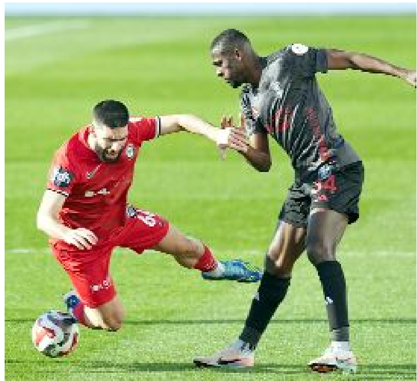
Milli ara dönüşü büyük bir düşüş yaşayan Arca Çorum FK, Pendikspor'la da 1-1 berabere kaldı ve 3 maçta tam 7 puan kaybetti.

ilk iki maçını sahasında oynayan Çorum ekibi, Bandırmaspor'a 1-0 yenildikten sonra Bodrum FK ile 1-1 berabere kaldı. Kırmızı-siyahlı takım Cumartesi günü ise İstanbul'da Pendikspor'la 1-1 berabere kalınca galibiyet hasreti 3 maça çıktı. (Hüseyin AŞKIN)