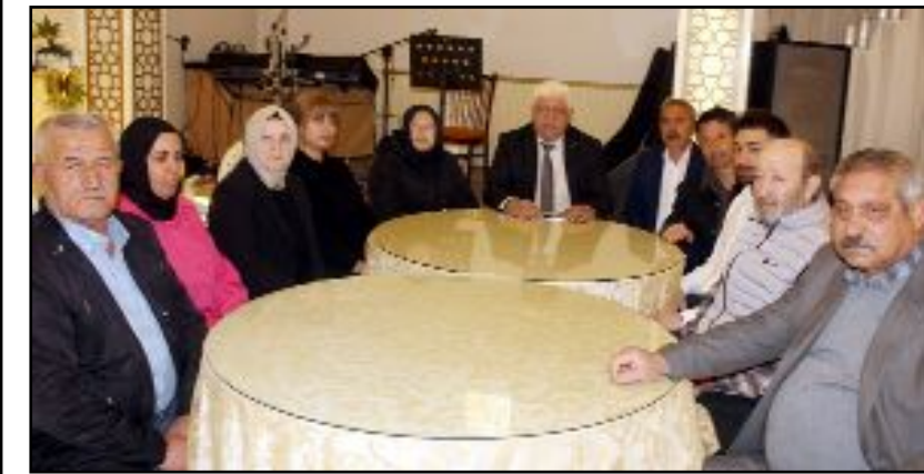
Huzur Partisi Çorum İl Teşkilatı tarafından Afra Düğün Salonu'nda basın toplantısı düzenlendi.