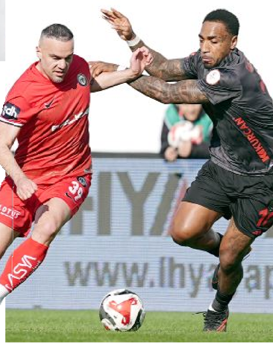
Arca Çorum FK, Pendikspor'la 1-1 berabere kalarak 2 puan da İstanbul'da bıraktı.

Öte yandan, Pendikspor ise Reşat Onur Coşkunes'in yönettiği üçüncü maçta ilk kez puan kaybetti. İstanbul temsilcisi, Coşkunes'in düdüğü çaldığı maçlarda 2021-2022 Sezonunda Pazarspor'u (D) 1-0, 2022-2023 Sezonunda da Gençlerbirliği'ni (D) 2-1 yenmişti. (Hüseyin AŞKIN)