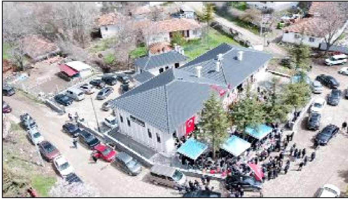
Çorum'un Alaca ilçesinde Karamahmut Köyü Ali Gök Kültür ve Cemevi hizmete açıldı.