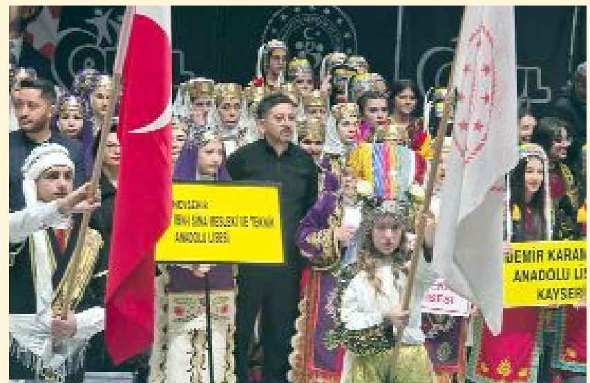
Gencecik folklorcular renkli görüntüler oluşturdu...