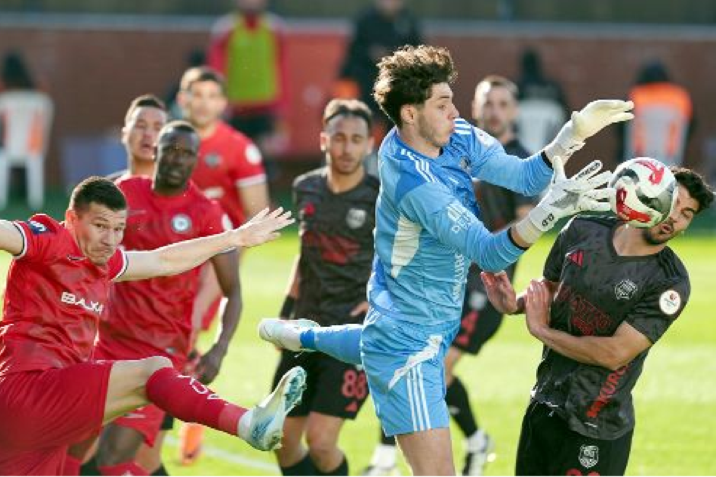
Arca Çorum FK, galibiyet için gittiği İstanbul'da, Pendikspor karşısında beraberliği uzatma dakikalarında bulunduğu golle kurtarabildi.