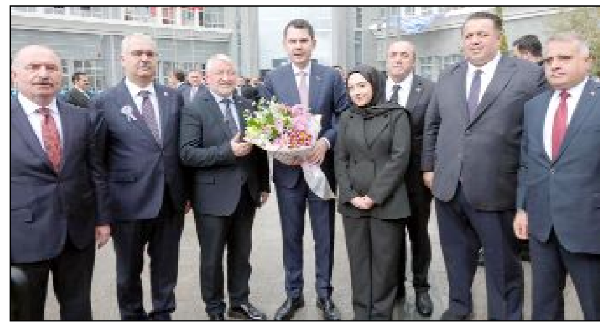
Çevre, Şehircilik ve İklim Değişikliği Bakanı Murat Kurum, Çorum programı çerçevesinde Belediye'yi ziyaret etti.