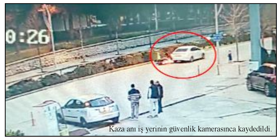
Kaza anı iş yerinin güvenlik kamerasınca kaydedildi.

Çorum'da otomobil ile motosikletin çarpıştığı kazada 1 kişi yaralandı.