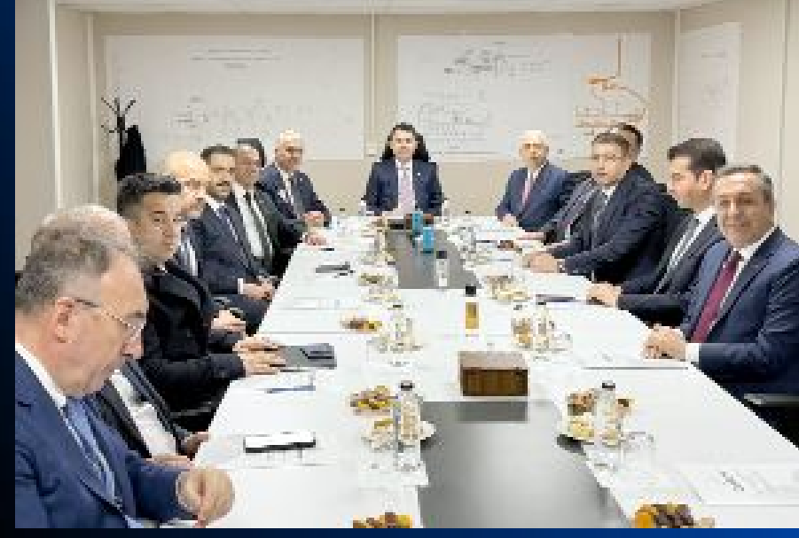
Bakan Murat Kurum, Ahlatcı Holding'in Sungurlu'daki Barut Fabrikası'nda...