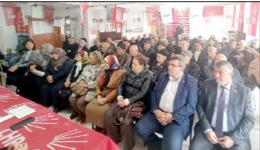
Toplantılarda parti çalışmalarını, yaşanan sorunlar, talepler, çözüm önerileri ele alınarak ilçelerin sorunları ve gündem değerlendirildi.