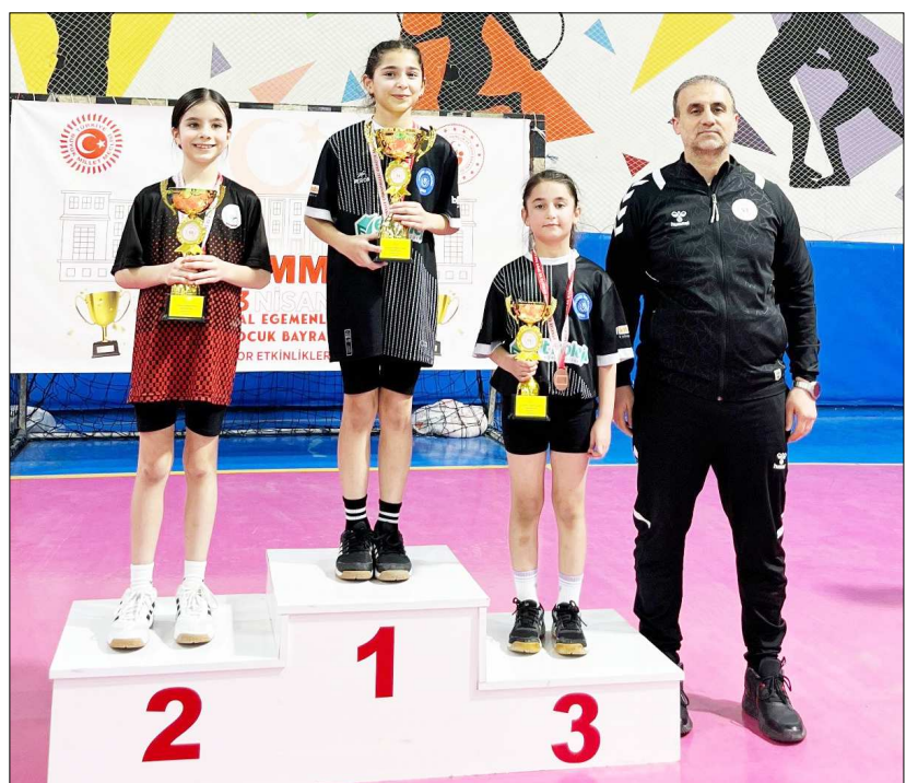
Dereceye giren sporcular madalya ile ödüllendirildi.

Gençlik ve Spor İl Müdürlüğü Spor Şube Müdürü Gürsel Gürbüz'ün katıldığı törenle dereceye giren sporcular madalya ile ödüllendirildi. (Rıfat KARA)