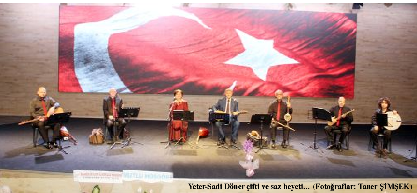
Yeter-Sadi Döner çifti ve saz heyeti...