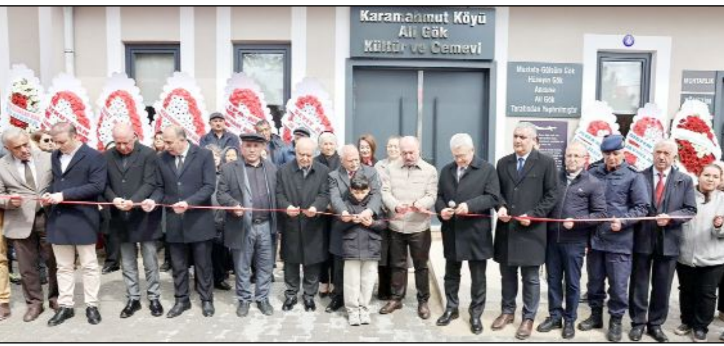
300 metrekare ibadet alanının yanı sıra 100 metrekarelik kurban kesim ve pişirme alanı, mutfak, kütüphane ve muhtarlık odasından oluşan cemevi için açılış töreni düzenlendi.