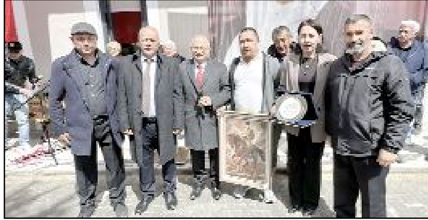
Açılış töreninde "hak aşkına semah" dönülürken, cemevini yapımına katkı sunanlara da plaket ve Atatürk tablosu armağan edildi.

Daha sonra Çalgan, Dinçer ve Saykan'ın yanı sıra Alaca Belediye Başkanı Şerif Arslan, eski adalet bakanlarından Seyfi Oktay ve Ankara Sanayi Odası Yönetim Kurulu Başkanı Seyit Ardiç, kurdele keserek cemevini hizmete açtı. (AA)