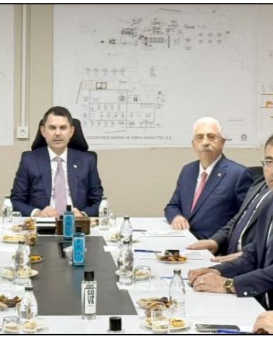
Bakan Murat Kurum ve Ahmet Ahlatcı...