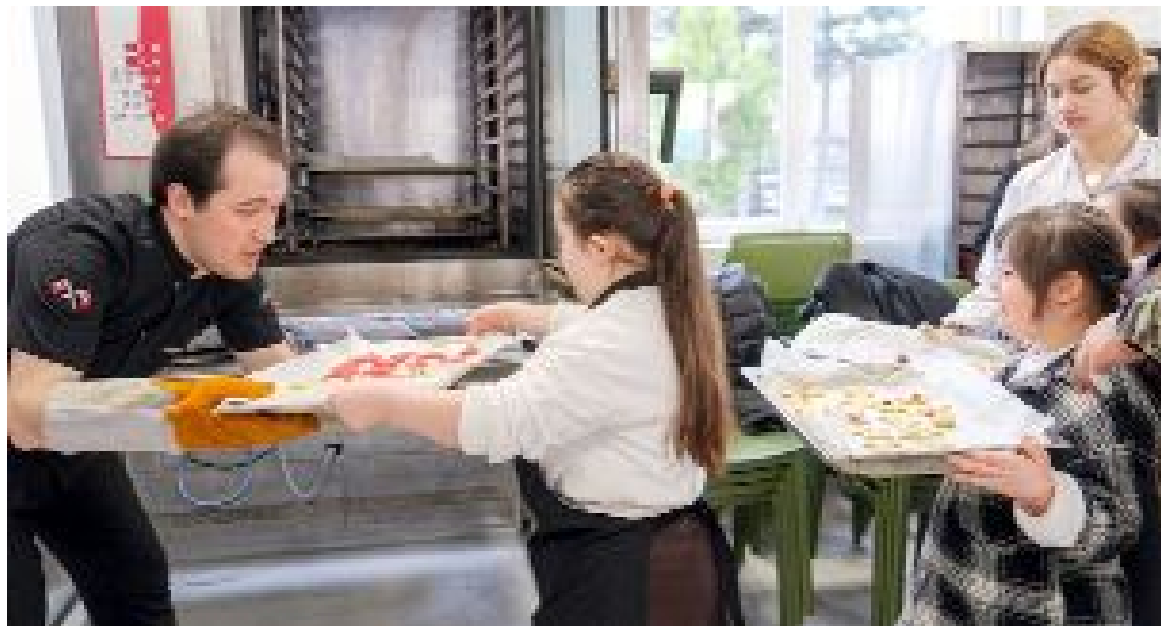
İletişim Ofisi ile Engelsiz Üniversite Koordinatörlüğü iş birliğince gerçekleştirilen "+1 Farkla Kurabiye Atölyesi" etkinliğinde özel öğrenciler eğlenceli vakit geçirdi.(AA)

atölyede; birlikte üretmenin ve paylaşmanın mutluluğu yaşandı.