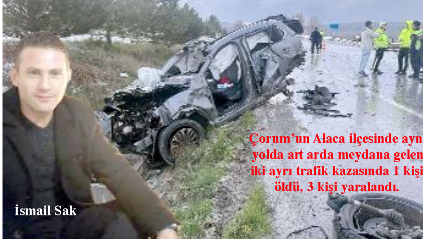
Çorum'un Alaca ilçesinde aynı yolda art arda meydana gelen iki ayrı trafik kazasında 1 kişi öldü, 3 kişi yaralandı.