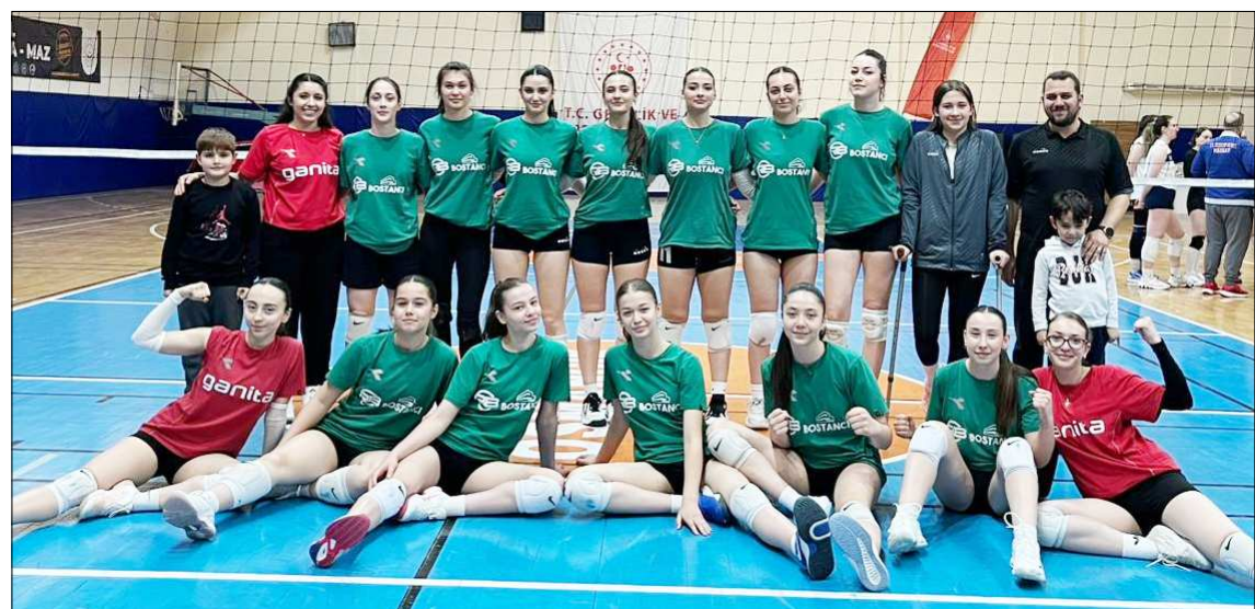
Osmancık'ın genç sultanları maçın ardından galibiyeti böyle kutladı.