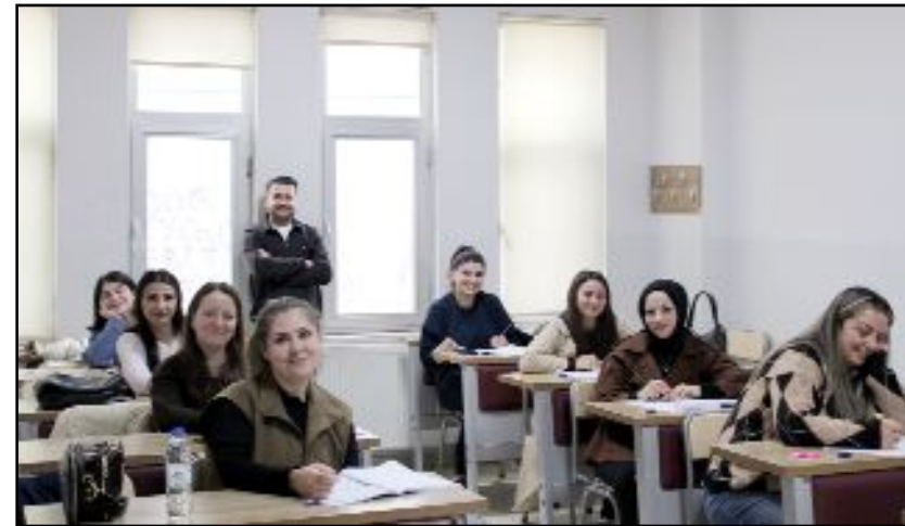
Çorum Eczacı Odası'nın eczacılardan gelen yoğun talepler doğrultusunda hayata geçirdiği Eczane Personeli Yetiştirme Programı - Farmahane Projesi'nde önemli bir aşama daha tamamlandı.