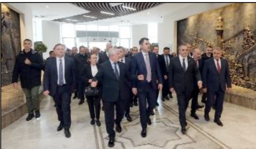
Bakan Murat Kurum, kentsel dönüşümden sosyal projelere kadar şehrin ihtiyaç duyduğu tüm çalışmalara destek vermeye devam edeceklerini açıkladı.