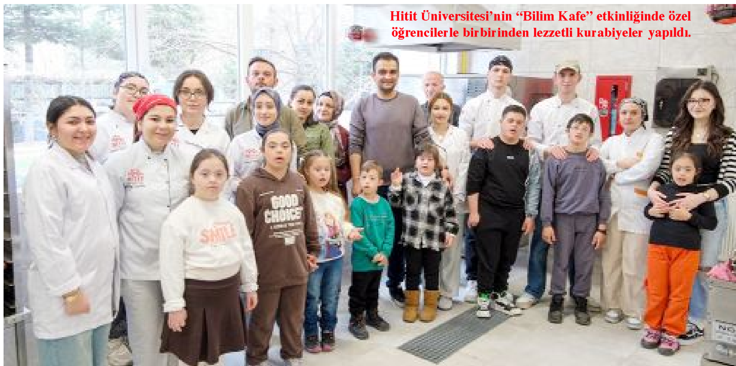
Hitit Üniversitesi'nin "Bilim Kafe" etkinliğinde özel öğrencilerle birbirinden lezzetli kurabiyeler yapıldı.

● Etkinlikte özel öğrenciler, Sosyal Bilimler Meslek Yüksekokulu Aşçılık Bölümü öğrencileriyle kurabiye yapımını deneyimledi. Hem eğlenceli hem de öğretici anların yaşandığı