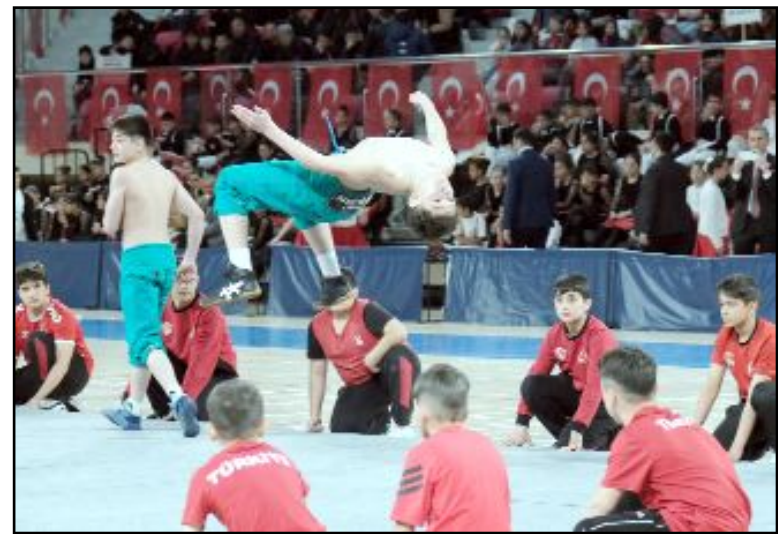
Çocukların sergilediği performans, vatandaşlar tarafından coşkuyla alkışlandı.