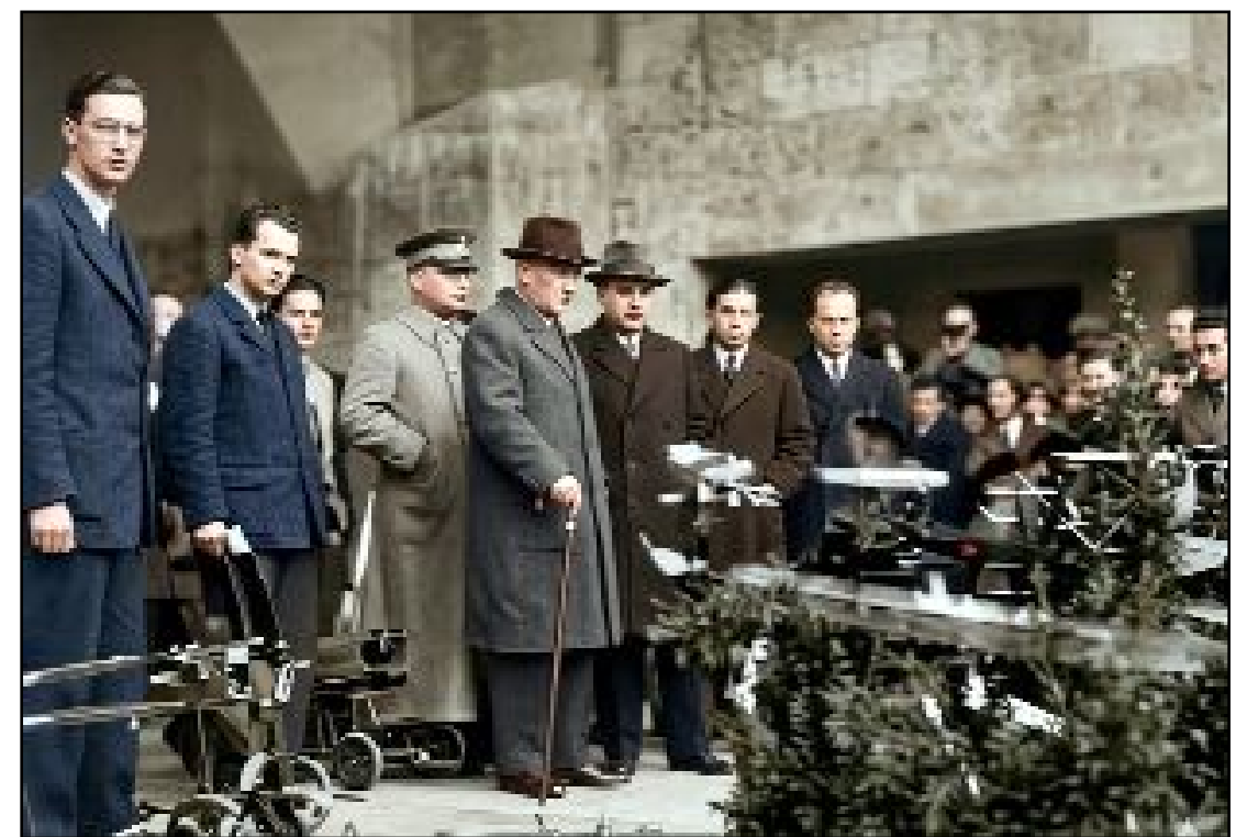
Atatürk 1. Ziraat Kongresi Sergisi'ni gezerken...