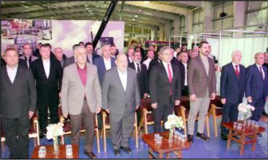
Çorum TSO Fuar Kompleksi'nde düzenlenen fuar 3 gün daha ziyaretçilerini ağırlayacak.