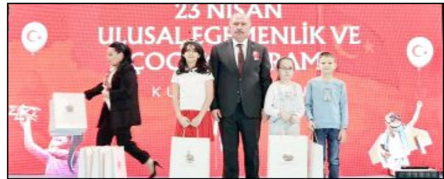
Törende yarışmalarda derecelere giren öğrencilere ödülleri verildi.

lam ve öneme değerli bir mirastır" ifadelerini kullandı. Çağlar, "Milli iradenin hayat bulduğu ve çocuklarımızın armağan edildiği bu kutlu gün, derin anlamlar taşımaktadır. Meclisimizin kuruluşunda olduğu gibi bugün de çocuklarımız, geleceğe dair hayallerimizle gerçekleştirecek en büyük umudumuzdur. Milli egemenlik ilkesi, milletimizin bağımsızlık karakterinden doğmuştur. 23 Nisan 1920 ruhu, çocuklarımız