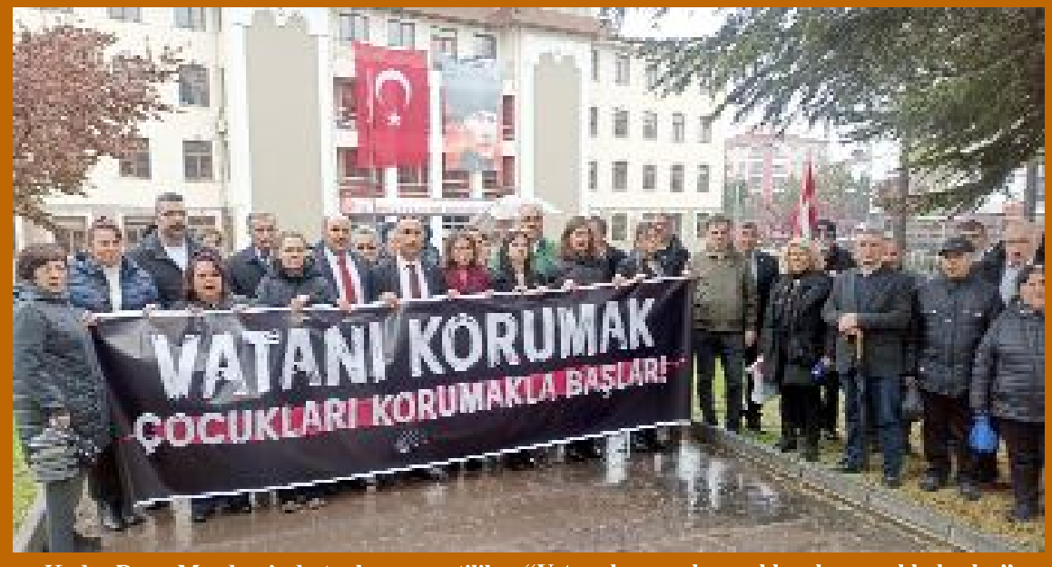
Kadeş Barış Meydanı'nda toplanan partililer, "Vatani korumak çocukları korumakla başlar" pankartı ile İl Milli Eğitim Müdürlüğü önüne sessiz yürüyüş gerçekleştirdi.

Cevap hakkına saygımız gereği, cevap ve düzeltme metnini, aynı sayfada ve aynı sütunda virgüllüne bile dokunmadan yayımlıyoruz. •5'de