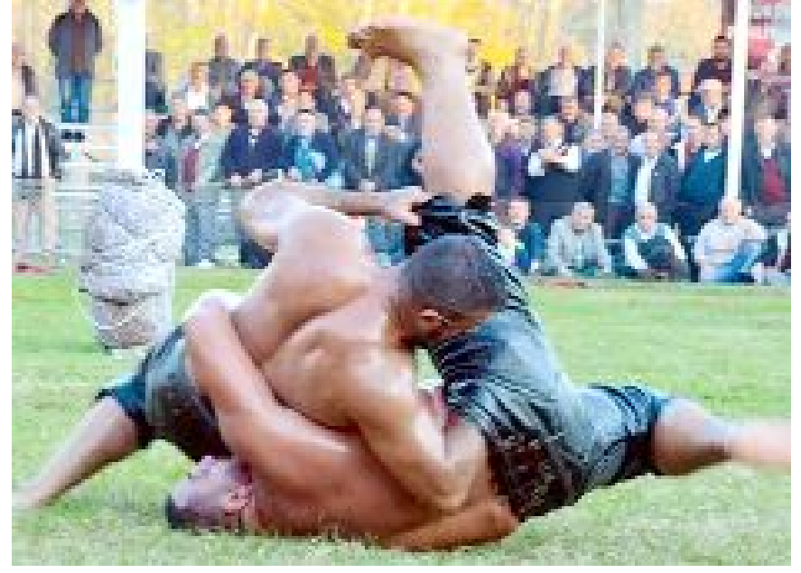
Kargı Panayır Güreşleri bu yıl da Kasım ayında yapılacak.

vam edecek ve Kasım ayında Çorum'daki Kargı Panayırını ile tamamlanacak. (Hüseyin AŞKIN)