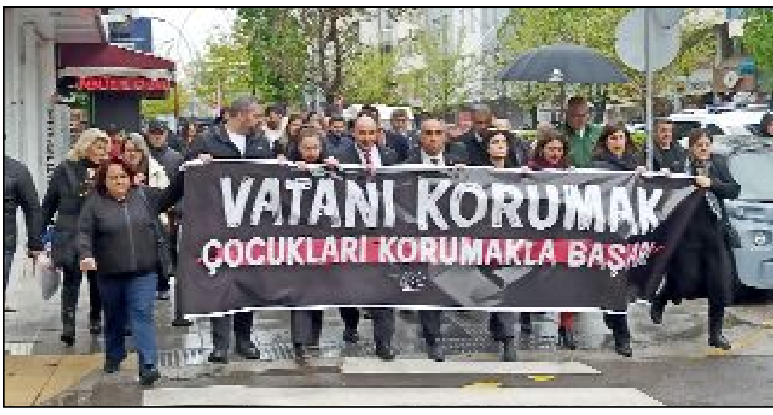
Kadeş Barış Meydanı'nda toplanan partililer, "Vatani korumak çocukları korumakla başlar" pankartı ile İl Millî Eğitim Müdürlüğü önüne sessiz yürüyüş gerçekleştirdi.