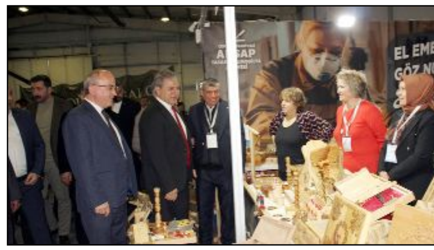
Açılışı yapan protokol üyeleri fuardaki standları tek tek gezerek verilen hizmetlerle ilgili bilgi aldı.

Evlilik planı yapan çiftler başta olmak üzere tüm vatandaşlar her gün 10.00 - 21.00 saatleri arasında ziyaret edilebilecek olan Evlilik ve Güzellik Fuarı'na davet edildi. (Volkan SINAYUÇ)