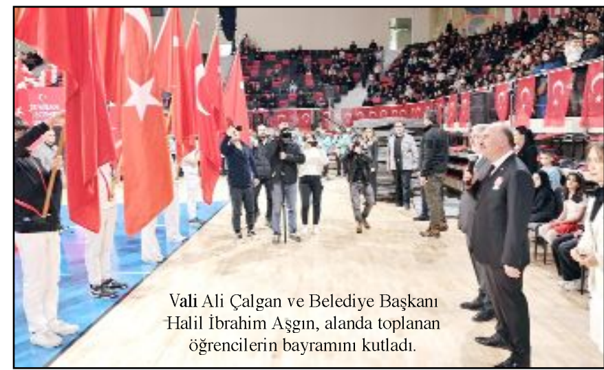
Vali Ali Çalğan ve Belediye Başkanı Halil İbrahim Aşgın, alanda toplanan öğrencilerin bayramını kutladı.

Çorum'da 23 Nisan Ulusal Egemenlik ve Çocuk Bayramı, öğretmen ve öğrenciler tarafından hazırlanan etkinliklerle coşkuyla kutlandı.