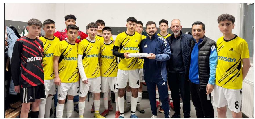
Başkan Arıcı genç futbolculara tatlı ikramında bulundu.