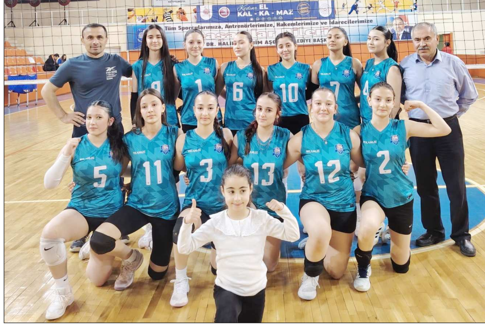
Dinamikspor'un küçük sultanları bugün kazanırsa yarı finale yükselecek.

Kulübü ile karşılaşacak olan Çorum Dinamikspor bu maçı kazanması halinde grubunu lider tamamlayarak Türkiye finallerine katılmaya hak kazanacak. (Rıfat KARA)