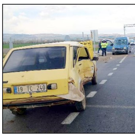
İskilip yolu Ömerbey köyü kavşağında meydana geldi.