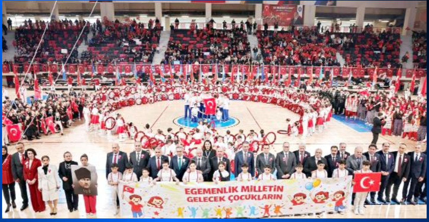
Çorum'da 23 Nisan Ulusal Egemenlik ve Çocuk Bayramı, öğretmen ve öğrenciler tarafından hazırlanan etkinliklerle coşkuyla kutlandı.

● İskilip Caddesi üzerindeki Çorum Yeni Spor Salonu'nda düzenlenen 23 Nisan Ulusal Egemenlik ve Çocuk Bayramı kutlama etkinliklerinde öğrenci ve öğretmenler tarafından hazırlanan halk oyunları ve dans gösterileri büyük beğeni topladı. Çocukların sergilediği performans, vatandaşlar tarafından coşkuyla alkışlandı. •10'da