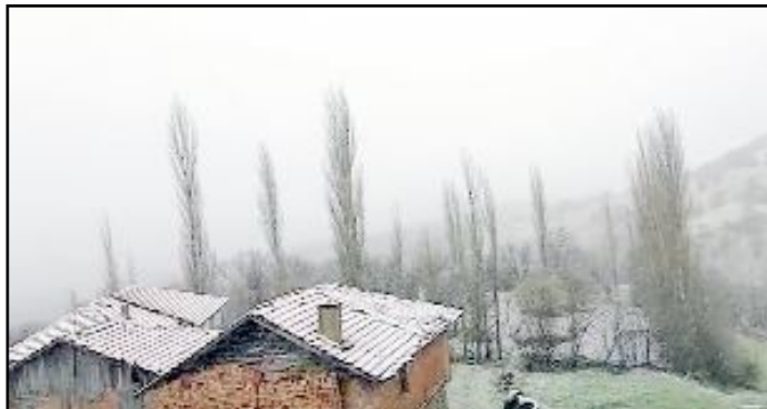
Dün sabahın erken saatlerinde başlayan kar yağışı köylerde etkili oldu.

Yaralıları, sağlık ekiplerince olay yerinde yapılan ilk müdahalenin ardından Hitit Üniversitesi Erol Olçok Eğitim ve Araştırma Hastanesi'ne kaldırıldı. Kaza yapan araçlar, ekiplerin çalışmasının ardından çekici yardımıyla olay yerinden kaldırıldı. (Haber Merkezi)