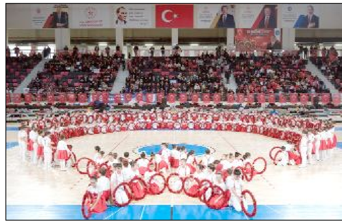
Törende, öğrenci ve öğretmenler tarafından hazırlanan halk oyunları ve dans gösterileri büyük beğeni topladı.