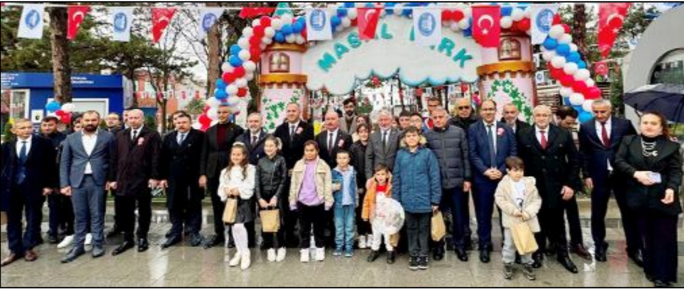
İnönü Caddesi üzerinde 3 bin 700 metrekarelik alanda kurulan Masal Park törenle hizmete açıldı.

Çorum Belediye Başkanı Aşgın bir sözünü daha sözünü yerine getirdi