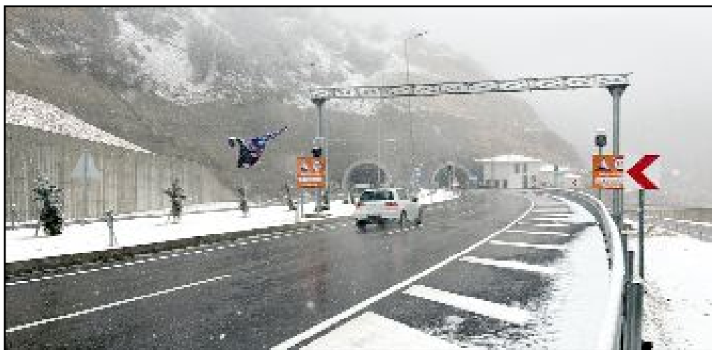
Çorum-Sungurlu ve Çorum-Osmancık kara yolunun bazı bölgelerinde yolun çevresi karla kaplandı.

Çorum'da kar ve karla karışık yağmur etkili oldu.