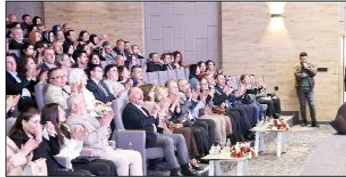
Ticaret ve Sanayi Odası Kültür Salonu'nda seçkin konuklar...