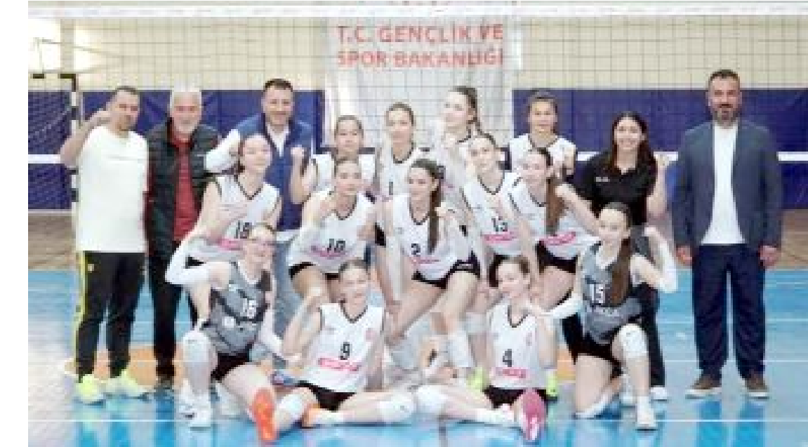
Osmancık Belediyesi Spor Takımı, önceki hafta Çorum'da oynanan grup birinciliği maçlarını birinci olarak tamamlamıştı.