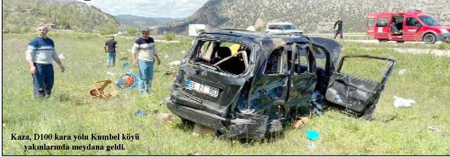
Kaza, D100 kara yolu Kumbel köyü yakınlarında meydana geldi.

Çorum'un Osmancık ilçesinde otomobilin devrilmesi sonucu 1 kişi öldü, 1 kişi yaralandı.