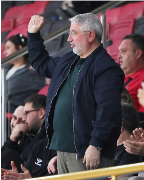
Başkan Aşgın maçı heyecanla takip etti.

Yeni Spor Salonu'nda oynanan maçı protokol tribününden takip eden Başkan Aşgın, maç sonunda parkeye inerek basketbolcuların sevincine ortak oldu. Grubu lider tamamlamaları halinde daha önce açıkladığı primi arttıran Başkan Aşgın, Play-Off'lar da başarı elde edilmesi halinde ikinci bir prim daha vereceğinin de sözünü verdi. (Rıfat KARA)