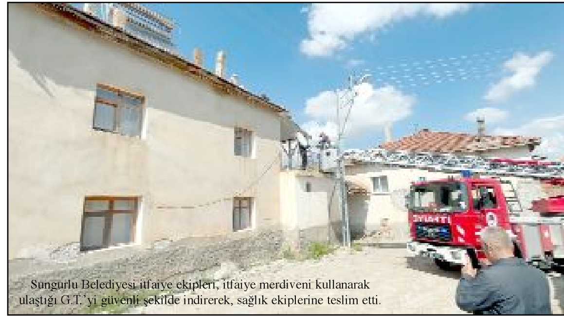
Sungurlu Belediyesi itfaiye ekipleri, itfaiye merdiveni kullanarak ulaştığı G.T.'yi güvenli şekilde indirerek, sağlık ekiplerine teslim etti.

G.T.'nin sağlık durumunun iyi olduğu öğrenildi. (AA)