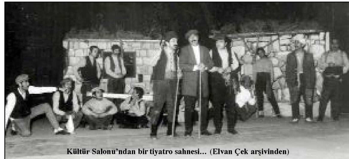
Kültür Salonu'ndan bir tiyatro sahnesi...