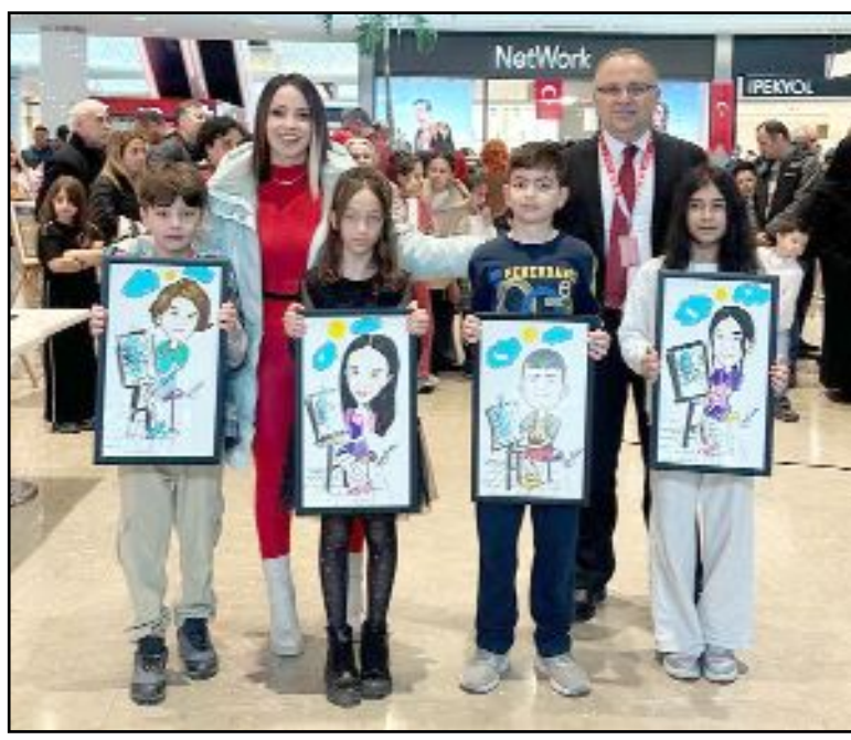
Özel Hastane'nin bu yıl 7'ncisini düzenlediği "Geleneksel Resim Yarışması"nda dereceye giren öğrenciler ödüllendirildi.