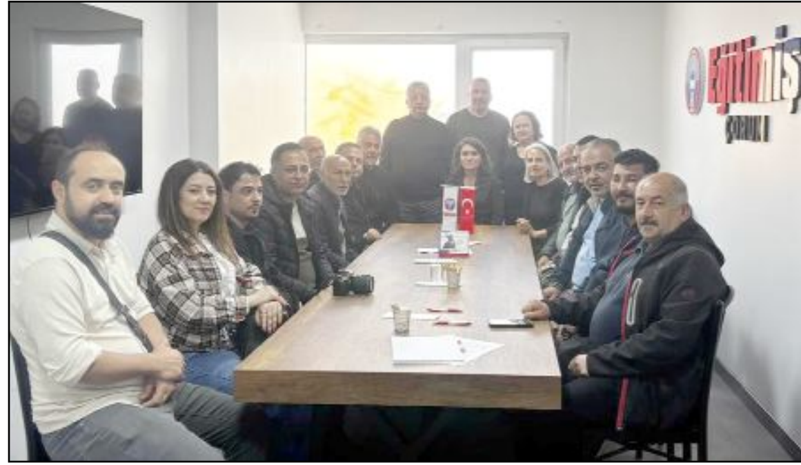
Basın mensupları, Eğitim-İş yönetimi ile sohbet ederek gündemi ve sendika çalışmalarını değerlendirdi.

K.S.S. Ankara Yolu 3. Cad. No: 133 ÇORUM