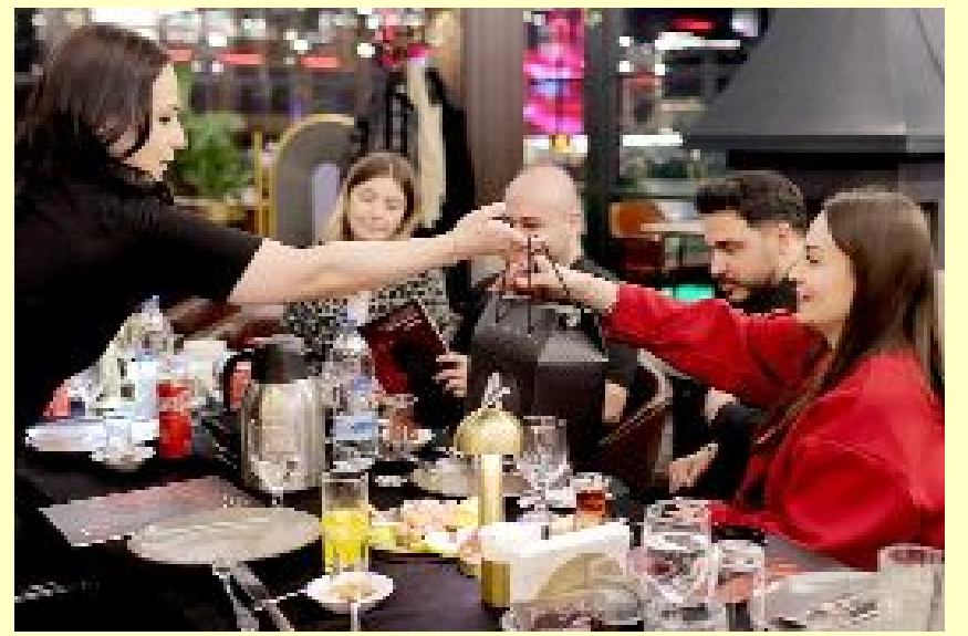
Sektör içi samimiyet ve hoş paylaşımlar...

Atlamaz Yapı yetkilileri, bu buluşmanın amacının yalnızca ürün tanıtımı olmadığını belirterek, mimar ve iç mimarlar arasında daha güçlü ve samimi bir iletişim kurulmasına zemin hazırlamayı arzu ettiklerini söylediler. (Aliye ÖNCEL)