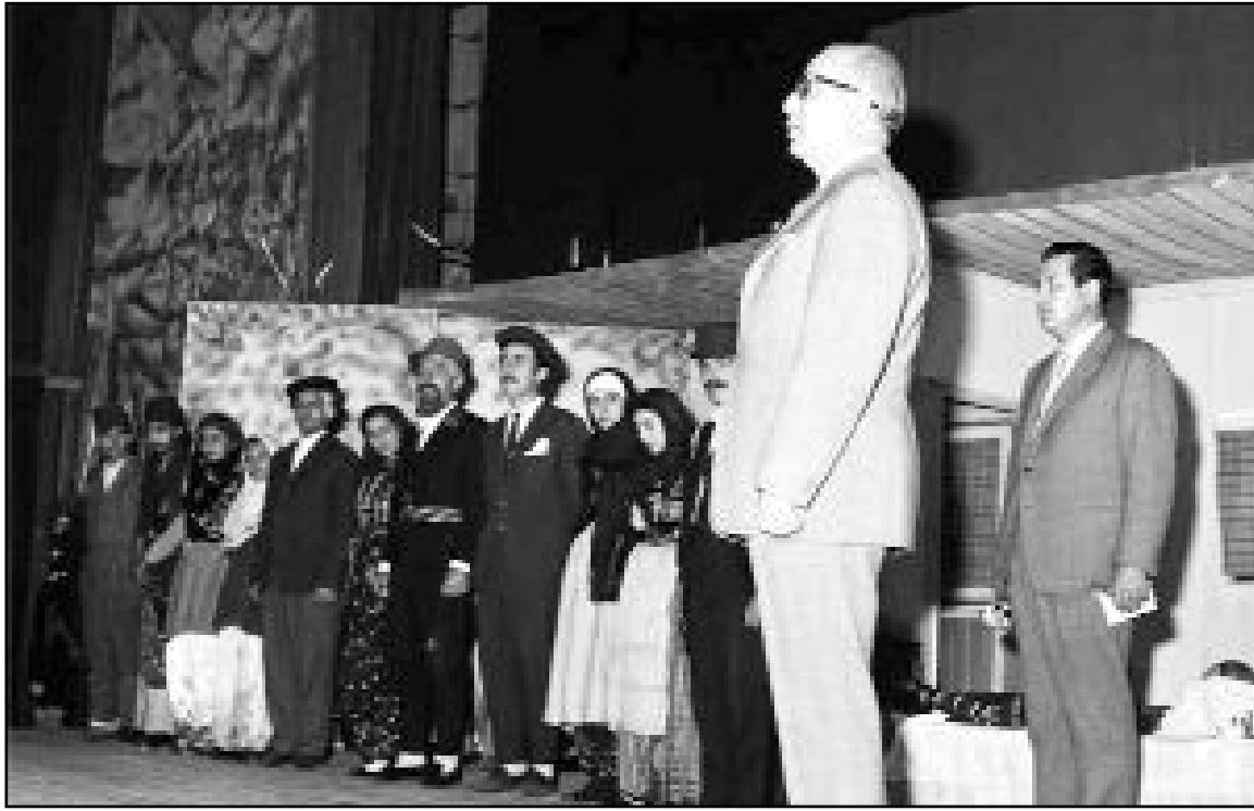
Çorum Halk Eğitim Tiyatro Grubu "Sultan Gelin" temsilinden sonra Vali Ziya Çoker tarafından tebrik edilirken. (Arka planda, dönemin Halk Eğitim Başkanı Hayrettin Koyuncu.)

Unutmamak gerekir ki, bu tür özel eserler yalnızca geçmiş anlatmaz; aynı zamanda geleceğe de ışık tutar. Onlar sayesinde çocuklarımız, kitaplardan okudukları tarih ile gerçek hayat arasında bağ kurabilir.