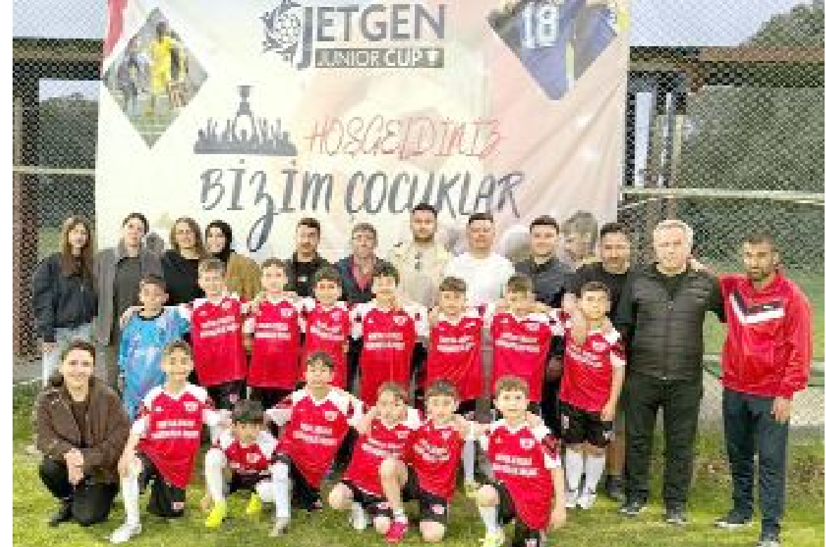
Hattuşa Gençlikspor, 9-10 yaş grubunda 5 galibiyet, 1 beraberlikle şampiyon oldu.

iki şampiyonluk kupası olarak damga vurdu. (Hüseyin AŞKIN)