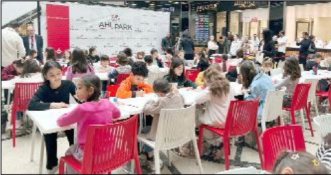
AHL Park AVM'de düzenlenen yarışmaya, Çorum İl Millî Eğitim Müdürlüğü onayıyla il genelindeki ilköğretim 1 ile 4'üncü sınıf öğrencileri katıldı.

ailelerin de yoğun katılımıyla bayram coşkusu içinde tamamlandı. (Haber Merkezi)