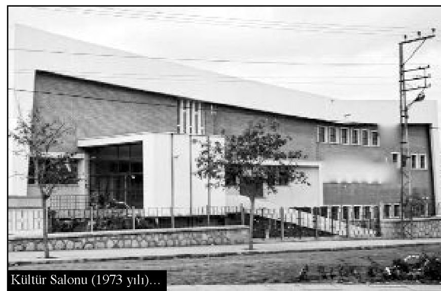
Kültür Salonu (1973 yılı)...

Ben ilk kez 1971 yılında o salona tanıştım.