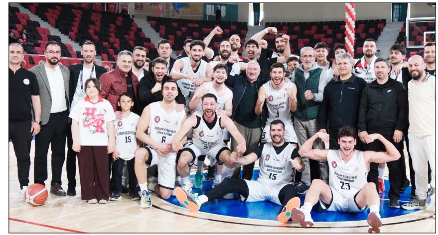
Maçın bitişi düdüğünün ardından galibiyet böyle kutlandı.

Çorum'un Erkekler Bölgesel Ligi'ndeki temsilcisi Çorum Belediyespor, gruptaki son maçında Selçuklu Belediyespor'u mağlup ederek Play-Off'lara lider girmeyi başardı.