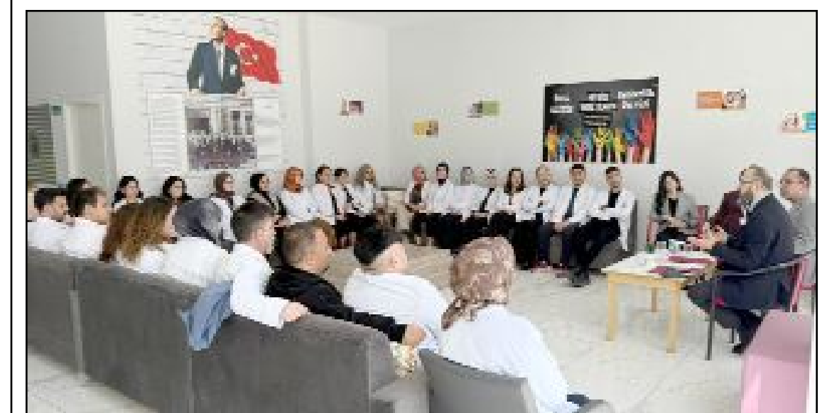
Özel İlk Arzum Özel Eğitim ve Rehabilitasyon Merkezi ile Özel Doğa Otizm Dil Akademi Rehabilitasyon Merkezi tarafından "Özel Eğitimde Aile Eğitimi: Neden ve Nasıl Olmalı" başlıklı eğitim düzenlendi.