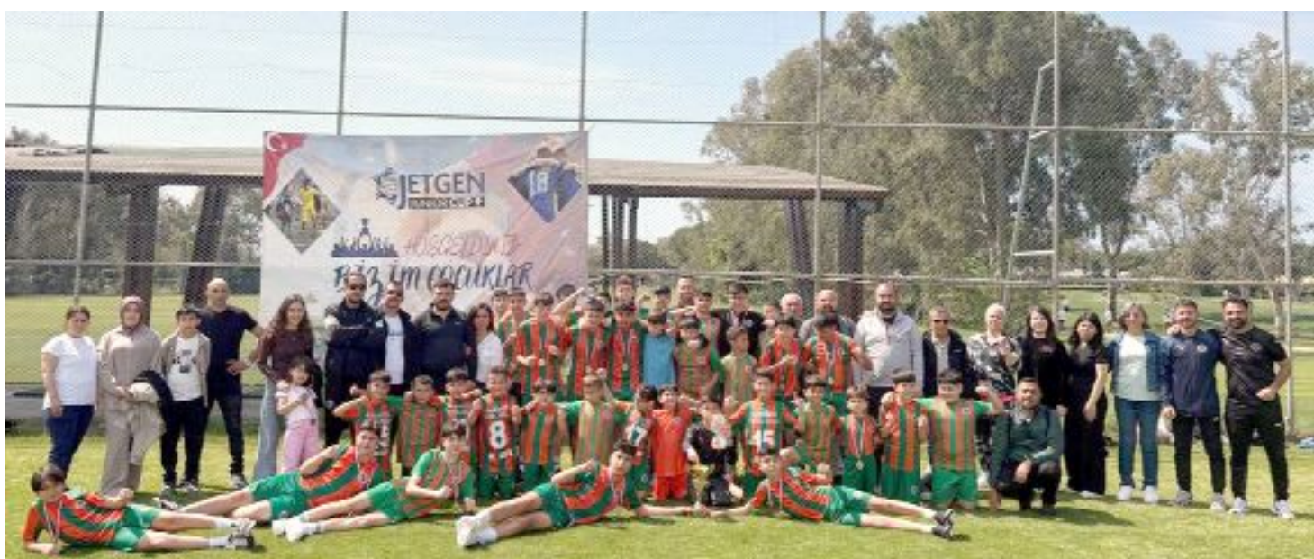
13-14 yaş grubunun final maçında İtalya temsilcisi Milan'ı 1-0 yenen Çorum Alanyaspor Futbol Okulu şampiyon oldu.

Antalya-Belek'te düzenlenen Uluslararası JetGen Junior Cup Futbol Turnuvası'nda, 13-14 yaş grubunun finalinde İtalyan devi Milan'ın altyapısını 1-0 yenen Çorum Alanyaspor şampiyon olurken, 9-10 yaş kategorisinde ise 6 maçta 5 galibiyet, 1 beraberlik alan Çorum Hattuşa Gençlikspor mutlu sona ulaştı.