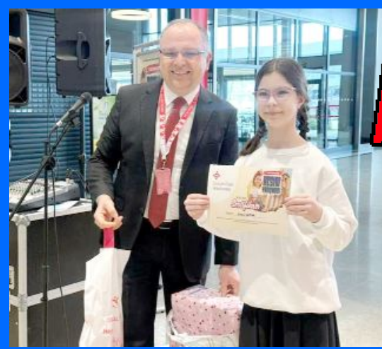
Özel Hastane'nin bu yıl 7'ncisini düzenlediği "Geleneksel Resim Yarışması"nda dereceye giren öğrenciler ödüllendirildi.