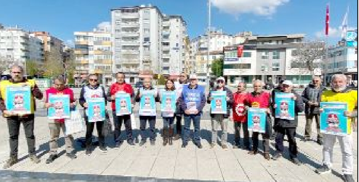
TÜRK-İŞ, DİSK, KESK ve Birleşik Kamu-İş tarafından oluşturulan Tertip Komitesi, Kadeş Barış Meydanı'nda basın açıklaması düzenledi.