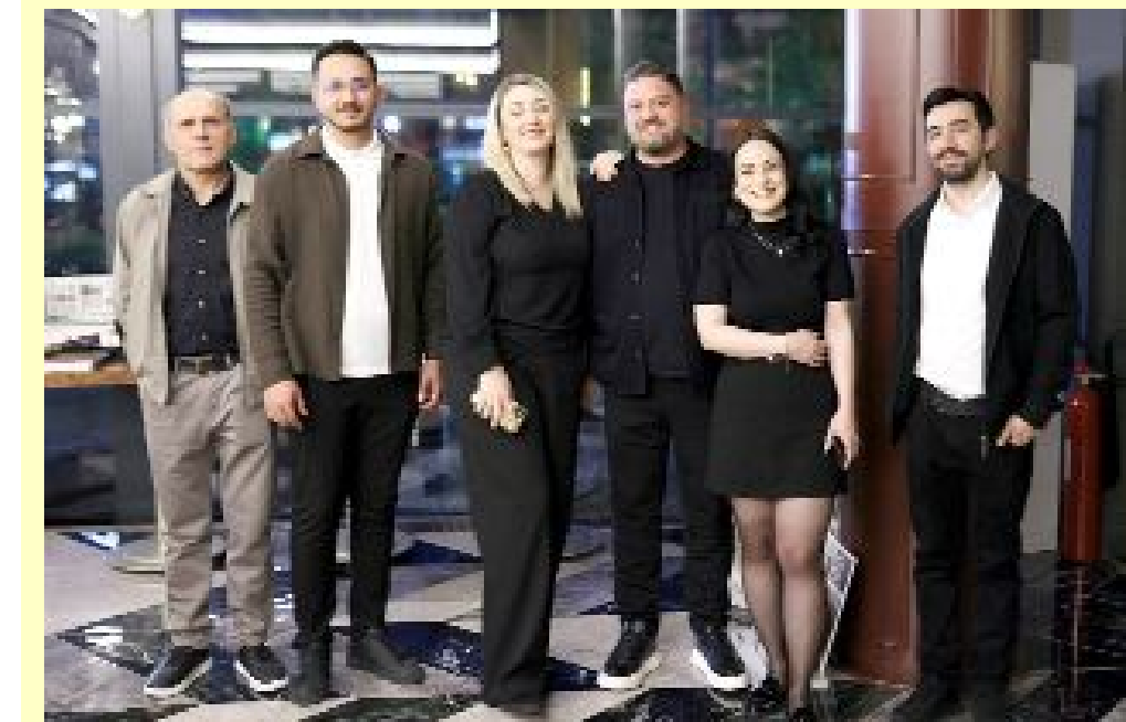
Atlamaz Yapı Malzemeleri firmasının, mimar ve iç mimarları buluşturduğu yemekten...

Atlamaz Yapı, Çorum'da faaliyet gösteren mimar ve iç mimarları bir araya getirdi.