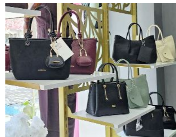
Birbirinden şık çantalar...