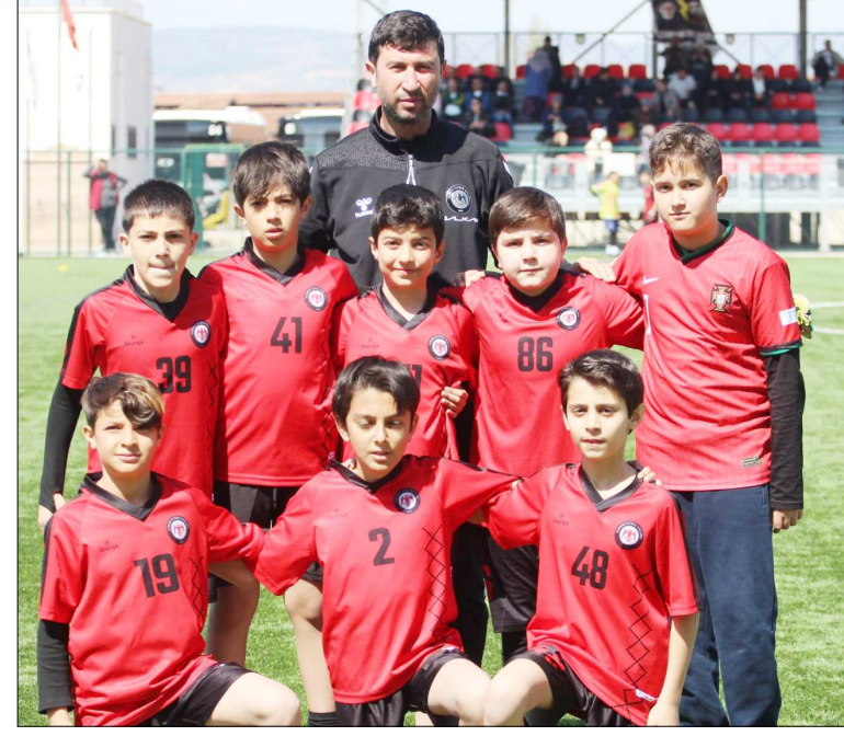
Turnuvada mücadele eden takımlardan fotoğraflar...