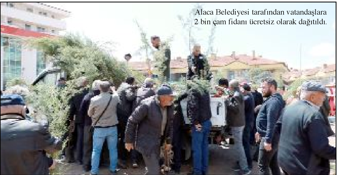
Alaca Belediyesi tarafından vatandaşlara 2 bin çam fidanı ücretsiz olarak dağıtıldı.

lerin sonucunda ülkemizin sırtına binen faiz yükü katlanarak artıyor. "Savaş bahanesiyle enflasyon hedeflerinden sapabiliriz" açıklamaları ise kabul edilemez. Bu ülkenin sınırlı kaynaklarını bir avuç yabancı yatırımcıya yüksek faizle peşkeş çekmek, sürdürülebilir bir ekonomi yönetimi değildir" dedi. Bütçe açıklarını halka yeni vergiler ve cezalarla yüklemek ekonomi yönetmek anlamına gelmediğini ifade eden Öztürk, gerçekçi politikaların şart olduğunu söyledi. (Haber Merkezi)