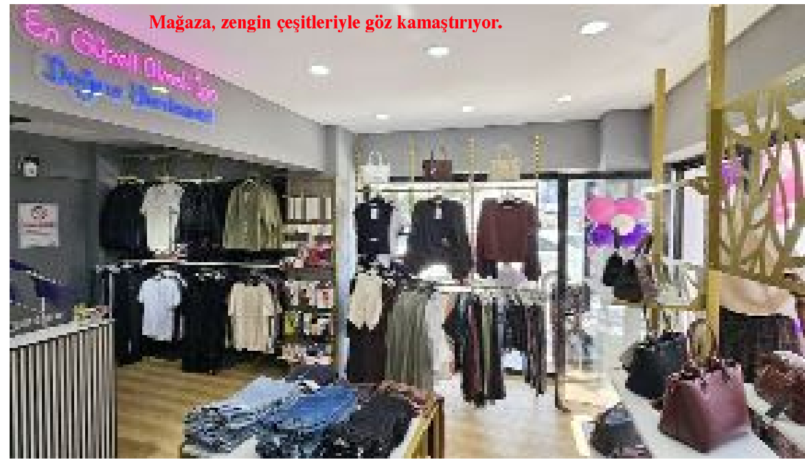
Mağaza, zengin çeşitleriyle göz kamaştırıyor.

Yaklaşık 5 yıllık sektör tecrübesini yeni mağazasında müşterileriyle buluşturan Arıcı, açılışta yaptığı açıklamada, kadınların kendilerini rahat ve özgüvenli hissete-