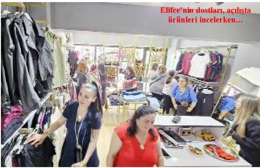
Elifce'nin dostları, açılışta ürünleri incelerken...

Bahçelievler Mahallesi Bahabey Caddesi'nde, Hünkar Hacı Bektaş Parkı karşısında hizmete giren butik, açılış davetlilerden yoğun ilgi gördü.