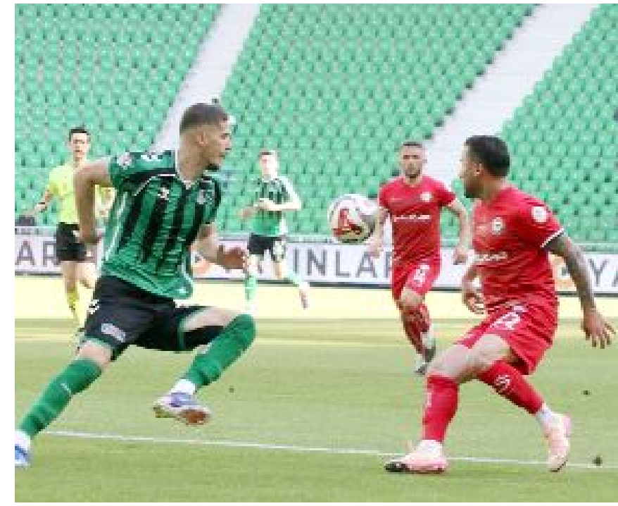
Arca Çorum FK'nın Sakaryaspor'u 4-0 yendiği maçtan bir enstantane...

Arca Çorum FK-Erzurumspor Manisa FK-Sakaryaspor İstanbulspor-Adana Demir Ümraniyespor-Keçiörengücü Bandırmaspor-Sivasspor Esenler Erok-Pendikspor Bodrum FK-Sarıyer Hatayspor-Vanspor Boluspor-Serikspor İğdir FK-Amedspor