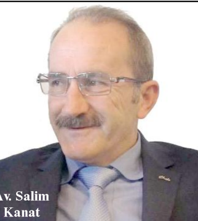
Av. Salim Kanat

Çorum Barosu avukatlarından, Alaca'da uzun yıllardır avukatlık yapan şair, yazar ve karikatürist Salim Kanat vefat etti.