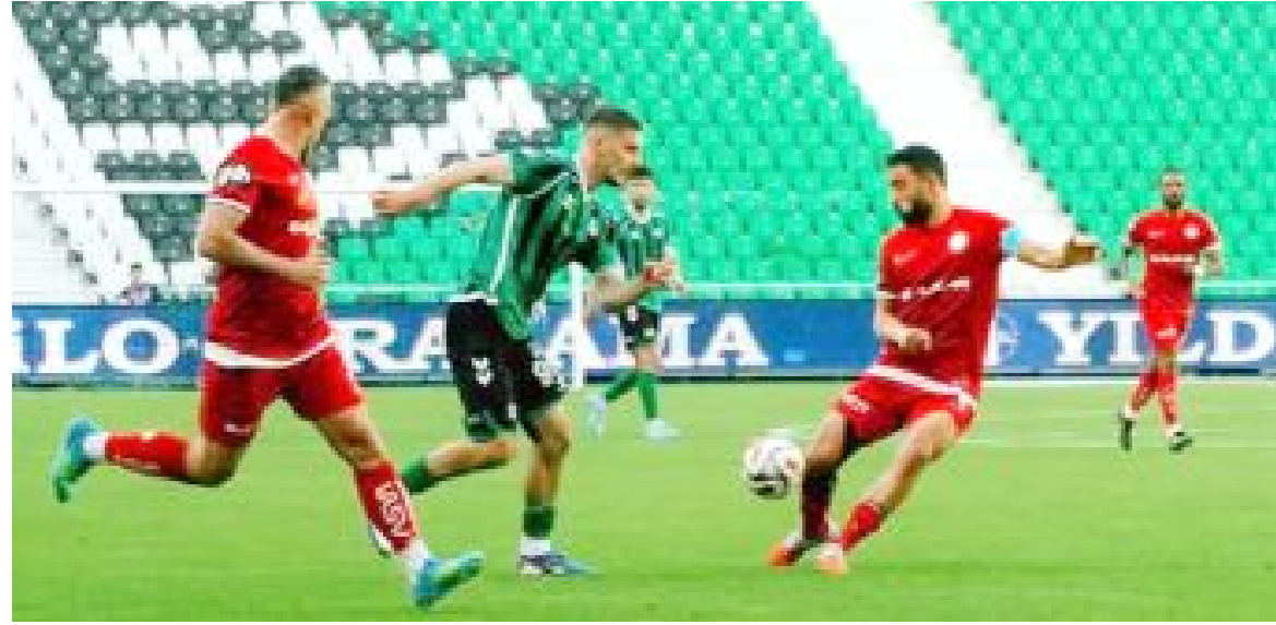
Sakarya deplasmanında 4-0 kazanan Arca Çorum FK, sezonun en farklı galibiyetini aldı.