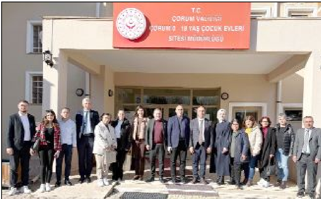
CHP heyeti, Sevgi Evlerinde bulunan çocukların 23 Nisan Ulusal Egemenlik ve Çocuk Bayramı'nı kutladı.