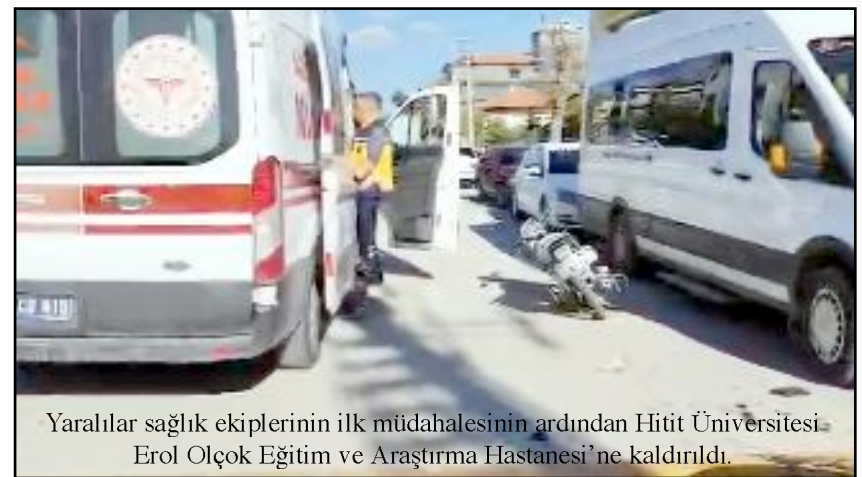
Yaralılar sağlık ekiplerinin ilk müdahalesinin ardından Hitit Üniversitesi Erol Olçok Eğitim ve Araştırma Hastanesi'ne kaldırıldı.

Kaçan sürücüye 422 bin 500 lira ceza uygulanırken motosiklet trafikten men edildi. (Haber Merkezi)