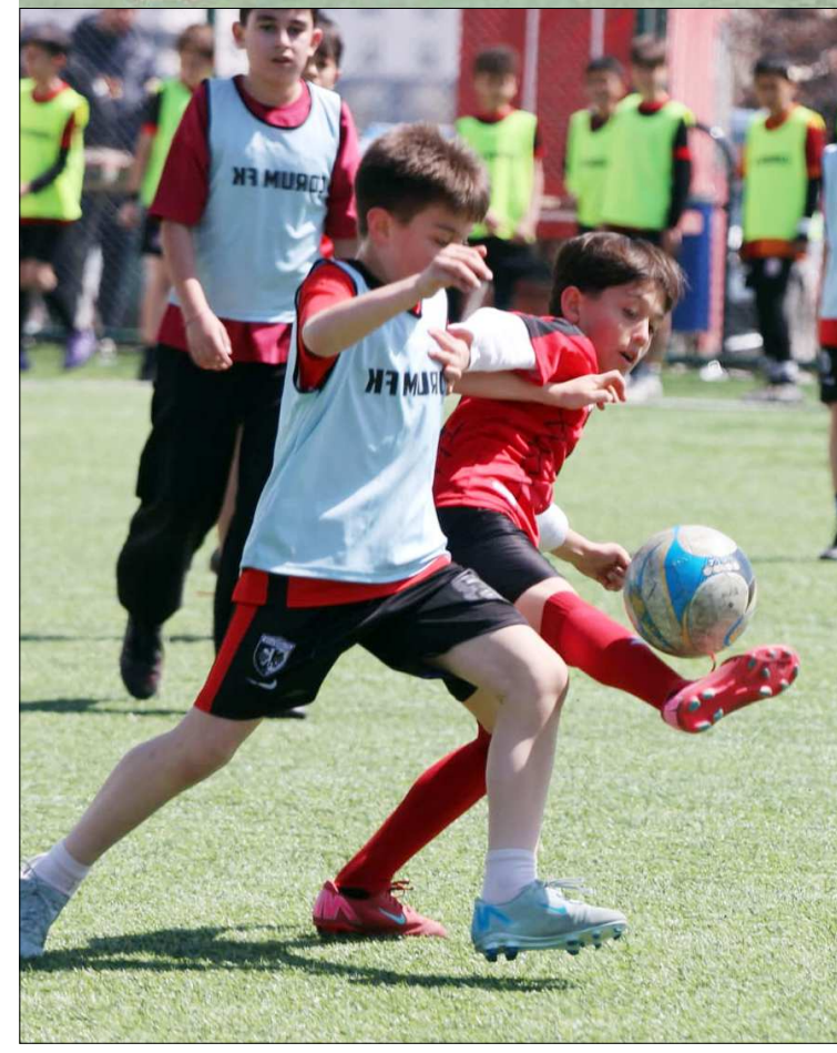
Turnuvada oynanan maçtan bir enstantane...