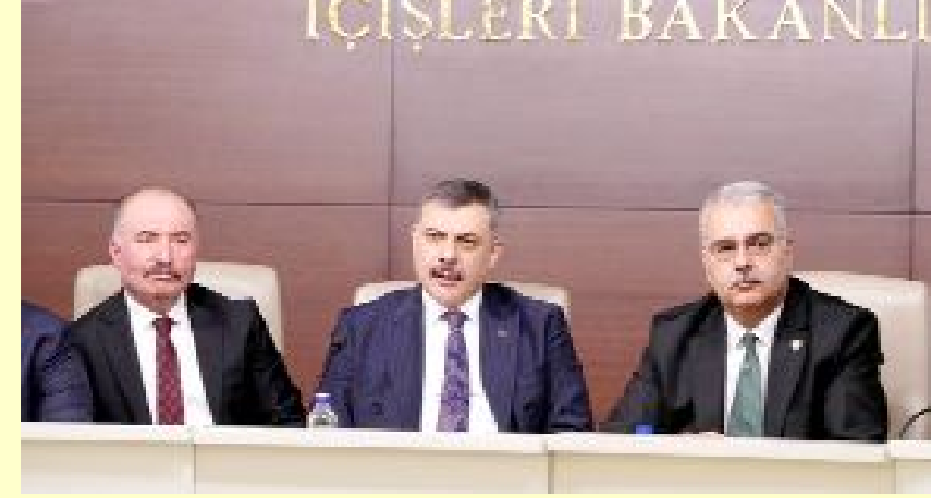
Bakan Çiftçi Çorum heyetine nazik ziyaretleri için teşekkür ederek ilimiz projelerine desteğini vurguladı.