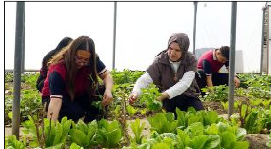
Seranın bir bölümünde de 95 albion çileği ile 950 kök Yedikule marulu yetiştirildi.