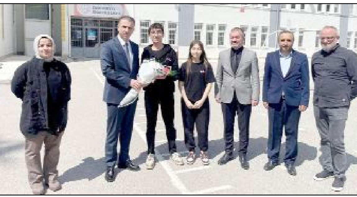
Çorum Cumhuriyet Başsavcısı Ahmet Bektaş, Cumhuriyet Anadolu Lisesi'ni ziyaret ederek 11 ve 12. sınıf öğrencileriyle buluştu.