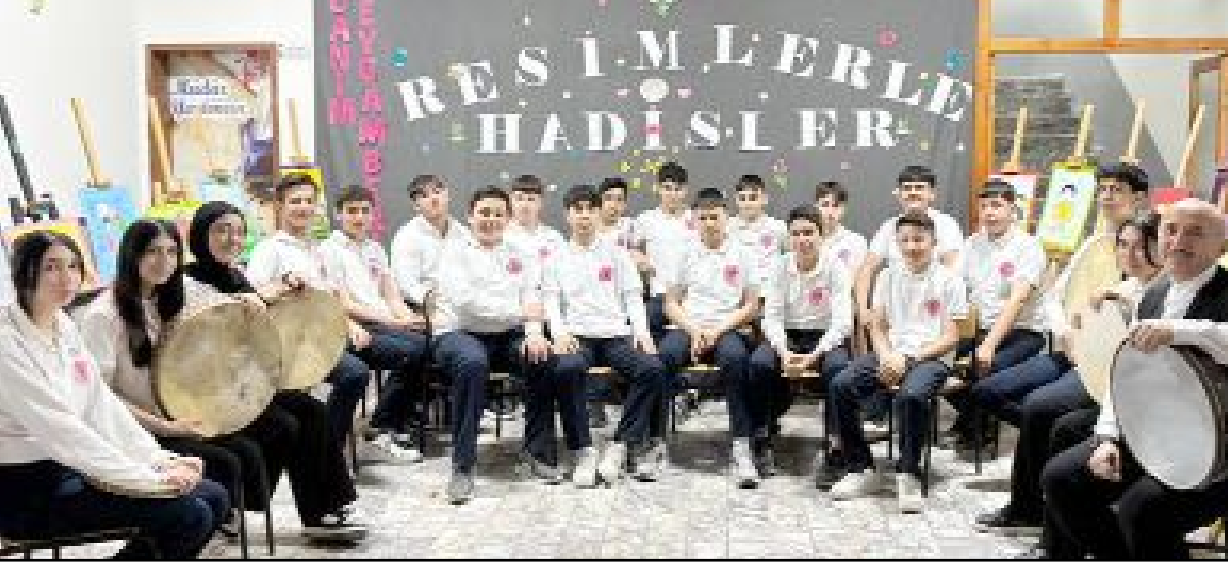
9-Ave 9-B sınıfı öğrencilerinden oluşan koro ilahiler söyledi, 10/A sınıfı öğrencileri ise def çaldı.