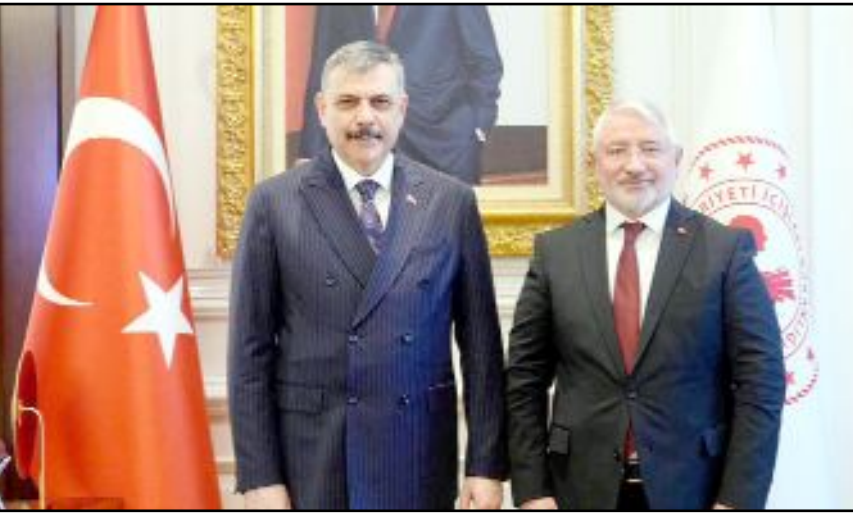
Ziyarete katılan Çorum heyeti Bakan Çiftçi ile bol bol hatıra fotoğrafı çekindi

İnsana karşı saygının, hoşgörünün, dayanışmanın, paylaşma gibi değerlerin güvenli bir yaşamın temel taşları olduğunu unutmamak gerekir. Yaşamın temelini korumak için her türlü olumsuz çalışma koşullarına rağmen, gece gündüz demeden özveriyle hizmet vermeye çalışan hekimlerimize, hemşirelerimize ve diğer tüm sağlık çalışanlarımıza sahip çıkılması gerekmektedir." (Volkan SINAYUÇ)