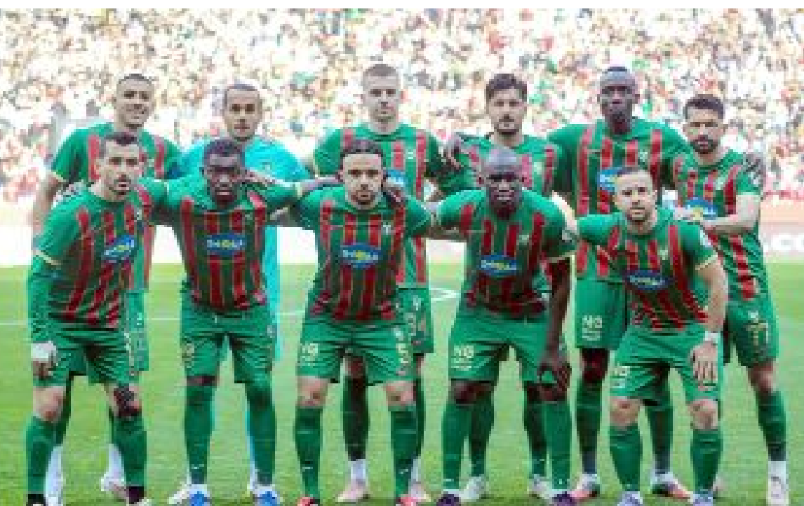
Amedspor, son maçında Iğdır FK'yı yenmesi durumunda hiçbir sonuca bakmadan Süper Lig'e yükselecek.

4-0'lık Sakaryaspor galibiyeti moral ve özgüven açısından çok kıymetli. Ancak asıl değer, bu maçı ne kadar doğru analiz ettiğinizle ortaya çıkar. Eğer bu galibiyet eksikleri görmezden gelen bir rahatlık yarattırsa tehlikelidir. Ama doğru dersler çıkarılır, detaylara odaklanılır ve oyun disiplini korunursa, işte o zaman gerçek bir kazanıma dönüştür. Çünkü artık sezonun kaderini belirleyecek bir döneme girildi. Ve bu dönemde kazananlar, oyunu en iyi oynayanlar değil, oyunu en doğru anlayanlar olacak.