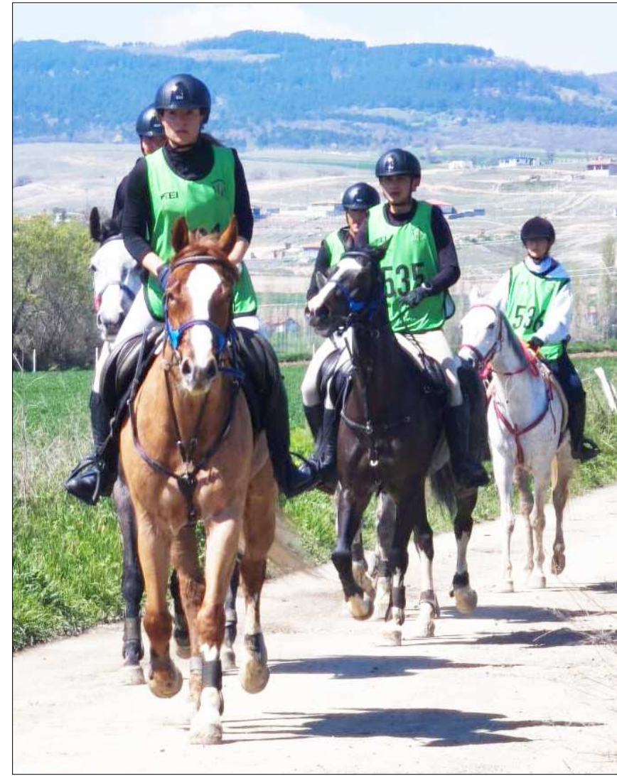
Çorum Belediyesi binicilik tesislerinde gerçekleşen yarışlardan bir fotoğraf...

AŞGIN'DAN MÜJDE Çorum Belediyesi Binicilik Tesisleri'nde düzenlenen endurance yarışlarının ardından gerçekleştirilen ödül töreninde, Çorum Belediye Başkanı Halil İbrahim Aşgın, dereceye giren sporculara ödülleri takdim etti. Aşgın, Çorum'un binicilikte önemli bir merkez haline geldiğini vurgulayarak belediyenin desteğinin süreceğini ifade etti ve Ekim ayında Çorum'da uluslararası bir yarışma düzenleneceğinin müjdesini verdi. (Hüseyin Gazi KOLAÇ)