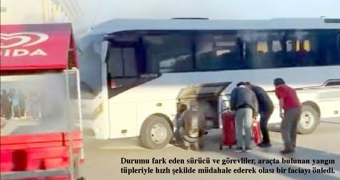
Durumu fark eden sürücü ve görevliler, araçta bulunan yangın tüpleriyle hızlı şekilde müdahale ederek olası bir faciayı önledi.

Kısa sürede kontrol altına alınan olayda herhangi bir yaralanma yaşanmazken, öğrenciler büyük bir korku yaşadı. (Haber Merkezi)