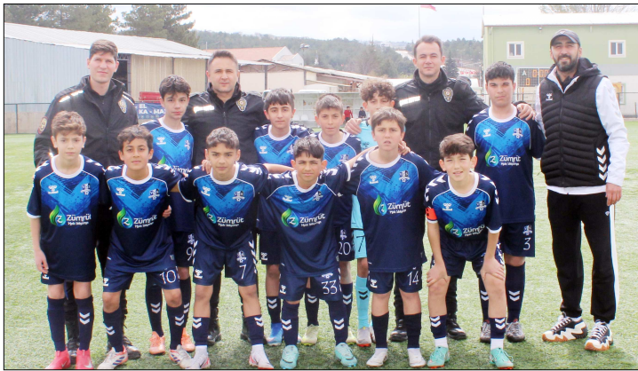
Vefaspor A grubunu şampiyon tamamladı.

C grubunda ise şampiyon bu hafta oynanacak son hafta maçlarının ardından belli olacak. 18 puanlı Mimar Sinanspor ile 16 puanlı Osmancık Kandiberspor şampiyonluk için yarışıyor. (Aliye ÖNCEL)