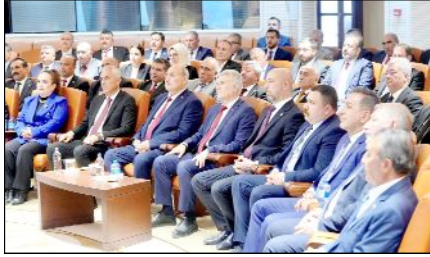
Çorum heyetinin ziyaretinde ilimizdeki devam eden bazı yatırımlar ve gelecek hedefleri görüşüldü.

Milletvekili Ahlatcı, "AK Parti teşkilatımız ve Cumhuriyet İttifakı ortağımız MHP heyetiyle birlikte, şehrimizde görev yaptığımız süre boyunca hemşehrilerimizin gönlünde müstesna bir yer edinen değerli Bakanımız Mustafa Çiftçi'yi ziyaret ettik. Sayın Bakanımız a yeni görevinin hayırlı olması temennileri-