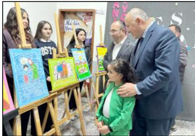
Mehmet Çelik Mesleki ve Teknik Anadolu Lisesince düzenlenen etkinlikte öğrencilerin hadis-i şerifleri resimlerle anlatan çalışmalarını sergilendi.

Beş yaşından bu yana Kur'an kurslarına gittiğini dile getiren Ünverdi, "Neredeyse Kur'an'ın yarısına kadar geldim ve Peygamber Efendimizi hayatımın çoğunda örnek alıyorum" ifadelerini kullandı. (AA)