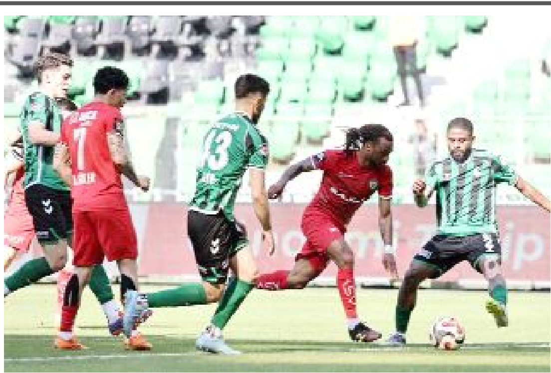
Haftayı 4-0'lık Sakaryaspor galibiyetiyle kapatan Arca Çorum FK 1 günlük izin ardından Erzurumspor maçının hazırlıklarına bugün yapacağı idmanla başlayacak.

A ve Doğu Tribün D4 bloklarda izleyen taraftarlar, "çirkin ve kötü tezahürat" nedeniyle cezalı oldukları için Erzurumspor maçına giriş yapamayacaklar. (Hüseyin AŞKIN)