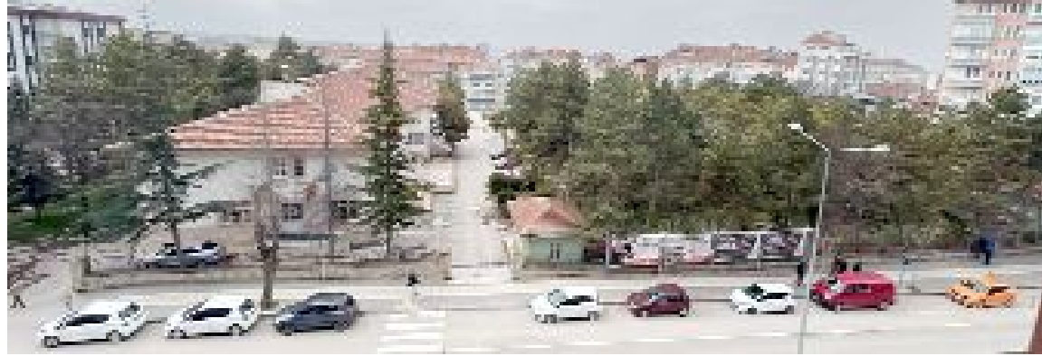
Uzun yıllar Göğüs Hastalıkları Hastanesi, Diş Hastanesi'nin açılışına kadar da Ağız ve Diş Sağlığı Merkezi olarak hizmet veren "ağaçlı-bahçeli" sağlık tesisi, adeta Bahabey'in akciğeri...

● O günden bu yana Çorumlular, bu yerin özelleştirme kapsamı dışına çıkarıldığına ilişkin net ve somut açıklamayı bekliyor. En başta, Eğitim Araştırma Hastanesi'nde bu birimin 30 yataklı sınırlı oluşu nedeniyle, Çorum halkı fizik tedavi ve rehabilitasyon hizmeti alamıyor. Diğer yandan da, etkili girişimlerle özelleştirmenin önüne geçilmediği takdirde, bu değerli yerin oldu-bittiye getirilerek rantta kurban edilebileceği endişesi yaşanıyor. (Haber Merkezi)