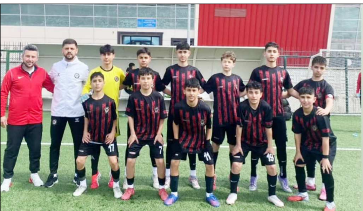
Arca Çorum FK B grubunu şampiyon tamamladı.