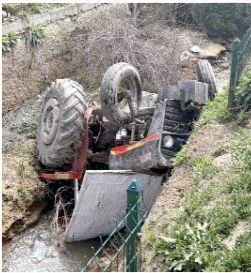
Sungurlu'nun Beşköy köyünde traktörün su kanalına devrilmesi sonucu yaralanan 13 yaşındaki S.C., kaldırıldığı hastanede hayatını kaybetti.