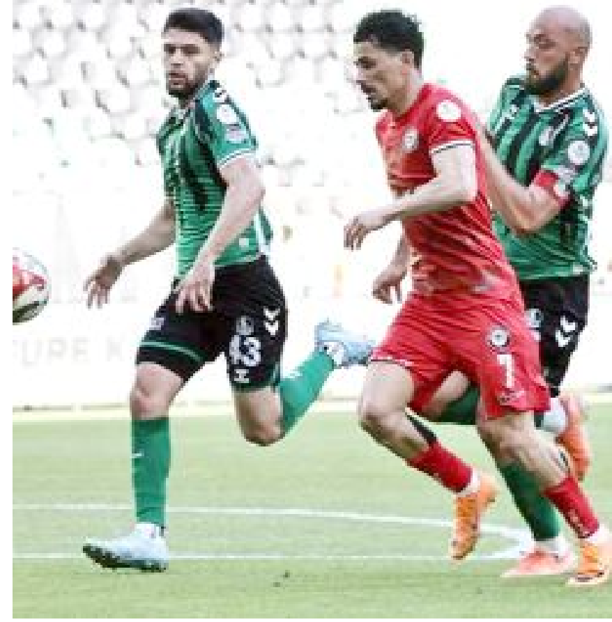
Sakaryaspor'u 4-0 yenen Arca Çorum FK, bu sezon en farklı galibiyetini aldı.