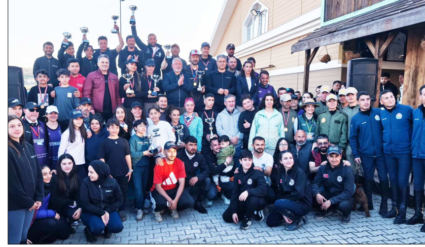
Dereceye giren biniciler Belediye Başkanı Halil İbrahim Aşgın tarafından ödüllendirildi.