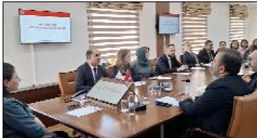
Festivale her yaşta bireyin aktif katılımının önemi vurgulandı.

Toplantı sonunda festival sürecinde görev alacak kurum ve kuruluşların sorumluluk alanları detaylı şekilde belirlenirken, etkinliklerin koordinasyon içinde planlı ve etkin bir şekilde yürütülmesine yönelik kararlar alındı. (Volkan SINAYUÇ)