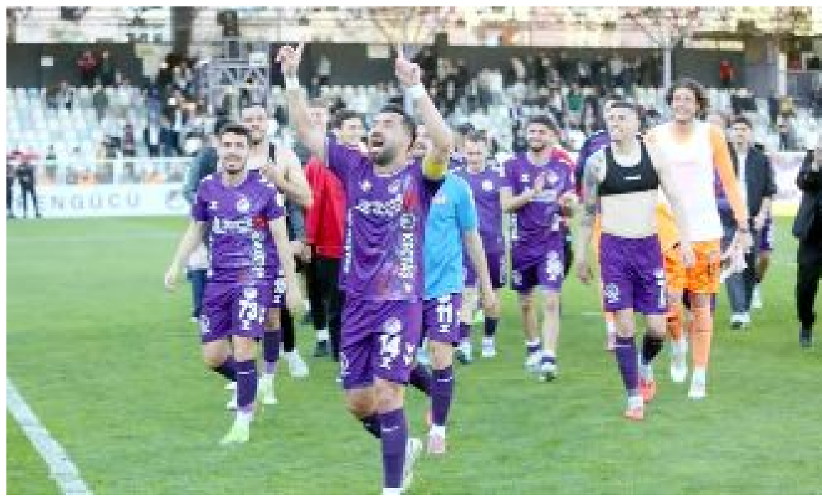
Sahasında Manisa FK'yı 2-1 yenen Keçiöregücü, Play-off'un son bileti için büyük avantaj yakaladı.