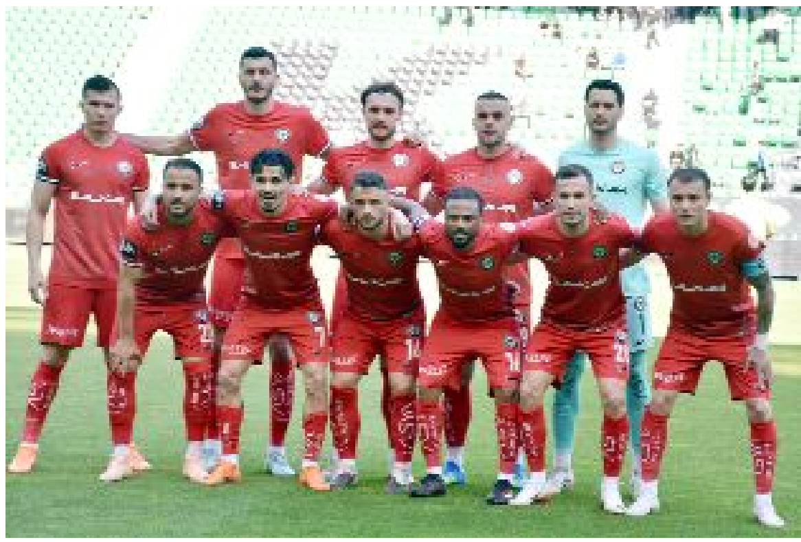
Arca Çorum FK, Erzurumspor'u yener, Amedspor da Iğdır'da yenilirse final biletinin sahibi olacak.

Amed ve Erokspor yenilir, Arca Çorum FK Erzurumspor'u yense, bu kez üç takım da 73'er puana sahip olacak ve 3'lü averaj hesabı devreye girecek. 3'lü averajda da Amedspor'un 7, Arca Çorum FK'nın 6, Erokspor'un 4 puanı bulunuyor. Dolayısıyla, Süper Lig'e direkt yükselecek takım Amedspor olacak (Hüseyin AŞKIN)