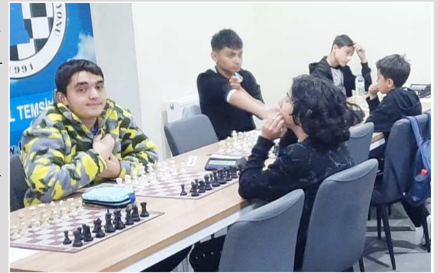
Yeni Spor Salonu'nda gerçekleşen satranç müsabakalarından bir fotoğraf...

na olan ilgisini artırmayı ve yeni yeteneklerin keşfedilmesini amaçladı. Organizasyon sonunda dereceye giren sporculara kupaları takdim edildi. (Aliye ÖNCEL)