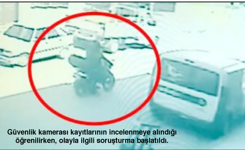
Güvenlik kamerası kayıtlarının incelenmeye alındığı öğrenilirken, olayla ilgili soruşturma başlatıldı.

Çorum'da bir motosiklet sürücüsünün cadde üzerinde bir kediyi ezdiği, çarpmanın ardından sürücüsünün durmadan hızla olay yerinden uzaklaştığı görüldü.