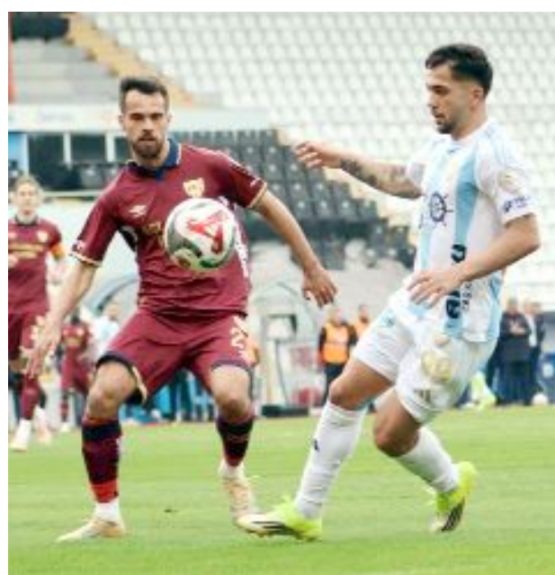
Bandırmaspor, haftayı şampiyon Erzurumspor karşısında aldığı 1-1'lik beraberlikle kapattı.

Bu iki takımdan biri çok büyük bir ihtimalle Arca Çorum FK'nın play-off 1.turundaki rakibi olacak. (Hüseyin AŞKIN)