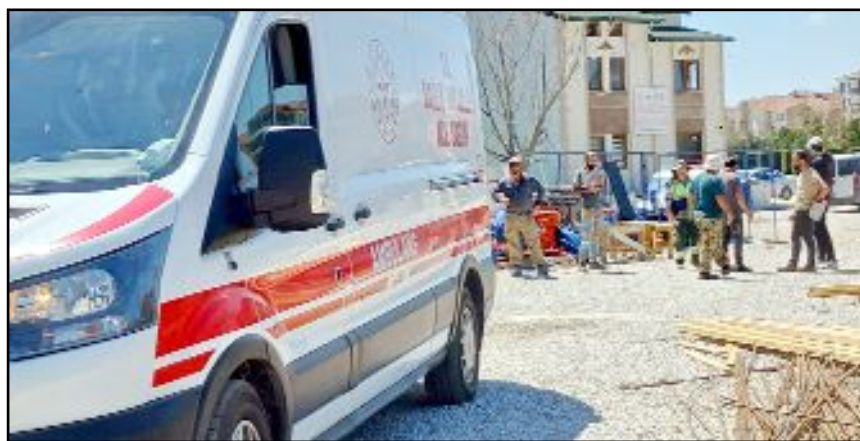
Yaralı işçi, sağlık ekiplerince olay yerinde yapılan ilk müdahalenin ardından Hitit Üniversitesi Erol Olçok Eğitim ve Araştırma Hastanesi'ne kaldırıldı.

Eski Türkiye'ye özlemden mi korkuluyor? Yeniisi yapıyorlarsa bu dizileri tekrar yayımlanmaları, mafya dizilerinden daha faydalı olur.