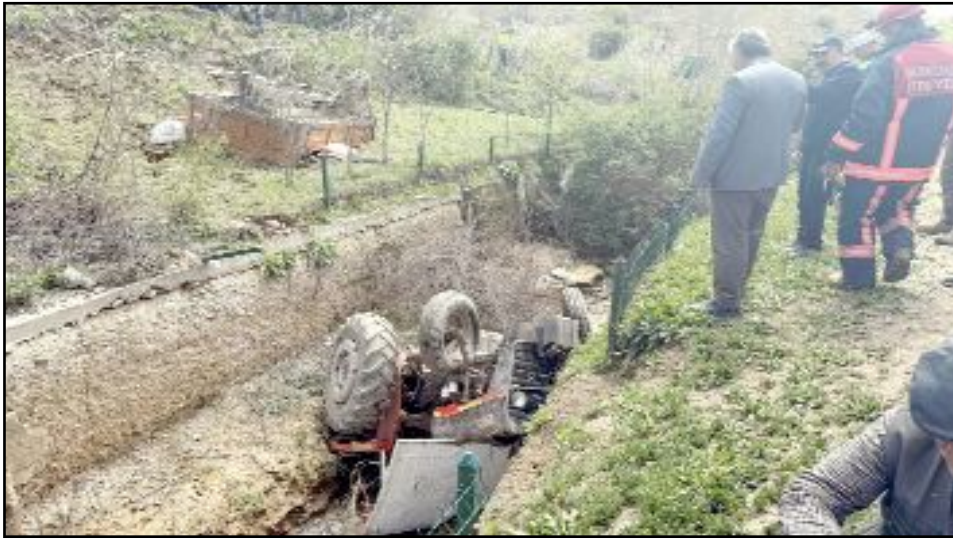
Kaza, önceki gün Çorum'un Sungurlu ilçesi Beşköy köyünde meydana geldi.