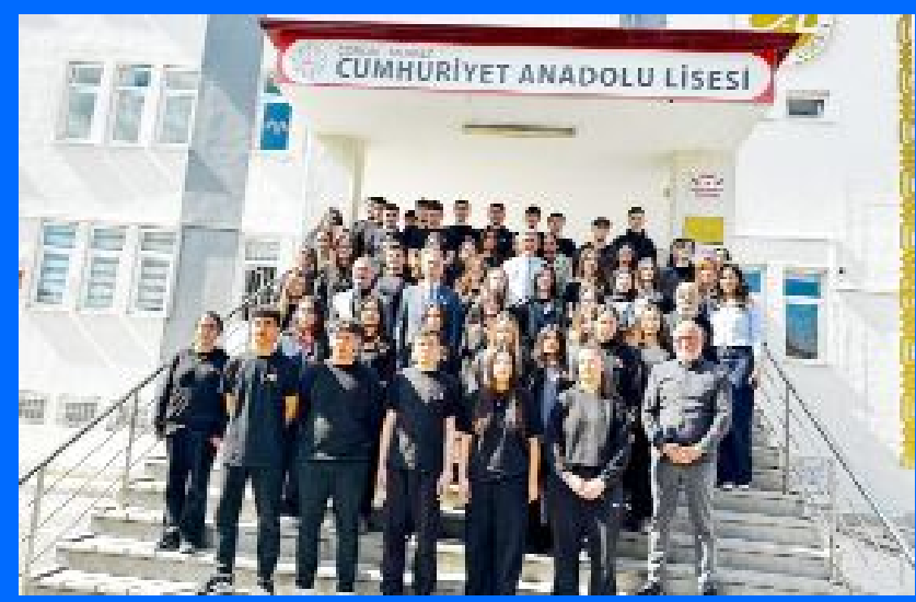
Çorum Cumhuriyet Başsavcısı Ahmet Bektaş, Cumhuriyet Anadolu Lisesi'ni ziyaret ederek 11 ve 12. sınıf öğrencileriyle buluştu.