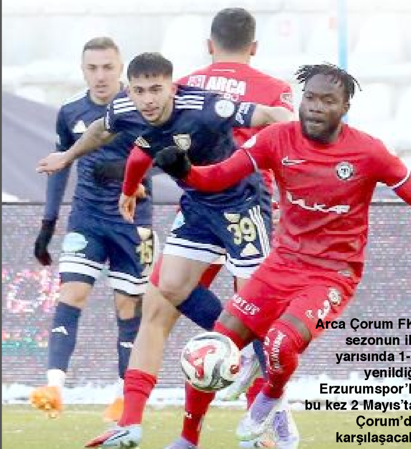
Arca Çorum FK, sezonun ilk yarısında 1-0 yenildiği Erzurumspor'la bu kez 2 Mayıs'ta, Çorum'da karşılaşacak.

maçı saat 20.00'de Manisa FK ile Sakaryaspor arasında oynanacak. Diğer maçlar ise 2 Mayıs Cumartesi günü oynanacak olup, tüm karşılaşmalar saat 16.00'da başlayacak. Arca Çorum FK, şampiyon Erzurumspor'u konuk ederken, İğdir FK ile Amedspor, Bandırmaspor'la Sivasspor, Esenler Erokspor'la Pendikspor, Bodrum FK ile Saryer, Ümraniye ile de Keçiörengücü karşı karşıya gelecek. (Hüseyin AŞKIN)