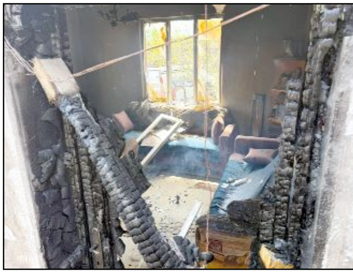
Sungurlu Belediyesi itfaiye ekiplerince söndürülen yangında ev kullanılmaz hale geldi.