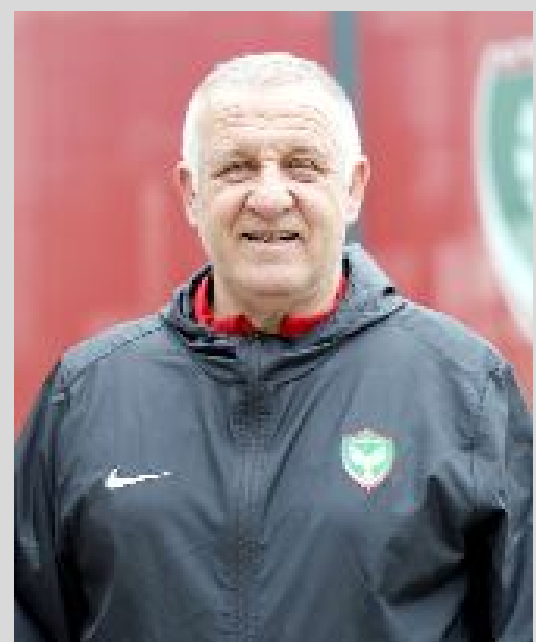
Bakkal, 12 maçta 23 puan topladı.

Gazetemizin basına girdiği saatlerde Diyarbakır temsilcisinin yeni teknik direktörü henüz belli olmamıştı. (Hüseyin AŞKIN)