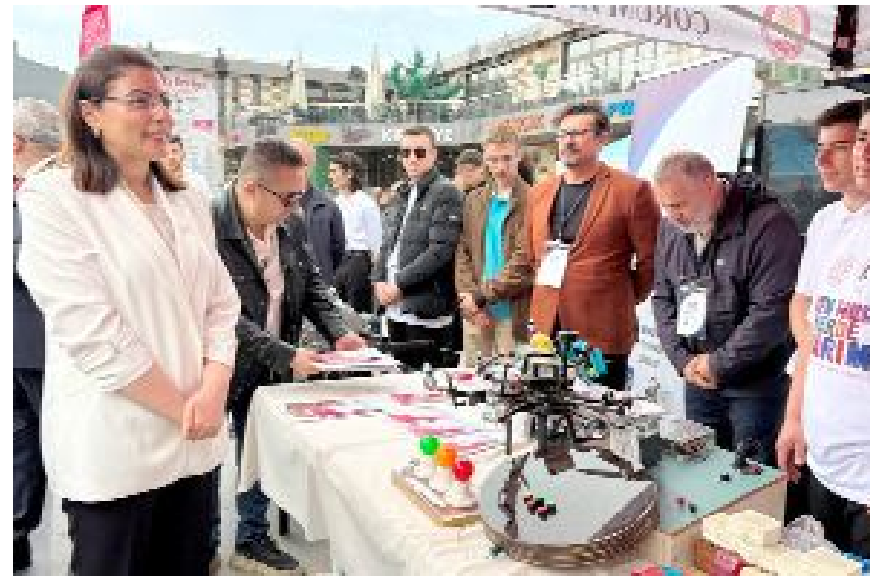
Kadeş Barış Meydanı'nda düzenlenen fuarda meslek lisesi öğrencileri, okullarında yaptıkları ürünleri ve bölümlerini tanıttı.

Konuşmalarından sonra 75. Yıl Cumhuriyet Mesleki ve Teknik Anadolu Lisesi öğrencileri halk oyunları gösterisi, Güzel Sanatlar Lisesi öğrencileri müzik dinletisi, Buharaevler Kız Mesleki ve Teknik Anadolu Lisesi ise "Ahilik pabuç atma" draması ve kuşak bağlama töreni gerçekleştirildi. (AA)