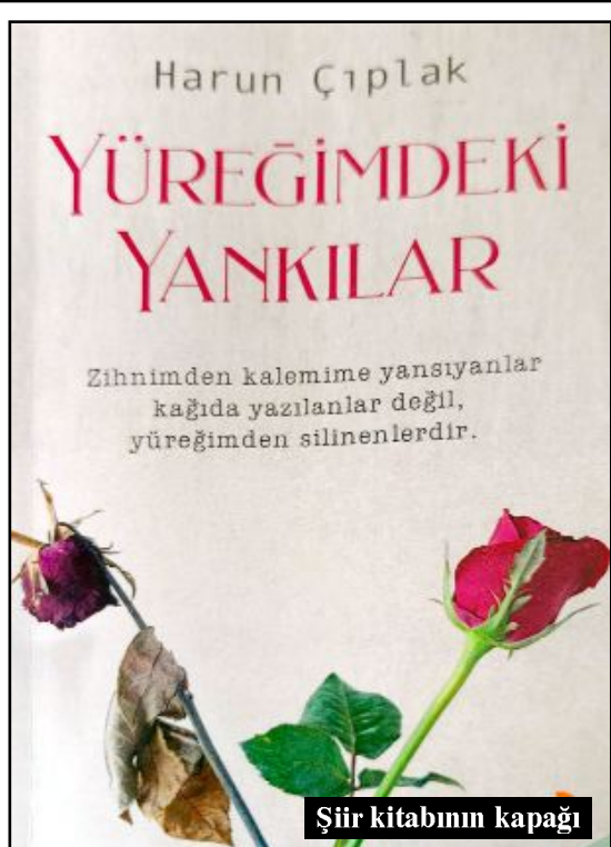
Şiir kitabının kapağı