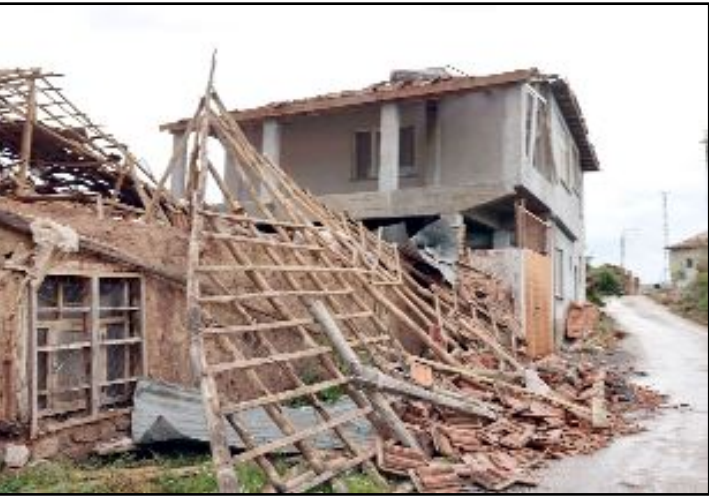
Yapılan ilk incelemede, köylerdeki bazı evlerin çatılarının uçtuğu, ağaç ve elektrik direklerinin devrildiği belirlendi.