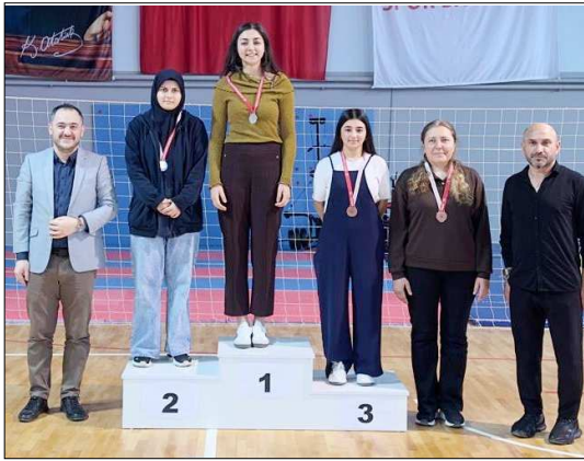
Büyükler kategorisinde dereceye giren sporcular...