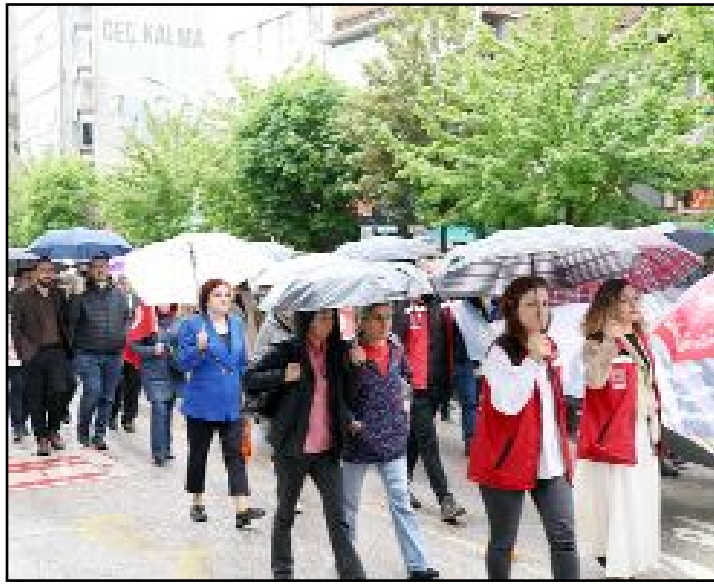
Aile ve Sosyal Hizmetler İl Müdürlüğü öncülüğünde Saat Kulesi'nden Kadeş Meydanı'na kadar yürüyüş yapıldı.