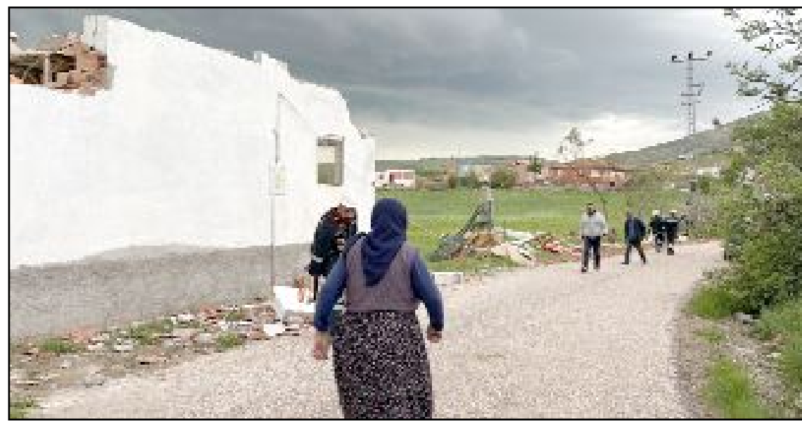
Hortum sebebiyle evlerin tamamına yakınının zarar gördüğü köydeki vatandaş korku dolu anları anlattı

Hortumun vurduğu köydeki vatandaş o anları anlattı: