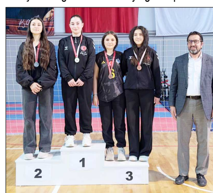
Gençler kategorisinde dereceye giren sporcular...