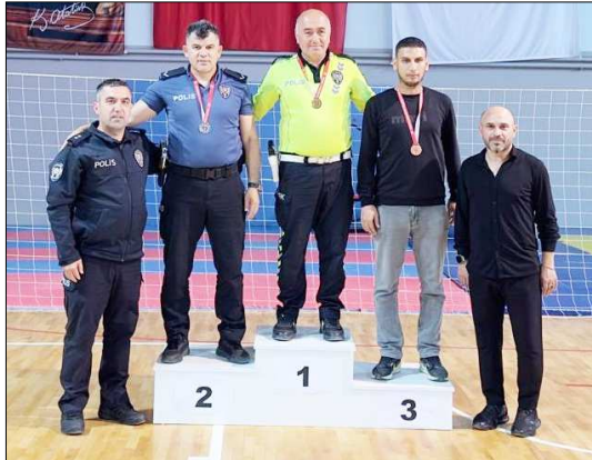
Büyükler kategorisinde dereceye giren sporcular...