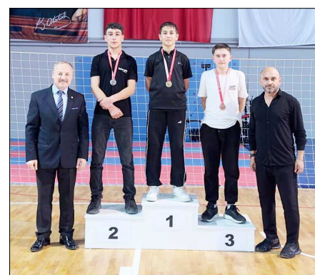
Gençler kategorisinde dereceye giren sporcular...

Müsabakalar sonunda düzenlenen törene, Mecitözü İlçe Müftüsü Ömer Yaşakabak, İlçe Emniyet Amiri Sinan Döner, Devlet Hastanesi Başhekimi Mehmet Akif Gümüş ve Gençlik ve Spor İlçe Müdürü Hasan Demirel katıldı. Dereceye giren sporcuların ödülleri protokol üyeleri tarafından takdim edildi. (Rıfat KARA)