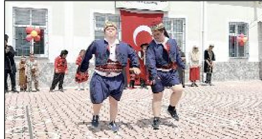
özel öğrenciler, Türkiye'nin yanı sıra Çin, İspanya, Hindistan, Kafkasya, Arabistan, Afrika ve Meksika'nın yöresel halk oyunlarını sergiledi.

ri, oda başkanları ve çok sayıda vatandaş katıldı. (AA)