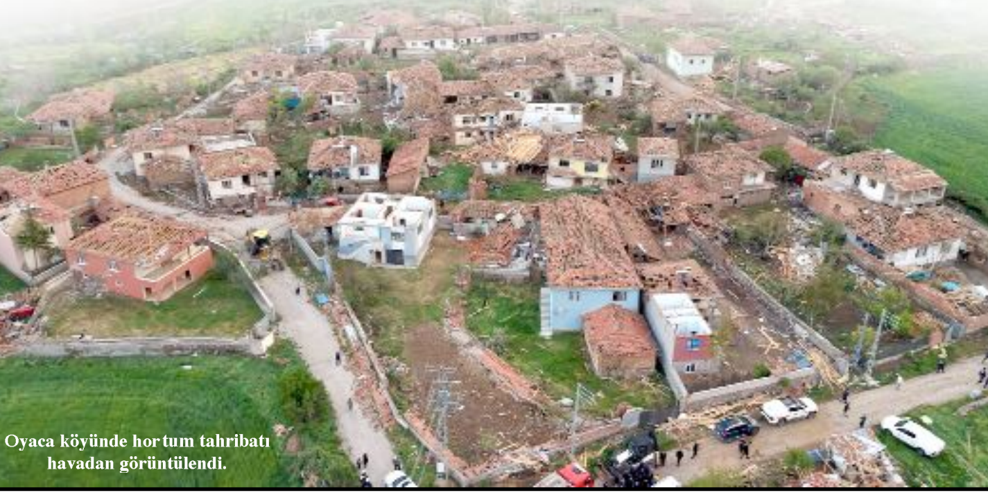
Oyaca köyünde hortum tahribatı havadan görüntülendi.

Köyde oluşan hasar ise havadan görüntülendi. Kaydedilen görüntülerde çok sayıda evin çatısının uçtuğu ve duvarlarının yıkıldığı görüldü. (İHA)