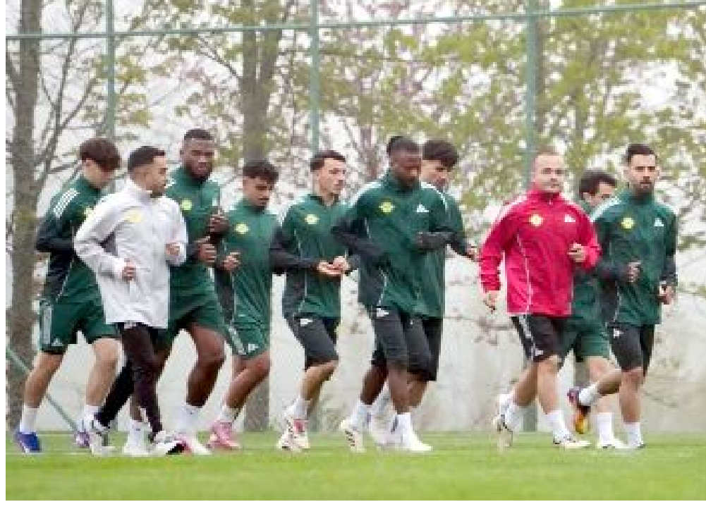
Esenler Erokspor, Arca Çorum FK ile oynayacağı final maçına Bolu'da hazırlanıyor.