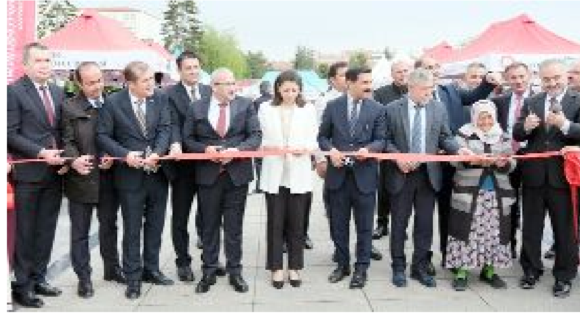
Çorum'da Maarifin Kalbinde Marifetli Gençlik Projesi kapsamında Mesleki ve Teknik Eğitim Tanıtım Fuarı düzenlendi.