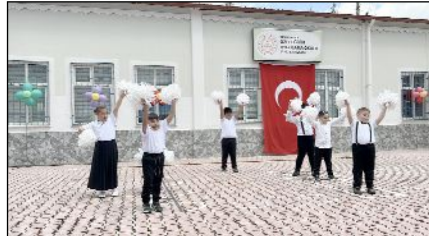
özel öğrenciler, Türkiye'nin yanı sıra Çin, İspanya, Hindistan, Kafkasya, Arabistan, Afrika ve Meksika'nın yöresel halk oyunlarını sergiledi.