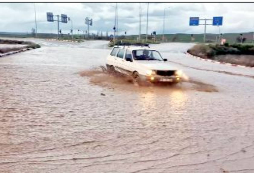
Alaca'da etkili olan sağanak sebebiyle tarım arazileri sular altında kalırken, cadde ve yollarda su baskınları meydana geldi.

kavşağında yola taşınan sel suları sebebiyle araçlar ilerlemede güçlük çekti.