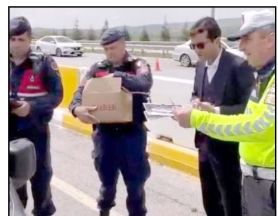
Altı Nokta Körler Derneği üyelerinin katılımıyla jandarma denetleme noktasında düzenlenen etkinlikte sürücülerin engelli bireylere yaklaşımına dikkat çekildi.

Engelliliğin yalnızca doğuştan değil, trafik kazaları, afetler, yangınlar ve savaşlar gibi dış etkenler sonucu da ortaya çıkabileceğine dikkati çeken Kabakçı, trafik kazalarının engelli bireylere neden olan en önemli unsurlardan biri olduğunu belirterek, "Sloganımız 'Yolun sonu engel olmasın, sevdikleriniz sizi bekler.' 5 dakika geç gitseniz bile bir ömür vicdan azabı çekmeyin." dedi. (AA)