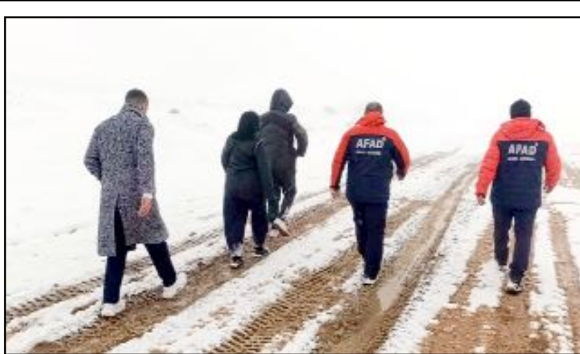
AFAD ve 112 ekipleri üç kişiyi ulaştırarak kurtardı.

"Formülümüz net ve basittir: Madem beklenen enflasyon hedefleri tutmadı ve piyasada disiplin sağlanamadı; o halde kamu görevlilerimizin ve emeklilerimizin maaşları acilen güncellenmelidir. Tutmayan enflasyonun faturası sabit ücretliye ödetilmemeli, seyyanen zam verilerek bu tartışmalara son verilmelidir." (Haber Merkezi)