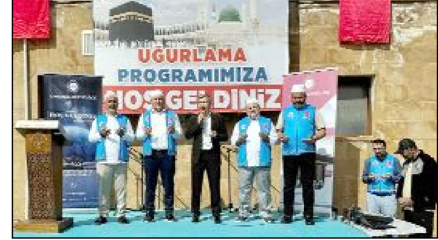
Uğurlama töreninde din görevlileri tarafından dua ve ilahiler okundu.

MHP İl Başkanı Çıplak, mesajının sonunda 3 Mayıs 1944 olaylarının kahramanlarını ve hayatını kaybedenleri rahmet ve minnetle andığını belirtti. (Volkan SINAYUÇ)