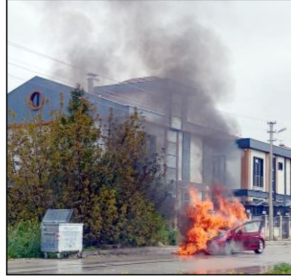
Çorum Belediyesi itfaiye ekiplerinin müdahalesiyle yangın söndürülse de otomobil tamamen yandı.

Otomobilin bakımdan yeni çıktığı ve sahibinin şikâyetçi olacağı öğrenilirken; olay yeri inceleme ekipleri de çalışma yaptı. (Haber Merkezi)