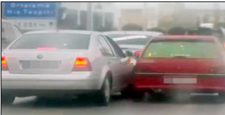
Çorum-Ankara karayolu İskilip Caddesi mevkiinde kayda alınan görüntüler 'pes' dedirtti.