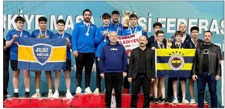
Erkeklerde şampiyon olan Çorum Belediyesi Spor Kulübü...