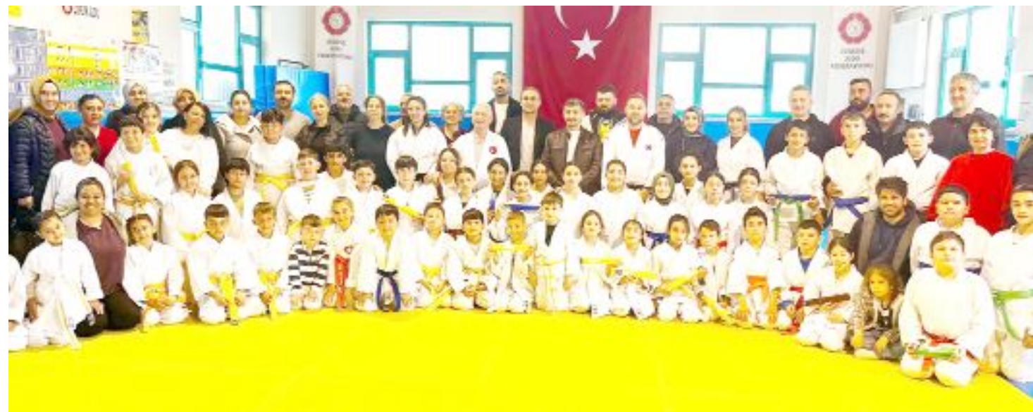
Kuşak sınavına katılan sporcular, antrenörler ve bazı sporcu velileri toplu fotoğrafta görülüyorlar.