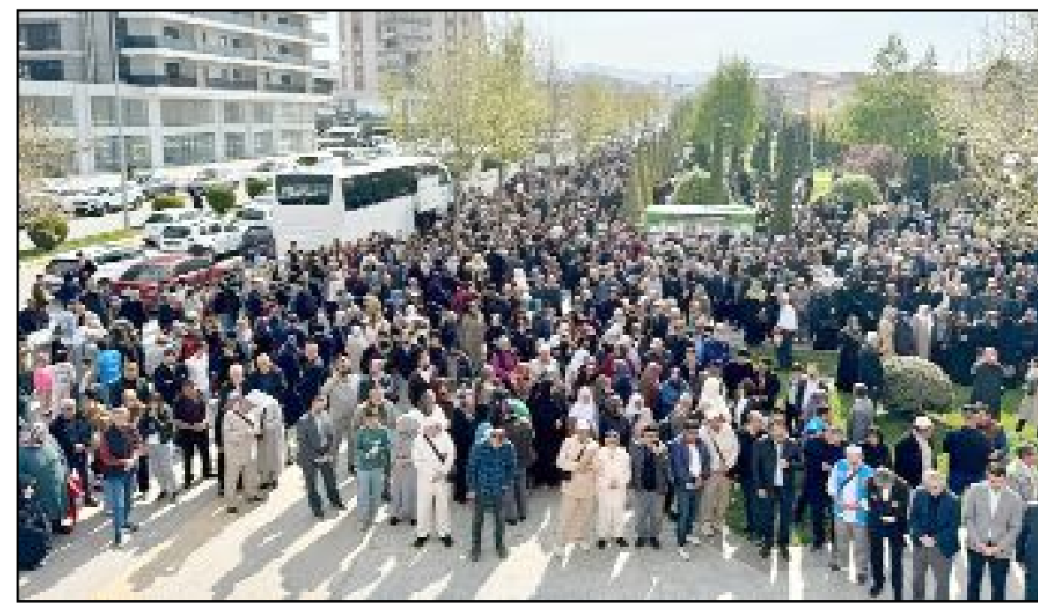
İl Müftülüğü tarafından Akşemseddin Camii önünde hacı adayları için uğurlama töreni düzenlendi. Törene hacı adayları ve din görevlileri ile aileleri katıldı.