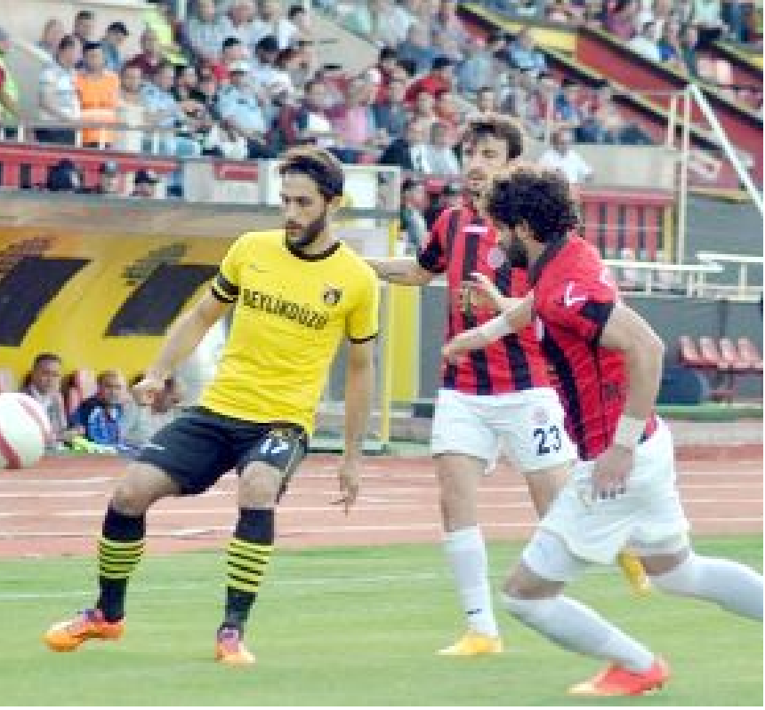
Arca Çorum FK, 2014-2015 Sezonunda, İstanbulspor'la Eskişehir'de oynadığı 3.Lig Play-off final maçını 3-1 kaybederek 2.Lig'in kapısından döndü.

Arca Çorum FK, 1.Lig'de ise 2023-2024 Sezonunu 56 puanla 5.sırada tamamlayarak play-off bileti aldı. 1.turda eşleştiği Kocaelispor'u Çorum'da 2-1 yenen Arca Çorum FK yarı finalde Bodrum FK ile eşleşti. Çorum'da oynanan ilk maç 1-1, Bodrum'daki rövanş ise 0-0 bitince sonucu penaltılar belirledi. Penaltıları 5-4 kazanan Bodrum FK adını finale yazdırdı. Finalde de Sakaryaspor'u yenip Süper Lig'e yükseldi.