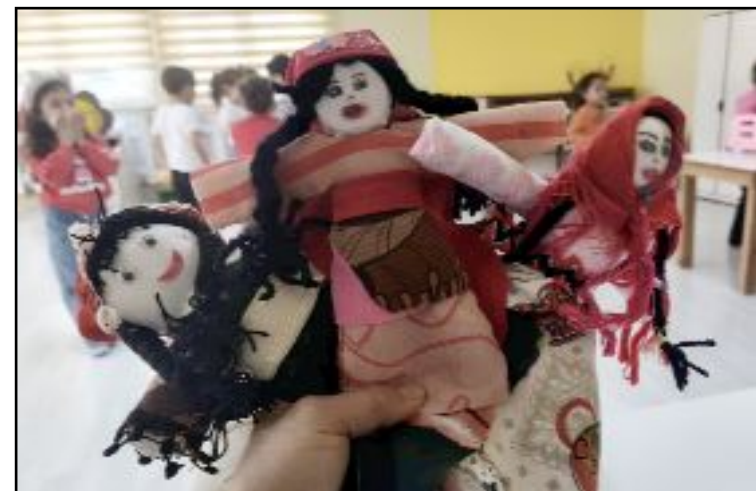
Renkli görüntülere sahne olan etkinlikte çocuklar büyük bir mutluluk yaşadı.

Yetkililer, bu tür etkinliklerin çocukların gelişimine önemli katkı sağladığını belirterek benzer faaliyetlerin devam edeceğini ifade etti. (Aliye ÖNCEL)