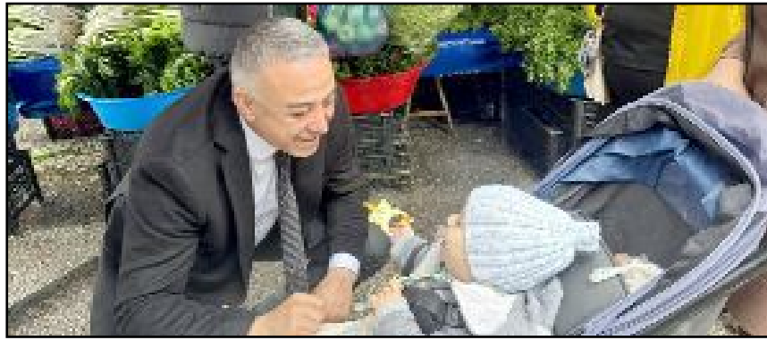
Milletvekili Tahtasız da esnaf ziyaretlerinde hazır bulundu.

edilmiyor. Tarladan ucuza çıkan meyve ve sebzeler sofralara gelinceye dek kat ve kat artıyor. Bu ülkede en önemli problemlerden biri gıda enflasyonudur ve bu iktidarın bu enflasyonu bitirmeye ne gücü vardır ne de çözümü! Bu kara düzen de geçecek, çarşıya, pazara bolluk, bereket gelecek" dedi. (Volkan SINAYUÇ)