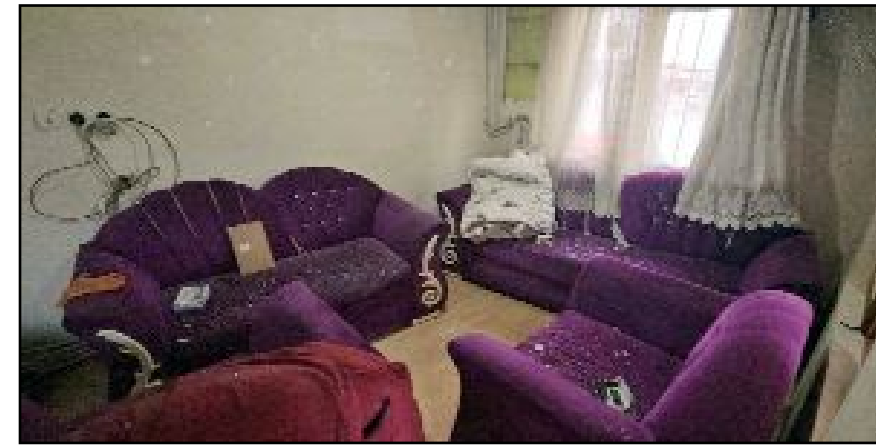
Olay yeri ve çevresinde inceleme yapan polis ekipleri, şüpheli ya da şüphelilerin yakalanması için çalışma başlattı.

Saldırıda can kaybı ya da yaralanma yaşanmazken evde maddi hasar meydana geldi. Olay yeri ve çevresinde inceleme yapan polis ekipleri, şüpheli ya da şüphelilerin yakalanması için çalışma başlattı. (Haber Merkezi)