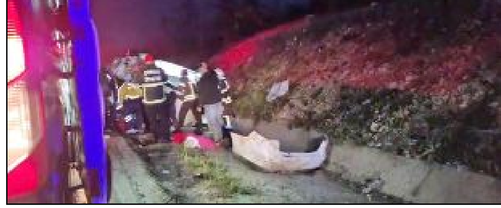
Kaza, Çorum-Samsun yolu Akpınar köyü mevkiinde meydana geldi.

Yaralıları, sağlık ekiplerinin olay yerindeki ilk müdahalesinin ardından Hitit Üniversitesi Erol Olçok Eğitim ve Araştırma Hastanesi'ne kaldırılarak tedavi altına alındı. (Haber Merkezi)