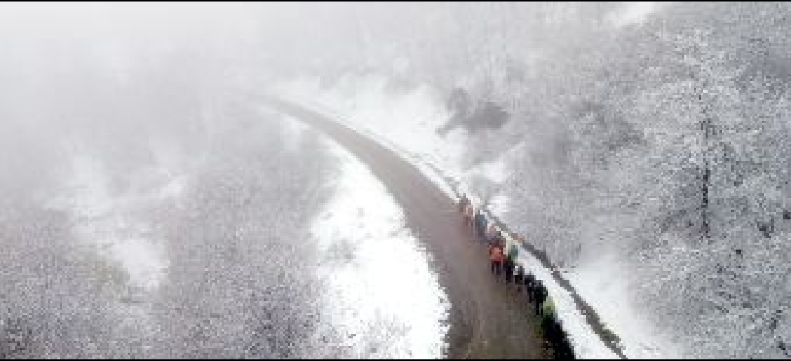
Çorum'da hafta sonu hava sıcaklığının hissedilir derecede düşmesinin ardından kar yağışı etkili oldu.