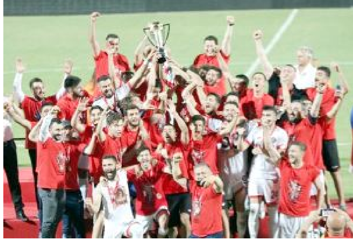
Arca Çorum FK, 2018-2019 Sezonunda, Adana'da Serikspor'la oynadığı 3.Lig Play-off maçını penaltılarla kazanarak 2.Lig'e yükseldi.

Kırmızı-siyahlı takım, 2016-2017 Sezonunda da 3.Lig 1.Grup'ta 58 puanla 5.oyarak Play-off'a kaldı. Yarı finalde Altay'la eşleşen Arca Çorum FK, Çorum'da oynanan ilk maç 2-0 kazanarak