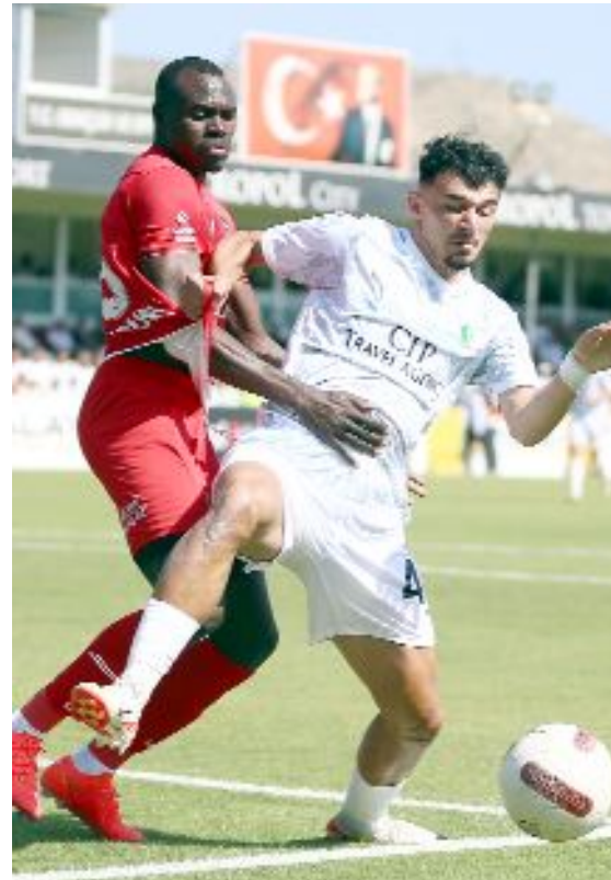
Arca Çorum FK, en son 2023-2024 Sezonunda Play-Off oynadı. 1.Turda Kocaelispor'u eleyen Çorum ekibi, yarı finalde Bodrum FK'ya penaltılarla elendi.