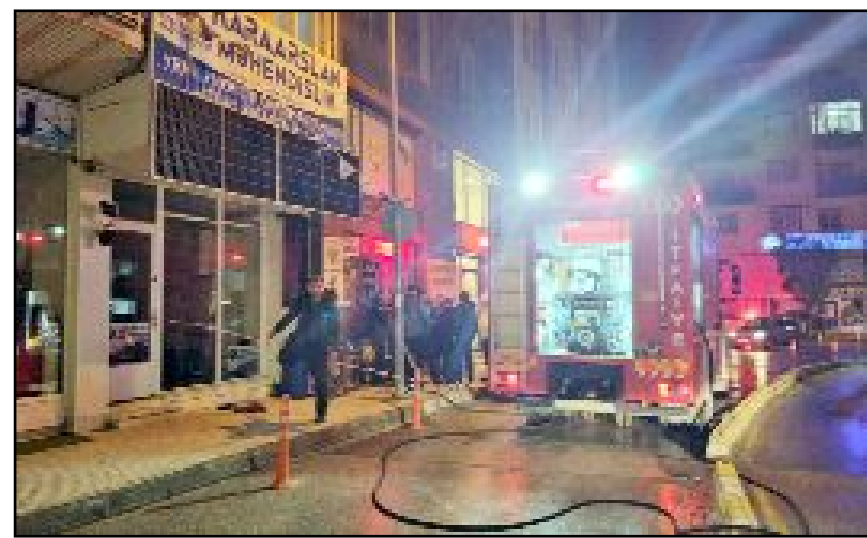
Yangın, itfaiye ekiplerinin müdahalesiyle büyümeden kontrol altına alınarak söndürüldü.

Yangında iş yerinde maddi hasar meydana gelirken, çıkış nedenine ilişkin inceleme başlatıldı. (Haber Merkezi)