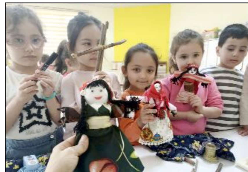
Minek öğrenciler hayal güçlerine göre oyuncak tasarımı yaptı.

İl Milli Eğitim Müdürlüğü koordinesinde Karşıyaka Anaokulu öğrencileri tarafından yapılan etkinlik, renkli görüntülere sahne oldu.