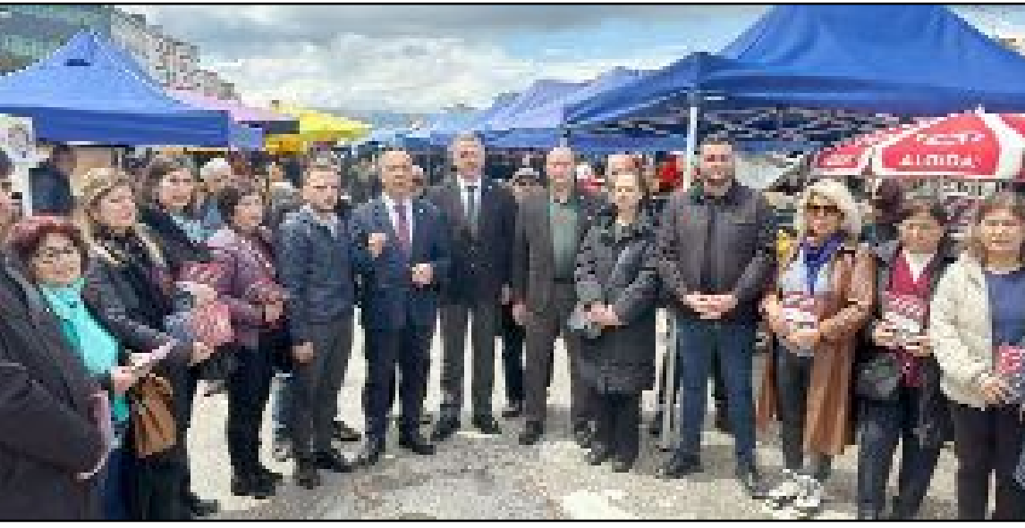
CHP Çorum Teşkilatları Genel Başkan Özgür Özel'in talimatı uyarınca dün Pazartesi Pazarı'nda esnaf ve vatandaş dinledi.