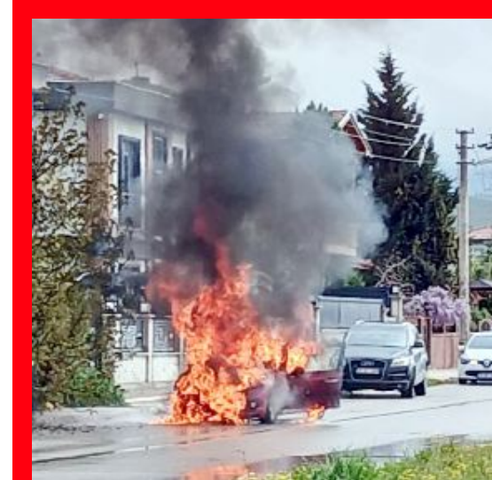
Olay, Buharaevler Mahallesi Slimkent 1. Cadde'de meydana geldi.