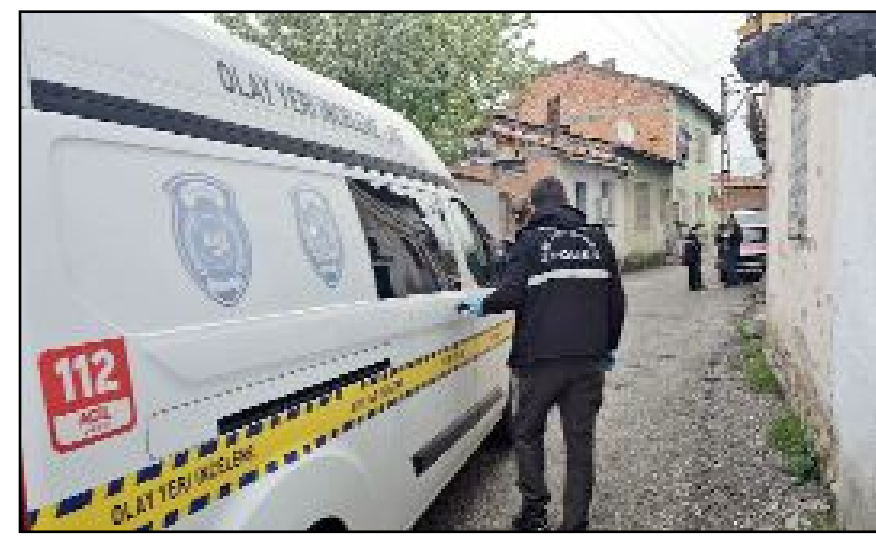
Saldırıda can kaybı ya da yaralanma yaşanmazken evde maddi hasar meydana geldi.