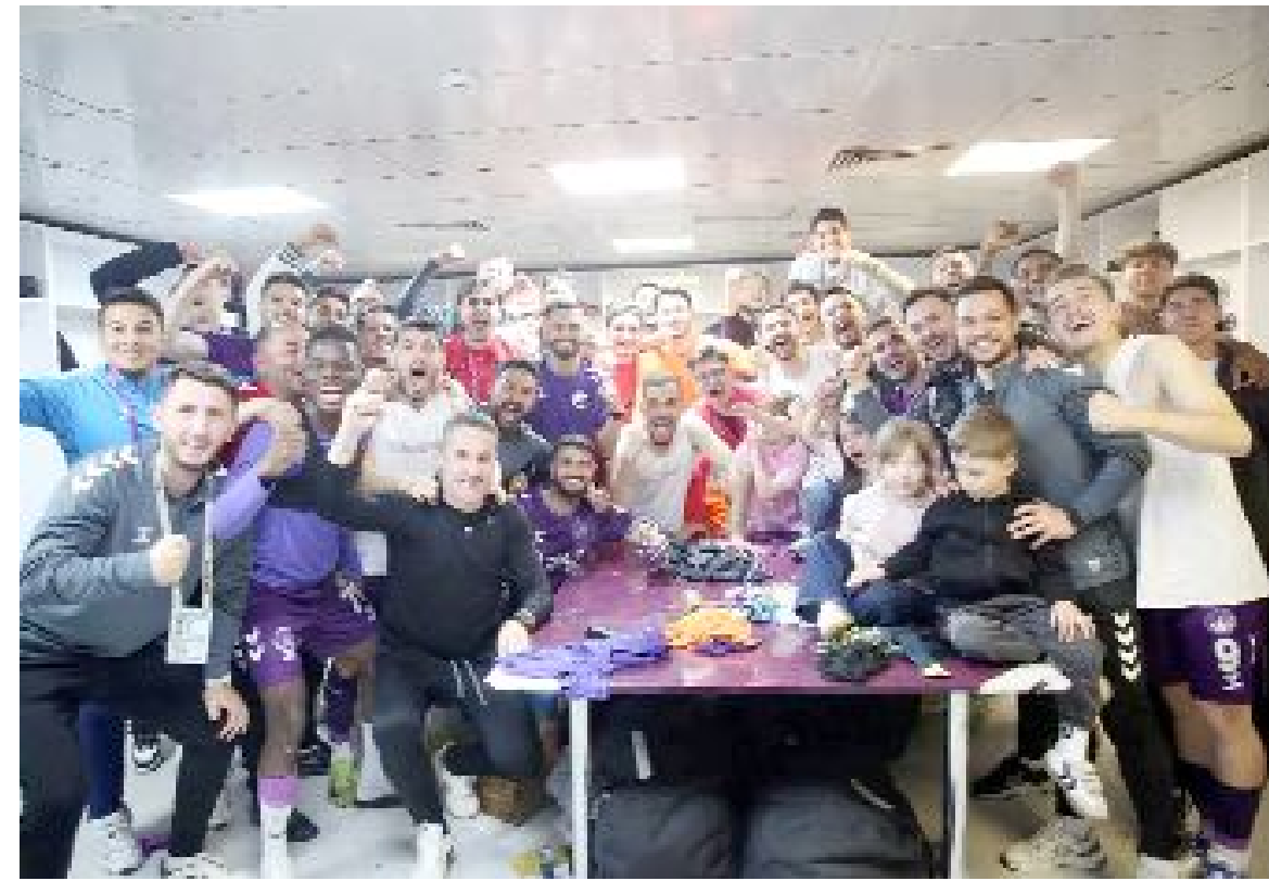
Ankara Keçiöregücü, normal sezonda oynadığı 38 maçta 16 galibiyet, 12 beraberlik, 10 yenilgi alarak 60 puan toplarken, play-off potasına 7.sıradan girdi. Başkent ekibi attığı 73 gole karşılık 43 gol yedi.

larında da aynı ciddiyet ve centilmenlik ruhuyla mücadele ederek, Ankara'nın ve Keçiören'in adım en yükseğe yazdırmak için sahada olacağız. İnanıyoruz ki bu yolun sonu şampiyonluk, hedefimiz Süper Lig." (Hüseyin AŞKIN)