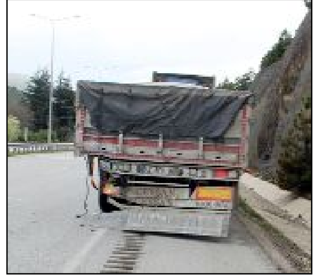
Kaza, Sıklık Tabiat Parkı mevkiinde meydana geldi.

Yaralıları, olay yerindeki ilk müdahalenin ardından hastaneye kaldırıldı. (Haber Merkezi)