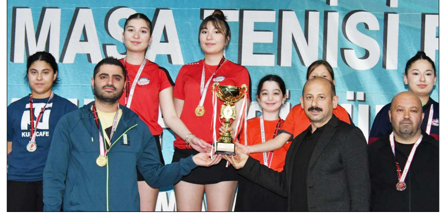
Kadınlarda şampiyon olan Çorum Arenaspor Kulübü...