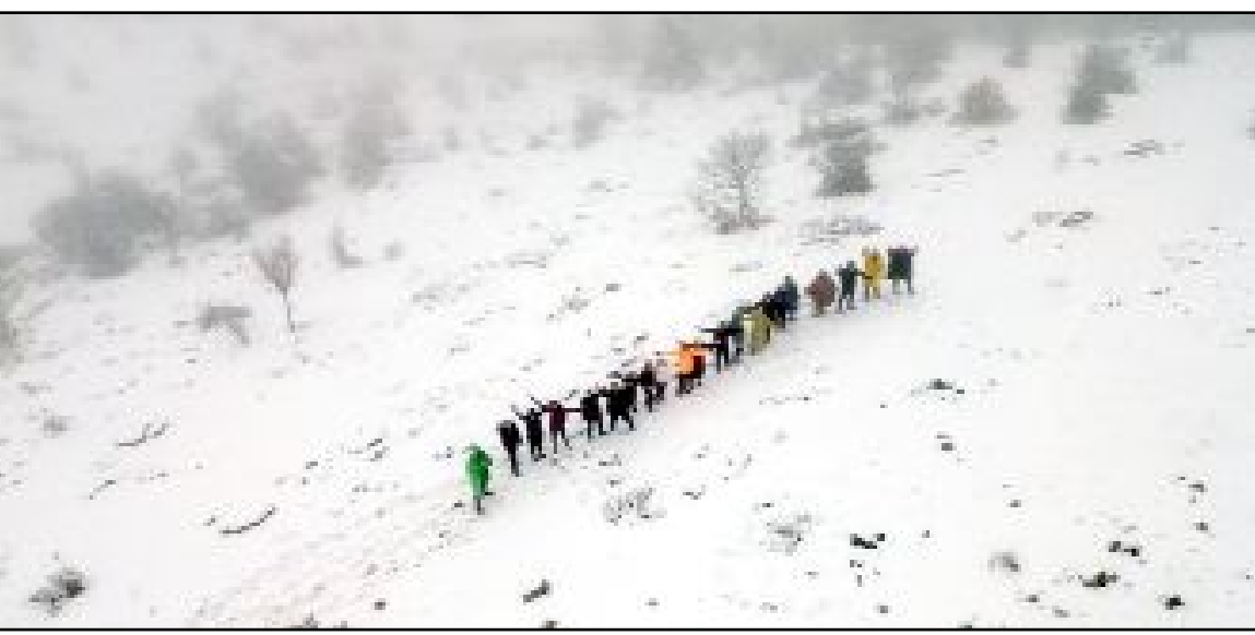
Çorum Doğa Kulübü tarafından Hıdırlık Göleti mevkiinde doğa yürüyüşü düzenlendi.