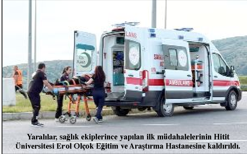
Yaralıları, sağlık ekiplerince yapılan ilk müdahalelerinin Hitit Üniversitesi Erol Olçok Eğitim ve Araştırma Hastanesine kaldırıldı.

Çorum’da asfalt yüklü tanker ile otomobilin çarpışması neticesinde meydana gelen kazada 4 kişi yaralandı.