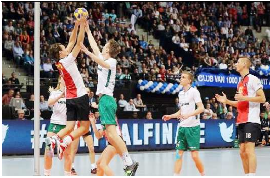
Korfbol müsabakasından temsili bir fotoğraf...