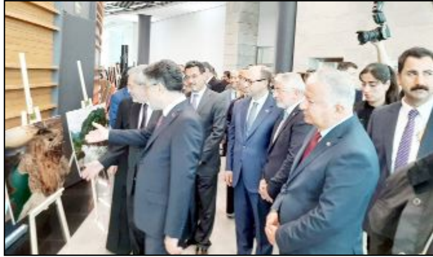
Belediye Başkanı Aşgın da Ankara'da düzenlenen Su Atlası programına katıldı.

bu çalışmaların ülkemiz için hayırlı olmasını diliyorum" dedi. (Volkan SINAYUÇ)