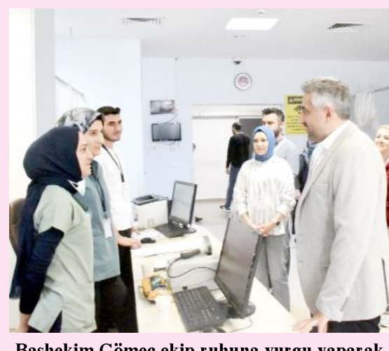
Başhekim Gömeç ekip ruhuna vurgu yaparak özveri ile görev yapan personele teşekkür etti.

● Çorum Hitit Üniversitesi Erol Olçok Eğitim ve Araştırma Hastanesi'nde Kurban Bayramı tatili boyunca yoğun bir sağlık hizmeti mesaisi yaşandı. Başhekim Gömeç ve hastane yönetimi, bayramda görev yapan Acil Servis personeline teşekkür ziyaretinde bulundu. •7'de