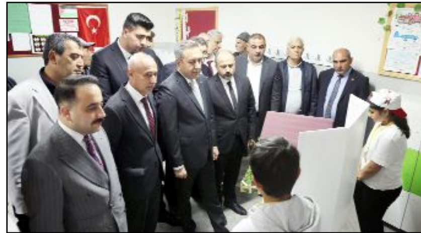
Arifegazili Ortaokulu tarafından düzenlenen 4006 TÜBİTAK Bilim Fuarı'nda 30 öğrenci 13 projeye yer aldı.

Okul yönetimi, bilim fuarlarının öğrencilerin akademik gelişmelerinin yanı sıra özgüven ve iletişim becerilerine de katkı sağladığını belirterek, emeği geçen öğretmen, öğrenci ve velilere teşekkür etti. (Haber Merkezi)