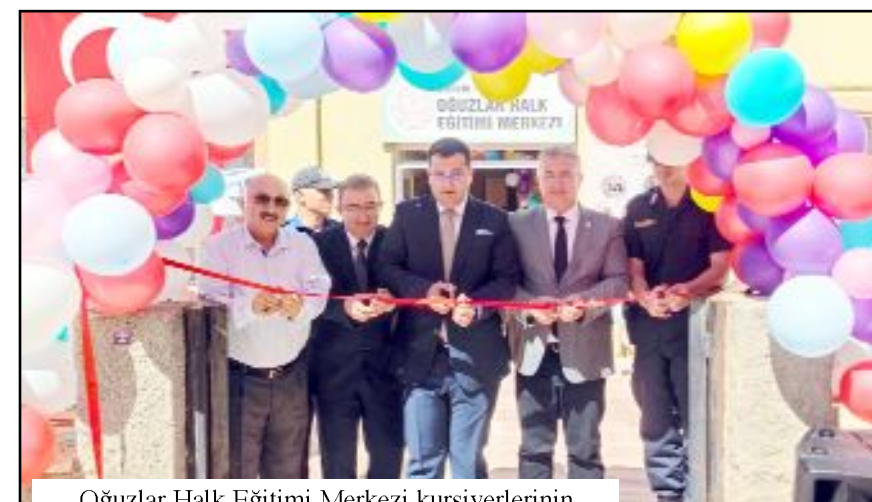
Oğuzlar Halk Eğitimi Merkezi kursiyerlerinin hazırladığı ürünlerden oluşan yıl sonu sergisi açıldı.