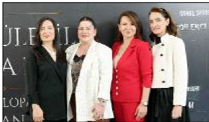
İş kadınlarının "zirve" hatırası...

Ve şimdi bu medeniyetin bize bıraktığı sembollerle ve doğayla kalkınmayı yeniden anlamlandıralım. Hititlerde boğa, bereketi, üretmeyi ve toprağa bağlı yaşamın sürekliliğini simgeleyen kutsal güçtür. Boğa gibidir insan... Gücünü gürlütüden değil, köklerinden alır.