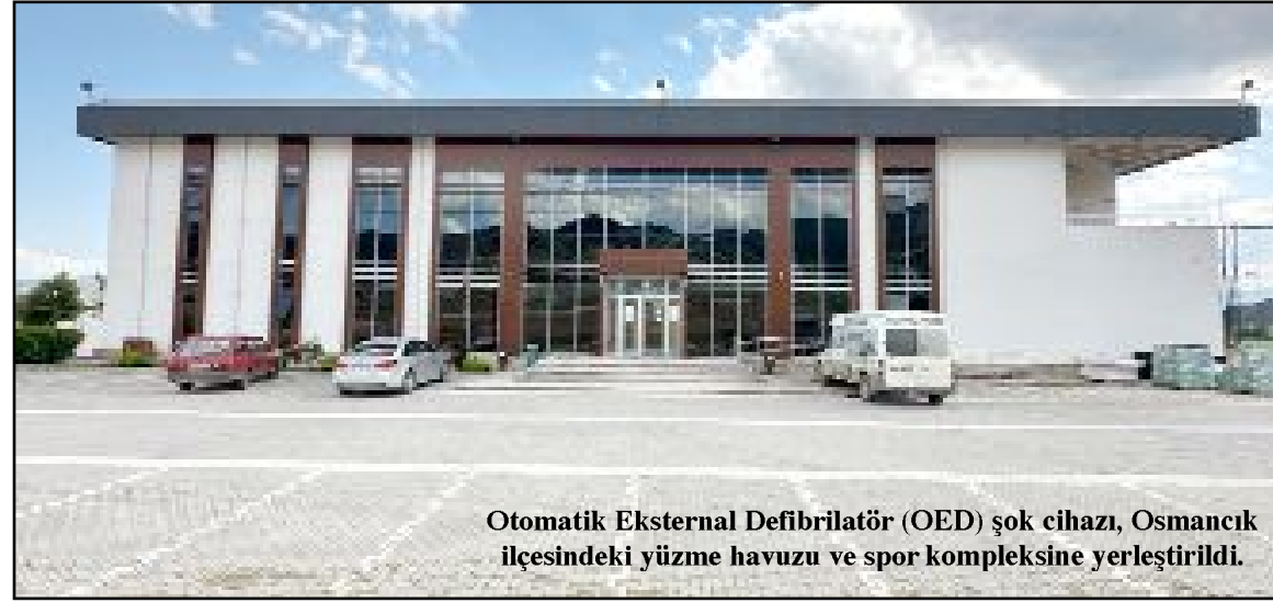
Otomatik Eksternal Defibrilatör (OED) şok cihazı, Osmançık ilçesindeki yüzme havuzu ve spor kompleksine yerleştirildi.