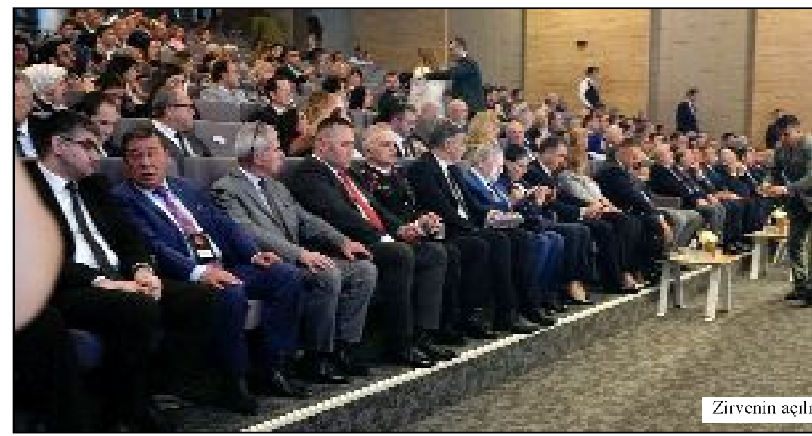
Zirvenin açılışında protokol...