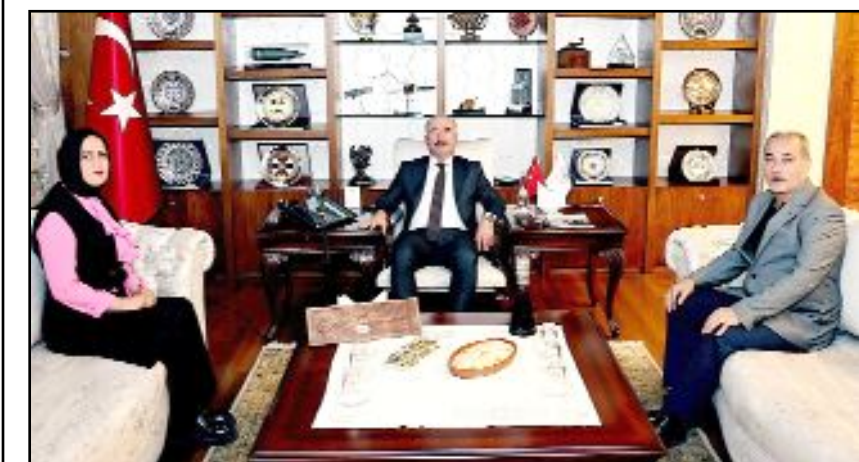
Ziyarete Vali Çalgan'a Osmancık'a özgü şerbet, helva ve ırgat böreği gibi yöresel lezzetler hakkında bilgi verildi.

Vali Ali Çalgan, yöresel gastronomi değerlerinin gelecek nesillere aktarılmasına katkı sunan çalışmalarını takdirle karşıladığını belirterek, Kartal ve Yılmaz'ı tebrik etti, çalışmalarında başarılar diledi. (Haber Merkezi)