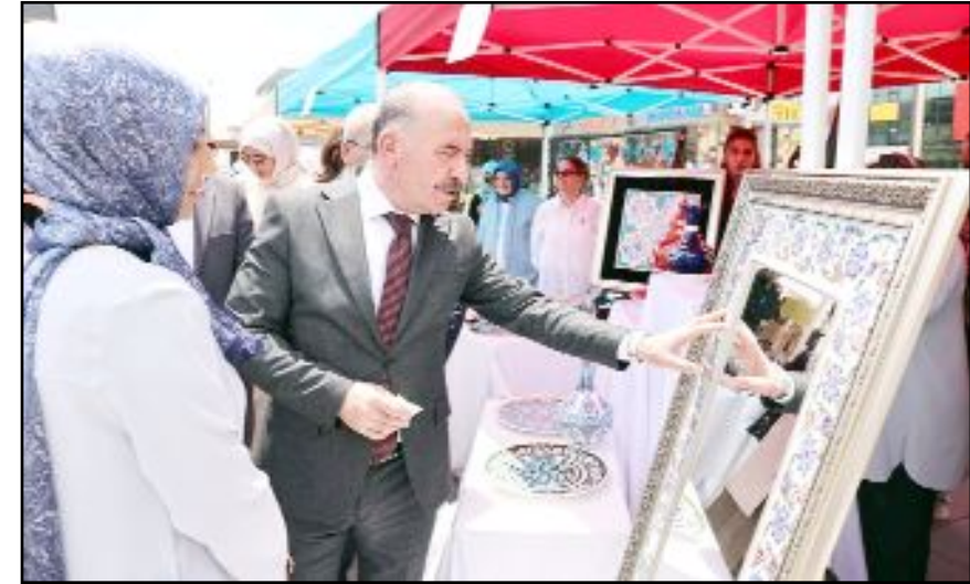
Çorum Halk Eğitim Merkezi'nde 1 Eylül ve Haziran dönemi içerisinde toplam 952 kurs açıldığını belirtildi.