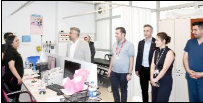
Bayram tatili boyunca Acil Serviste 14 bin 531 hastaya bakıldığı ve hastanede 179 ameliyatın yapıldığı belirtildi.

madan sürdürerek bölge halkına hizmet vermeye devam etti. (Haber Merkezi)