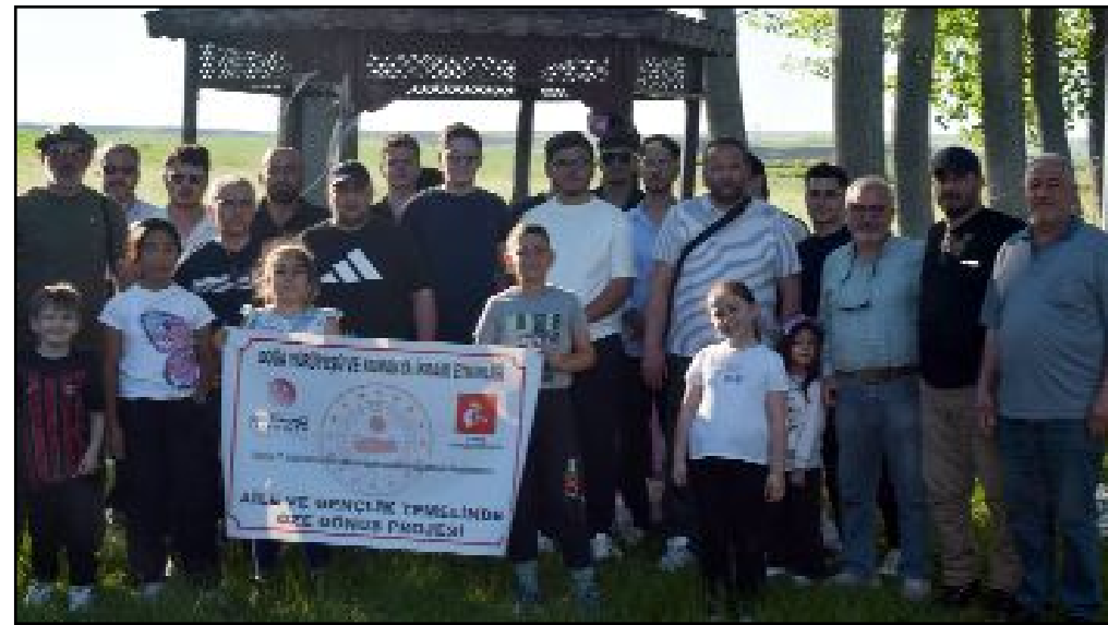
İçişleri Bakanlığı Sivil Toplumla İlişkiler Genel Müdürlüğü'nün desteklediği etkinliğe demek yöneticileri, doğa gönüllüleri ve öğrenciler katıldı.

Çorum Akıncılar Derneği tarafından, "Geleceğin İnşası için Nesline Sahip Çık" projesi kapsamında Alacahöyük'te doğa yürüyüşü düzenlendi.