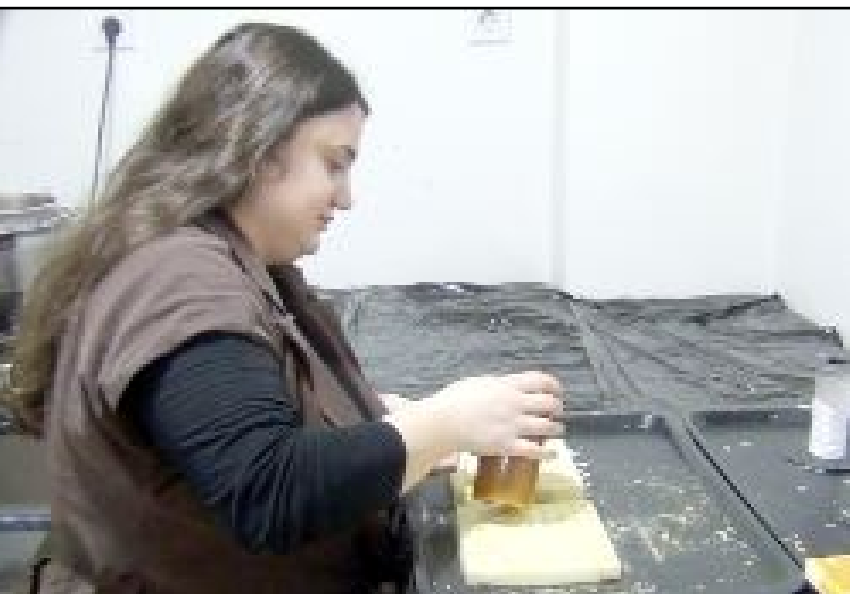
Çöplü, hazırladığı kalıplarla mumdan şehrin simgelerinin figürlerini yapıyor.