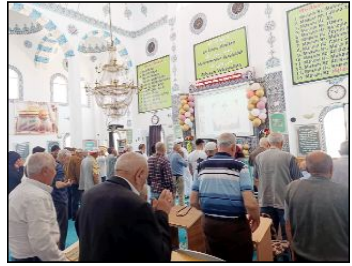
Öğle namazında biraraya gelen Aleviler, öğle ve ikindi namazını peşpeşe kıldık-tan sonra Kur'an okudu.

çuklara çeşitli hediyeler verildi. Program yapılan duanın ardından Ehli Beyt Vakfı'nın katılımcılarına yemek ikramıyla sona erdi. (Haber Merkezi)