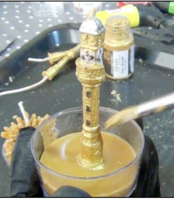
Şeyma Nur Çöplü, yaptığı mumlar büyük ilgi gördükten sonra kendi atölyesini kurdu.

● Çorum'un en bilinen değerlerini farklı bir bakış açısıyla tasarladığını kaydeden Çöplü, "3 yıl önce mum yapmaya başlamıştım. Daha sonra küçük bir atölye açtım. Atölyemde çeşitli mumlar tasarlıyorum.