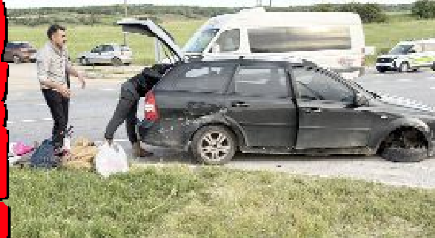
Kaza, Çorum-Samsun karayolu Palabıyık köyü yolu ayrımındaki kavşakta meydana geldi.

Bayramda 14 bin 531 hasta muayene edildi