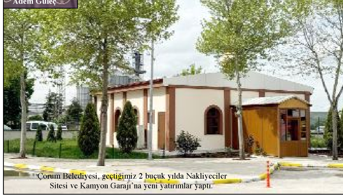
Çorum Belediyesi, geçtiğimiz 2 buçuk yılda Nakliyeciler Sitesi ve Kamyon Garajı'na yeni yatırımlar yaptı.