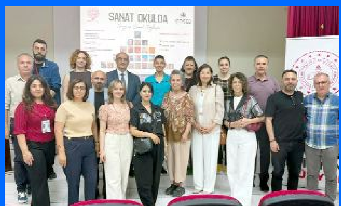
Yunus Emre Ortaokulu'ndaki etkinliğe katkı sunan eğitimciler...