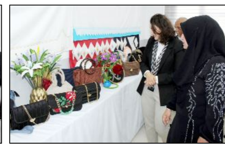
Sergide, kursiyerlerin yıl boyunca hazırladığı el işi ürünler, geleneksel el nakışları ile ahşap ürünler ile gıda ürünleri ziyaretçilerin beğenisine sunuldu.